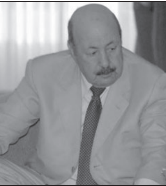
اللواء المتقاعد العربي بلخير

العلاج الصيف الماضي، غير أنه اضطر إلى العودة للجزائر بسرعة خوفا من تعرضه للمساءلة من القضاء الفرنسي في إطار التحقيقات في قضية اغتيال المعارض علي مسيلي في باريس عام 1987.