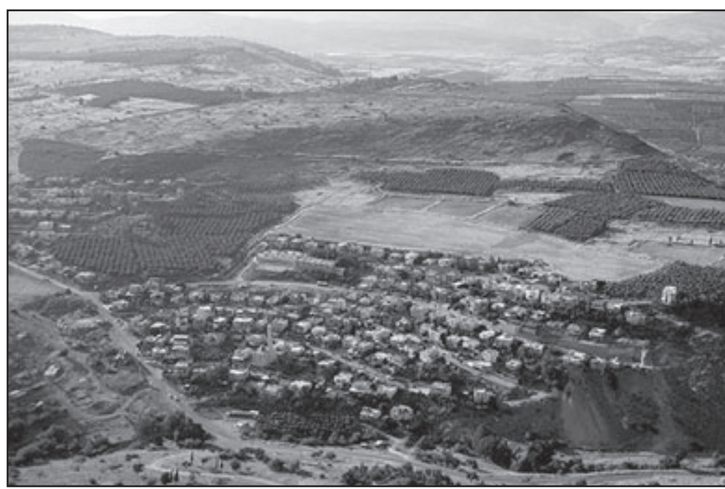
لماذا لا يعترف الاسويون بشرعية الجبهة الدولية؟

كما قال ليرمان ان انابوليس كان فضلا، فما اضرم اضطرابا وادى الى تنفيذ هستيري من اليسار الاسرائيلي. ولكن المفارقة هي انه حتى الان فان اليسار الاسرائيلي بالذات هزء بانابوليس. وقد اوضح بانه بينما ستحترم الحكومة الجديد كل التعهدات الدولية، فهي ليست ملتزمة بالاتفاقات الغامضة لاوهرت ليفني مع الفلسطينيين. الاتفاقات التي لم تحرج ايدا على الكنيست للمصافحة عليها. ليرمان تعهد بقبول «خريطة الطريق» للرابعية، وينبغي التهديد بانه اذا ما وعدنا بتفكيك البنية التحتية للارهاب في المناطق، فان «خريطة الطريق»