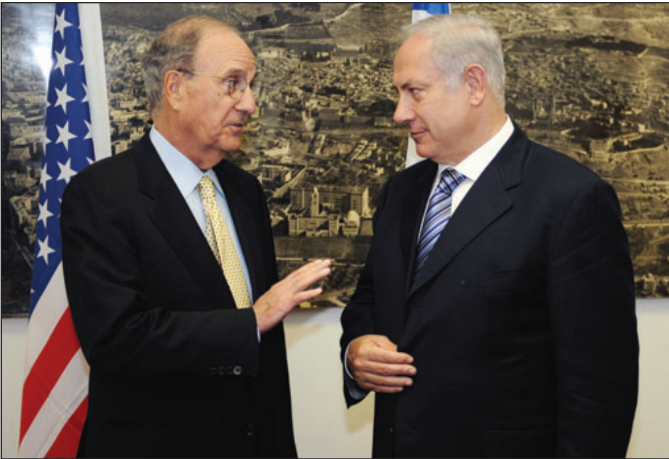
رئيس الوزراء الاسرائيلي بنيامين نتيناهو لدى استقباله المبعوث الاميركي جورج ميتشل

وأحجم متحدث باسم نتيناهو عن التعقيب على تصريحات بيريس. ونقلت صحيفة «يو.إس.إرمي تايمز» التي يصدرها الجيش الاميركي عن وزير الدفاع الاميركي روبرت غينس قوله في خطاب هذا الاسبوع انه بينما قد يعرقل أي هجوم برنامج إيران النووي لفترة قد تصل الى ثلاث سنوات الا انه سيرسخ أصرارهم على امتلاك برنامج نووي ويزرع في كل البلاد كراهية لا تنتهي من هاجمهم». وتعددت إيران بالرد على أي هجوم بنش هجمات بصواريخ بعيدة المدى على اسرائيل وقواعد الولايات المتحدة في الخليج.