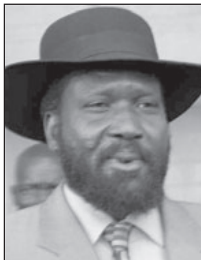
الفرق سلفاكير ميارديت