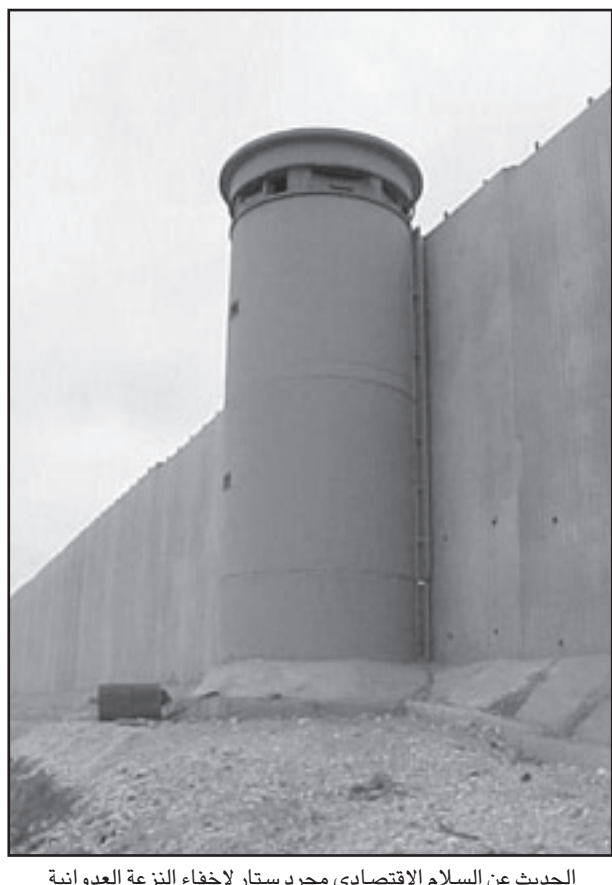
الحديث عن السلام الاقتصادي مجرد ستار لإخفاء النزعة العدوانية

صحيح، هذه المسألة المنزلة تؤثر على كل ما يجري في مقدمة المسرح، من الامن وحتى الاقتصاد، من الارباب وحتى السياحة ولكن لماذا نوجع عقولنا الخلوقة والسترة بالربط بين هذا وبين ما يجري على مسافة ربع ساعة سفر شرقا او جنوبا من بيتنا. لقد كانت وسائل الاعلام بالطبع الوكيل المركزي لازالة الموضوع عن جدول اعمالنا. تحالف نادر، من الجدار حتى الجدار، وحدة وطنية للحكم، المؤسسة الامنية، الحرون، المرسلون، المدعيون، المشاهدون والقراء، ولا سيما المشاهدين والقراء، الذين لا يريدون ان يكتبوا ولا يريدون ان يقرأوا، لا ان يتحدثوا ولا ان يسمعوا، لا ان يبلغوا ولا ان يعرفوا، اخذوا جميعا في المهمة: ازاحة الاحتلال عن