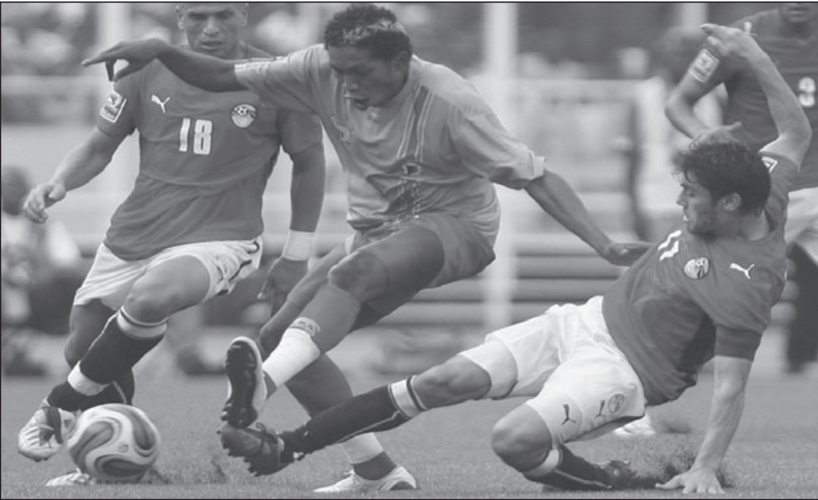
نجم منتخب مصر أحمد حسام «ميدو» (يمين) خلال المباراة مع منتخب الكونغو

مع زامبيا في القاهرة في الجولة الأولى، مبدياً ثقته في الجهاز الفني واللاعبين على تجاوز هذه المرحلة الصعبة.