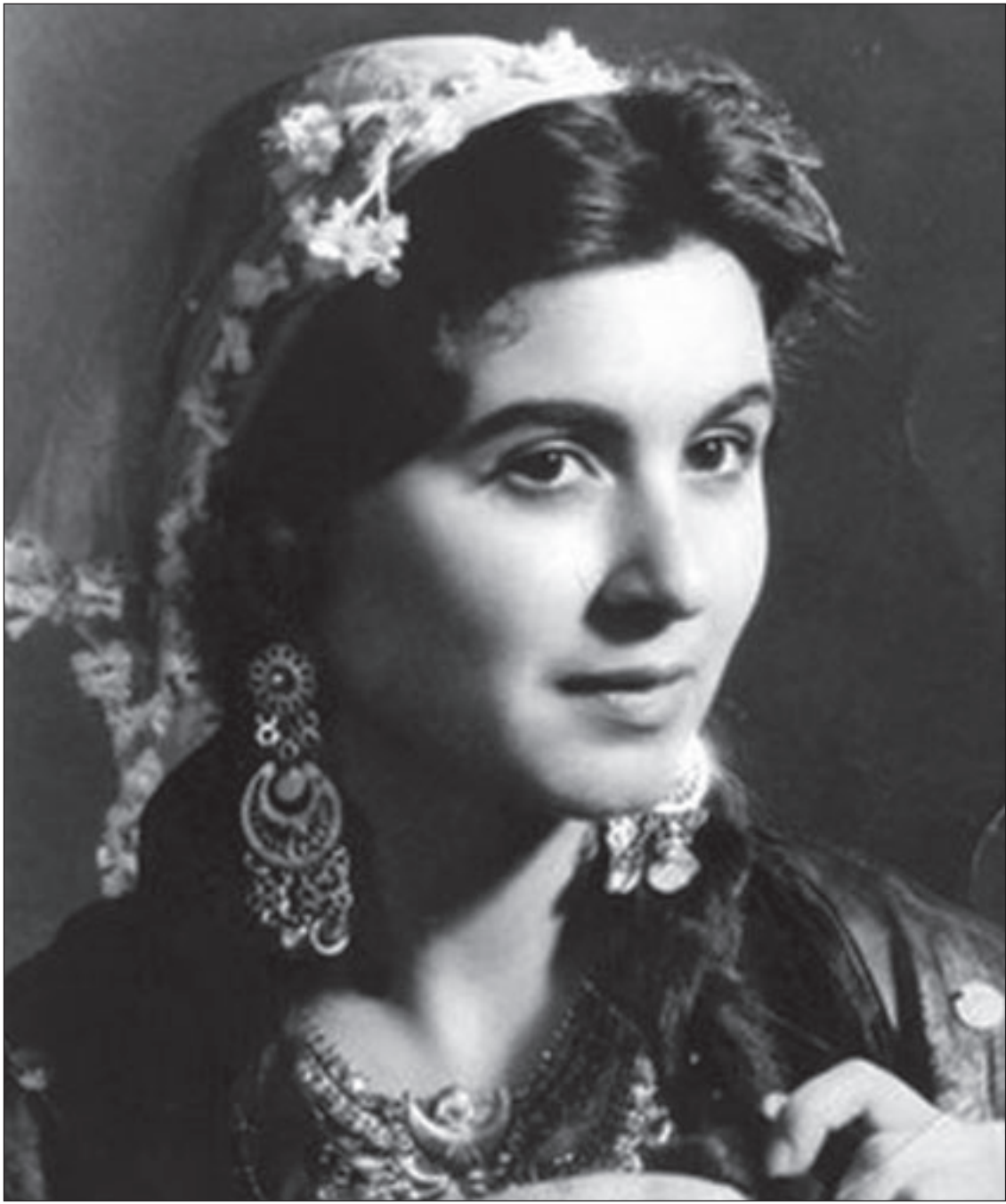
سعاد حسني في لقطة من «حسن ونعيمة»