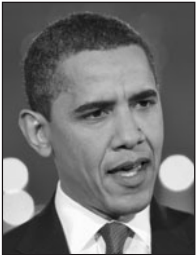
اوباما لم يكشف بعد ثوابه بكاملها

الامريكي في مجلس الامن للدفاع عن اسرائيل ضد قرارات متحيزة. بالنسبة للاغلبية هذه المواضيع سيتبنى على نتنياهو ان يقف متينا وان يعارض المزيد من التنازلات احادية الجانب الكفيلة بان تفسر بأمننا، وعليه فينتهي له ان يتصرف بذكاء.