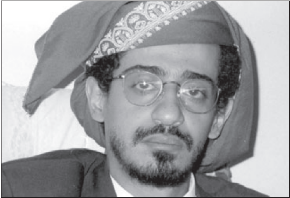
الشيخ طارق الفضلي