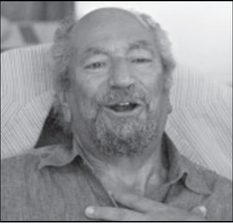
سعد الدين إبراهيم

■ القاهرة (مصر) - يو بي اي: قالت مصادر قضائية امس الخميس ان محكمة مصرية قررت حجز دعوى مقامة من عضوة في الحزب الوطني الحاكم ضد الناشط الحقوقي والسياسي سعد الدين إبراهيم للنطق بالحكم في أيار / مايو المقبل.