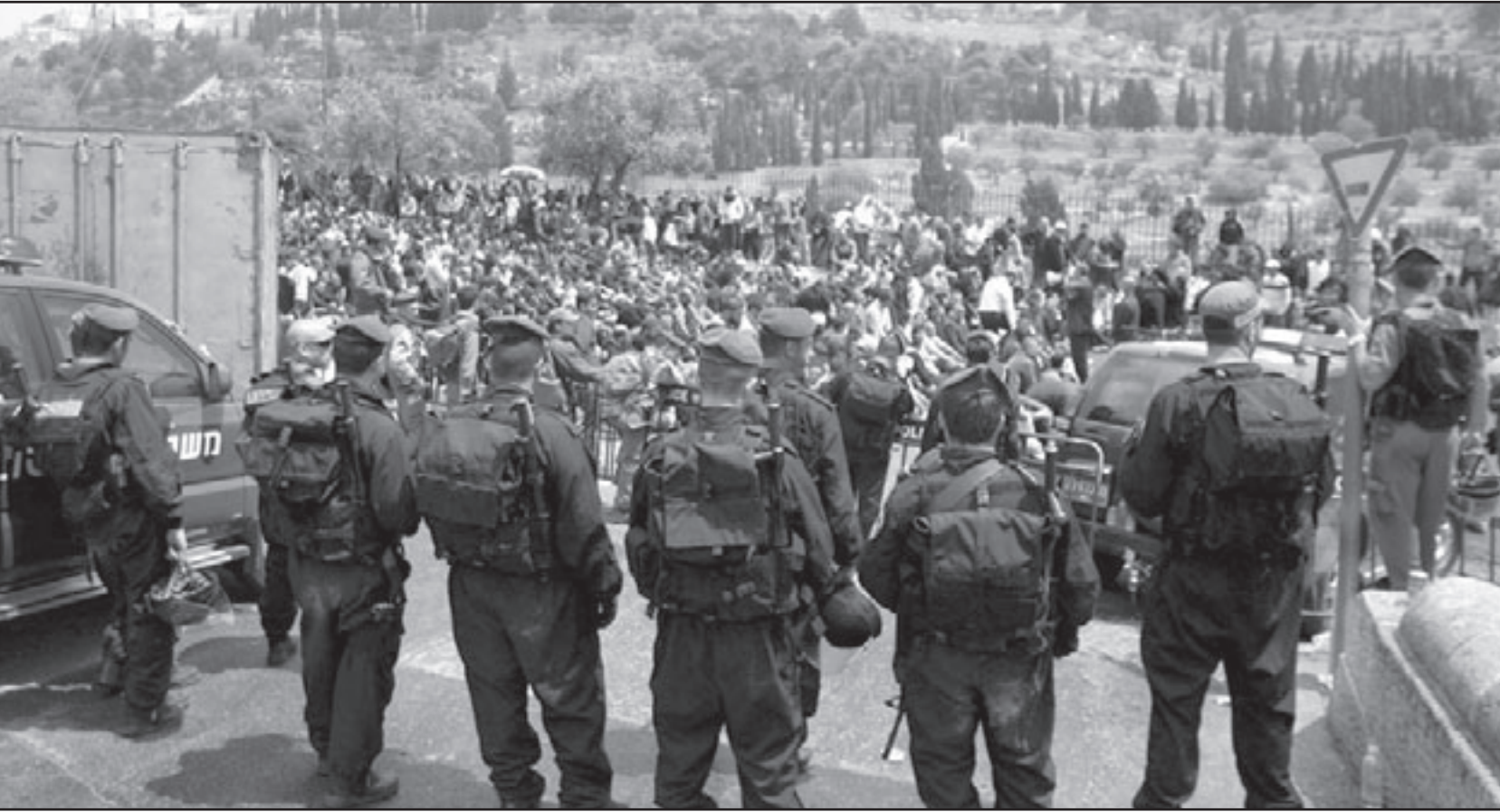
قوات الاحتلال الاسرائيلي تمنع الفلسطينيين من التوجه الى المسجد الاقصى لحماية من المستوطنين

كما طالب أبناء الشعب الفلسطيني باستخدام كافة الوسائل المتاحة لمقاومة حملة التهويد التي تستهدف المدينة المقدسة والمسجد الأقصى المبارك.