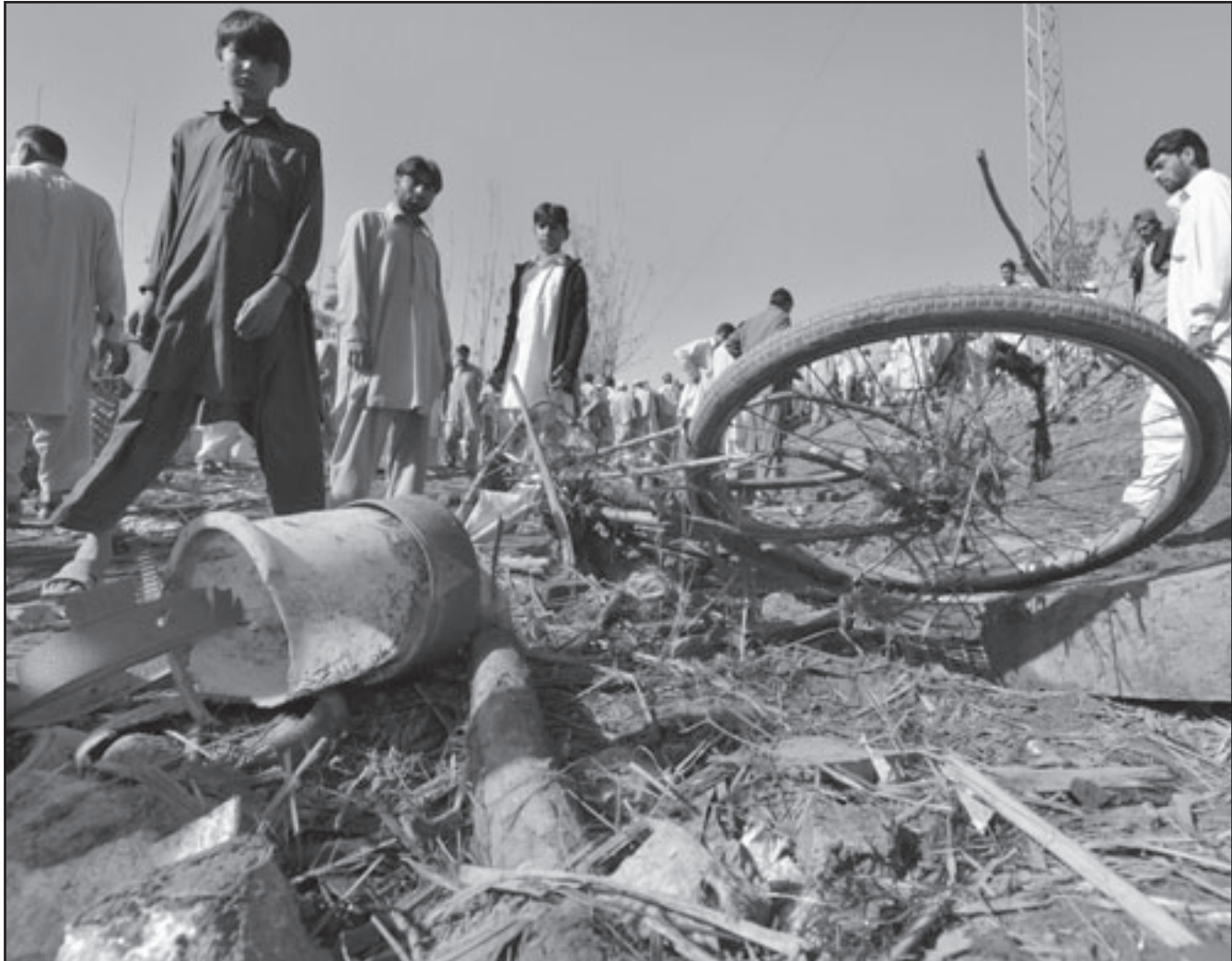
باكستانيون يتفقدون مكان التخضير الانتحاري حيث انتشرت اشلاء الضحايا واغراضهم