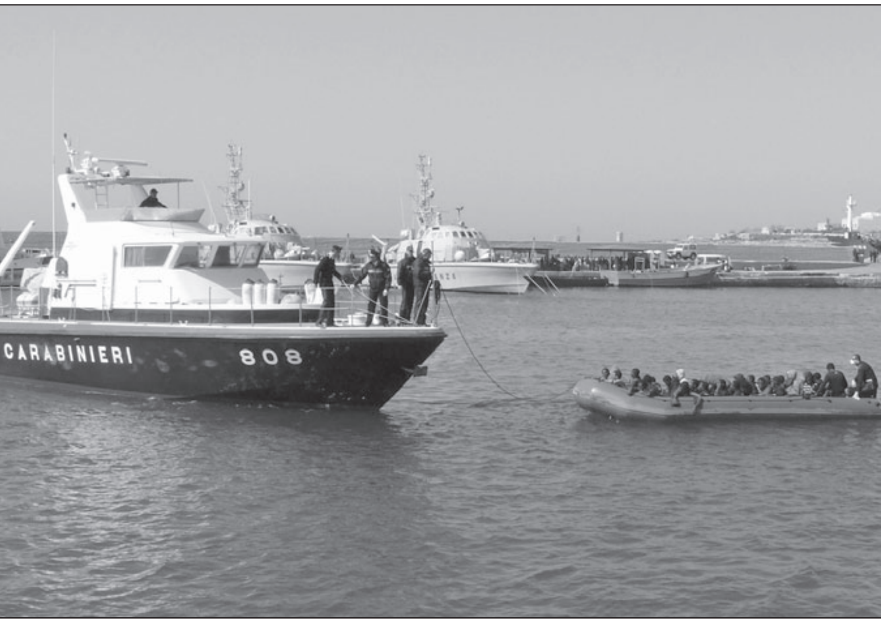
دورية إيطالية تقطر قارب مهاجرين نحو مرفأ لاميدوسا امس

ويطالب معارضون الحكومة منذ انتخابات الرئاسة في عام 2004 التي فاز بها الرئيس زين العابدين بن علي بنسبة 94.4 بالمئة من الاصوات