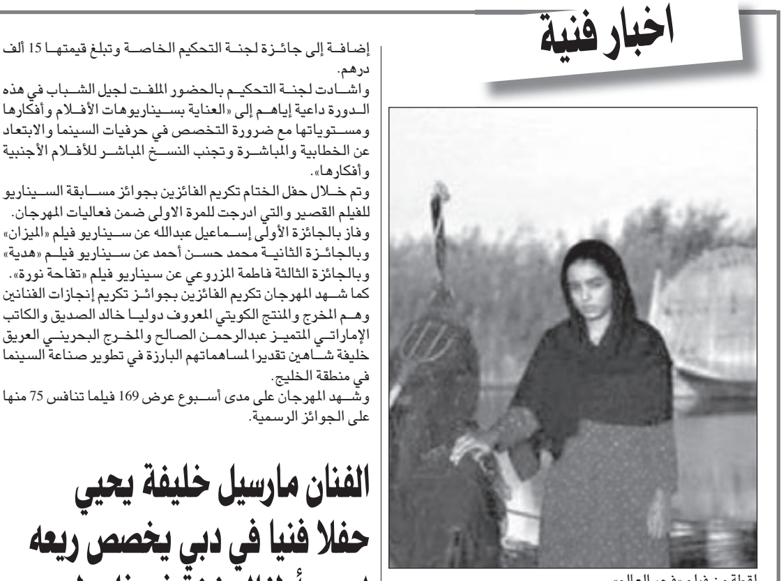
لقطة من فيلم «فجر العالم»

المليجي، الشخصية الهوائية المائلة الى الانحراف الكارهة لحياة والدها العسكرية المنضبطة والنازعة الى الحرية والقز خارج الاسوار الحديدية بغية الانطلاق والتحرر من القيود الرسمية.. هذا النمط من الابداء كان قريباً على سعاد حسني بعض الشيء قبل ان تخصص فيه وتصنع لنفسها بصمة واضحة تصبح بمثابة ماركه مسجلة تتجلى في الابداء وتمرست على قراءة الشخصيات الدرامية قراءة سليمة بوعي فطري تدعمه موهبة كبيرة، لذا اذت سندريلا شخصية «فاطمة»، السيدة المتعطشة الجيرة على الزواج من العدة الديكتاتور ببراعة شديدة واستطاعت ان تكون ندا قويا لسناء جميل التي لعبت دور الغريبة او الزوجة الاولى، وكذلك تاقست سلاح منصور على قمة الابداء التحليلي وهي لا تزال شابة صغيرة في سن مستهل حياتها الفنية، واعتبر فيلم «الزوجة الثانية» نقلة في حياة الفنانة الكبيرة التي تربعت فيما بعد على القمة وبشّرت افلامها التالية بنجومية طليعة ولم تكن قد لعبت بعد دورها الفارق في غروب وشرق، ان قامت بدور ابنة رئيس البوليس السياسي محمود