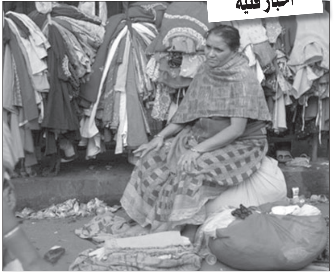
لقطة من فيلم «بلال»