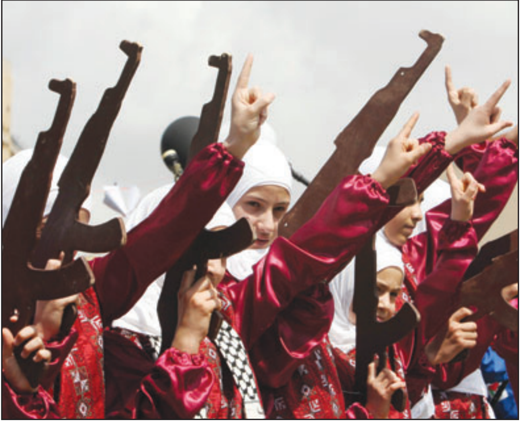
فتيات لبنانيات اثناء فعاليات مهرجان القدس عاصمة للثقافة العربية في بيروت الجمعة

الأمنية على رأس أولوياته، وأشار الى أنه من المستبعد ان يقبل الرئيس المصري محمد عباس الالخير في رسالة رسمية قطع علاقاتها مع حزب الله، وفي محاولة لإغلاق الباب في وجه أي من تلك التساعي خرج الجمعة