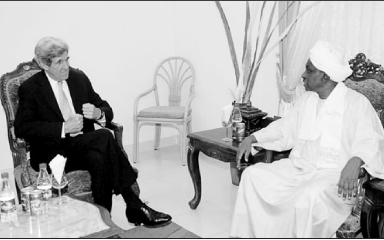
كيري خلال لقائه مع علي عثمان طه في الخرطوم مساء الخميس الماضي

«بفضل جهود الموفد الخاص للرئيس (الأمريكي براك اوباما) الجنرال سكوت غرايتسون وورغبة الحكومة (السودانية) في الدخول في حوار جديد معنا فإن هذا النشاط الانساني سيعود جزئياً». الا ان رئيس لجنة الشؤون الخارجية في مجلس الشيوخ الأمريكي حذر من ان هذه «العودة الجزئية لهذا النشاط الانساني غير كافية». ولم يحدد السناتور كيري ما اذا كان ذلك يتطلب عودة المنظمات غير الحكومية التي طردت او قدوم منظمات دولية جديدة الى دارفور. وواضح مسؤول سوداني كبير للفرانس برس طالبا عدم ذكر اسمه ان السودان سيستقبل منظمات دولية بينها منظمات امريكية لكن ليس بالضرورة ان تكون المنظمات التي طردت. واستنادا الى الامم المتحدة فان طرد المنظمات غير الحكومية الكبرى يهدد وصول المساعدة الانسانية اللازمة لأكثر من مليون شخص في دارفور.