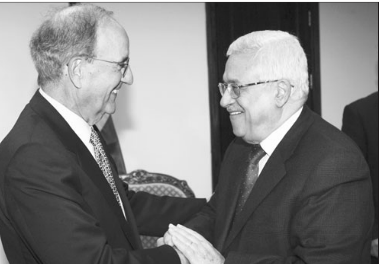
الرئيس الفلسطيني لدى اجتماعه بالمبعوث الأمريكي لعملية السلام في رام الله الجمعة

وهذه الحكومة التي تدعو إلى الاعتراف بهذا الكيان وإلى الطابع اليهودي لدولة الاحتلال في محاولة لأخذ شرعية لتجسير شعبنا الفلسطيني من الأراضي المحتلة عام 48».