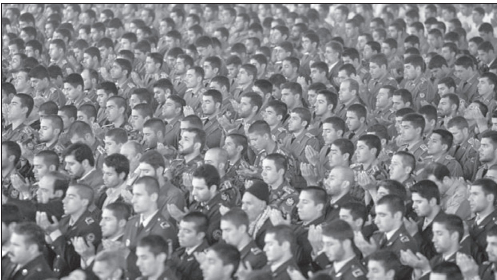
جنود ايرانيون يؤدون صلاة الجمعة بطهران

ونقلت الوكالة عن احمدي نجاد قوله خلال اجتماع عقده مساء الخميس مع ايرانيين يعيشون في الخارج «نحن مبالون للحوار وسنعلن في هذا البيان اطار المحادثات وموقف ايران».