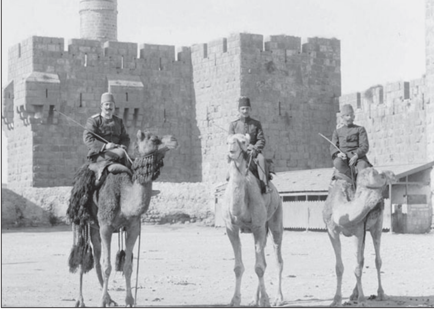
جنود في عهد السلطنة أمام احد جدران القدس

ومسألة الحفاظ على الهوية والتراث تتجاوز بكثير الجهود الفردية أو المؤسساتية المنوطة وحتى الوطنية، إذ وفي مقابل تلك الممارسات التهجنية تتبدى ضرورة ملحة لتضاريف جهود إقليمية وعربية تزوم نحو تفعيل موقف دولي وفعال مستوياً الإشكالية للوعي المجتمعي العالمي. ويرغم تواقع قدرات وإنجازات الهيئات الوطنية، وبالذات في فلسطين المحتلة، إلا أن ذلك لا يعفي من الإشارة إلى الإشارة بما تقوم به بعضها في ظروف صعبة. وفي هذه المساحة الضيقة لا يتسع المجال لتعدد من المؤسسات المعنية بالتراث عربياً وفلسطينياً، وعلى أهمية أدوارها المختلفة، ولكن يصعب إغفال ما يقوم به «مركز عمارة التراث»، وبخاصة على ضوء تدميره مؤخرًا، وحاجة المركز لدعم الماسن كمؤسسة فلسطينية ثقافية تقوم بدور مؤسسي مهم في توثيق ومسح وترميم التراث الثقافي في قطاع غزة. وفي مناسبة يوم التراث العالمي دأب المركز على تنظيم فعاليات ثقافية تتجاوز محيطه الإقليمي حيث نظم العام الماضي بعنوان «تراث الحروب والكوارث على التراث المباني والمواقع الأثرية»، http://www.iugaza.edu.ps/ar/research/ http://www.conf.hrarc/default.asp ، على ضوء تدمير المركز في 29 كانون الأول (ديسمبر) 2008، ويضمن اليوم الدراسي مناقشة القوانين والاتفاقيات الدولية لحماية الممتلكات الثقافية أثناء الحروب والنزاعات، وتأثيرها على المباني الأثرية، وسبل معالجة الأضرار الإنسانية والتصدعات، بالإضافة إلى استعراض تجارب محلية ودولية في معالجة والحفاظ التراثي، ويهدف إلى تسليط الضوء على ما خلفته الحروب من تأثيرات على المباني الأثرية والمؤسسات العاملة في