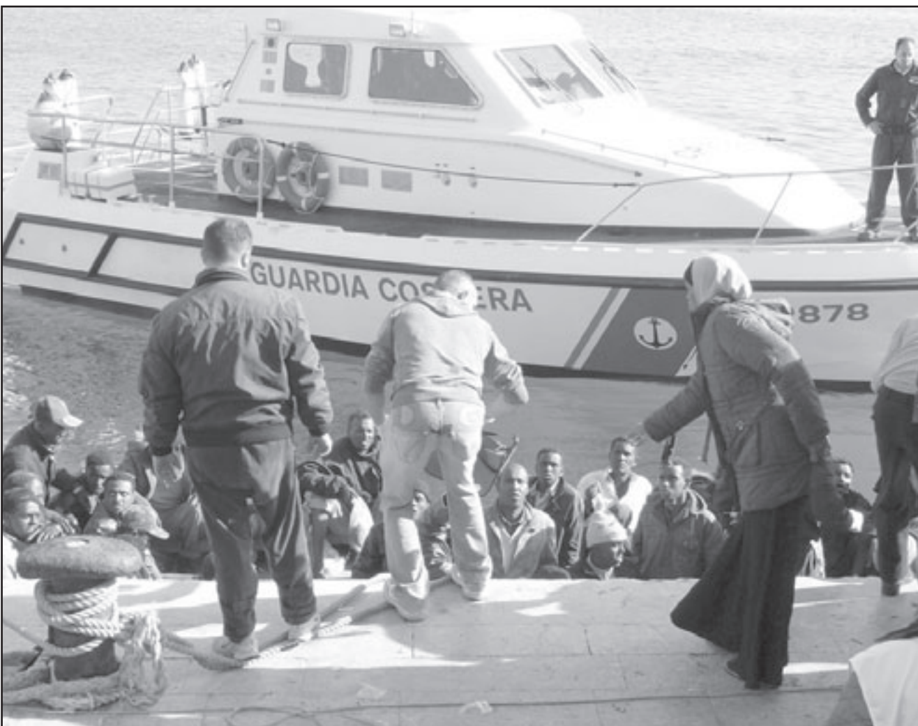
أخر دفعة من الحالمين بالهجرة الى أوروبا تُعاد إلى مرافق طرابلس الليبية الأسبوع الماضي

الرياح-رويتزن: قد لا تنتفض الضغوط على ليبيا لوقف موجات الهجرة غير المشروعة التي تتلظن من شواطئها إلى شيء يذكر بعد أن تحولت الدولة الواقعة في شمال أفريقيا المطلة على البحر المتوسط إلى منطقة جذب للافارقة الفقراء وهم في طريقهم إلى الحلم الأوربي.