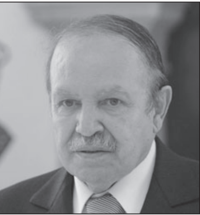
بوتفليقة الأسبوع الماضي بالجزائر

الأخير الذي أجراه الرئيس بوتفليقة في تشرين الثاني/نوفمبر الماضي، إضافة إلى احتمال مغادرة بعض الوزراء مناصبهم مثل وزير الزراعة الجمع بين أجزاء من مدهما، على مدى سنتين متتاليتين، شريطة أن يتم ذلك باتفاق بين الخادم والمشغل، كما أنه بإمكان الخادم الاستفادة من الراحة خلال أيام الأعياد الدينية والوطنية، ويمكن باتفاق الطرفين تسهيل الاستفادة منها إلى تاريخ لاحق، كما يمكن للخادم الاستفادة من تصاريح أو رخص تغيب لأسباب عائلية مثل الزواج أو الوفاة، وخصص مشروع القانون مادة للطرق إلى أجر خدم البيوت، إذ نص على أن الأجر يحدد بتراضي الطرفين، ويدخل في احتسابه، بالإضافة إلى المبلغ التقديري، مكملات أخرى مادية أو عينية.