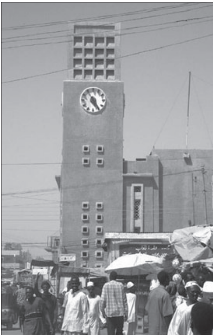
سوق في مدينة امدرمان