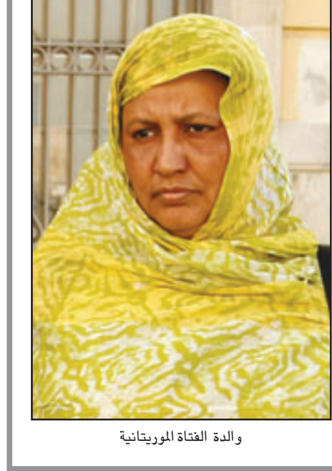
والدة الفتاة الموريتانية

بيت الزوجية. أما البنت التي رفعت الدعوى فتعيش مع العائلة الإسبانية التي احتضنتها. وخلفت هذه القضية نقاشا قويا وسط المجتمع الإسباني والمهاجرين، فأفراد العائلة الموريتانية يؤكدون أن الزواج شرعي وتم وفق تقاليد بلادهم، وحيثهم انه لو كان مخالفا للقانون لما أجازت الدولة الموريتانية هذا الزواج. من جانب آخر، تبنت الكثير من المقالات الصحافية موقفا انتقاديا ضد العائلة الموريتانية. من ذلك ما جاء في صحيفة «لونيغا اسبانيا» أمس الخميس من أنه لا يجب احترام مثل هذه التقاليد ولا يمكن السماح للمهاجرين بجلب مثل هذه العادات الى اسبانيا. وكشفت مصدر بالمجموعة المغربية للإعلام في اسبانيا«القدس العربي» ان الموقف الغالب هو «رفض تزويج الفتيات في سن مبكرة، لكن هناك تقاليد يرضع القضاء عليها بين ليلة وضحاها، مضيفا انه «لا يمكن التعامل مع هذه التقاليد بهذه الطريقة وكان الأمر يتعلق باجرام». وأوضح المصدر أن العائلة الموريتانية، موضحا أنه ليس من العقل مع هذه العائلة الموريتانية، موضحا أنه ليس من العقل محاكمة أم بتهمة تسهيل اغتصاب ابنتها.