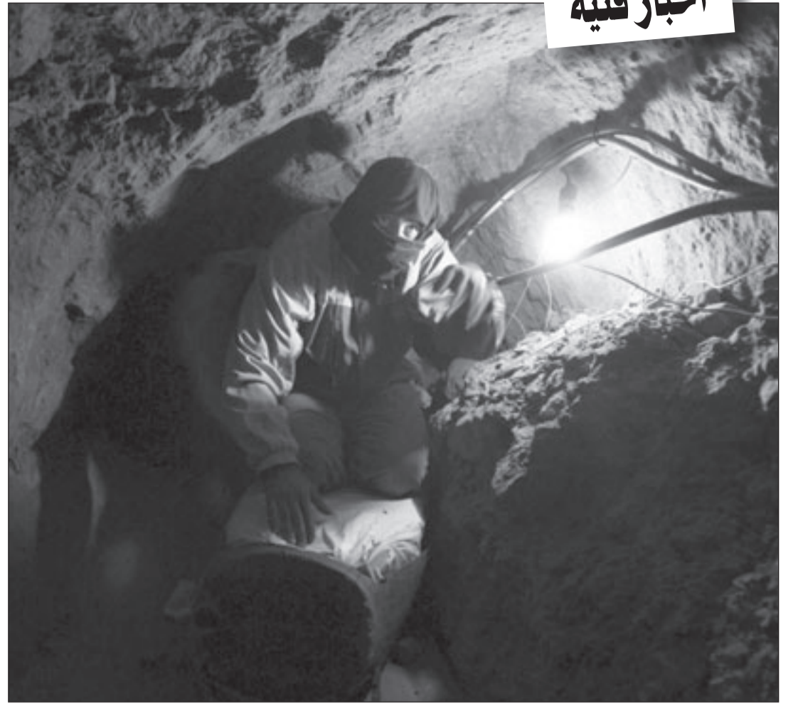
أحد انفاق غزة