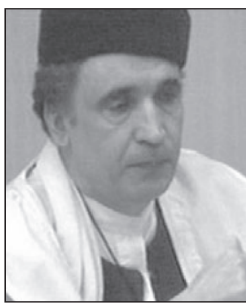
عبد الباسط علي محمد المقرحي

لندن - يو بي أي: ذكرت صحيفة «سكوتلند أون صندي»، أمس الأحد أنه يمكن إخلاء سبيل عبد الباسط علي محمد المقرحي، المواطن الليبي المدان بتفجير طائرة ركاب تابعة للخطوط الجوية الأمريكية (بان أمريكا) فوق بلدة لوكربي الاسكتلندية عام 1988، وعودته إلى ليبيا خلال فترة قصيرة بسبب إصابته بحالة متقدمة من مرض السرطان.