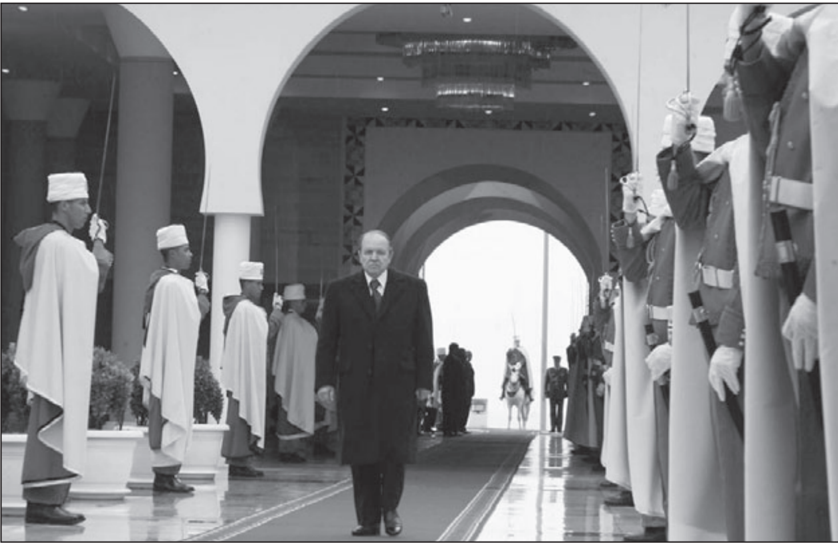
بوتفليقة يصل إلى «قصر الأمم» بغرب العاصمة لأداء اليمين الدستورية أمس