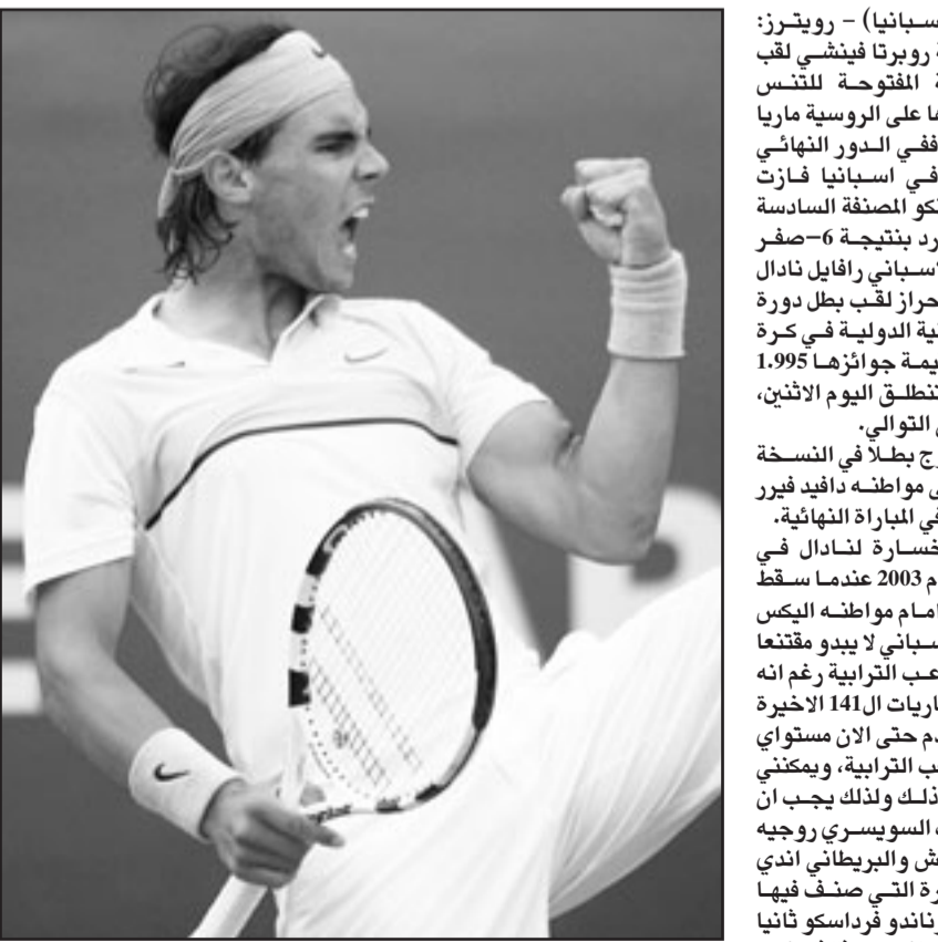
الاسباني رافايل نادال

■ برشلونة (اسبانيا) - رويترز: احزرت الايطالية وويرتا فينشي لقب بطولة برشلونة المفتوحة للتنس للسيدات بعد فوزها على الروسية ماري كيريلنكو الأحد. في الدور النهائي للبطولة القادمة في اسبانيا فازت فينشي على كيريلنكو المصنفة السادسة بجموعتين دون رد بنتيجة 6-صفر و6-4. ويسمى الاسباني رافايل نادال المصنف اول ال احرز لقب بطل دورة برشلونة الاسبانية الدولية في كرة المضرب الالهة قيمة جوائزها 1.995 مليون دولار التي تنطلق اليوم الاثنين، للعام الخامس على التوالي. وكان نادال توج بطلا في النسخة الماضية بفوزه على مواطنه دافيد فيور 1-6 و4-6 و1-6 في المباراة النهائية. وتعود آخر خسارة لنادال في برشلونة الى عام 2003 عندما سقط في الدور الثاني امام مواطنه اليكس كوريتشكا. لكن الاسباني لا يبدو مقتنعا بما يقدمه له اللاعب الازبائي رغم أنه فاز في 137 من المباريات ال141 الأخيرة عليا بقوله «لم اقدم حتى الآن مستوى الحقيقي للملاعب الترابية، ويمكنني تقديم أفضل من ذلك ولذا يجب أن أحسن». ويخيب الاسباني فينشي وديوكوفيتش والبريطاني اندي موراي عن الدورة التي صنّف فيها الاسباني الاخر فرناندو فرانسكو ثانيا والروسى نيكولاي أفديتكو ثامنا وفير وصيف النسخة الاخيرة و رابع.