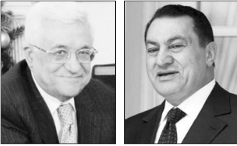
محمد حسني مبارك