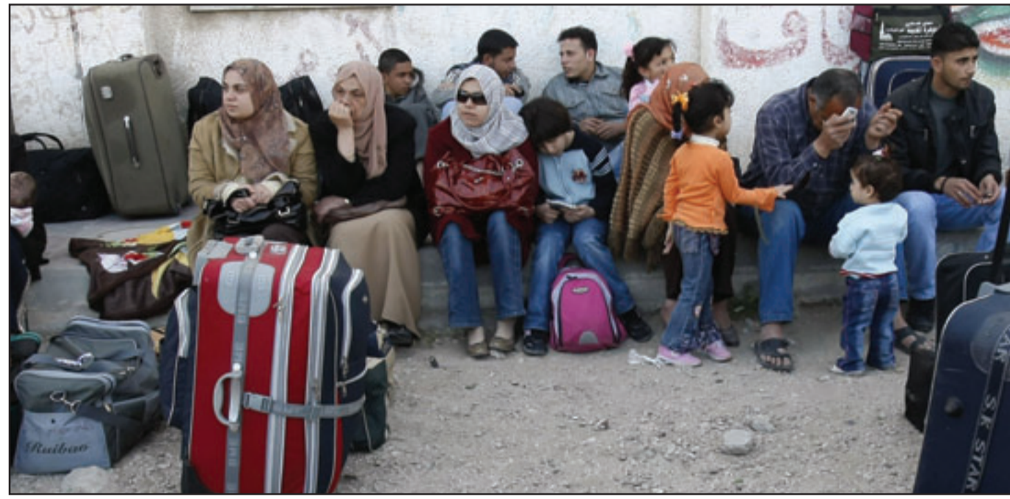
مسافرون فلسطينيون ينتظرون المرور عبر معبر رفح الذي فتح ليومين