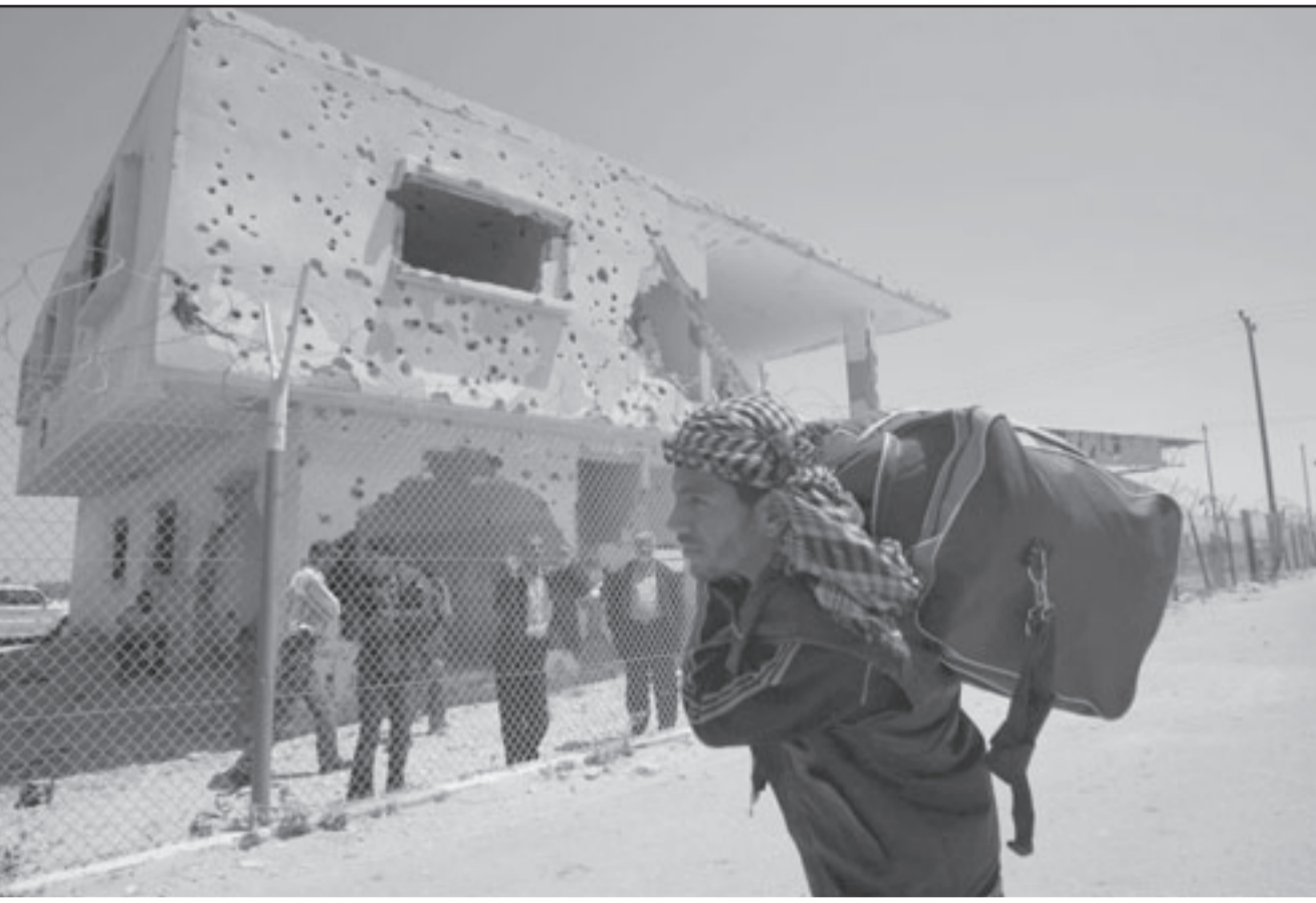
فلسطيني ينقل بعض الحاجيات من مصر الى غزة بعد فتح معبر رفح