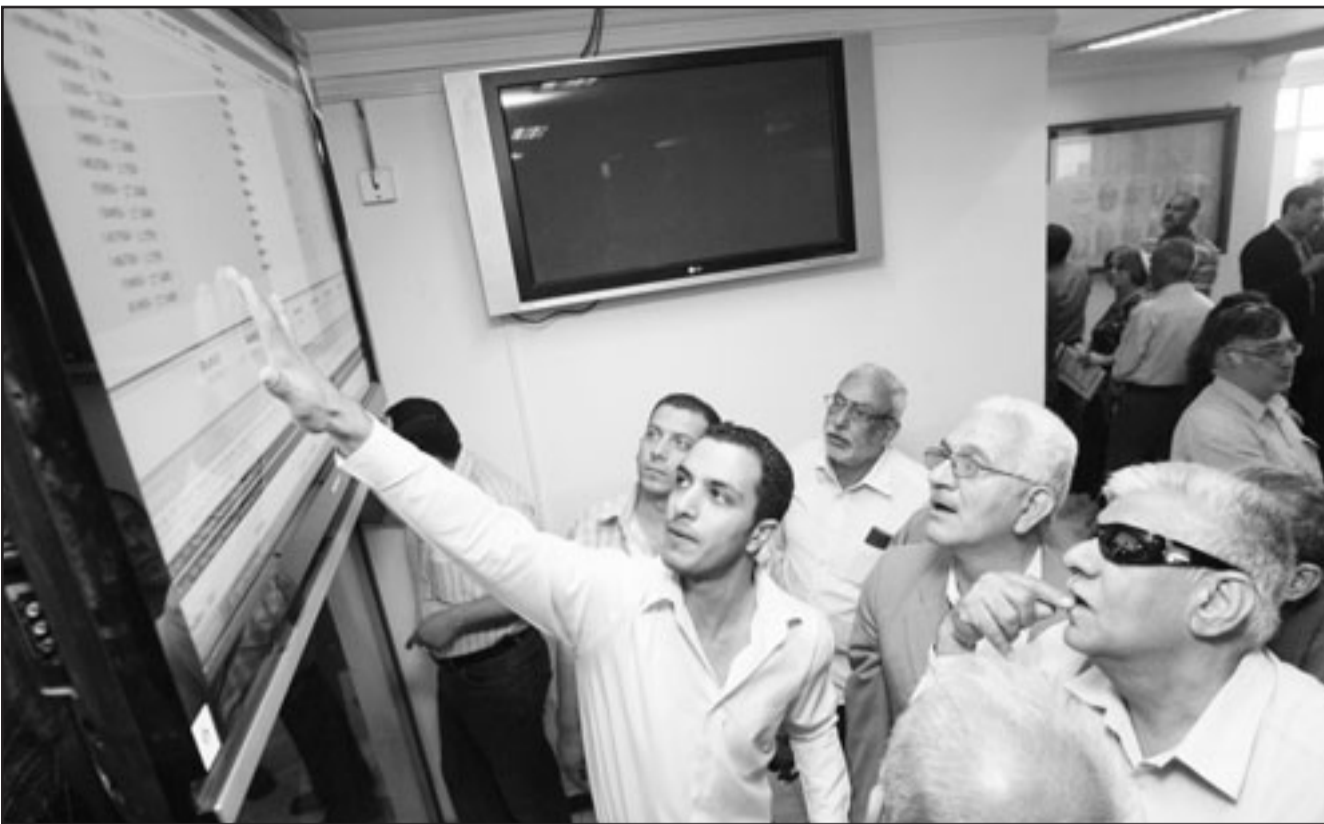
متداولون بسوق البورصة العراقية الالكترونية امس