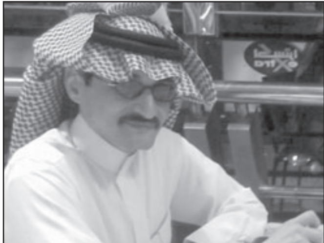
الأمير الوليد بن طلال

البشير عضو الهيئة الاستشارية في المجلس، فإن المعايير الرقابية التي توفرها مؤسسة النقد العربي السعودي إلى جانب الأجهزة المعنية الأخرى، منعت حدوث أي تأثيرات قوية ومباشرة للأزمة على القطاع المصرفي السعودي. وقال البشير إن الأنظمة المالية المعمول بها في المملكة برهنت على قوتها ومدى قدرتها على حماية المؤسسات المالية العاملة تحت لوائها وسط أمواج الأزمة العالمية العاتية، مقارنة بمؤسسات انهارت بعد خسارة بقيمة 5.1 مليار دولار وأعلن بعضها الإفلاس في المنطقة. وأضاف «الوضع لدينا آمن وسط دائما أسلوبا حذرا في العمل». ومهما يكن من أمر وسواء اشترت حصصا في اوبيل ام لا فان اامرة ابوظبي ابدت في الأونة الاخيرة رغبتها في دخول مؤسسات الصف الاول في الاقتصاد الاوروبي. واكد خادم القبيسي رئيس مجلس ادارة شركة «أبار» التي أصبحت تملك أكثر من 9 بالمئة من اسهم «دايمر» الشهر الماضي في ألمانيا «لدي موقف ايجابي جدا من الصناعة الألمانية». وأضاف «حين نتحدث عن ألمانيا في الخليج فاننا نتحدث عن مؤسسات جيدة وتكنولوجيا جيدة وتسيير جيد». ولقيت هذه التصريحات استحسانا في البلاد التي يمكن ان يصل فيها الانكماش إلى ناقص 4 بالمئة هذا العام. وادى انهيار