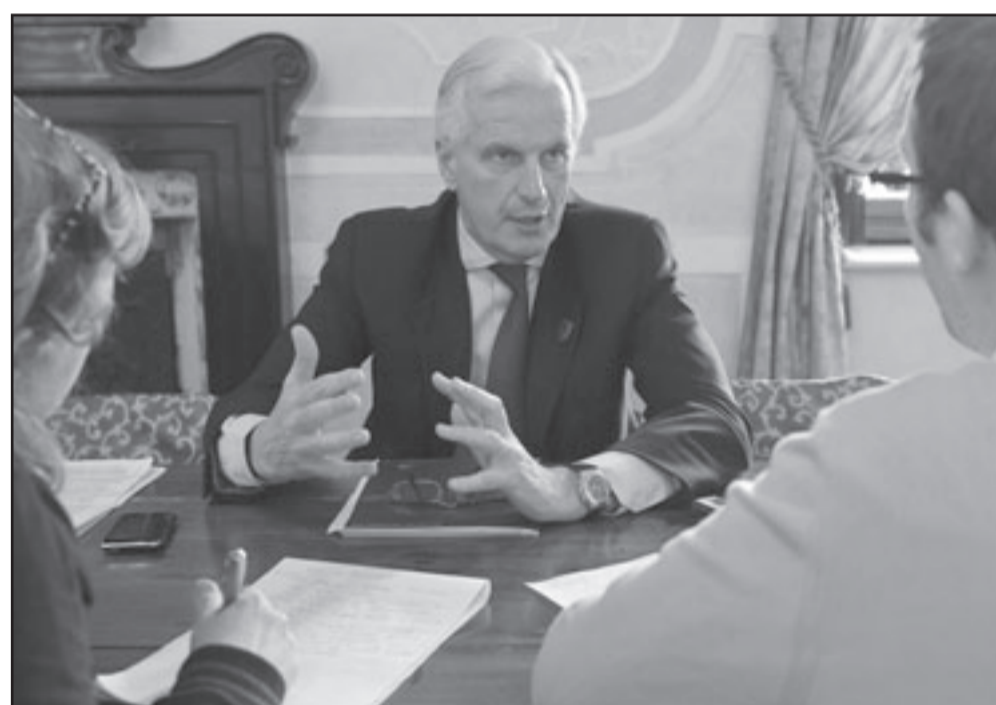
وزير الزراعة الفرنسي يتحدث للصحافيين على هامش اجتماع مجموعة الثمانية

افريقيا والمكسيك والارجنتين واستراليا ومصر. وجاء الصوت المعارض الوحيد في الاجتماع الذي عقد في شمال إيطاليا من وزير الزراعة في الدولة المضيفة الذي قال انه لن يتبرده في فرض رسوم إذا واجه قطاع الزراعة في بلاده أي تهديد. ولم يتضح بعد ما اذا كان سيرد أي ذكر لاجراءات الحماية على السلع الغذائية في الوثيقة المقرر ان يصدرها الاجتماع غدا الاثنين. وتوقع مسؤولون ومدنيون أن تخلو الوثيقة من توصيات محددة وأن تركز على الحاجة إلى زيادة مساعدات التنمية وایجاد سبل لزيادة انتاج الغذاء خاصة في العالم الثالث وبأسعار تناسب المستهلكين المحليين. وقال وزراء انه من المرجح ان تذكر الوثيقة فكرة تكوين مخزونات عالمية من الحبوب «كمفهوم عام يحتاج إلى دراسة متأنية دون التزم بالعمل بهذه الفكرة».