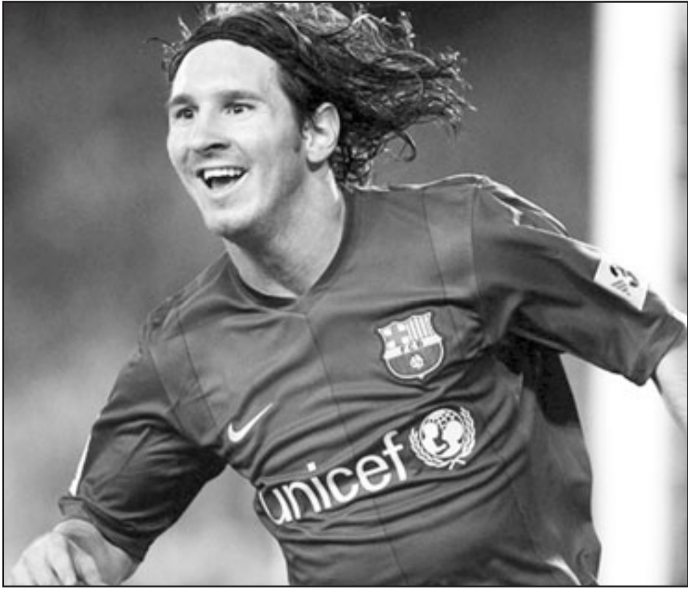
الارجنتيني ليونيل ميسي