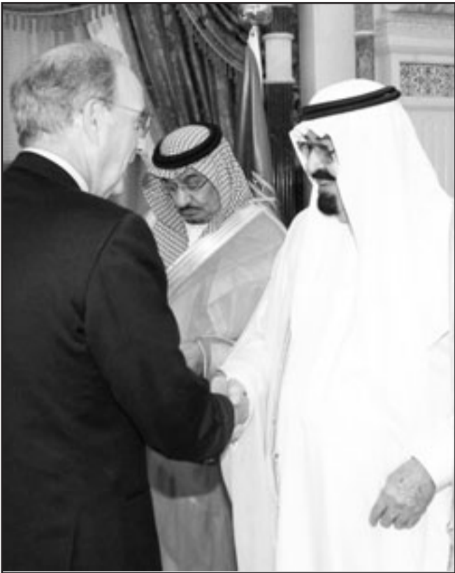
العاقل السعودي لدى استقباله المبعوث الأمريكي لعملية السلام امس في الرياض

■ الرياض - ي. ب. أي: بحث العاقل السعودي الملك عبد الله بن عبد العزيز في الرياض امس الأحد مع المبعوث الأمريكي الخاص للشرق الأوسط جورج ميتشل مستجدات القضية الفلسطينية وعملية السلام في المنطفة.