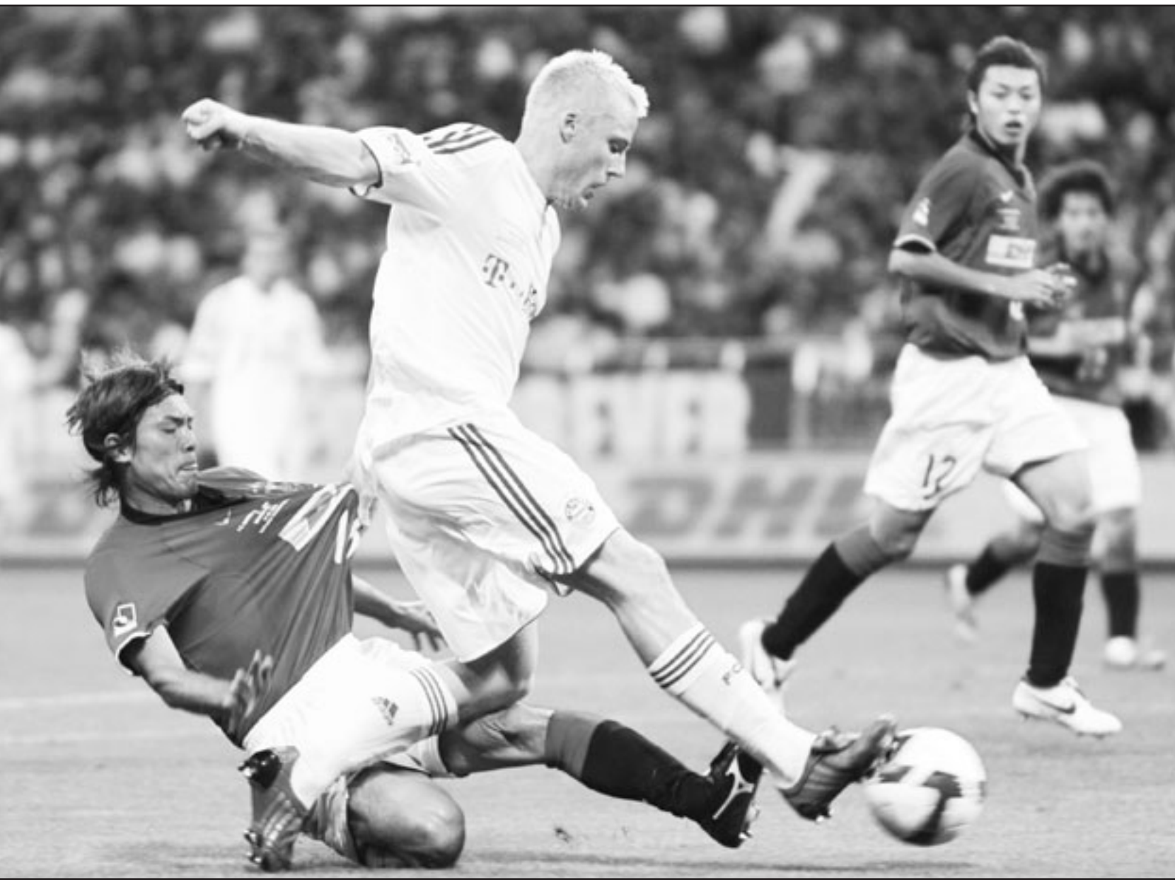
نجم بايرن ميونيخ كريستيان ليل يتغرد بالكرة خلال مباراة مع فريق اواردين

لندن - ا ف ب: اختير لاعب وسط مانشستر يونايتد بطل انكلترا لكرة القدم، الويلزي راين غيغز، لاعب العام في انكلترا من قبل جمعية لاعبي كرة القدم المحترفين . ويأتي اختيار غيغز (35 عاماً) رغم انه لم يشارك اساسيا سوى في 12 مباراة في الدوري الانكليزي هذا الموسم . وعلق النجم الويلزي على اختياره بالقول «لا يمكن أن أحلم بتحقيق أفضل من ذلك، خصوصاً ان الاختيار جاء من اللاعبين»، مؤكداً «حصلت على العديد من الكؤوس والجوائز في مسيرتي، لكن هذه الجائزة هي الأفضل بالنسبة لي..» (نص 18 عاماً) في صفوف مانشستر يونايتد، وقد مدد عقده في شياطا يونايتد الماضي عاماً اضافياً . وفي حال شارك مع فريقه ضد ارسنال غداً الاربعاء في ذهاب نصف نهائي دوري ابطال أوروبا، سيحصل غيغز الى عتبة المباراة مع مانشستر يونايتد، علماً بأنه يملك الرقم القياسي بعدد المشاركات معه (799 مباراة) . وكان غيغز تحظى الرقم السابق المسجل باسم بوبي تشارلتون (758 مباراة) في مشاركته في نهائي البطولة الأوروبية بالذات ضد تشلسي في 21 ايار/مايو الماضي في موسكو والتي فاز فيها مانشستر بركلات الترجيح بعد انتهاء الوقتين الاصلي والاضافي 1-1