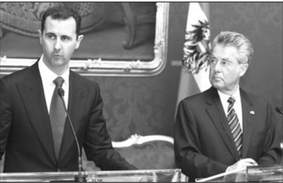
الرئيس النمساوي خلال لقائه نظيره السوري في فيينا