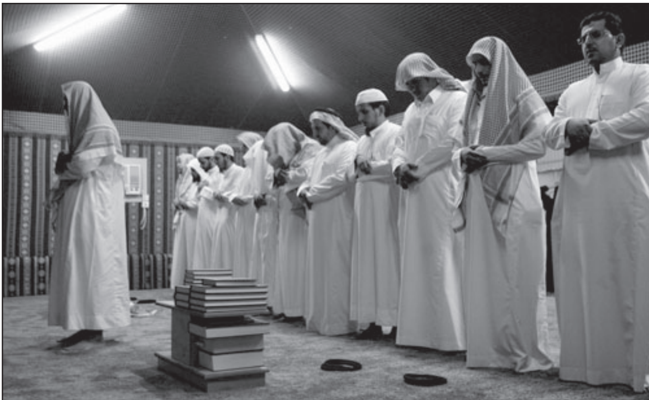
أعضاء سابقون في تنظيم القاعدة يؤدون الصلاة في مركز إعادة التأهيل بالعاصمة السعودية الرياض

ويسمح لهم كذلك بتبضية اسبوعهم الاول بعد عودتهم من غوانتانامو مع عائلاتهم.