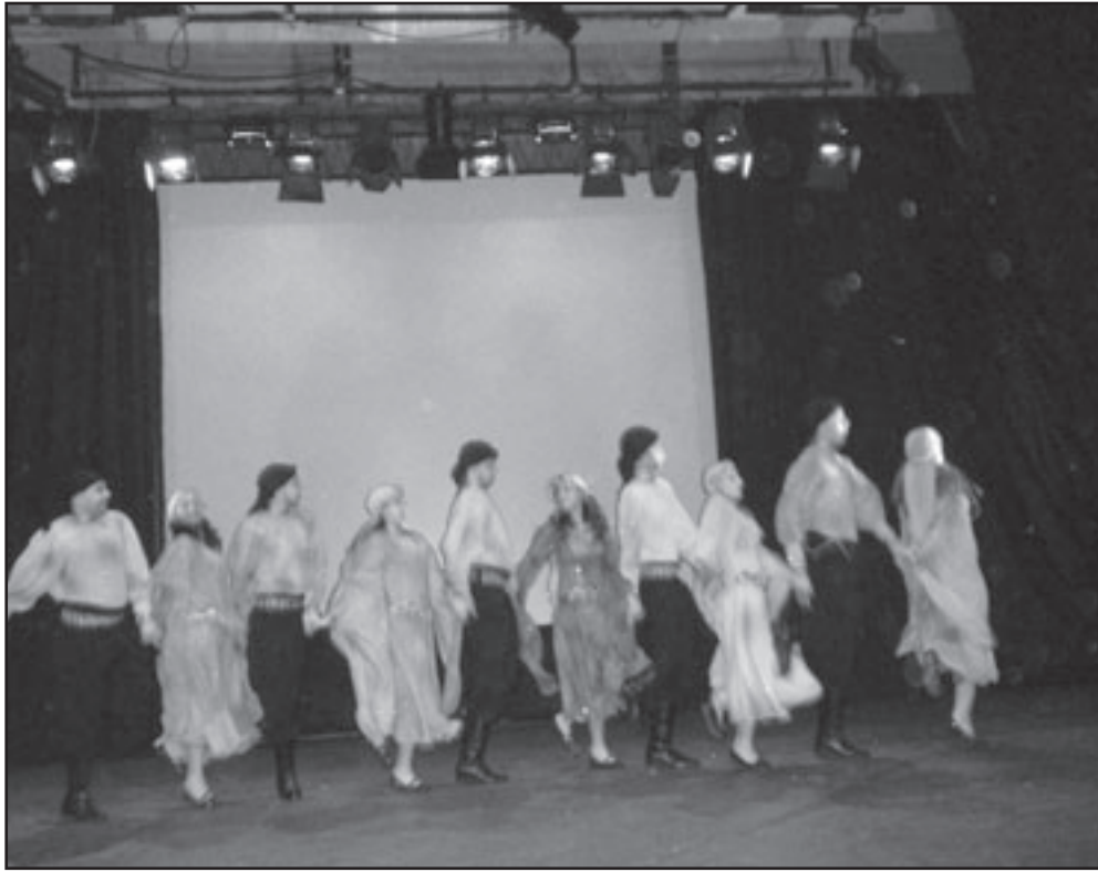
فرقة «آرادوس» (القدس العربي)