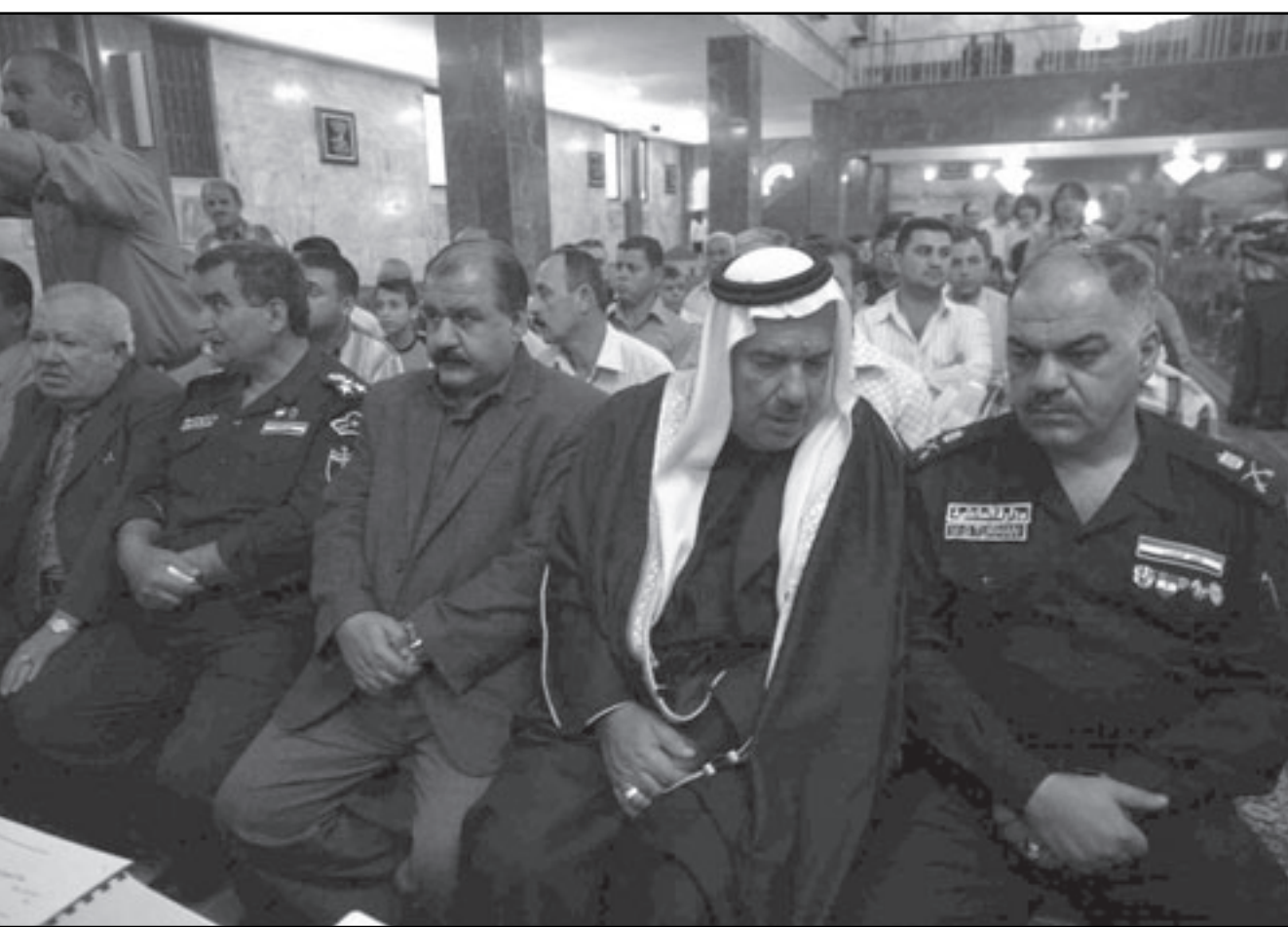
عراقيون يشاركون في قداس على روح القتلئ امس