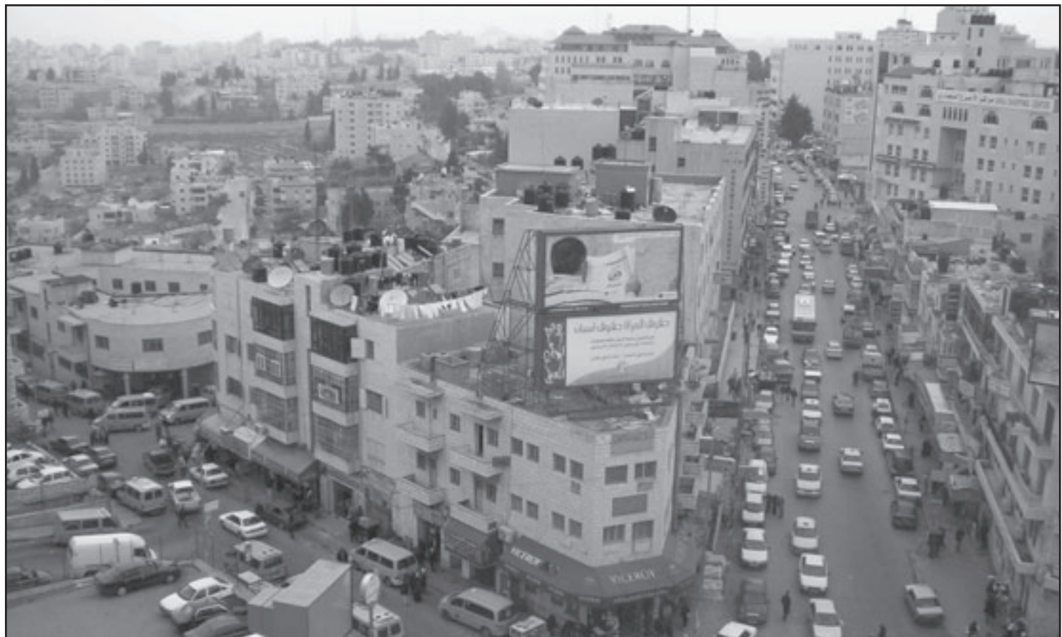
ما الفرق بين واشنطن ورام الله؟.. كلهم اعداء!

المتحدة. الحزب الشيوعي وجزءا من ميام تمت وصول الجيش الامري. في بعض الكيوتسات، نغية، مثلا خبات السلاح تحت الارض، على فرض ان الجيش السوفيتي المنقذ سيحتاج الى التعاون. في مياي حلم البعض بالانضمام الى كتلة دول عدم الانحياز. الى جانب صديقنا الهندي، ويوغسلافيا ومصر ناصر. ولشدة الحظ من قرر ان اين تذهب اسرائيل كان بن غوريون. الاحلام الهراء ايها توهو البتيا في الاسباب