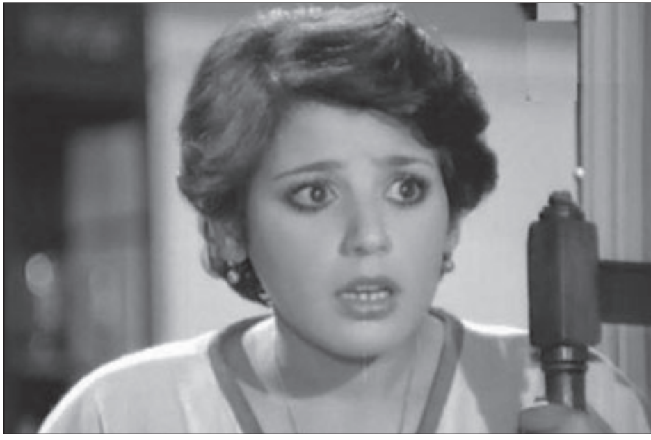
حنان سليمان في أحد أدوارها التلفزيونية

وقالت: الفن يتعرض أحيانا لموجات سطحية ثم يعود إلى أصله وجذوره، وأرى أن الأعمال الفنية حاليا دخلت في مرحلة جديدة بها الجيد الذي نتمنى استمراره. أضافت: السينما بدأت في التوسع بالانتاج الضخم الذي يمكنه طرح موضوعات كبيرة تحتاج لفرزانات