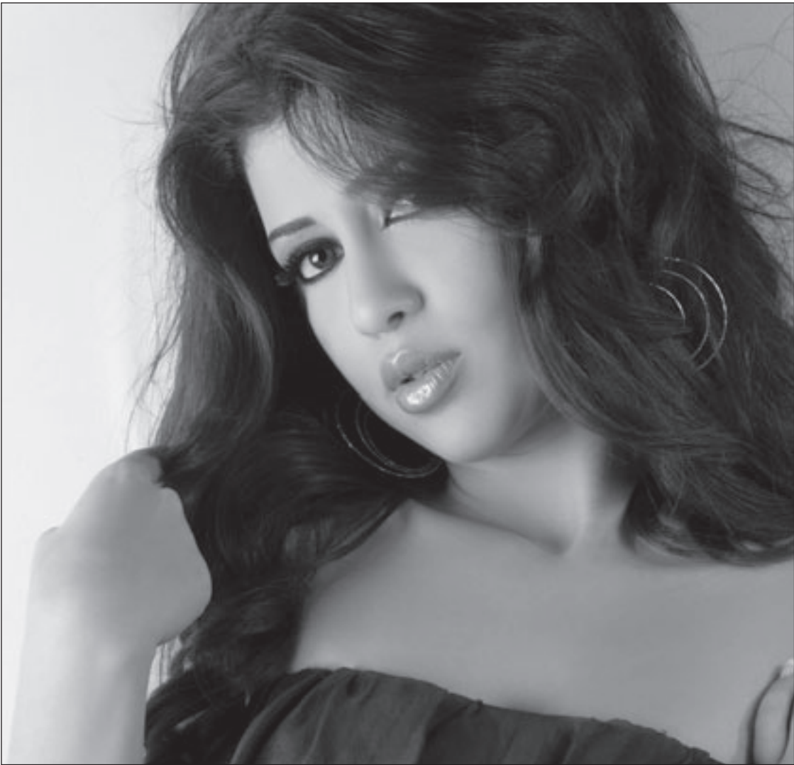
لاليان محفوظ (القدس العربي)