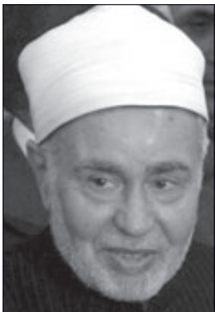
شيخ الأزهر سيد طنطاوي

ولى إلى غير رجعة، مشيراً إلى أن الجهاد مستمر حتى قيام الساعة شاء من شاء وأبى من أبى. وجدد دعوته للفصائل الفلسطينية كي تترك الفرقة وأن تتحد تحت راية الله عز وجل، مشدداً على أن يشائر النصر لن تتم إلا قبل أن تتحد كل الجماعات والقوى الفلسطينية تحت راية واحدة. ونفى أن يكون قد أشار من قبل أو أفق بحملة مقاتلة للإسرائيليين، مشدداً على أنهم فئة باغية تهلك الحرث والنسل ولا يخشون في الله لومة لائم، وقال «من مات دون عرضه ومن مات دون ماله فهو شهيد كما ورد في الحديث الشريف، لذا فإن الذين يقتلون وهم في ساحة المعركة من أجل تحرير الأقصى هم من أرقى الشهداء». وتعهد بعدم السفر إلى إسرائيل قبل أن يتم تحرير كامل التراب الفلسطيني وأن تعلن القدس موحدة للشعب الفلسطيني «لن أدخلها إلا تحت السيادة الفلسطينية حتى لو كنت على فراش الموت». وشدد على أنه لن يسمح لأي من قيادات الأزهر بأن يسافروا إلى هناك معتبراً أن موقفه ليس لكامل العاملين في المشيخة. جدير بالذكر أن دعوة وجهها مؤخراً د. محمود حمدي زقزوق وزير الأوقاف المصري لجميع المسلمين بضرورة زيارة القدس والمسجد الأقصى «بتأشيرات اسرائيلية»، لإجبار العالم على الاعتراف بها عاصمة لدولة فلسطين، أشارت جدلاً كبيراً بين مختلف أوساط الشارع المصري ورفضها جميع رجال الدين، واعتبرها هؤلاء محاولة صريحة ودعوة للتطبيع.