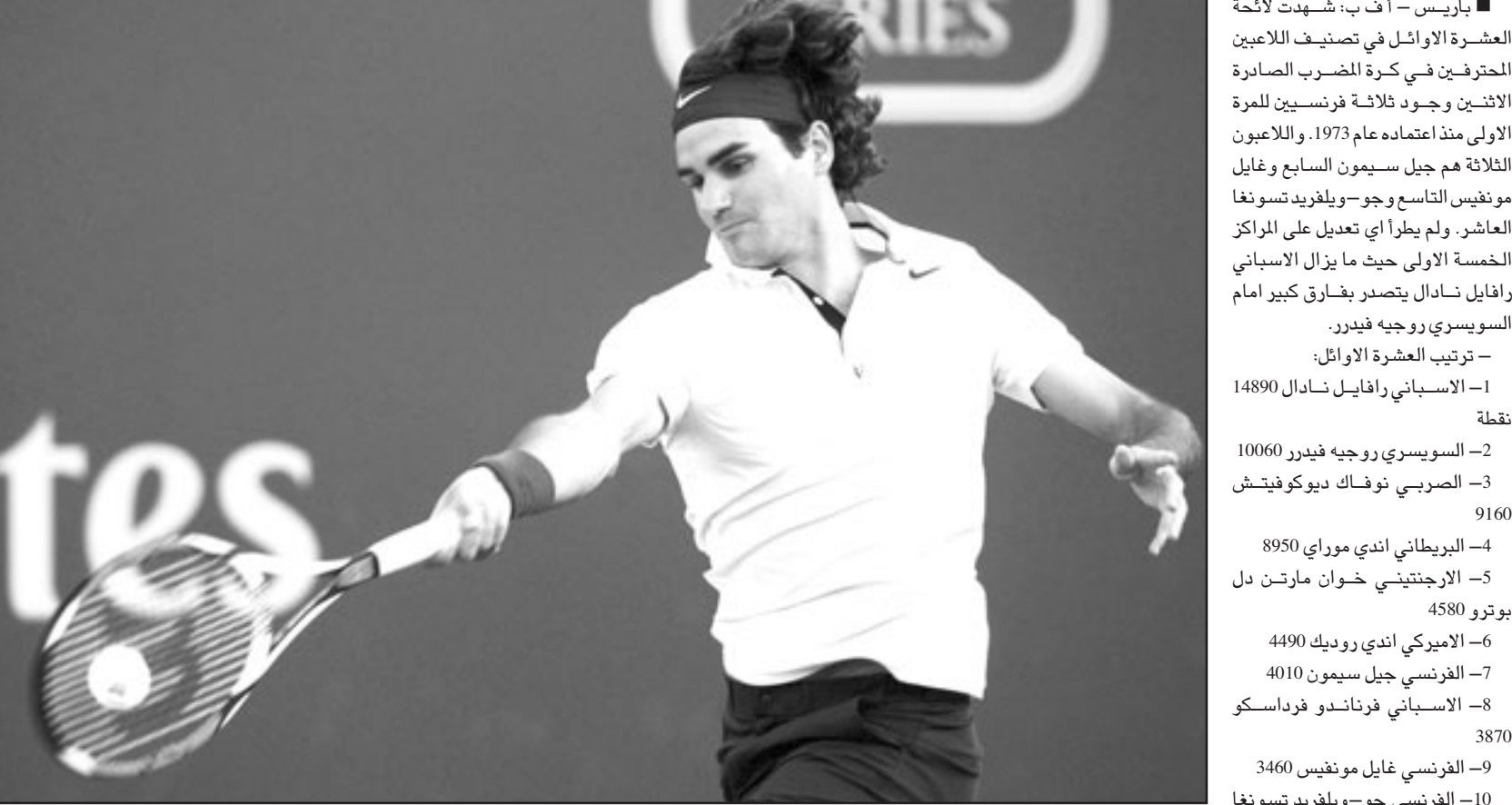
السويسري روجيه فيدرر