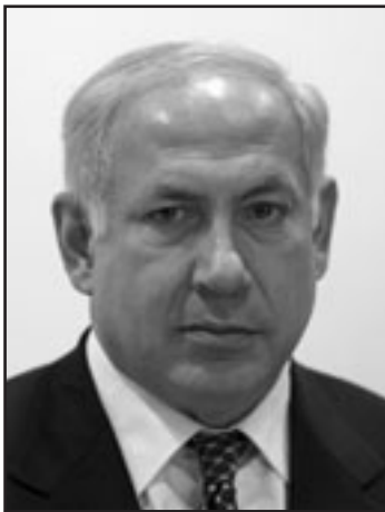
تنتياهو شطب بخيرية واحدة حدود الدولتين

«سلطة فلسطينية»، ولوضعت حدا للمسرحة المسماة «مسيرة السلام» ولطردت في دوائر النخبة الاسرائيلية بات عبارة «يهودية وديمقراطية» هي تضارب داخلي، لان انتماء الدولة الى قسم من مواطنيها وليس للاخرين يخرق مبدأ المساواة الديمقراطية.