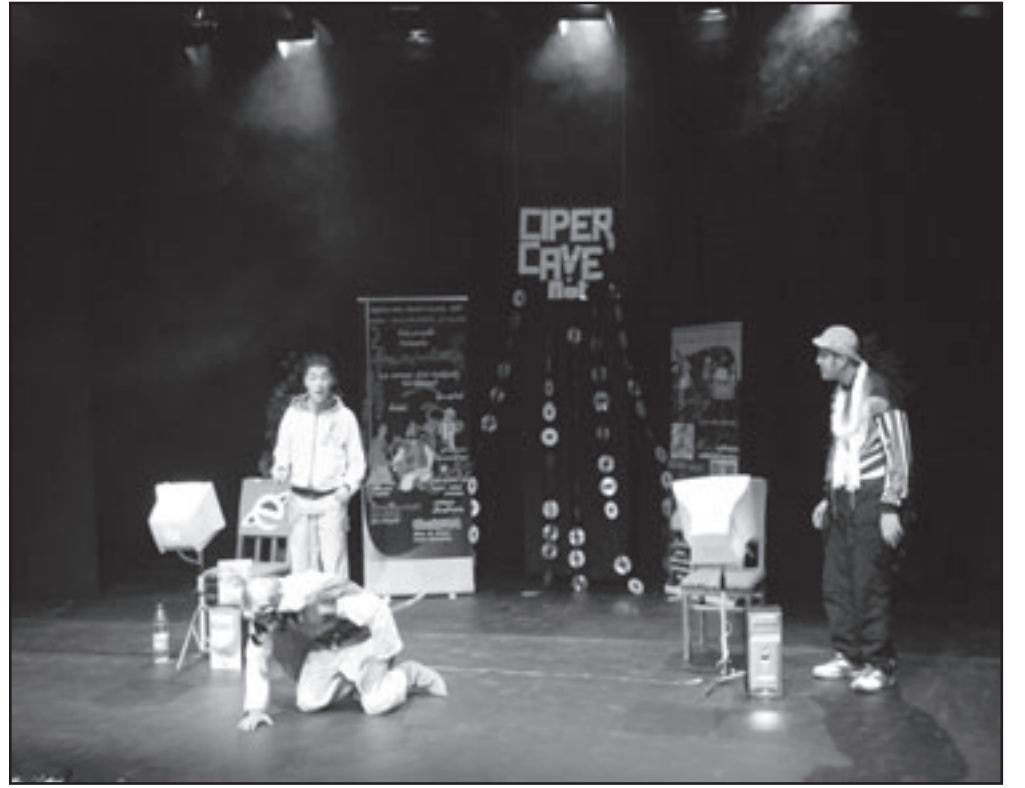
من العرض الجزائري، «عودة الحجاج بن يوسف»