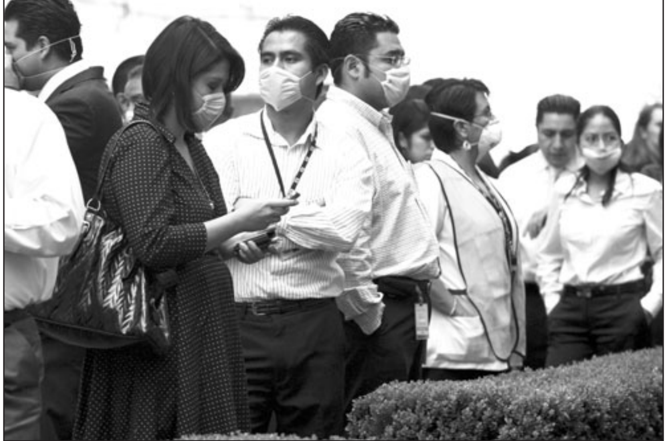
مواطنون في العاصمة المكسيكية يردون اقنعة واقية ويقفون خارج منازلهم تحسبا لانتهيار ميان بعد الزلزال الذي ضرب المدينة بدرجة 6 بمقياس ريختر أمس

عدم وجود مزارع لتربية الخنازير في الاقليم، لكنه أكد وجود خنازير برية. اسرائيل لتؤيد استخدام عبارة «انفلونزا الخنزير» أما في اسرائيل، فقد قرر نائب وزير الصحة الاسرائيلي المتشدد ياكوف ليتسمان أمس الاثنين اعتماد تسمية «انفلونزا المسك» بدلاً من «انفلونزا الخنازير» إذ ان الدين اليهودي يعتبر ان الخنزير حيوان نجس. وقال ليتسمان خلال مؤتمر صحفي «افضل استخدام كلمة انفلونزا المسك حتى لا اضطر الى التلطف بكلمة «خنزير». والدين اليهودي يحظر اكل لحم الخنزير ويعتبر هذا الحيوان نجسا في التقليد اليهودي. وحرص ليتسمان من حزب «اليهودية من اجل التوراة» على طمأنة الناس حيال احتمال انتشار هذا المرض في اسرائيل. واكد «لا مؤشرات الى ان الفيروس وصل الى اسرائيل واجهتنا مستعدة لمواجهة اى احتمال».