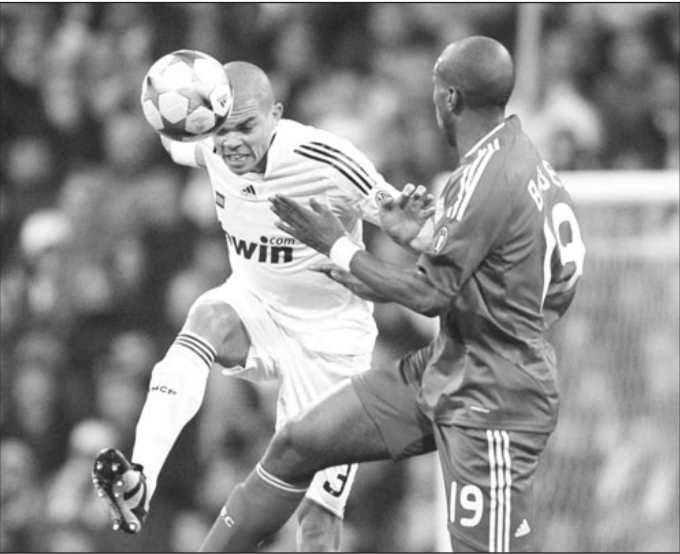
نجم ريال مدريد ريببي (يسار) ينافس لاعب ليفربول ريان بيل على الكرة