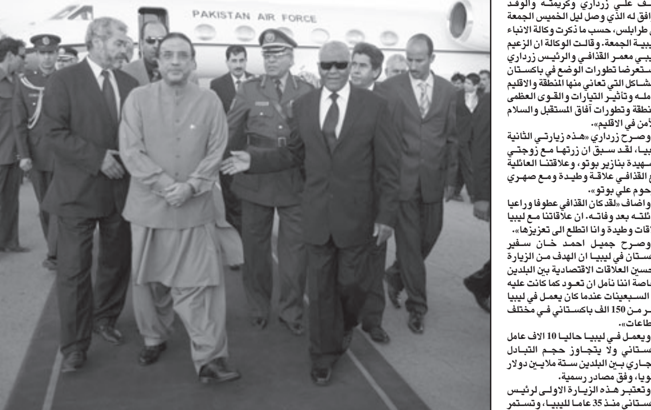
الرئيس الباكستاني يصل إلى مطار طرابلس ظهر الجمعة