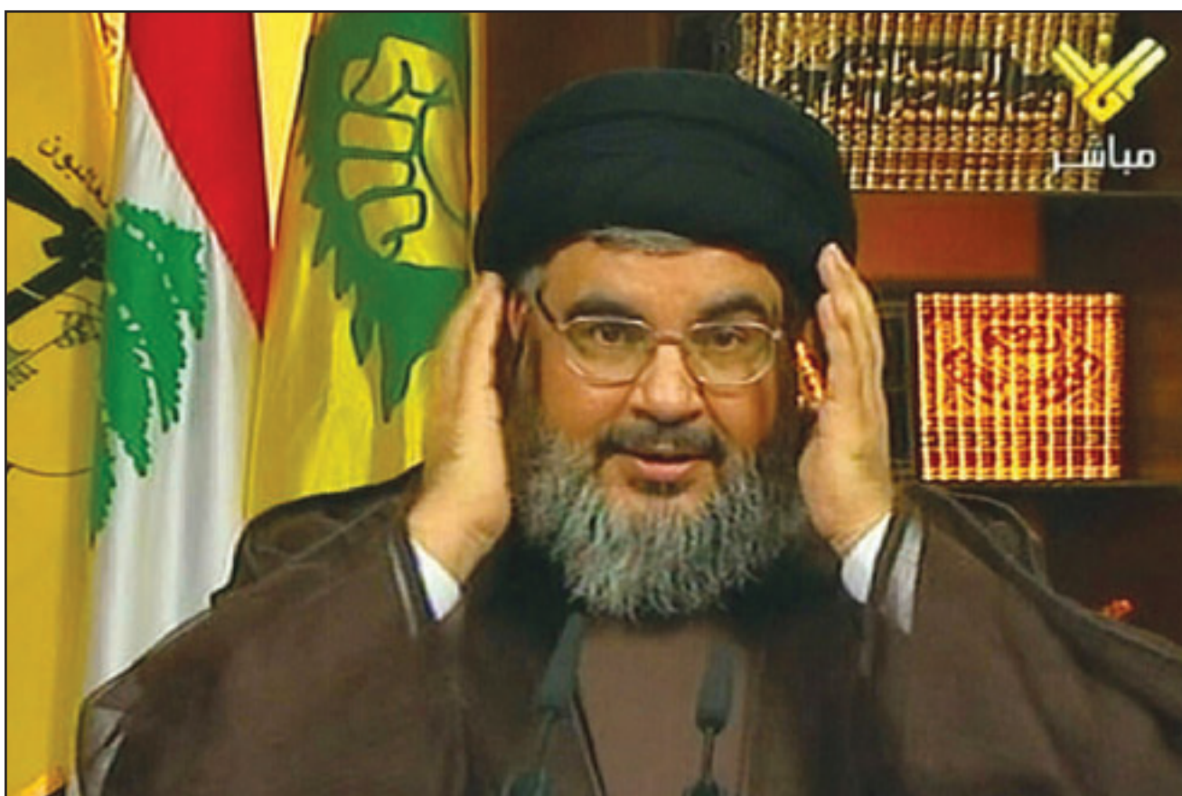
الامين العام لحزب الله يلقى كلمة عبر تلفزيون المنار مساء الجمعة

لقضية واضحة هي دعم الفلسطينيين وهذه تهمة تهمتها الوحيدة». ويتهم القضاء المصري حزب الله بالسعي إلى زعزعة الاستقرار في مصر، وذلك بعد اكتشاف خلية لهذا الحزب في مصر تعمل على تقديم الدعم لحركة حماس في قطاع غزة. وأضاف نصر الله «القول للمسؤولين المصريين إن استمرار الحملة لن يجدي نفعاً، منسائلاً «هل استعداد النظام المصري موقعه الإقليمي من خلال الحملة وهل استطاع تشويه صورة حزب الله؟ أنا أقول لكم بالطبع لا». وأشار نصر الله إلى وجود جهات لم يسماها تعمل على المعالجة الهادئة. وقال «تعمل جهات نثق بها وتحترمها على معالجة الموضوع بعقل وهدوء»، مرفياً عن الله بأن «تعمل على النتائج المطلوبة». وانتهى نصر الله الأمين العام للأمم المتحدة بان كي مون بجزء المؤسسة الدولية بالعودة ضد حزب لصالح إسرائيل، وقال إن الحملة الغربية ضد حزب