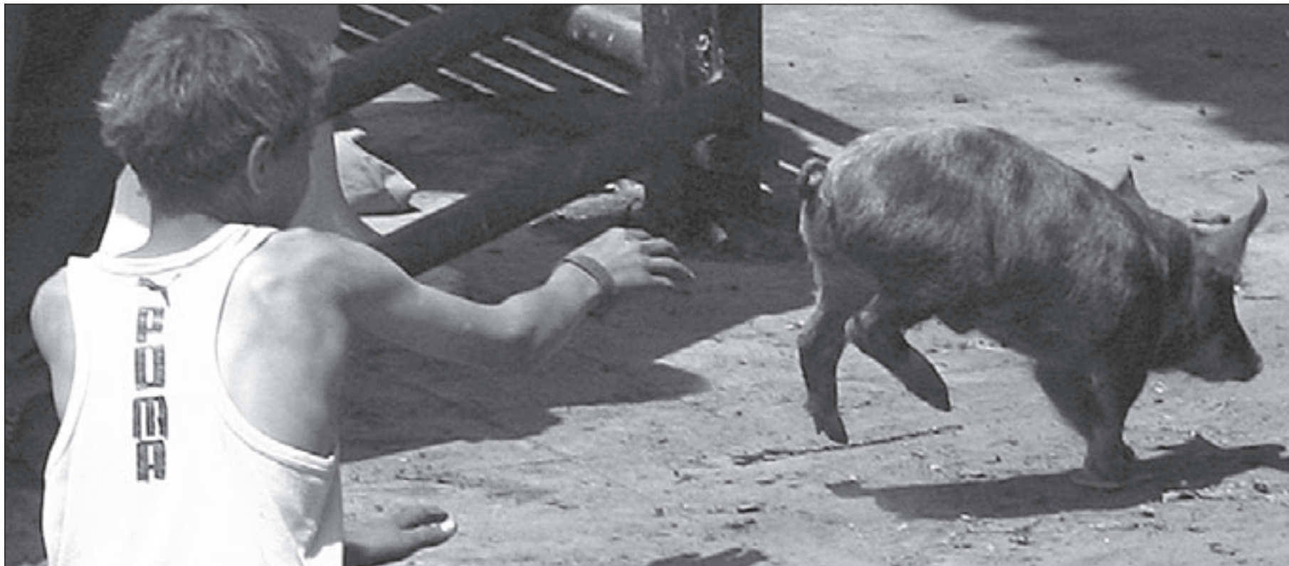
مطل مصري في إحدى مزارع الخنازير بالقاهرة

وتؤكد بيرة انها ستشارك في التصويت لكنها حتى