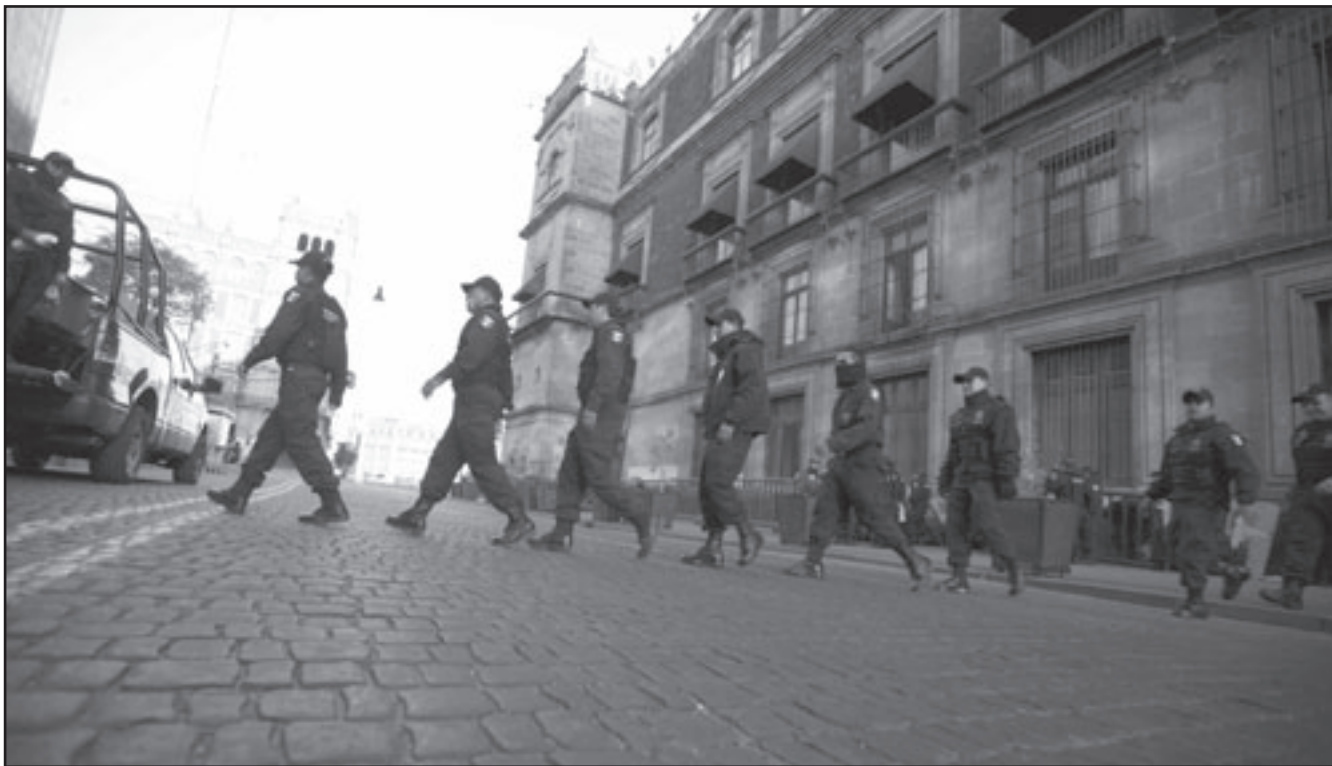
ميدان رئيسي في العاصمة المكسيكية يخلو الامن دورية لرجال الامن

غير الضرورية مثل الأثاث وأجهزة الكمبيوتر. وقال كارستنز إن دولا أخرى ابتليت بالأوبئة في السنوات الأخيرة تعافت سريعا حالما يأخذ المرض دورته الطبيعية، لكنه أضاف أن تلك الأمتنة تتبء أيضا بأن تفشي الانفلونزا لمدة ثلاثة شهور قد يخفف الناتج أيضا، وتزدحم المتاجر بمكسيكيين يرتدون الأقنعة الواقية ويشترتون مستحضرات التعقيم والطعام والمياه لكن خبراء الاقتصاد يقولون إنهم يخفضون مشترياتهم من الأشياء