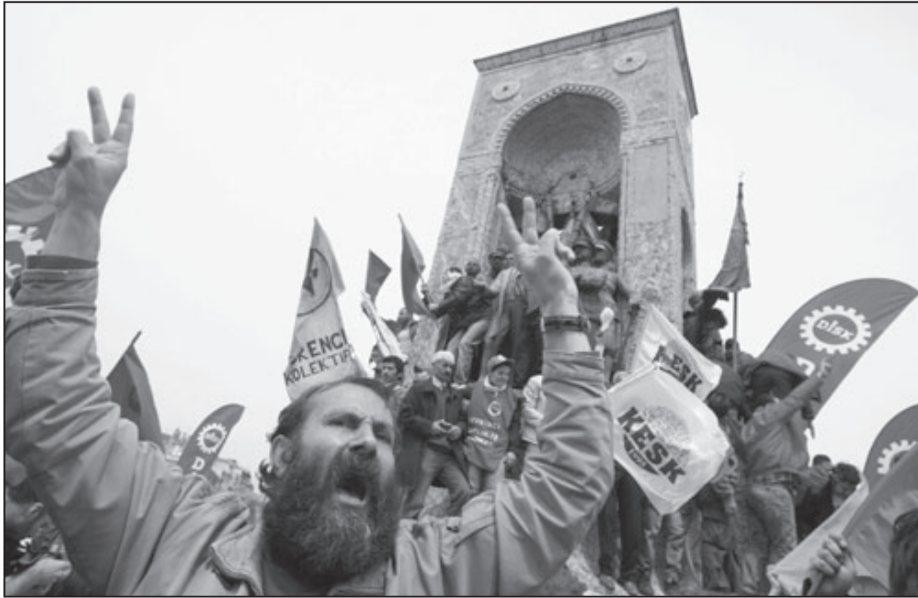
جانب من مظاهرات اسطنبول بمناسبة عيد العمال

تجاوز عدد العاطلين عن العمل فيها في الفصل الاول اربعة ملايين شخص، لتصل نسبة البطالة الى 36.17%، وهي الاعلى في الاتحاد الاوروبي. وفي روسيا اووقت الشرطة الجمعة مئة من انصار اليمين المتطرف وناشطين مناهضين للمهاجرين حاولوا التظاهر في سان بطرسبورغ (شمال) في حين شهدت عدة مدن روسية اخرى تظاهرات بمناسبة عيد العمال، على ما افاد مراسلو وكالة «فرانس برس». وفي وارسو تجمع مظاهرون امام مقر البرلمان تهاقبن «حرية، مساواة، اشتراكية». في اليونان احييت النقابات الاول من ايار (مايو) في شقين كالعادة. ففي اثينا شارك الالاف في تجمعين في وسط المدينة، اكبرهما دعوة من الجبهة النقابية الشيوعية تحت شعار «على السلطة الثرية دفع ثمن الازمة». وفي فيينا، شارك حوالي 100 الف شخص في تجمع الحزب الاجتماعي الديموقراطي مطالبين بالترديد من «العدالة الاجتماعية». وفي صوفيا وعد رئيس الوزراء سيرغي ستانيشيف بان يساعد حزبه بلغاريا على عبور «مياه الازمة» اجتماعية، على ما نقل مصور «فرانس برس». وايضا مسيرات في طوكيو، سيول، ومانبلا.