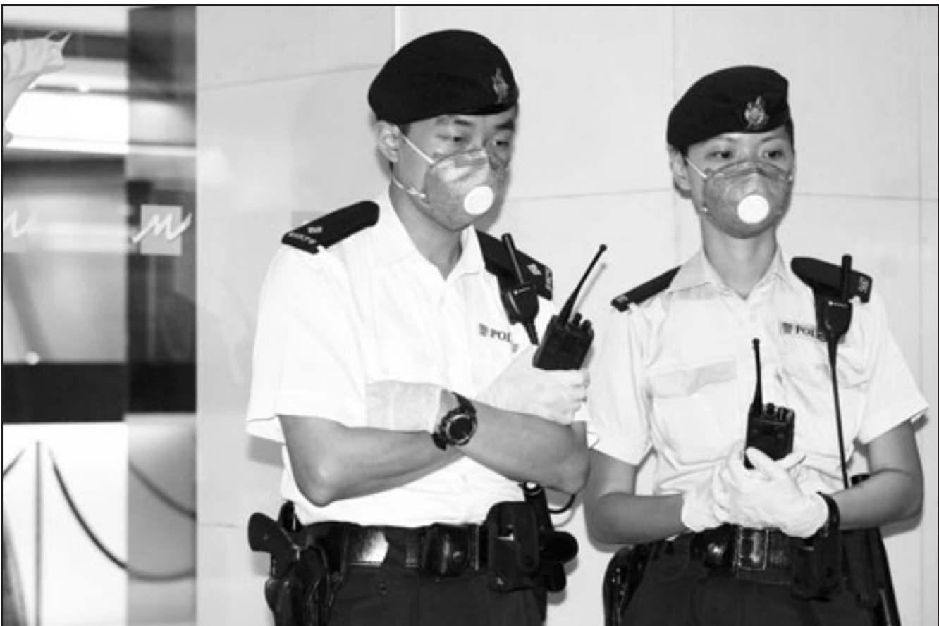
شرطي وشرطة يرتديان اقنعة واقية من المرض بعد ثبوت وجود اول إصابة في هونغ كونغ

وعلى الرغم من ذلك بثت محطات إذاعة محلية فلسطينية برنامج عن المرض لتوعية المواطن الفلسطيني. وأكدت وزارة الصحة في حكومة حماس في غزة بدورها عدم تسجيل أي حالات مشتبه بها مصابة بمرض أنفلونزا الخنازير.