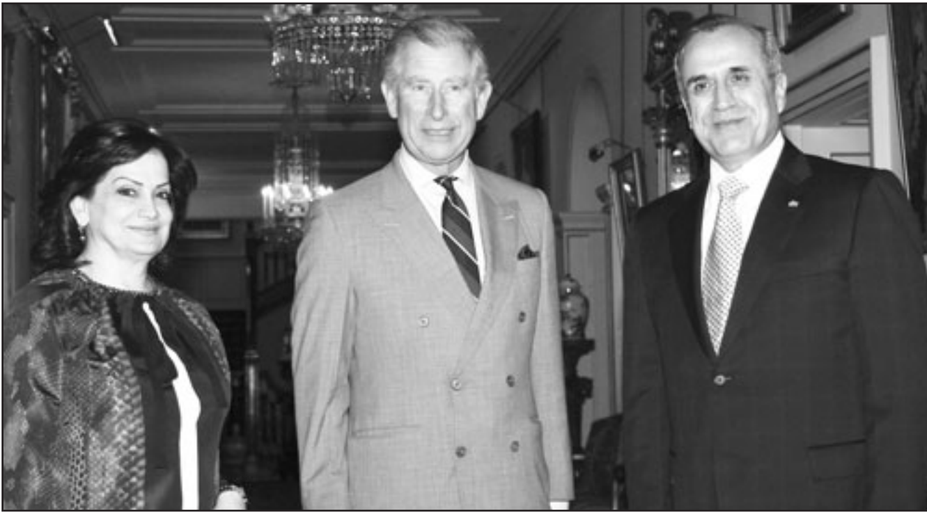
الامير تشارلز لدى استقباله الرئيس اللبناني وعقبته في لندن مساء الخميس

واعتبر سليمان بيان «مما ورد في القرار الدولي 1701 الإقرار بضمانة الدول العظمى للموسسة لصلون حدود لبنان مع العدو الإسرائيلي، وقد بخرق هذا القرار، كما يعارض لبنان اي محاولات او مغامرات لتوطين الفلسطينيين في لبنان».