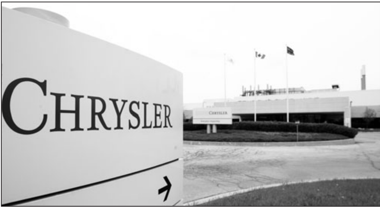
مركز تجميع سيارات تابع لكرايسلر في مدينة برامتون الكندية