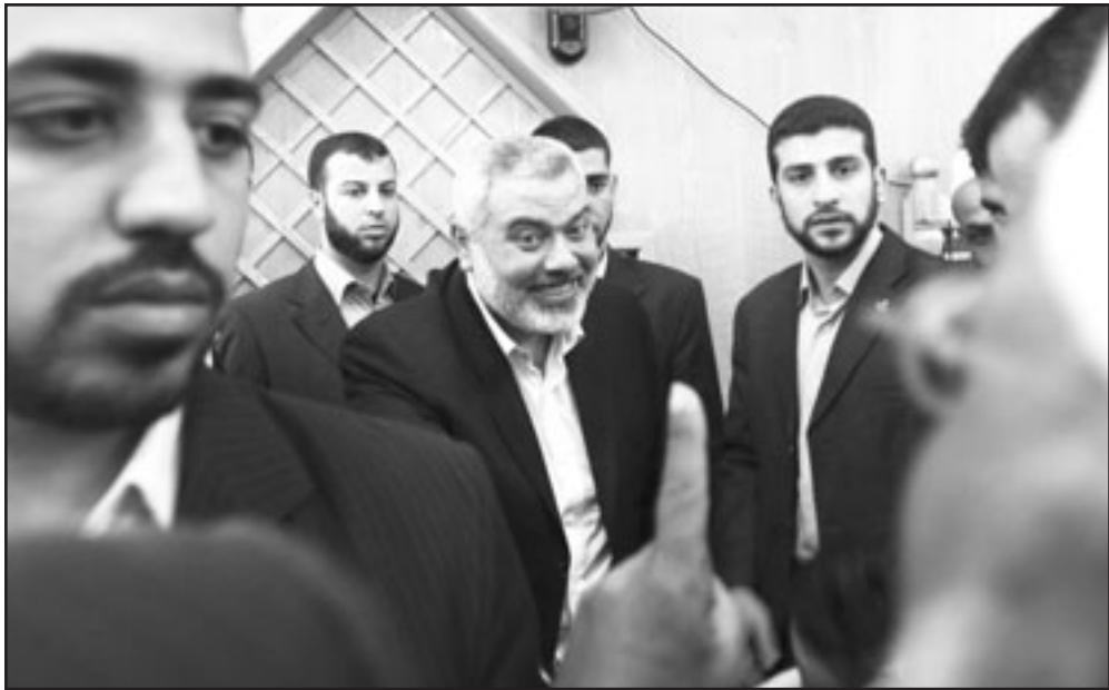
اسماعيل هنية بعد صلاة الجمعة

الخارجية العرب الا يقتصر على متابعته للقدس على البيانات والمناشدات والتصريحات».