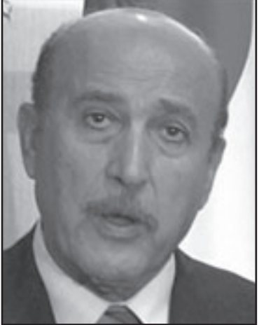
عمر سليمان؛ حكومة الوحدة الفلسطينية لن تتشكل

ريما للمرة الاولى منذ توقيع اتفاق السلام بين مصر واسرائيل تجد هاتان الدولتان نفسيعما في نفس الجانب من الخندق في مواجهة عدو مشترك وتهديد استراتيجي يزيح جانبا لفكرة زمنية معينة - كل النقاط الخلافية الاخرى. اذا من الصحيح القول ان مصر لم تخفي مطالبها من اسرائيل في المسألة الفلسطينية كما ان الجيش المصري لن يتوقف عن زيادة قوته