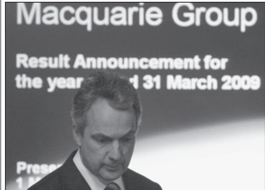
نيكولاس مور الرئيس التنفيذي لبنك ماكوارى

برلين - دب: تقرر السماح بزراعة البطاطس المعدلة وراثيا في ألمانيا بصورة رسمية حيث أجاز المكتب الاتحادي لحماية المستهلك وسلامة الأغذية كسلطة مسؤولة يوم الخميس لإحدى الشركات الزراعية بزراعة هذا النوع من البطاطس بولاية مكلنبورغ فوربومرن. وأفادت مصادر مطلعة بأن وزيرة الزراعة الألمانية إلزا إنغبر كانت سمحت لشركة «بي إيه إس إف بلانت ساينس» المتخصصة في الأبحاث الكيماوية الزراعية يوم الاثنين الماضي بزراعة البطاطس المعدلة في مساحة محدودة معدة للتجارب، حيث ستم الزراعة على مساحة عشرين هكتارا بدلا من مئة وخمسين هكتارا كانت مقررة في قبل. ويتوقع المكتب الاتحادي لحماية المستهلك وسلامة الأغذية ألا تؤدي تجربة زراعة هذا النوع من البطاطس والذي أطلق عليه «أفلورا» إلى أي آثار ضارة على الإنسان أو الحيوان أو البيئة، ومع ذلك أمر المكتب بإخاذ احتياطات أمان صارمة من بينها مثلا ترك مسافة قدرها عشرة أمتار فاصلة بين منطقة تجارب البطاطس المعدلة وبين الحقول الجاورة التي تنبت فيها محاصيل عادية.