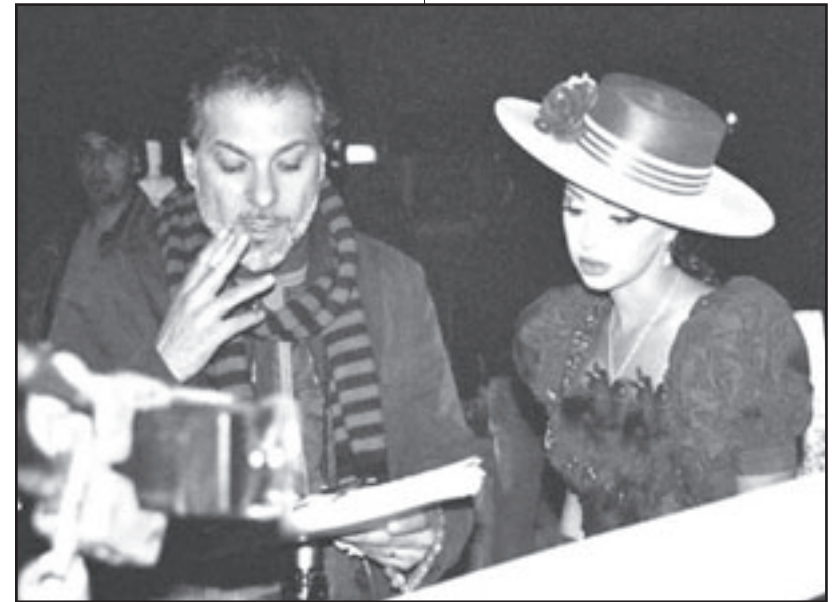
المخرج حاتم علي ومريام فارس

إنتاج أعمال درامية بميزانيات مفتوحة ونذكر «صراع على الرمال» - فكانت «سيلينا» المدينة التي تحتل بعيد «الوجه الثاني»، حيث برتدي كل أفرادها أفعى وليلوم واحد فقط، لكن الملك