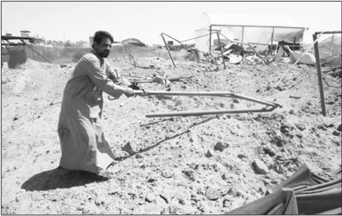
فلسطيني يتفقد آثار الدمار بعد قصف اسرائيلي لنفق على الحدود المصرية مع القطاع

وقال المفوضة السامية للامم المتحدة لحقوق الانسان «رغم ان الحكومة الاسرائيلية اشارت الى ان المنازل التي يجري هدمها لم تحصل على التصاريح اللازمة للبناء فان الحقيقة هي ان الفلسطينيين لا يسمح لهم بالحصول على مثل هذه