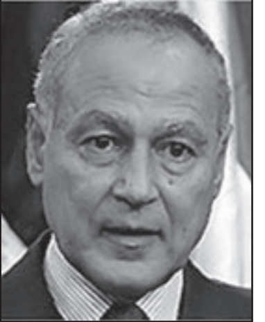
ابو الغيط وضع مصر واسرائيل والغرب بسلة واحدة

ولكن في الاسابيع الماضي ارتفعت وحدة المصالح الاسرائيلية- المصرية تدرجة، هي انتقلت من المسار العلني، في مقابلة هجوية بصورة مميزة مع صحيفة «الشرق الاوسط» الهندية ذكر وزير الخارجية المصري احمد ابو الغيط التهديد الايراني لصر بالتهديد الايراني لاسرائيل والغرب ووضعهم في سلة واحدة، الرئيس مبارك خرج في الاسوع الماضي