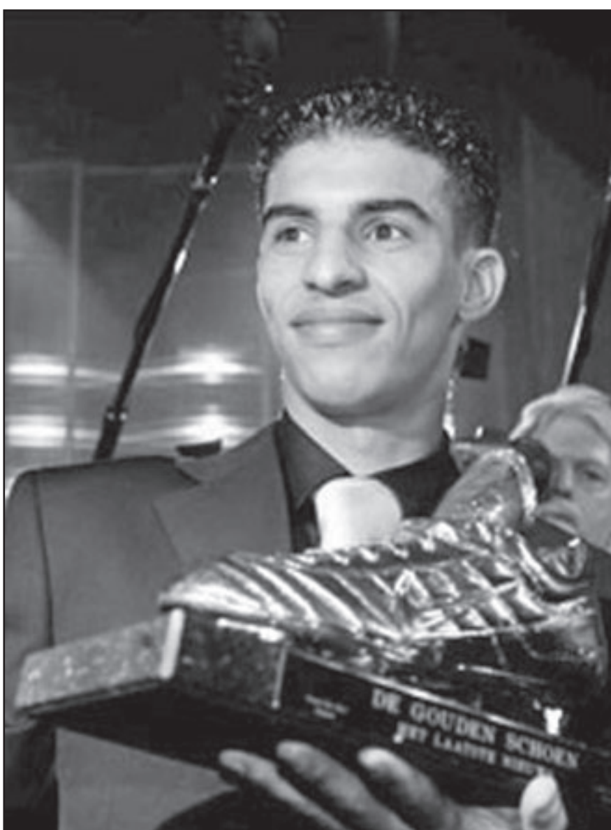
مبارك بوصوفة الذي اختير أحسن لاعب في بلجيكا سنة 2006 وتعرض لعمالة مهينة على يد الشرطة البلجيكية

وكان اللاعب المغربي الذي يلعب في صفوف إنترخلت البلجيكي، وجرى اختياره أحسن لاعب في بلجيكا سنة 2006، قد تعرض لعمالة وصفت بالعنيفة والمهينة في مهقو يرتاده الغارية في