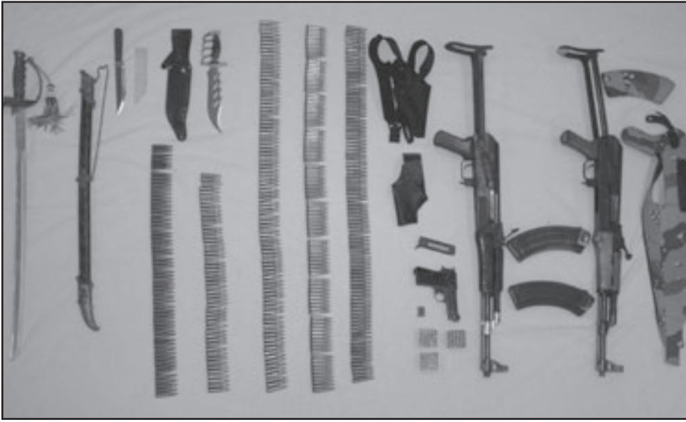
صورة للأسلحة التي ضبطتها السلطات البحرينية مع المتهمين الجمعة

■ المنامة - رويترز - ف. ب: ذكرت وكالة الأنباء الرسمية في البحرين في ساعة متأخرة من الخميس أن الدولة الخليجية التي يتخذ منها الأسطول الأمريكي الخامس قاعدة له اعتقلت شخصين يشتبه في أنهما خططا لأعمال إرهابية في البلاد والمنطقة ككل. وقال وزير داخلية البحرين الشيخ راشد بن عبدالله آل خليفة إن السلطات عثرت على أسلحة وذخائر في منزلي الشخصين المشتبه بهما، والقي القبض عليهما يوم 26 نيسان/ أبريل.