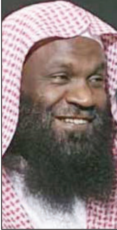
امام الحرم المكي الشيخ عادل الكلباني