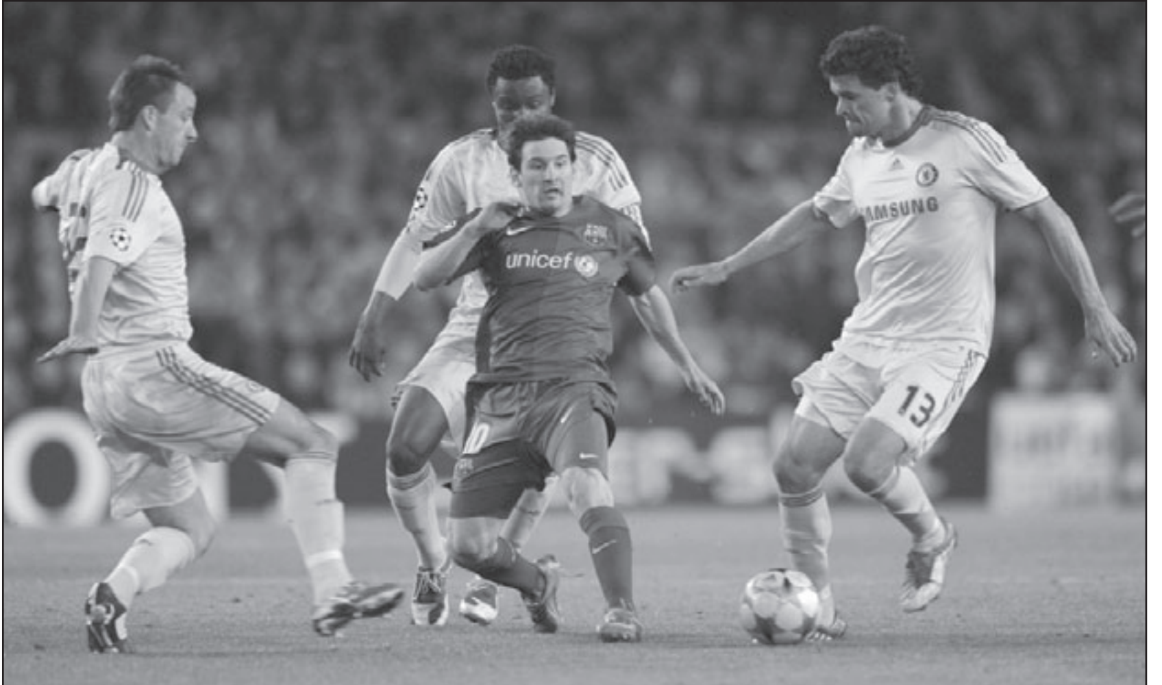
ميسي نجم برشلونه (يمين) في منافسه على الكرة مع جون تيري نجم تشلسي (يسار) وفي الوسط ايسين

بعد غيابه عن مباراة الذهاب للإيقاف، أما ريكاردو كارفاليو وجو كول فهما لم يستعدا لياقتهما البدنية بعد. وفاجأ هيدينك الكثيرين عندما لم يرح من لاعب الأساسيين سوى المخضرم مايكل بالاك خلال مباراة تشيلسي أمام فولهام بالدوري الإنكليزي يوم السبت الماضي والتي فاز فيها تشيلسي 1/3 ليحتفظ بمركزه الثالث بترتيب الدوري الممتاز. وعلق هيدينك على برشلونة قائلا: «إنه فريق على مستوى عال جدا ويجب أن نتمتع بتركيزنا التام أمامهم، ولكننا أيضا لدينا ثقة كبيرة في أنفسنا وإذا حظينا بتشجيع جماهيري كبير هنا في الاستاد فيوسعنا تحقيق ما نريده». من جانبه، أشرف صانع ألعاب تشيلسي فرانك لامبارد بالرد على الانتقادات التي وجهت لفريقه للترزاهم بالأداء الدفاعي البحث في «كامب نو». وقال لامبارد يوم السبت الماضي: «كانت نتيجة رائعة وأداء ممتازا.. أما بالنسبة لكل هذا الجدل، فإنتي أنظر إلى الأمر على أنه مجرد