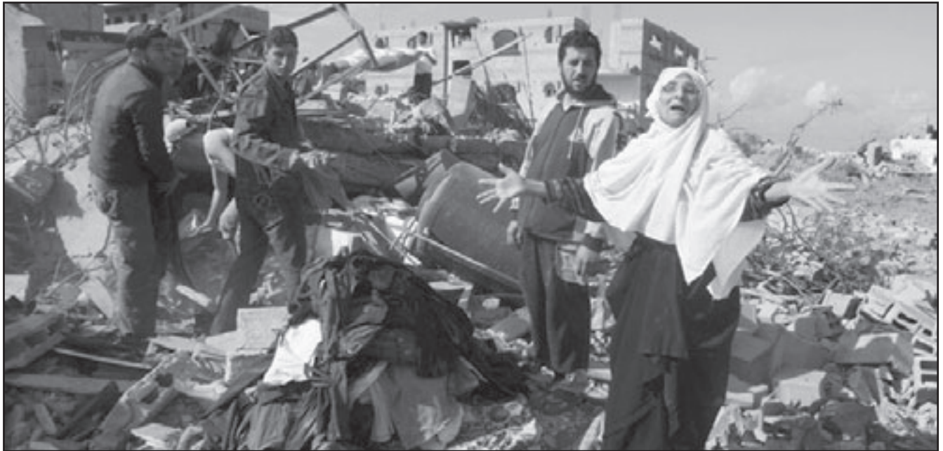
عائلة فلسطينية تتفقد آثار العدوان الإسرائيلي على غزة

بعد مرور يوم واحد على اعلان القاضي الاسباني مواصلة النظر في الدعوى المقدمة ضد عدد من القادة الاسرائيليين بتهمة ارتكاب جرائم حرب ضد الابرياء الفلسطينيين، تلقت الدولة العبرية صفة جديدة، حيث كشفت صحيفة «يديعوت احرونوت»، في عددها الصادر امس الثلاثاء، أن الامم المتحدة أعدت تقريراً عن ممارسات الجيش الإسرائيلي في الحرب الأخيرة على غزة اتهمت فيه الجيش الإسرائيلي بارتكاب مخالفات خطيرة ضد القانون الدولي وضم المعاهدات والموثيق الدولية. ووصف مصدر اسرائيلي التقرير في تعليقه للصحيفة العبرية بأنه بمثابة هزة أرضية دبلوماسية. وقالت الصحيفة، نقلاً عن مصادر مطلعة في تل ابيب أن حالة من الغضب الحارم تسود المؤسسات السياسية والامنية في إسرائيل بسبب نتائج التقرير، الذي رفض جميع الادعاءات الاسرائيلية حول قيام الجيش باطلاق النار على مؤسسات الامم المتحدة والابرياء الفلسطينيين. ونقلت الصحيفة الإسرائيلية عن مسؤول فرنسي رفيع المستوى قوله أنه في حال تبنت الامم المتحدة التقرير، فإن الأمر سيؤدي اسرائيل إلى معرة قاسية للغاية في الحلبة الدولية، اصعب بكثير من الحملة التي خاضتها ايان الانتفاضة الثانية التي اندلعت في ايلول (سبتمبر) من العام 2000. ويعود التقرير الاممي في اوقات الاحتلال الاسرائيلي قامت خلال الحرب الأخيرة على غزة باطلاق النار عمدا ومع سبق الإصرار والترصد على مؤسسات تابعة للأمم المتحدة في قطاع غزة، كما أطلق الجيش النار على المدنيين الابرياء الذين كانوا داخل هذه المؤسسات، والذين هربوا من بيوتهم بعد أن دمرتها لحد الحرب الاسرائيلية، ولقنت الصحيفة في ايامها الأولى من