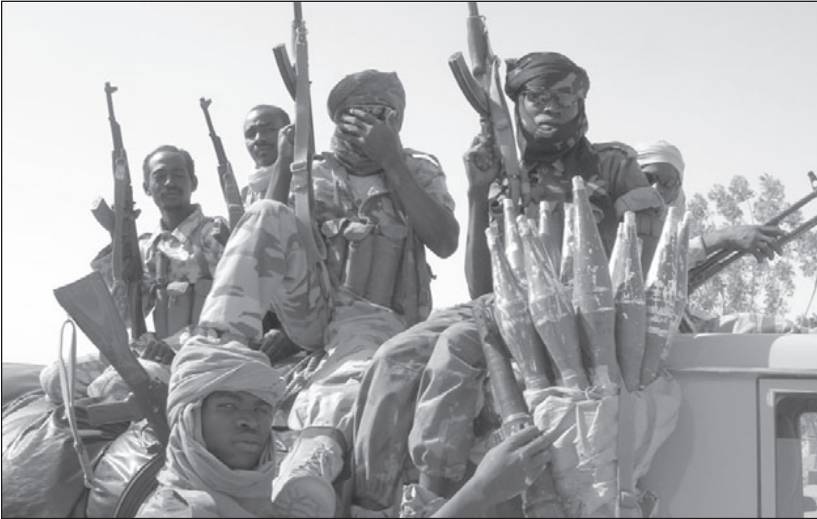
متمردون تشاديون على الحدود امس

الخرطوم - «القدس العربي»: اتهمت الحكومة التشادية السودان امس بدعم المعارضة التشادية في شن حملات عسكرية شرق تشاد على تشاد عقب يومين فقط من توقيع اتفاق المصالحة بين البلدين في الدوحة. وقال الناطق باسم الحكومة التشادية محمد حسين في تصريح مقتضب للاذاعة الرسمية صباح امس «في وقت لم يحفل الحبر بعد على اتفاق الدوحة، اطلق نظام الخرطوم للتو عدة ارتال مسلحة ضد بلادنا». وتحدث عن «عدوان ميرجم»، بدون ان يحدد اي تاريخ وبدون ان يوضح ان كانت هذه القوات المسلحة لا تزال على الحدود ام دخلت الى الاراضي التشادية، و اضاف انه «بإطلاقه هذا العدوان المرمج على تشاد، فان النظام السوداني تنكر لتوقيعه في الدوحة». الى ذلك أكد الرئيس السوداني عمر البشير التزامه التام بتنفيذ اتفاق المصالحة بين بلاده ودولة تشاد الذي تم توقيعه امس الاول