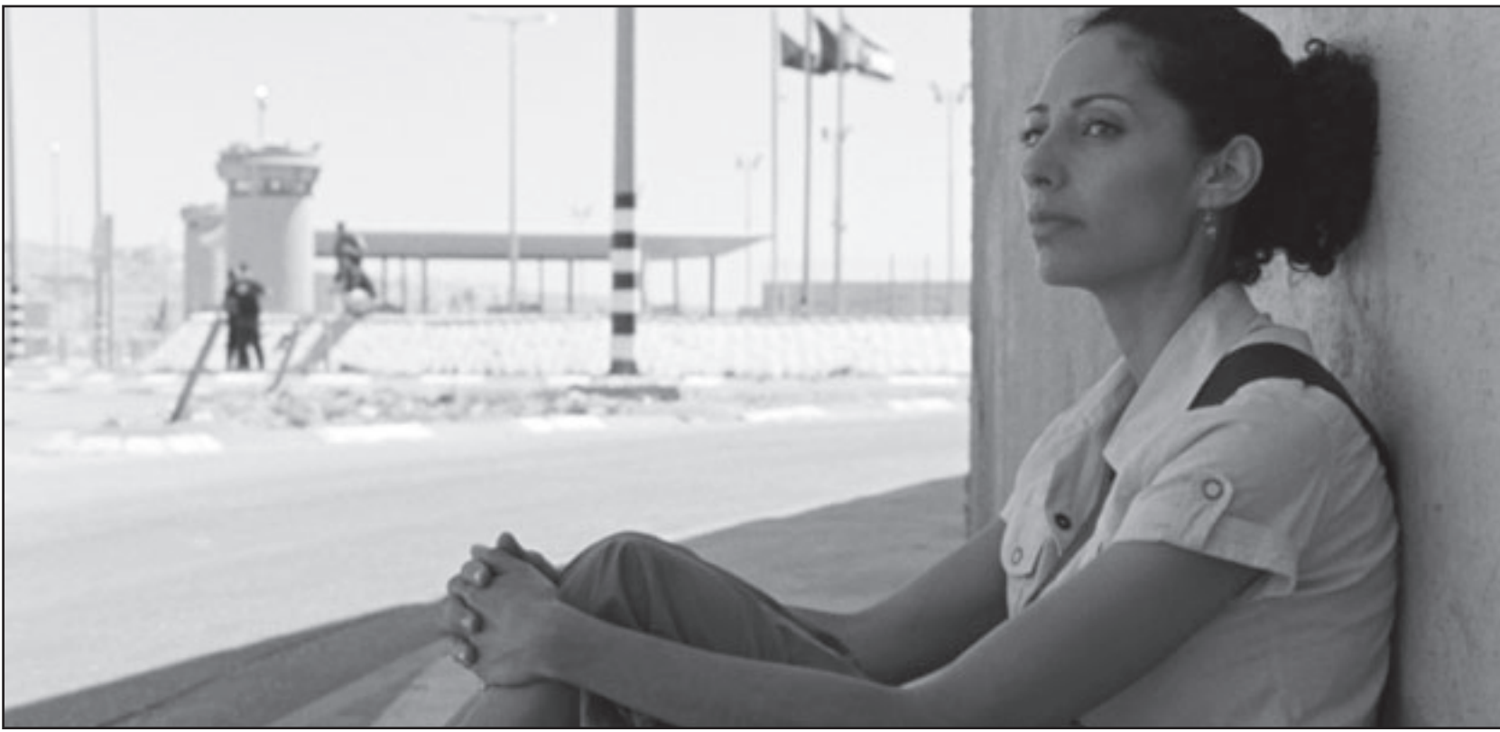
لقطة من فيلم «ملح هذا البحر»