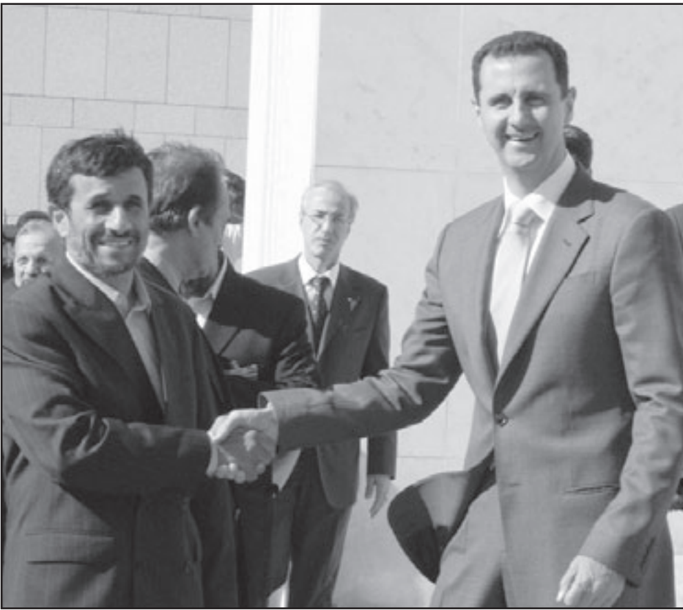
الرئيس السوري لدى استقباله نظيره الإيراني في دمشق أمس