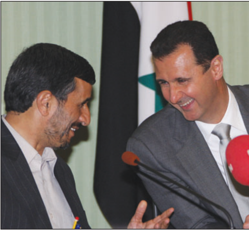
الرئيسان السوري والاراني يتحدثان للصحافيين في دمشق امس