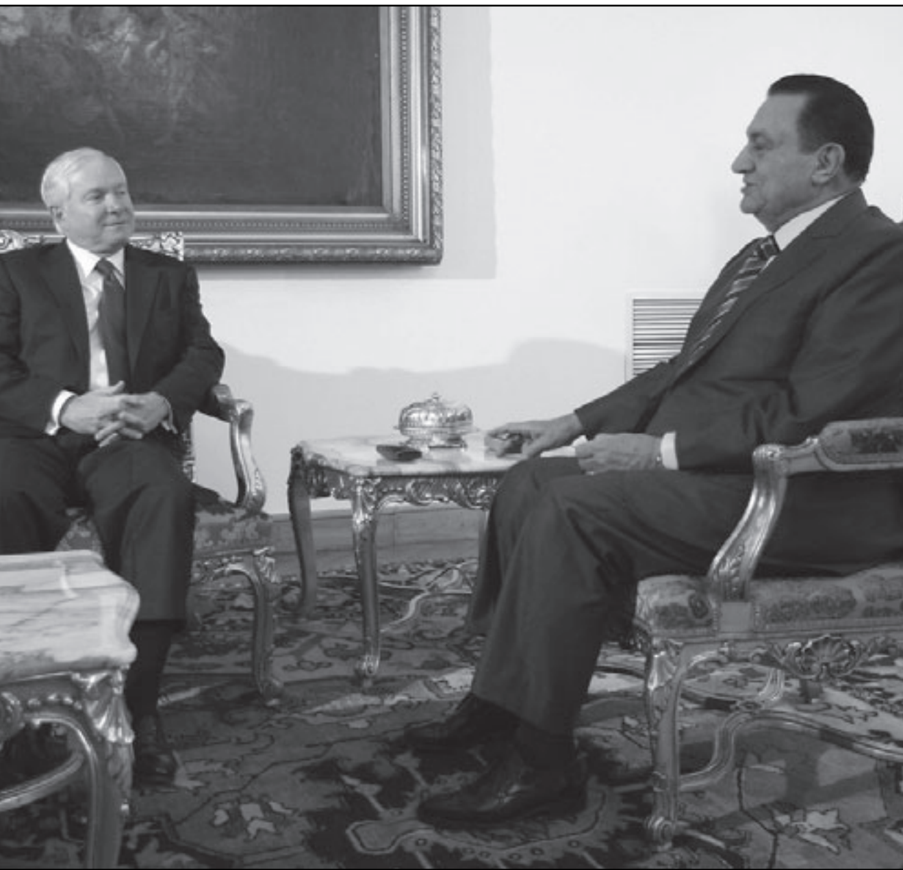
الرئيس المصري حسني مبارك مستقبلاً وزير الدفاع الأمريكي روبرت غيتس بالقاهرة أمس

الانسحاق وراء أفتنة النصب والتخلي للوسطاء وسماسرة التهريب وعدم السفر بكافة الطرق غير الشرعية إلى الدول الأوروبية المجاورة للبحر المتوسط عبر السواحل الليبية لتفادي وقوعهم تحت طائلة القانون ومنعاً لتعرضهم للخسائر المادية الكبيرة ولآية متاعب أو مشاكل والقبض عليهم وترحيلهم إلى مصر ولضمان عدم تعرض حياتهم لكافة أنواع المخاطر والمآسي الإنسانية».