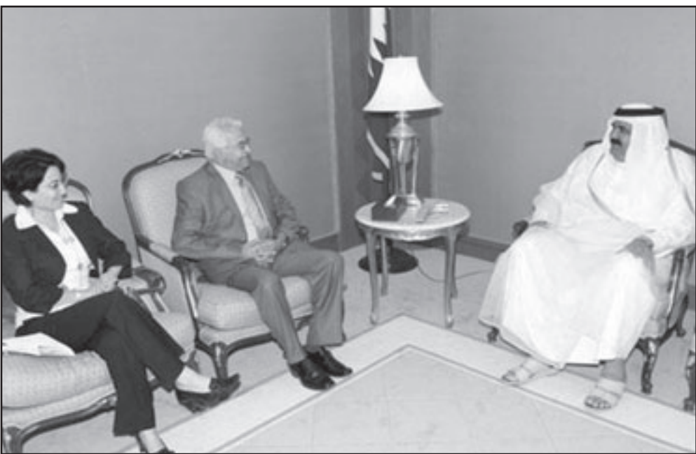
الشيخ حمد بن خليفة آل ثاني خلال استقباله عضوي الكنيست العربيين حنين زعبي وأصل طه في قطر أمس

وفي هذا الإطار شدت على أهمية ادماج ذوي الإعاقة والفئات المهمشة في العملية الديمقراطية باعتبار ذلك جزءاً لا يتجزأ من حقوقهم. وشددت