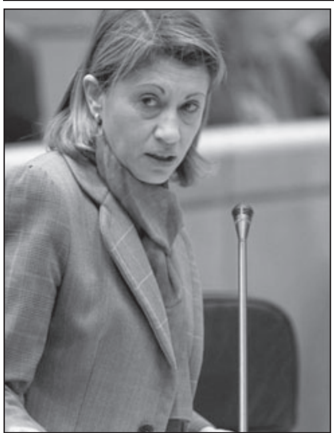
وزيرة الزراعة الإسبانية إينا إسبينوسا

وأضاف أن وزارة الصحة رصدت ميزانية تقدر بـ 16 ملايين يورو لإنتاج دواء «تاميفلو»، موصحا أن 6 ملايين عليه من هذا الدواء متوفرة على مستوى الصيدلية المركزية للمستشفيات، وأنه تم توزيع 500 ألف منها عبر ولايات الوطن.