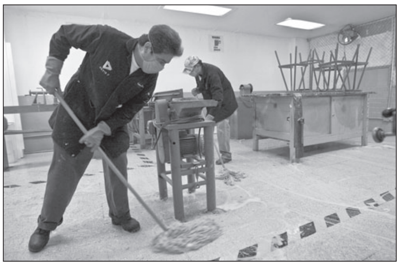
عاملان في العاصمة المكسيكية امس

أب: اعلن حزب يمني معارض أن مواجهات عنيفة اندلعت امس الثلاثاء بين القوات الحكومية وأتباع الزعيم الديني المتمرد عبد الملك الحوثي، بعد ان كانت توقفت في 17 تموز/يوليو الماضي. وقال حزب «الإصلاح» المعارض على موقعه، إن مديرية رازح بمحافظة صعدة القريبة من الحدود السعودية شهدت اليوم مواجهات عنيفة بين الجانبين، اثر مقتل أحد أتباع الحوثي. ونقل الحزب عن مصادر لم يسماها قولها، «إن المواجهات تدور رحاها في قرية القلع شمال مركز مديرية رازح بالقرب من