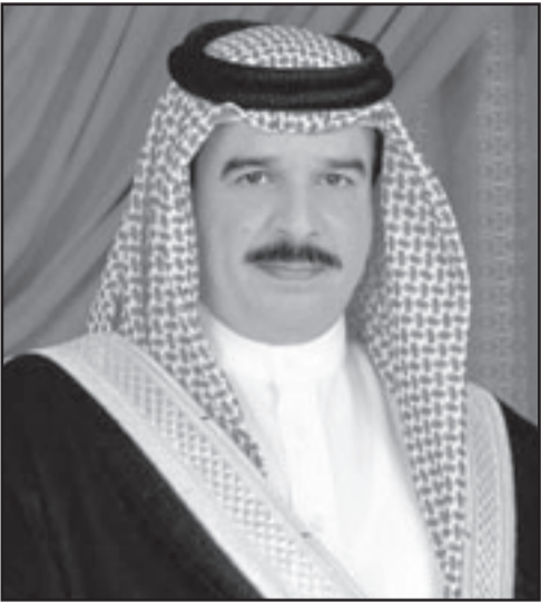
العامل البحريني الملك حمد بن عيسى آل خليفة

ثالث انتخابات برلمانية منذ دستور 2002 في تشرين الثاني (نوفمبر) من العام المقبل.