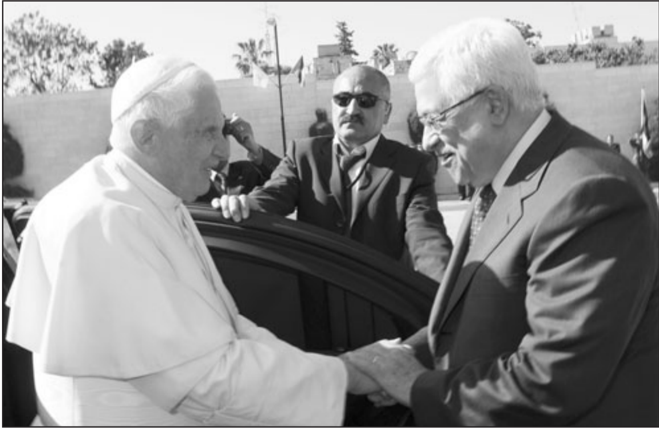
الرئيس الفلسطيني مستقبلا البابا في بيت لحم

تعرضت لها وما زالت تعترضون لها نتيجة هذا الاضطراب العظيم الذي اصاب هذه الارض طوال عقود، قلبي مع كل الاسر التي خسرت الكثير... وامضى البابا بنديكتوس السادس عشر في بيت لحم البلدة التي شهدت مولد السيد المسيح ويام الفلسطينيين ان تجذب زيارته للصفحة الغربية المحملة اهتماما بمعاناة تحت الاحتلال الاسرائيلي، وفر مئات الالاف من الفلسطينيين او اجبروا على ترك منازلهم في حرب عام 1948 لدى قيام دولة اسرائيل، وقال البابا «قلبي مع الاسر التي شردت».