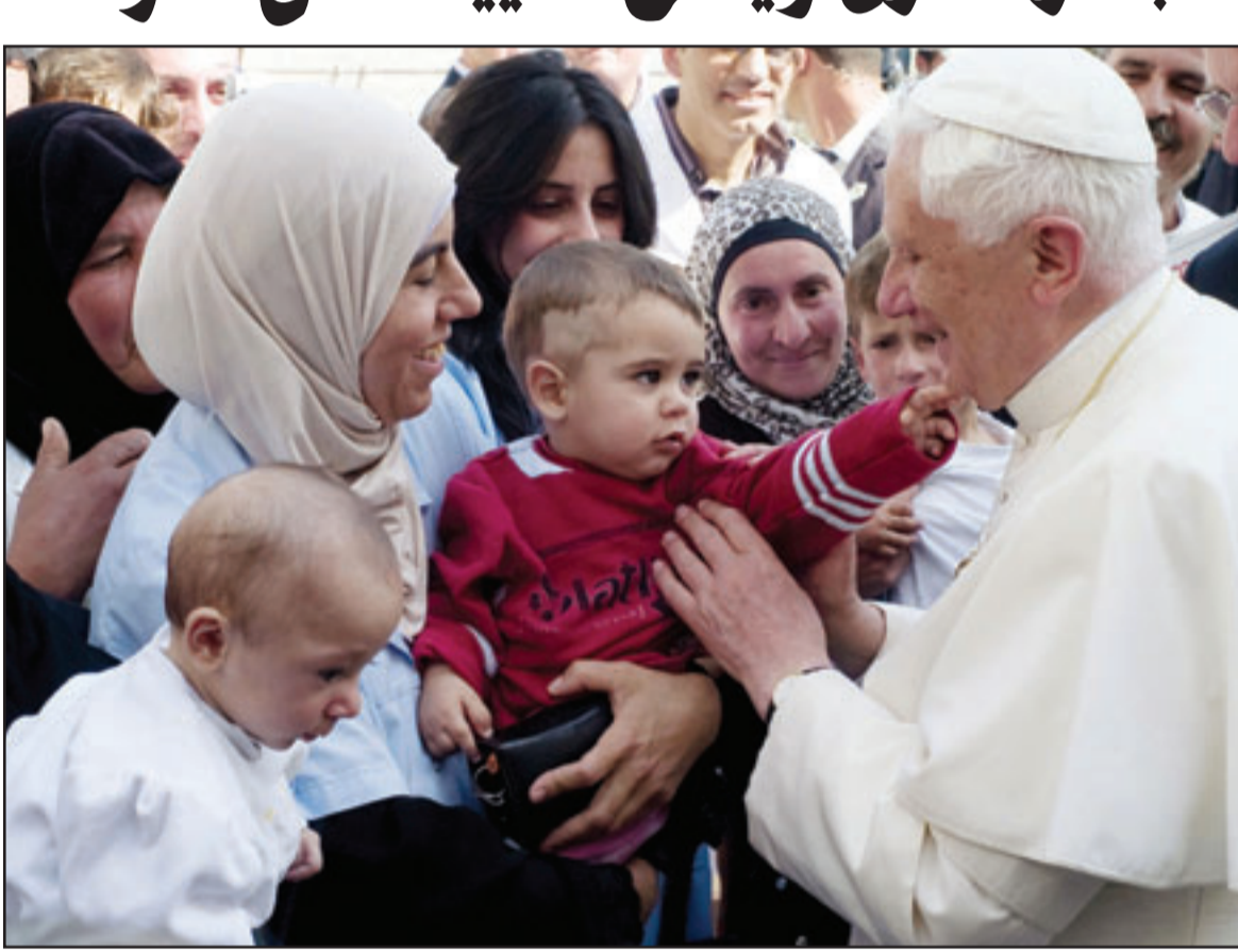
البابا بندكتوس السادس عشر يزور أطفالاً في مستشفى كاريثاس في مدينة بيت لحم امس