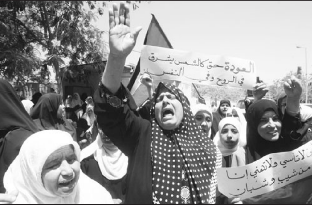
فلسطينيات يتظاهرن لاجلاء ذكري النكبة في غزة

واكدت من جهتها اللجنة الوطنية العليا للدفاع عن حق العودة واللجنة العليا لاجلاء الذكرى الـ 61 للنكبة على ضرورة مشاركة الفلسطينيين في