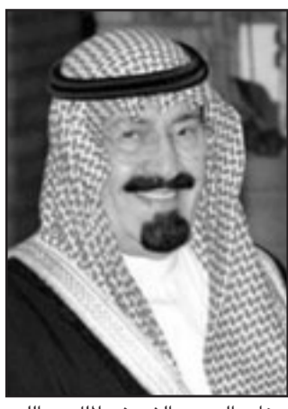
خادم الحرمين الشريفين الملك عبدالله

إنها «ستبقى بؤرة تغلب عليها الصراعات، فالجحيرات الكبرى الأفريقية ودول شرق شمال الكونغو تنتشر فيها الصراعات العنيفة وتؤثر هذه الصراعات على 86 مليون نسمة مع وقوع ملايين الضحايا، كما أن الوضع في دارفور وكذلك القرن الإفريقي يعيشان حالة مأساوية» وأشار إلى «إن أهم تحدٍ في إفريقيا هو أمام منظمة الاتحاد الأفريقي التي عليها أن تقوم بدور أساسي رغم أنه ليس هناك حلا سريعا أو رؤية إيجابية للمستقبل». ويضم مجلس التفاهم العالي الذي أنشئ في عام 1983 رؤساء دول وحكومات سابقين ويهدف إلى الاستفادة من خبرات ومعرفة رؤساء حكومات ودول ومسؤولين سابقين في الشؤون الدولية العامة وفي الشؤون الاقتصادية في تحقيق الاستقرار العالمي من خلال توصيات تسهم في الوصول إلى السلام والنمو الاقتصادية لجميع دول العالم.