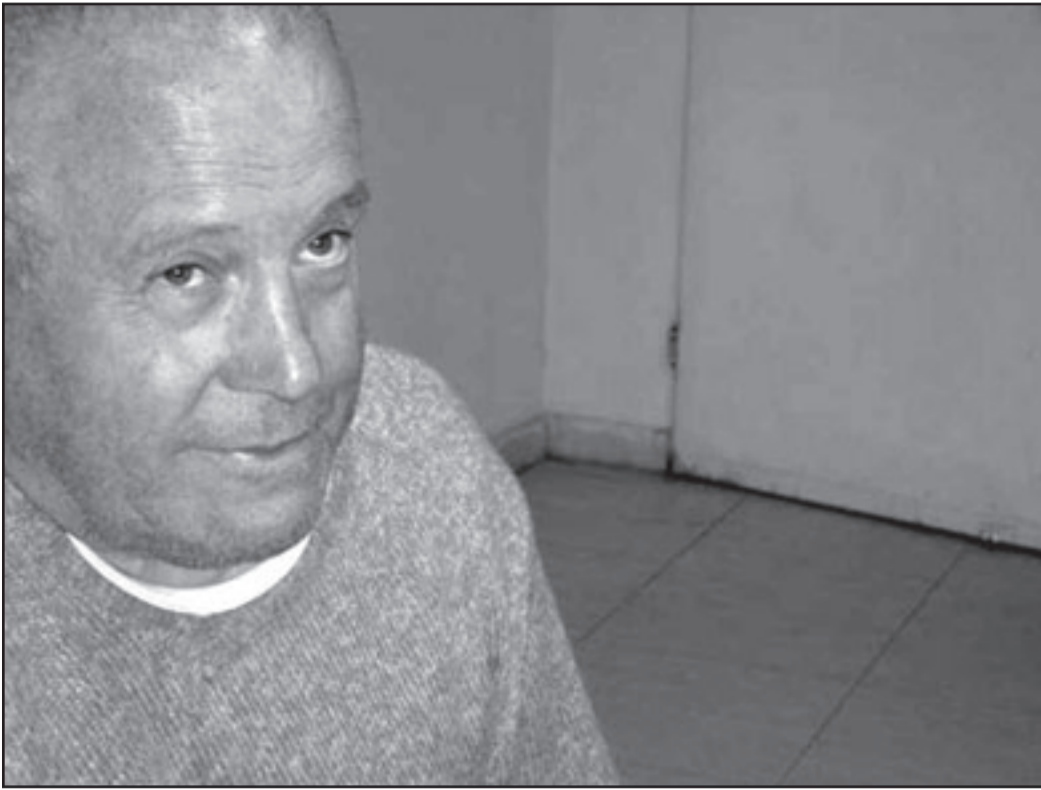
سليمان اليوسف (القدس العربي)

عندها استغفزه: لكن الزمن يتغير ويتبدل، ما كان مقبولا في الأمس قد يرفضه أبناء الأجيال التالية.