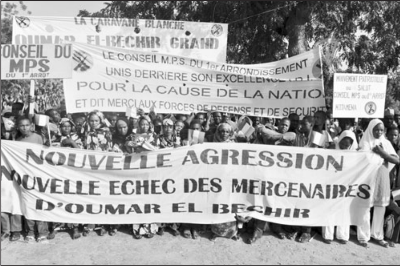
مؤيدون للرئيس دبيي في تظاهرة أمس دعما لمواقفه من السودان