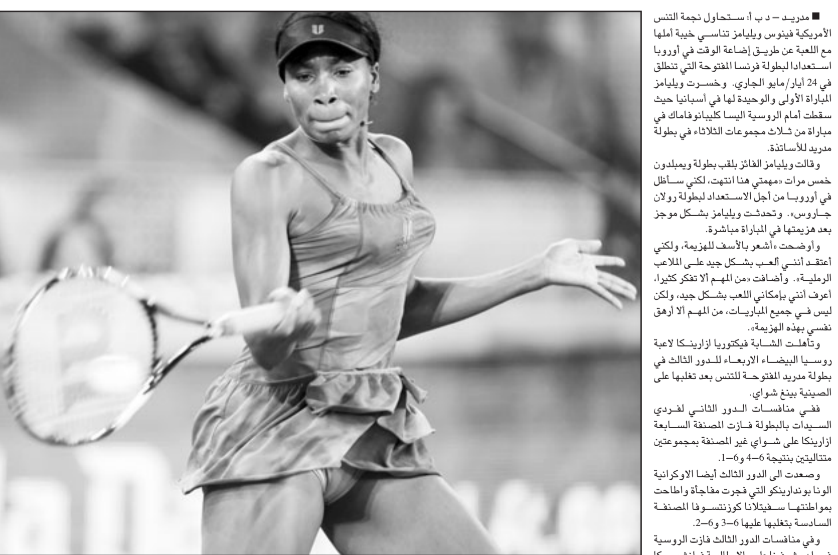
الأمريكية فينوس ويليامز