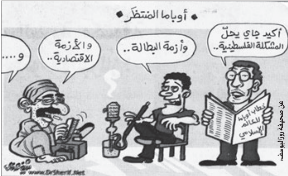
في صحيفة روز اليوسف.