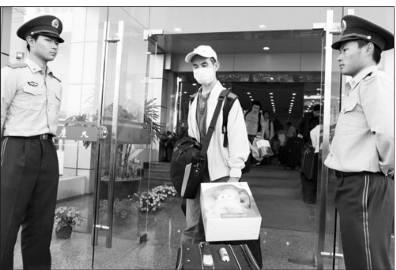
رجل احتجزته السلطات الصينية في فندق في شنغهاي مع 97 شخصا آخرين عادوا على متن طائرة من جنوة اسبوع يعاد الفندق أمس بعد ان سمحت السلطات الصينية بالإفراج عنهم

من المعارك. وتابعت في بيان «الامم المتحدة تعرب عن القلق الشديد بسبب تصاعد العنف في المنطقة واستمرار اذهاق ارواح» ودعمت غرانند القيادة المحليين وكل السلطات المعنية التي التدخل لحل النزاع بالوسائل السلمية والعمل على عقد مصالحة.