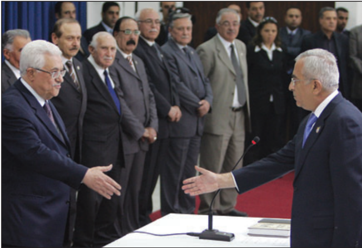
رئيس الحكومة الفلسطينية سلام فياض يصافح الرئيس الفلسطيني محمود عباس بعد تاديته اليمين الدستوري امس