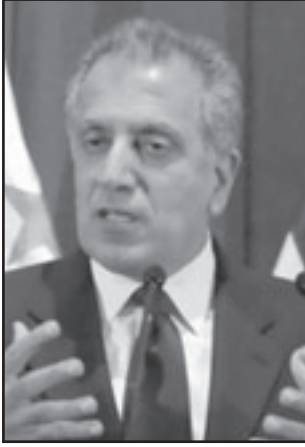
زلاني خليل زاد

كشفت صحيفة «نيويورك تايمز» ان السفير الامريكي السابق في كابول وبغداد، زلاني خليل زاد قد يحتل منصباً مؤثراً في الحكومة الافغانية بدون انتخابه، وانه يناقش المنصب مع الرئيس الافغاني حامد كرزاي. وكان زاد قد فكر في الدخول في السباق الانتخابي لتحدي كرزاي في الانتخابات التي ستعقد نهاية الصيف القادم، لكنه لم يسجل اسمه في الموعد المحدد في 8 ايار (مايو). ولكن المسؤولين الامريكيين والافغان يتحدثون عن استعدادات وظيفة جديدة يتناقشون حولها منذ اسابيع وتعطي خليل زاد سلطة ضابط تنفيذي لافغانستان. وتعتقد الصحيفة ان تحالفا من هذا النوع سيمسب في صالح كرزاي الذي سيعطيه القدرة على التصدي للمنافسين المحتملين. وبالتنسيق لواشنطن التي عبرت عن خيبة املاها من اداء كرزاي فان دخول خليل زاد في اللعبة سيعطيها القدرة على ادخال عنصر قوي ومؤثر في اطار سياسي غير فاعل وضعيف. وطالما تحدثت ادارة الرئيس الامريكي باراك اوباما عن محاولة لتجنب التعامل مع كرزاي وسحب السلطات منه وتقوية الحكومة والحكومات الاقليمية في محاولة منها للقضاء على الفساد والمصوبية.