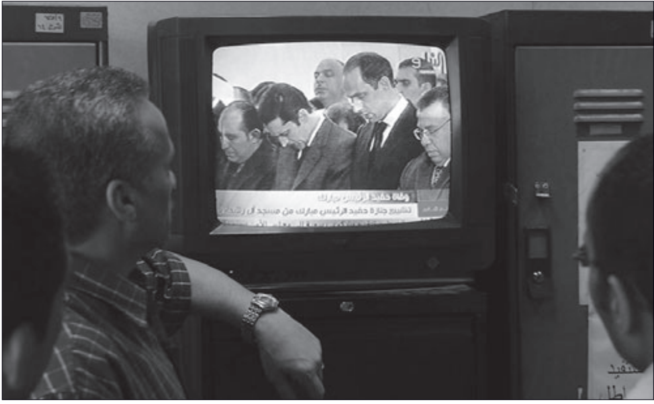
مصريون يتابعون تشييع حفيد مبارك على التلفزيون