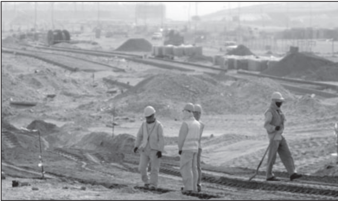
عمال اجانب في موقع جزيرة السعديات في الامارات

مزايم مضللة وافتراضات باطلة نتجت عن اتباع منهجية مشكوك فيها وبحث خاطيء قامت به المنظمة.. وتكررت الشركة انها قامت ببناء مشروع «قرية إسكان عمال جزيرة السعديات» التي قالت انها «أحد أفضل مشاريع السكن العمالي في منطقة الشرق الأوسط وهي تتضمن مرافق سكنية وخدمانية وترفيهية متطورة تضعها الشركة في خدمة عمال الإنشاءات» على أن تفتتح القرية ليقدم فيها خمسة الاف عامل اعتباراً من تموز (يوليو) المقبل.