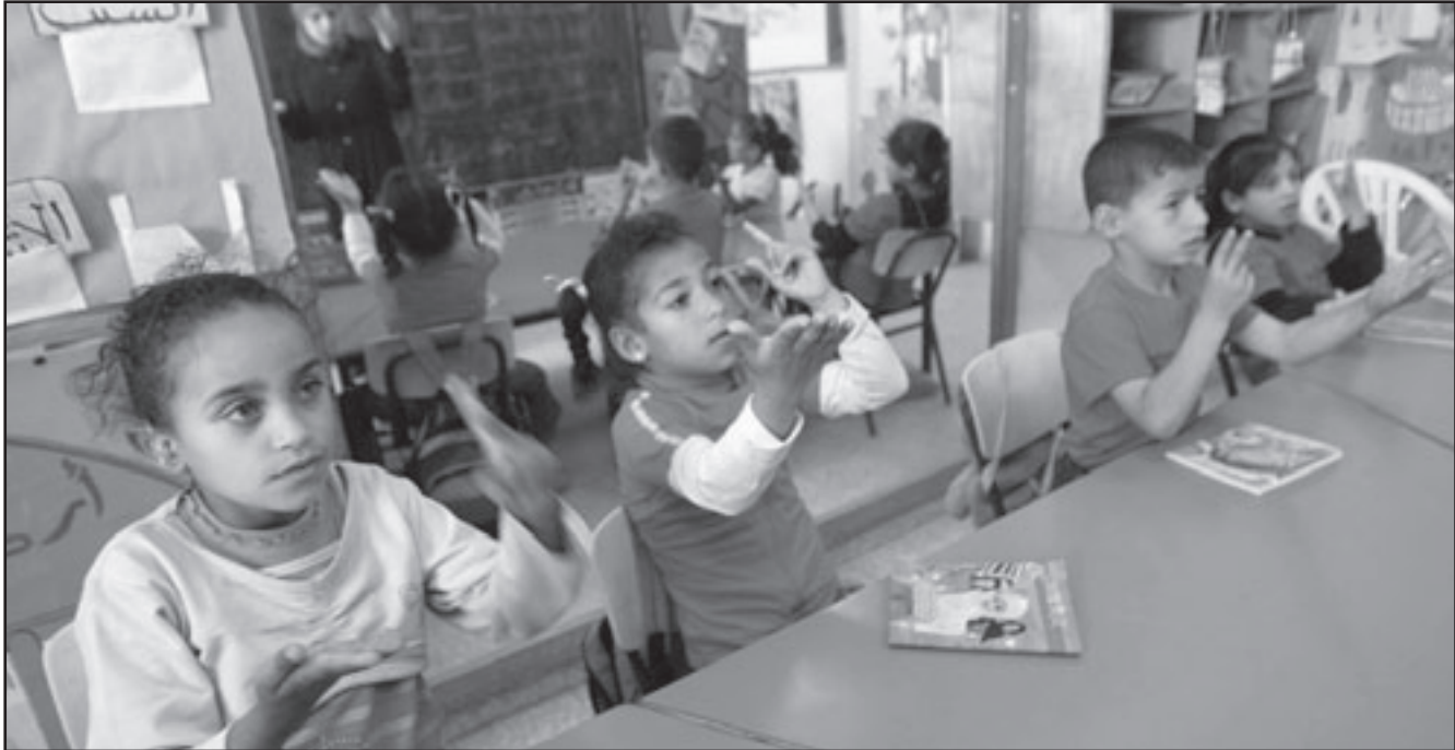
اطفال في مدارس خاصة للصم والبكم في خان يونس

وتديرها حركة حماس في غزة ان مجموع المسافرين في الأيام الثلاثة بلغ 1519 مسافراً، والقدومين 815، والمرجعين من قبل الجانب المصري 569، وأكدت الداخلية ان عملية الفتح الاستثنائية «لا تتخفف من الازمة المتراكمة».