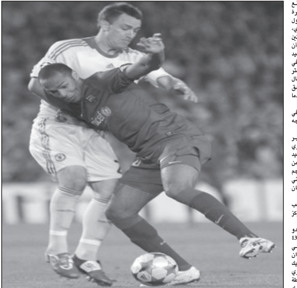
تيري هنري (يمين) في منافسة على الكرة مع نجم تشلسي جون تيري