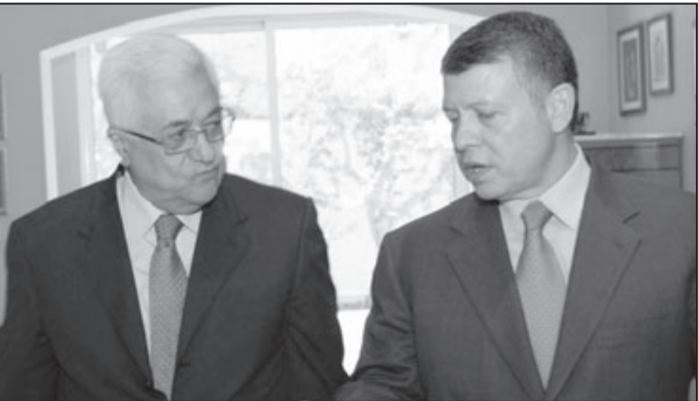
العاهل الاردني الملك عبد الله الثاني لدى لقائه الرئيس الفلسطيني محمود عباس

الرياض - عمان - د ب أ - ف ب: بحث العاهل السعودي الملك عبدالله بن عبد العزيز مع الرئيس الفلسطيني محمود عباس هاتفياً أمس الأحد الأوضاع على الساحة الفلسطينية إضافة إلى نتائج المباحثات التي أجراها مع الرئيس الأمريكي باراك أوباما. وتكررت وكالة الأنباء السعودية الرسمية أن الملك عبدالله تلقى اتصالاً هاتفياً أمس من الرئيس الفلسطيني جرى خلاله بحث مستجدات الأوضاع على الساحة الفلسطينية بالإضافة إلى العلاقات الأخوية بين البلدين. وقالت مصادر فلسطينية مطلعة إن أطلع العاهل السعودي على نتائج المباحثات التي أجراها مع الرئيس باراك أوباما في واشنطن، بشأن تفعيل المفاوضات الفلسطينية-الإسرائيلية للوصول إلى حل للصراع وفق الرهجات المتعددة. كما بحث العاهل الأردني الملك عبد الله الثاني والرئيس الفلسطيني محمود عباس في عمان أمس الأحد الجهود المبذولة لاطلاق مفاوضات السلام في الشرق الأوسط، حسبما افاد بيان صادر عن الديوان الملكي الأردني. وقال البيان أن الزعيمين بحثا «الجهود الفلسطينية والاسرائيلية» في وقت أكدت فيه أن «السلامة الفلسطينية والاسرائيلية» على حد سواء، كما أنه ليس هناك شروط مسبقة... فعندما نقرأ خطة العمل الاسرائيلي العاشم على غزة، وسوف نتطرق رسمياً في منتصف شهر رمضان المبارك المقبل، وسوف تبحث المنظمة مع لجنة المدارس الاهلية بالغرفة الاسبوع المقبل، التفاصيل اللازمة لاستكمال الحملة التي من المرجح أن تنطلق رسمياً في قائمة المناهجين، وذلك مراعاة لاحتياجات السنة الدراسية الجديدة. وستشمل الحملة في قائمة المناهجين، مدارس العربية السعودية، بالإضافة إلى المكتبات التجارية، والمناهجين التقليديين، بهدف توفير مستلزمات مدرسية متكاملة للتلاميذ في قطاع غزة.