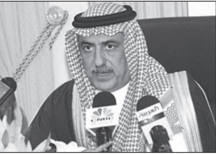
وزير المالية السعودي إبراهيم العساف

وأردف العساف «ستجري مراجعة الحصة، لا نعرف ماذا ستكون النتيجة فهناك الكثير من الطلاب في هذا الخصوص، كل بلد يعتقد ان لديه الحق بدرجة أكبر في زيادة الحصة».