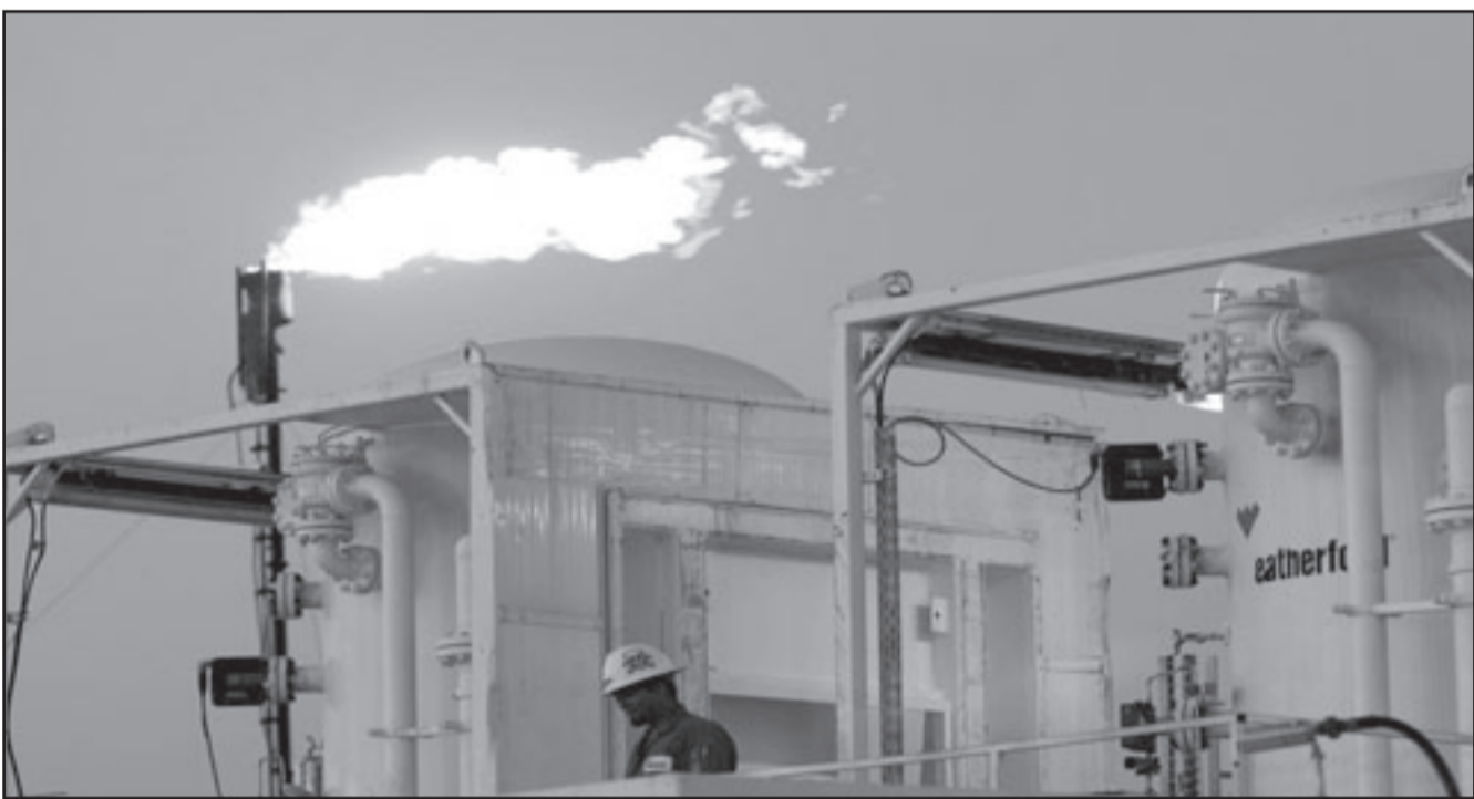
تحضيرات لبدء عمليات الضخ اليوم الاثنين من حقول طق ب معبدل اربعين الف برميل يوميا

ويهدف خط الأنابيب نابوكو الذي يدعمه الغرب إلى الحد من اعتماد أوروبا على الغاز الروسي، وحتى الآن استقطب مشروع خط الأنابيب الذي تبلغ قيمة استثمارته عشرة مليارات دولار مشترين كثيرين دون ما يكفي من الغاز لبيعه لهم.