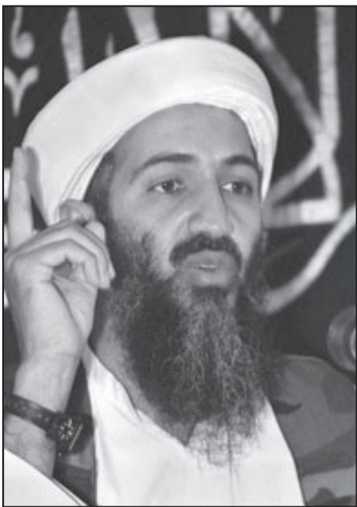
زعيم تنظيم «القاعدة» الشيخ اسامة بن لادن

وقال بن لادن في الشريط المنسوب اليه ان «اوباما قد سار على خطى سلفه في زيادة الاستعداد للمسلمين... ومؤسسا لحروب طويلة الامد..» واعتبر بن لادن في التسجيل الذي بثت بهجيد وصول الرئيس الامريكى