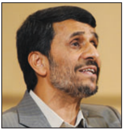
الرئيس الإيراني احمدى نجاد

■ طهران - ا ف ب: هاجم الرئيس الإيراني محمود احمدى نجاد الإريعاء إسرائيل مجدداً واصفاً المحرقة بأنها «خدعة كبيرة». واعتبر الرئيس الإيراني في تصريحات نشرها موقع التلفزيون الإيراني على الانترنت ان المنظمة الديمقراطية الليبرالية في العالم نالت من «القيم الإنسانية».