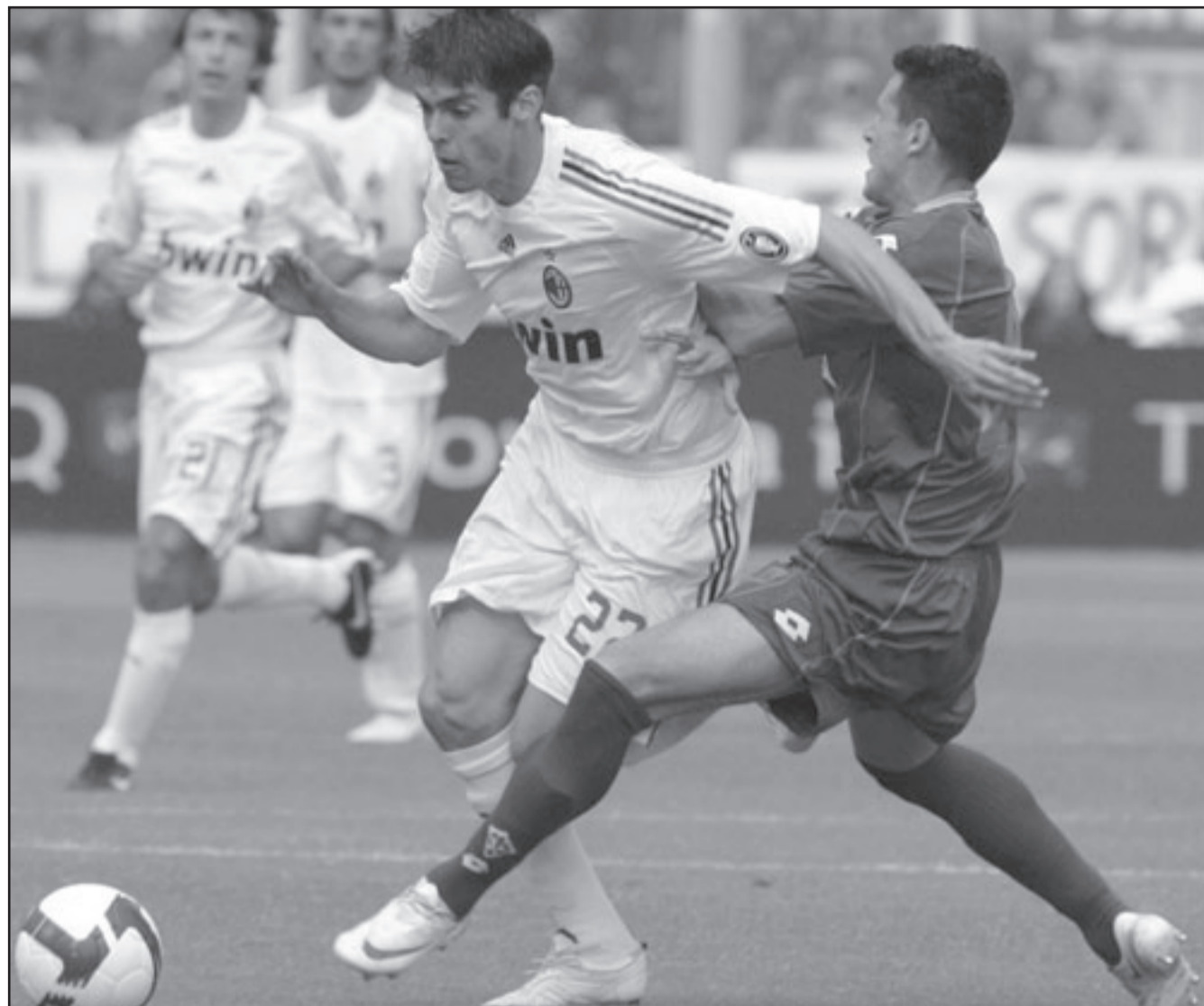
كاكا (في الوسط) خلال منافسة على الكرة مع لاعب فيورنتينا مانويل باسكوال