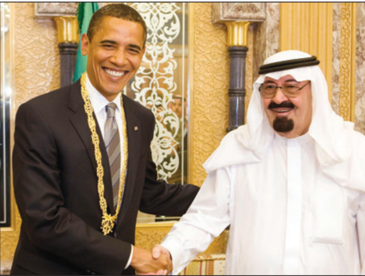
العاهل السعودي الملك عبد الله بن عبد العزيز يصفاح الرئيس الأمريكي باراك اوباما بعد تقليده قلادة الملك عبدالعزيز في الجنادرية امس