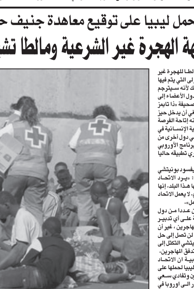
بضعة مهاجرين، من أصل 71، يتلقون الاسعافات الأولية بعيد وصولهم إلى إحدى جزر أرخبيل الكناري الخميس على متن قارب مطاطي

انتخابيا، يطفو الحضور المغربي في واجهة أخرى، هو حق التصويت الذي يتمتع به أكثر من نصف مليون مغربي في الدول الأوروبية، وهي كتلة مهمة نسبيا تكون ذات وزن مهم في دولة مثل بلجيكا ودون وزن في اسبانيا، ففي اسبانيا، والامر نفسه ثلثي المهاجرين المغاربة الجنسية البلجيكية، وفي الثانية لا يحل سوى 5 في المئة الجنسية الإسبانية.