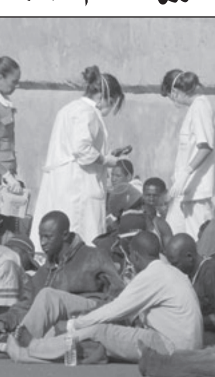
بضعة مهاجرين، من أصل 71، يتلقون الاسعافات الأولية بعيد وصولهم إلى إحدى جزر أرخبيل الكناري الخميس على متن قارب مطاطي

انتخابيا، يطفو الحضور المغربي في واجهة أخرى، هو حق التصويت الذي يتمتع به أكثر من نصف مليون مغربي في الدول الأوروبية، وهي كتلة مهمة نسبيا تكون ذات وزن مهم في دولة مثل بلجيكا ودون وزن في اسبانيا، ففي اسبانيا، والامر نفسه ثلثي المهاجرين المغاربة الجنسية البلجيكية، وفي الثانية لا يحل سوى 5 في المئة الجنسية الإسبانية.