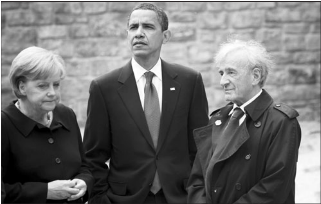
الرئيس الامريكى باراك اوباما يتوسط المستشارة الالمانية انغيلا ميركل واليلى فزل خلال زيارته لموقع معتقل بوشنفالده

ان سجيناً سابقاً فيه «كان على صلة بالمانيا» هو مراد كرتناز استقبل في آب (اغسطس) 2006 في المانيا بعدما امضى خمس سنوات في غوانتانامو. وقال اوباما الجمعة إن على الرئيس الايراني محمود احمدي نجاد الذي وصف محارق النازي هذا الاسبوع مجددا بأنها خدعة كبرى، أن يزور موقع معسكر اعتقال بوشنفالده. وفي مقابلة في المانيا مع قناة «ان.بي.سي» الاخبارية قبل زيارته لبوشنفالده لاجاء نكرى ضحايا الحرب العالمية الثانية ومحارق النازي سئل اوباما عما يمكن أن يتعلمه الزعيم الإيراني من زيارته للموقع. وقال اوباما يجب أن يزوره بنفسه... ليس لدي صبر على الأشخاص الذين يتكرون التاريخ. وتاريخ محارق النازي ليس محل تخمين». و اوباما هو اول رئيس امريكى يزور بوشنفالده، وكانت في انتظاره عند مدخل المعسكر مجموعة طلاب من مدينة بينا المجاورة. ووضع اوباما وميركل وفيزل ورئيس اللجنة الدولية لعقلى بوشنفالده الفرنسي برتران هيرز وردة بيضاء على نصب تذكريمي «في نكرى جميع ضحايا المعسكر.