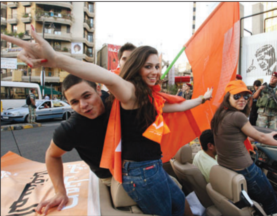
مؤيدون للجناح ميشال عون يجوبون شوارع بيروت راغعين الرايات البرتقالية