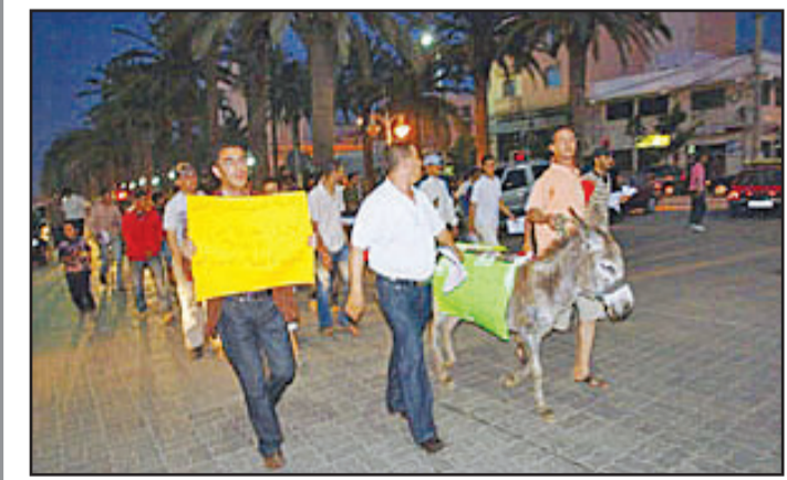
جانب من مظاهرة في مدينة الناظور تندد بشراء الاصوات

هذه المظاهرة وأن كانت السلطات قد كتفت عن تزوير الانتخابات وفرض المرشحين الفائزين. وأكد وزير الاتصال الناطق الرسمي باسم الحكومة أن العدالة ستستخذ كل التدابير الجزية من أجل ضمان احترام العملية الانتخابية لـ 12 حزيران/يونيو بشكل مطلق. وأوضح خالد الناصري أن «السلطات سواء الإدارية منها أو القضائية ستتكون بالمروءة لكل الاختلالات التي قد تحدث أثناء العملية الانتخابية». وقال وزير العدل عبد العزيز الرضاوي انه تم اتخاذ كل التدابير والإجراءات القانونية والقضائية حتى تتم العملية الانتخابية في إطار من النزاهة والشفافية والتقدير بالضوابط القانونية والأخلاقية اللازمة. وجاب المظاهرون الذين أطلقوا على اطارهم «التنظيبي» اسم اللجنة التضفيرية للدفاع عن حقوق الحمير، مختلف شوارع وأزقة مدينة الناظور، يتقدمهم حماران علق عليهما لافتات تندد بشراء الاصوات مثل الحمير تعيب على بني البشر بيع ضمائرنا بأبخس الأثمان» و«أنا حمار أفلع ما يملع علي ضميري»، كما استعملوا مكبرات الصوت لترديد شعارات تنتقد «شراء» النظم وغض السلطات الطرف عنها، وزرعوا بلاغا عنوانه «من الحمير إلى الرأي العام من بنو البشر» فيما قالت اللافتات الصغيرة المعلقة على الحمير إن الصوت الانتخابي في المنطقة وصل ثمنه إلى 600 درهم (75 دولارا). وسجل «بلاغ الحمير»، الوجه إلى الرأي العام من بني البشر، استمرار «خسرق القانون وتجاوزه من قبل بعض وكلاء اللوائح»، في مقابل «الحياد السلبى لاحتفال الأجهزة المعنية بالاستحقاقات». وقال إن الموعود والعروض لشراء الصوت الواحد وصلت إلى 500 درهم، مشيرا إلى أن هذا الثمن المعروض لمن كرمهم الله، في إشارة إلى بني البشر، يهدد الحمير وباقي الحيوانات، ودعا إلى