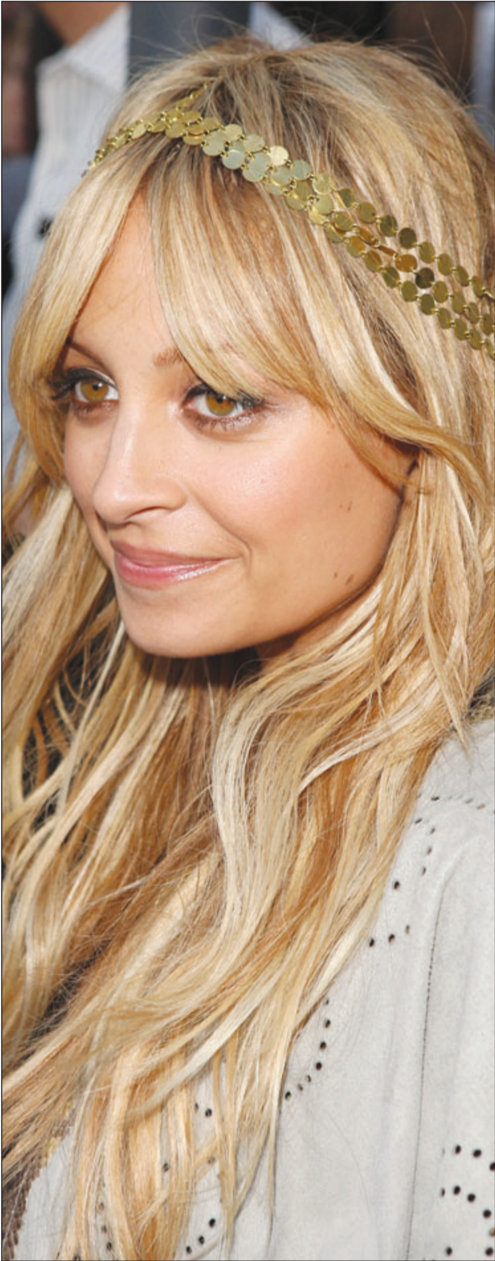
مصممة الأزياء نيكول ريتشي حضرت عرض الأزياء الذي اقيم في «بوليفار 3، في هوليوود بكاليفورنيا.

■ استوكهولم - ا ف ب: أظهرت دراسة سويدية ان الحياة الزوجية السعيدة والمتوازنة تخفف من تأثير ضغط العمل على الصحة. واوضحت المشرفة على الدراسة أن كريستين اندرس ارتن من جامعة غوتبرغ ان «الحياة الزوجية السعيدة تخفف من التأثيرات السلبية لهذا النوع من الضغط على صحتها، لكن اذا كانت العلاقة لا تسير على ما يرام فان التأثيرات السلبية على العكس تزيد». وأظهرت الدراسة التي شملت 900 رجل وامرأة، ان النساء