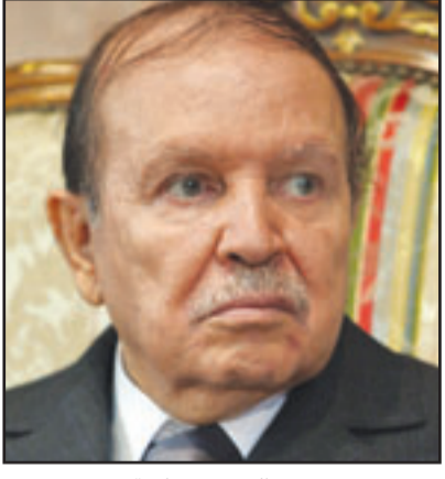
عبد العزيز بوتفليقة