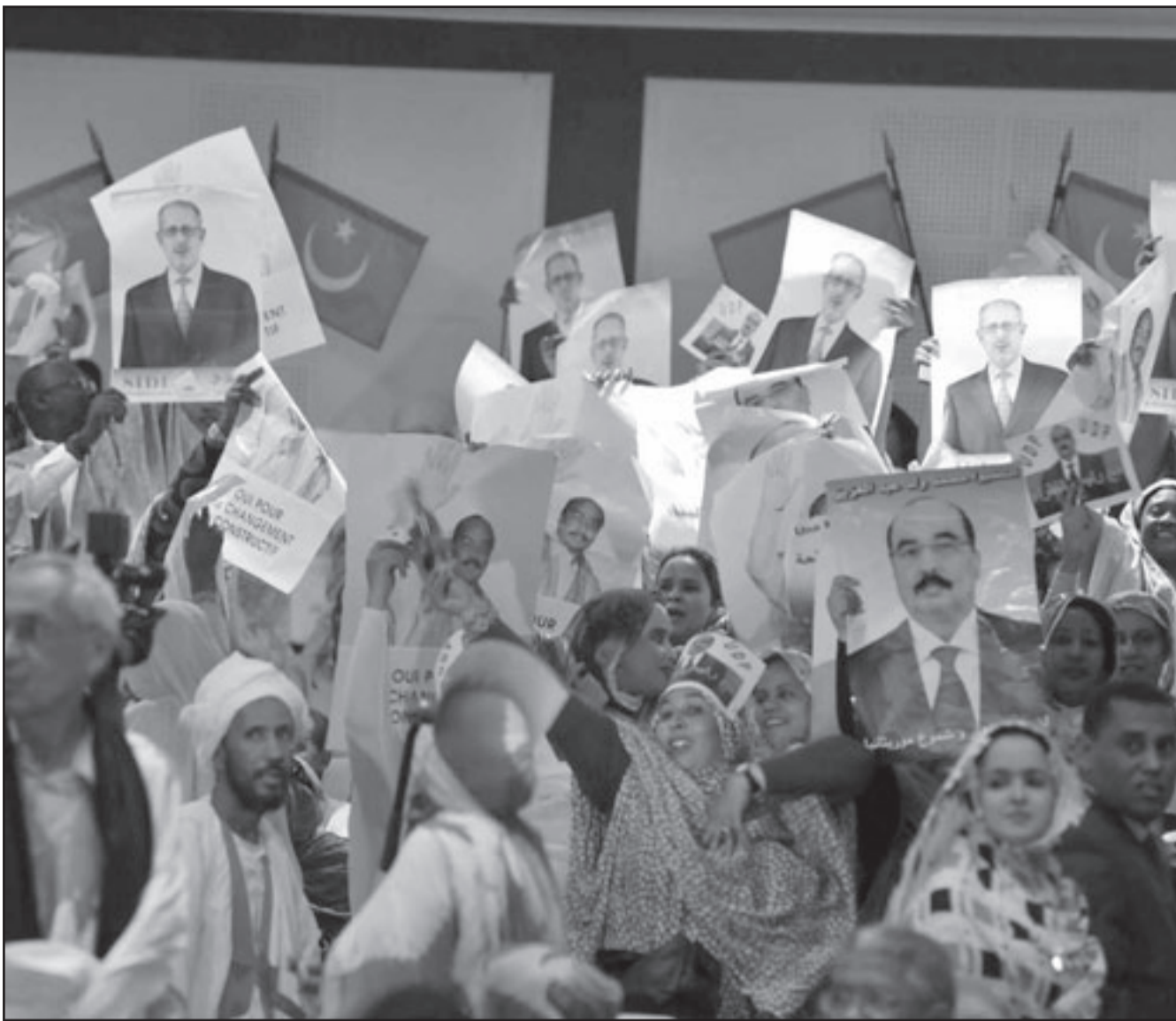
موريتانيون من أنصار الرئيس المخلوع وأنصار الجنرال ولد عبد العزيز يعبرون عن انتباههم بتوقيع اتفاق المصالحة مساء الخميس