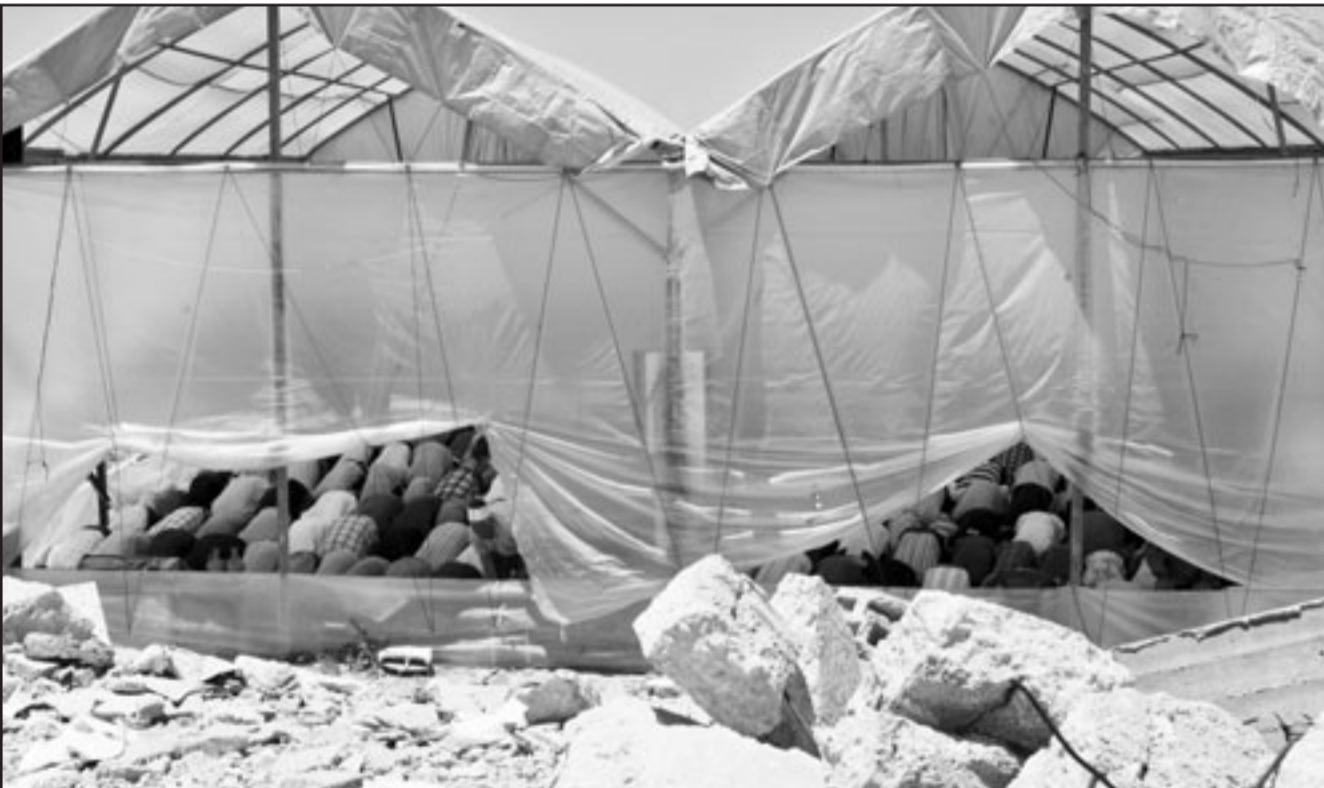
فلسطينيون يؤدون صلاة الجمعة في خيم بعد تدمير جيش الاحتلال الاسرائيلي للجوامع في غزة