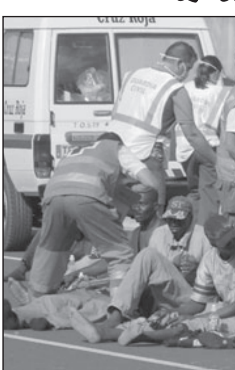
بضعة مهاجرين، من أصل 71، يتلقون الاسعافات الأولية بعيد وصولهم إلى إحدى جزر أرخبيل الكناري الخميس على متن قارب مطاطي

انتخابيا، يطفو الحضور المغربي في واجهة أخرى، هو حق التصويت الذي يتمتع به أكثر من نصف مليون مغربي في الدول الأوروبية، وهي كتلة مهمة نسبيا تكون ذات وزن مهم في دولة مثل بلجيكا ودون وزن في اسبانيا، ففي اسبانيا، والامر نفسه ثلثي المهاجرين المغاربة الجنسية البلجيكية، وفي الثانية لا يحل سوى 5 في المئة الجنسية الإسبانية.