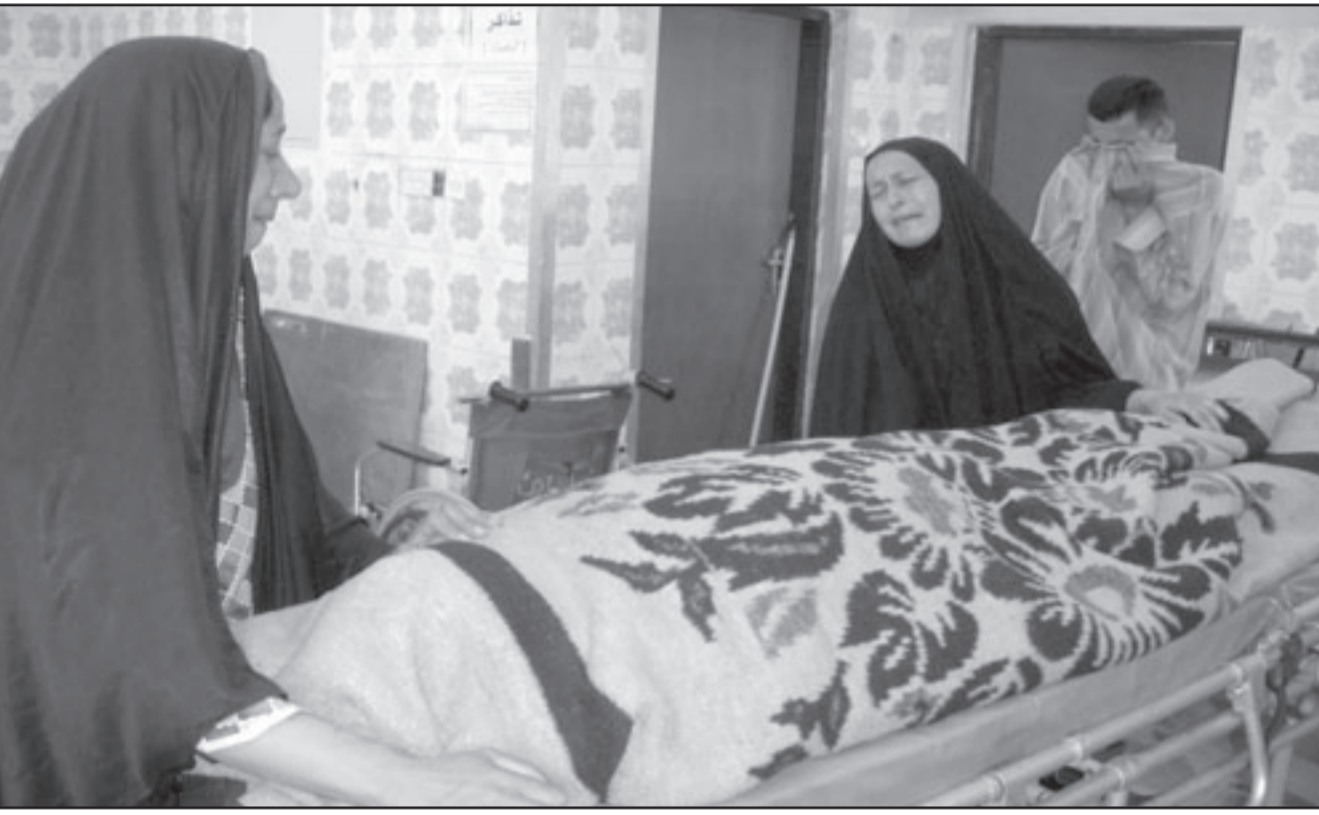
أقرب أحد ضحايا الانفجار في بعقوبة (شمال بغداد) الجمعة ببيكون قبيل تشييعه

وأكد النائب عن جبهة التوافق ظافر العائني ضرورة مواجهة التدخل الإقليمي في الشأن العراقي بعد انسحاب القوات الأمريكية، قائلا: «يزداد حجم التدخل الإقليمي في العراق بعد انسحاب القوات الأمريكية وعلى حكومة المالكي أن تكون