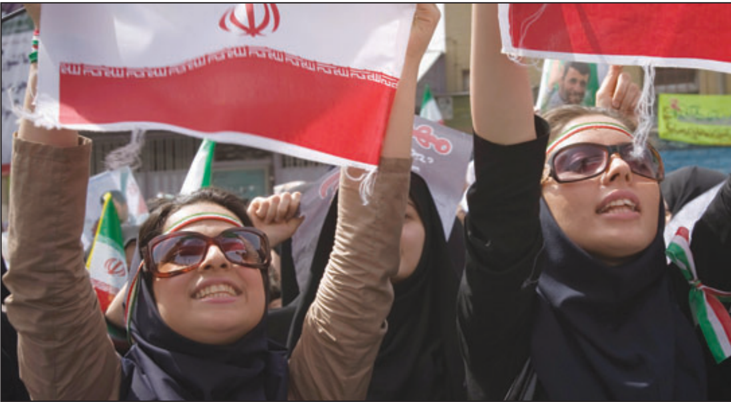
نساء يشاركن بهمرجان تأييد الرئيس احمدي نجاد