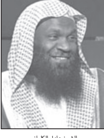
الشيخ عادل الكلباني

من أصول أفريقية، وغالبا ما ينسبه نفسه بسوابكها، ضمن مقارنته لوصوله لامة الحرم كآول إمام أسود بوصول باراك اوباما لمرسة الرئاسة الأمريكية.