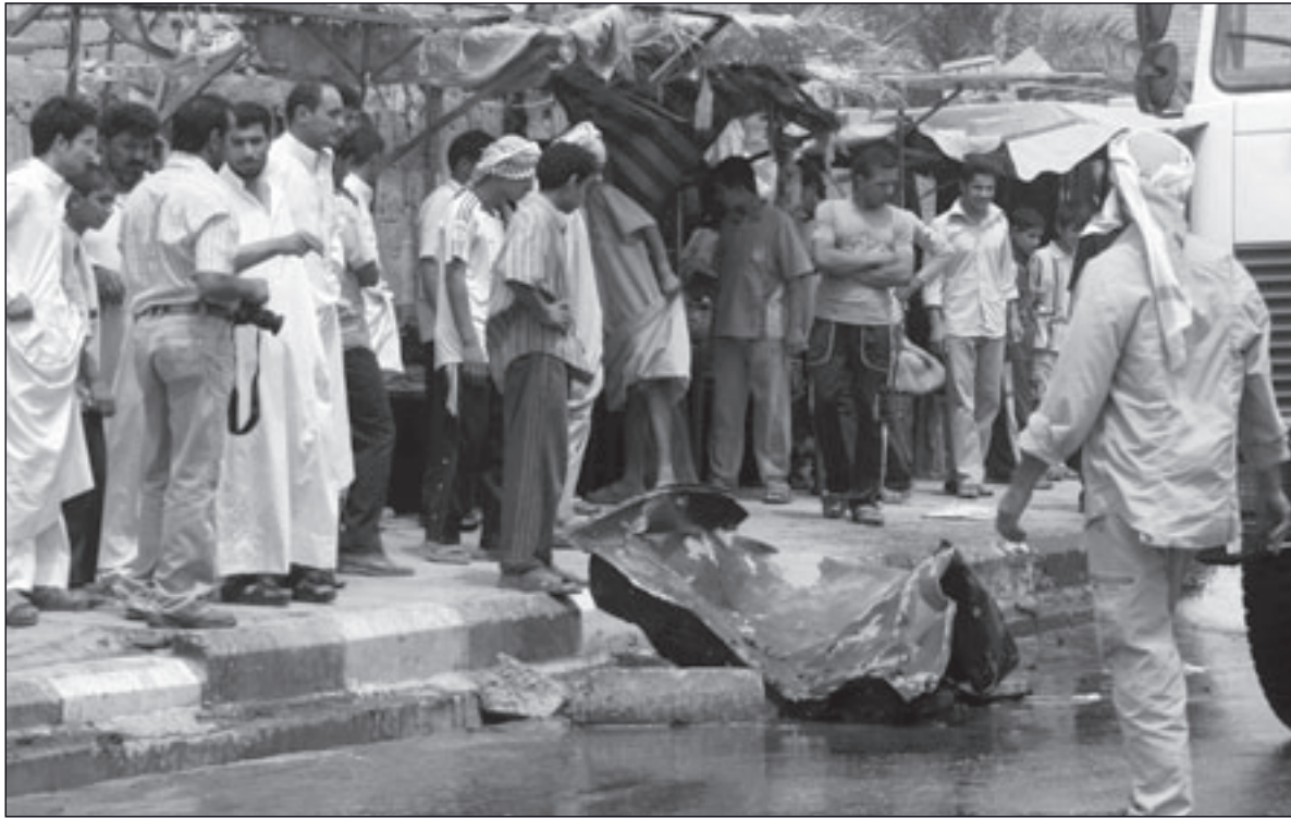
عراقيون في موقع الانفجار في الناصرية أمس