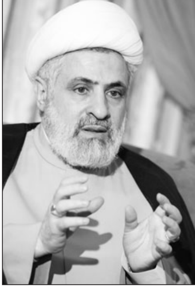
نائب الامين العام لحزب الله الشيخ نعيم قاسم

مرشح قوي لرئاسة الحكومة الجديدة لكته اضاف ان القرار يعود للغالبية. وأشار الى ان نتائج الانتخابات النيابية وقبول حزب الله بها تثبتت ان السلاح لم يكن حاضرا في الانتخابات ولم يكن فعلا ومؤثرا في الانتخابات بل هذه شهادة على ان سلاح حزب الله هو سلاح مقاومة ولا علاقة له بالتفاصيل السياسية وبالشأن الانتخابي وحيادة الناس اليومية». وحزب الله الذي خاض حربا على مدى 34 يوما مع اسرائيل في العام 2006 هو الفصيل الوحيد الذي يحمل السلاح بعد انتهاء الحرب الاهلية التي دارت بين عامي 1975 و1990 وهو يقول ان سلاحه ضد الهجمات الاسرائيلية على لبنان. وقال قاسم «هذه الحكومة الجديدة لن يكون امامها نقاش اسمه السلاح وانما هذا امر مرتبط بطاولة الحوار ولا حاجة بان يكون مادة نقاش».