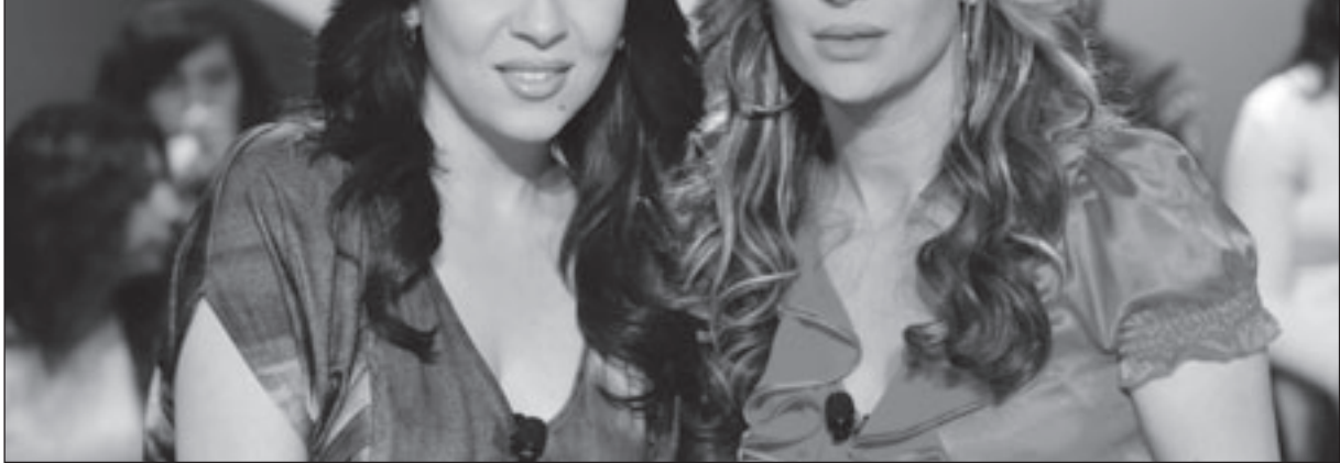
باسمة ومريم امين في برنامج «سوالفنا حلوة»

تبت هذه الحلقة على قناة دبي، يوم الثلاثاء 16 حزيران/يونيو الساعة 22:30 بتوقيت الإمارات، 21:30 بتوقيت السعودية، والإعادة يوم الجمعة 19 حزيران/يونيو الساعة 16:00 بتوقيت الإمارات.