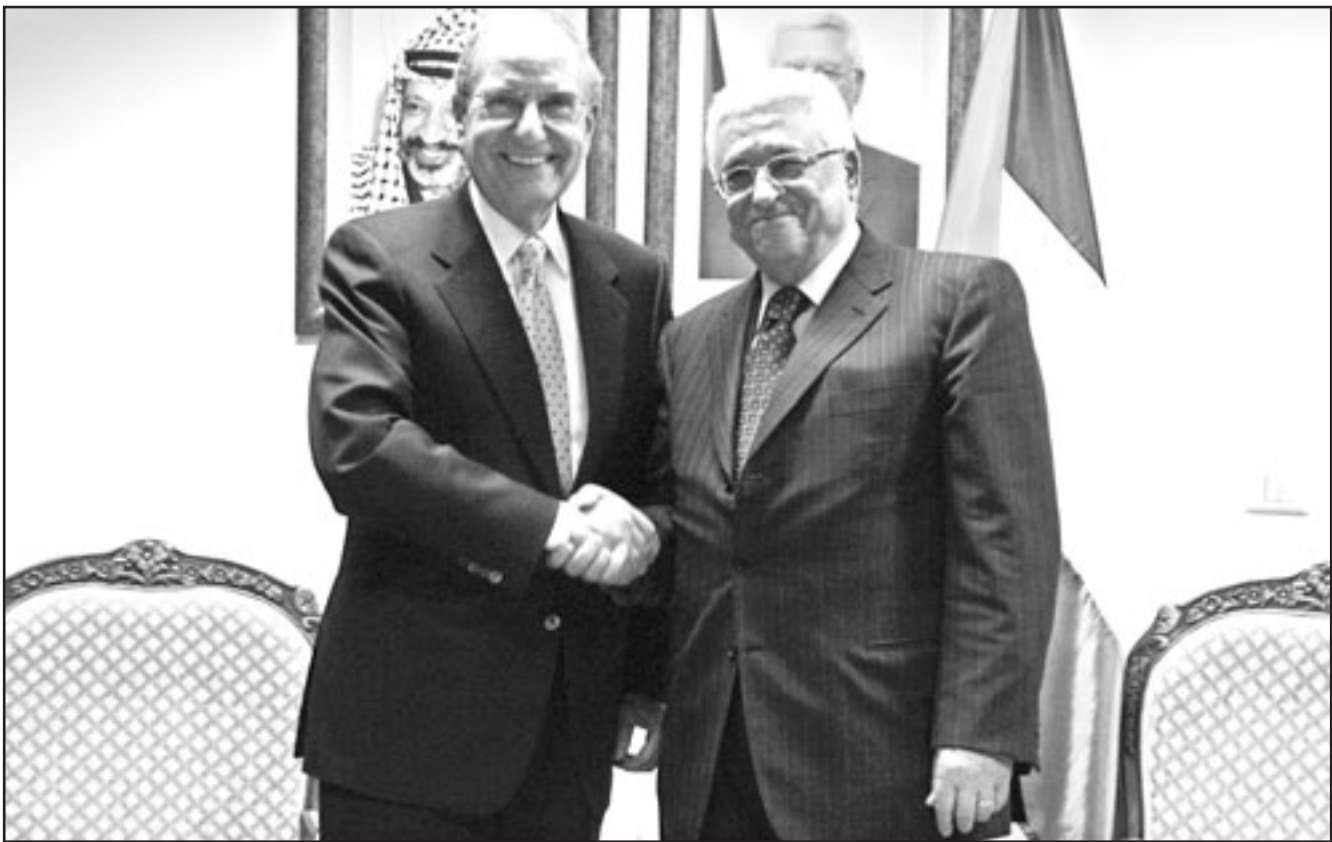
الرئيس الفلسطيني محمود عباس لدى اجتماعه بالمبعوث الأمريكي جورج ميتشل في رام الله امس