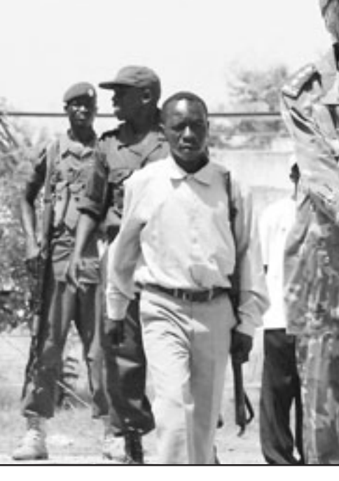
جندياً من جيش تحرير السودان في أحد معسكرات التدريب

على الرغم من الانتقادات قال عبد الله إن اللجنة ستواصل عملية تحديد الدوائر الانتخابية لأن القانون يحتم عليها ذلك. وعلى الرغم من التأجيل قال إنه تم تشكيل لجان انتخابية في الولايات ولجنة واحدة في جنوب السودان، ويقول محللون إن التسجيل سيكون مشكلة أيضاً لأن الكثير من السودانيين خاصة في الجنوب ليس لديهم أوراق هوية. وقال عبد الله إن زعماء القبائل ربما يتعرفون على هويات الناخبين، مضيفاً