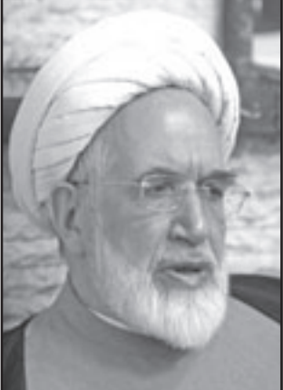
مهدي كرويي وعد بالغاء اعدام 135 حدثا