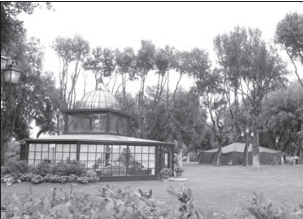
القذافي يصل إلى روما وفي استقباله برلسكوني، وفي الصورة الثانية خيمته التي ترافقه في فيلا دوريا بامفيلي، أضخم حدائق روما