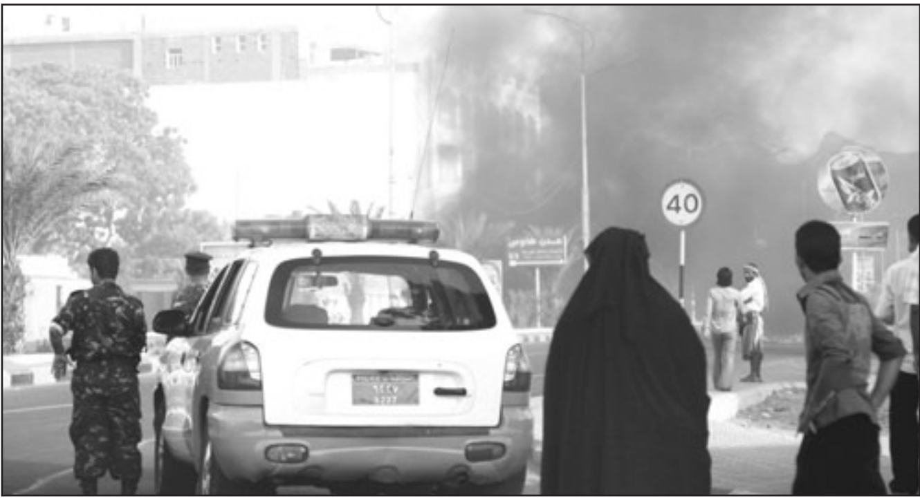
رجال امن ومواطنون يمنيون في أحد الشوارع التي أغلقها انفصاليون في مدينة عدن

الجنوب، لكنها لن تكون أقل قتامة من الشعور العام السائد في البلاد بالقلق البالغ والمخاوف المتزايدة كل يوم من أن تصل الأمور إلى درجة يصعب معالجتها، ويكون حينها من الصعوبة بمكان الحفاظ على الوحدة اليمنية التي تعد المنجز الأكبر لليمن الحديث، والتي طالما كانت ولا تزال حلم اليمنيين جميعاً دون استثناء بمن فيهم أبناء الجنوب. حالة التوتر أصبحت سيد الموقف في العديد من المحافظات الدولية اليمنية، وهي ما دفعت بالرئيس علي عبد الله صالح إلى زيارة عدن أمس الأول لأول مرة في صيفها الحار، بينما كانت مقصده غالباً في موسم الشتاء المعتدل طقساً، وعاصمته الشتوية، ضمن تقاسم الأدوار السياسية لعاصمتي شطري اليمن السابقين صنعاء وعدن. ودشن صالح جولته الميدانية للمحافظات بزيارات متكررة لعسكرات الجيش، حيث زار خلال الأيام الثلاثة الأيام الماضية على التوالي معسكر الجند بمحافظة تعز القريبة من عدن، ثم معسكر العند في لحج، ثم معسكر بدر بعدن، في مهمة قرأها البعض