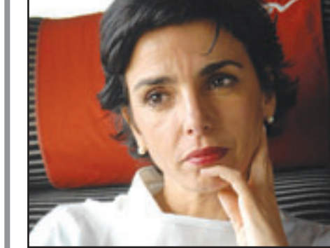
الوزيرة الفرنسية رشيدة داتي

الماضي لصالح الملك خوان كارلوس (سبعة آلاف يورو) ضد خوسيه أنتونيو باروسو رئيس بلدية بويرتا ريال في إقليم قادش (جنوب) الذي اهل الملك بتصريحات قذحة، متهما اياه بالفساد والسرقة وأنه عالة على الدولة الإسبانية. اثنار أكثر اهمية من الملك خوان كارلوس عشرين مرة طالما أنه يطالب بغرامة تقوئ ما توصل اليه خوان كارلوس عشرين مرة. وقد فاجأ مبلغ التعويض المجلد المغربية وصرح مديرها أحمد الشريعي ليومية «بي سي» الإسبانية قائلا «المغرب تفاجئت الدعوى، من حق اثنار ان يقدم بها، لكن الغريب هو ان مسؤولا سابقا في دولة ديمقراطية يدافع عن حرية الصحافة والتعبير وفي الوقت ذاته يطالب بتعويض مبالغ فيه 120 ألف يورو.