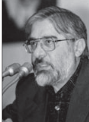
موسوي وعد بحرية التعبير وازالة اسوار العزلة العالمية

على مسافة غير بعيدة من محكمة الجنايات الاخلاقية في شارع الشهيد احمد قصير تندلق الحياة الليلية في مدينة طهران على امداد شارع فريقيقا، مطربو الراب غير الشرعيين يقومون بعروضهم في الازقة بصورة تلقائية ويقومون بيجثون روكوس صورية غير قانونية يجثون واخذوا والغرام ويوتقون مورهم في الغديوي الخليلين كما ان هناك ايضا نقاط اللقاة المتلويين في اومر غير سياسي، ثمانية ملايين موقع انترنت مغلفة امام مجاور، ولكن المثلين محكومون بالوت