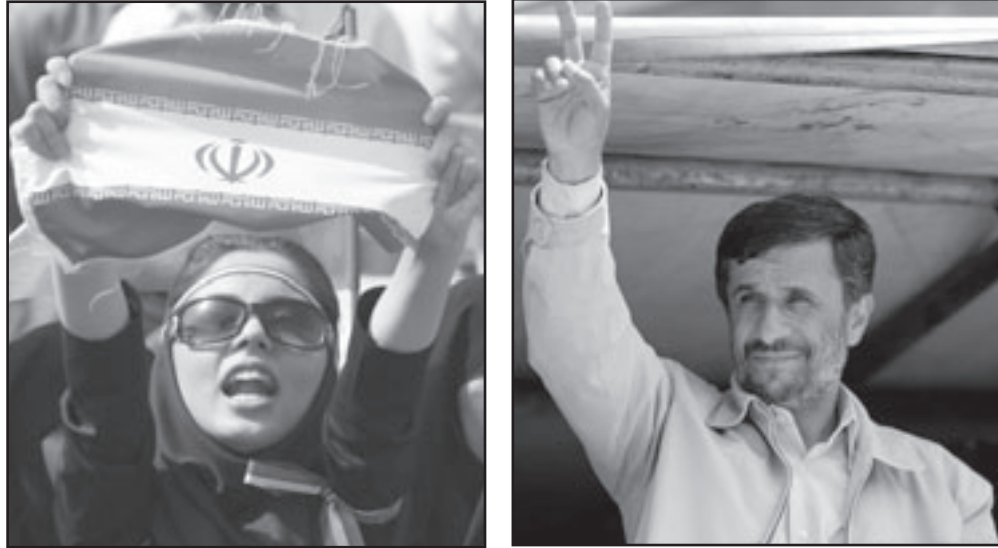
احمدى نجاد يلوح لمؤيديه خلال حملته الانتخابية.. و ايرانية من مناصبه ترافع علم ايران

واهانة مسؤولين كبار ومن بينهم الرئيس جرمية في إيران تصل عقوبتها القصوى إلى السجن عامين. وكان الرئيس المتشدد اسحق محمدي موسوي ومن بينهم الرئيس السابق اكبر هاشمي رفسنجاني بالفاسد. ورد رفسنجاني بغضب مطالباً بالزعيم الاعلى للجمهورية الاسلامية كبح جماح احمدى نجاد. ويقيم موسوي احمدى نجاد بعزل ايران بهجومه اللاذخ على الولايات المتحدة وبنهجه المتشدد فيما يتعلق بسياسة ايران النووية وابتكاره الحرة.