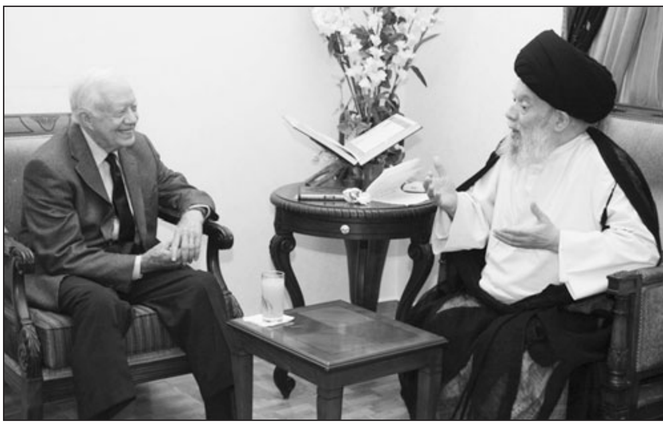
السيد محمد حسين فضل الله خلال اجتماعه مع الرئيس الاميركي الاسبق جيمي كارتر امس

ومن شأن هذه النتيجة ان تفضي الى اسناد مهمة تشكيل الحكومة المقبلة الى التحالف المناهض لسورية بزعامه سعد الحريري في الفترة المقبلة بعد مشاورات نيابية لهذا الغرض يجريها الرئيس ميشال سليمان. وكان حزب الله الشيعي وحلفاؤه طالبو بحق القفض (الفيوتو) في الحكومة المنتهية بنايتها وهي نقطة خلافية بقيت في صميم الوضع السياسي على مدى السنوات الاربع الماضية. وقال قاسم ان حزب الله وحلفاءه لم يتخذوا موقفا مشتركا مع الحكومة الجديدة، ورفض التعليق بشأن ما اذا كان حق القفض او ما يسمى بالثلث المعتل سيكون شرطا للمشاركة. وقال الشيخ قاسم ان حزب الله سينتظر ما يقدمه تحالف 14 آذار «فاذا قرر برنامجا وروية وطريقة اداء تختلف عن المرحلة السابقة وتفتح افاقا جديدة فسجدنا الى جانبه اما اذا كانت الامور كما كانت في السابق في حالة من التشنج او في حالة من الاستئثار او