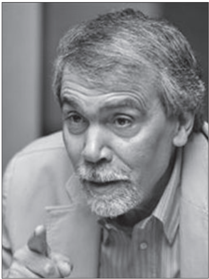
عبد الفتاح كيليطو

ما يوضّح كيليطو في «العرب وفنّ الحكى» هو بخاصة العلاقة بين الكتابة والسلطة السياسية من خلال القراءة الحاذقة التي يقوم بها لبعض النصوص الكبرى. يتسند على أن هذا يستهان به من الحكايات رويت أو كتبت بناه على أمر، على طلب ويأذن