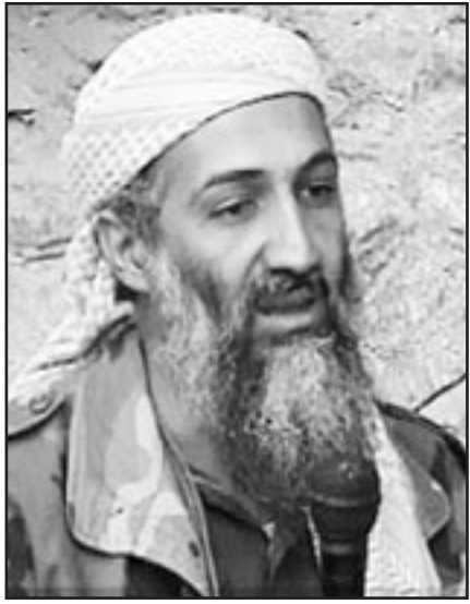
اسامة بن لادن