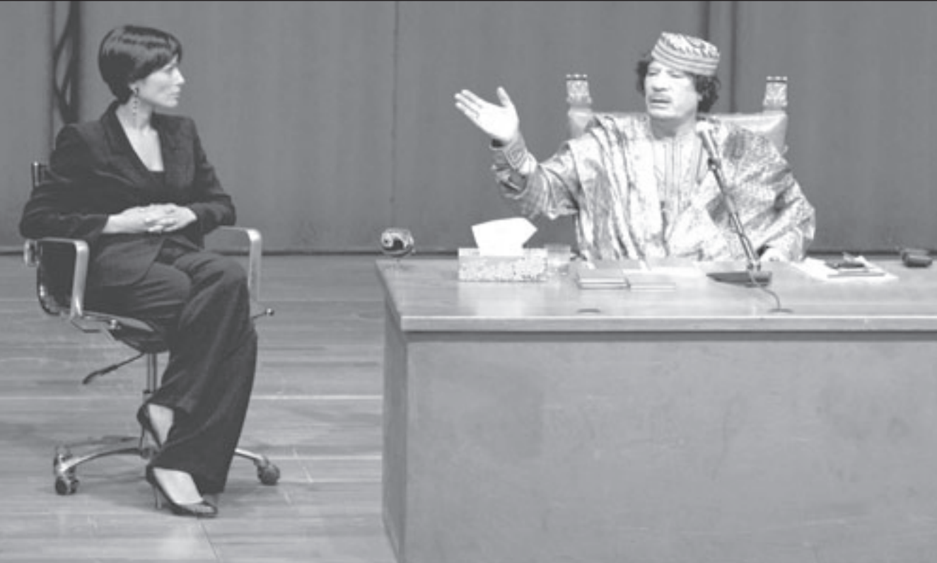
القذافي يلقي محاضرته امام النساء الايطاليات

واحتل حزب الأصالة والمعاصرة الذي يتزعمه فؤاد علي الهمة الوزير السابق في الداخلية وصديق الملك قائمة الأحزاب من حيث عدد الترشيحات (16