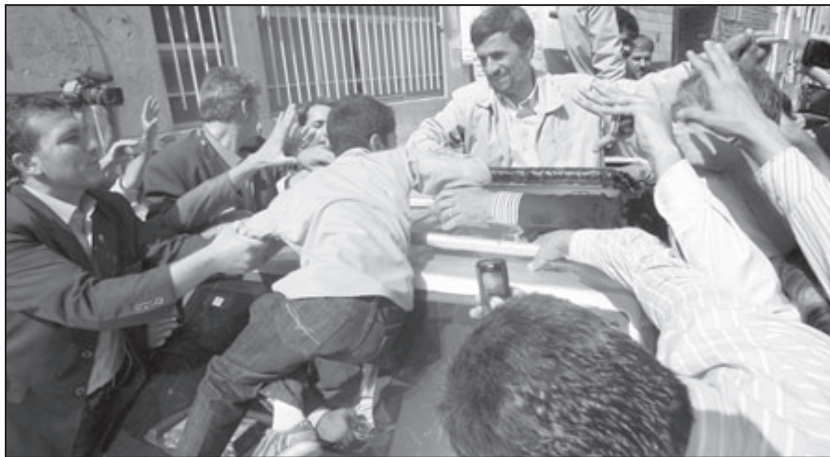
مطلق إيراني يحاول الوصول الى الرئيس احمدي نجاد عقب الالاء بصوته

الرئيس المنتهية ولايته المحافظ المتشدد محمود احمدي نجاد والمحافظ المعتدل مير حسين موسوي وهو رئيس وزراء سابق. وقال عباس شكوهي مسؤول المركز الانتخابي في السفارة الإيرانية ببغداد «هناك 12 مركزاً انتخابياً في العراق لاستقبال الإيرانيين الموجودين في العراق». وأوضح أن «المراكز الانتخابية فحقت ابوابها منذ الثامنة صباحاً (00:05 تغ) وستستقبل الناخبين حتى السادسة مساءً (00:15 تغ)». وأشار إلى أن خمسة من المراكز تتوزع في بغداد فيما توزعت السبعة