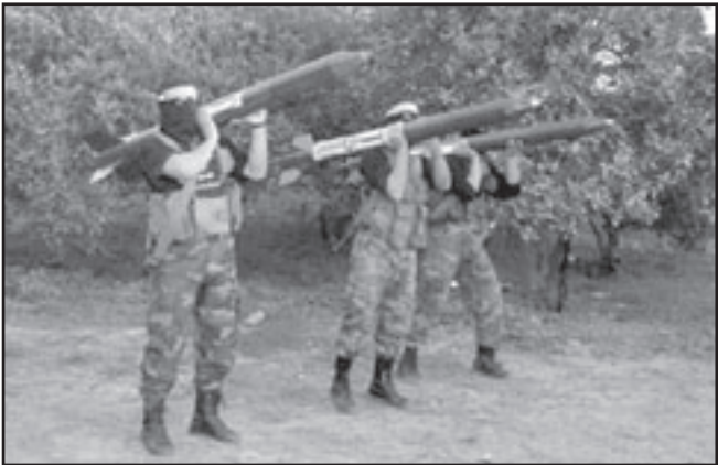
الشبان يغاردون حماس ويتبنون خط القاعدة

التشظيع في عملياتهم الهجومية الاولى. شارك فيها 21 حزبا - منهن 12 منهن من جبهة بعبتون وحصريون - اعتبروا «خطا» لانحازيين، بينما اعتبر التسعة المتبقون قوة اسادن خطية. كشف امر الخلية على سفك قرية من الجدار الحدودي الفاصل بين قوات الامن الاسرائيلية التي عملت بالكانا لجحت في منع عملية التسلل لحسن الظن. شعوب عيان قالوا ان الخلية انطلقت في طريقها قرابة الساعة السادسة صباحا ولم تثر ارباب احد. اطفال الذين كانوا بلانك تنجيشوا اظهرت تنظيمات صغيرة راديكالية في استخدامها الخلية من دون ان يعرفوا بانها محملة بالمواد المتفاسفة. بغية الخربين انتطوا الاحصنة ولذلك اعتقد السكان انهم صباون او مزارعون.