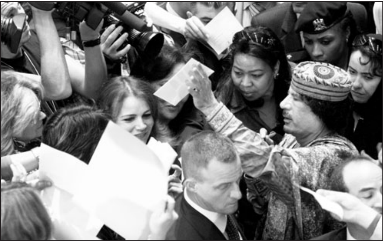
الزعيم الليبي معمر القذافي يوقع تذكارات لنساء في روما