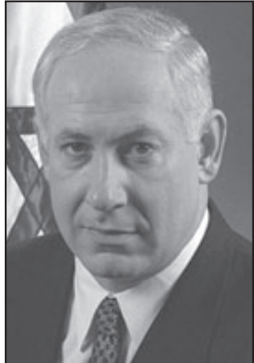
ننتياهو اختار خطاب محامي الدفاع امام هيئة المحلفين

قرار استخدام الجهاد لم يكن غويا. تمارين امتطاء الجهايا هي جزء جوهري في خطة جند انصار الله التهايلية. تدريبات