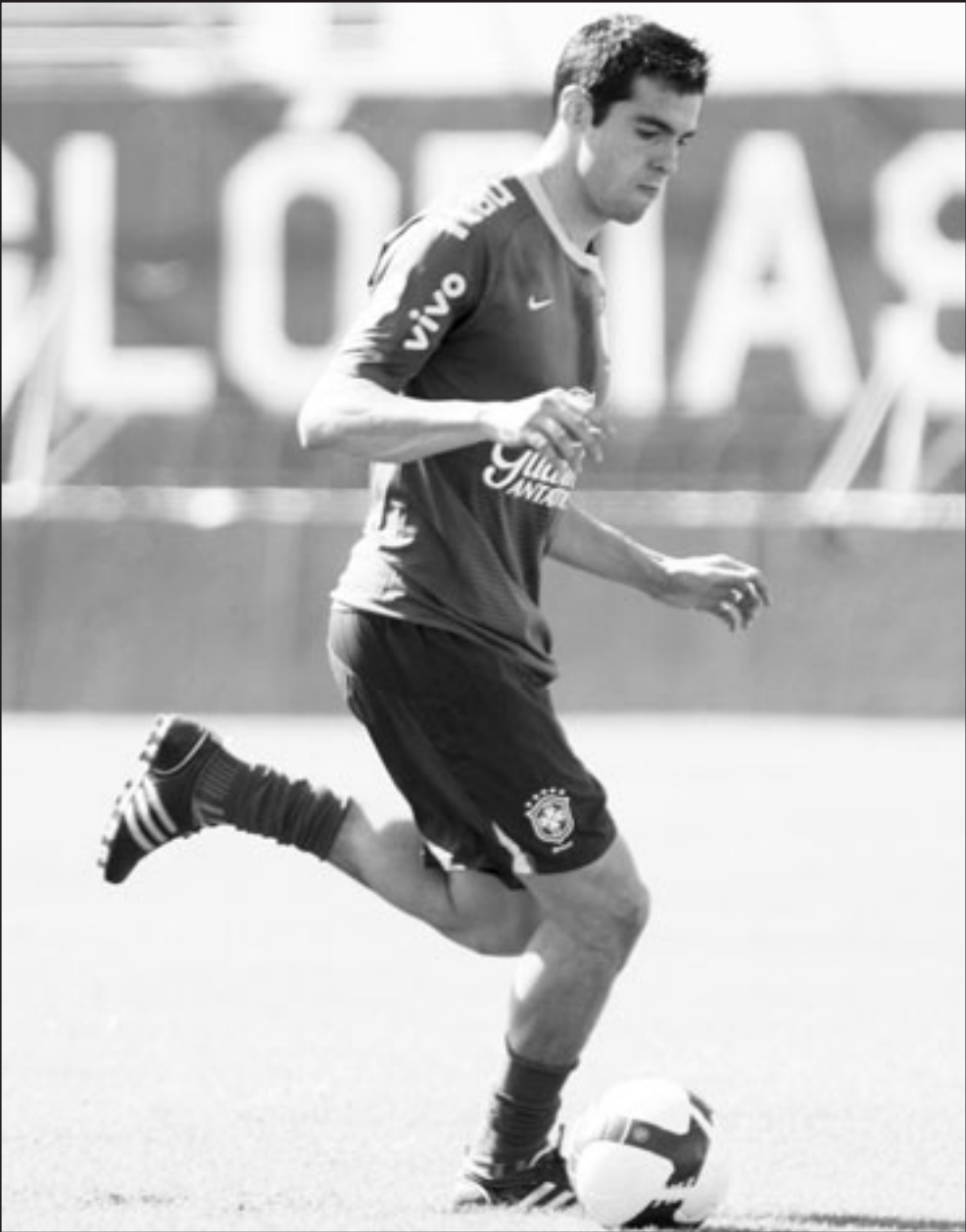
نجم المنتخب البرازيلي كاكا