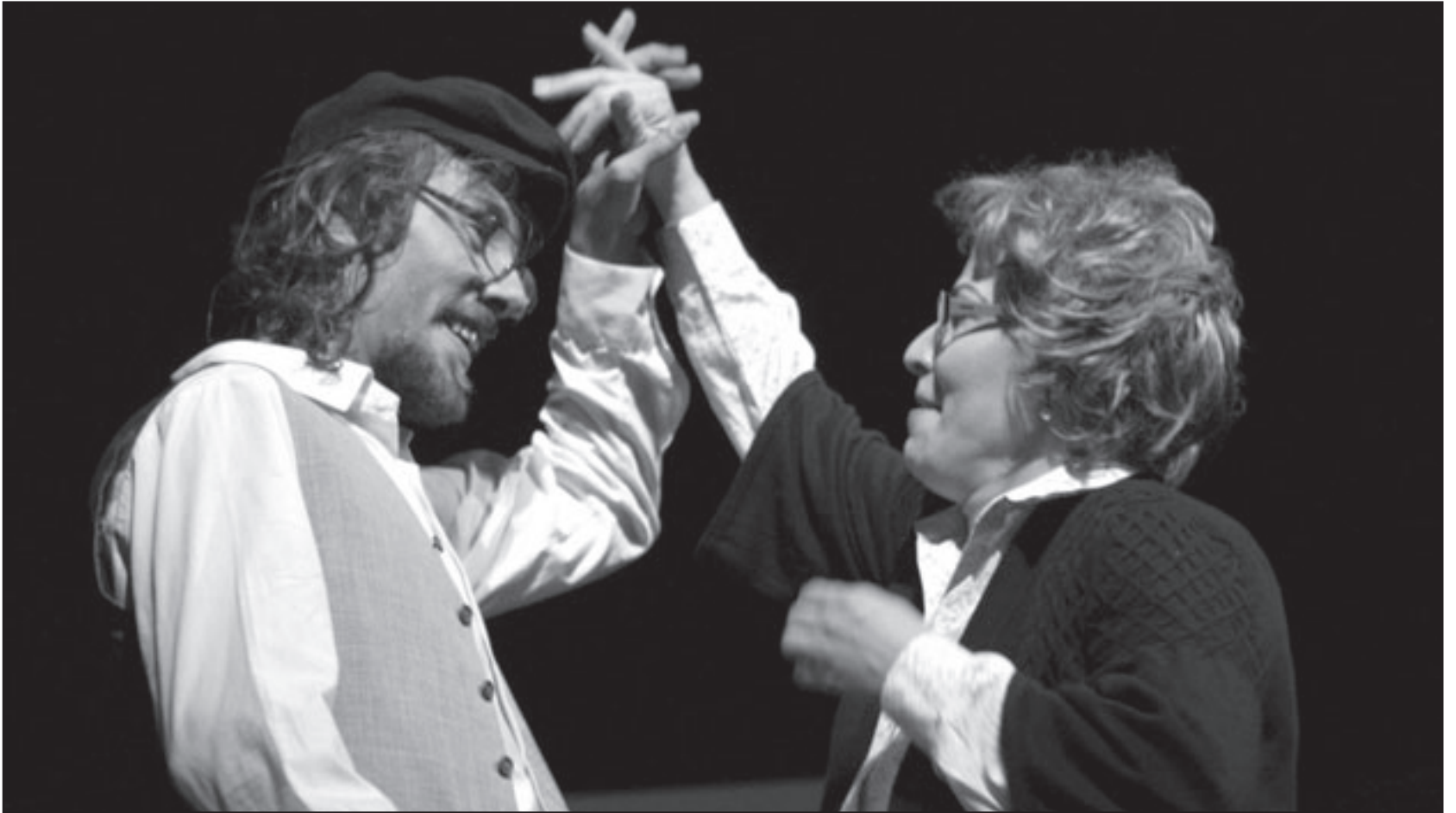
مشهد من مسرحية «الكراسي»