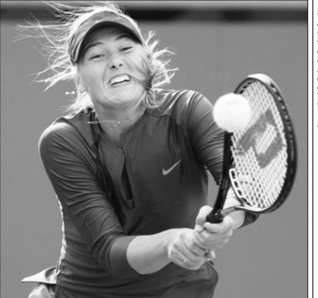
الروسية ماريا شارابوفا

بوينس آيرس - د ب ا: بدأت نتائج المدير الفني الذي يعتبر أفضل لاعبي الكرة في تاريخ البلاد، وأشار استطلاع آخر أجرته صحيفة «أوليه» الرياضية عبر موقعها الإلكتروني الى أنه من بين 47286 مشاركاً، يعتقد أقل من نصفهم (48.6 بالمائة) بأن الأرجنتيني يمكنها التأهل الى كأس العالم بصورة مباشرة. وفي المقابل ترى نسبة 23.8 بالمائة أن راقصي التانغو سيكون عليهم خوض مواجهة فاصلة من أجل التأهل، فيما أعربت نسبة 6 و28 عن ثققتها بإخفاق الأرجنتيني أول يوم الأربعاء صفر 2/ أمام ضيفه الإكوادوري. ومن بين 12309 مشاركين في الاستطلاع، أكدت نسبة 79.4 بالمائة اعتقادها بأن مارادونا غير مؤهل للقيادة الأفضل لشغل المنصب عند رحيل المدير