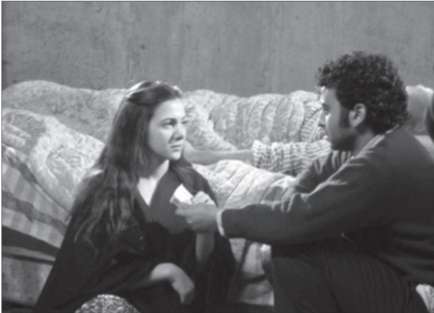
لقطة من فيلم «عزبة آدم»