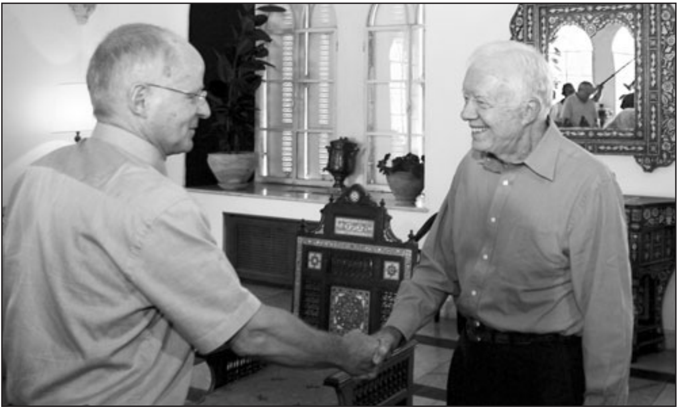
الرئيس الامريكى الاسبق جيمي كارتر لدى لقائه والد الجندي الاسرائيلي غلعاد شليط في القدس

مسؤولية افضال المفاوضات التي تمت بوساطة مصرية للافراج عن شليط في مقابل الافراج عن مئات الاسرى الفلسطينيين وجرت آخر جولاتها في آذار (مارس) قبل تولي حكومة رئيس الوزراء اليميني الاسرائيلي بنيامين نتنياهو السلطة في الاول من نيسان (ابريل).