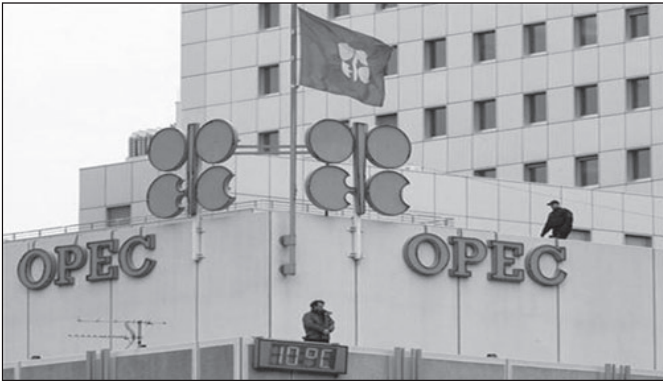
مقر أوبك في لندن

بأمال في حصول التعاضد الاقتصادي بحسب متعاملين في السوق. وفي المبادلات الصباحية تراجع برميل النفط الخفيف «لايت سويت كرو»، تسليم تموز (يوليو)، 21 سنتا ليبلغ 47.72 دولارا. وخسر برميل نفط برنت (بحر الشمال)، تسليم تموز (يوليو)، 44 سنتا ليبلغ 35.71 دولارا. والخميس، سجلت اسعار النفط ارتفاعا ملحوظا في بورصة بارتفاع توقعات الوكالة الدولية للطاقة بعد مراجعة الاستهلاك ما جعل السوق أكثر تفاؤلا بشأن التوازن بين العرض والطلب. وفي سوق نيويورك اقل سعر برميل النفط الخفيف، تسليم تموز (يوليو) على 68.72 دولارا اي بارتفاع 35.1 دولار قياسيا بسعر الاقل الارباع.