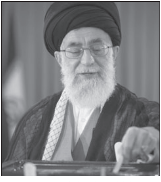
المرشد الأعلى للجمهورية الإيرانية آية الله علي خامنئي يدي بصوته

المعارض وزيادة للنشاطات النووية. ويعتقد أن خسارة نجاد سيتم الترحيب بها خاصة من الغرب، على أنها إشارة لابتعاد إيران عن سياسته. ويرى أن اللبنانيين كانت امامهم الفرصة للتصويت ضد حزب الله على خلاف الإيرانيين الذين لا يمنحون نفس الفرصة.