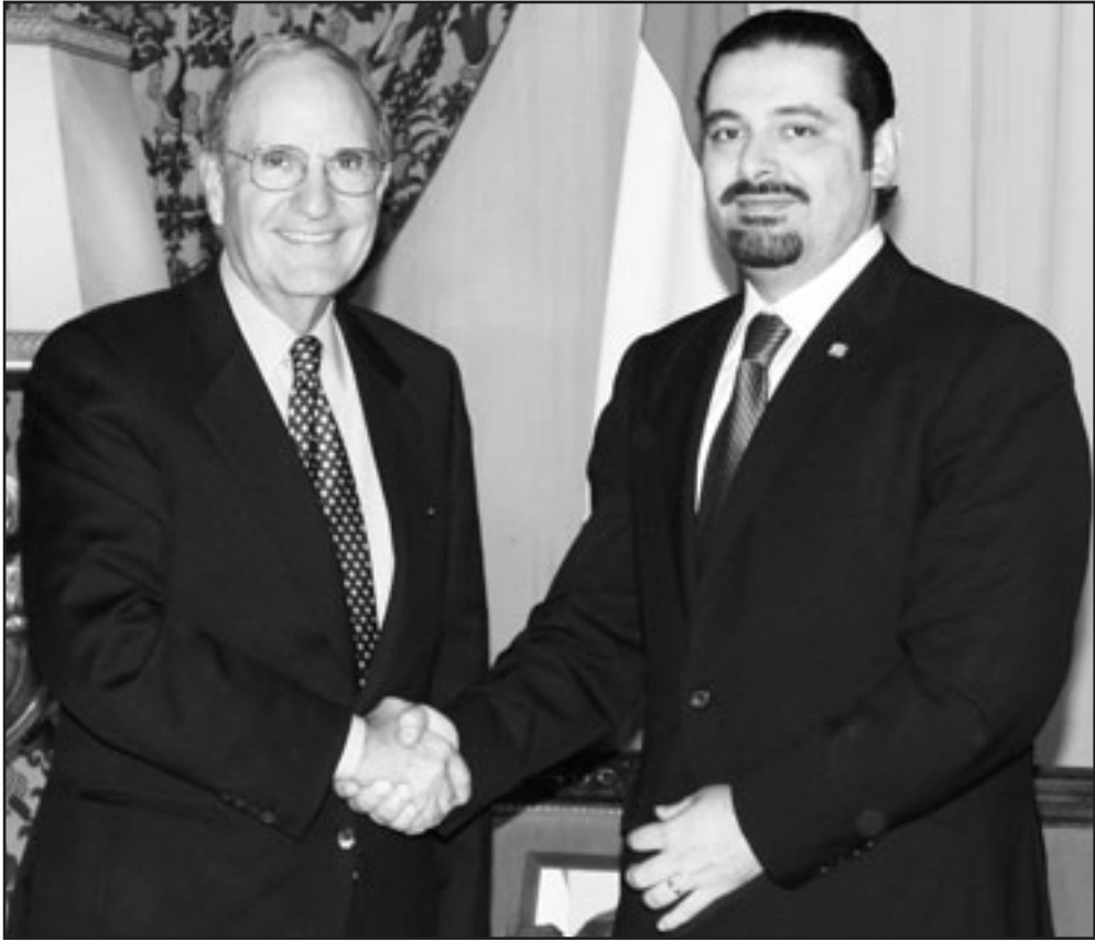
زعيم كتلة المستقبل سعد الحريري لدى اجتماعه مع المبعوث الأمريكي جورج ميتشل في بيروت الجمعة

ونظم زيارات اكثر من مسؤول لبناني الى دمشق». وفي الحركة الداخلية ايضا، برزت زيارة النائب الحريري الى بكركي حيث التقى بطيريك الماروني نصر الله صغير معلنا «ان الاكثريه اليوم واضحة وقد عدنا يدنا وايقون على ثوابت 14 آذار»، واذ ورد في المصاحف السورية في بيروت الجمعة