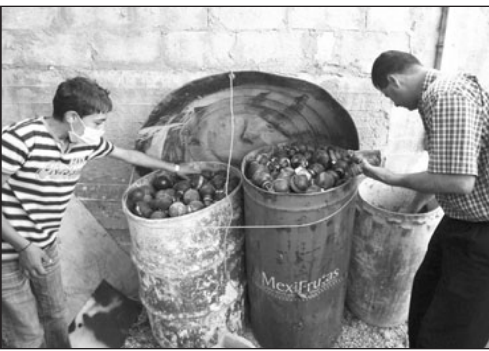
فلسطينيان يجمعان القنابل المسيلة للدروع التي يطلقها الجيش الاسرائيلي على المتظاهرين في بلعين

بجزيتهم، ونحن كاسرائيليين واجانب ندعهم بوجودنا، مضيئة ان «بلعين» باتت رمزاً لجميع القرى المقاومة للجدار». وشارك في مسيرة الجمعة فلسطينيون واسرائيليون واجانب، بعضهم قرع طبولاً فيما رفع آخرون صورة باسم ابو رحمة التي وضعت على دروع حديد لصد عشرات القنابل المسيلة للدروع.