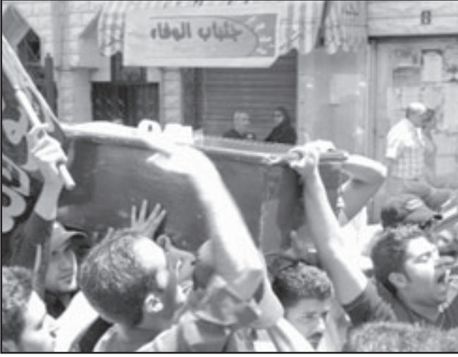
احداث ايار ساهمت باسقاط حزب الله في الانتخابات

الده. اتباعه حرقوا هيئات تحريد الصحف ومحطات التلفزة المؤيدة للائتلاف واشتبكوا في معارك الطلاق نار مع مسلحين سنيين. الجهايات حصدت ارواح 21 انسانا في احداث ايار (مايو) سقط حزب الله مرتين. هذا التنظيم الذي يدعي انه مدافع عن لبنان واقسم على عدم توجيه سلاحه نحو الاشقاء ايدا قتل بصوره مسؤودة عددا من اللبنانيين. في المرة الثانية حدثت انكسار في علاقته مع الطائفة المسيحية. الكثيرون من المؤيدين للتحالف بين حزب الله والجزال المسيحي ميشيل عون افاقوا على