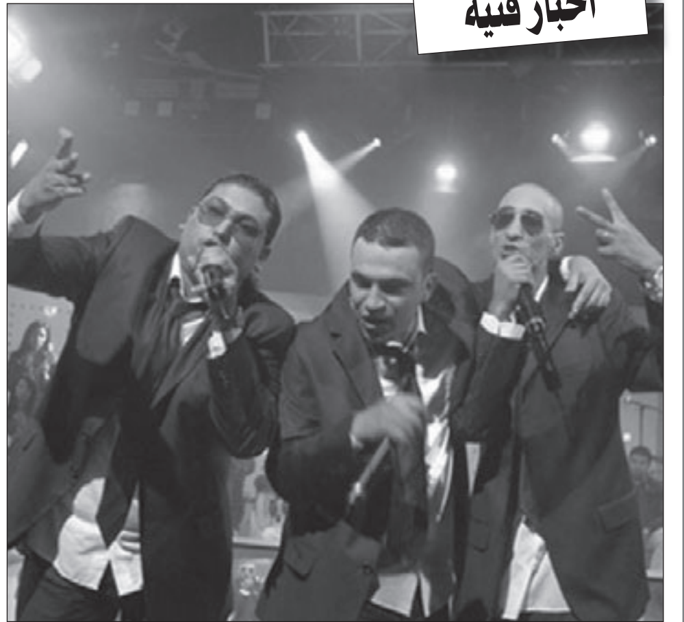
فرقة «ماسكوت» في عرض موسيقي

■ في حوار سابق مع إحدى الصحف الإماراتية قلت «لأسف الشديد إن حجم الاحتفاء بالفيلم الإماراتي عربياً أكبر بكثير من نظيره محلياً»، ما السبب في رأيك؟