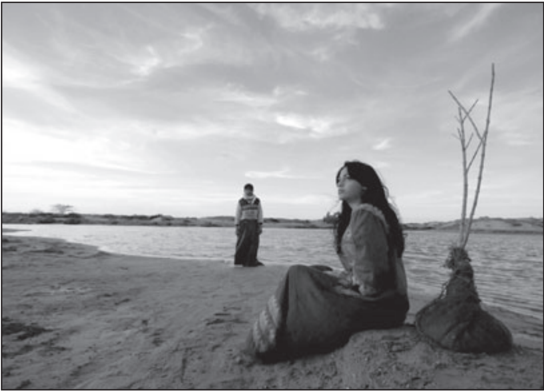
لقطة من فيلم «بنت مريم»

كما عرض الفيلم السوري «الليل الطويل» بحضور مخرجه حاتم علي ومنتجه هيثم حقي ونال الفيلم أيضاً ثناء كل الحاضرين الذين اعتبروه خطوة على الطريق الصحيح للسينما السورية التي تراجعت كثيراً رغم المفرة الواضحة في الإنتاج التلفزيوني.