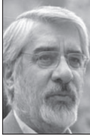
انتصار موسوي كان يعني حجب الثقة عن النظام

كثيرين في ايران ولا سيما من الشباب، باتوا مهتمين أكثر من أي أحد آخر بنمط الحياة، الامكانيات والفرص المفتوحة بلاهم (والذين يعيشون في الدول الديمقراطية.