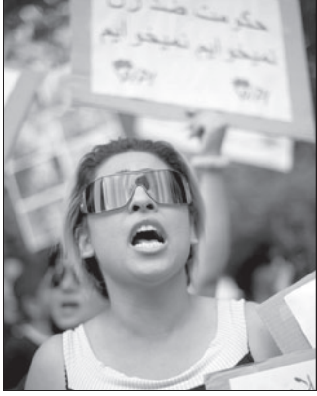
ايرانية تشارك بمظاهرة امام سفارة طهران في لندن

ايران والعالم، وقالت ان احلام التغيير تحولت لغبار. ببورها قالت «نويويورك تايمز» ان احلام التغيير انتهت يوم السبت، ونقلت عن حاكم ولاية نيويورك جيم غوفين ان عليهم مواجهة اربعة ايام جديدة من الديكتاتورية، واصفيا ما حدث بالظلم. واشارت مثل غيرها الى ان انتخاب نجاد سيجعل من ملفات مثل أفغانستان والعراق والقاعدة والملف النووي وتحسين العلاقات مع الغرب اثنائية، وقالت ان نجاح نجاد جاء بسبب تباينه بخلاف السكان في الريف عن التغيير، وأكدت ان النتائج كانت مريحة للمتطرفين في اسرائيل والولايات المتحدة الذين كانوا يخشون رئيسا جديدا يغير النظرة عن ايران، الامر الذي يمس دبلوماسي انه لو نجح موسوي لكان الاصلح على الغرب التعامل معه من نجاد الذي يظل الواجهة في سياساته من غموض موسوي اللطيف. وقالت ان الاخير اختلف من المشهد وسطه وشائعات بانته وضع تحت الاقامة الجبرية، ولكنه ارسل رسالة الى اتباعه من انه لن يقبل بالنتائج وان لا تراجع من موقفه ولا عودة للوضع السابق. ونفت الشرطة الإيرانية عن الادعاءات التي وضع موسوي زعمال الإقامة الجبرية، ونقلت وكالة أنباء الرضا الإيرانية (ايلنا) نفي نائب قائد الشرطة أحمد رضان الشنيد للتلقي التي اشارت الى وضع موسوي وزوجته زهرة في الإقامة الجبرية لتجنب المزيد من الاضطرابات في طهران.