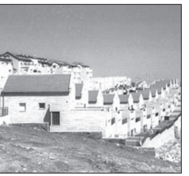
قضية البناء في المستوطنات تهدد باسناد علاقة اسرائيل بأمريكا

وكانت النتيجة بناء بلا ترخيص أت بعدد اوامر هدم وزيادة كثافة السكن: معدل الكثافة عند اليهود 0.84 نسمة للفرقة، قيسا الى 1.43 عند العرب. «ان الاسرائيل التي تهتم كثيراً بزيادة المستوطن الطبيعية، تحارب زيادتها الطبيعية كوننا خطراً سكانياً»، يقول عضو الكنيست أحمد الطيبي. جمعيتها رسمية، جمعيتها جمعية لكن معطياتها رسمية، جمعيتها جمعية «عبر عاميم»، تدل على أن وضع العرب الاسرائيليين افضل كثيراً من وضع الفلسطينيين في شرقي القدس: منذ 1967 تضاعف عدد السكان الفلسطينيين في شرقي القدس اربعة اضعاف تقريباً - من 69 الف الى 270 الف.