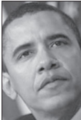
نتائج الانتخابات ستعرق خطط اوباما

في ضوء ارتفاع مستوى الاستياء الجماهيري والانتقاد اللاذع على احمدي نجاد (وبالاساس في مجال السياسة الداخلية، ولكن ايضا في مجال السياسة الخارجية المطرقة والتصريحات بشأن تکران الكارثة)، برز النوق الى التغيير في اوساط قطاعات أخذة في الاتساع. انتخاب باراك اوباما للرئاسة في الولايات المتحدة ومدد اليد للحوار شجع الكثيرين في ايران على تأييد سياسة أكثر اعتدالاً. بالنسبة للكثيرين، يبدو موسوي أكثر ملاءمة لعصر اوباما وعملية الحوار. نتائج الانتخابات ستجعل من الصعب على اوباما دفع خطته الى الامام على المدى القصير، ولكن حتى احمدي نجاد يمكنه ان يكون شريكاً في الحوار، اذا ما شعر بان هذا يخدم المصلحة الجودية للنظام الثوري ويلقى التأييد من الزعيم الاعلى.