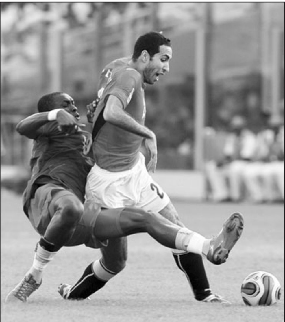
منتخب مصر خلال مباراة مع منتخب الكاميرون