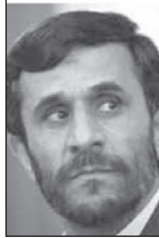
انتصار نجاد تحقق من خلال التزوير

انتصار موسوي الذي زيف بشكل فظ جدا. نتائج الانتخابات للرئاسة في ايران. لماذا كان النظام يحتاج الى ان يتخذ هذا التزييف الفظ جدا والخطوات غير الديمقراطية جدا، عندما كان يتباهى على مدى السنين بان الانتخابات في ايران ديمقراطية؟ لماذا احمدي نجاد الذي خط على علمه شعارات مثل «مكافحة الفساد، خدمة الشعب» وما شابه اعطى بيده لفضل فاسد للغاية؟ يبدو انه يحمل تلك عدة تفسيرات.