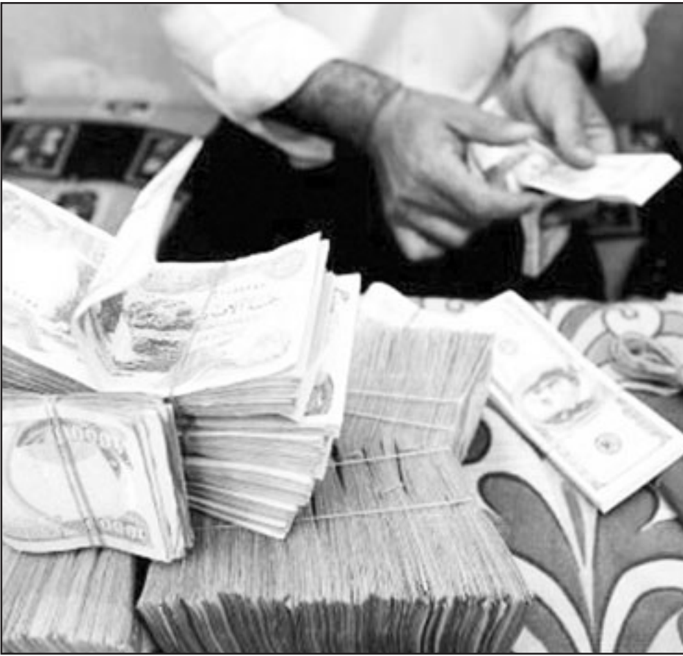
صراف عراقي يحول العملة المحلية للدولار الأمريكي

■ ابوظبي - القدس العربي: «أكد خبراء ماليون واقتصاديون امريكيون اسم ان العالم يسير في اتجاه الانتعاش البيئي والتعافي من تأثيرات الازمة المالية» و ان التضخم، لا الانتعاش، هو الخطر الحقيقي الذي يلوح في الأفق. وقالوا في ندوة نظمها «مركز الإمارات للدراسات والبحوث الاستراتيجية» بأبوظبي حول «الازمة المالية العالمية: التحديات والحلول» ان الازمة ما زالت ترواح مكانها. وأشاروا الى أن اقتصادات دول «مجلس التعاون» المربوطة بالدولار تشهد تضخماً نتيجة لانخفاض الدولار، ومن هنا، يجب على هذه الدول الابتعاد عن ربط عملاتها بالدولار وادخولها في سوق النقد العالمي. وقال «يوريسيفيك كابتال» بالولايات المتحدة الأمريكية، ان التضخم، لا الانتعاش، هو الخطر الحقيقي الذي يلوح في الأفق، ذلك ان التوسع السريع في عرض النقود سيؤدي -في نهاية المطاف- إلى حدوث ارتفاع حاد في الأسعار. أما في المرحلة الحالية، فإن المد التضخمي تكبحه الضغوط التعويضية الحاصلات الميؤولة في هذا السياق، منتبهة إلى تأكيد أن العالم يسير في اتجاه الانتعاش البيئي والتعافي من تأثيرات الازمة المالية». وشارك في الندوة أيضاً الدكتور ستيفن روش، رئيس «مؤسسة مورغان ستانلي»، آسيا، هونغ كونغ، الذي تحدّث حول مازق عالم ما بعد الازمة المالية، فأكد ان ملاح هذا العالم ستبطلون من خلال مدى الرغبة لدى قادة العالم في الارتقاء إلى مستوى الحدث وتصرفهم من منطق استراتيجي، لا من منطق تكثيفي.