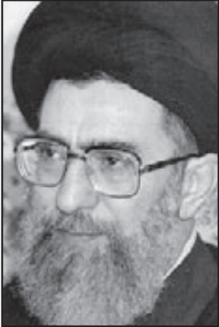
خامنئي ساند بشكل واضح حملة نجاد