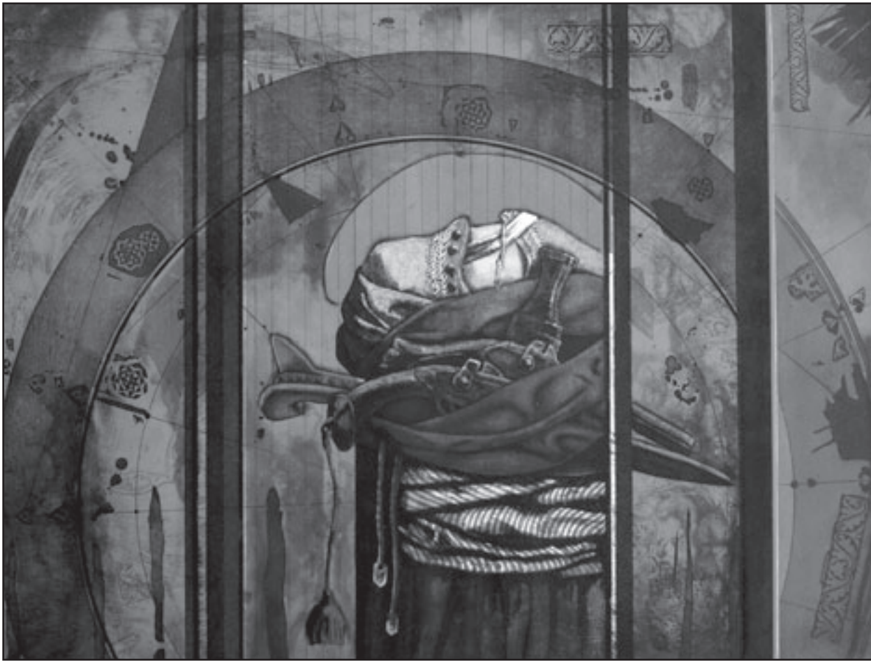
لوحة لعوض الشيمي (القدس العربي)

وتحضر الحروفية بكل تفاصيلها البهية لدى الفنان الرائد رفيق اللحام، الذي مرت تجربته عبر ما يزيد على الخمسين عاما بأكثر من محطة، لعل المحطة الحروفية، كانت هي الأبرز في تجربته، ولم تغب أيضا، من يحمل لها الفنان في قلبه الحب والإعجاب، منها عمان والقدس، فهو غربي الوجهة، وشكل عبر سيرته مدرسة طابعية مميزة تلتزم عليها العديد من الفنانين الأردنيين، فهو خطاط متمكن وقد حمل عبر