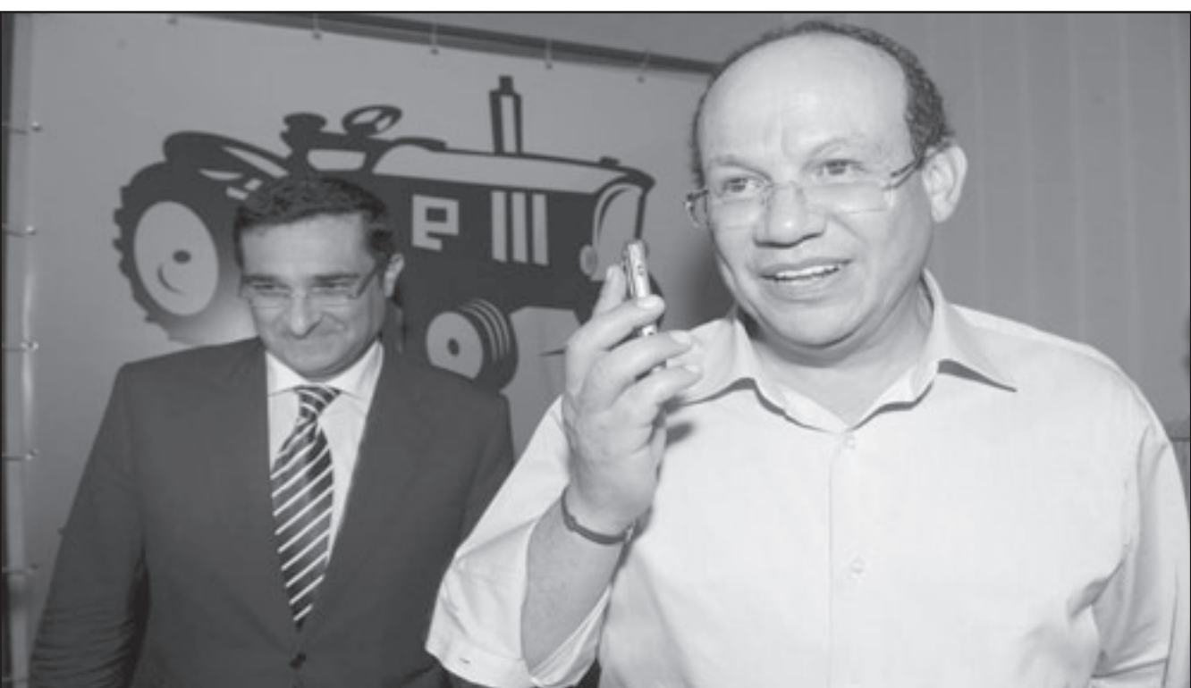
فؤاد عالي الهمة يبدو عاجزا عن إخفاء سعادته بالفوز الكاسح الذي حققه حزبه

مقارنة مع استحقاق 2003، حيث تمكنت من الفوز بـ3406 قاعد على الصعيد الوطني، أي بنسبة 12.3 في المئة مقابل 127 مستشارا خلال الإنتداب الحالي. وأضاف أن الشريحة التي لا يتجاوز عمرها 35 سنة حظيت بأعلى نسبة تمثيلية داخل فئة النساء (50 في المئة)، مبرزًا الحضور المتميز للمنتخبات اللواتي تتوفرن على تعليم ثانوي أو عال (71 في المئة). وأشار بن موسى إلى أن 10 آلاف و779 مرشحا أعيد انتخابهم (أزيد من 61 في المئة)، وإلى أن 18 في المئة من المنتخبين تقل أعمارهم عن 35 سنة، فيما يتوفر تعليمي ثانوي أو عال. وقال الوزير إن العاملين في قطاع الفلاحة احتلوا مركز الصدارة بنسبة 29 في المئة، تليهم فئة الأجراء (18 في المئة)، والتجار (11 في المئة)، ورجال التعليم وموظفو القطاع العام (8 في المئة لكل من الفئتين). كما تم تسجيل ارتفاع في نسبة الشباب، الذين تقل أعمارهم عن 35 سنة، انتقلت من 16 في المئة في انتخابات 2003 إلى 18 في المئة خلال اقتراع 2009، مشيرًا إلى أن هذا الارتفاع سجل في نسبة المنتخبين المتوفرين على مستوى تعليمي ثانوي أو عال، إذ ارتفعت من 46 في المئة سنة 2003 إلى 51 في المئة سنة 2009.