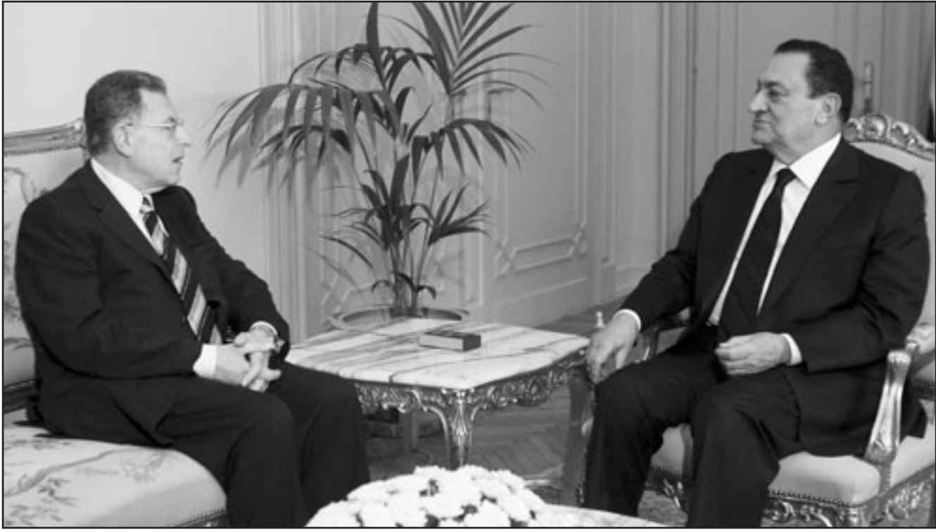
الرئيس المصري حسني مبارك لدى استقباله فؤاد السنيورة في القاهرة امس

قيادة الاتحاد البرلماني العربي واتحاد برلمانات دول منظمة المؤتمر الإسلامي وفي جميع الاطر البرلمانية.. وفي بيان إثر اجتماع لها برئاسة بري في دارته في المصليح نوهت الكتلة بانجاز الاستحقاق الانتخابي من جديد، الكتلة لبنان في يوم واحد، ودعت لأن «يقوم المجلس النيابي الجديد بدور تأسيسي على مستوى القرار القانوني لتي من شأنها أن تضع اتفاق الطائف موضع التنفيذ دون استثنائية، وتكذلك لقرار قانون اللامركية الادارية وقانون الأحزاب وإنشاء وزارة للتخطيط والتصميم والغاء كل الجالس والصناديق والهيئات، مشددة على ضرورة أن «يتم ترتيب الاولويات الوطنية الداخلية انطلاقا من وضع خطة نهوض وطني اقتصادي تؤدي إلى السير قدما لبقاء الازمة الاقتصادية الإجتماعية».