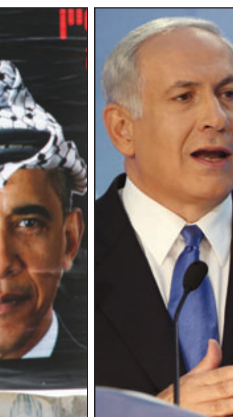
ملصقات تصور الرئيس الامريكي مرتديا كوفية علقها مستوطنون في القدس