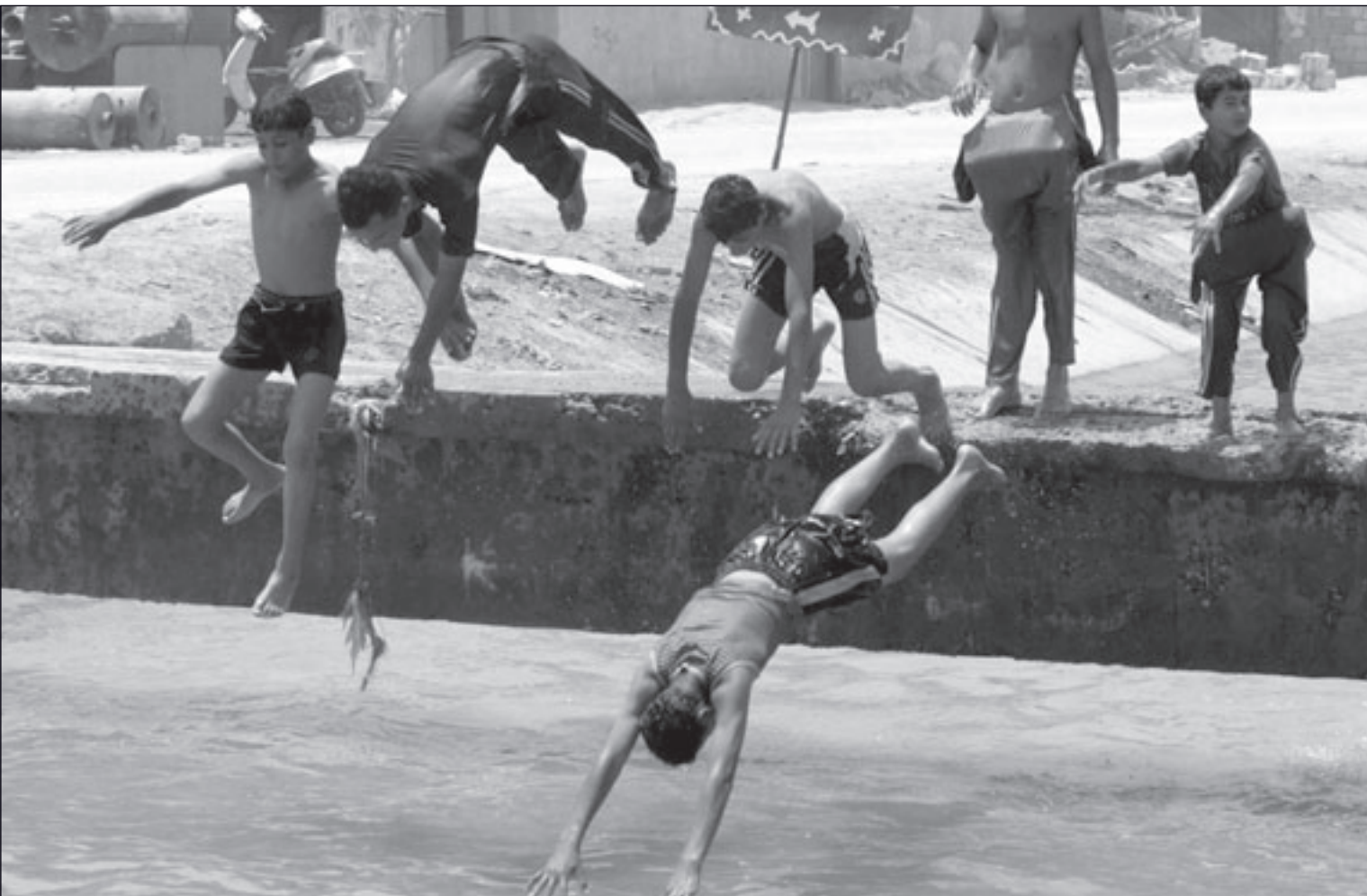
اطفال عراقيون يستحمون في نهر الفرات امس هربا من الحرارة الشديدة (ا ف ب)