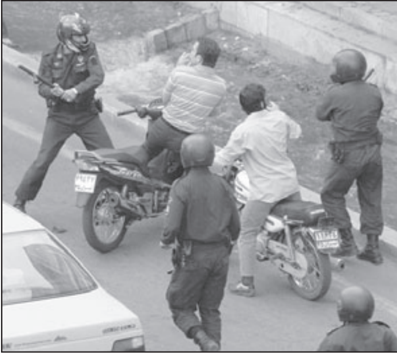
قوات شرطة تضرب متظاهرين مؤيدي موسوي