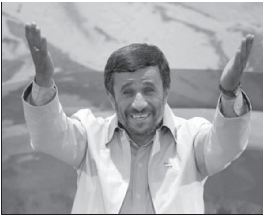
أحمدي نجاد يحيي المواطنين بعد إعلان فوزه بالانتخابات

التي فاز بها الرئيس محمود أحمدي نجاد. توقيف صحفيين هولنديين وفي لاهاي أعلن تلفزيون نيدرلاند 2 الهولندي الرسمي الأحد أن اثنين من صحفييه كانا يطحيان الانتخابات الرئاسية الإيرانية أوقفتهما الشرطة وأمرتهما بمغادرة البلاد. وأعلنت نيدرلاند 2 الأحد في بيان نشر على الإنترنت «أمر الصحافي في (نشرة الأخبار) نونا، بيان إيكومب والمصور (ديب) هيلغرز بمغادرة إيران». وأضافت انهما «كانا يصوران امام المقر العام (لمير حسين) موسوي، المناقش الرئيسي (لرئيس محمود) أحمدي نجاد، عندما أوقفتهما الشرطة». وتابع البيان «تم دفعهما الى الحائط وصودرت شراطينهما وسحب ترخيصهما وجبرا على مغادرة البلاد على الفور». وكان الصحافيان وصلا الى ايران منذ أيام لتغطية الانتخابات الرئاسية، بحسب المصدر.