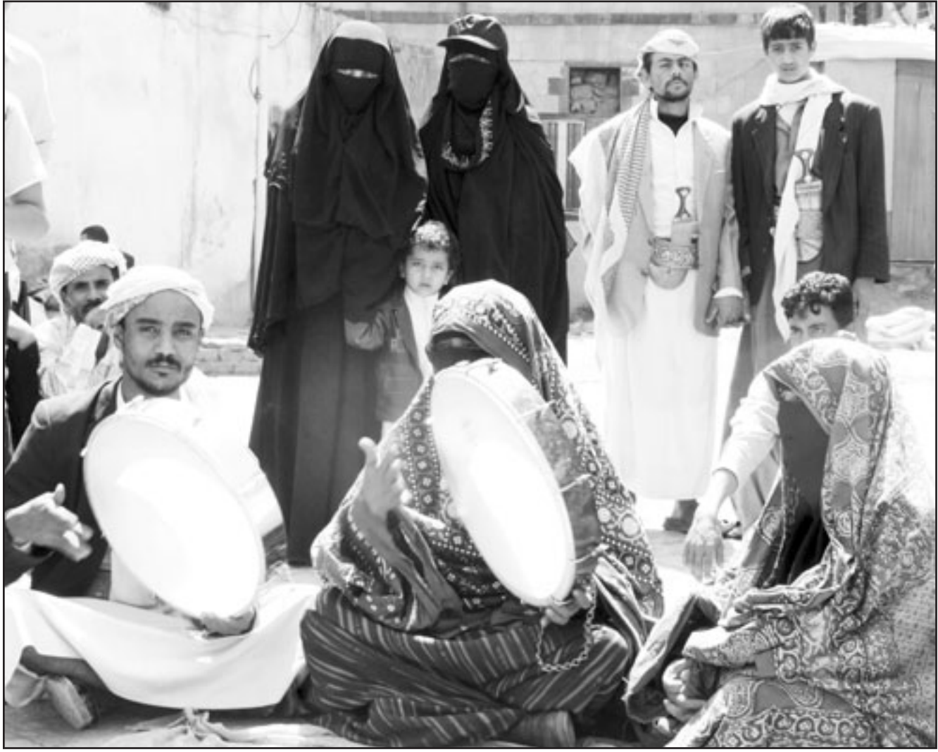
يتميون يقدمون عرضاً غنائياً تقليدياً في المدينة القديمة بصنعاء أمس حيث لم يؤثر حادث الاختطاف على سير الحياة اليومية هناك

أطراف عدة تلعب على وتر فك الارتباط؛ الاسلاميون يحركون الشارع .. و«القاعدة» تزداد شعبية .. والعسكريون السابقون يعرضون خدماتهم