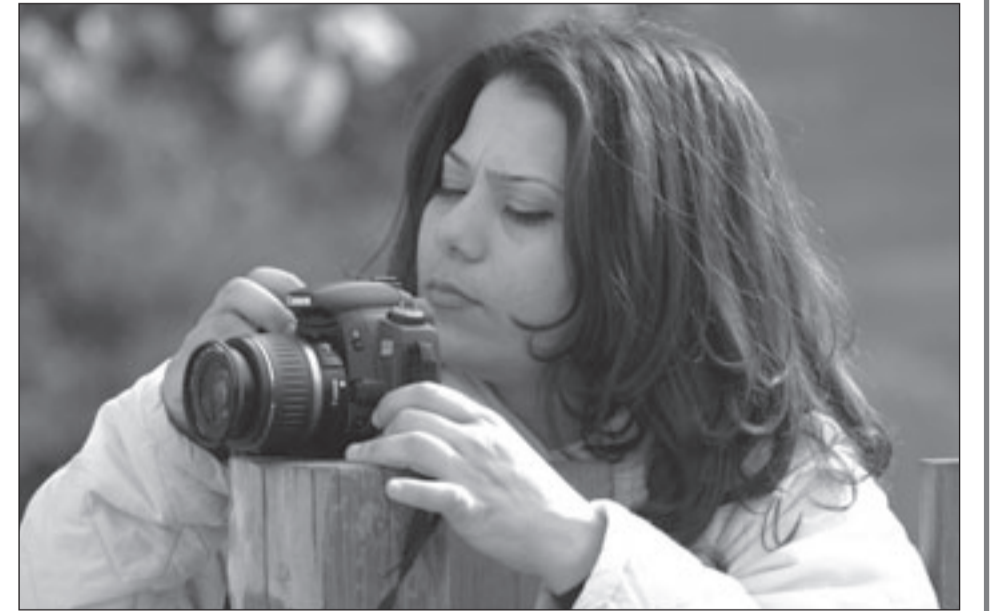
مقبولة نصار (القدس العربي)