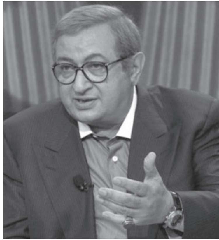
نور الشريف: الدراما الخليجية شيء جيد