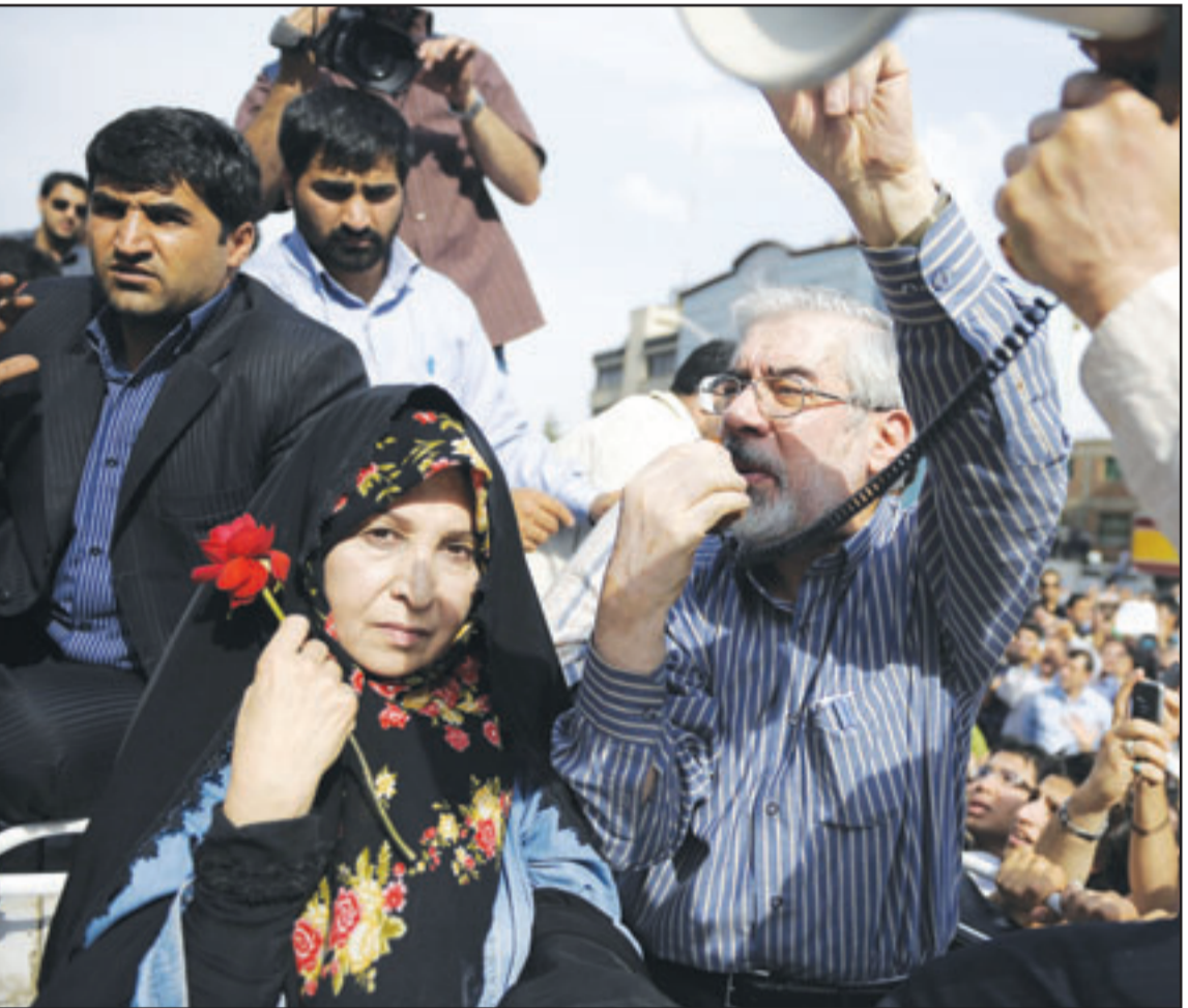
المرشح الخاسر في الانتخابات الرئاسية في إيران مير حسين موسوي وزوجته زهرة ورافينغارد يشاركان بمظاهرات طهران أمس

خرج مئات الالاف من أنصار المرشح الرئاسي مير حسين موسوي الى شوارع العاصمة الإيرانية طهران أمس الاثنين احتجاجاً على نتائج الانتخابات الرئاسية. وقتل متظاهر إيراني بالرصاص أمس واصيب العشرات مع انتهاء التظاهرة، وفق ما افاد مصدر صحافي. والمصور الذي رفض كشف اسمه، شاهد جثة رجل قتل برصاصه في الرأس امام قاعة تيليشيا اليابسج اشتعلت فيها النيران. من جهته قال مراسل لوكالة «فرانس برس» غطى التظاهرة انه سمع اطلاق نار. وقال شهود عيان المرسل انه لدى انتهاء التظاهرة فتح رجال باللباس المدني النار على متظاهرين واصابوا عددا منهم. و افاد الشهود ان مطلق النار كانوا باللباس المدني ولم يكونوا من عناصر الشرطة. ومساء الاثنين افاد مراسل «فرانس برس» ان مواجهات وقعت بين شرطيين ومتظاهرين في محيط ساحة آزادي التي انتهت فيها التظاهرة وان عشرات الاشخاص كانوا يفرون من المكان. وشارك مرشح الرئاسة الإيرانية الخاسر مير حسين موسوي المتظاهرين في مسيرة الاحتجاج، وقال موسوي أثناء مخاطبته الجماهير المحتشدة في طهران انه مستعد للمشاركة بعملية اقتراع جديد. وأضاف موسوي، الذي كان يتحدث في أول ظهور علني له منذ انتخابات يوم الجمعة الماضي، قائلا انه جرى تزوير نتائج التصويت لصالح أحمدني نجاد، التهمة التي نفاه الأخير بقوله ان الاقتراع كان «عادلاً». ووجه موسوي نداء الى نخبة رجال الدين الشيعة أخذوا عليهم صفتهم إزاء العملية الانتخابية التي قال انها تنتهك مبادئ الشريعة الإسلامية.