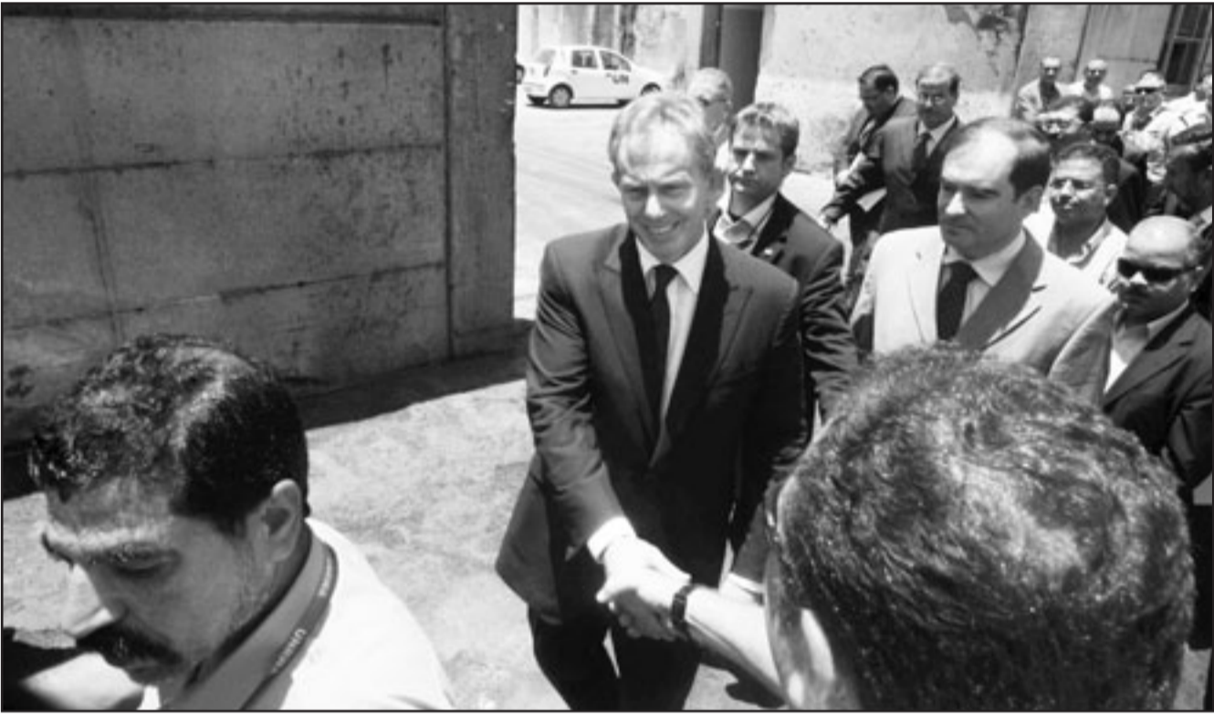
مبعوث اللجنة الرباعية للشرق الاوسط توني بلير خلال زيارته الى غزة امس