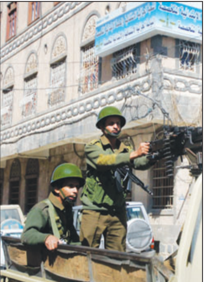
قوات يمنية تجوب شوارع صنعاء أمس

صنعا-برلين- «القدس العربي» - من خالد الحمادي وعلاء جمعة: