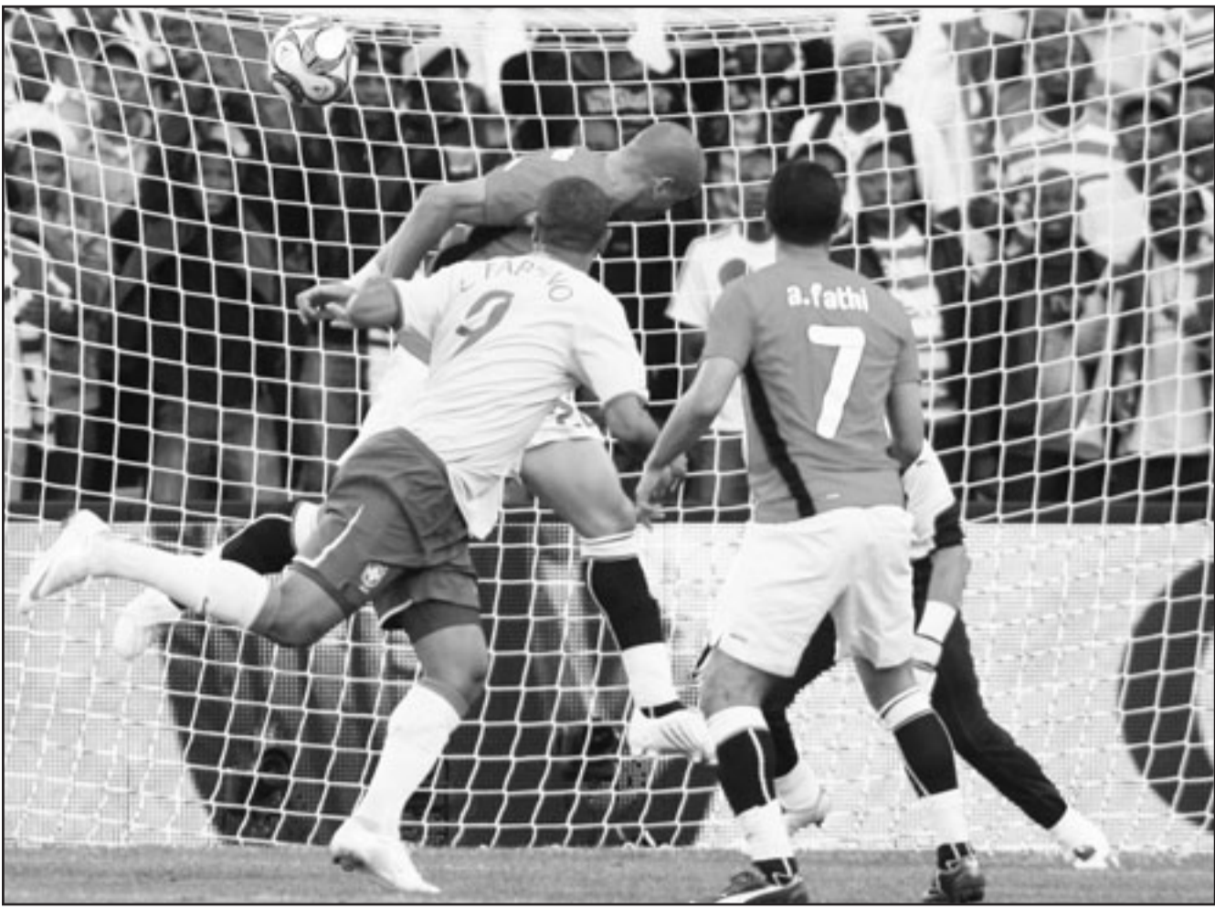
نجم البرازيل لويس فابيانو (يسار) يسدد برأسه هدفا في مرعى منتخب مصر