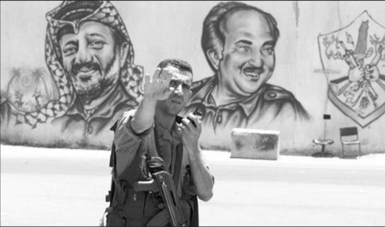
عنصر أمن من حماس في غزة ويظهر خلفه رسم للرئيس الفلسطيني الراحل ابوعمار والشهيد ابو جهاد

المستشفى الا انه فارق الحياة متأثراً بجراحه. الا ان حماس ردت على ذلك التصريح وقالت «انه توفي نتيجة التعذيب الوحشي الذي تعرض له في سجن المخابرات في الخليل». وحملت كتلة التغيير والاصلاح التابعة لحماس في المجلس التشريعي الرئيس محمود عباس والدكتور سلام فياض المسؤولية عن وفاة عمرو في سجون الاجهزة الامنية بالضفة. وطالبت الكتلة في بيان صحفي راعية الحوار مصر بتحديد موقفها من وفاة عمرو واتخاذ الموقف الذي يناسب هذا الحدث، معتبرة ان الحوار مضيق للوقت. ودعت لجنة المصالحة بين حركتي فتح وحماس عقدت اجتماعاً لها في الضفة وغزة الاحد وتم الاتفاق وفق ما اعلن على اثناء ملف الاعتقال السياسي بين الحركتين. وعلى ذلك الصعيد اعتبر مصدر قيادي في حماس وفاة عمرو فجر الاثنى عشر في سجون السلطة بالضفة الغربية هو الرد الاولي المباشر على مباحثات وفدي