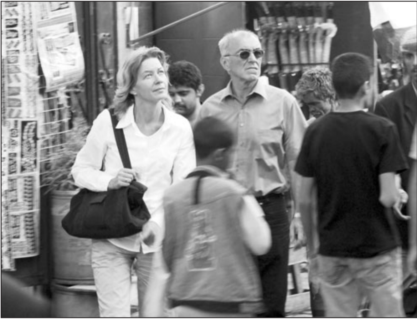
سياح اجانب في احد اسواق صنعاء امس رغم الحادث المؤسف