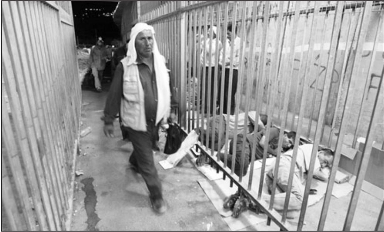
فلسطينيون يتأمون على الارض بانتظار فتح الحاجز للدخول لمدينة القدس

وقال نيبيل ابو رديئة الناطق الرسمي باسم الرئاسة، ان تصريحات نتنياهو «نستفك كل المبادرات وكل التوقعات ووضعت القيود امام كل الجهود التي تبذل»، لافتا الى انها «تشكل تحديا واضحا للموقف الفلسطيني والعربي وكذلك الامريكي».