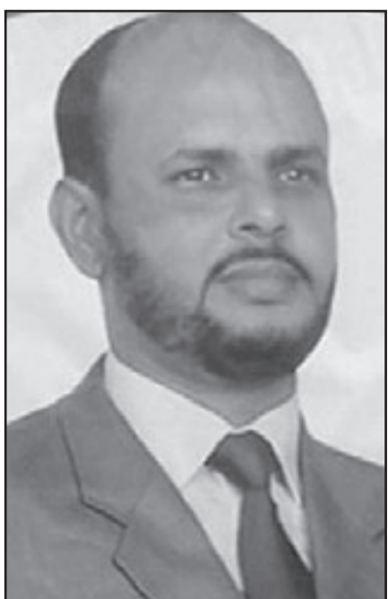
مرشح الرئاسة، الاسلامي جميل ولد منصور

ضمن القوى السياسية المشكلة لها في حملة سياسية وإعلامية ضد قادة المجلس العسكري قبل أن يوسعوا التحالف المناوئ لحكم الجيش. ويختار ولد منصور مرشحا يكون الإسلاميون قد اقروا له في العتق في الرئاسي لأول مرة بعد أن اختار خلال السنوات الماضية بالمشاركة في الانتخابات البلدية والنيابية التي أجريت في عهد ولد الشيخ عبد الله سنة 2001، وتحت سيطرة العسكريين عام 2006 حيث حصلوا على 10 مجالس محلية بينها أربع مقاطعات داخل العاصمة نواكشوط.