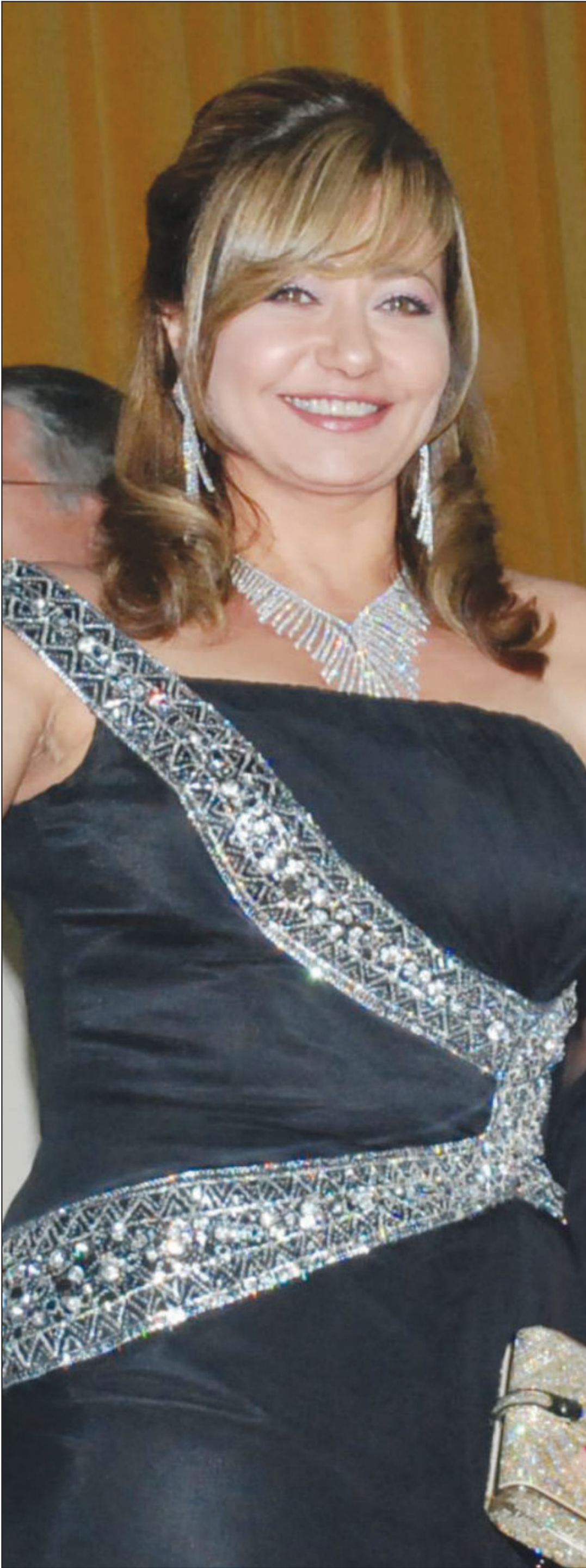
الفنانة المصرية ليلي علوي تقوم بطولته مسلسل تلفزيوني جديد بعنوان «مجنون ليلي» بشاركا بطولته الفنان خالد ابو النجا الذي يؤدي دور مريض نفسي يقع في غرام الطبيبة «ليلي».

وقالت الدمية العامة كاترين فوناندين رانسل «عاشت بالينيو باي وكاتلر باي في حالة توتر شديد طوال أسابيع بسبب قتل عدد من قططها بطريقة هيبية ويصعب التعبير عنها». وأضافت «اعتز عن تعاطفي مع ملكي هذه الحيوانات الأليفة لأنهم تكبدوا خسائر كبيرة».