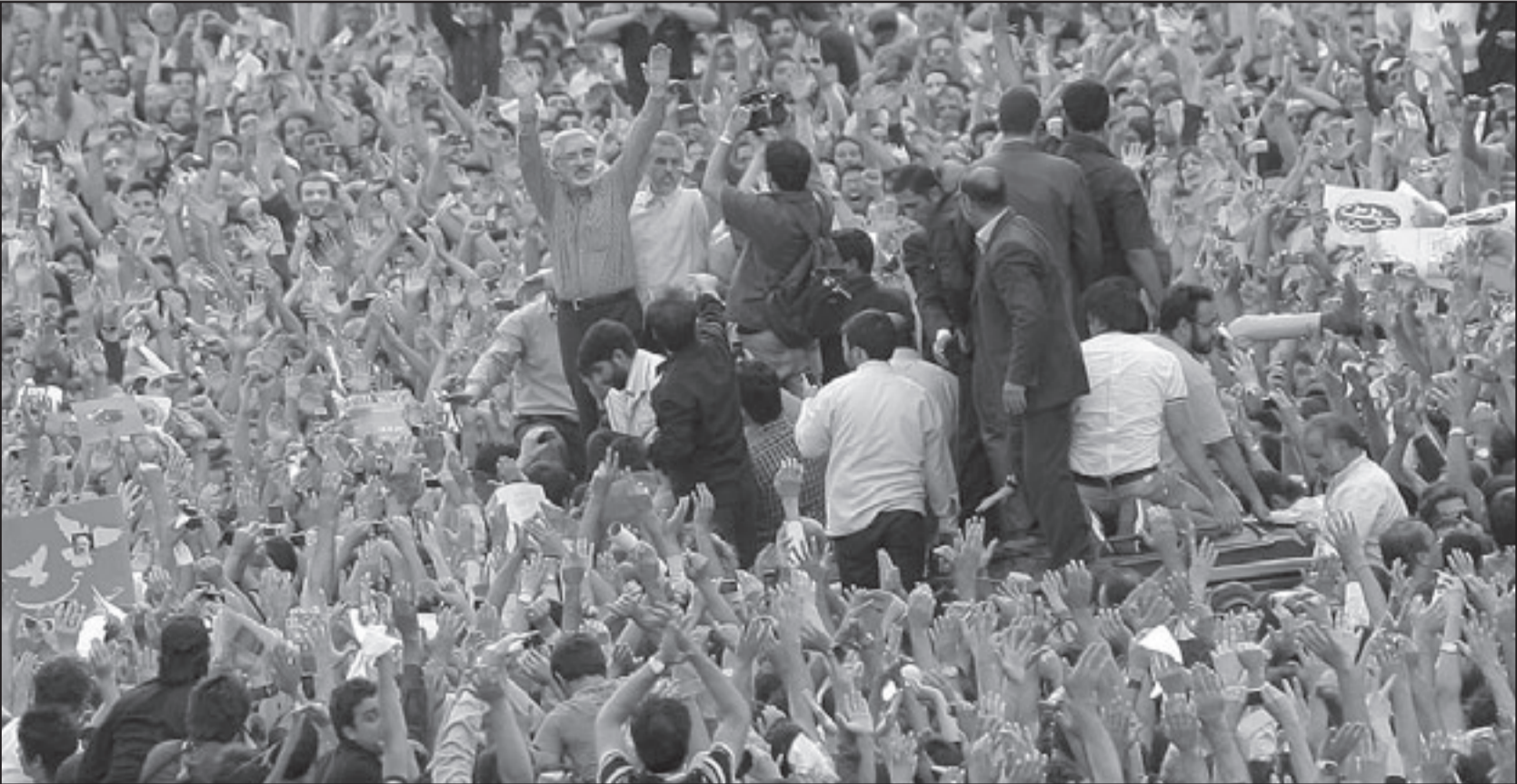
مرشح الرئاسة الإيرانية الخاسر مير حسين موسوي خلال مشاركته في التظاهرة الضخمة التي خرجت في وسط طهران امس تنديدا بنتائج الانتخابات

والاستبعاد الرئيس احمدي نجاد المشتكى في نتائج الانتخابات، وقال ان من لديه وقائع ومستندات «إن