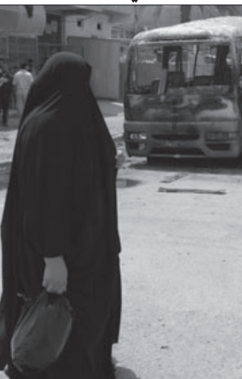
سيدة عراقية تنظر باتجاه باجاء بقايا جرح تفجيره في بغداد امس (1 ف ب)

السيارات المفخخة في عموم العراق»، لافتا إلى أن الهدف من تصعيد التدابير الأمنية في محافظته هو حماية المدنيين. وشهدت هاتان المدينتان الأحد والاثنين تدابير أمنية من بينها وضع قطع استمنية في الشوارع الرئيسية واقامة سيطرات أمنية متحركة وثابتة واغلاق المداخل الفرعية المؤدية إلى عدد من الشوارع الرئيسية. وكانت محافظة ذي قار شهدت الاربعة الماضي تفجيرا نوويا بسيارة مفخخة استهدفت سوقا شعبية بناحية الجبحاء (38 كيلومترا غرب مدينة الناصرية) ما أسفر عن مصرع 29 شخصا وإصابة 60 آخرين بجرح.