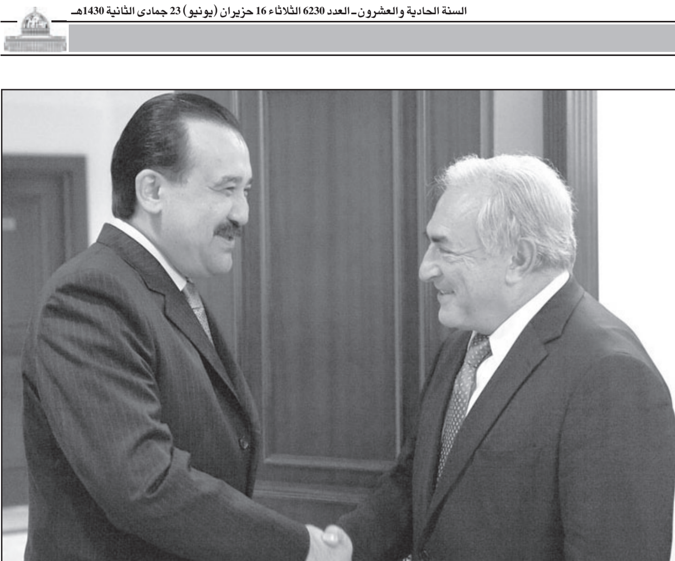
رئيس وزراء قازاخستان كريم سيميوف لدى اجتماعه مع دومينيك ستراوس كان رئيس صندوق النقد الدولي خلال زيارته الى قازاخستان