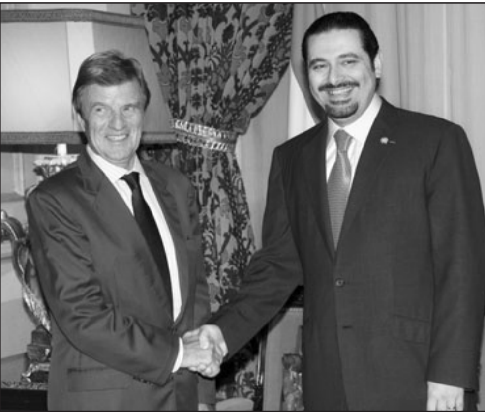
رئيس الوزراء اللبناني المكلف سعد الحريري يصافح برنار كوشنير وزير خارجية فرنسا في بيروت الجمعة

وإذ كان والذي قد دفع حياته تضحية للبنان، فأنا أيضاً أستطيع أن أضحي بنفسي من أجل وطني، وإذا لم أعمل ذلك لن أكون ابن والذي ولن أستأهل