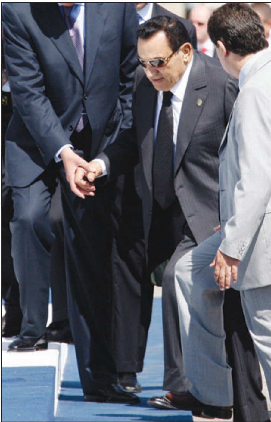
الرئيس المصري حسني مبارك خلال قمة الثماني في إيطاليا

وأضاف «انتم تعيشون داخل العالم العربي وتقومونهم وتعرفون ثقافتهم، وحين الوقت لكي تندمجوا وأن تتوقفوا عن عزلتكم». وعن القدس قال مبارك إن «الحل الصحيح هو ما تم الاتفاق عليه في نهاية ولاية الرئيس (الأمريكي الأسبق بيل) كلينتون سوية مع (رئيس الوزراء الإسرائيلي الأسبق إيهود) باراك وعرفات (الرئيس الفلسطيني الراحل ياسر عرفات)، والقدس الشريف يجب أن تكون عاصمة الدولة الفلسطينية وغرب المدينة لكم، وأنا أكرر جيدا الحل المتفق عليه لأنني كنت ضالعا فيه وأعرف أن باراك وافق مبدئياً». كذلك رفض مبارك المطلب الإسرائيلي بإجراء تعديلات على مبادرة السلام العربية، خصوصا في ما يتعلق ببناء اللاجئيين، وقال «ماذا علينا أن نعد؟ انشوا هذا الأمر فالمبادرة لينة جدا وكل شيء سيتم بالاتفاق». بشأن تبادل الأسرى وإطلاق سراح الجندي الإسرائيلي الأسير في قطاع غزة غلعاد شاليط. وقال إنه «تم تحديد عدة شروط للملقة وكنا على وشك إنهاؤها وتنفيذ المرحلة الأولى منها، لكن في اللحظة الأخيرة غيرتم رايكم فجأة وفشلت الصفقة». ورأى مبارك أنه بالإمكان استئناف المفاوضات بشأن صفقة تبادل الأسرى، «وانتهجوا أن هناك تطورات إيجابية في سلوك حماس فلا يوجد عنف ولا إطلاق صواريخ وأعلن (رئيس المكتب السياسي لحماس) خال مشعل أنه سيوافق على الاعتراف بدولة فلسطينية في حدود العام 1967 وهذا يعني اعترافا، رغم أنه ضمني، بدولة إسرائيل».