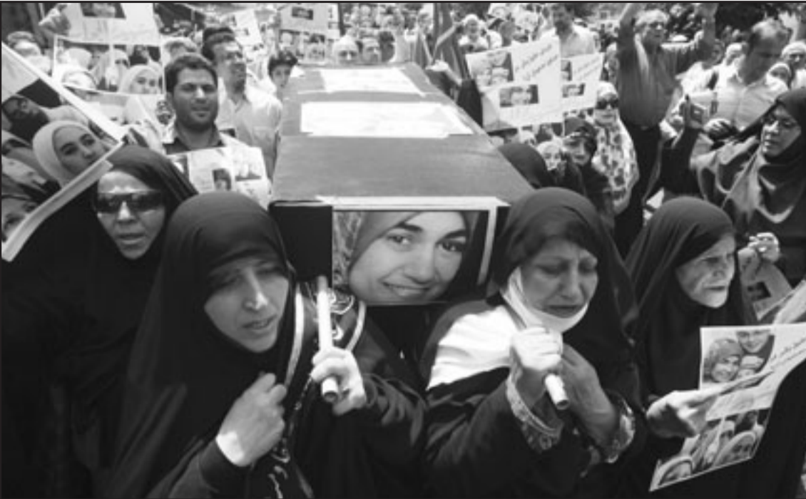
سيدات إيرانيات في جنازة تشيع رمزية الجمعة في طهران