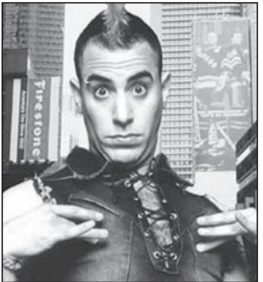
لقطة من «برونو»

فيينا - ( د ب أ): لم تهتم وسائل الإعلام النمساوية بالعرض الأول للفيلم الكوميدي المثير للجدل «برونو» الذي يقوم بطولته النجم البريطاني ساتشا بارون كوهين وتصويره لحياة نمساوي مثلي منحرف سياسيا، قدر اهتمامها بالشخصية الحقيقية التي يسرد الفيلم قصتها.