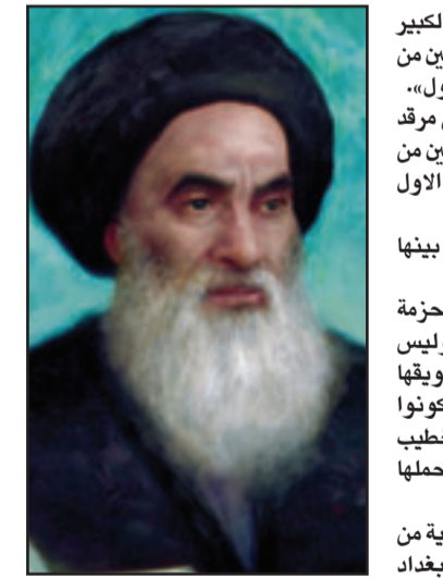
آية الله علي السيستاني

كربلاء - «القدس العربي»: حذر ممثل المرجع الشيعي الكبير آية الله على السيستاني الجمعة المسؤولين السياسيين والأمنيين من «خطورة» التفجيرات الاخيرة التي «قد تعيد البلاد الى المربع الاول» وقال رجل الدين احمد الصافي خلال خطبة صلاة الجمعة في مرقد الامام الحسين في كربلاء (110 ك جنوب بغداد) «احذر المسؤولين من ان استهداف الابرياء من طائفة معينة هدفه اعانتنا الى المربع الاول وانكنا نثار الطائفية واتار العنينة». وشهد العراق الخميس موجة من الهجمات اودت بالعشرات بينها هجومان انتحاريان في تلغفر (450 كلم شمال بغداد). وأضاف «الاستهداف في الفترة الاخيرة عمات المخفحات والاحزمة الناسفة والسداف الابرياء (...) والجميع يتحمل المسؤولية والاحزمة شخصا محمدا». وحذر من تصاعد العنف قائلا «إذا لم يتم تطويقها (التفجيرات) فقد تؤدي الى امور اخرى وعلى السياسيين ان يكونوا على قدر المسؤولية»، بدوره، انتقد الشيخ جاسم الطهيري خطيب صلاة الجمعة في مدينة الصدر، شرق بغداد، الحكومة قائلا «تحملها مسؤولية الفحرفات الاخيرة». وتفجيرات الخميس هي الاعنف منذ انسحاب القوات الامريكية من المدن في الثماني من حزيران/يونيو، وفقا للاتفاقية الامنية بين بغداد وواشنطن في تشرين الثاني/نوفمبر الماضي.