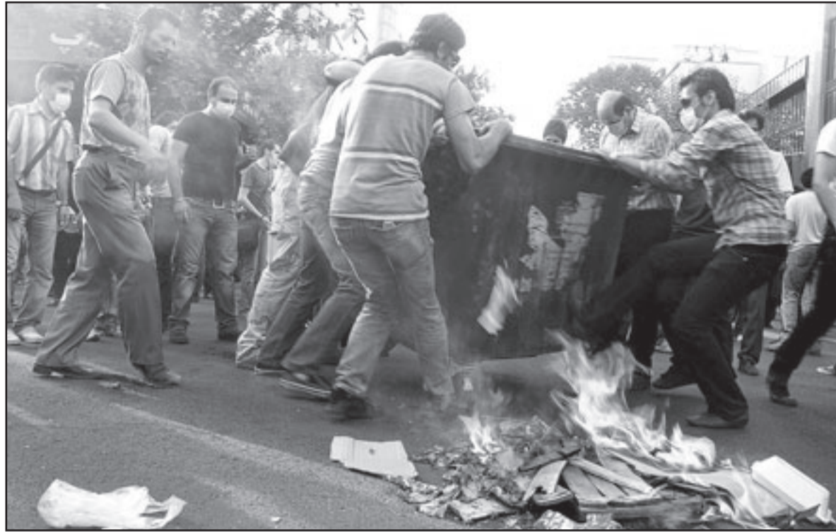
متظاهرون إيرانيون يحرقون حاوية قمامة في طهران الخميس