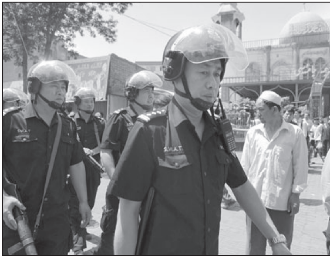
قوات مكافحة الشغب الصينية امام احد المساجد في إقليم شينجيانغ

كما أدان تيفالوت سميرينج، رئيس حزب الرضاء والعدالة الإندونيسي، أكبر أحزاب (هوياتهم) العرقية جانبا وان ويمدوا يد العون لليوغور». واندلعت أعمال الشغب بعد أن احتشد العديد من افراد طائفة الايغور للاحتجاج على مقتل اثنين منهم في مصنع في جواتونغ.