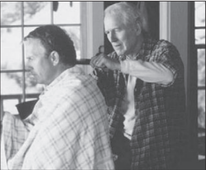
لقطة من «رسالة في زجاجة»

التماس الكهربائي بين الغادئين: «لأنها... رغم أنها ذات زوج.. قالت أنها عذراء... وأنا ماض بها إلى النور..»