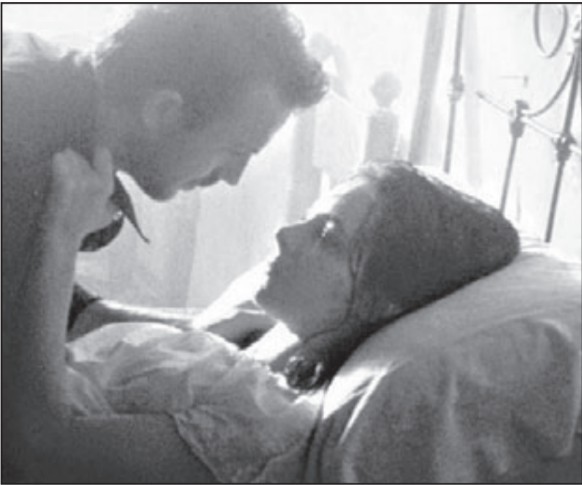
وأخرى من «انتقام»

صديقه، لكننا يوغرها كخنجر مرتد في قميص الغواية... ليقط شرارة العد التنازلي للرصاصة، فمن يقبذ الحب من رحمة الرصاص غير الموت! لم ينج أحد من الحرب - التي أضرمها رجال العجوز في كوخ كوستنر - غير الانتقام، تلك السارة التي يحتفظ بها الجندي معه كتذكاري يدل على تفاصيله وهويته، بقيت في يد القصيدة: قصيدة لوركا: الزوجة الخائنة.