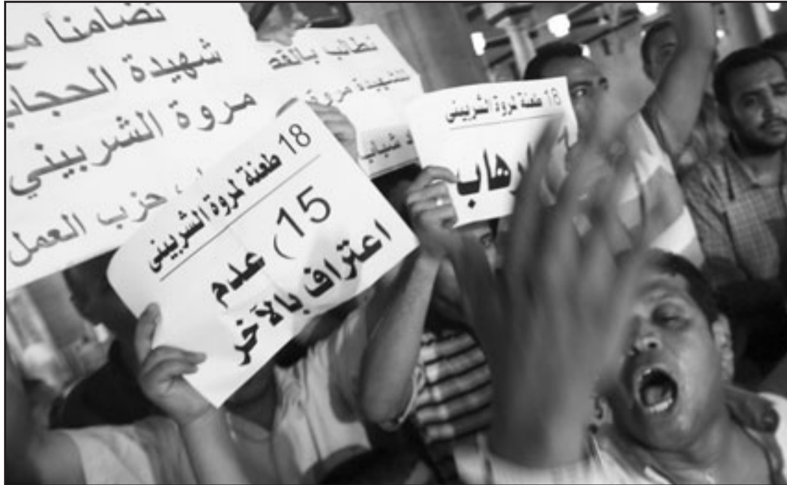
مواطنون مصريون في تظاهرات عقب صلاة الجمعة في القاهرة