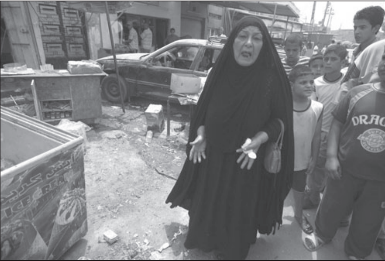
سيدة عراقية في موقع انفجار ببغداد الجمعة