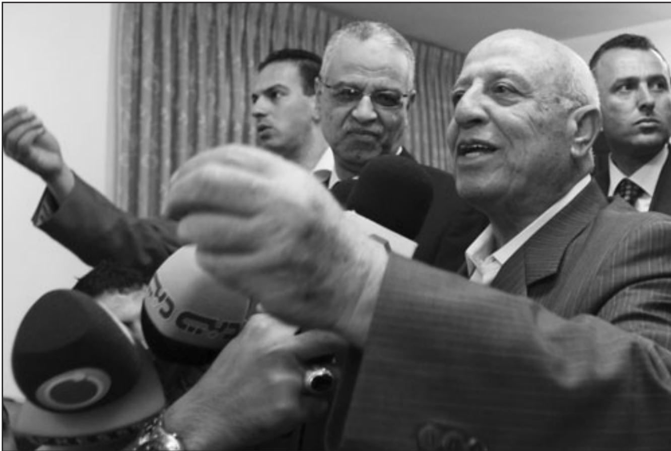
رئيس وفد فتح لمفاوضات القاهرة احمد قريع ومحمد ابراهيم (وسط) من الوفد الامني المصري يتحدثان للصحافيين في رام الله الجمعة

(يوليو) الجاري، وقال الصالحي ان الوفد المصري سيستمع لمواقف الفصائل والرئاسة الفلسطينية في محاولة لتذليل العقبات قبيل الجلسة القادمة للحوار، مع الترحيح بأن يطرح تعديلات على مهام اللجنة التي عرضت كبدل عن تشكيل حكومة التوافق الوطني، لأن اللجنة بالصيغة المطروحة لا تحظى بقبول الفصائل حتى الآن. وعن مدى تفاؤله بنجاح جلسة الحوار المقبلة في 25 تموز الجاري، قال الصالحي ان اللقاء كبير من أن يصلح استمرار الانقسام لتغلب على إدارة إنهائه، معبراً عن أمله في أن ينجح الجميع برعاية الوفد المصري في تهيئة الأجواء لإنجاح إرادة المصالحة قبل الوصول إلى حوار القاهرة القادم.