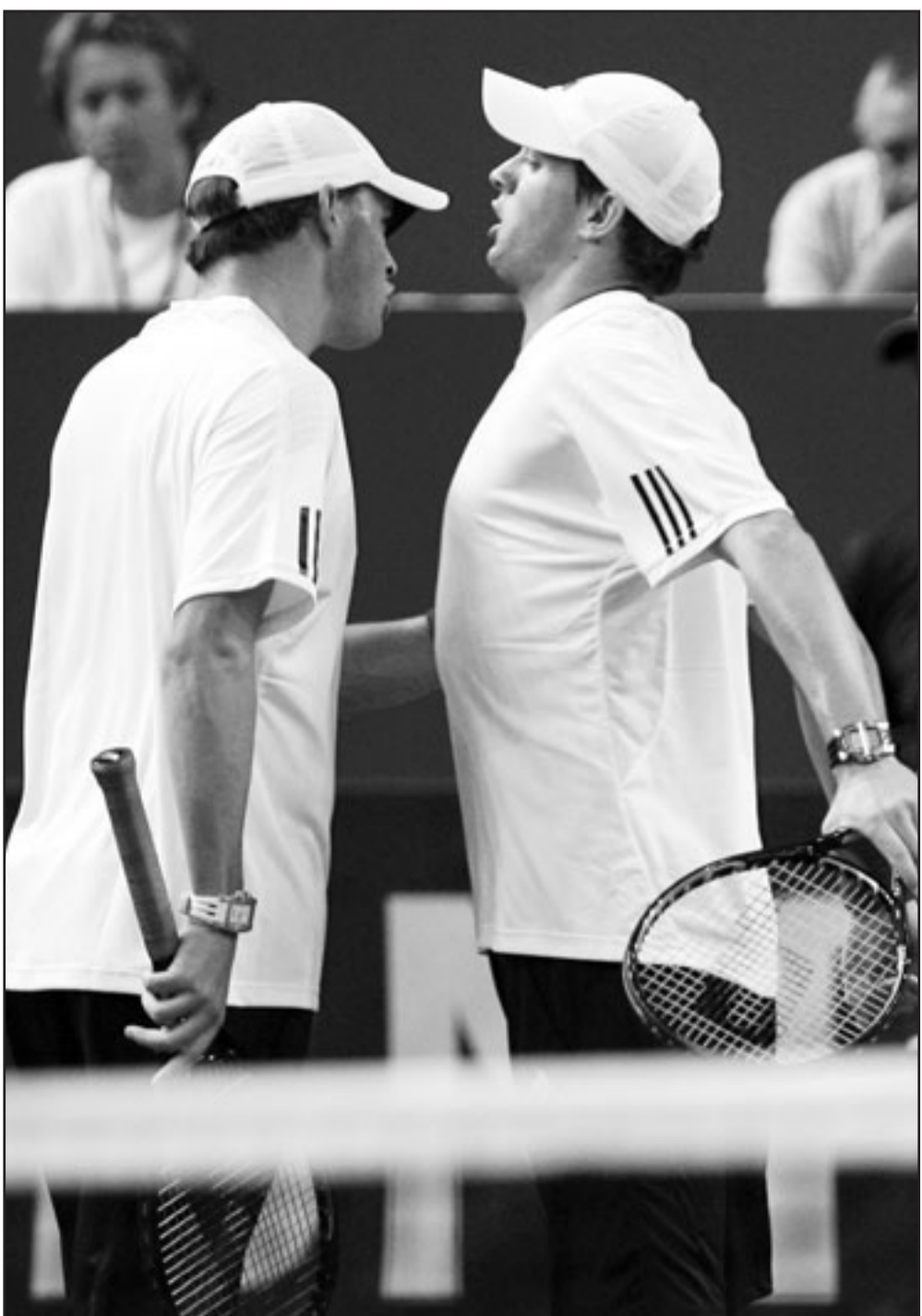
الثنائي الأمريكي التوأمن يوب ومايك برايان

وتأتي تلك الخطوة ضمانا لعدم إثارة جماهير الإسماعيلي ضد مجلس الإدارة وحتى يطمئن بالتحفظ في الأعدمة الأساسية للفريق، في الوقت الذي رفض فيه اللاعب الانضمام للاهلي رغم المحاولات المستترة التي بذلها مسؤولوه لضم اللاعب.