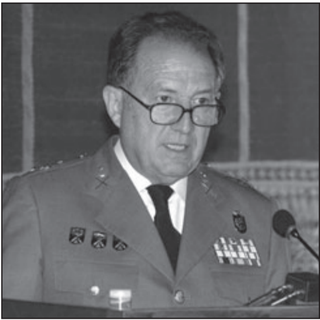
المدير الجديد للمخابرات الإسبانية الجنرال فيليكس سانس رولدان

المشتركة مع القوات المغربية وحصل على وسام عسكري ملكي من المغرب. ومن ضمن مهامه المقبلة حسب ما يدور في كواليس السياسة الإسبانية إعادة الاعتبار للمخابرات الإسبانية وزيارة المغرب لاحتواء التوتر الناتج عن طرد الضباط الثلاثة من أجل إرساء العلاقات الاقتصادية والثقافية على حساب الرؤية العسكرية التي طبعت هذا الجهاز في الماضي الذي كان يترأسه فقط جنرالات. ويبدو أن البروتو سايس اتبع نهجاً لا سيما وأن سستيو يلج على العلاقات الاقتصادية والثقافية مع المغرب غير أن مجيء جنرال قد يعيد النظرة العسكرية الضيقة إلى العلاقات الثنائية.