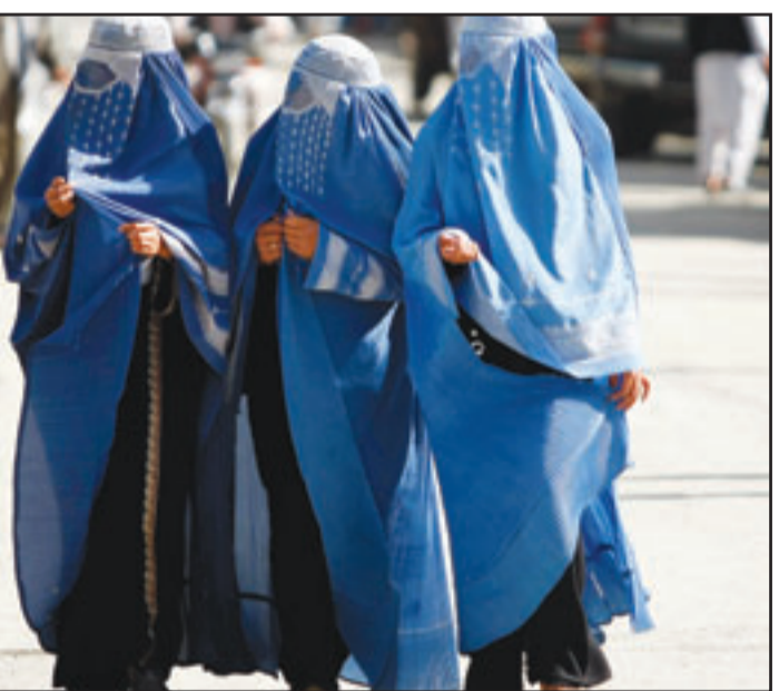
مفتيات افغانيات يسرن في مدينة بهرك في اقليم هلمند الافغاني

الارواح هذا الصيف وهو جزء مما يربدون ان تكون دفعة حاسمة للاستفادة من التعزيزات الأمريكية والسيطرة على اراض تسيطر عليها طالبان قبل الانتخابات القادمة. وانتشر براون و اعضاء حكومته في استوديوهات محطات التلفزيون ليؤكدوا للرأي العام ان الهجوم البريطاني الأمريكي الكبير على مقردي طالبان في اقليم هلمند جنوبي افغانستان يحقق نجاحا برغم عدد القتلى الكبير. وقال براون موجه كلامه مباشرة الى الجنود من خلال هيئة اذاعة القوات البريطانية «اعلم ان هذا كان صيفا صعبا حتى الآن وسيظل صيفا صعبا». و اعتبر الرئيس الأمريكي باراك اوباما المعركة التي تخوضها قوات منظمة حلف شمال الأطلسي (ناتو) في أفغانستان عنصرا هاما في الحرب ضد الإرهاب، ودعا دول الحلف العسكري إلى تبني تكتيكات مختلفة في هذا البلد بعد الانتخابات المقررة في العشرين من آب (أغسطس) المقبل. وقال اوباما في مقابلة مع شبكة «سكاى نيوز» امس الأحد «نعرف ان هذا الصيف في افغانستان سيكون صعبا وان الطريق امانا لا يزال طويلا ولذلك علينا ان نقيم الموقف بعد الانتخابات الأفغانية لنرى ما يمكننا فعله والذي قد لا يعني الجانب العسكري، بل الجانب التنموي». (تفاصيل ص 2 ورأي القدس ص 19)