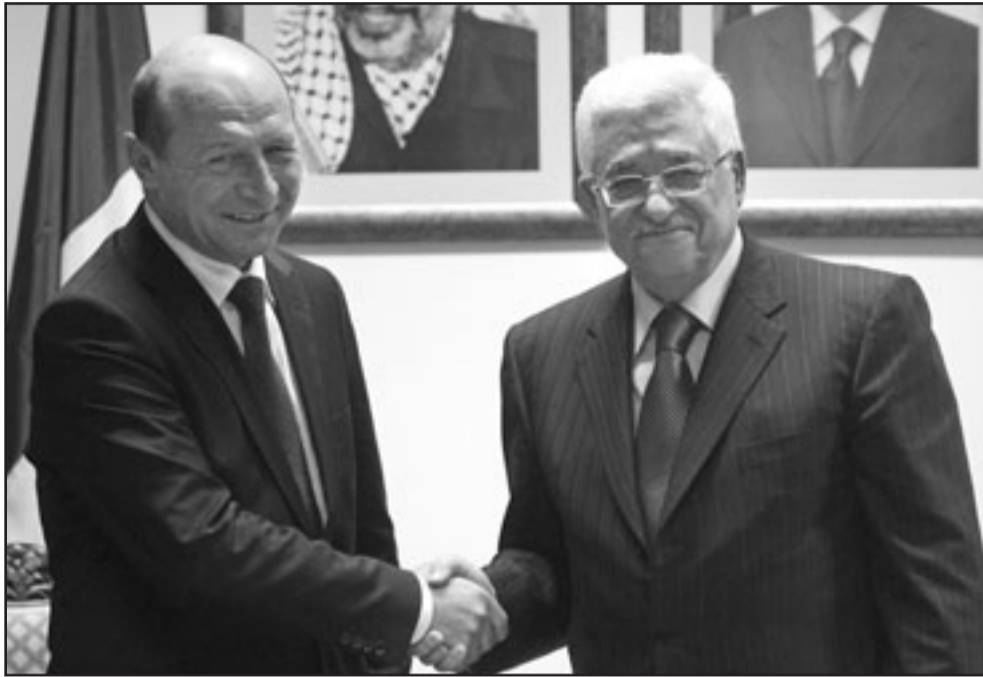
الرئيس الفلسطيني لدى استقباله نظيره الروماني في رام الله أمس