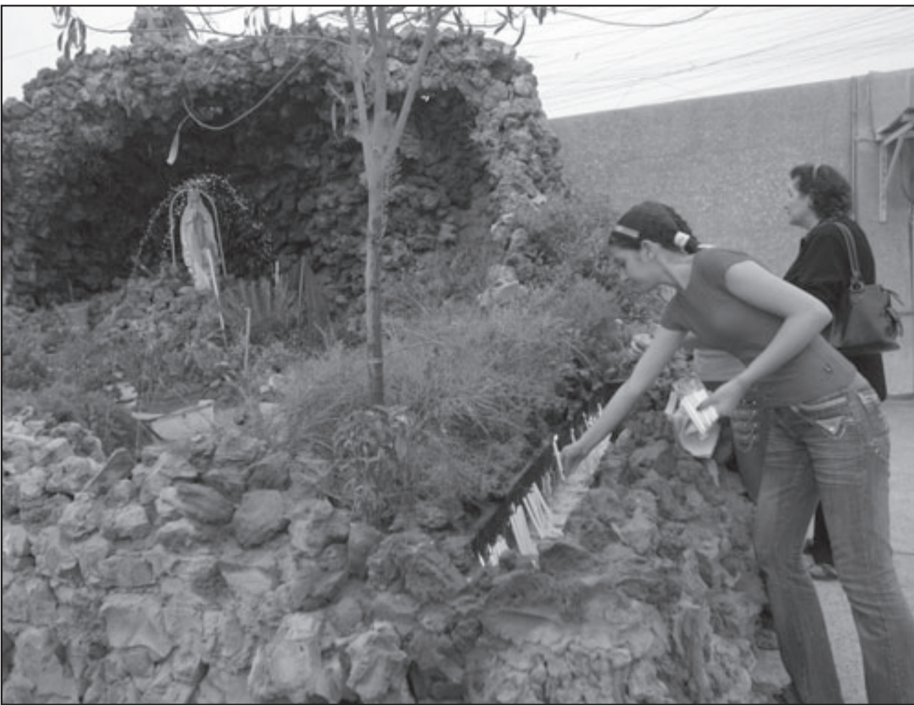
فتاة عراقية تودق الشموع في كنيسة تعرضت لهجوم في بغداد امس

اختلف النواب العراقيون بشأن اعتماد القائمة المغلقة او المفتوحة والدائرة الانتخابية الواحدة او تعدد الدوائر الانتخابية في الانتخابات المقبلة، فقد اكد التحالف الكردستاني انه مع الدائرة الانتخابية الواحدة لكل العراق. وقال النائب يوسف احمد عن التحالف الكردستاني ان التحالف مع مقترح جعل العراق دائرة انتخابية واحدة، مشددا على ان ذلك سيحل مشكلة كركوك، معتبرا ان هذا المقترح فوائدها كثيرة منها ما يخص الناحية الفنية حيث ستكون مهمة مفوضية الانتخابات سهلة، كما ان النائب المنتخب، سيمثل كل الناحية الفعلية كل العراق، اضافة الى انه سيسهم بحل مشكلة كركوك بشكل اوتوماتيكي. وأشار احمد الى ان الحوارات والجدالات بشأن كركوك تثار عندما يريد مجلس النواب تشريع قانون جديد للانتخابات، فالكتلة العربية والتركمانية في كركوك تريد توزيع المقاعد في مجلس المحافظة وبشكل متساو اي 4 مقاعد للاكراد و4 للعراب و4 للتركمان، والتحالف الكردستاني يريد ذلك ويريد اجراء الانتخابات في كركوك كسائر المحافظات الاخرى. كما ان النائب ليلي الخفاجي عن الائتلاف العراقي الموحد اكد على ان اغلب الكتل البرلمانية تؤيد اعتماد القائمة المفتوحة ونظام الدوائر المتعددة في قانون الانتخابات الجديد. ووضحت الخفاجي ان سبب الميل الى النظام القائمة المفتوحة هو