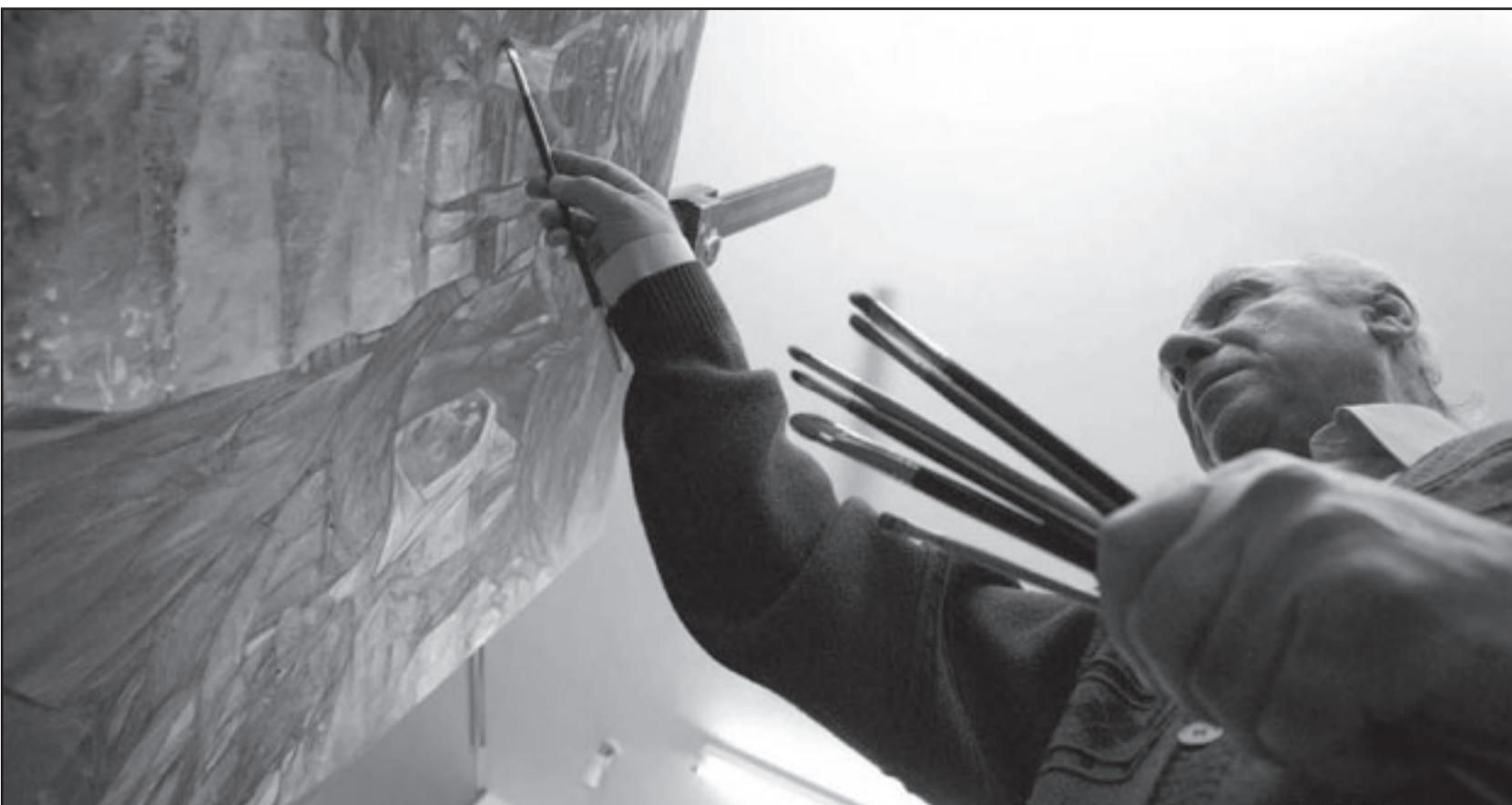
الغنان في رسمه