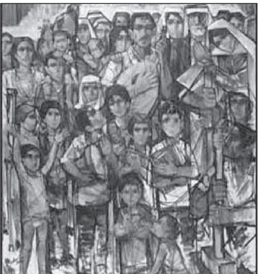
لوحة الانتفاضة الفلسطينية

من كلامي أنني أدافع عن راية أو عن قبيلة، فهذا ليس غايتي هنا. لقد لاحظت على الأستاذ عبده وازن نزعة أصولية في محاولته إثبات بعض الأحكام التي لا تعتمد أمام التحليل العلمي، من قبيل تأكيد بنوع من الوثوقية التي لا يساورها أدنى شك أن «البرتغالية لا تشبه الإسبانية» بتأناه (لاحظوا معي بتاتا) عزيزي أستاذ وازن ... أظن أنه ينبغي لك