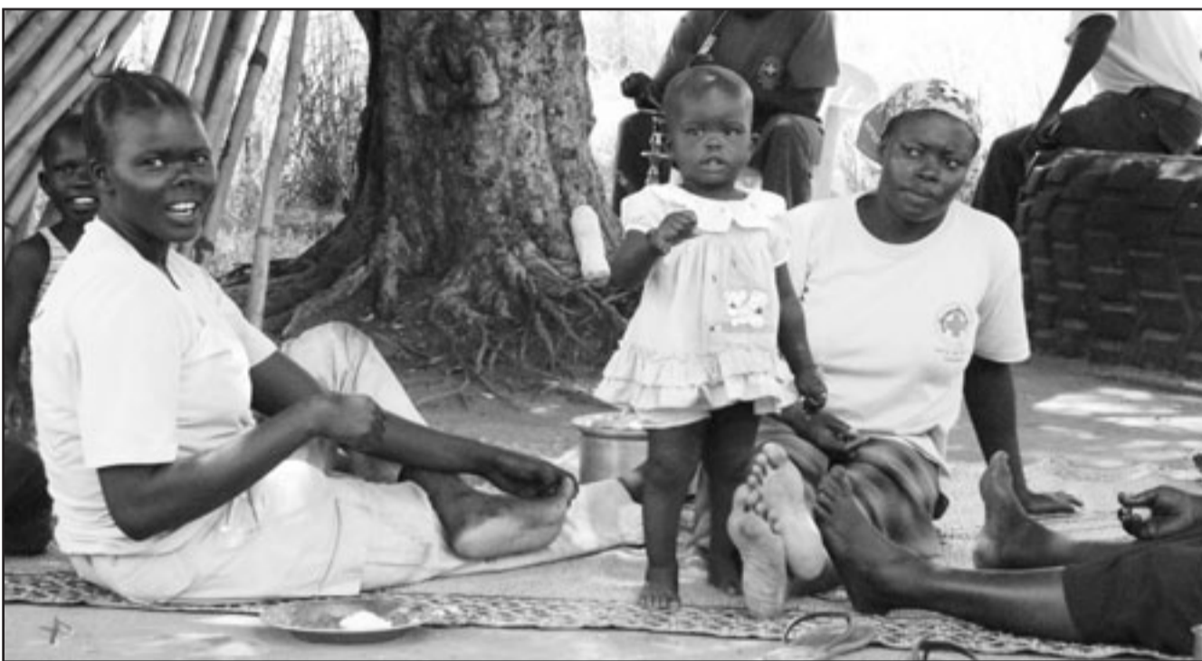
علامات مناجم سودانيات خلال استراحة من عملهن في معسكر وسط اثيوبيا حيث من غير الشائع ان تقوم النساء بالعمل في المناجم. وتقول العلامات انهن يواجهن صعوبة في تغيير نظرة المجتمع الى المهنة التي يقمن بها حيث ظلت هذه المهنة حكرًا على الرجال طيلة قرون.