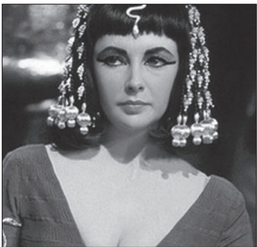
إليزابيث تايلور فى لقطة من فيلم «كليبواترا».

■ القاهرة - (رويترز): تنظم الدورة الخامسة والعشرون لمهرجان الإسكندرية السينمائي فى اب (أغسطس) القادم برنامجاً عنوانه (الإسكندرية فى عيون الكابريا) تعرض فيه الأفلام المصرية والأجنبية التي صورت فى المدينة الساحلية التي يطلق عليها عروس البحر المتوسط إضافة إلى إصدار موسوعة عن هذه الأفلام. وقالت إدارة المهرجان فى بيان إن المهرجان الذي سيفتح فى الرابع من اب/ أغسطس سيصدر «موسوعة تضم كل الأفلام المصرية والعالية التي صورت أو دارت أحداثها فى الإسكندرية». ومن الأفلام التي ستعرض ضمن هذا البرنامج (السمان والخريف) عن رواية نجيب محفوظ الحائز على جائزة نوبل فى الآداب عام 1988 و(صراع فى الميناء) ليوسف شاهين و(الصعاليك) لداود عبد السيد و(البحر بيضك ليه) لحمد كامل القليوبي و(بلطية العايمة) إضافة إلى أفلام أجنبية هي (الإسكندر) و(الإسكندر المقدوني) و(ابن كليبواترا) و(كليبواترا) بطولة إليزابيث تايلور وريتشارد بيرتون. وقال البيان إن الفيلم الأمريكي (كليبواترا) الذي أنتج عام 1963 «أفضل فيلم عالمي كانت فيه مدينة الإسكندرية محورا لأحداثه.. وتعد إليزابيث تايلور أول ممثلة تحصل فى ذلك الوقت على مليون دولار كأجر كما نال الفيلم أربعة جوائز فى مسابقة الأوسكار.