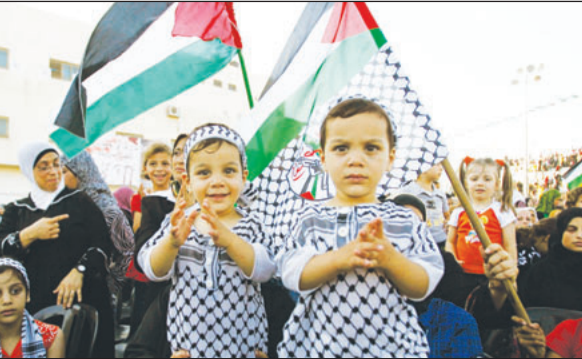
طلتان فلسطينيتان تشاركان بمظاهرة دعم للرئيس الفلسطيني محمود عباس في مدينة قلقيلية