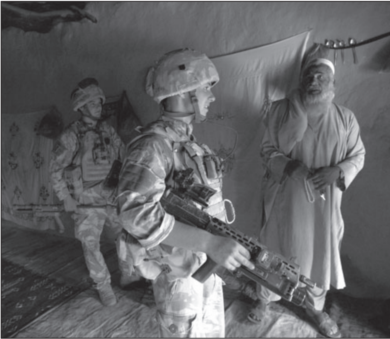
جنديان بريطانيان يقومان بتفتيش منزل رجل افغاني مسن في منطقة هلمند

واضاف «هناك حاجة لتبني استراتيجيات جديدة لبناء الجسور مع المجتمع الأفغاني بعد اجراء الانتخابات الرئاسية على الرغم من أن هذا الصنف في أفغانستان سيكون صعبا وان الطريق أمامنا لا يزال طويلا ولذلك علينا أن نقيم الموقف بعد الانتخابات الأفغانية لنرى ما يمكننا فعله والذي قد لا يعني الجانب العسكري، بل الجانب التنموي».