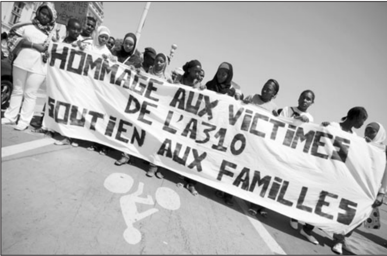
بعض اقارب ضحايا الطائرة المنكوبة خلال تظاهرة صامتة في نيس (جنوب فرنسا) امس