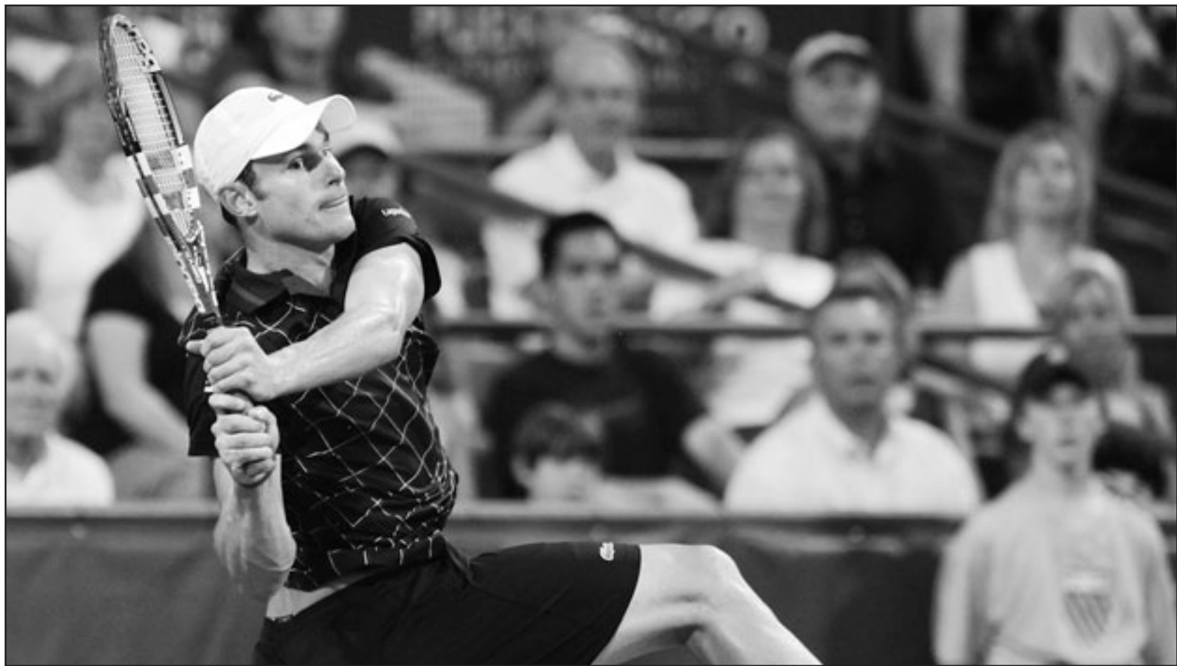
الأمريكي أندي روديك

مسيرته الناجحة التي حقق فيها 23 فوزاً متتالياً في تموز/يوليو وأب/أغسطس من العام الماضي.