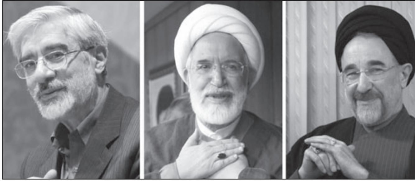
من اليمين محمد خاتمي ومهدي كروبي ومير حسين موسوي الذين دعا قائد رفيع في الحرس الثوري الإيراني الى محاكمتهم أمس

■ عواصم-وكالات: دعا قائد رفيع في الحرس الثوري الإيراني أمس الأحد إلى «محاكمة ومعاقبة» الرئيس الاصلاحى السابق محمد خاتمي ومرشحي المعارضة الى الانتخابات مير حسين موسوي ومهدي كروبي، وروهم في الاحتجاجات التي أعقبت الانتخابات الرئاسية في 12 حزيران (يونيو). وتحدث يد الله جواني قائد المكتب السياسي في هذه القوة النخبوية في النظام عن مؤامرة حيكمت بهدف قيام «ثورة مخملية» ضد الجمهورية الاسلامية. وقال جواني في مقال نشرته اسبوعية صبح صادق التي يصدرها المكتب السياسي في الحرس الثوري «ما هو دور خاتمي وموسوي وكروبي (...) في هذا الانقلاب؟ إن كانوا مؤامرين، وهذا هو الواقع، فعلى مسؤولي القضاء والامن توقيفهم ومحاكمتهم ومعاقبتهم لاحكام نيران هذه المؤامرة». كذلك دعا مسؤول عسكري اخر الى اتخاذ اجراءات بحق «قادة المؤامرة». وأفادت وكالة الأنباء الرسمية (ايرنا) ان الجنرال مسعود جزائري