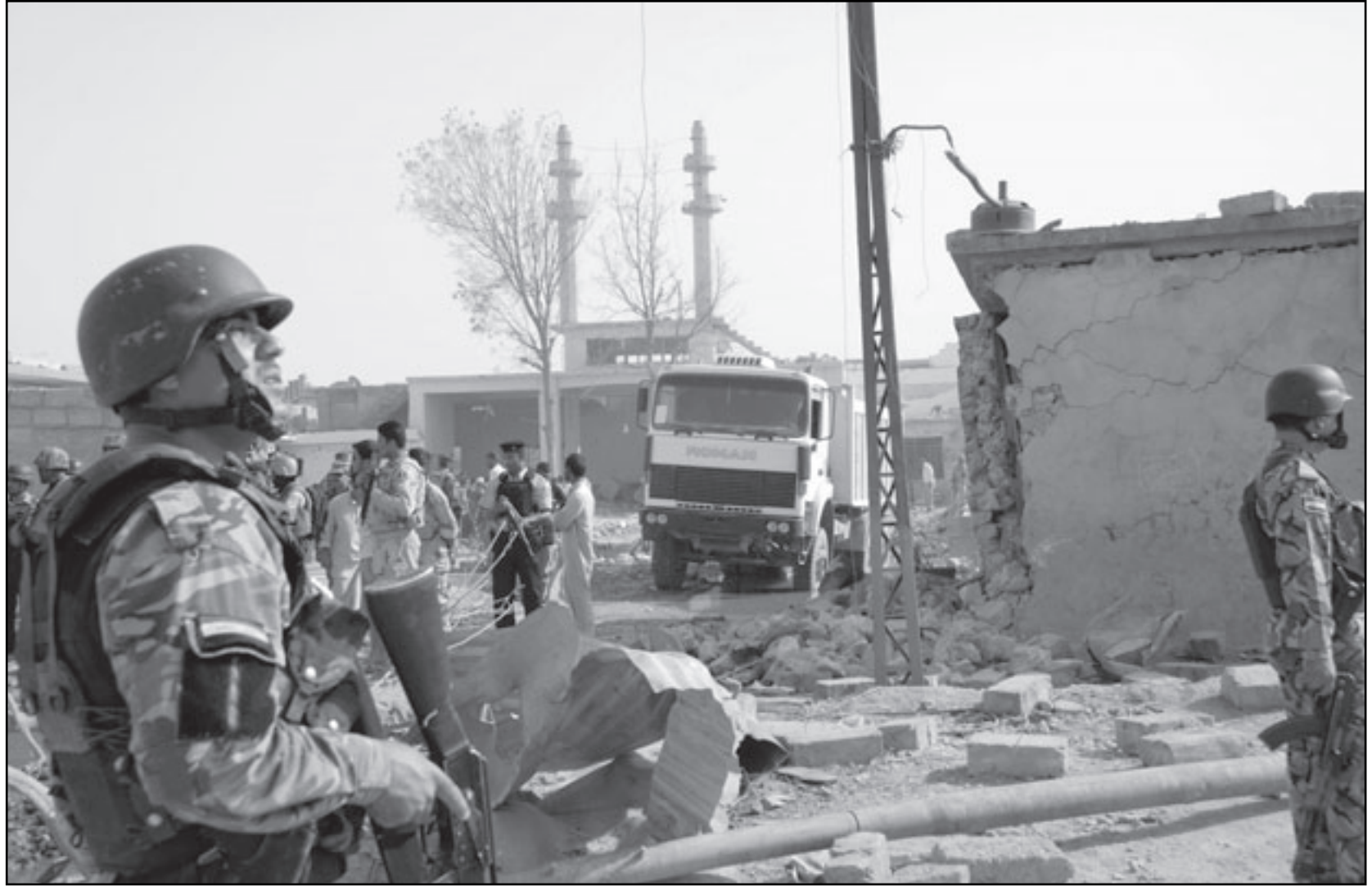
جندي عراقي في موقع انفجار بمدينة الموصل امس

و أوضح المصدر ان اجتماعات الكتل المؤسسة قد انتهت المسودة الأولية