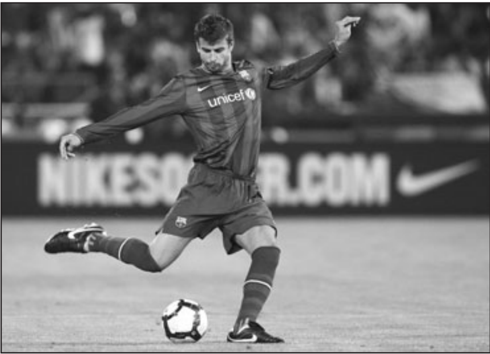
لاعب برشلونة غيراد بيكيو

وحقق موناكو فوزاً صعباً على ضيفه تولوز بهدف وحيد سجله البرازيلي اندرسون نينه في الدقيقة 44. وانتزع نيس فوزاً ثميناً من مضيفة سانت اتيان بهدفين نظيفين سجلهما الناف المالي سامي تراوري (39) ولويك ريمي (88). وحذا سوشو حذو نيس واقتنص بثوره 3 نقاط ثمينة من مضيفة سوشو بهدف وحيد سجله التشيكي فاسلاف سفيركوس في الدقيقة 41.