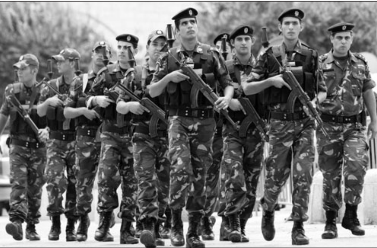
استنفاث امني فلسطيني قرب ساحة المهدي

في اطار التعاطف والتضامن مع اعضاء المؤتمر في قطاع غزّة الذين منعتهم حركة حماس من مغادرة القطاع للمشاركة في المؤتمر. وتمت تسوية تلك القضية من خلال الاتفاق في حركة فتح ان يشارك هؤلاء الاعضاء وترشيحا وتصويتا من خلال وسائل الاتصال الحديثة ضمن آلية التصويت عن بعد. وفي ذلك الاتجاه عملت «القدس العربي» من مصادر رفيعة المستوى بدخل حركة فتح بأن قسما كبيرا من اعضاء غزّة صوتوا الليلة قبل الماضية على اعضاء المركزية والثوري. وحسب المصادر فان اغلبيية من اعضاء المؤتمر بقطاع غزّة ادلوا باصواتهم الليلة قبل الماضية بفتح ان اغلق باب الترشيح وتقديم الطعونات واغلاق باب الانسحاب. وأشارت المصادر بأن عملية الانتخابات لم تبدأ في بيت لحم عصر الاحد الا بعد ان شارك معظم اعضاء غزّة الذين منعتهم حماس في عملية الانتخابات من خلال وسائل الاتصال الحديثة على حد قول المصادر. ومن المقرر ان ينتخب المؤتمر السادس لفتح 80 عضوا للمجلس الثوري، و18 عضوا للجنة المركزية، إضافة للرئيس محمود عباس الذي انتخب قائدا عاما للحركة بالاجماع السبت. وحسب النظم الداخلي المعدل لحركة فتح تقوم اللجنة المركزية بتعيين 4 اعضاء للمركزية في اول اجتماع لها، ليصل عدد اعضائها إلى 23 عضوا، ويتم تعيين 25 عضوا آخر في اول اجتماع للثوري ليصل مجموع اعضائه إلى 128 عضوا. وفي ظل التزامه الشديد على الترشح لعضوية الاطراف القبلية لحركة فتح قرر بعض كوادر الحركة الانسحاب حيث اعلن صلاح التعمري عضو المجلس الثوري سحب ترشيحه من عضوية المركزية في حين اعلن صخر سبسيو