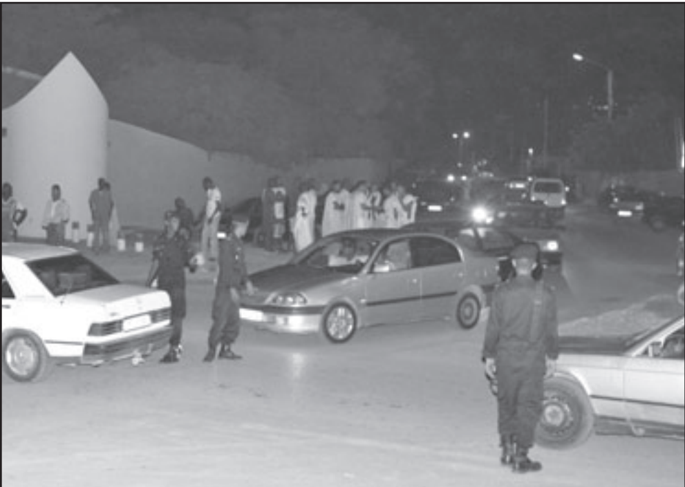
مسرح العملية الانتحارية بعد لحظات من وقوعها

عمية، وكان الأمر يتعلق بمحاربة عصابة من لصوص الحق العام وقطاع الطرق، لا بمحاربة حملة أفكار وقعا كما هو الواقع. وتأتي حادثة التفجير هذه في ظل مواجهة عسكرية وأمنية شرسة يخوضها الجيش المالي منذ حزيران/يونيو الماضي، بدعم من الدول الغربية، ضد نشطاء تنظيم القاعدة، وسبق للرئيس المالي آمادو توماني توري أن أعلن أن الجزائر وليبيا ومالي ستضع مكائباتها العسكرية والاستخباراتية لمكافحة تنظيم القاعدة الذي يهدد أمن منطقة الساحل والصحراء كما قال. ووجه تنظيم القاعدة رسالة للرئيس توماني توري جاء فيها ما نصه «تعلنون جيدا أنه ليس لنا حاجة في حركم، وأنتم في غنى عن فوض حرب بالوكالة ضدنا فتمزقنا نساءكم ويترجم أو لا يترجم» إلا بدافعا عن حقوق الصليبيين من قلعة إخواننا المسلمين في فلسطين والعراق وأفغانستان. فحنن ندعوكم أن نتأول بانفسكم عن حربنا فدافعا منكم عن الصليبيين، فحنن ما تعرضنا لكم سابقا إلا بعد أسركم لإخواننا وعدواتكم علينا».