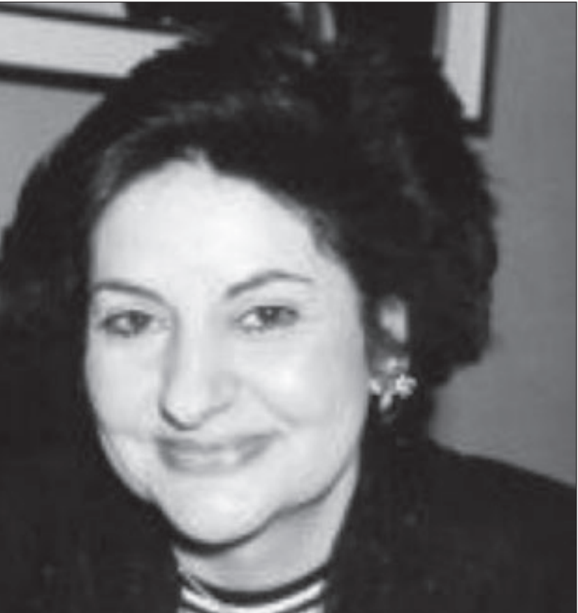
دانيال بارنبويم

■ أ.ف.ب. - أ.ف.ب. تلقف وجهات نظر الآخر عن طريق «الاحترام»، «الفضول»، هذا هو منطق التعايش الذي ينادي به قائد الأوركسترا دانيال بارنبويم أمام أعضاء ديوان الشرق والغرب الذي يضم موسيقيين عرباً وإسرائيليين. ويقول قائد الأوركسترا لوكالة الصحافة الفرنسية (فرانس برس): «من «مقر بيلاس» (جنوب إسبانيا)، حيث يتنم 103 موسيقيين تمهيداً لبدء جولة أوروبية بمناسبة الذكرى العاشرة لإطلاق الفرقة، «لا تتدنى الأوركسترا خطأ سياسياً مشتركاً، وإنما تضم عشرة آلاف رأي سياسي». في العام 1999 أسس دانيال بارنبويم الذي ولد في بوينوس آيريس لوالدين يهوديين من أصول روسية، بالاشتراك مع أستاذ الآداب المقارن الفلسطيني إدوارد سعيد الذي توفي في العام 2003، أوركسترا تضم مجموعة من الشباب العرب والإسرائيليين بغية التقريب بينهم عن طريق الموسيقى الكلاسيكية. ويضيف «في إطار هذا المشروع، يحق لجميع التعبير عن رأيهم، لا نتوقع أن نفتتح بوجهات نظر الآخر. لكن أن يفتح كل شخص بفضول للاهتمام بمنطق وجهة النظر المختلفة». بالنسبة إلى «المايسترو» كما يسميه الموسيقيون العاملون معه يمر «أساس كل شيء» من طريق واحدة وهي أن «يفهم كل شخص أن فكر الآخر يستند إلى منطق خاص، وينبغي له احترامه». ولا تخلو بيوميات الأوركسترا من مشادة صاخبة