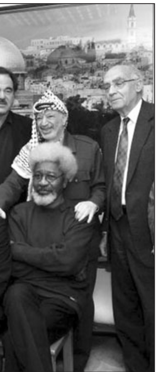
بقي ان أقول لك... بأن من توهوا بأنك كنت تحبهم وتسوط حق حصصهم من الشهرة.. هو الآن طليقون لكنهم اكتشفوا بعد عام واحد من غيابك أنك ضروري لهم لأنك مشجب عجزهم، وقد ينتحرون عقليا أو شعريا مثلما فعل بعض ديستوفسكي الذي كان يتدرب بمرض امه كي يؤجل ما لديه من ابداع...