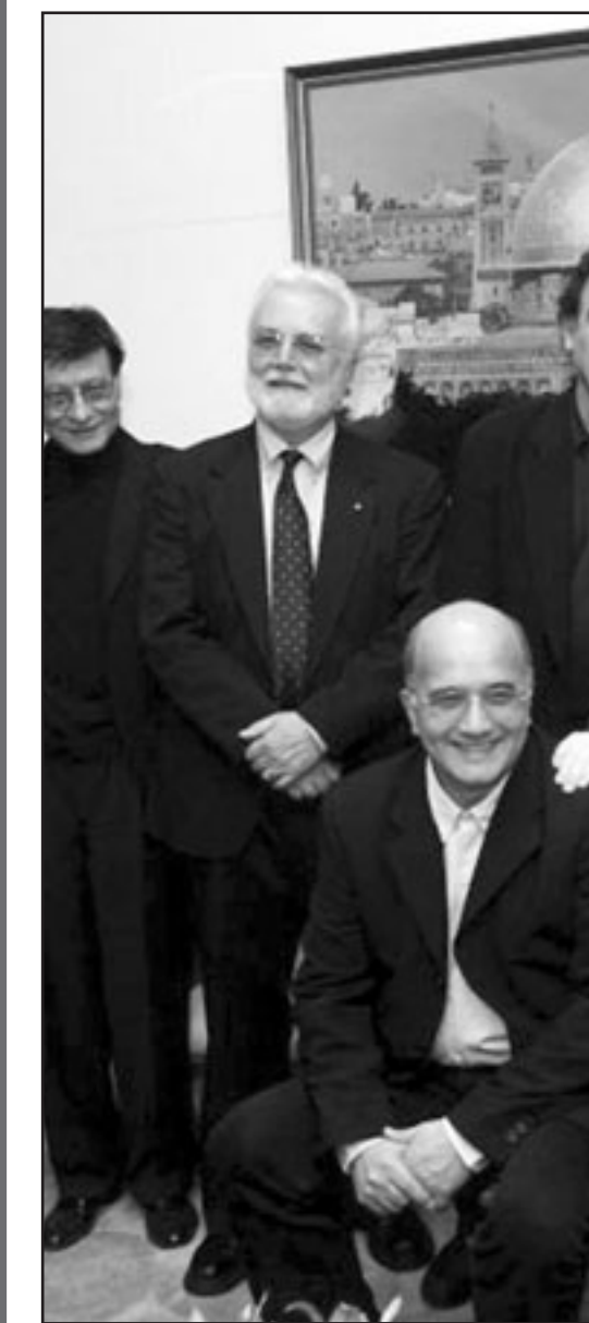
الغياب قد مكنت في النخاع، منذ سمعت صوت نبيل في الهافت يقول لي بصوت مسبلول ان موعنا قد تأجل الى الأبد، وأنك اعترت عن، رغم أنك لا تعتذر عما فعلت وان كنت ستعتذر حتما لنفسك عما كتب باسمك وبأصابع تحول الناي الى شعبان...

لها ان درويش يدفع قصيدته بأبعاد جمالية وإنسانية تتجاوز الحالة الفلسطينية، وإن انطلقت منها كمنطق ارتكاز، وبذلك يقيم جسراً ما بين القارئ والشعر، أي ما بين قارئ فلسطيني تحديداً، هو شريحة من القارئ كومي، وشعر هو واحد من فنون، تتجاوز المنطق السياسي، ولا تؤدي وظيفة المنبر لتروج ايدولوجية ما، وعلى ما يبدو، فإن الأمر يعكس شيئين أساسيين في بسبوكولوجيا الشاعر تحديداً، وهما: الوعي المبكر للمآزق السياسي ببعده الديغرافى،