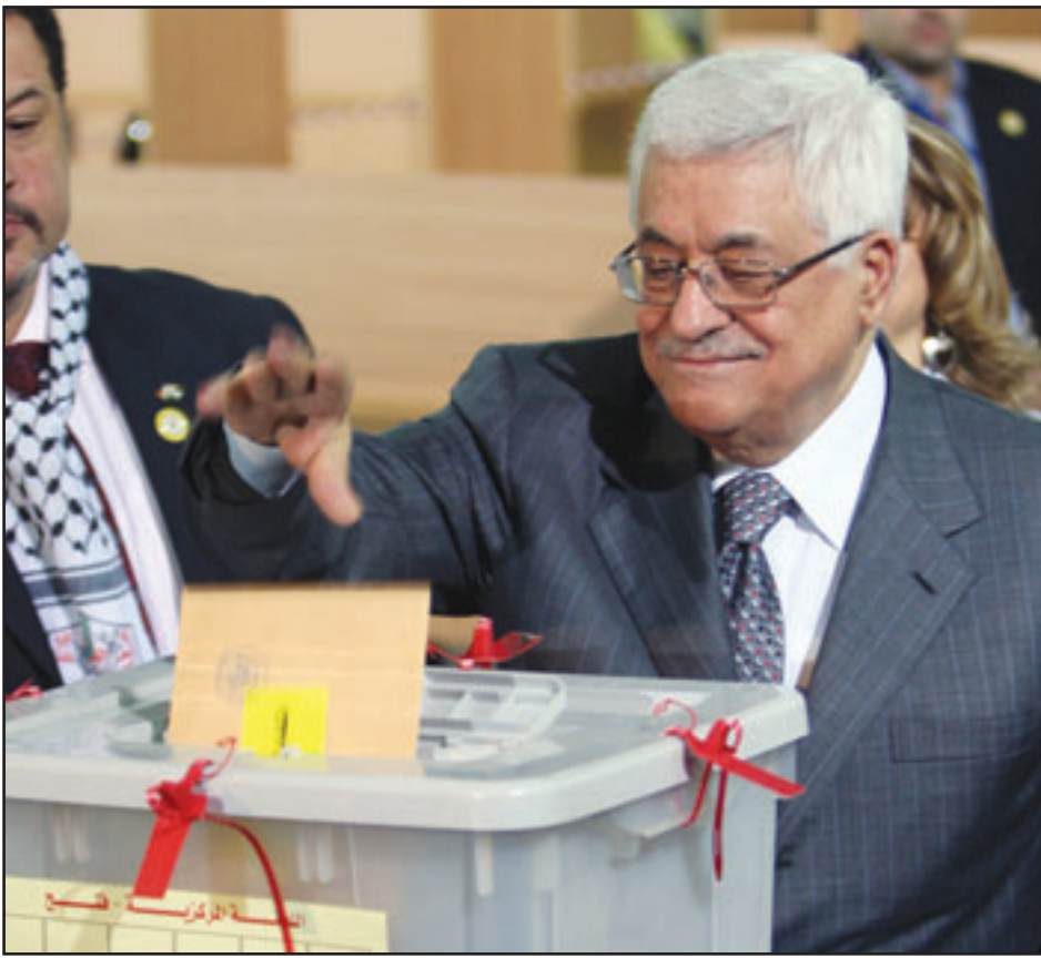
الرئيس الفلسطيني محمود عباس يدلي بصوته في انتخابات قيادة فتح أمس