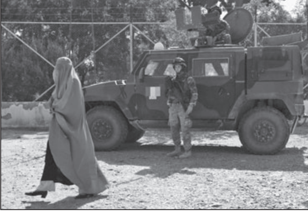
امرأة أفغانية تمر من امام آلية عسكرية لجنود دولين قبيل الانتخابات الرئاسية أمس