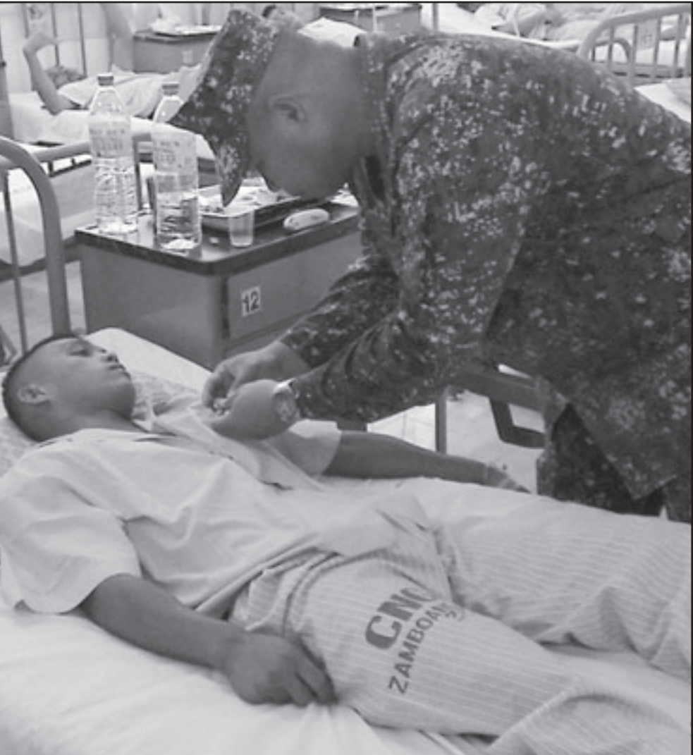
احد جرحى الجيش الفلبيني يتلقى العلاج في المستشفى أمس

يذكر أن أكثر من 10 ألف شخص من انصار سيلايا قدم معهم سيورا على الاقدام من شرق ووسط البلاد إلى العاصمة قد تظاهروا بالعودة والانتلاء وصولا إلى مقربة من القصر الجمهوري وعلى رأسهم ابنة سيلايا، هورتانسيا.