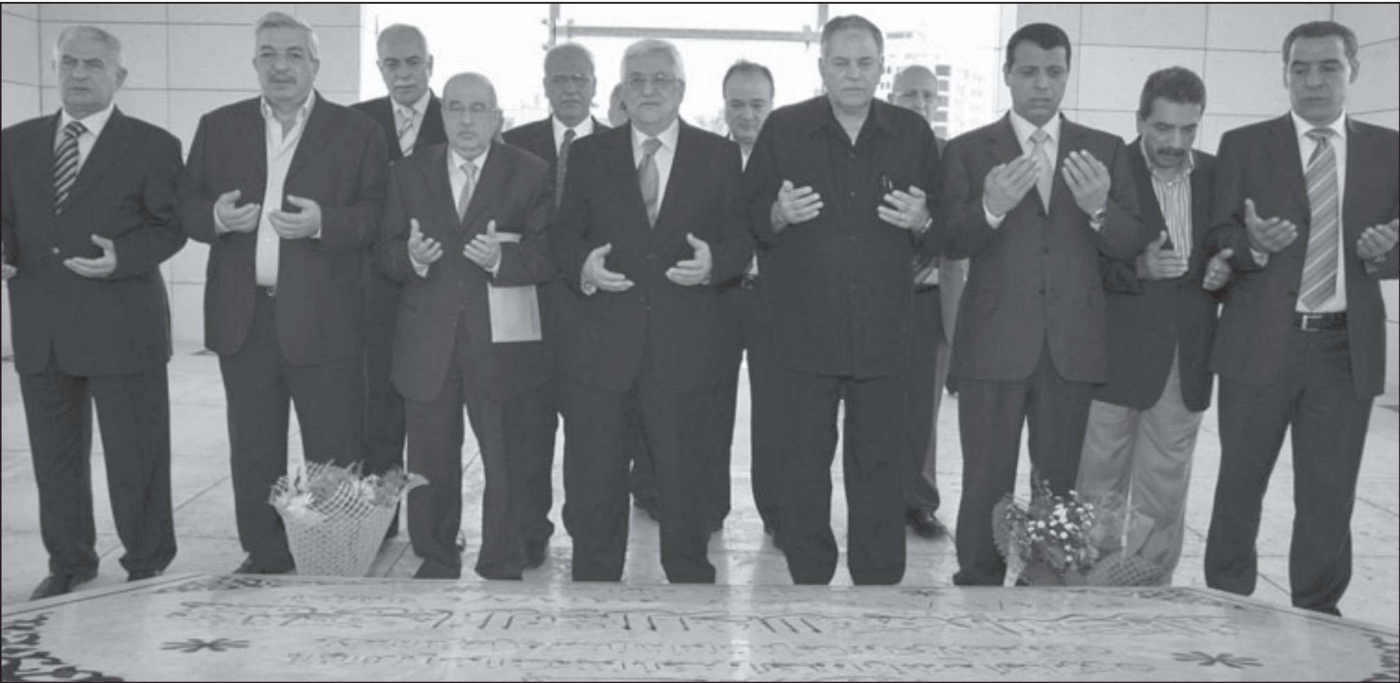
اعضاء اللجنة المركزية الجديدة يقرأون الفاتحة على ضريح الرئيس الفلسطيني الراحل ياسر عرفات في رام الله