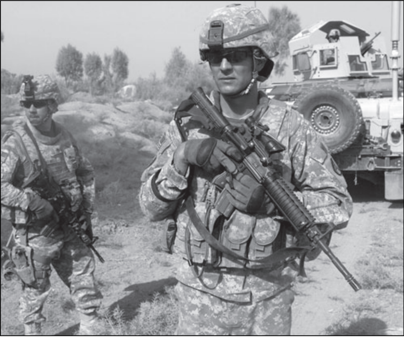
جنديان امريكيان في المحمدية امس