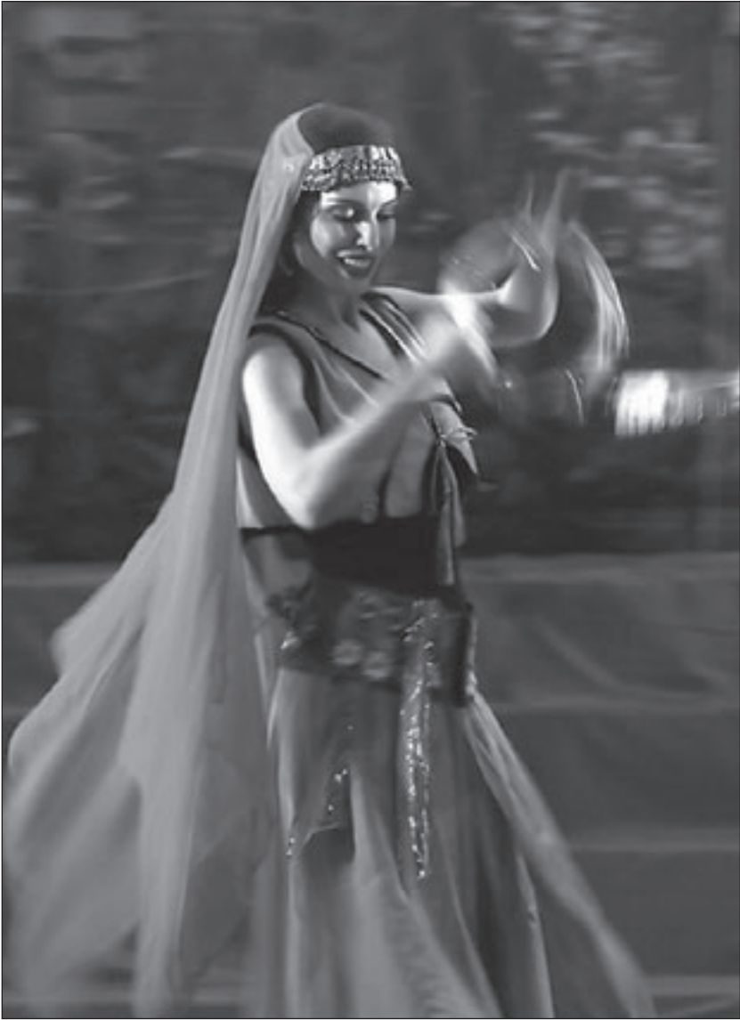
من عروض فرقة أورنيينا السورية