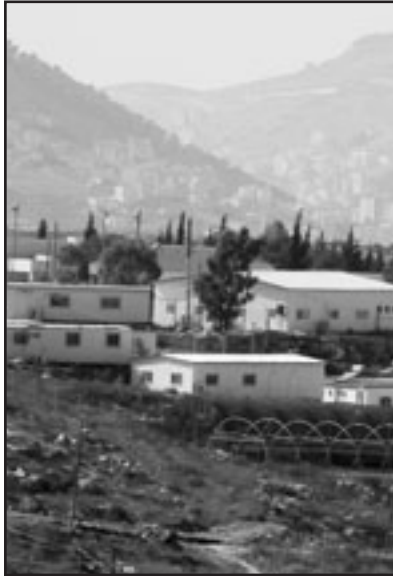
جانب من مستوطنة ايتمار في الضفة الغربية

■ القدس - ف ب - يو بي أي: احبت السلطات الاسرائيلية مشروعا قديما لبناء 450 وحدة سكنية في حي استيطاني في القدس الشرقية بينما يتحدث مسؤولون اسرائيليون عن صفقة اسرائيلية جديدة مع حماسا في حزيران (يونيو) 1967. واعتبرت صحيفة «هارتس» في ملحقتها الاقتصادية «ذي ماركر» انه من المتوقع ان تطلق مصلحة املاك الدولة الاسرائيلية هذا المشروع الذي كان مطروحا سابقا في استدرج عروض في حي يسغات زئيف الاستيطاني في القدس، ولم يكن استدرج العروض ادى الى عقد في تشرين الاول (تشرين) 2008 ان اعتبرت الادارة الاسرائيلية العروض المقدمة لها غير مرضية. ووضحت الصحيفة ان مصلحة املاك الدولة قررت في نهاية المطاف تخفيض مستوى مطالبها والمواقف على بعض العروض على ان تبدأ اعمال البناء بعد ستة اشهر. ولم يكن في وسع وزارة الاسكان وكالة الخبر او نفيه ردا على اسئلة وكالة فرانس برس. واعلنت اسرائيل الثلاثاء تحت ضغط واشنطن استعدادها لتجميد الاستيطان في الضفة الغربية مؤقتا عبر وقف طلبات استدرج العروض لبناء وحدات سكنية حتى بداية 2010 بدون ان يطاول التجميد مشاريع البناء الخاصة. واتى الرئيس الامريكي باراك اوباما على القرار الاسرائيلي معتبرا في ختام لقاء مع نظيره المصري حسني مبارك في البيت الابيض انها «خطوة في الاتجاه الصحيح» من قبل اسرائيل.