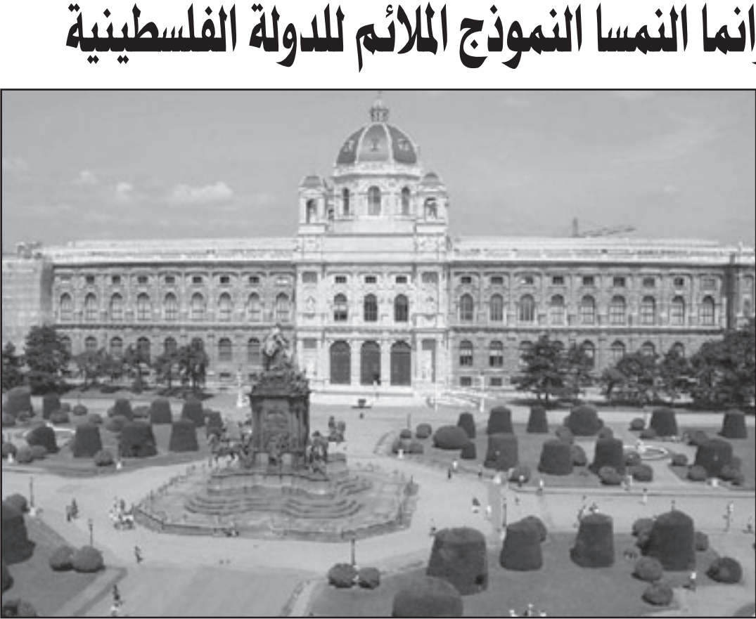
النمسا اعلنت عن نفسها كدولة محايدة وتعدت بعدم التحالف مع اية دولة

بالتنازل عن حل ارض اسرائيل الكاملة، الاطر السياسية الانفصالية ستحظر من خلال التشريعات في الجائين.