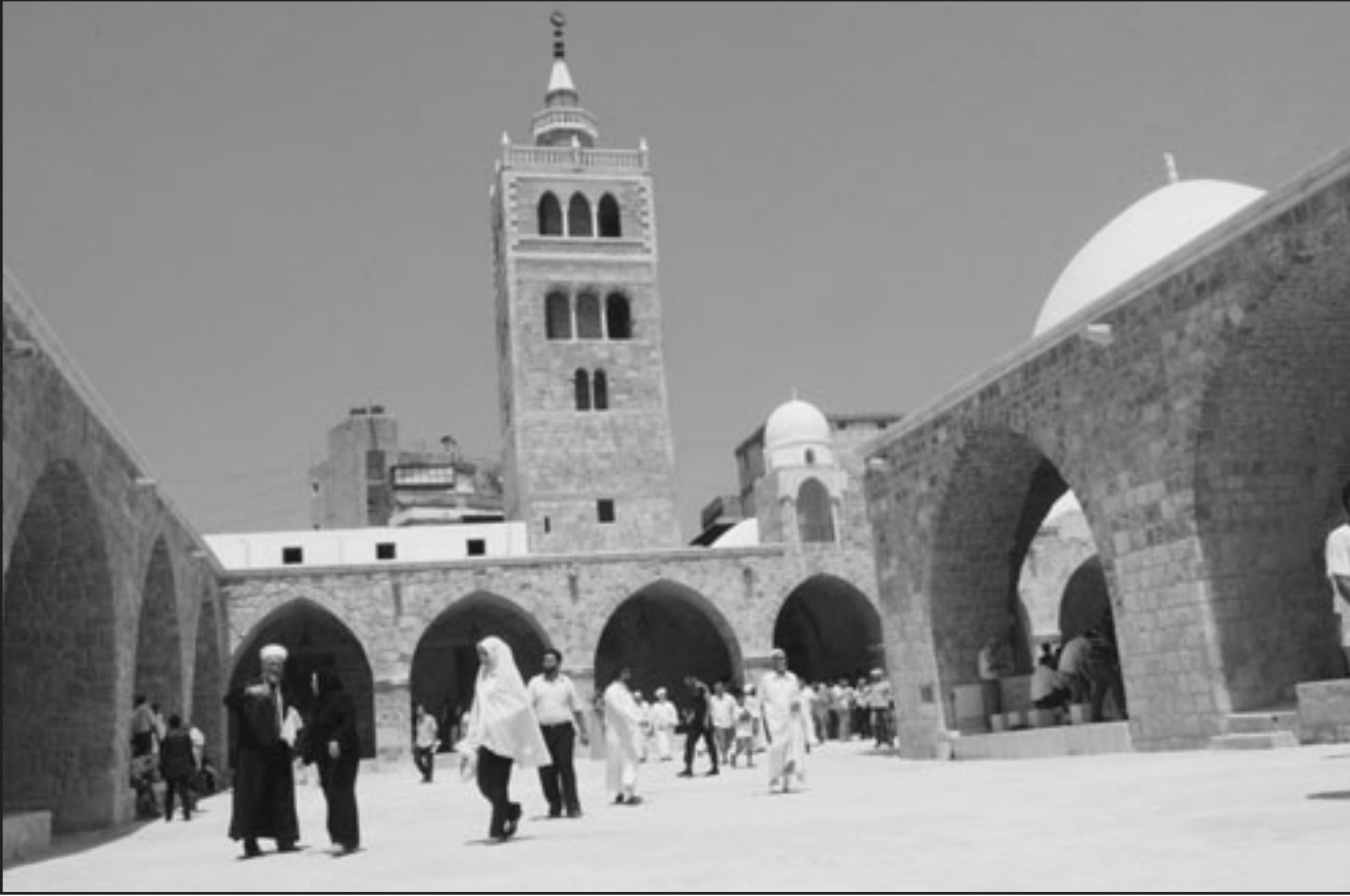
مطلون زيورون جامع المنصوري في طرابلس شمال لبنان بعد اعادة فتحه للعامه ويعتبر الجامع من اقدم واعرق الجوامع في منطقة الشرق الاوسط

في غضون ذلك، جددت قوى الاربعة عشر من آذار تمسكها بتشكيل حكومة ائتلاف وطني، داعمة في هذا الاطار الجهد المبذول من قبل الرئيس المكلف في هذا الاجراء. وأكدت انها في موقفا متسكك الانتاب عون بتوزيع صوره جبران باسيل برسم التيار الوطني الحرّ وترك له الحكم على هذا الموقف، وهو التيار الذي نبض في مسيرته على مبدأ رفض الاطلاق والتوريت الاحزابيين. وأفيد ان الحريري يسعى لعقد اجتماع عام لاقتاب 14 آذار يحضره رئيس «اللقاء الديمقراطي» النائب وليد جنبلاط ورئيس الهيئة التنفيذية في القوق اللبنانية سمير ججعج ورئيس الكتائب امين الجميّل، واللافت اخبارا زيارة قام بها النائب جنبلاط الى السفير المصري في لبنان احمد فؤاد البيدي بحضور عدد من وزراءه ومستشاري السفارة وذلك للتذليل ما حصل من سجال بين جنبلاط والنظام المصري.