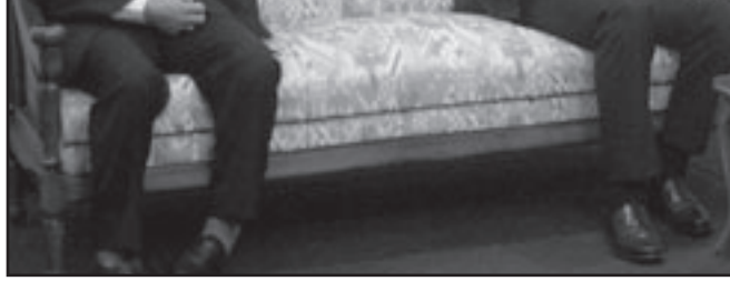
الرئيس بشار الاسد اثناء اجتماعه مع الرئيس الإيراني احمدي نجاد ومرشد الثورة علي خامنئي امس

بشأن اعتقال ومحاكمة الفرنسية كلوديت ريس في ايران. واعتبر تشقاوي في معرض رده على التصريحات الاخيرة للمتحدث باسم الخارجية الفرنسية بان المسؤولين الفرنسيين «سعيون جاهدين الى قلب الحقائق والايحاء بان موضوع اعتقال السيدة ريس جاء على خلفية سياسية».