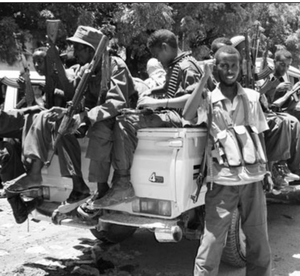
ميليشيات مؤيدة للحكومة الصومالية تجوب شوارع العاصمة مقديشو

الاستراتيجية. وطردت قوات اهل السنة والجماعة يوم الاثنين جماعة السيطرة على بلدة ثانية من متطرفين وتتهم الولايات المتحدة جماعة الشباب بأنها وكيل للقاعدة في الصومال.