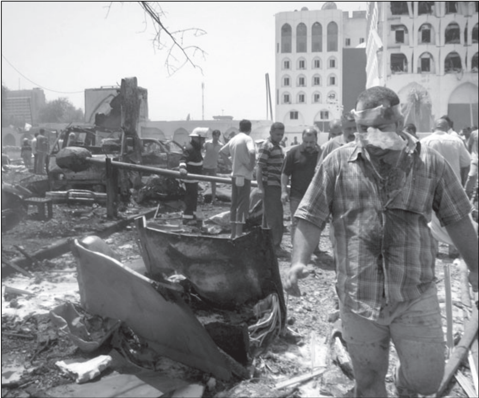
موقع احد الانفجارات في وسط بغداد أمس

وحول موقف اللجنة الأمنية في البرلمان من الاتهامات التي تتبادلها أطراف داخلية بالمسؤولية عن التفجيرات، قال السامرائي إن المشكلة تكمن بـ«اللجان التحقيقية» التي لا تكشف عن «ملايسات الجريمة والجهات التي تقف وراءها»