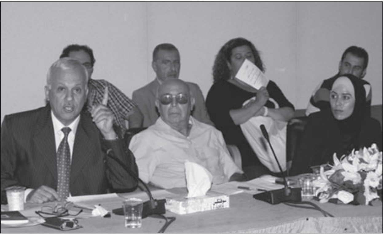
من جلسات ملتقى القصة القصيرة (القدس العربي)

وكنْتُ أشعرُ بارتياح غريب، وقد مضى ذلك النهار سريعياً مثل عودٍ نقابٍ اشتعلت للحظات أمام عيني ثم انحطفاً. ولقي عمق الليل خرجت صرخة مدوية في البيئات، ففكرت من سريري وأنا أرفع أذاري الذي تتساقط تصفح، كأن طفل قد صعد من نومه صارخاً وهو يسرد لأمه مشهد الثعبان الذي رآه يتمرغ في جوف مرحاض الحلم. فلم اقتدرت امرأة تخضب وجهها بالحوف، لأنها رأت ما يشبه السم يسبح على حواف مرحاض بيتها. توالى النصائح والنداءات وحام ذباب كثير وأخبار: عاتلة كاملة تجرح حقايتها في الفجر مبتعدة جبة الصحراء، وأخرون خططوا لبيع بيوتهم وشراء منازل تبعد بأميال عن الحي، ومنهم من غير مرحاضه، فلنأ منه أن المرحاض الجديدة لا تستكتها الثعابين، وشاع أن أحدهم استقدم عاملاً من خارج البلاد بحتة أنه مزارع واشترى له معولاً وأمره أن يقف طوال الليل أمام فتحة المرحاض، وأن هذا من علامات الساعة، وأن الثعابين التي تنتظر الموتى في قبورهم ضاعت نزعاً ونفذ صبرها، فقررت غزو الناس في أعماق بيوتهم. ولاني رجل لا يلقي بالألشاعات، فلم تجد الأفاقي من وسيلة للاتقارب مني سوى الحروق الخفية للنوم، حيث لم يعد حلم من أحلامي في تلك الأيام يخلو من صور الأفاقي وأبنائها وبناتها.