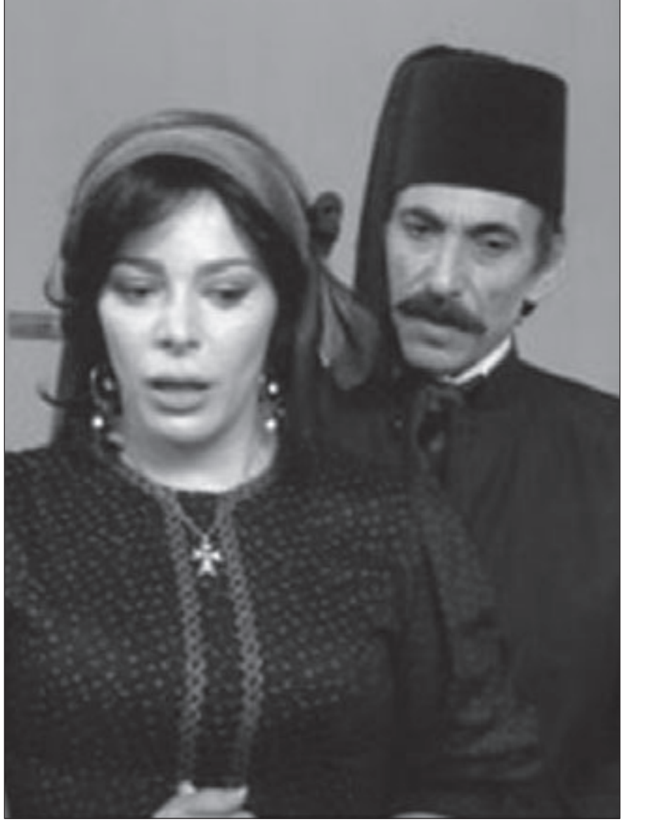
لقطة من مسلسل «جبران خليل جبران»