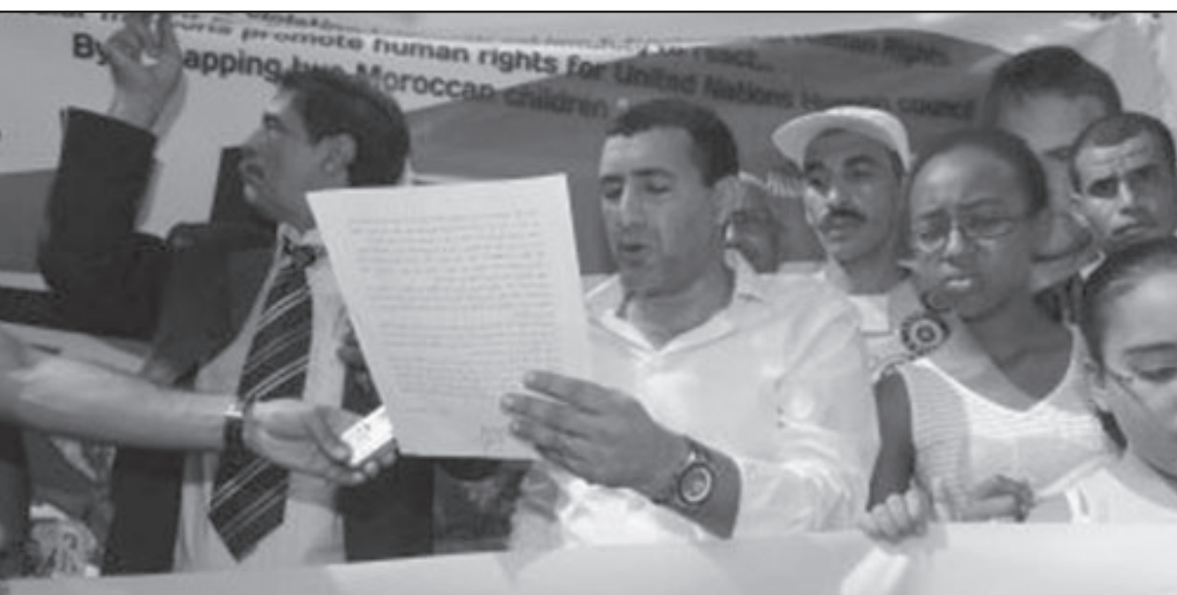
جانب من الاحتجاج امام السفارة النرويجية بالرباط امس