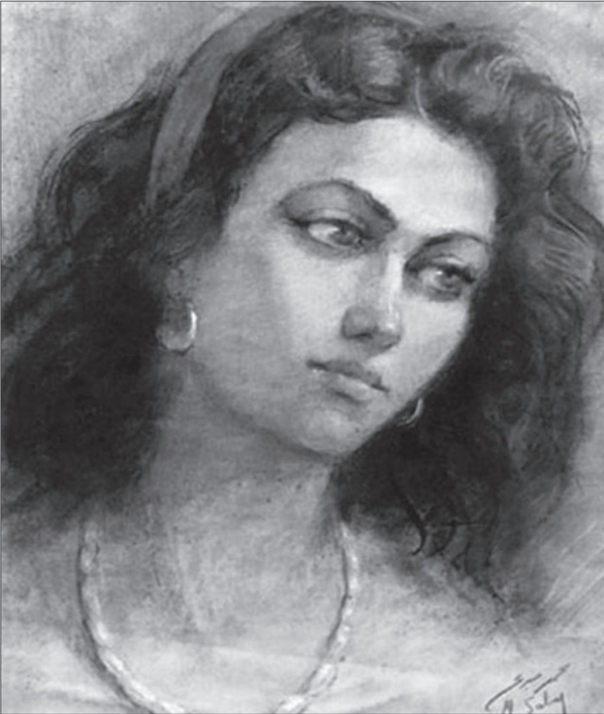
وجه فنانة، محمد صبري

وقد اشغلت صبري بالترتيب بكلية الفنون التطبيقية في الفترة من 1953 حتى عام 1959 ثم عمل مدبرا للمعارض ثم مستشارا فنيا للهيئة العامة لحولن بوراة الثقافة، ثم خبيرا بالمعهد المصري للدراسات الإسلامية بمديري، وهو حاليا يقوم بالتدريس كاستاذ غير متفرغ بكلية الفنون التطبيقية بجامعة حلوان، كما حصل صبري على عدد من الأوسمة مثل وسام فارس من الحكومة الاسبانية عام 1961 وسام العلوم والفنون من الطبقة الأولى، وفي عام 1988 حصل على وسام الحلون بوراة الثقافة، ثم حصل على اسبانيا تقديرا لفته، هذا بالإضافة إلى أن محمد صبري حصل على العديد من الجوائز منذ العام 1948 عندما حصل على الجائزة الأولى للميدالية الذهبية في التصوير في مهرجان الأدبي والفني الذي أقامته وزارة المعارف العمومية، كما في عام 1997 فقد حصل محمد صبري على جائزة الدولة التقديرية في الفنون، وقد رشحته كل من جامعة حلوان والمنصورة والمنيا للحصول على جائزة مبارك في الفنون وهي أعلى الجوائز التي تمنحها الدولة سنويا، وبالإضافة إلى ذلك فقد نال صبري العديد من شهادات التقدير والتكريم، وله مقننات بالعديد من المتاحف المصرية والعربية والعالية مثل متحف الفن الحديث وقصر عابدين، وأكاديمية سان فرناندو و متحف القصر الملكي، ومتحف الفنون الجميلة بفالنسيا، و متحف غرناطة و متحف قرطبة والرباط و مجلس برن في اكلترا ووزارة الأشغال بروما، ومجلس