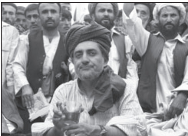
المرشح الرئاسي عبد الله عبد الله بين انصاره عشية الانتخابات الرئاسية

■ كابول - وكالات : قتل 21 شخصا بينهم خمسة مدنيين وحاكم اقليم وزعيم قبلي واربعة شرطيين أمس الأربعاء في عدة انفجارات ومعارك في جنوب افغانستان وشرقها ثلاثة الانتخابات الرئاسية ومجالس الولايات كما أعلنت السلطات، وقتل المدنيون الخمسة وبيّنهم أربعة من افراد عائلة واحدة، بعبوة ناسفة انفجرت لدى مرور سيارتهم في شرانا بولاية بكتيكا (شرق) كما أعلن المتحدث باسم حاكم الولاية حميد الله شوال.