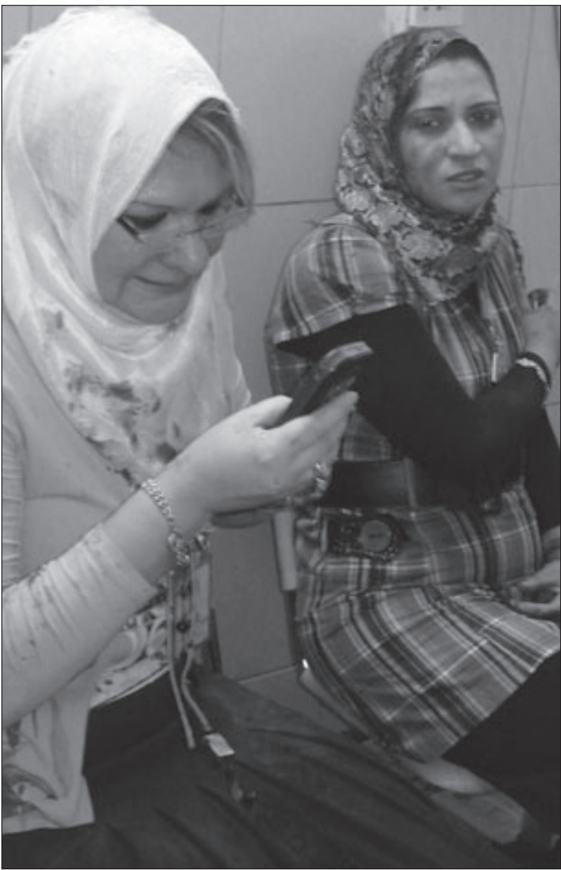
من ضحايا الانفجارات امس (ا ف ب)

وكانت مجموعة من أفراد الأمن العراقي بينهم عناصر في حماية نائب الرئيس العراقي عادل عبد المهدي قاموا بعملية سطو على مصرف الزوية نهاية شهر تموز/ يوليو الماضي وسرقة مبلغ يصل إلى ستة ملايين دولار بعد قتل 8 من أفراد حماية المصرف الذي يقع في حي الكرادة وسط بغداد.