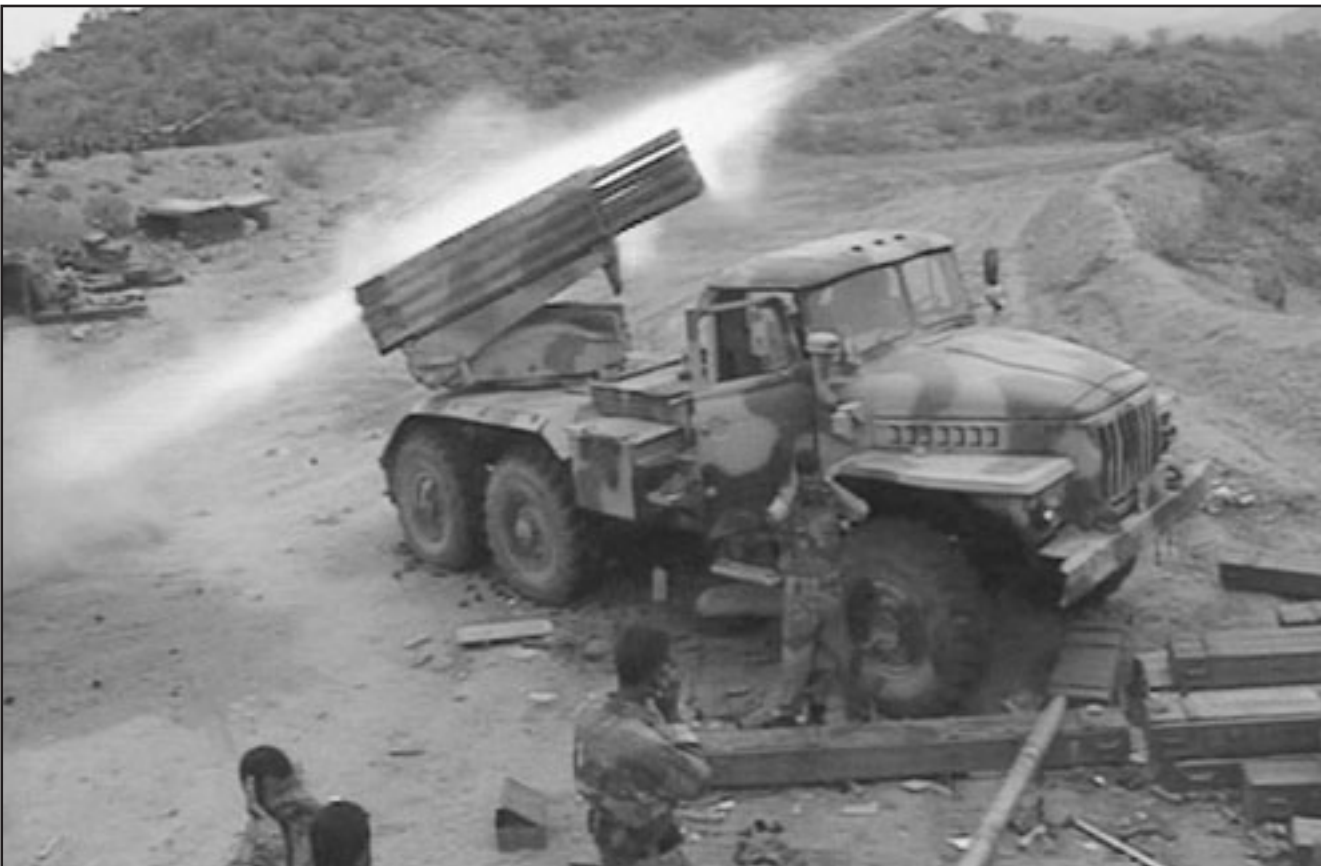
قاذفة صواريخ تابعة للجيش اليمني تقصف مواقع المعارضة في إقليم صعدة