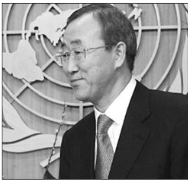
بان كي مون

الأمم المتحدة لدى الامم المتحدة انتقادات لاذعة الى الامين العام للمنظمة الدولية بان كي مون، حسيبا ذكرت امس الاربعاء صحيفة «افتنوستن» النرويجية. ويشكل نشر هذه المعلومات مصدر احراج للنرويج قبل اسبوعين من زيارة يفترض ان يقوم بها الى اوسلو. وقالت الصحيفة ان سفيرة النرويج منى بول وصفت بان كي مون في رسالة سرية بعثت بها الشهر الماضي الى وزارة الخارجية النرويجية بمناسبة انقضاء نصف ولايته، بأنه شخص «يفتقد الى المزايا القيادية»، و«سريع الغضب». وفي اتصال هاتفى اجرته معها وكالة «فرانس برس»، رفضت وزارة الخارجية النرويجية التعليق على «مذكرة داخلية» مقرة ضمنا بوجودها. و اضافت منى بول في الرسالة التي تقول الصحيفة انها حصلت على نسخة عنها «في