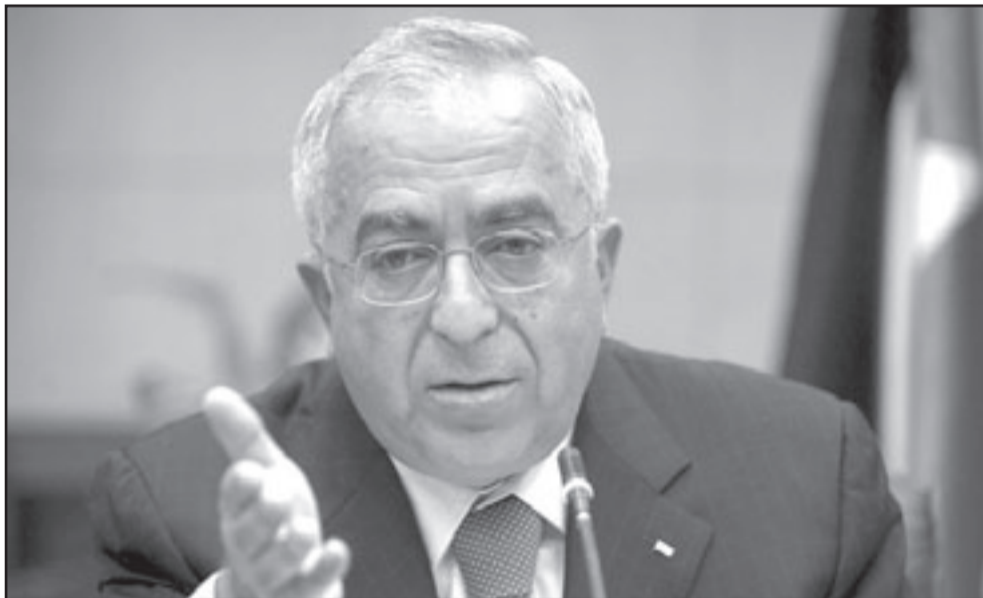
رئيس الحكومة الفلسطينية سلام فياض خلال اجتماع الحكومة في رام الله

تواجهنا، مبينا ان هذه الفترة كان ينبغي ان تنتهي عام 1999 بعلان الدولة الفلسطينية. وأوضح فياض في مؤتمره الصحافي الذي عقده بمقر مجلس الوزراء برام الله ان وثيقة «فلسطين: اناة الاحتلال واقامة الدولة» هي برنامج عمل حكومته وان هذا البرنامج، وما يتضمنه من اهداف وطنية وسياسات وبرامج حكومية، يستهدف بناء مؤسسات الدولة القوية والقادرة على تلبية احتياجات المواطنين، وتنمية امكنياتهم وتعزيز قدرتهم على الصمود، إضافة إلى تقديم الخدمات الأساسية لهم بالرغم من الاحتلال ومراساته، وتابع فياض ان حكومتنا ملتزمة ببرنامج منظمة التحرير الفلسطينية، والسلطة الوطنية من اجل تحقيق اقامة دولة فلسطين المستقلة وعاصمتها القدس على حدود عام 1967 في غضون العامين القادمين».