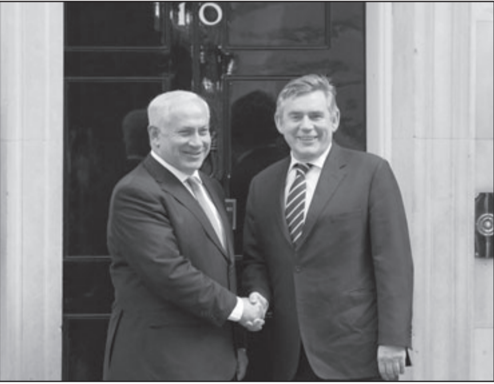
رئيس الوزراء البريطاني غوردون براون مستقبلا نظيره الإسرائيلي في مقر الحكومة في لندن

مضافا الى ما ذكر اعلاه، أكدت المصادر ذاتها ان السعودية، مثل دول عربية اخرى في منطقة الشرق الاوسط، يجب ان تنتهج سياسة جديدة لاسفاح المجال امام الدولة العبرية لتجديد المفاوضات مع الفلسطينيين، على الرغم من ان السعودية أعلنت عن رفضها المقترحات الاسرائيلية، وعلى صلة بذلك قائل وسائل الاعلام الاسرائيلية ان الولايات المتحدة اعربت عن امهالها في تقديم المفاوضات مع اسرائيل وفتح الباب على مصراعيه لتجديد المفاوضات مع الفلسطينيين.