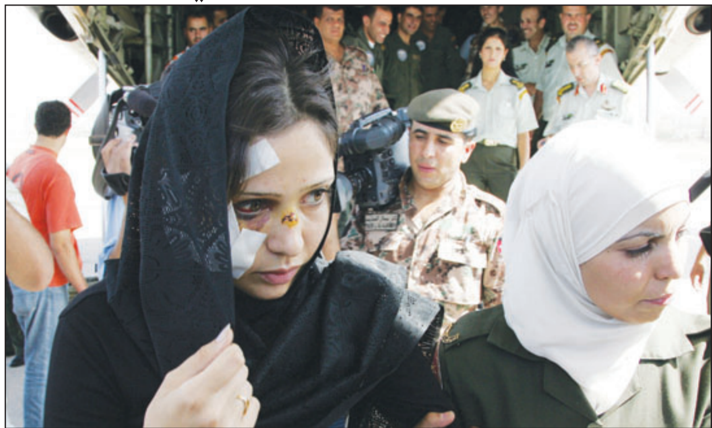
فتاة عراقية في ضحايا تفجيرات الاربعاء لدى وصولها الى عمان أمس لتلقي العلاج

الدامية يوم الأربعاء الماضي، وسبق لسورية أن أدانت بشدة هذا العمل الإرهابي الذي أودى بحياة عدد من أبناء الشعب العراقي». وأضاف البيان الرسمي أن سورية أبلغت الجانب العراقي استعدادها لاستقبال وفد عراقي للإطلاع منه على الأدلة التي تتوفر لديه بشأن مخفيي التفجيرات، وإلا فإنها تعتبر أن أي تجر يته في وسائل الإعلام العراقية «أدلة مفرطة لأهداف سياسية داخلية». وأشار إلى أن تضارب تصريحات المسؤولين العراقيين حول هذا الموضوع وتناقضها دليل يؤكد ذلك. وكان بيان عن المتحدث باسم الحكومة العراقية علي البديع قد أعلن أن «مجلس الوزراء قرر مطالبة الحكومة