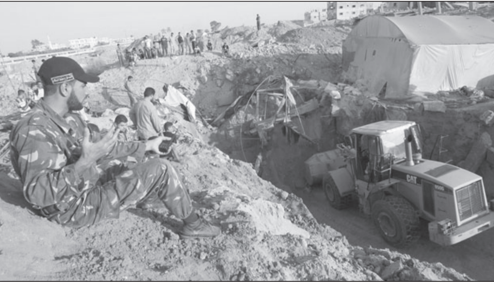
فلسطينيون يراقبون الانفاق المهتمة بعد القصف الاسرائيلي

الاسرائيلية التي توغلت، لافتة الى ان عناصر المجموعة تمكنوا من تنفيذ مهمتهم والعودة الى قواعدهم بسلام. وأكدت الالوية ان هذه العملية جاءت «ردا على الجرائم الاسرائيلية المتواصلة بحق الشعب الفلسطيني في قطاع غزة والضفة الغربية وتسكا بطريق الجهاد كسبيل أمثل لتحرير كامل الأراضي الفلسطينية المحتلة».