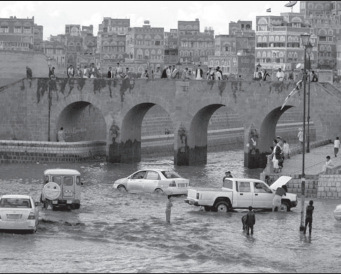
مياه الفيضان تغرق شوارع صنعاء بسبب الامطار الغزيرة