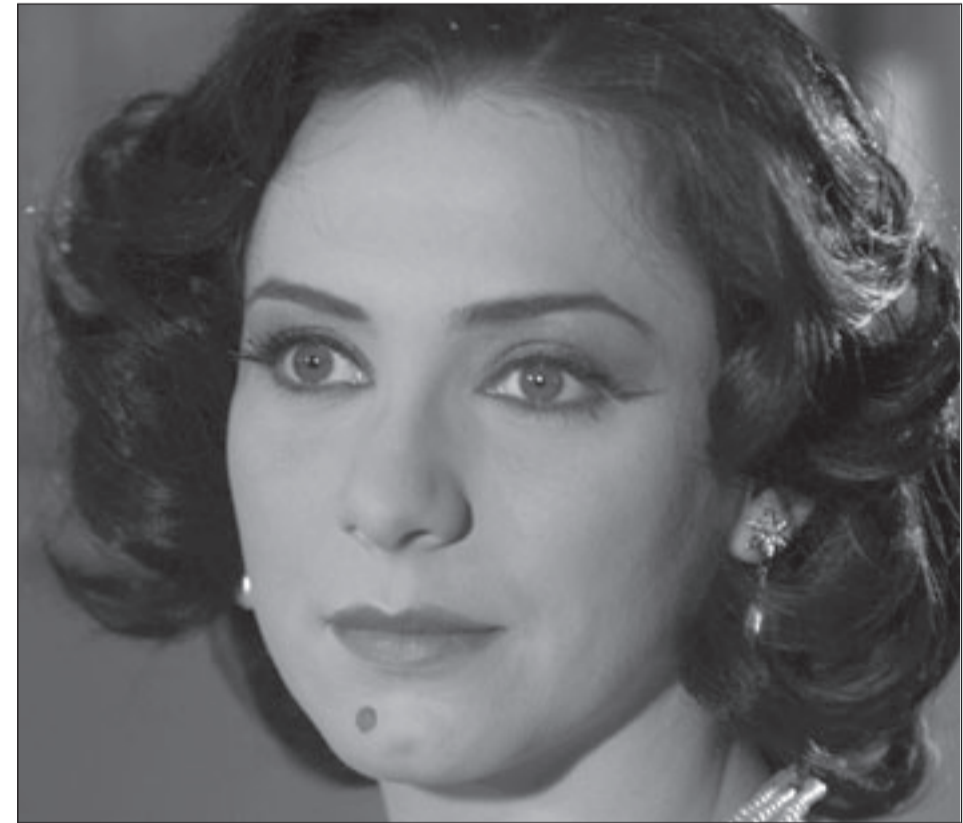
سلاف فواخرجي في لقطة من مسلسل «اسمهان»