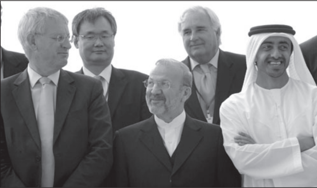
وزير الخارجية الإيراني منوشهر متكي يتوسط وزير خارجية الامارات الشيخ عبد الله بن زايد والسويد كارل بلدت على هامش اجتماع اصدقاء باكستان الديمقراطية

ارتفع من حوالي 2100 في مايو. وقال محللون نوويون ان هذا العدد يمكن اضافته لخطوط الانتاج في غضون اسابيع. وقال دافيد اولبرايث رئيس معهد العلوم والامن الدولي في واشنطن الذي يتابع الانتشار النووي «بعد تركيبها فان اختيارها قبل ان تصبح جاهزة للقيام بالتخصيب يستغرق اسابيع قليلة».