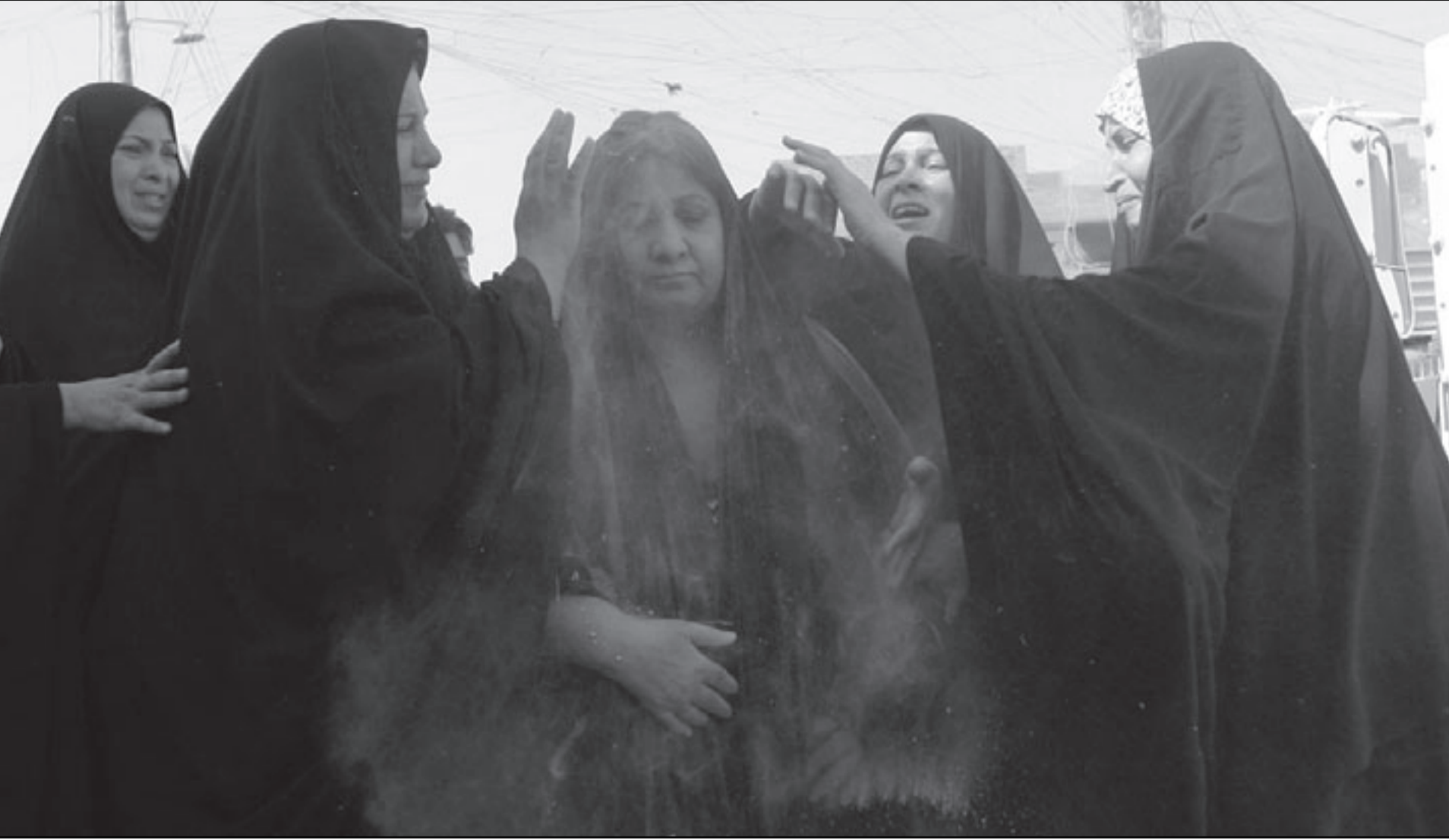
سيدات عراقيات أثناء تشييع ضحايا هجوم في بغداد أمس

الجديدة التي أجرتها إدارة أوباما هناك سلسلة من التعديلات على سياسة التحقيق، فالسي أي إيه لم يعد لديها أي دور في التحقيق وأوكلت مهمته رأسا للبيت الأبيض من خلال فريق خاص، والسؤال المطروح هنا هل يحتاج أوباما لاستعراض جديد للقوة مع الحرس القديم وهو يواجه هجمات من اليمين الأمريكي وتحديات من أجل تمرير سياساته المتعلقة بالصحة؟ فما لا يحتاجه أوباما في الوقت الحالي نقاش مسيس حول التعذيب، لأنه في كل مرة يتحول فيها النقاش حول التعذيب إلى قضية وطنية فالحزب الديمقراطي يخسر النقاش، فديك تشيني المشغول كل يوم بانتقاد الإدارة الحالية يعرف أن هناك قطاعا كبيرا من الأمريكيين يقف معه لا مع أوباما وهو أن استخدام التعذيب مبرر للحصول على معلومات تهم الامن القومي.