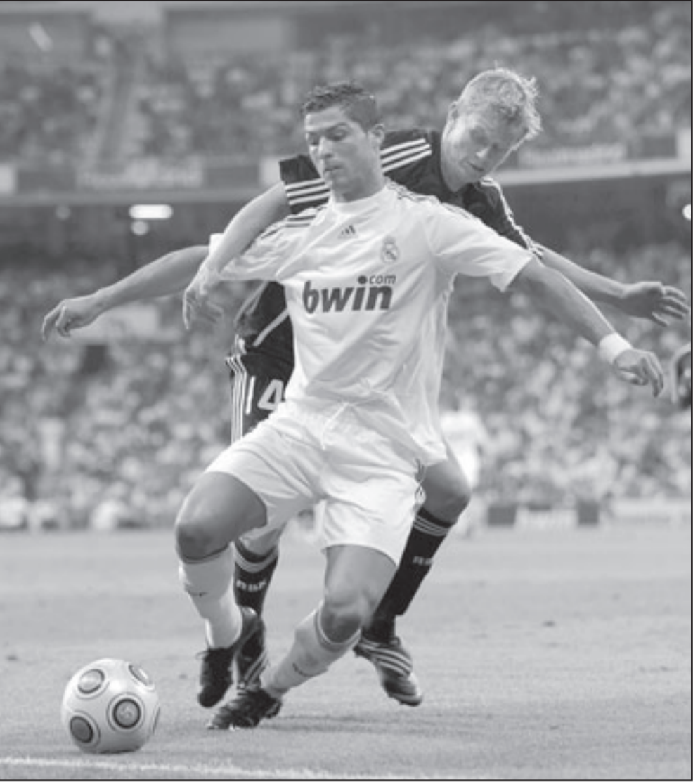
رونالدو بحاجة الى الوقت من اجل التأقلم

وقال ميرك هيزر العائد الى الفريق بعد ان لعب