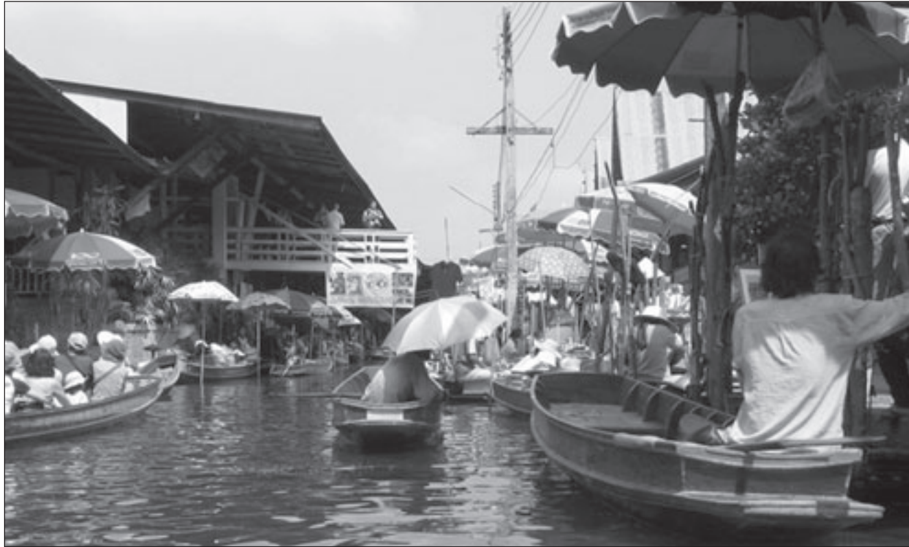
السوق العائم في بانكوك

وفي السوق العائم وهو من العلامات المميزة في بانكوك حيث مجموعة أحياء سكنية يعيش أهلها في بيوت تقف على أعمدة وسط المياه، ووسيلة الانتقال الوحيدة بين البيوت وإلى خارجها هي الزوارق... يتوقف علاء الدين كوكش عند تاريخ السوق وتقاليد التجوال فيه، لكن أهم ما يقدمه هنا تلك الرؤية العميقة والساخرة لإغراء السوق على السائح، وما يخلفه لديه من متعة شراء أشياء لسزوم لها تعبير عما أسماه (الغيباء السياحي) في