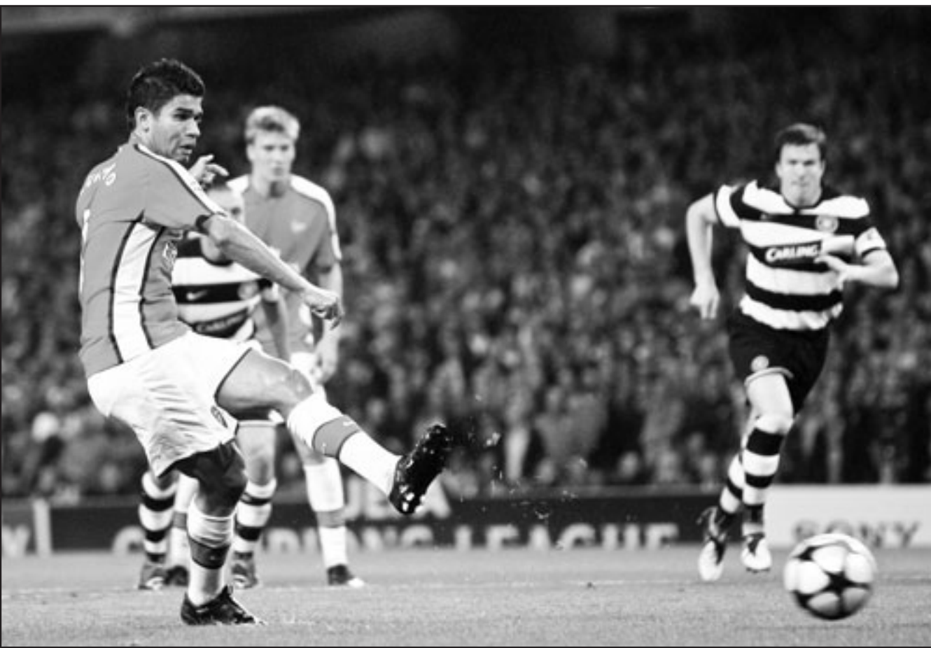
ارسنال خلال مباراته الاخيرة امام سيلتك الاسكتلندي

لندن - د ب أ: يستضيف مانشستر يونايتد غدا السبت فريق أرسنال في أولى المواجهات الراقبة بين الفرق الأربعة الكبيرة بالدوري الإنجليزي لكرة القدم هذا الموسم وذلك في إطار مباريات المرحلة الرابعة من المسابقة. وبدا أرسنال الموسم بشكل رائع حيث اكتسح إيفرتون بسعة أهداف نظيفة وتغلب على بورتسموث 4/1 كما أطاح بيلسليك الاسكتلندي في طريقه إلى دور المجموعات بدوري أبطال أوروبا. وقال الفرنسي أرسين فينجر المدير الفني لأرسنال «أشعر بالسعادة لأنني ساحل ضيفاً على مانشستر يونايتد في استاد أولد ترافورد لأنه أكبر اختيار.. تحتاج دائما إلى مستويات عالية من الثقة عندما تلعب في أولد ترافورد ولدينا هذه الثقة الآن». وتحرم الشوك حول مشاركة لاعب خط الوسط الإسباني ميسك فايبرجاس مع أرسنال في هذه المباراة بسبب الإصابة التي أبعدته أيضا عن المباراة التي تغلب فيها أرسنال على سلتيك 1/3 أمس الأول الأربعاء. ولم يظهر مانشستر يونايتد باستوى