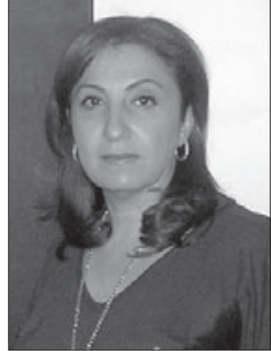
هائلة الوعري (القدس العربي)

الأول هو مشهد «الوداع» كما حاولت التعبير عنه في إحدى لوحاتي، حيث مجاميع من البشر متجمعة حول الباصات، تتوابع في مشهد مليء بالأسى والحزن، وكما نلاحظ بين هذه المجاميع تظهر بيوت مهجورة أو فراغات الأبواب، وقد استخدمت في رسم هذه اللوحة ألواناً ترابية داكنة تميل إلى السواد في بعض زواياها. أما المشهد الثاني فتشكل أثناء عبورنا الجسر الخشبي إلى الأردن، إذ سقطت لعيتي التي كنت أحملها وأطلق عليها اسم «عماد»، وقع عماد في النهر، صرخت، لكن أحداً لم يُنقذ «عماد»، وضاعت معي هذه الشخصية/الدمية/لكنه عاد في أغلب لوحاتي شخصاً بل شخصاً متخفياً بلا ملامح.