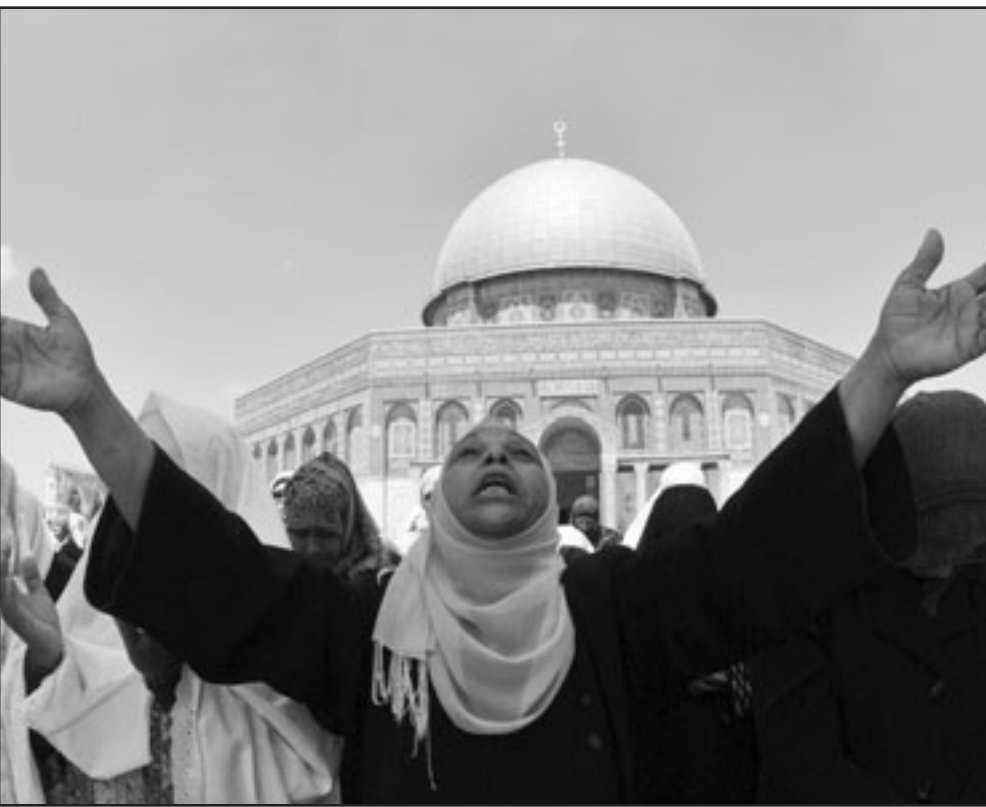
فلسطينية تصلي في باحة قبة الصخرة في القدس