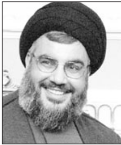
حسن نصر الله

وقال «لن نسمح بإضعاف العماد عون وكسره أبداً لأننا نعرف الهدف من ذلك وبالنتالي فإننا في «حزب الله» وحركة «وأمم» والتيار