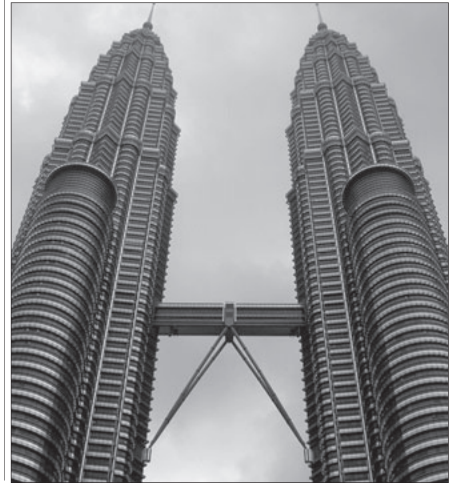
برجا بتروناس رمز ماليزيا الحديثة

ثم يضيف مصوراً مشاعره ببلغة واخترال في ختام الرحلة: (غابت الشمس ونحن في القمة، نأمل جزيرة بينانغ كلها... وخيم علينا الصمت وكان الغروب كان ينكرنا بأن لكل شيء نهاية... وأن رحلتنا شارفت على الانتهاء... وتذكرت قول أبي البقاء الرندي في رثاء الأندلس: لكل شيء إذا ما تم نقصان لا يفخر بطيب العيش إنسان) إن كتاب (السفر بعيداً: يوميات رحلة إلى تاييلاند وماليزيا) يمثل تجربة أدبية وتسجيلية جديدة بالقراءة والاهتمام، فهو يفيض بالسلامة في السرد، والطرافة الساخرة في التحليل، والعمق في الرؤية وتمس الجوهري... وهو يمثل امتداداً أصيلاً لأدب الرحلات الذي يكاد يكون قد اندثر في أدبنا العربي المعاصر، مقابل لغتان لغة وشكل الريبورتاج الصحافي... إننا نأب رحلات يقترب من فن اليوميات ولغة المذكرات بكل ما فيها من نبرة ذاتية في القول والرؤية... وهنا تكمن الفريدة الحقيقية.