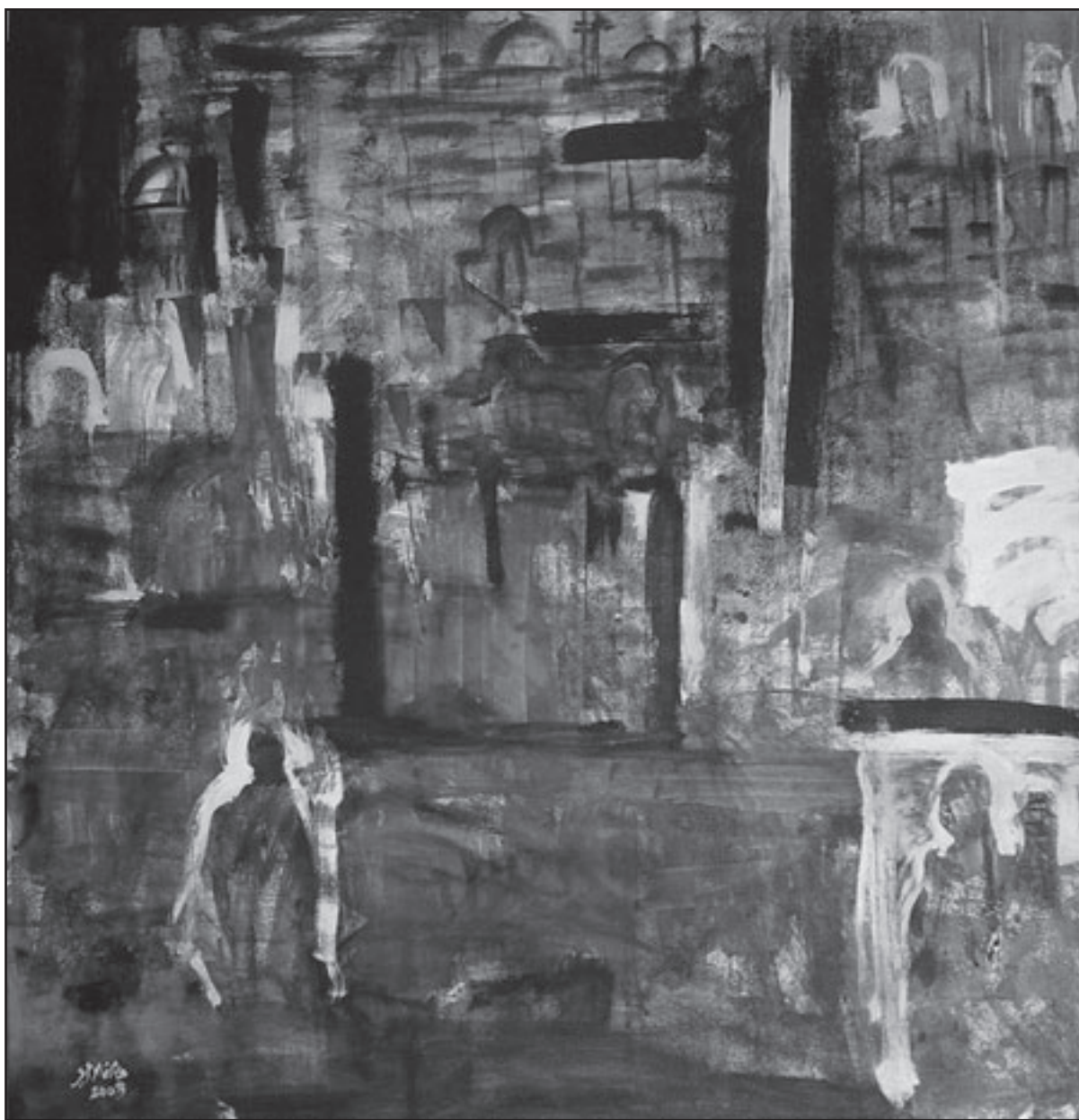
«الحارات القديمة»

هذا الوجود الوجداني بالنسبة لي كان في خلفية معرضي الذي أقمته عام 2003 بعنوان «بقايا ذكرك... بقايا أثر»، وتلجى بشكل واضح في المعرض التالي «القدس في الذاكرة» عام 2006، لكنني في هذا العام قررت أن أقدم شيئاً متميزاً لاحتفالية القدس عاصمة الثقافة العربية، فكان هذا المعرض الذي افتتح في آذار (مارس) من هذه السنة في الأمانة العامة لبلدية عمان، وانتقلت به في 2 آب (أغسطس) إلى دمشق، وسيعاد افتتاحه في تشرين الثاني (نوفمبر) من هذا العام في تونس أيضاً، كمساهمة مني للاحتفاء بعيداً إقليمية التي خرجت منها قبل أن تكفل سنواتي الخمس، لكنها ما زالت تستكنني بقفاص كثيرة أسعى جاهداً لالتقاطها وإعادة تثبيتها على سطح لوحاتي. «عندما تعود إلى تلك اللحظة الأولى التي أشعلت فيها الرغبة بالرسم» «ربما سكتني هاجس الرسم منذ الطفولة، وتحديدًا بعيد خروجه من مدينة القدس، إذ شكّل هذا الخروج بضغط الاحتلال نقلاً في ذاكرتي وفي نفسي، لم أستطع أن أتحرر منه بعد، ولا زال يلح عليّ مشهدان من يوم الخروج: