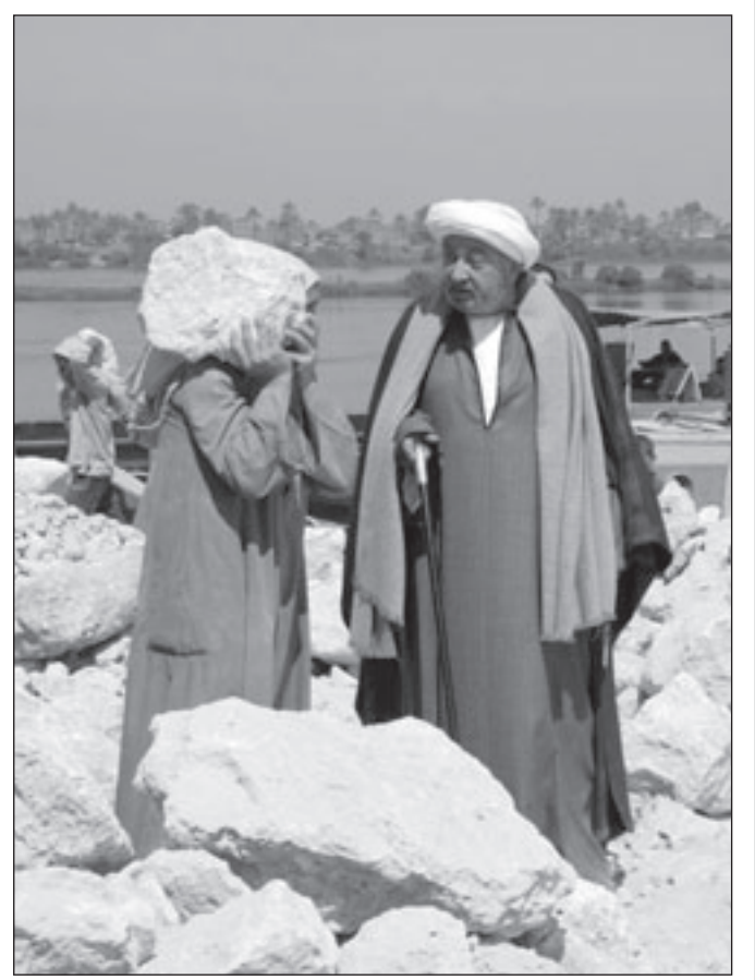
لقطة من مسلسل «الرحايا»

ولفت حالة الركود الاقتصادي العالمي وأثارها السلبية على صناعة السينما بظلال من الخوف ألا يحظى المهرجان الذي يقام في جزيرة ليد فينيسيا هذا العام بالاهتمام اللائق. ويقول المخرج ماركو مولر مدير المهرجان ان الامر ليس كذلك ويصف الجودة السادسة والسنتين من المهرجان والخامسة له كدبر للمهرجان بأنها ستكون «الصحيحة»..أخيراً، كما رد مولر على انتقادات التي قالت بان اختيار الأعمال المشاركة في المهرجان انحاز وبشكل محجف للأعمال الأمريكية والأوروبية على مثيلاتها من بقية بقاع العالم وقال مولر لقد دفعت الأزمة الاقتصادية المخرجين والمنتجين في أمريكا وأوروبا لتقديم أعمال أكثر «أهمية» من غيرها التي تعبر عن الروح السائدة في وقتها.