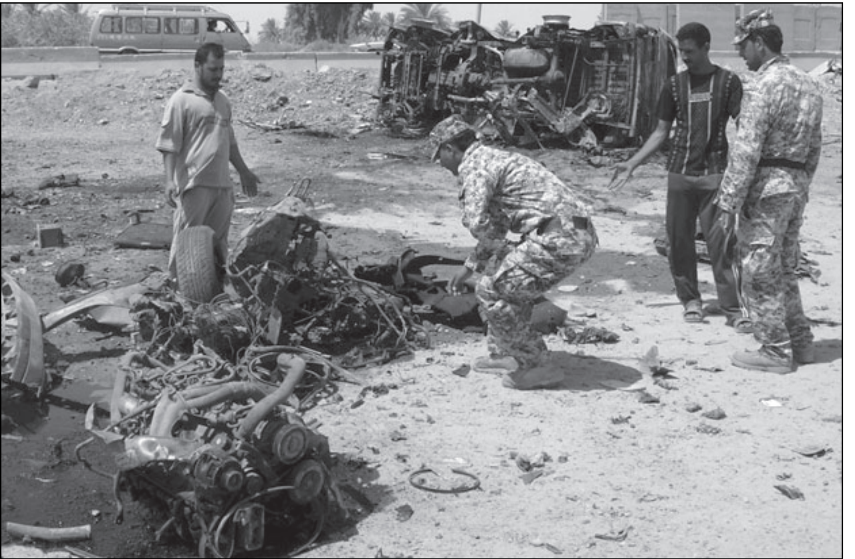
جندي عراقي يرفع بقايا سيارة انفجرت في تاجي الجمعة

في مجلس النواب العراقي طه المهدي ان الحكومة العراقية قد تصرفت لاسلاف بطريفة سريعة وغير متأنية، قائمة على ردود الافعال، واصاف المهدي اعتقده انه لا يجب ان يتم التصرف بهذه الطريقة، وان كانت لديها ادلة عليها تقديمها. واشار الى وجود مليون وخمسمائة الف مهجّر عراقي من المكون السنني في سورية، وفي حالة قطع العلاقات فانهم لا يستطيعون الالاء باصواتهم في الانتخابات النيابية القادمة وهذا سيحرم هذا المكون من 15 مقعدا في البرلمان القادم. وتابع المهدي اذا كان لرئيس الوزراء دليل