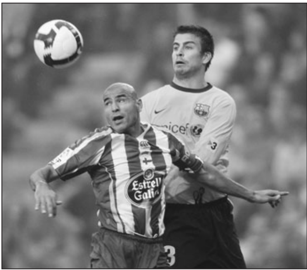
برشلونة خلال إحدى المباريات مع ديوريتيفو لكارونيا