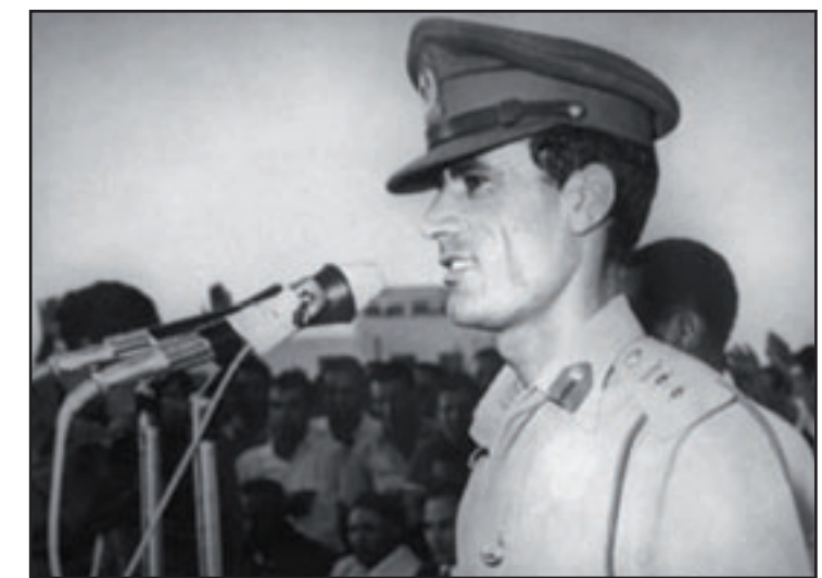
القذافي في ايلول/سبتمبر 1969، في الاسابيع التي تلت استيلاءه على السلطة

هاوس رودولف ميترتس الى طرابلس حيث قدم اعتذارا عن اعتقال منيغيل القذافي في جنيف في تموز/يوليو 2008. وقبل احتفاله بذكرى ثورة الفاتح من ايلول/سبتمبر 1969 التي حملته الى رأس