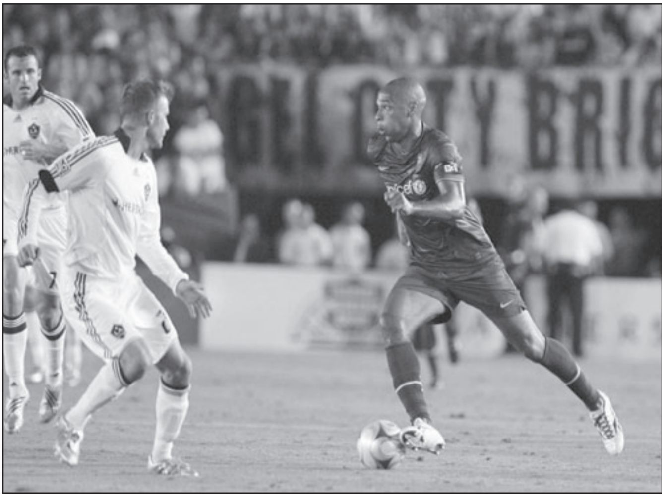
تيري هنري نجم برشلونة (يمين) خلال المباراة مع لاس فيجاس جالاسيكي

2- صفر على ضيفه اشبيلية فيما اهدر فياريال تقدمه ليتعادل 1-1 مع ضيفه اوساسونا. واصل كركيتش (19 عاما) في المباراة الافتتاحية للدوري المحلي ضد سيورتنغ خيخون والتي انتهت لمصلحة برشلونة 3-صفر، علما انه سجل الهدف الأول. وغادر كركيتش الذي احتفل بعيد ميلاده التاسع عشر يوم الجمعة الماضي للمعب قبل عشر دقائق من نهاية المباراة. وقال مدرب برشلونة بيب غوارديولا «ارجو ان نستعيده بأسرع وقت ممكن لأننا بحاجة اليه. (دوري ابطال والدوري والسكاي الحليان)، لكنه فشل في فرض نفسه اساسيا وسط كوكبة من النجوم. من جهة اخرى اعلن نادي برشلونة بطل أوروبا واسبانيا (دور المجموعات) من دوري ابطال أوروبا ضد انتر ميلان الايطالي.