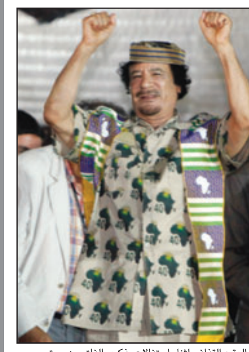
العقيد القذافي أثناء احتفالات بذكرى الفاتح من سبتمبر

للألعاب الأولمبية. وفي الأيام التالية ستطلق البالونات التي تصلا بالهواء الساخن فوق الصحراء وسيقيم الطوارق مهرجانا تشارك فيه ألف ناقة. وستقام عروض للصوص والضوء في مدن ليبية قديمة مثل الخمس وصبراتة. وجعل القذافي من أفريقيا محور تركيز عونه للسلاح الدولية وقدم مساعدات سخية لدول أفريقية فقيرة ودعا إلى إقامة الولايات المتحدة الافريقية مع وجود جيش مشترك وعلمة موحدة. وذكرت وكالة أنباء الجمهورية الليبية (أوج) أن الزعيم الليبي معمر القذافي التي كلمه من قاعدة إيعيتيقة الجوية بطرابلس في الساعة الثانية والنصف (بالتوقيت المحلي) من صباح امس. وهي ساعة الصفر التي تحركت فيها قوات التحرير الثورية. لتحرير هذه القاعدة التي كانت أكبر قاعدة لأمريكا خارج أراضيها. وجاء إلقاء الكلمة عقب انتهاء عرض فني. وقال القذافي في كلمته «إن المكان الذي نحن فيه الآن هو قاعدة إيعيتيقة الجوية وقد كان اسمها قاعدة هوبلس الجوية. وهوبلس ضابط أمريكي قتل في باكستان أو أفغانستان أو في أي مكان آخر».