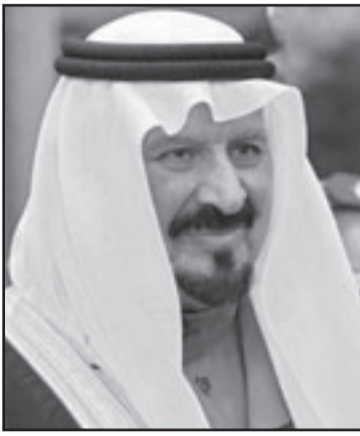
ولي العهد الامير سلطان بن عبد العزيز

واعتبر رئيس الحركة العربية لتخوذ السعودية للاصلاح (حركة معارضة تتخذ من لندن مقرا لها) في تصريح له «القدس العربي»، ان الحكومة السعودية المثقلة في الاسرة الحاكمة كانت تخشى الى حد كبير ان تبدأ القاعدة بالتفكير باستهداف موزها. معتبرا ان اعلان الحكومة تشديد الرقابة حول المنشآت النفطية يهدف الى حرف الانظار عن اصل القضية وهو