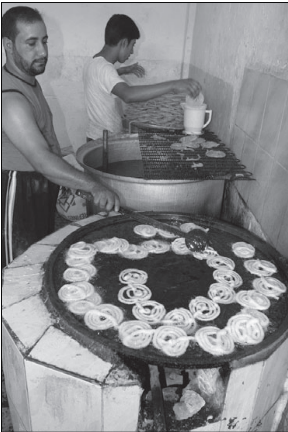
صانع حلويات رمضان في العراق أمس

ديوان الرقابة المالية. كما أكدت القاضي نقلا عن تصريح (لو كالة الصحافة العراقية) وجوب تقديم هذه النماذج الفاسدة في كل مكان الى القضاء ومعاقبتها ليكون هناك رادع للباقيين، الفتاغسي عن المورين والمفسدين سيجعل المشكلة مستعصية ومستشرية وحلها صعبا جدا. ويشير رئيس هيئة النزاهة رحيم العكيالي الى ان ظاهرة تزوير الشهادات لها تداعيات سلبية على الواقع العملي للبلاد واخذت مدى واسعا خلال الفترات الاخيرة وارتبكت خطط التوظيف الحكومي بان يأخذ أشخاص غير كفؤين حقوق آخرين، منوها الى التنسيق مع الوزارات ومكاتب المفتشين العاملين لاعداد كشوفات خاصة بالشهادات. ووفق تقارير عراقية فإنه تم الكشف عن 3165 وثيقة دراسية مزورة وحصول عراقيين على شهادات دراسية في اختصاصات حساسة ومهمة مقابل ثمن من عدد من الدول الأوروبية، ونكرت تقرير لكتيب المفتش العام لوزارة التعليم العالي العراقية ان 2769 وثيقة دراسية مزورة تم كشفها خلال العامين الماضيين حتى شهر تموز (يوليو) للعام الجاري في عموم المؤسسات التعليمية التابعة للوزارة وأن جامعتي المستنصرية وبغداد تصدرتا القائمة بـ558 طالبا مزورا للأولى و196 للثانية، فيما جاءت جامعتا المثنى وذي قار بأقل عدد.