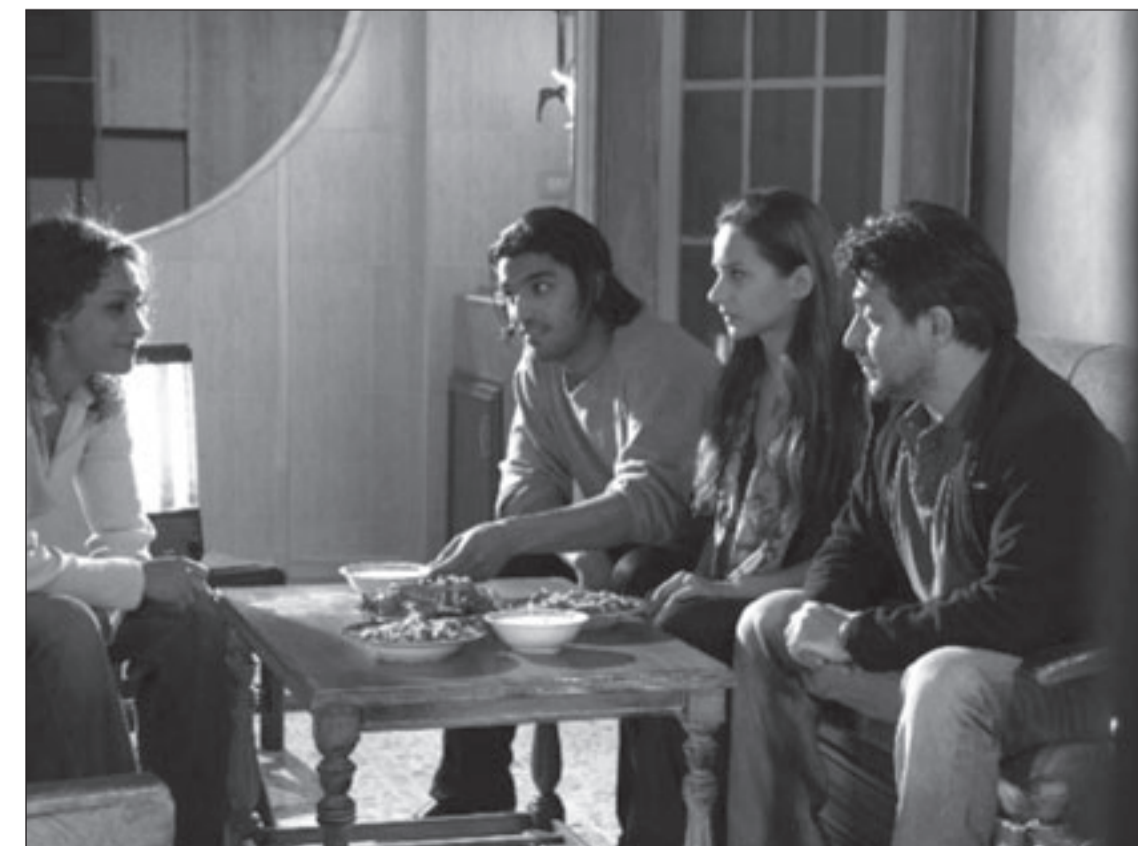
لقطة من مسلسل «هدوء نسبي»

وأوضح أنه قام بإعادة صياغة أحداث حرب العراق وفق مجرياتها وهو أمر استلزم وقتا طويلا في التحضير والإعداد واختيار الشخصيات حتى لا تبدو الدراما هزلية مقارنة بالواقع وفي المقابل لا تبدو أكثر قسوة وبشاعة مما جرى وبثته وكالات الأنباء