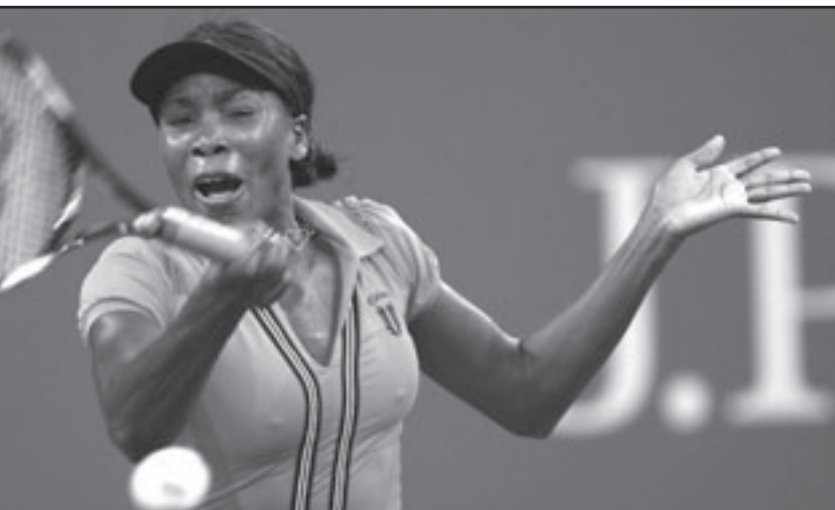
الأمريكية فينوس ولييامز

نيويورك - (د ب أ): استغل النجم السويسري روجيه فيدرر خبراته الكبيرة لترويض لاعب أمريكي باقع ظهر على الساحة الكبيرة للمرة الأولى في حياته حيث فاز اللاعب الأول في العالم 1/6 و3/6 و5/7 على الأمريكي الصاعد ديفين بريتون ليتأهل إلى الدور الثاني من بطولة أمريكا المفتوحة للتنس. ومن ناحية أخرى، واجهت الأمريكية فينوس ولييامز المصنفة الثالثة بالبطولة معركة ساخنة أمام الروسية غير المصنفة فيرا دوشيفينا قبل أن تتمكن أخيرا من