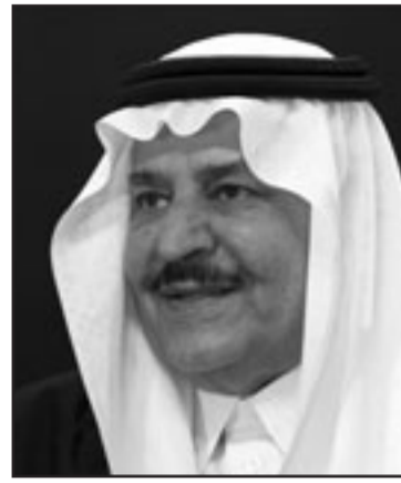
الامير نايف بن عبد العزيز

الله والامير سلطان خليفته المعين وولي العهد وكلاهما في الثمانينات من العمر في الخارج.