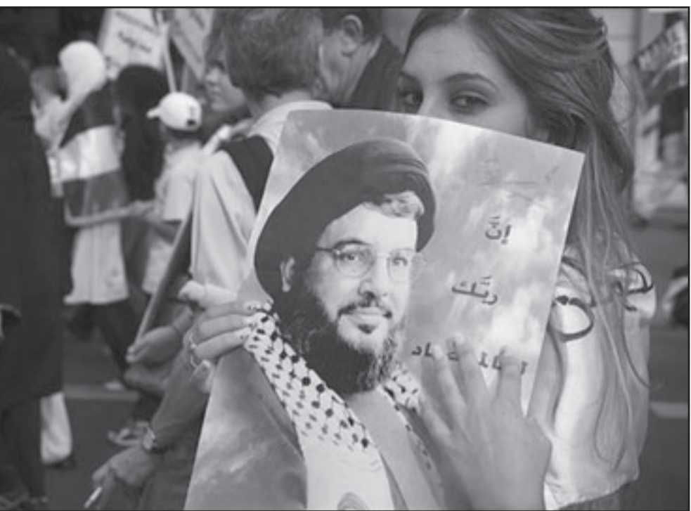
حزب الله يحاول تجنيد عرب إسرائيل

المهني أن يخترقها وان يكمل المهمة، حزب الله نقل جهوده الى مجال التجنيد المتكثف للعلاء في اوساط عرب اسرائيل. اساس التجنيد للعرب الاسرائيليين يرمي بقدر اقل لتفكيك العمليات واكبر لبناء بنية تحتية تساعد النشاط ارامي. جمع المعلومات، تجنيد عملاء محليين، جمع خدمات افشاء للأسلحة وللعناصر المعادية، وبالعمل في عدل الستين الاخيرين هناك ارتفاع في عدد العرب الاسرائيليين الذي اعتكفوا بسبب الاتصال مع عميل اجنبي ونقل معلومات. ومع ذلك في المخابرات يواصلون التجنيد على أنه لا يدور الحديث عن ظاهرة جماهيرية بل عن اعشاب شاذة.