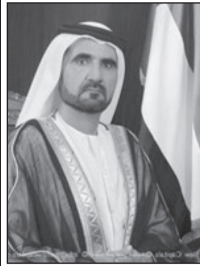
الشيخ محمد بن راشد آل مكتوم

وتجدر الإشارة إلى أن الأزمة التي ضربت القطاع العقاري في الإمارات عامة وفي دبي خاصة أدت إلى تعليق عشرات المشاريع العقارية بينما اضطرت شركات ناشطة في القطاع إلى التخلي عن آلاف العمال الآسيويين.