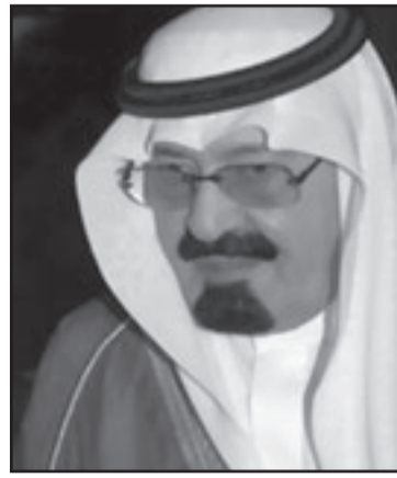
العاهل السعودي الملك عبد الله بن عبد العزيز