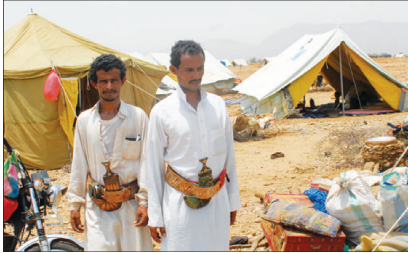
ناحازان يمينان في شمال محافظة صعدة