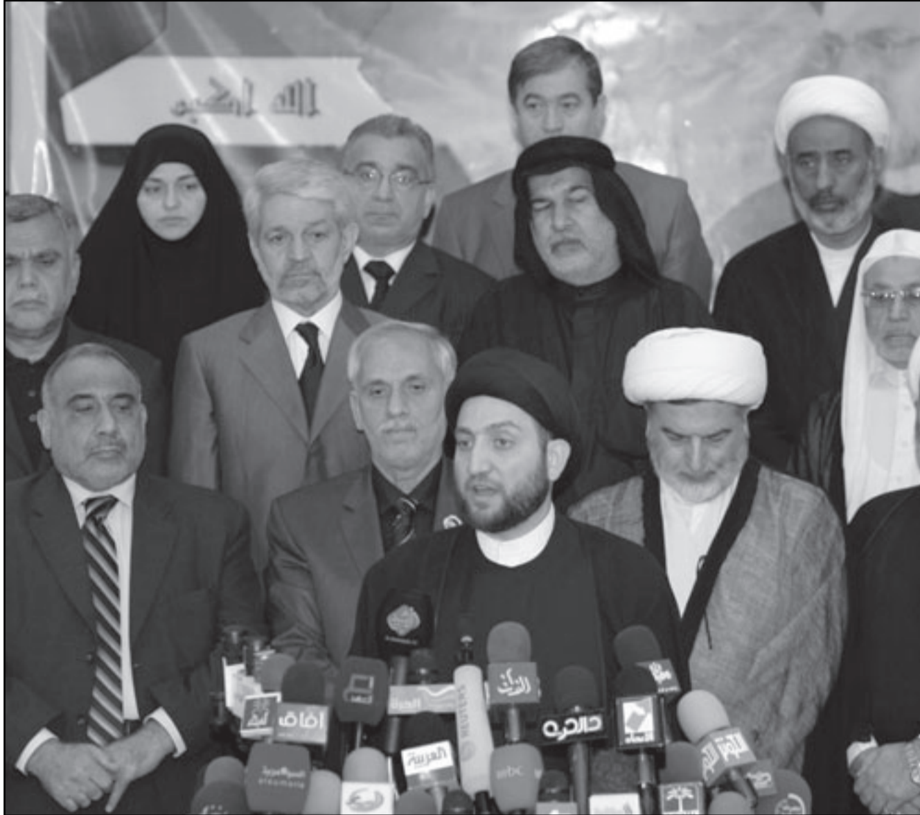
عمار الحكيم زعيم المجلس الإسلامي الأعلى بعد انتخابه

قرارها الحاسم بالانضمام إلى هذه الخيمة الكبيرة والواسعة الائتلاف الوطني العراقي». كما دعا في كلمته إلى «تشكيل جبهة وطنية واسعة تضم كل القوائم والكتل والائتلافات الواسعة للقوى الوطنية لبلادنا من أجل النهوض بالعملية السياسية ومواجهة التحديات التي تواجه العراق». وتأسس المجلس الأعلى في إيران خلال حكم الرئيس العراقي الراحل صدام حسين وتربطه علاقات وثيقة