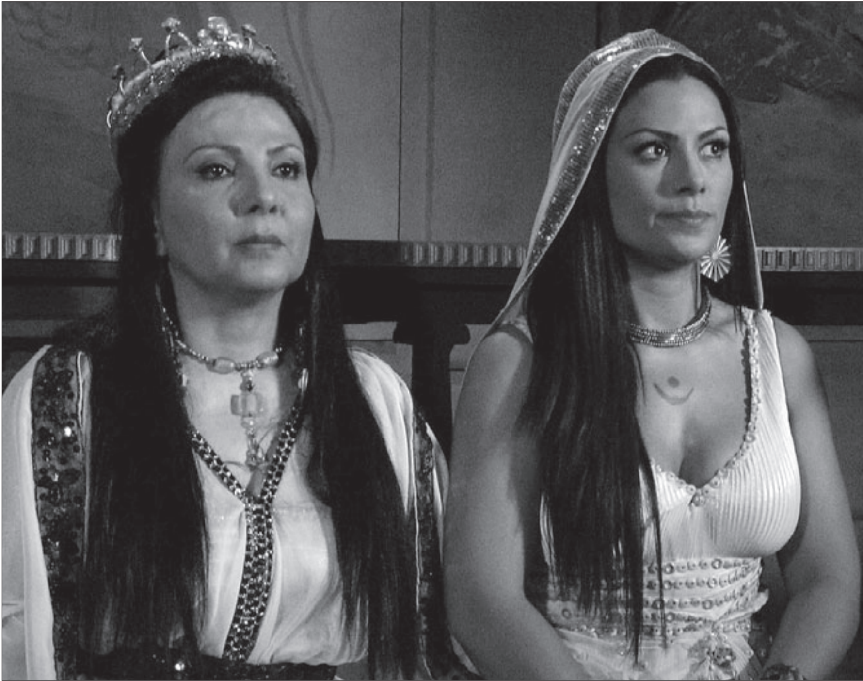
لقطة من مسلسل «بلقيس»

والدور يعد علامة فارقة في مشوار رياحنة الفني، وكان الرياحنة، حاز مؤخرا على ذهبية أفضل ممثل في مهرجان القاهرة للإعلام العربي الرابع عشر، عن دوره في المسلسل التاريخي «عودة أبو تايه»، الذي أحرز سبع جوائز ذهبية في المهرجان، في سابقة هي الأولى على مستوى المشاركات الأردنية في دورات المهرجان الذي يعقد دوريا كل عام، في الوقت الذي حازت المسلسلات المصرية المشاركة في فعالياته على تسع جوائز ذهبية، في مؤشر على المكانة المتقدمة التي تحتلها الدراما الأردنية بين شقيقاتها العربيات.