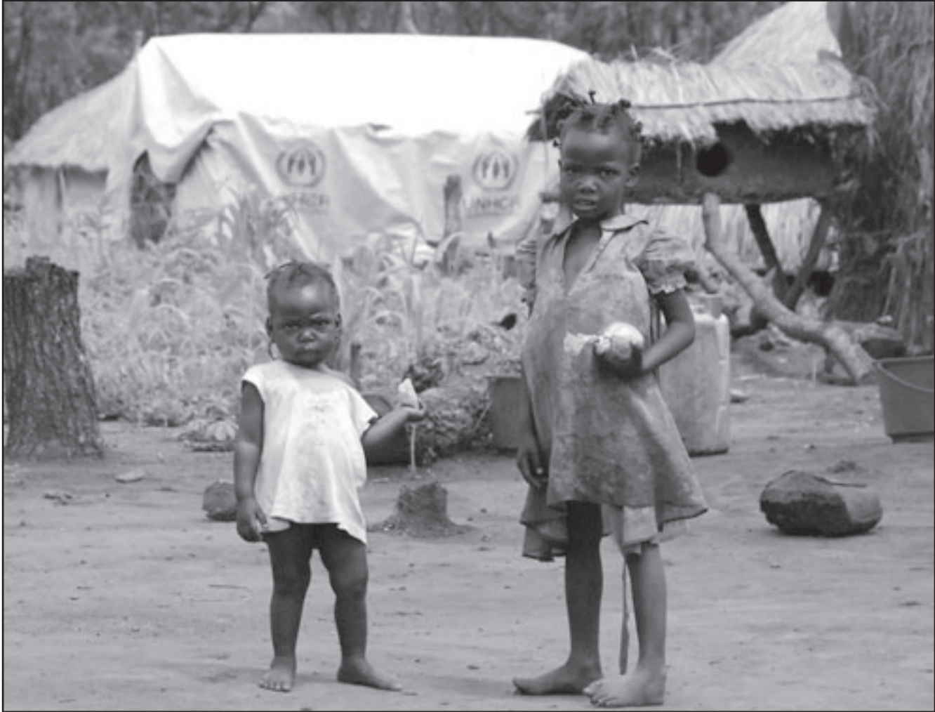
طفلتان في جنوب السودان امس

انحدار أفغانستان الى حالة الفوضى التي عاشتها البلاد بعد خروج القوات السوفييتية نهاية العقد الاخير من القرن الماضي. ويرى محللون انه في حالة رفض عبدالله التسليم بالهزيمة فسقط البلاد أزمة خطيرة، ويعتقد مستشار أوباما قام بمراجعة سياسة أفغانستان انه في حالة انهيار حكومة أفغانستان، فإن كل القوات الأجنبية ومن كل أنحاء العالم لن تنفع، وفي حالة عدم وجود حكومة لا تمتع بشرعية الحد الأدنى فإنه احسن الجنرالات والاستراتيجيات لن تفيد. وتأتي هذه التحليلات الخفيفة في الوقت الذي قدم فيه قائد القوات الأمريكية يوم الاثنين تقييماً مثيراً للقلق، فقد قال الجنرال ستانلي مكريستال، الذي يقود ايضا قوات الناتو ان الوضع في أفغانستان سيء لكن يمكن التغلب عليه، في اشارة تعتبر انها تعيد الطريق امام طلب قوات جديدة هناك. وهذا التقييم بعيد الى الأذهان مخاطر الانحراط الروسي هناك في الثمانينات من القرن الماضي ويضع ادارة أوباما امام خيار تعميق التدخل هناك في وجه المعارضة المتزايدة من المواقين لوجبه في أفغانستان ودعوتهم لسحب القوات سريعاً وشكهم في امكانية انتخاب حكومة شرعية وفاعلة. ومع ان التقييم السري الذي قدمه الجنرال ان يطلب زيادة القوات الا ان مسؤولين أمريكيين يرون فيه اشارة لزيادة عدد القوات، خاصة ان الجنرال