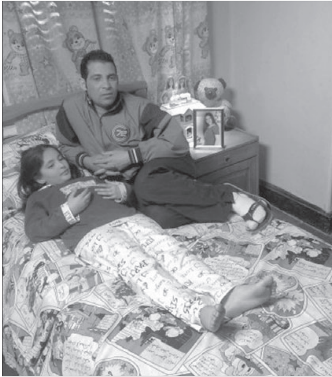
سعد الصغير في لقطة من فيلم «ابقي قابلني»

وعندما يظهر وينجح تبدأ وسائل الاعلام المختلفة المرئية والمسموعة والمقروءة تطلب عمله الفني سواء كان بالتمثيل ام بالغناء. بالنسبة لتردد اسمه في اقسام الشرطة والمحاكم وتحقيقات النيابة قال الصغير: لم ادخل النيابة من قبل.. صحيح هناك محاضر شرطة لكن كلها تظهر انها كيدية لا اصل لها ولهذا يتم حفظها، وهذه ضريبة الشهرة التي تواجه اي فنان يدخل دائرتها. حول المشاكل التي تردت بينه وبين المطرب حكيم قال: نحن على علاقة طيبة وتقابل بالود والاحترام واذا كانت حدثت بعض المشاكل البسيطة زمان ربما لسوء فهم مني الا ان الامور حاليا جيدة ولاقتي بالنجم حكيم اعترى كثيرا. هناك مشاكل اخرى مع المطرب عمدة الم تصل الى حل لها ايضا قال سعد: احب ان اسير في حالي بعيدا عن المشاكل وانا قلبي ابيض ولا احمل بغضا او كراهية لأحد، واي زميل يفتح معي علاقة طيبة افلا ومرحبا لأن اولاد البلد يتسمون بالجدعنة ويحبون امتداد علاقاتهم الطيبة مع بعض. لماذا يتأخر طرح البوماتك رغم انك تنفق عليها كثيرا يرد سعد قائلا: سوق الكاسيت يعانى من مشاكل عديدة اتمنى حلها بسرعة لاعادة هذه الصناعة الى رواجها من جديد لأنها تفقد مئات المنازل وتعمل الاف من الاسر والعائلات وهدمها يطيح بهؤلاء البسطاء الذين يرتزقون منها القليل لكنه يساعدهم على تحمل مشاق الحياة، يكفي ان يطرح الالبوم الجديد الذي يتكلف الملايين ويسرق على الانترنت فور طرحه ويجده الشباب الذي يشتري الالبومات امامه مجانًا بالتاكيد الأزمة الاقتصادية تجعلهم يذهبون الى المجاني ويتركون من له حق الشراء لاعادة ما انتفخ على الالبوم، ولا بد الا نحمل المنصات الفنية فوق طاقتها لان عددها قليل وامكاناتها ضعيفة للغاية ولا تستطيع مواجهة ما فيا سرعة الافغان بهذا الشكل.