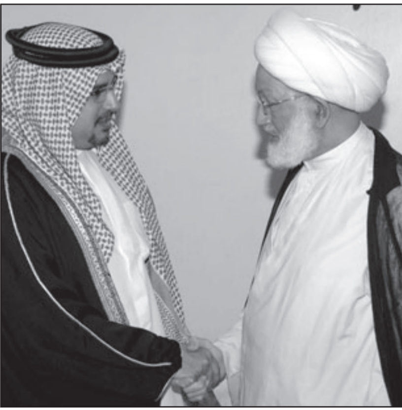
ولي عهد البحرين الشيخ سلمان بن حمد آل خليفة يصافح رجل الدين الشيعي الشيخ عيسى قاسم

ويتمتع الحراس لصالح شركة التعهدات الأمنية المتهم افرادها بجرميه قتل بالعراق وهي «أرور غروب» والتي وقعت عقد سنويا مع وزارة الخارجية قيمته 180 مليون دولار من أجل توفير الحماية للسفارة والعاملين الأمريكيين وغير الأمريكيين فيها. وكانت الخارجية قد قدمت الشركة في شهر تموز (يوليو) الماضي، وفي وقت توقيع العقد اعترف مساعد وزير الخارجية وليام موسر بوجود توجه قصور لكن أداء الشركة على الأرض كان جيدا.