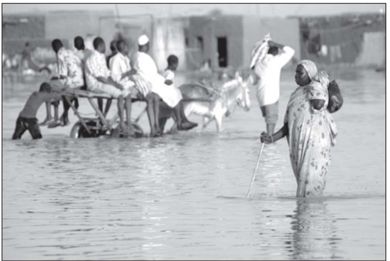
فيضانات ناتجة عن هطول الامطار في السودان

الأقل منذ كانون الثاني (يناير) وربما كان العدد أكثر من ذلك، الأمر المختلف هذا العام هو عدد القتلى واستهداف النساء والأطفال في كثير من الأحيان». وأضاف «من دواعي قلق الأمم المتحدة ومنظمات أخرى تعمل هنا أنه سيكون من الصعب إذا استمر هذا العنف نقل موارد متعلقة بالانتخابات في بعض المناطق المتضررة من العنف». والانتخابات ضرورية لإنجاح اتفاق السلام الذي أنهى حرباً أهلية بين شمال وجنوب السودان ولغرض البلاد لتحقيق استقرار طويل الأجل. وسيصوت الناخبون لاختيار رئيس للبلاد وأعضاء البرلمان وحكام الولايات وأعضاء مجالس الولايات. وسيختار الناخبون في الجنوب أيضاً رئيساً لجنوب السودان وأعضاء مجلسه التشريعي. وتعتبر قبيلتنا النوكا والنوير من جماعات الرعي التي لها تاريخ طويل في سرقة الماشية. واشتبهت قبيلة النوير أيضاً مع جماعة الورلي العرقية الأصغر حجماً وسقط مئات القتلى في مدامها لقرى. وأثنى مسؤولون جنوبيون باللائمة في بعض الاشتباكات على الأقل على أفراد من الحزب الحاكم بالخرطوم. ويقول المسؤولون إن الخرطوم تمدد العنفيين في الجنوب بالسلاح لتصعيد التوتر بين الشمال والجنوب قبل الانتخابات. وتغني الخرطوم أنها تثير اضطرابات عرقية في الجنوب. وبينما تحدث سرقات الماشية عادة في موسم الجفاف من كل عام فإن عدد القتلى هذا العام إلى جانب استهداف النساء والأطفال يشيران إلى تصعيد كبير منذ انتهاء الحرب التي استمرت 22 عاماً بين الشمال والجنوب بعدد اتفاق سلام في عام 2005.