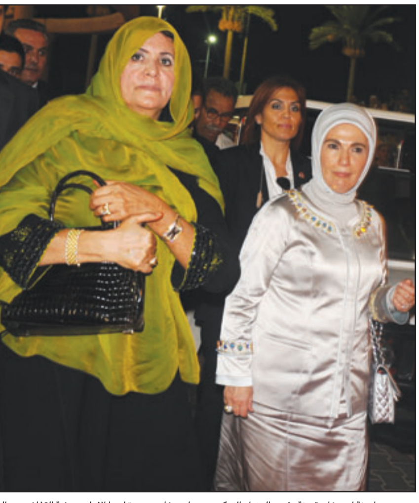
امينة اردوغان قريبة رئيس الوزراء التركي رجب اردوغان وسيدة ليبيا الاولى صفية القذافي... والى اليسار محمد عبد العزيز زعيم جبهة البوليزاريو على هامش احتفالات ذكرى الفاتح من سبتمبر

■ منسحب من احتفالات ذكرى الفاتح من سبتمبر مشاركة جبهة البوليزاريو في احتفالات الفاتح من أيلول (سبتمبر) في ليبيا بانسحاب الوفد الرسمي المغربي من الاحتفالات وظهور بوادر أزمة علاقات بين ليبيا والمغرب. وقالت وكالة الأنباء المغربية الرسمية أن الوفد المغربي الذي مثل الملك محمد السادس، بدعوة من قائد الثورة الليبية المعيد القذافي، في الاحتفالات المقامة لتخليد الذكرى الأربعين لثورة الفاتح من أيلول (سبتمبر)، غادر مكان التظاهرة عندما لاحظ ضمن المدعوين حضور رئيس ما يسمى بـ«الجمهورية الصحراوية» «المزعومة».