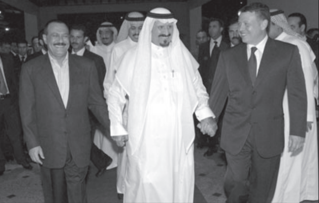
ولي العهد السعودي الامير سلطان بن عبد العزيز يتوسط العاهل الاردني الملك عبد الله الثاني والرئيس اليمني علي عبد الله صالح

ويذكر المجلس بخصوص الوضع بين الكويت والعراق أي ضرورة استكمال العراق تنفيذ كافة قرارات مجلس الأمن الدولي ذات الصلة. وفي إطار الجهود العربية التي تبذل في تحقيق المصالحة الوطنية الفلسطينية، دعا المجلس كافة القوى الفلسطينية إلى استئناف الحوار الجاري بينهم والتوصل إلى اتفاق وأن تضع في قائمة أولوياتها المصلحة الوطنية العليا للشعب الفلسطيني لتحقيق تطلائته في إقامة دولته المستقلة وعاصمتها القدس الشريف».