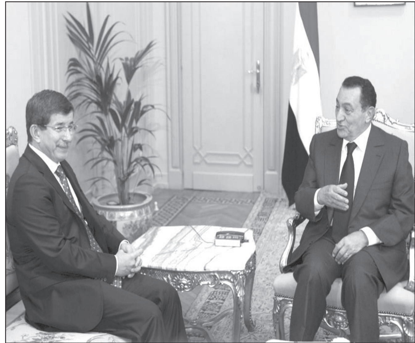
الرئيس المصري حسني مبارك مستقبلاً وزير خارجية تركيا احمد داود اوغلو في القاهرة امس

الدائمة، وقعت في 19 من الشهر الماضي وأسفرت عن مقتل 95 شخصاً وجرح 600 آخرين. وكان العراق طلب من سورية تسليم عراقيين يشتبه بخلوهم في هذه الاعتداءات. وفي مطلع الاسبوع استعدت بغداد سفيرها في دمشق التي ردت بعد بضع ساعات باستدعاء سفيرها في بغداد.