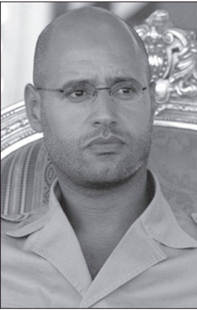
سيف الاسلام القذافي

اتساعاً، ودعا المحافظون الي تحقيق شامل. وقال براون في رسالة الى مايكو بتاريخ السابع من تشرين الأول / اكتوبر عام 2008 «لا ترى حكومة المملكة المتحدة ان من الملائم الدخول في مناقشات ثنائية مع ليبيا بشأن هذه المسألة.» واضاف في الرسالة التي اطلعت عليها رويترز ان ليبيا اجابت بالفعل عن اسئلة بشأن ضلوعها مع الجيش الجمهوري الايرلندي وستعارض بشدة اعادة فتح هذه القضية المرافعة. وقال «هذه الاجابات ارضت حكومة المملكة المتحدة آنذاك واوضحت لليبيا لنا انها تعتبر المسألة منتهية.» أكد براون في الرسالة ان العلاقات التجارية المتنامية من بين الاعتبارات لكنها ليست السبب الاساسي لعدم الدخول في مفاوضات مباشرة. وقال «علاقات المملكة المتحدة مع ليبيا تتضمن التجارة الا ان التعاون الثنائي بات الآن واسع النطاق على مستويات كثيرة وخصوصا في الحرب على الارهاب.» واضاف «اعتقد ان من مصلحتنا ان يستمر هذا التعاون.» وعرض براون الأفكار نفسها في رسالة اخرى بعث بها الي مايكو قبل ذلك بشهر. وفي تلك الرسالة وهي بتاريخ 11 ايلول/سبتمبر عام 2008 قال ان العلاقة مع ليبيا «أولت بمشاكل جزري، وان من مصلحة المملكة المتحدة ان تستمر في ذلك. وكثر ايضا ان الاسئلة بشأن ضلوع ليبيا في امداد الجيش الجمهوري بالمفجرات اوجب عنها. ونفى مكتب رئيس الوزراء الاحد بشكل قاطع الاشارة الي ان براون كان يخشى من ان يفسد صفقات قطعية مرحة. وقالت محدثة باسم مكتبه في داوننغ ستريت «كما يوضح رئيس الوزراء بجلاء في رسالته الي السيد مايكو لم تكن الاعتبارات التجارية عاملا مؤثرا في قرار الحكومة.»