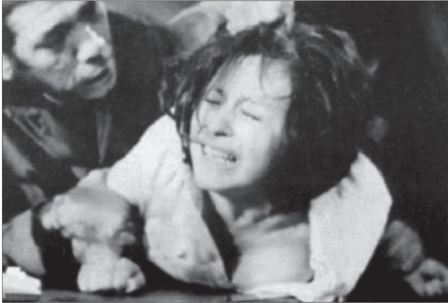
لقطة من فيلم «الكرنك»

والقدر والتمرد على مرارة الواقع ورغبته الملحة في التغيير ويظل الهاشم يضيّق بالشخصيات حتى يصبح الفارق بين الحالتين دقيقاً إلى حد التلاشي، ثم سرعان ما تبين له الخيط الأبيض من الخيط الأسود ويرى بيقينه الفطري أن الإيمان بالقضاء والقدر لا يتنافى مع التمرد على الواقع المؤلم والنزوع إلى حياة أكثر استقراراً وأماناً، فبرغم اليأس الشديد الذي يعانیه البطل وحالة الانكسار التي تنتابه يواصل المسيرة ويأخذ في العدو نحو مستقبل يسير في خط مواز لمناساته كانما هي دعوة للاستمرار والضي مهم كان الضم. وتأتي شخصية جعفر الراوي في رواية «قلب الليل» لتبتح عن ماهية الذات والمعنى والمقصود من الحياة، ويقطع البطل مسافات