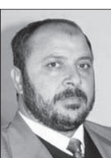
الشيخ نجي الرشيد