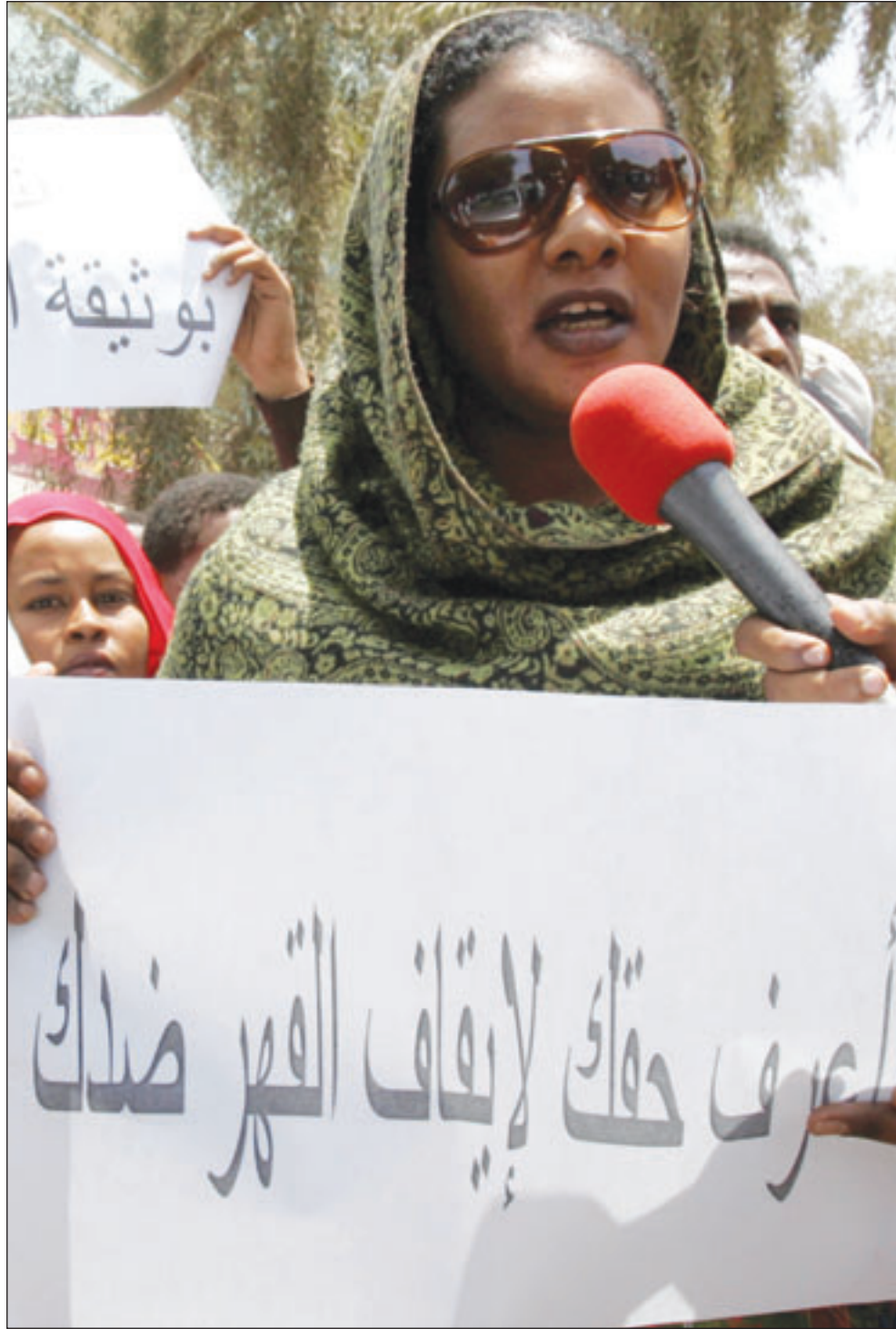
الخرطوم - القدس العربي - من كمال بخيت: