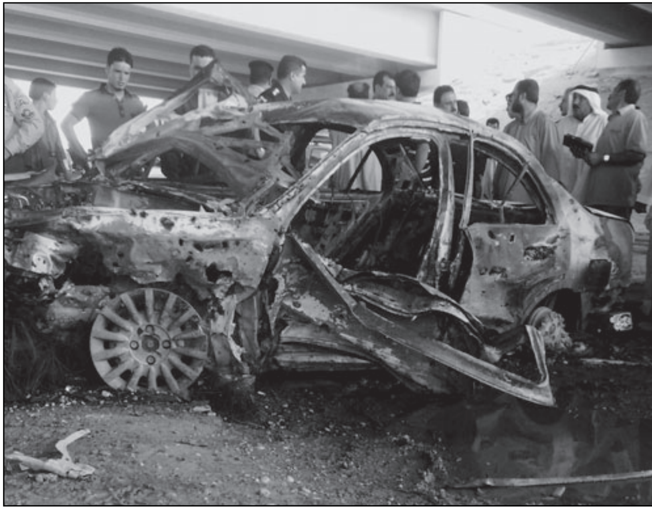
عراقيون حول حطام سيارة انفجرت في الرمادي أمس

بغداد - «القدس العربي» - - من ضياء السامرائي: أقال رئيس الوزراء، نوري المالكي، الناطق الرسمي باسم وزارة الداخلية اللواء الركن عبد الكريم خلف من دون معرفة أسباب هذا القرار. حيث نقل عن خلف إعرابه عن استغرابه لقرار إقالته الذي قال أنه علم به السبت الماضي، وقال إن «القائد العام للقوات المسلحة اتخذ قراراً بإقالته من منصبه من دون معرفتي للأسباب». إلا أن مصدراً أمينياً قريباً من وزير الداخلية أبلغ «القدس العربي» أن سبب الإقالة يعود إلى نفي خلف تورط بعثيين في هجمات الأربعا الدامي، ملقياً باللوم على تنظيم دولة العراق الإسلامية المرتبط بالقاعدة.