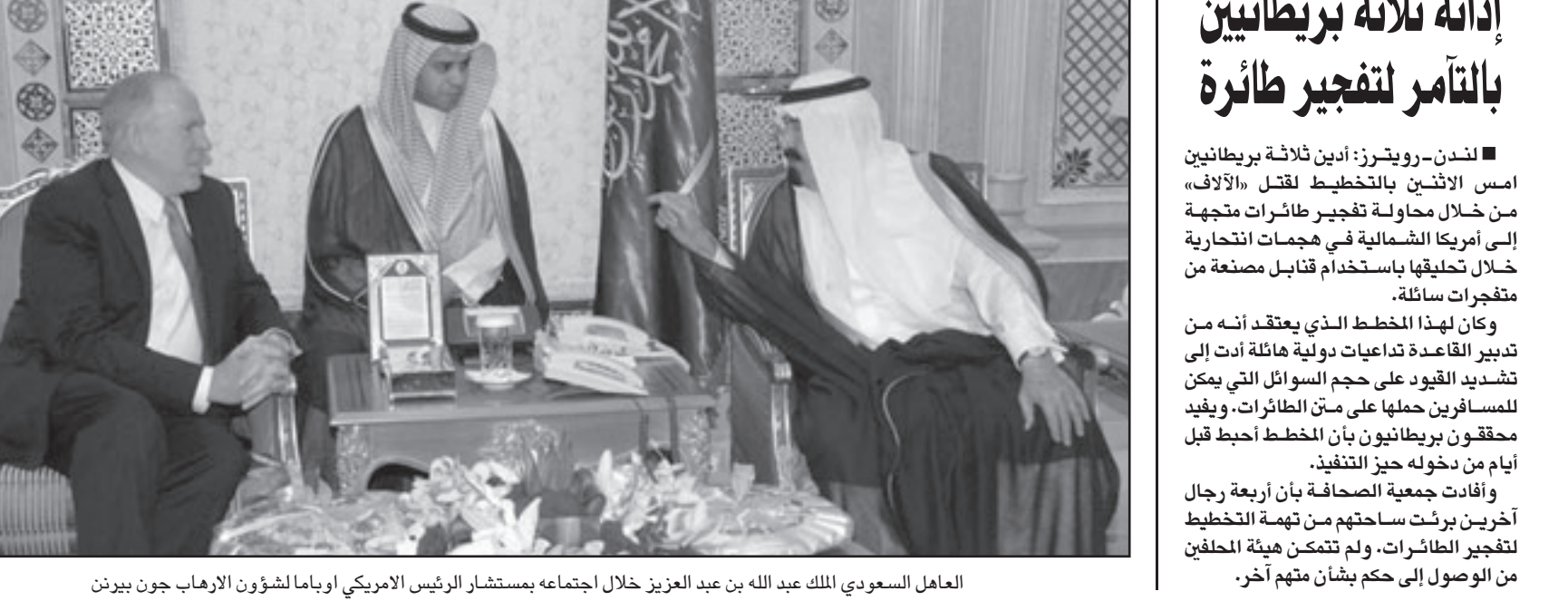
العاهل السعودي الملك عبد الله بن عبد العزيز خلال اجتماعه بمستشار الرئيس الأمريكي اوباما لشؤون الارهاب جون بيرتن

الرياض - اف ب: ذكرت مصادر رسمية ان جون بيرتن مستشار الرئيس الأمريكي باراك اوباما لشؤون الامن ومكافحة الارهاب، اجرى سلسلة من مباحثات مع السعودية واليمن اللتين تشهدان اعمال عنف ذات طابع ديني. وفي جدة، استقبل العاهل السعودي الملك عبد الله مساء الأحد بيرتن، حسبيما اوردت وكالة الانباء السعودية التي لم تذكر تفاصيل حول مباحثات المسؤول الأمريكي في المملكة التي شهدت نهاية آب (اغسطس) اعتداء انتحاريا فاشلا تبناه تنظيم القاعدة استهدف الامير محمد بن نايف بن عبد العزيز مساعد وزير الداخلية وعضو الاسرة الحاكمة المسؤول لمكافحة الارهاب. وكان بيرتن زار قبل ذلك اليمن التي تواجه مسلحتها تصردا شيعيا في الشمال وتيارا