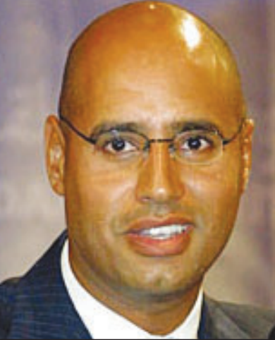
سيف الاسلام القذافي

في هذا الشأن مع ليبيا «لن ينظر اليه بشكل جيد»، ويبدو ان رئيس الوزراء اراد بذلك ان يجنب تعريض التعاون الوليد مع ليبيا للخطر وخصوصا في مكافحة الارهاب. ثم ادلى براون مساء بتصريحات مختلفة ووصفتها المعارضة بأنها «تغيير في الموقف» اذ وعد بدعم اهالي الضحايا في خطواتهم. واعلن ان دبلوماسيين سويساعون ممثلين للذين تزعموا زيارة ليبيا في الاسابيع المقبلة لبدء مفاوضات مباشرة مع القذافي في هذا الخصوص. (تفاصيل ص 7)