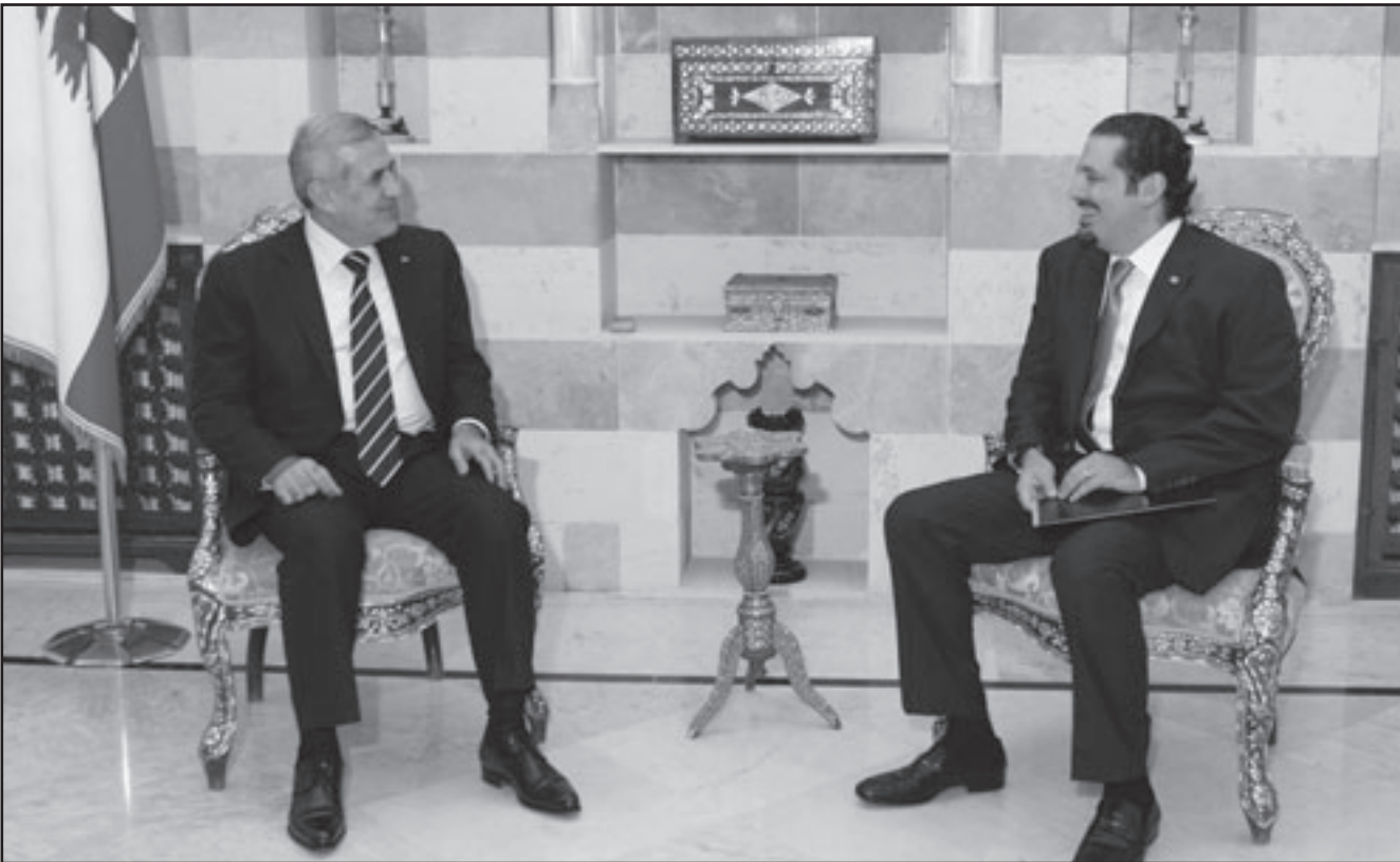
الرئيس اللبناني خلال اجتماعه مع زعيم كتلة المستقبل سعد الحريري في قصر بعبدا

يتم النقاش حولها، وصولا الى ما يرضي (التيار). من ناحية، اكد الوزير السابق وثام هاب ان «حكومة الامر الواقع لا يمكن ان تمر، وهي ستفتح أزمة سياسية لا احد يعرف ألقاها في لبنان»، مشددا على ان «رئيس الجمهورية ميشال سليمان لم يسير في حكومة غير حكومة الوحدة الوطنية، وهو يعرف ان حكومة الامر الواقع هي حكومة تعدد». وأضاف: «من الطبيعي ان يتشاور الرئيس المكلف مع اطراف كافة قبل اعلان الحكومة، الا انه ليس من الواجب ان يعتبر رأي الفريق الذي يتشاور معه الرئيس المكلف ملزما له. عند ذلك يخرج التشاور عن اطاره ولا يمكن ان يتعدى الصريح، ويغدو الرأي التشاوري امرا ملزما لا محذور، وفي هذا افتتحت على صلاحيات رئيس الوزراء الامم المتحدة». وختم «اننا نطالب الجميع بالانفتاح واحدهم على الآخر، مطلوب من الرئيس المكلف ان يكون منفتحاً على رأي المعارضين، ولكن المعارضين يقترض فيهم ان يتحلوا بالانفتاح ايضا. الا انه، في نهاية المطاف، يجب ان يكون حق الفصل والبت من اختصاص الرئيس المكلف، والا ما كان يجب ان يكلف».