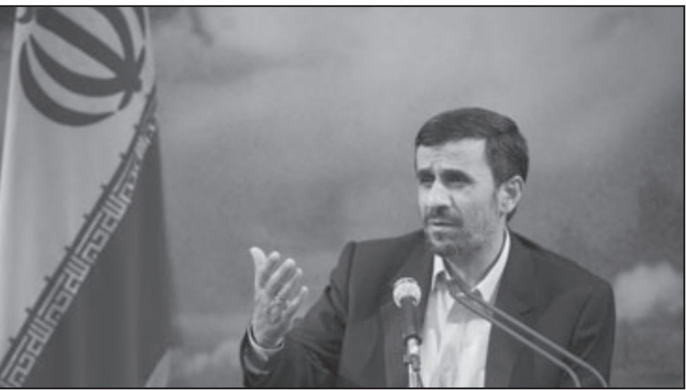
الرئيس الإيراني أحمدى نجاد خلال مؤتمر صحفي أمس

الجمعية العامة للأمم المتحدة التي سوف تعقد في وقت لاحق من هذا الشهر وأدى استعداده لمناظرة الرئيس الأمريكي باراك أوباما، فقال أحمدى نجاد «كما قلت من قبل فإني على استعداد لعقد مناظرة (مع أوباما) في مقر الأمم المتحدة حول جذور المشكلات العالمية الحالية والاستماع للمواقف الأخرى أيضا».