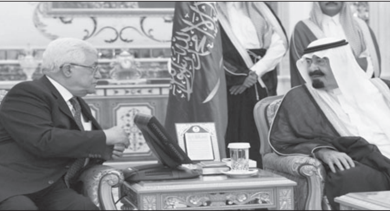
المعال السعودي لدى اجتماعه مع الرئيس الفلسطيني في الرياض