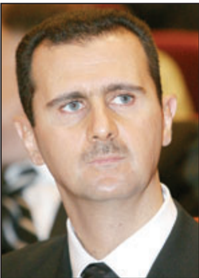
الرئيس السوري بشار الأسد

العربية بخصوص تلك المقترحات، إلى ذلك لم يستبعد مراقبون سوريون حصول لقاءات سورية عراقية في أنقرة في إطار الوساطة التركية المحيطة لاحتواء الأزمة ومنع تدويلها مؤكدين أن دمشق ستكون منفحة على أية خطوات من شأنها نزع فتيل الأزمة.