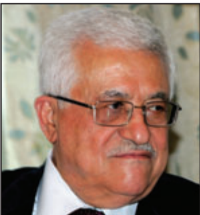
الرئيس الفلسطيني محمود عباس

■ رام الله-د.ب: قالت مصادر فلسطينية الجمعة إن الرئيس الفلسطيني محمود عباس سيتولى الدائرة السياسية لمنظمة التحرير الفلسطينية إثر توافق في اجتماع اللجنة التنفيذية. وذكرت المصادر أن اللجنة التنفيذية توافقت مساء أمس في اجتماع مطول عقده برئاسة عباس على توزيع المهام في إطار اللجنة، فيما تم استحداث دوائر جديدة، حيث برز تولي الرئيس مباشرة الدائرة السياسية بمنظمة التحرير بعد أن كانت سابقاً من مهام فاروق القدومي الذي لم يتولى مهام جديدة.