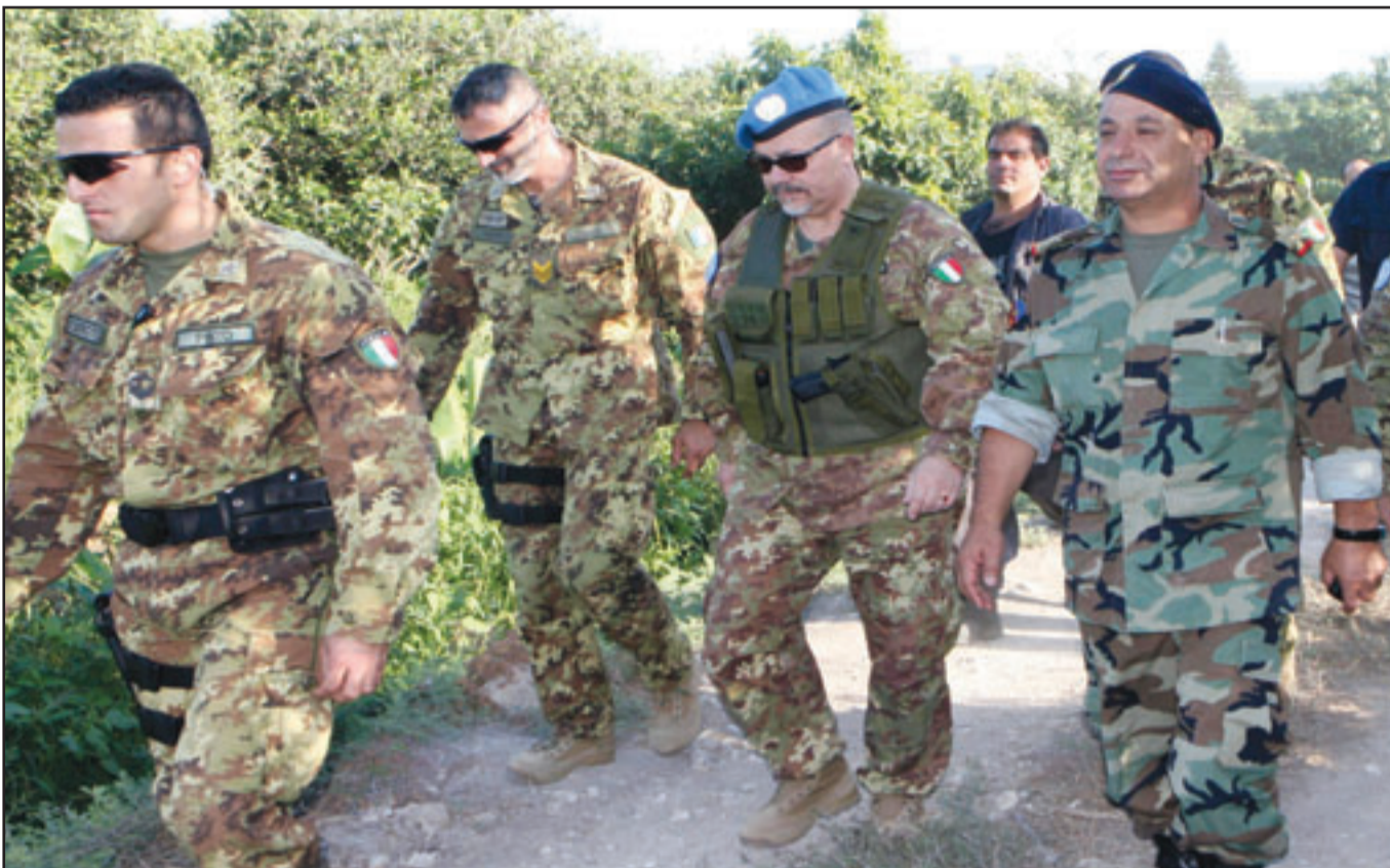
قوات لبنانية وقوات حفظ السلام في جنوب لبنان تتفقد اثار القصف الاسرائيلي