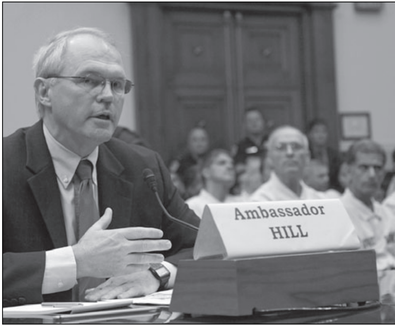
السفير الأمريكي كريستوفر هيل

وأضافت إلى ذلك فان بعض الشركات الخاصة تخصص قاعات عبادة لوظائفها المسلمين وتقوم بتعديل مواعيد عملها