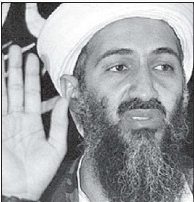
الشيخ أسامة بن لادن

الوادي الجديد غير أنه وقبل أن تتمكن من زيارته تم نقله الى سجن أبو زعبل. ومن المعروف أن رمزي الوافي تجاوز الأربعين عاماً وعمل طبيباً تشكو أسرته بأنه لم يزره أي طبيب قلب وغدد صماء وعظام أو رمد في السجن منذ عام. وقد توجهت العائلة مؤخراً ببلاغ إلى نيابة الخانكة في 22 أغسطس من أجل فتح التحقيق في الظروف والملايسات التي تسببت في أن يقدم رامى على الإضراب عن الطعام خاصة بعد تدهور صحته وتعرضه لمعاملة مهينة وصلت لحد تقديم أطعمه فاسدة ومياه مليئة بالديدان وكانت مصلحة السجن تقلت طبيب بن لادن من استقبالي طرة إلى سجن الوادي الجديد، لكنها رفضت الإفصاح عن مكان احتجازه لأسرته، مما جعلها تقيم دعوى قضائية للكشف عن مكان وجوده، وبعد العديد من المحاولات نجحت العائلة في معرفة مكان وجوده في سجن