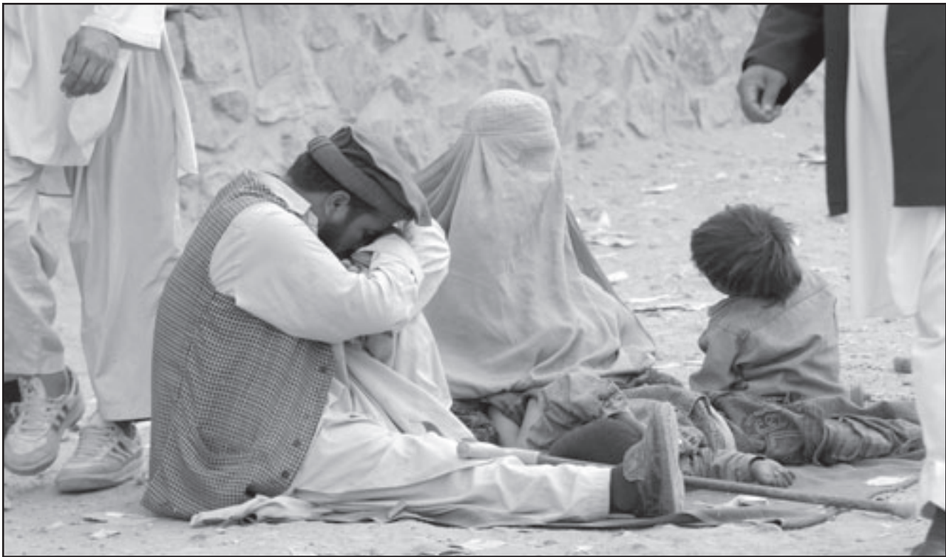
عائلة افغانية تتسول باحد شوارع كابول

تحقيق اهداف اوباما التي اعلنتها خلال تعديل الاستراتيجية في آذار (مارس) الماضي لسحق طالبان، واغرب مولين عن قلبه بان الاتهامات بشأن تزوير الاصوات في الانتخابات الرئاسية التي جرت مؤخرا «لا تساعده» في تعزيز مكانة حكومة كابول بين افراد الشعب. وقال السناتور الجمهوري لندسي غراهام «يمكن ان ترسل مليون جندي، الا ان ذلك لن يعيد الشرعية الى حكومتهم. هل توافقنا على ذلك؟» ورد مولين «هذه حقيقة»، وحذر بعد ذلك من ان الفساد «يشكل تهديدا ممانا للتهديد الذي يشكله طالبان».