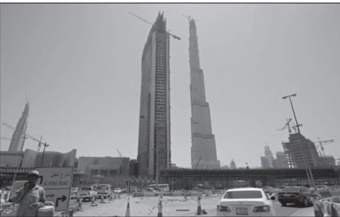
الحرس الثوري الإيراني خطط لتفجير المبنى الاعلى في العالم