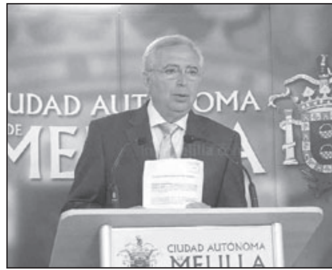
رئيس حكومة الحكم الذاتي في مليلية المحتلة، خوسيه إميرودا

عملت على فك الارتباط الديني بعدما منعت أئمة قادمين من المغرب تولى الإمامة في مساجد المدينتين المحتلتين وعدم الدعا للملك محمد السادس في الصلاة. وكان المغرب قد ندد بهذه الإجراءات، ولكنه لم يقم بأي رد فعل عملي ملموس حتى الآن. ويرى مغاربة المدينتين وخاصة في مليلية والذين يحملون الجنسية الإسبانية أن عدم اهتمام سلطات الرباط بسكان المدينتين من أصل مغربي دفعهم للبحث عن بدائل،