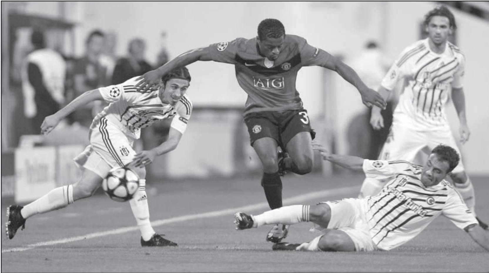
لحظة من مباريات مانشستر يونايتد أمس في بطولة أوروبا

الهزيمة أمام فيرنو بريمن في الدور قبل النهائي لبطولة الموسم الماضي لكنه يتطلع أيضا إلى استغلال الفرص الثمينة المتاحة أمامه والوصول إلى نهائي البطولة التي تقام على ملعبه في أيار/مايو المقبل. ويتصدر هامبورغ جدول الدوري الألماني (يونيدسليجا) حاليا ويأمل في الظهور بنفس المستوى في مباراته الأولى بدور المجموعات في البطولة الأوروبية والتي يخوضها أمام رابيد فيينا النمساوي في المجموعة الثالثة التي تشهد أيضا لقاء هامبورغ مع أيبس الإسرائيلي مع سيلتيك الاسكتلندي في إسرائيل. وقال الدفاع بوريس مانيسين بتحقيق بداية جيدة يعد شيئا مهما للغاية. فبذلك يمتلك التقدم خطوة كبيرة نحو الدور الثاني، وخاصة بتحقيق الفوز في المباراة الثانية بعدها. ويتنافس بلنسية الأسباني الفائز بكأس الاتحاد الأوروبي عام 2004 مع أقدم نادي إيطالي وهو جنو في المجموعة الثانية، ويفتح بلنسية مشواره في المجموعة بقاء مصيفه ليل الفرنسي بينما يلتقي جنو مع سلافيا براغ التشيكي في إيطاليا. وفي المجموعة السابعة يخوض كل من لاتسيو الإيطالي وفيراري الأسباني مباراته الأولى على ملعبه حيث يستضيف لاتسيو فريق سالزبورج النمساوي كما يلتقي فيراري مع ليفيسكي صوفيا البلغاري. وقال فيرناندو رويج رئيس نادي فيراري «إنها بطولة جديدة ونحن سعداء بالمشاركة فيها؟