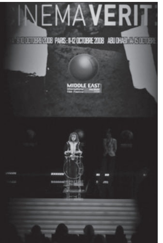
من مهرجان الشرق الأوسط السينمائي 2008