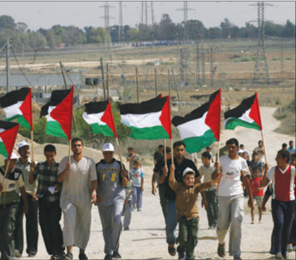
فلسطينيون يتظاهرون على مدخل حاجز اسرائيلي في غزة للمطالبة برفع الحصار عن القطاع