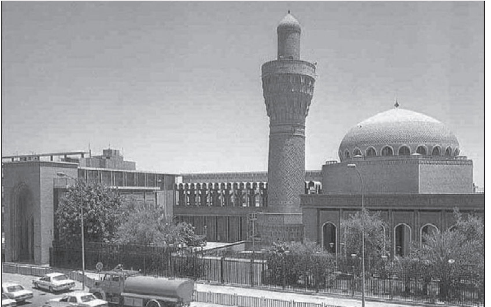
جامع الخلفاء في بغداد