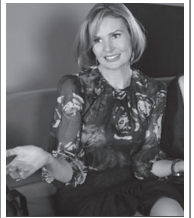
لقطة من مسلسل «خاص جدا»

ولم ينس المخرج وكاتب السيناريو أن يبرز اللحظات الإنسانية التي تنشأ عادة في زمن الحرب، وتلك اللحظات القاسية حين يتكشف إنسان الحرب أن قاتله تخلق عنه في الميدان ولا يزال الفرار أو خان وطنه. وبردة الفعل التي جعلت جندياً عراقياً يتحدر بسلاحه الشخصي لأن الحياة في وطن حر أصبحت مستحيلة. وجعل الفتاة العراقية تقص شعرها حزناً على ما آل إليه العراق. وكثيرة هي رداً الفعل تلك. ويتكرنا هذا العمل الدرامي المهم بالأعمال