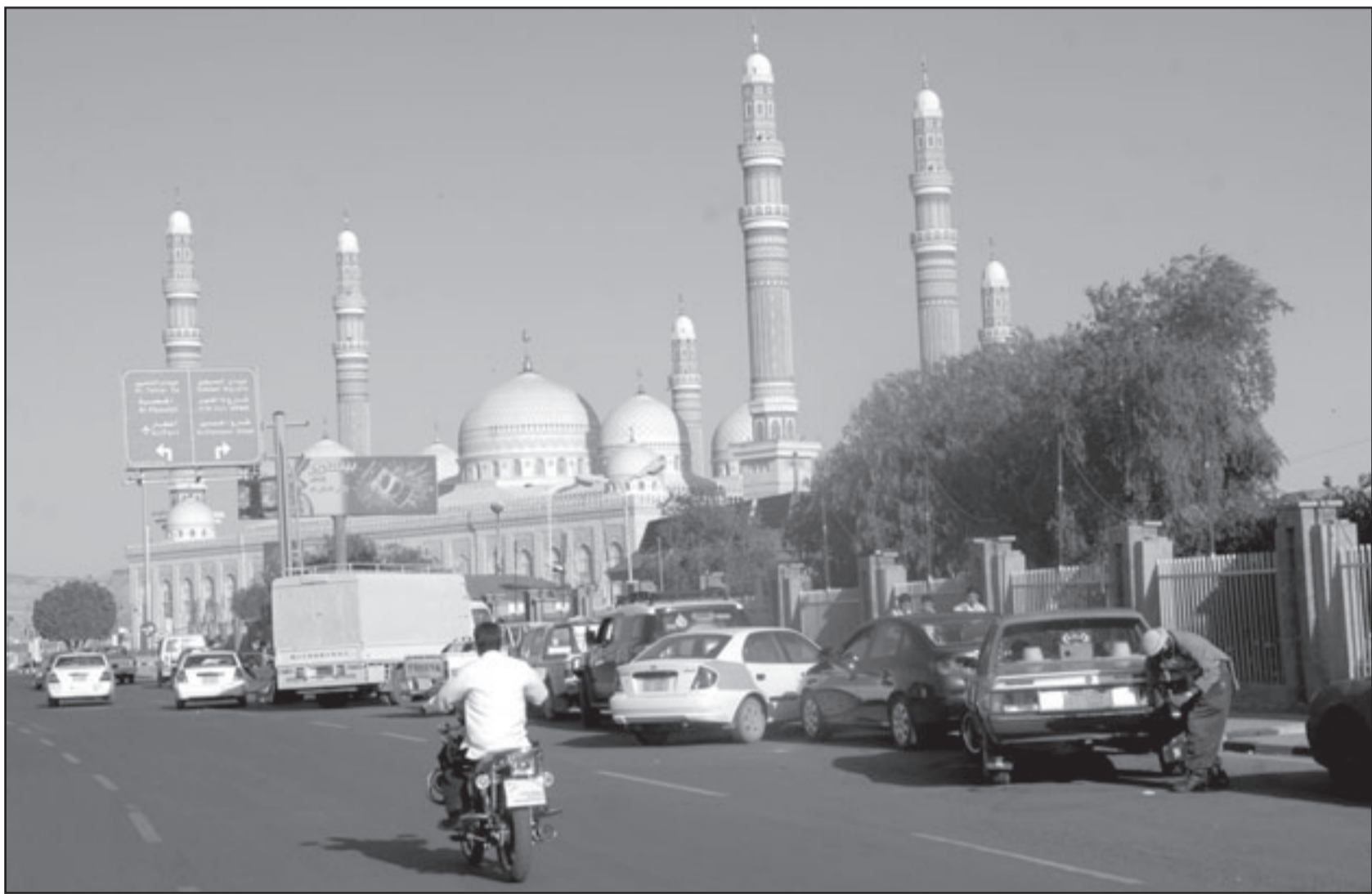
جامع الصالح في صنعاء حيث ادى الالف اليمينيين صلاة العيد

■ صنعاء - ا ف ب: قتل أكثر من 140 متمردا شيعة الاحد اول ايام عيد الفطر في شمال اليمن في معارك عنيفة مع الجيش اليمني على الرغم من هدنة اعلنتها الحكومة وخرقها المتمردون حسب ما ذكر مصدر عسكري.