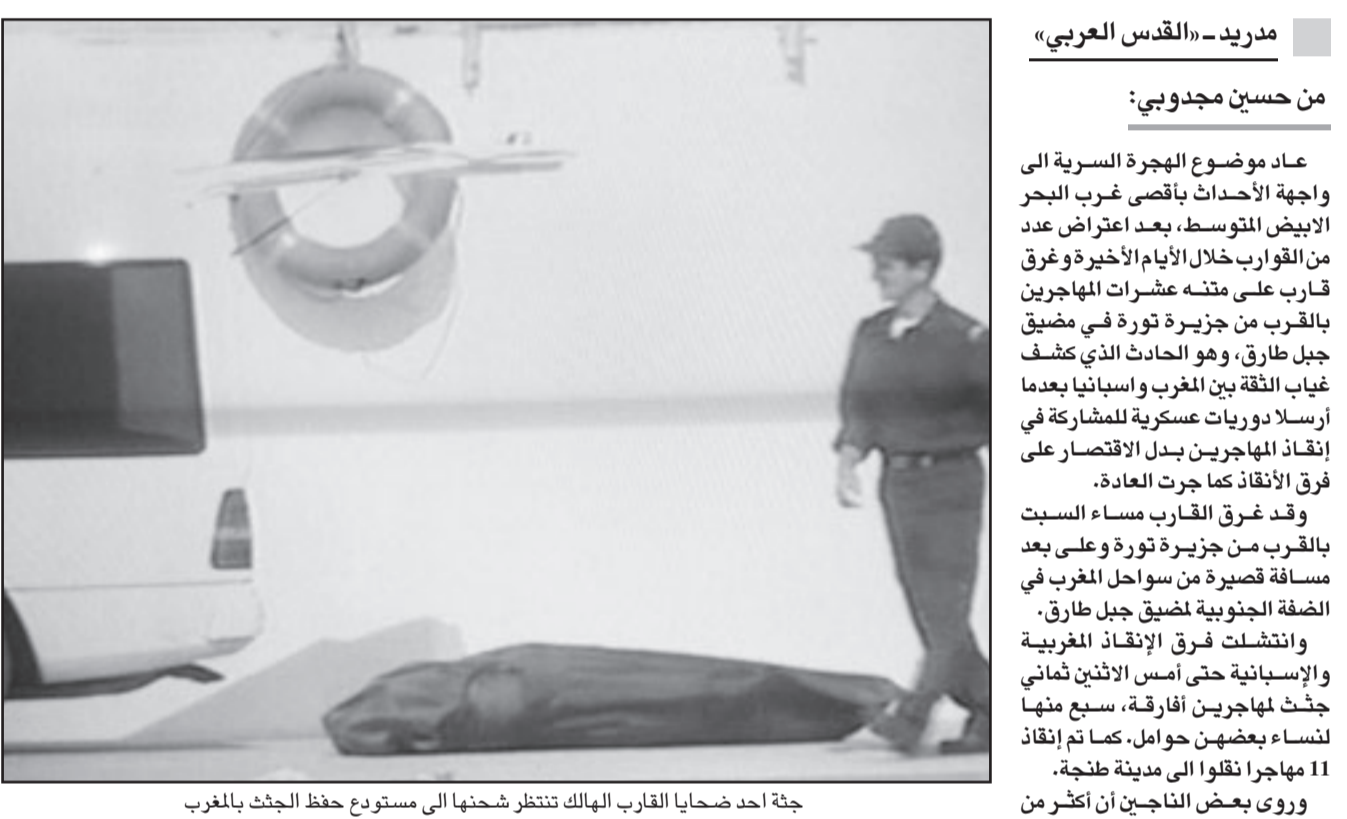
جثة أحد ضحايا القارب الهالك تنتظر شحنها إلى مستودع حفظ الجثث بالمغرب

■ مدريد - «القدس العربي» من حسين مجدوبي: عاد موضوع الهجرة السرية إلى واجهة الأحداث بأقصى غرب البحر الأبيض المتوسط، بعد اعتراض عدد من القوارب خلال الأيام الأخيرة وغرق قارب على متنه عشرات المهاجرين بالقرب من جزيرة تورة في مضيق جبل طارق، وهو الحادث الذي كشف غياب الثقة بين المغرب وإسبانيا بعدما أرسلتا دوريات عسكرية للمشاركة في إنقاذ المهاجرين بدل الاقتصاد على فرق الإنقاذ كما جرت العادة. وقد غرق القارب مساء السبت بالقرب من جزيرة تورة وعلى بعد مسافة قصيرة من سواحل المغرب في الضفة الجنوبية لمضيق جبل طارق، وانتشلت فرق الإنقاذ المغربية والإسبانية حتى أمس الاثنين ثمانية جثث مهاجرين أفارقة، سبع منها لنساء وبعضهن حوامل. كما تم إنقاذ 11 مهاجرا تقولا إلى مدينة طنجة. وروى بعض الناجين أن أكثر من أربعين مهاجرا كانوا على متن القارب بينهم أطفال ورضع. وتبقى الحصيلة النهائية للغرقى والمفقودين في هذه المأساة مجهولة، فقد يتعدى الأمر عشرين غرقيا، ولا يستبعد نجاة الكثيرين بحكم أن القارب غرق قريبا من الشاطئ المغربي. ومثل المهاجرون الناجون من الممسة الابتدائية في مدينة طنجة، وأفادت وكالة «إيبي» أمس الاثنين أن المغرب قد نقل المهاجرين إلى الحدود الشرقية مع الجزائر، حيث يعتقد أنهم دخلوا من هناك إلى الأراضي المغربية. والترحيل نحو الحدود الجزائرية يعني أساسا الطرد.