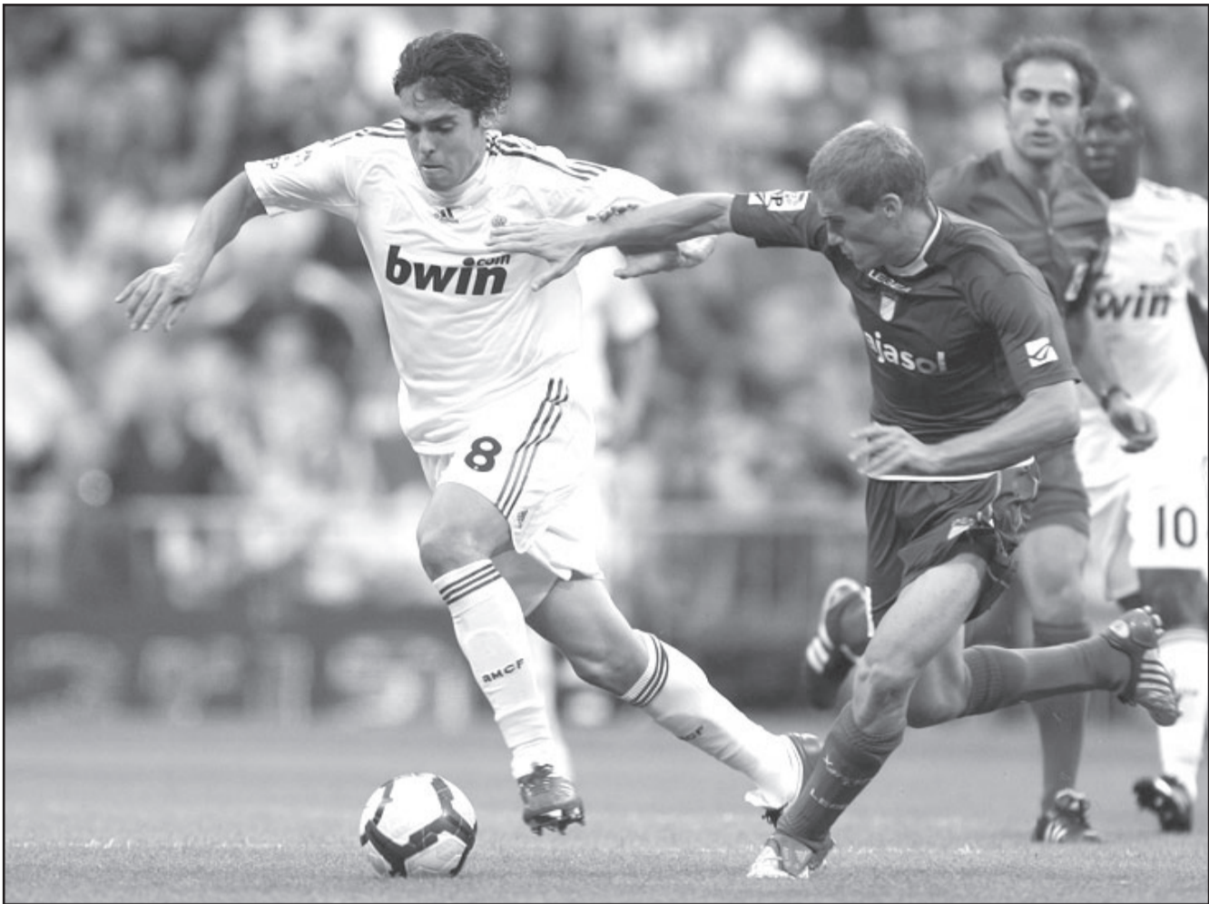
كাকা نجم ريال مدريد (يسار) يتفرد بالكرة في مباراة بالودري الاسباني

الفريق في مباراته الأخيرة السبت، وذلك من أجل إفساح المجال أمام مشاركة البرازيلي المتألق لويس فابيانو. وقال خيمينيز: «إنها المشكلة التي يمكن أن يستمتع بها أي مدرب». يلتقي برشلونة في وقت لاحق اليوم الثلاثاء مع ضيفه راسينج سانتاندر، صاحب المركز التاسع بالدوري الأسباني. وكعادته، رتب جوسيب جوارديولا، مدرب برشلونة، لتوجه فريقه بقيادة النجم ليونيل ميسي وزملائه إلى سانتاندر في الصباح الباكر يوم المباراة من أجل منح لعبه أكبر فرصة لقضاء وقت راحة أطول بصحبة أسرهم. ومن المرجح أن يتخذ جوارديولا راحة للمهاجم الفرنسي تييرى هنرى، مع الدفاع بأندريس إنيستيا في مكانه المعتاد بالجانب الأيسر من الملعب. ولم يلعب إنيستيا أي مباراة منذ بدايتها خلال الشهور الأربعة الأخيرة منذ أن أصيب بتهتك عضلي في فخذه. من ناحية أخرى، تنتجبه الأظفار لبقاء ريال مدريد مع فياريال غا الأربعاء خاصة أن الفريق المكي خسر مرتين على ملعب فياريال خلال الواسم الثلاثة الماضية. ويتصدر ريال مدريد حاليا ترتيب مسابقة الدوري الأسباني لهذا الموسم بفارق الأهداف بعدما تغلب على فريق القاع خيريز 5/ صفر الأحد، وسجل النجم البرتغالي كريستيانو رونالدو هدفين في تلك المباراة. ويتصدر رونالدو قائمة الهدافين بالدوري الأسباني حاليا برصيد أربعة أهداف بالتساوي مع ديفيد فيا مهاجم بلنسية يوم الخميس المقبل.