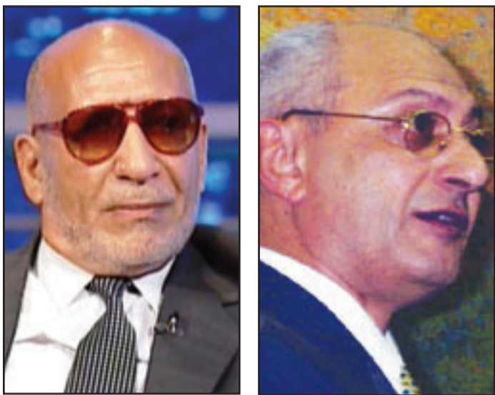
المستشار محمود الخضيرى