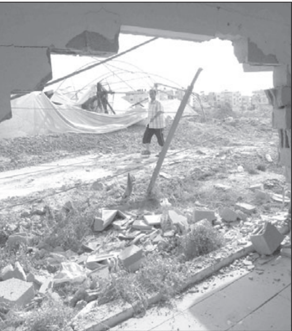
فلسطيني يتفقد آثار القصف الإسرائيلي على رفح