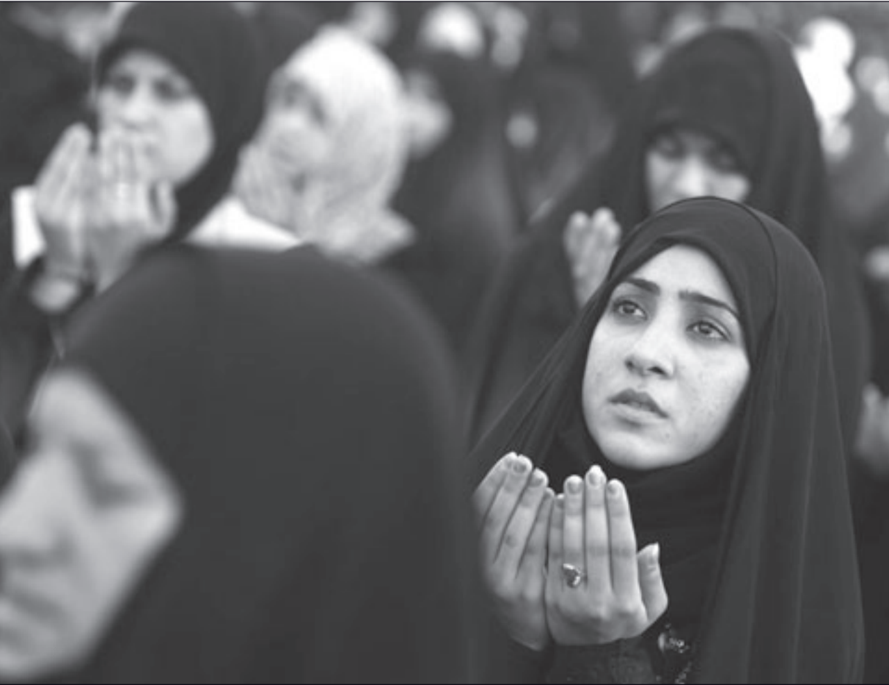
سيدات عراقيات اثناء احتفال بالعيد في بغداد امس

اما عضو البرلمان العراقي اسامه النجيفي فقد رفض المشروع مؤكدا ان لاطراف دولية ولجان الامم المتحدة دورها في تصاعد ازمة مناطق نينوى، وقال: نحن نرفض هذا المشروع الذي يحاول سلب الارض مستغلا ظروف العراق الحالية وهناك اطراف دولية