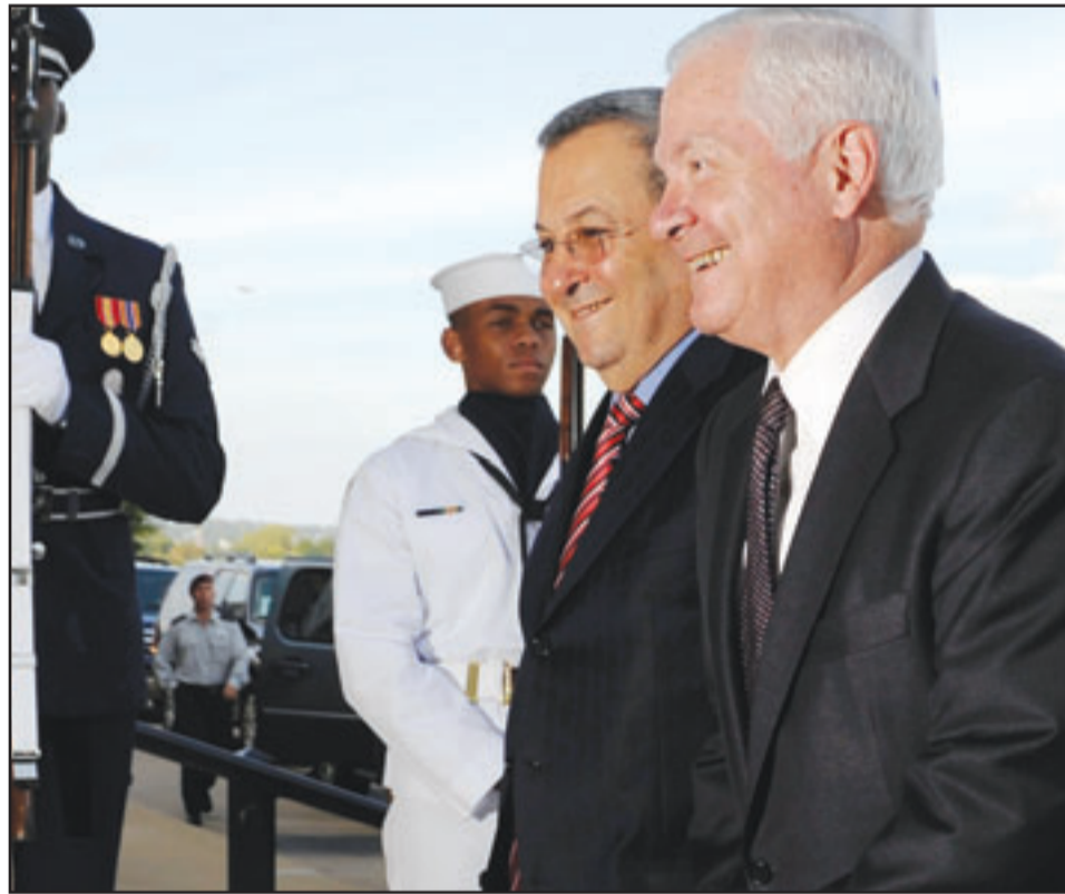
وزير الدفاع الامريكى روبرت غيبس لدى استقباله نظيره الاسرائيلي يهود باراك في البيتباغون امس

القدس المحتلة - «القدس العربي» - وكالات: