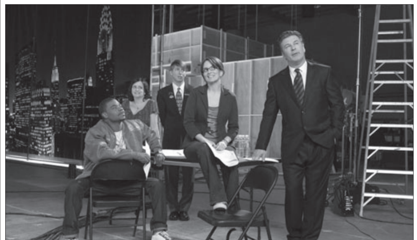
لقطة من مسلسل «30 روك»

واحتفظ الممثل الرئيسي في المسلسل اليك بولدوين