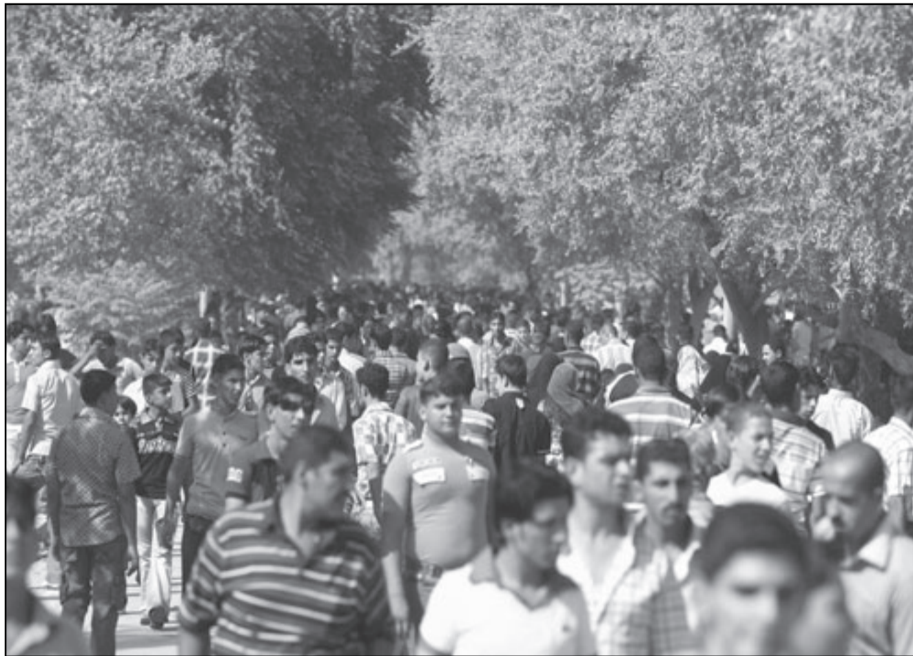
الآلاف العراقيين في حديقة الزوراء اول ايام عيد الفطر

وضحكهم واليوم يمثل العيد بصدى البكاء والخوف واليأس.