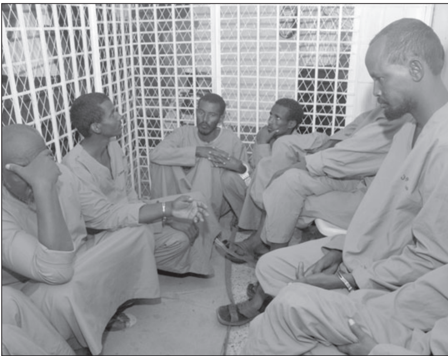
قراصة صوماليون في قفص الاتهام بمحكمة في صنعاء أمس اثناء محاكمتهم بتهمة خلف سفينة يمنية

عشرين متمردا قتلوا «بعد مواجهات مع قوات الجيش خلال تطهير المنطقة التي تقع فيها محطة جرمان والنازل الجبارة لها»، في صعده. من ناحية اخرى، قال مصدر امضى لوكالة الانباء اليمنية ان 44 متمردا احيلاوا الى النجابه العامة لحاكمتهم، وهم يشكلون المجموعة الاولى من دفعة تضم 127 عنصرا اراهابيا اعتقلوا خلال المواجهات، من جانبها، أكد مجلس الدفاع الوطني الذي يرأسه الرئيس اليمني ان «معرض لاطلاق النار قبل التزام المتمردين بشروطها التي حددتها والتي تشمل خصوصا وقف التمردين القتال وانهاء تمرسهم في الجبال وتسليم السلاح والافراج عن اسراهم المدنيين والعسكريين. وقال المجلس في بيان نقلته وكالة الانباء اليمنية «لا خيار امام تلك العناصر (المتمردين) سوى الاستجابة لما جاء في مباداة الحكومة من نقاط ليقاء العمليات العسكرية حقنا للدماء وتحقيقا للسلام». وفي مدينة زنجبار عاصمة محافظة ابين الجنوبية، اصابت امرأة بجروح في مواجهات الاثني بين قوى الامن ومسليحين فيما سجلت عودة للتوتر بين السلطات والناشطين الجنوبيين، وذلك حسبما افاد مصدر مسؤول الثلاثاء. ونقلت وكالة الانباء اليمنية عن المصدر انه «ثناء نزول قوة امنية لاداء مهامها الامنية»، في زنجبار «تعرضت لاطلاق وابل من النيران من قبل بعض تلك العناصر الاجرامية المطلوبة»، في اشارة الى الناشطين الجنوبيين، وقد ردت قوة الامن على هذه النيران. واقاد المصدر ان «ذلك ادى الى اصابة امرأة من قبل تلك العناصر كما قامت الاجهزة الامنية بالقاء القبض على عدد من افراد تلك العناصر الاجرامية» مشيرا الى ان عدد اعضاء المجموعة يصل الى ثلاثين شخصا.