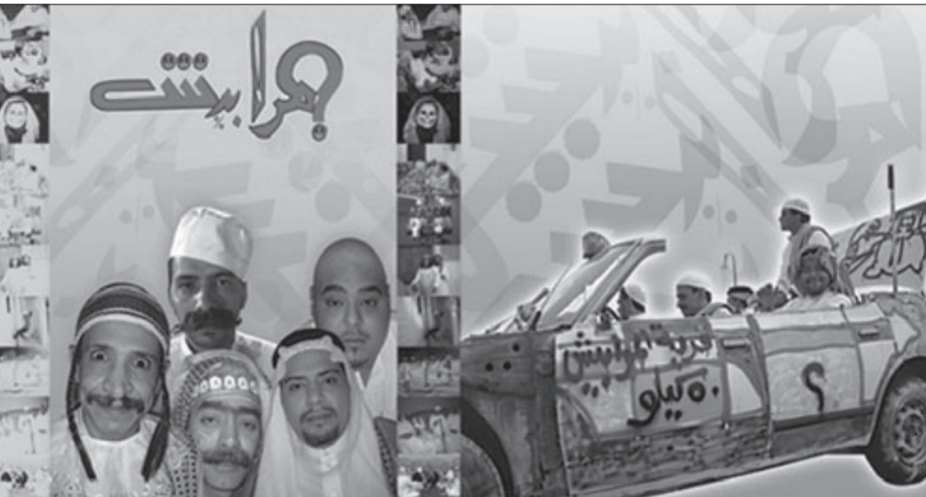
ملصق مسلسل «المرابيش»

ورغم كل هذه المآخذ تبقى التجربة هامة وتستحق التشجيع، لأنها قد تفتح أفقاً تجريبياً لكوميديا مختلفة... وقد تسهم في تطوير آلية التفكير بصناعة الكوميديا الاجتماعية التقليدية، بعيداً عن طغيان التثرثر واستمراء الهرج والمرج بحجة أن ذوق المجتمع الخليجي في الإضحاك هكذا! mansoursham@hotmail.com