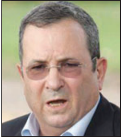
لندن - الناصرة - «القدس العربي»