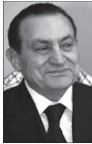
الرئيس حسني مبارك

لله تعالى بالدعاء عقب جميع الصلوات وفي الأسحار؛ حتى يزل الله تصرفه على المراهبين المجاهدين، ويرد كيد الصهاينة العتدين. واختتمت الجبهة ببيانها مؤكدة أنه لا بد أن يعلم الجميع أن قضية القدس والأقصى فلسطين هي معيار الشرعية الحقيقية للنظام السياسي العربي والإسلامي، وهي رمانة الميزان في الوحدة العربية والإسلامية، وأن التخلي عنها يسقط الشرعية عن كل نظام ينفض يده من هذه المسؤولية.