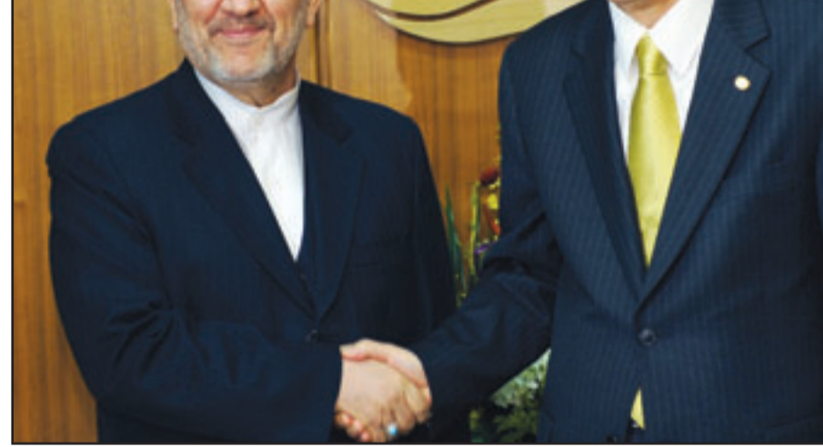
الامين العام للامم المتحدة بان كي مون يصافح وزير الخارجية الايراني مؤشهر متكي في نيويورك امس