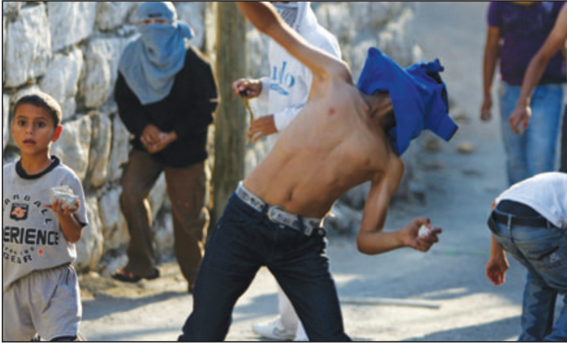
صبيّة فلسطينيون يرشقون بالحجارة قوات الاحتلال الاسرائيلي في القدس امس