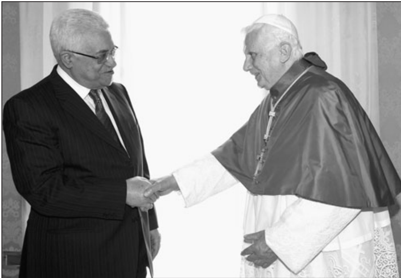
البابا لدى لقائه الرئيس الفلسطيني في الخاتيانك امس

مكتفة واحتياطات واسعة لتفادي اندلاع مواجهات في القدس، وتحديدًا في محيط المسجد الاقصى بعد صلاة الجمعة اليوم. وبحقوقه الوطنية المشروعة من أجل تأكيد عروبته القدس والاعراب عن تمسكنا بمقدساتنا الاسلامية والمسجدية.. ودعت اللجنة المركزية للجنة الرباعية والامم المتحدة بشكل خاص الى القيام بدورها تجاه شعبيتنا وقضيتنا العادلة وتجاه القدس باعتبارها ارضا فلسطينية محتلة يجب عدم المس بواقعها الحضاري والديني والجغرافي والسكاني.