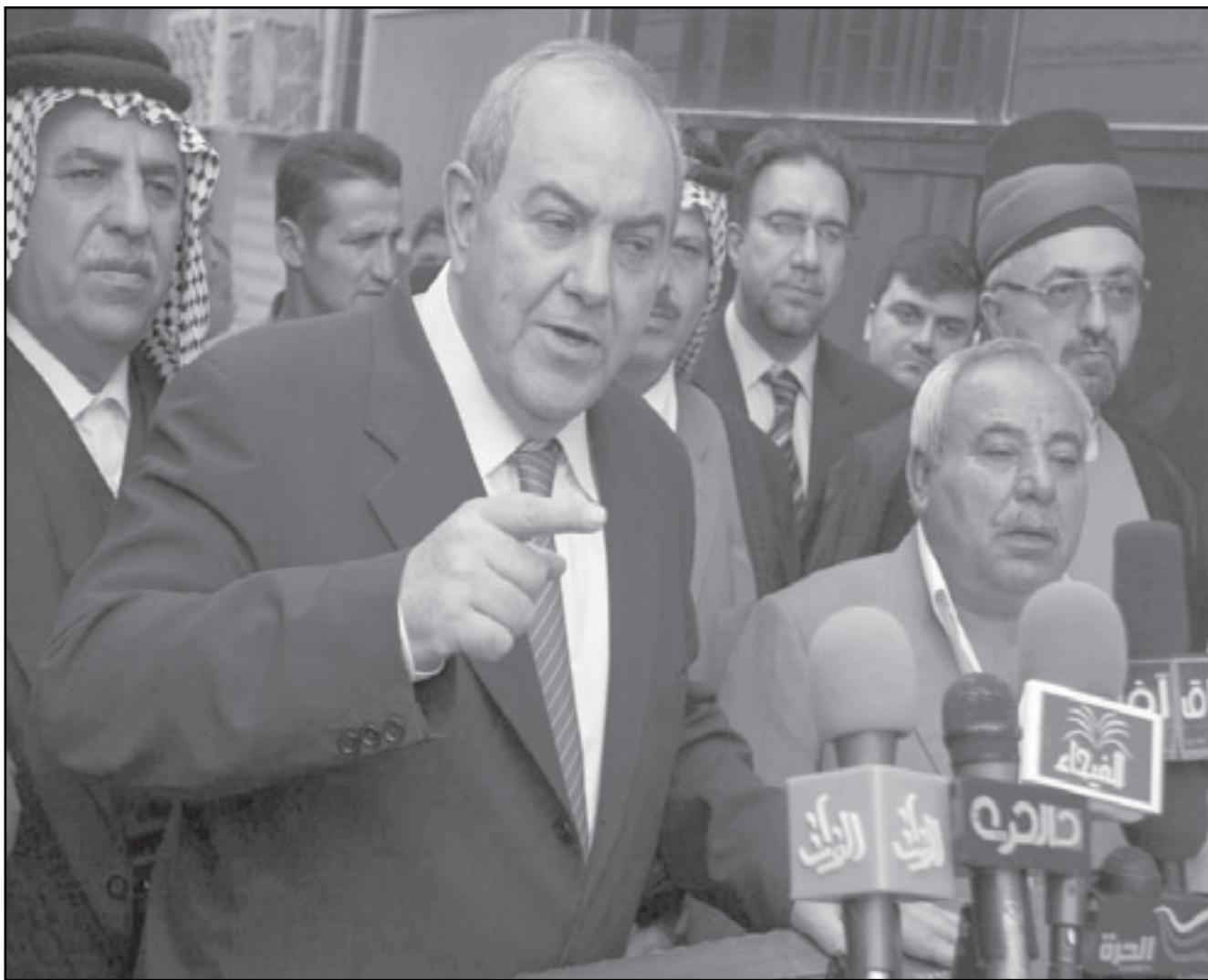
أياد علاوي يتحدث بزيارة لآية الله السيستاني أمس

وفي تصريحات خاصة له القدس العربي، أكد حمدي خليفة نقيب المحامين أنه ليس يوسع أي أحد منع مظاهرة لنصرة الأقصى مندباً للشائعات التي تردت عن وجود خطط لحظر العمل السياسي داخل النقابة. وشدد على أنه مع كافة المساعي التي