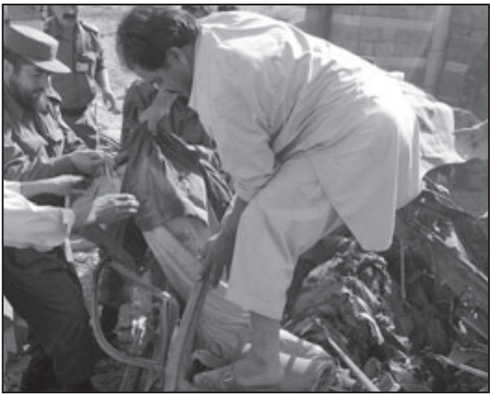
افغان ينتشلون جثث ضحايا التفجير في كابول أمس

موقع الانفجار إلى أجزاء من مركبة محطمة كدليل على أن الهجوم وقع بسيارة مفخخة. وقال مصدر في السفارة الهندية التي تقع بالقرب من وزارة الداخلية الأفغانية إن القتلى لم يكن بينهم مواطنون هنود، إلا أن سوريا كان يحيط بالسفارة دمر وتهشمت نوافذ السفارة. ومن جانبه، أدان الرئيس الأفغاني الانفجار، وقال بيان صادر عن مكتبه إن الرئيس يدين الهجوم الذي يعتبر «عملاً إرهابياً يستهدف شعبنا البري». من ناحية أخرى، أدان كاي إيد مبعوث الأمم المتحدة للشؤون الأفغانية الهجوم أيضاً، بينما قالت السفارة الأمريكية في كابول إنه «لا يوجد تبرير لهذا النوع من العنف الوحوش». وأعلنت حركة طالبان مسؤوليتها عن الهجوم الانتحاري الذي وقع أمس