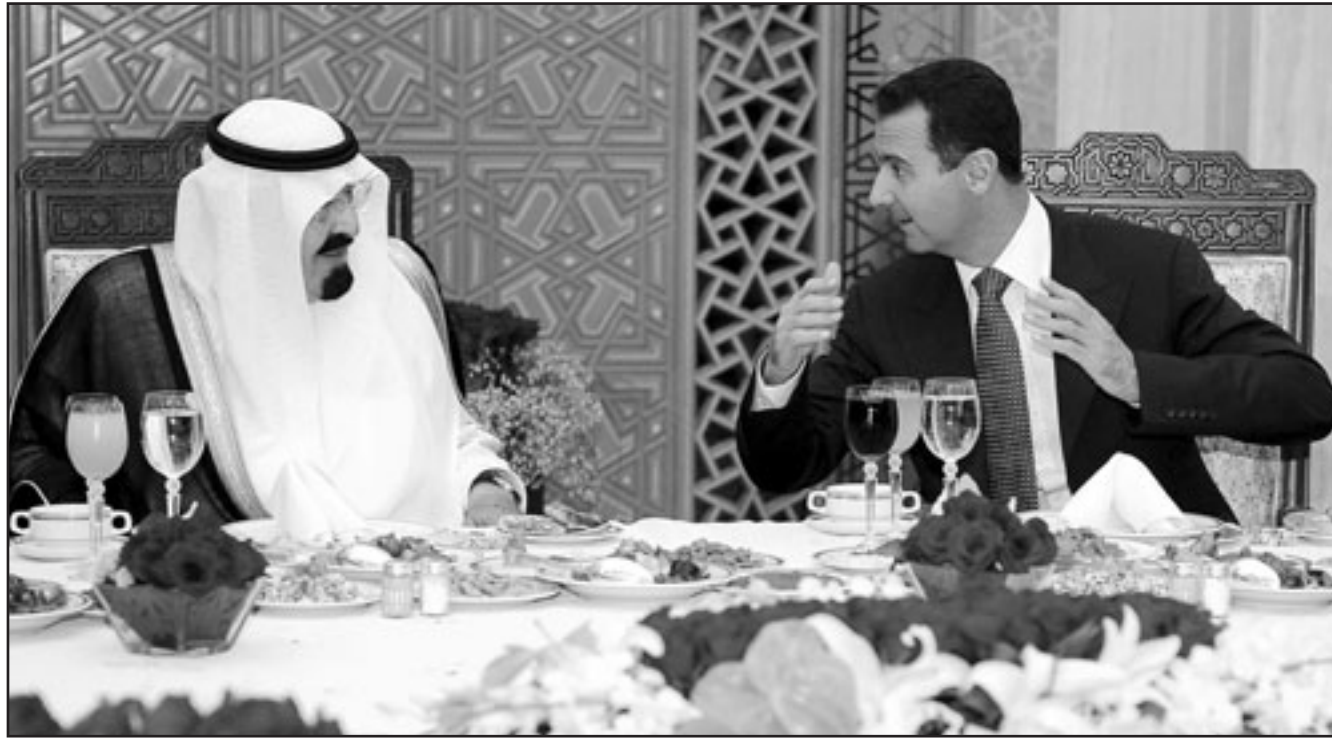
الرئيس السوري بشار الأسد والعهال السعودي الملك عبدالله على مأدبة الغداء في دمشق امس