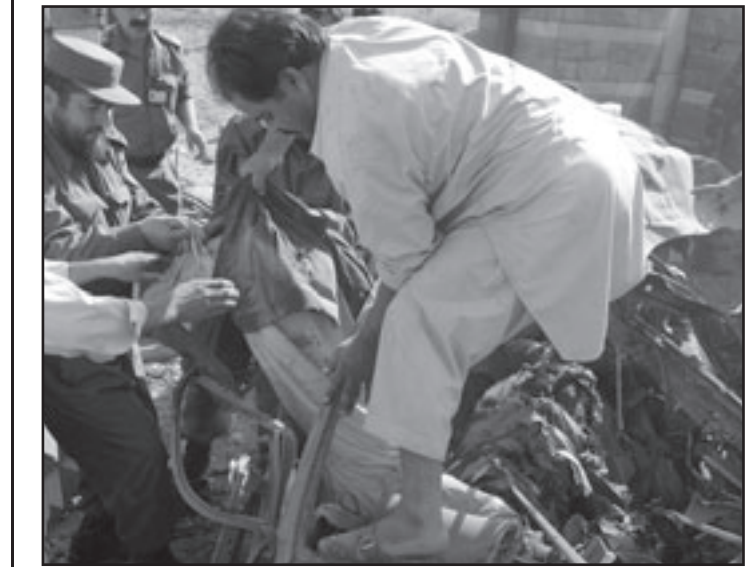
افغان ينتشلون جثث ضحايا التفجير في كابول أمس

مقديشو - أ ف ب: أعلن فصيلان إسلاميان متطرفان كانا يتواجهان منذ أسبوع للسيطرة على منطقة كيسمايو في جنوب الصومال، انهما توصلا إلى اتفاق لوضع حد لأعمال العنف وحل خلافهما. وأعلن الشيخ حسين فيدو المسؤول في حركة الشباب في مؤتمر صحفي في مقديشو «بعد أيام من المفاوضات المشاقة، توصل أخوة السلاح إلى اتفاق يحل الخلاف الذي كان سبب المعارك في كيسمايو». وأوضح «أن المسكرين سيحترمان، وحسب هذا الاتفاق، الخلاصات التي ستتوصل إليها لجنة ستحقق في أسباب الخلاف، وستحل المشكلة بحسب الشريعة». وكان المقاتلون في حركة الشباب وعناصر ميليشيا الحزب الإسلامي المتحالفون في مكافحتهم للحكومة الصومالية الانتقالية، يتواجهون منذ أسبوع في معارك عنيفة للسيطرة على كيسمايو، وهي مدينة ساحلية جنوب غرب مقديشو على المحيط الهندي، وأسفرت المواجهات عن عشرات القتلى. وأكد أحد قادة الحزب الإسلامي في العاصمة الشيخ محمد على حصول الاتفاق.