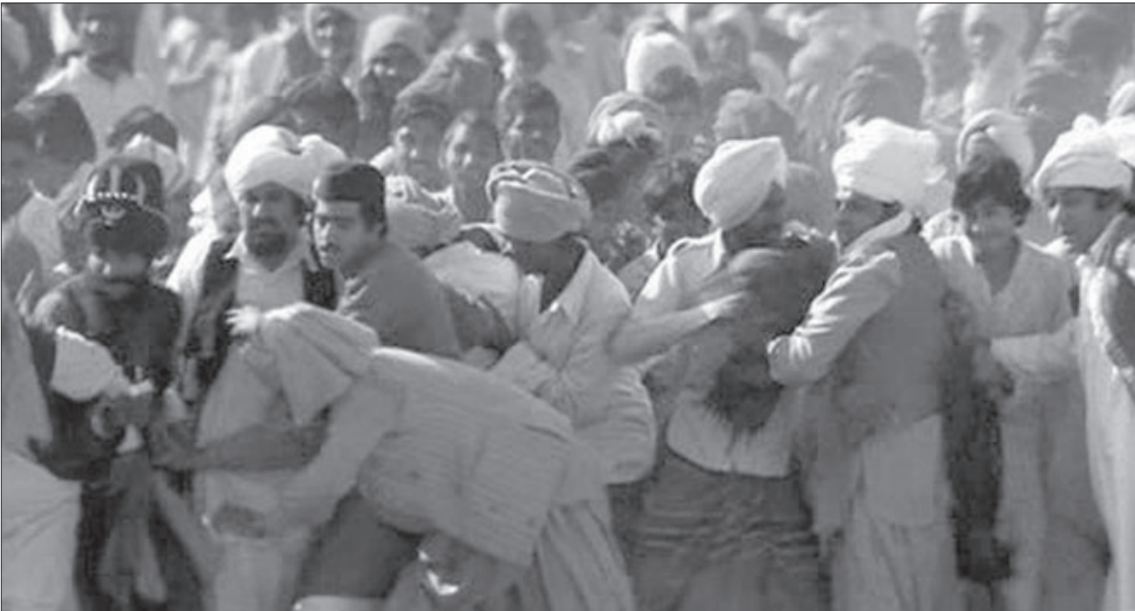
فيلم «غاندي» محتشد بالمشاهد المتوازية الرامية إلى فكرة التسامح

في كل ما حدث ويحدث ويحدث من حروب على سطح الكرة الأرضية، وربما يكون هذين الشبيئين هما السبب في تحجيم العاطفة الحسية بينه وبين زوجته، ومن ثم كان طرحه الاستغاثي عليها: (ستقبلين ذلك بصدر رحب، أو لا تقبلين على الإطلاق) متفادياً الوقوع في صيغة من الصيغتين الاستغاثيتين (صيغة السؤال الحامل لإجابته، وصيغة الأمر الملزم للتفنيد الفوري)، ومع هذا فإن طرحه الاستغاثي يتضمن هاتين الصيغتين، ومن ناحية أخرى يتشابه هذا الطرح مع ما طرحه مفتش القطار على غاندي (حرك مؤخرتك إلى...) (والا...). وبالمناسبة: ليس عمل غاندي في المستوطنة يشبه عمل المفتش أو المشرف؟ أمعنى هذا أن في غاندي تكمن بذرة استعمارية استعمارية؟ لم لا، في كل منا صفات متنجحة وصفات استثنائية وهامشية، وتحت شروط وظروف معينة قد ينمو بعضها على حساب الصفات السائدة التي قد تتحول إلى صفات كامنة. وعلى العموم فإن فيلم «غاندي» محتشد بالمشاهد المتوازية الرامية إلى فكرة التسامح عبر طرح إمكانية تبادل الأدوار أو أن الدول المستعمرة (بفتح الهمزة) كانت هي الدول المستعمارية، والعكس بالعكس، وبالتالي تحية السبب الماركسي قليلاً (صراع الطبقات) وتقديم السبب النفسي الثقافي، أو ربط السببين ببعضهما البعض، وهذا هو حال معظم الأفلام التي تندو متحازة للشعوب ومنها فيلم (غاندي).