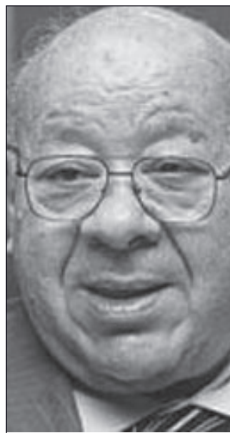
السفير إبراهيم يسري

وتابع «تم مراعاة الشروط القانونية في الترشيح للمنافسات التمهيدية وأن يكون