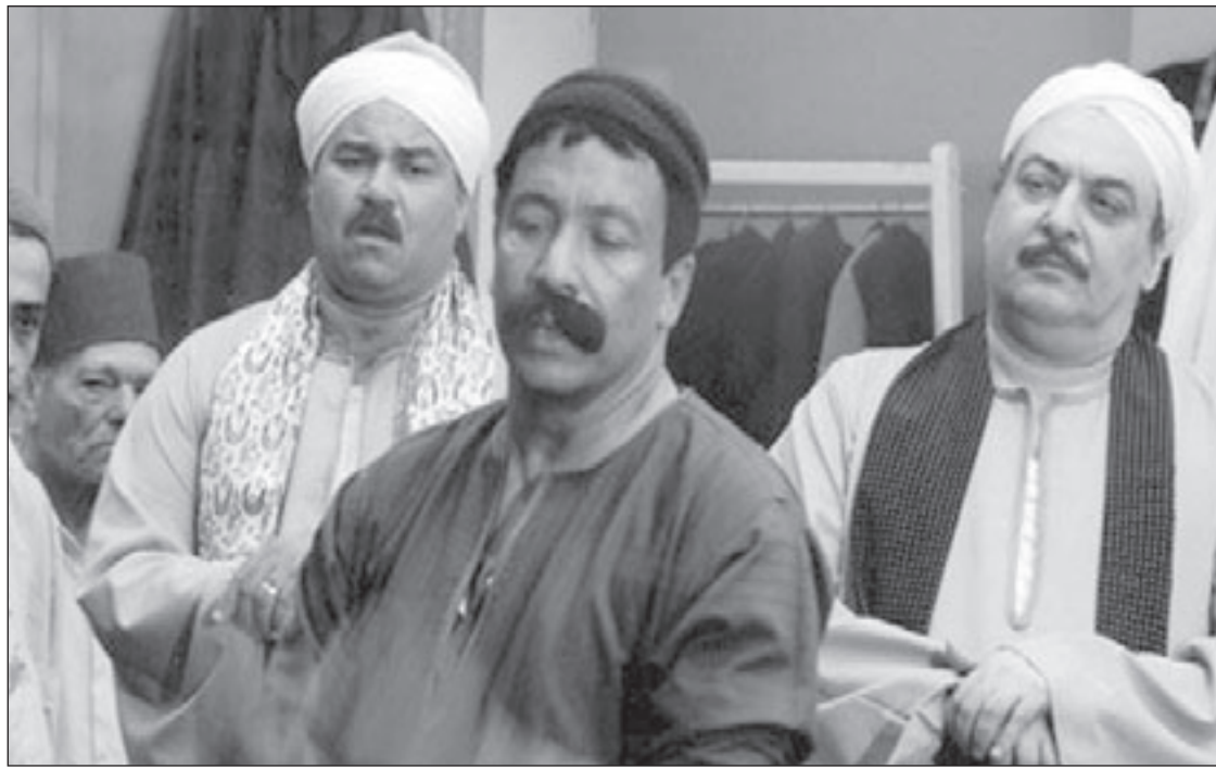
لقطة من مسلسل «المصراوية»

ومن يصلح لها، وأرى دخول الشباب للبطولات أمر إيجابي طالما أنهم يحملون المهبة واثبتوا أنفسهم في الأعمال التي شاركوا بها. أضافت: كما أن هناك ادراك من المنتجين لإضافة دماء جديدة إلى بطولات المسلسلات. عن رأيها في تقديم الفنانين للبرامج التلفزيونية قالت: لا أفضل هذا العمل ويجب ان يعمل كل شخص في تخصصه ليحقق النجاح فالممثل ممثل والمذيع مذيع، ومع ذلك لا أنكر ان هناك