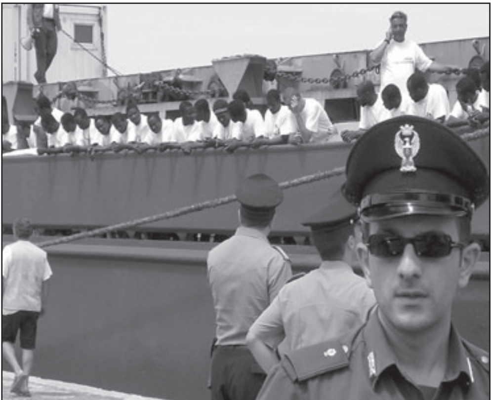
رجال أمن الطابيون يجرسون مركبا ألمانيا وصل الى ميناء صقلية في تموز (يوليو) محملا بمئات المهاجرين الأفارقة ويرأت محكمة إيطالية الأربعاء ثلاثة من طاقم المركب من تهمة المشاركة في تهريب مهاجرين غير شرعيين

وأضاف البلاغ أنه تم توقيف سبع طائرات بعد هبوطها بالمغرب، كما تعرضت بعض الطائرات لعمليات إحراق للحيلولة دون تحديد هويتها، وأفضت التحقيقات التي قامت بها السلطات إلى اعتقال أربعة إسبان وأمريكي واحد و35 مغربيا خلال السنتين الماضيتين.