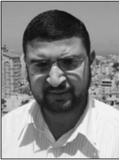
سامي أبو زهري