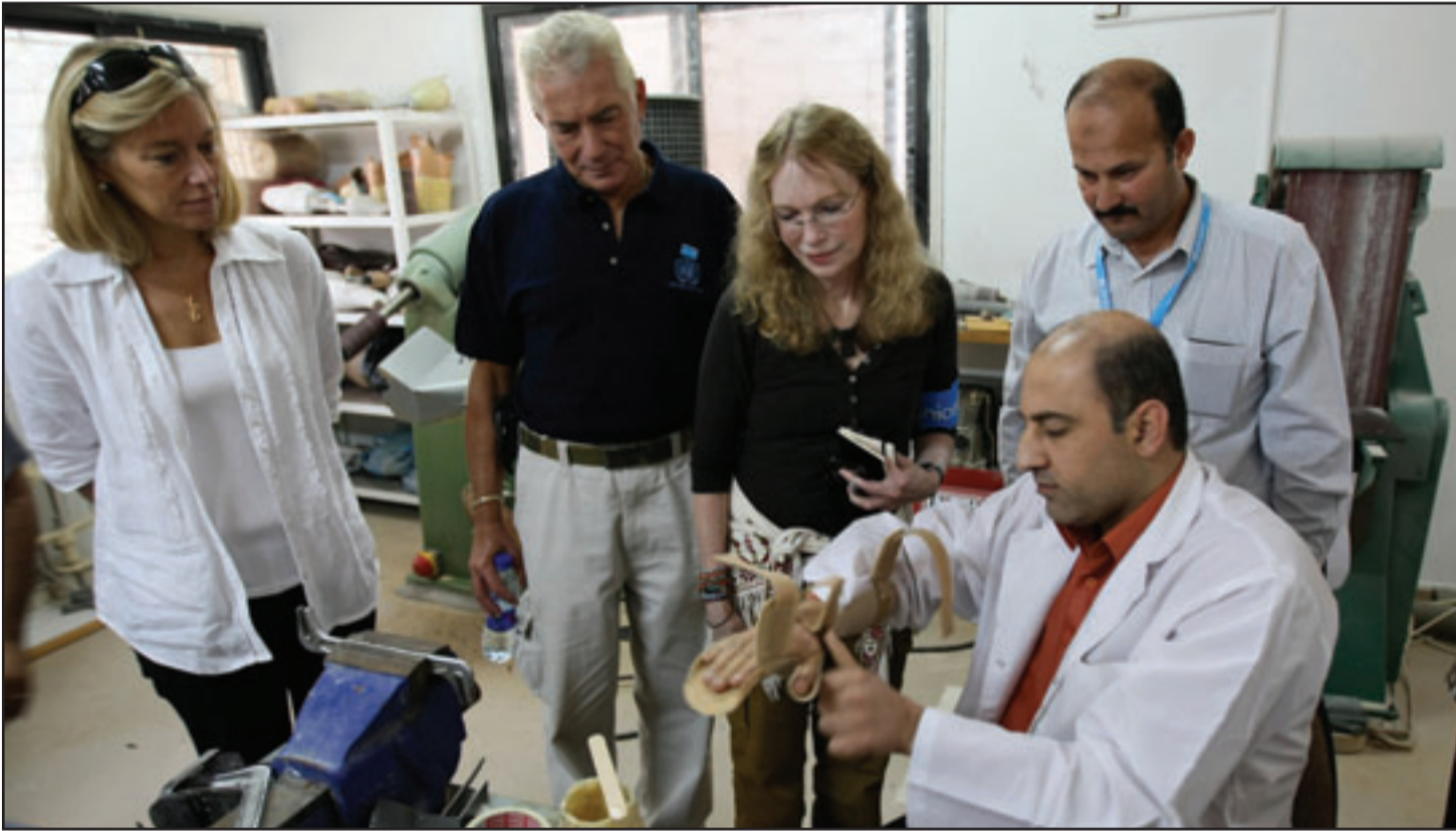
سفيراً منظمة اليونيسيف للتوايا الحسنة المثلة العالمية ميا فارو والممثل المصري محمد قابيل يزوران مركزاً لتأهيل المصابين في مدينة غزة أمس