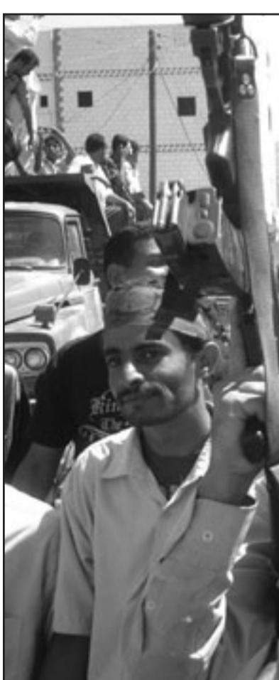
مسلحون جنوبيون خلال مظاهرة في جنوب اليمن