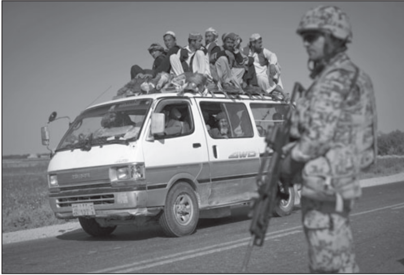
جندي من القوات الألمانية أمام حاجز لقوات الناتو في أفغانستان

وقال المتلون إن التوصيات المفصلة التي قدمها مكريستال سيناقشها رؤساء أركان الدفاع في حلف شمال الاطلسي في بروكسل يوم السبت قبل اجتماع لوزراء دفاع دول الحلف يعقد يومي 22 و23 تشرين الاول (أكتوبر) في براتيسلاف.