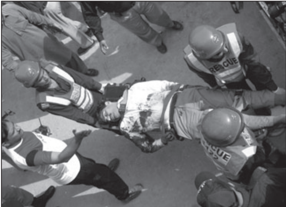
رجال اسعاف باكستانيون يقومون بنقل أحد ضحايا التجنيرات في لاهور

وقوع «هجوم انتحاري بشاحنة (فان) مفخخة»، وقالت الشرطة ان المهاجم اقتحم سيارة الجدار الخلفي لركب الشرطة في كوهاه وان البنتي تعلق به اضرار كبيرة.