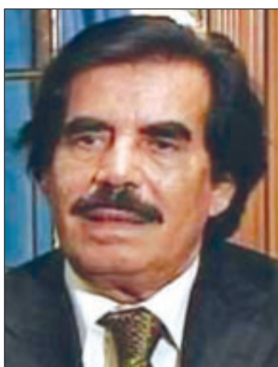
علي سالم البيض

لندن - «القدس العربي»: علمت «القدس العربي» ان الحكومة المصرية تبذل جهوداً مكثفة لغاء مؤتمر لوزراء خارجية دول الاتحاد الاورومتوسطي المقرر عقده في تركيا الشهر المقبل، لمنع مشاركة ايفيدور ليرمان وزير الخارجية الاسرائيلي فيه. وذكرت مصادر علمية لـ «القدس العربي» ان دولا عربية قد تعتذرن عن عدم حضور المؤتمر، وتسحب مشاركة وزراء خارجيتها فيه في حال اصرت الدول الاوروبية على المضي قدماً في عقده.