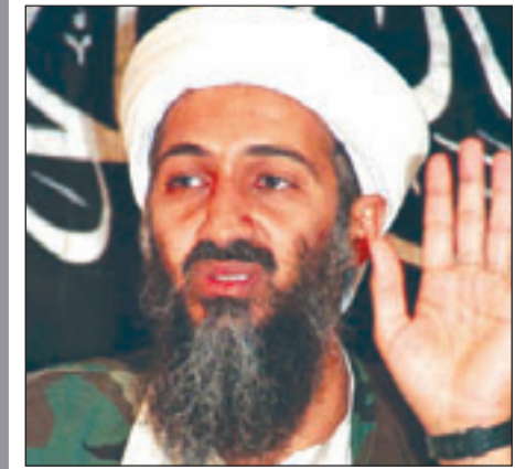
الشيخ اسامة بن لادن

غزة - رام الله - «القدس العربي» - من اشرف الهور وليد عوض: قررت مصر امس تأجيل عملية التوقيع على الورقة التي قدمتها للفصائل الفلسطينية بهدف انتهاء الخلاف الداخلي، والتي كانت مقررة الخميس الماضي، عقب طلب من حركة حماس، وبعد تداعيات رفض الوثيقة من الفصائل الفلسطينية في سورية، فيما اتهم عزام الاحمد دولة عربية بالوقوف وراء قرار حماس المطالب بتأجيل الاتفاق. واعلن مصدر مصري مسؤول في تصريح صحافي ان بلاده قررت تأجيل التوقيع على اتفاق المصالحة لاجل غير مسمى، وانها قررت مواصلة جهدها لانهاء الحالة التي نتجت عن تداعيات تقرير غولدستون. وفي التصريح اشاد المصدر المصري بموقف حركة فتح من المصالحة، وقال انها التزمت بالتوقيت المحدد والموافقة على كل ما جاء بالاتفاق دون تعديلات، لافتاً في ذات الوقت الى ان حركة حماس «طلبت مهلة من الوقت تزيد من الدراسة والتشاور، علماً بأن مشروع الاتفاق هو نتاج جهد مصري فلسطيني على مدى شهور». وأشار المصدر الى ان كل ما جاء في الورقة المصرية كان «نص ما ورد في اتفاق اللجان الخمس التي شكلت من ممثلي الفصائل والقوى الفلسطينية بالإضافة الى موافقة الجميع بما في ذلك فتح وحماس على المقترح المصري لحل القضايا الخلافية التي ظلت عالقة».