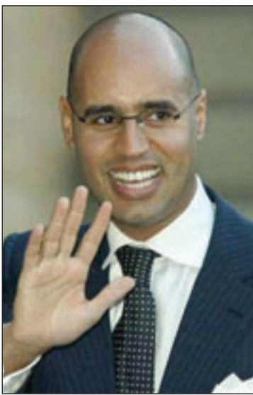
سيف الإسلام القذافي

وكانت هذه القيادات أقرت تزكية دعوة الزعيم الليبي معمر القذافي خلال الأيام الماضية التي طالب فيها بمنح نجله سيف الإسلام -الذي لا يشغل أي موقع رسمي في الدولة صيغة تمكنه من القيام بواجبه تجاه بلاده». وكان القذافي قال إن نجله سيف الإسلام رجل مخلص ويحب ليبيا ويأنه يواجه مشكلة كونه لا يشغل منصباً في الدولة. ومضى القذافي يقول إن سيف الإسلام سيعالج ليبيا من الفساد ومشاكل اجتماعية أخرى. وقال إن مؤسسات الدولة فشلت في تحقيق ذلك وفي تحقيق الحكم الرشيد. وقال القذافي الذي يرأس الاتحاد الأفريقي ويحصل لقب ملك ملوك أفريقيا ولقب القائد الأممي إنه لا يريد أن يشتت عن دوره على الساحة العالمية بموضوعات داخلية. يذكر أن سيف الإسلام ساهم في معالجة العديد من القضايا لصالح بلاده ليبيا ومن