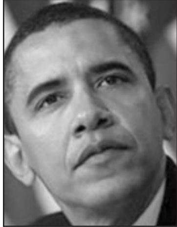
تقرير غولدستون مسمار في نعش مبادرة أوباما