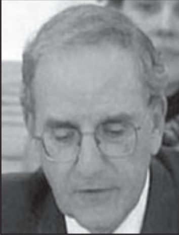
ميتشل متفائل ولكنه عاد دون اتفاق

حقق التعاون.. ولاية له وولاية لهم.. أوباما سيساعد ويدعم الحملة المقاربة في نيو جيرسي، إلا أنه ليس من المؤكد أن يتوجه إلى فيرجينيا رغم المشادات المتكررة، في هذا الأسبوع سماع الناطقون باسمه وهم يبعدون انفسهم قدر المستطاع عن الانتخابات في هذه الولاية التي كانت ولاية مركزية في انتصاره في الانتخابات العامة، خسارة مضاعفة وأوباما سيعلن باعتباره الخاسر الأكبر في ذلك المساء، هذا كان الدليل القاطع في صناديق الاقتراع على أن الحزب الذي بدأ قبل عام فقط مندفعاً نحو عهد طويل من الحكم يقف الناخبين وينزف دما، الاسابيع القريبة ستؤكد لنا ان كان أوباما سينجح في وقف هذه الموجة العكرة او أنه سينجر معها نحو الدوامة، المبعوث الخاص للشرق الاوسط