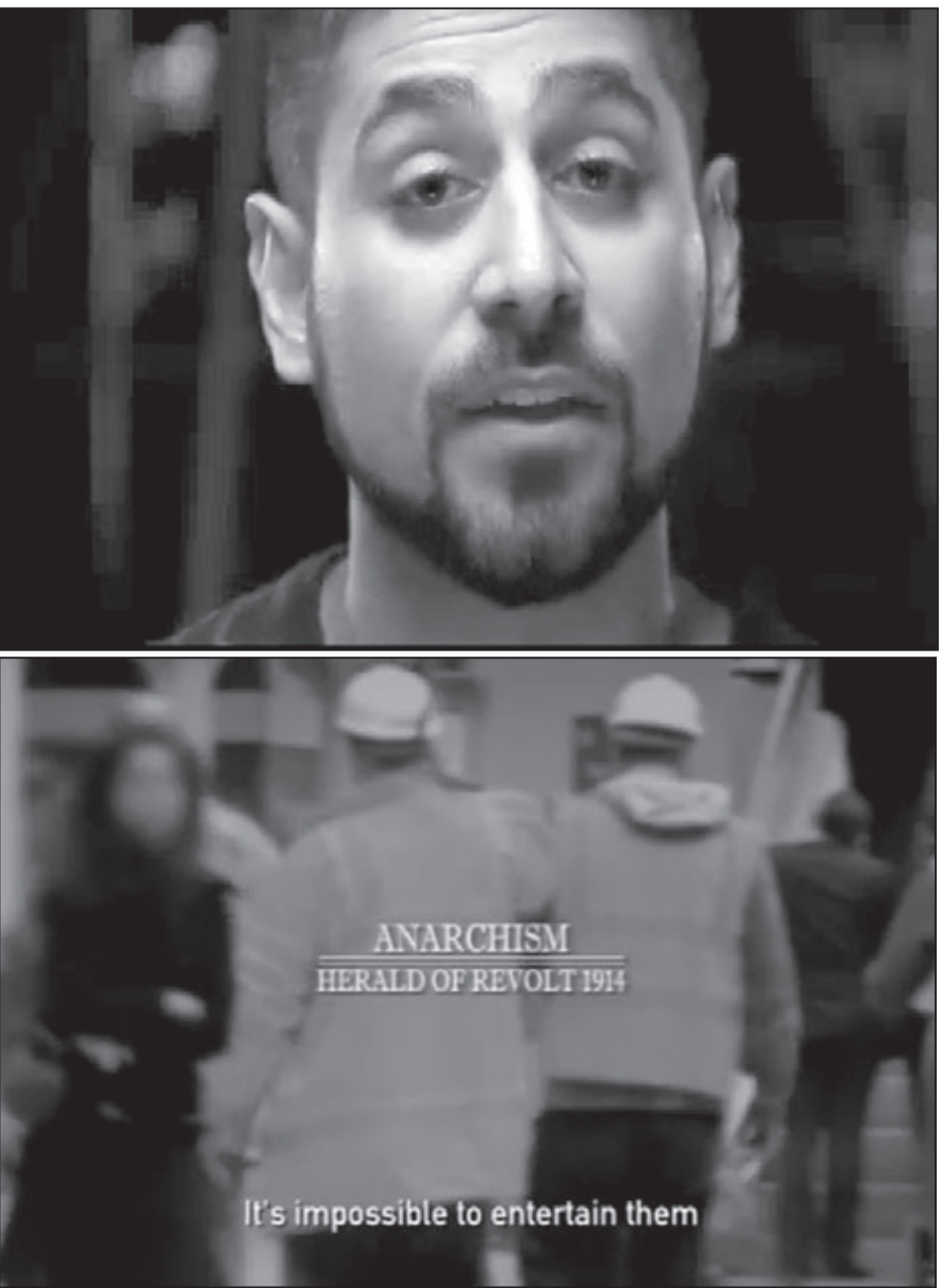
لقطعتان من الفيلم

وما يدفع الفوضوي لرفض المجتمع سواء كان في لندن او في باريس هو شعوره بالزيف من حوله، زيف المجتمع وان الدولة والحكومة بالضرورة غير شرعية ويجب العمل على حلها تماما كما ترى الجماعات الجهادية في نظام الدولة الذي لا يحكم بنظام الله نظاما شرعيا ويجب العمل على قلبه. الحركة الفوضوية كانت تمثل قطاعات مختلفة في معظم اوروبا وان كان الاسم في البداية سببة، الا ان انشرا فرنسا لبسبه باعتبارها رمز فخر واقتبال الفصحيات البارزة في محاولتهم لقلب المجتمع قوبل بنوع من الحملة القوية التي تشبه حرب بوش على الارهاب، فمدبر اف بي آي، ادغار هوفر قام بحملة ترحيل للمتطرفين فيما تعاون الامن والشرطة