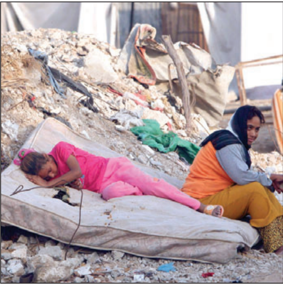
فتاتان فلسطينيتان تجلسان في العراء على انقاض منزلهما في قطاع غزة

تبنى مجلس حقوق الانسان التابع للأمم المتحدة الجمعة قراراً يصادق فيه على تقرير غولدستون الذي يتهم إسرائيل وحركة المقاومة الإسلامية (حماس) بارتكاب جرائم حرب خلال الحرب على غزة في أواخر 2008 ومطلع 2009. وفيما دانت إسرائيل القرار ووصفته بـ«الجائر»، رحب به الفلسطينيون وقالوا انه يجب أن يتبعه تحرك من مجلس الامن الدولي.