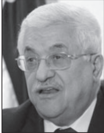
أبو مازن مضغوط ولا يمكن مطالبته بشيء