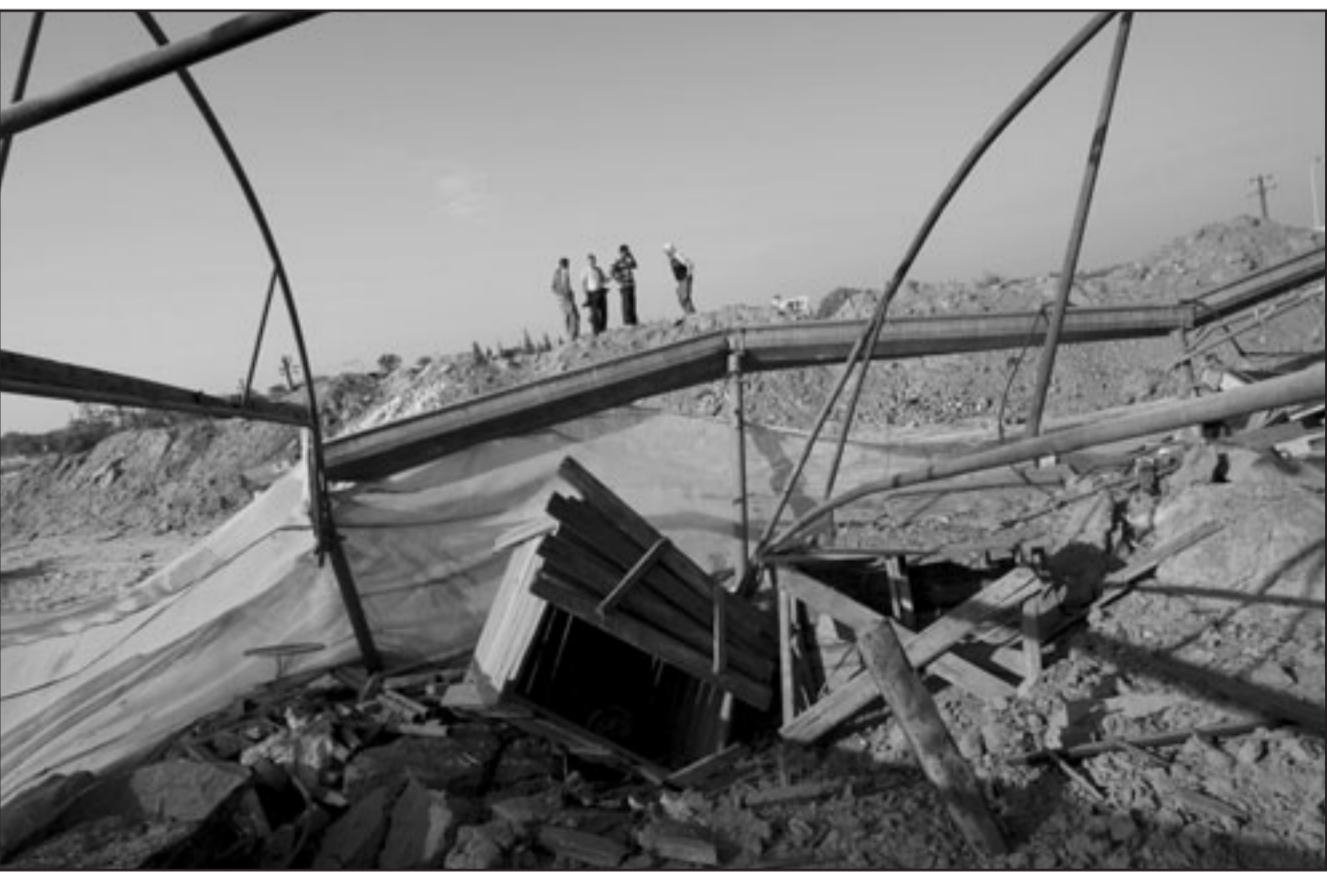
انار القصف الاسرائيلي على الأنفاق في جنوب قطاع غزة

السلام وتستدعي موقفا دوليا واضحا وصارما لمواجهةها». واحدم النزاع مجددا حول المسجد الاقصى في نهاية ايلول (سبتمبر) الماضي مع احتجاج فلسطينيين على دخول يهود الى الحرم القدسي، وهو ما نقلته الشرطة الإسرائيلية، ويضم الحرم القدسي المسجد الاقصى ومسجد قبة الصخرة وهو ثالث الحرمين الشريفين بالنسبة للمسلمين وتتخفق في الثورة أثناء عملية الحفر، والبعض الآخر نتيجة استنساخه العازر السلام الذي يضيئه الامن المصري في الأنفاق التي يتكشفا، وهناك من قتل خلال عملية تفجيرات إسرائيلية داخل النفق. وحسب احصائية مركز حقوق الانسان في غزة، فان عدد الذين قتلوا داخل الأنفاق أكثر من 115 شخصا و 121 مصابا، من بينهم 44 قتلوا عام 2009.