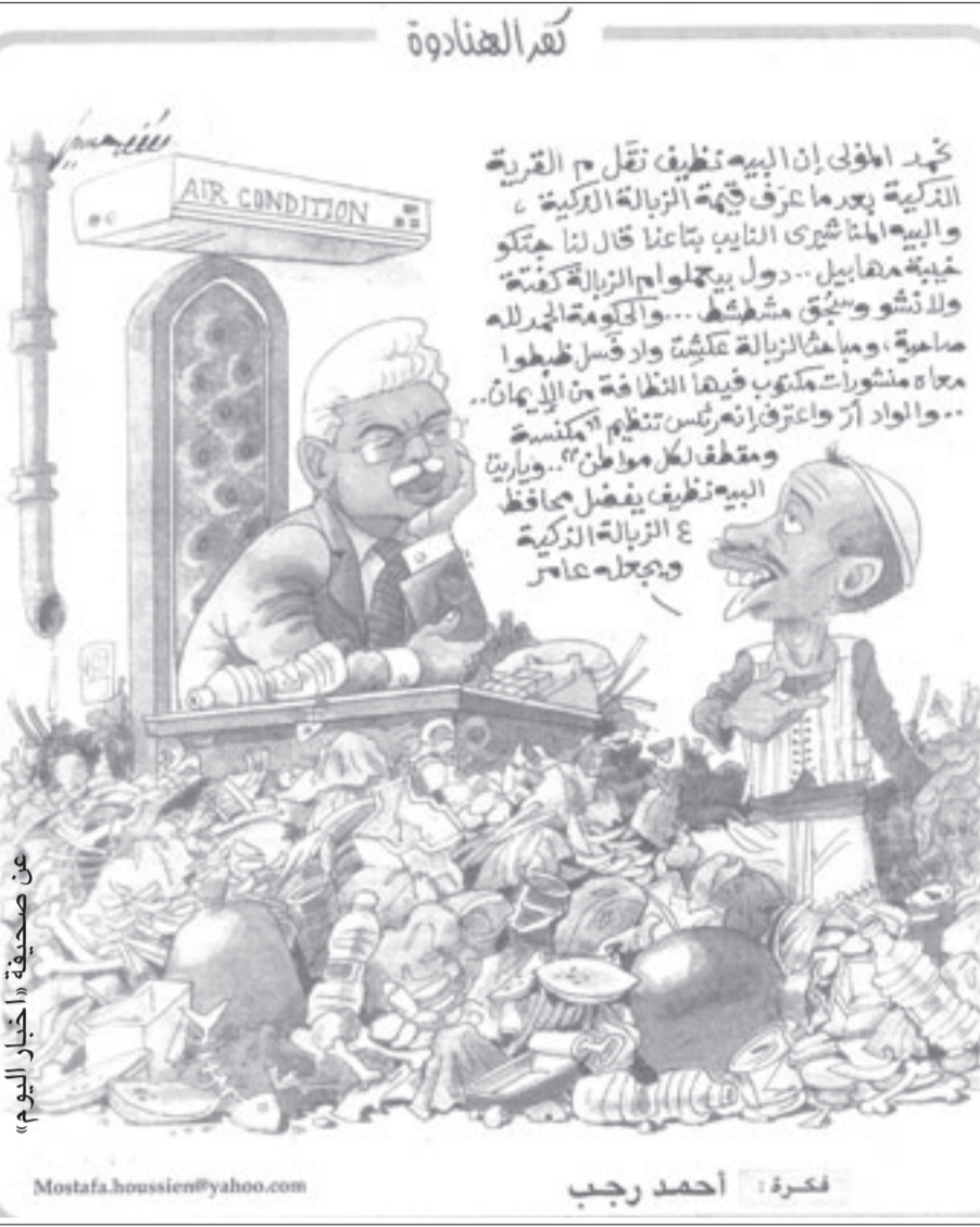
في صحيفة «أخبار اليوم»

تحريرها زميلنا وصديقنا أسامة سرايا وقوله عن هذه الزيارات «زيارة الرئيس مبارك مثل كل زيارة تفتح الطريق أمام المصريين جميعا إلى عالم من التجارب والفرص، وتمهدها للاستثمارات الخارجية، فهي كل زيارة يوظف علاقاته ومكانته السياسية لتوفير مناخ مشجع على المزيد من التعاون والمشاركة بين مصر وغيرها من دول العالم. وزيارات الرئيس إلى القوى الاقتصادية الواعدة تفتح أيضا آفاقا أخرى من التعاون السياسي مع القوى الأوروبية الجديدة، لتكون رافدا جديدا ينضم إلى روافد علاقتنا متميزة مع أوروبا القديمة، وانضمام هذه القوى إلى التكتلات السياسية الكبرى في عالم اليوم وتنامي قوتها الاقتصادية، يرشحها للقيام بدور فاعل في القضايا الدولية، ولذلك كان ضروريا أيضا أن تتناول زيارة مبارك الملفات السياسية العالقة في المنطقة. والمجر سوف تتولى رئاسة الاتحاد الأوروبي العام المقبل، وبوسعها أن تقدم الكثير لدعم علاقات مصر بالاتحاد الأوروبي، كما أكد ذلك الرئيس المصري في المؤتمر الصحافي المشترك مع الرئيس مبارك».