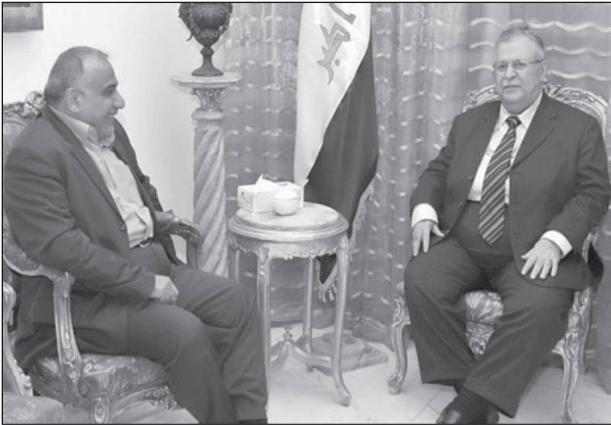
الرئيس جلال طالباني مستقبلا نائبه عادل عبد المهدي الاعرجي بـ«التردي».

وقال الشمري لن يحسم قانون النفط والغاز خلال هذه المرحلة ويمكن ارجاؤه الى المرحلة القادمة، لكن قضية التعديلات الدستورية فيها مواعيد محددة لانجازها واخفق مجلس النواب بالالتزام بهذه المواعيد المحددة واصبح يتعامل مع الموضوع كواقف حال بعيدا عن الاطر الدستورية، وان قضية التعديلات الدستورية كانت محددة باطر زمنية محددة وبفواتها يصبح من الناحية الدستورية غير صحيح طرحها من جديد، وهذا الموضوع حساس وله علاقة باستقرار الوضع السياسي في البلد ولذلك نحن ندعم ان يطرح في وقت اخر حتى لو كان خارج الضوابط القانونية مادام ان ذلك يصب في مصلحة الاستقرار السياسي في البلد، مشيرا الى ان المواضيع