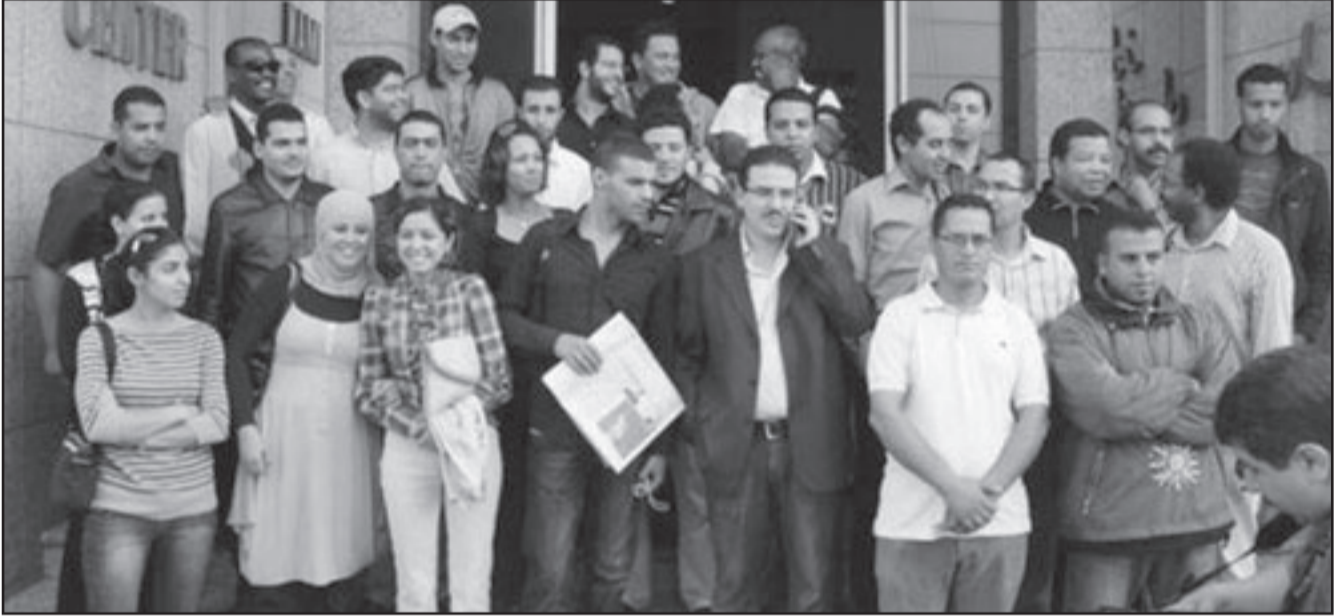
طاقم «أخبار اليوم» ممنوعون من ولوج مقر جريدتهم

الصحافة والنشر بهذه الإجراءات الاستثنائية وغير القانونية، يضر كثيرا بصورة المغرب وبمساره في تجاه تكريس الديمقراطية. وناشأت السلطات بإطلاق سراح مدير جريدة «المשל»، ووضع حد لهذه المتابعات القضائية وكذا وقف إغلاق صحيفة «أخبار اليوم».