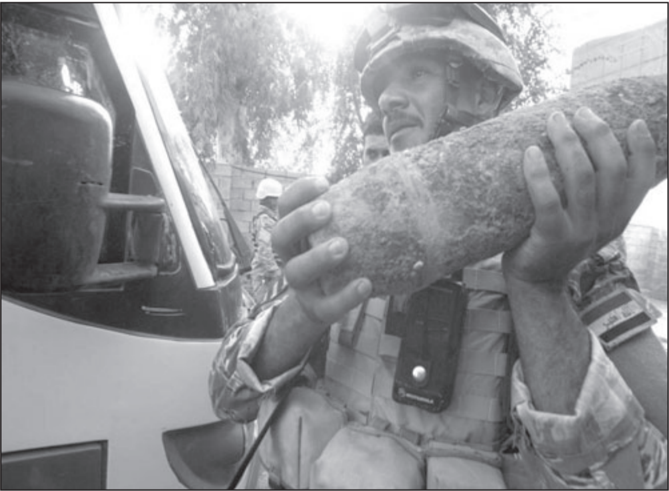
جندي عراقي يحمل ذخيرة عثر عليها في منزل ببغداد

البيرقدار: محمد الدايني سحاحم وفق القانون العراقي