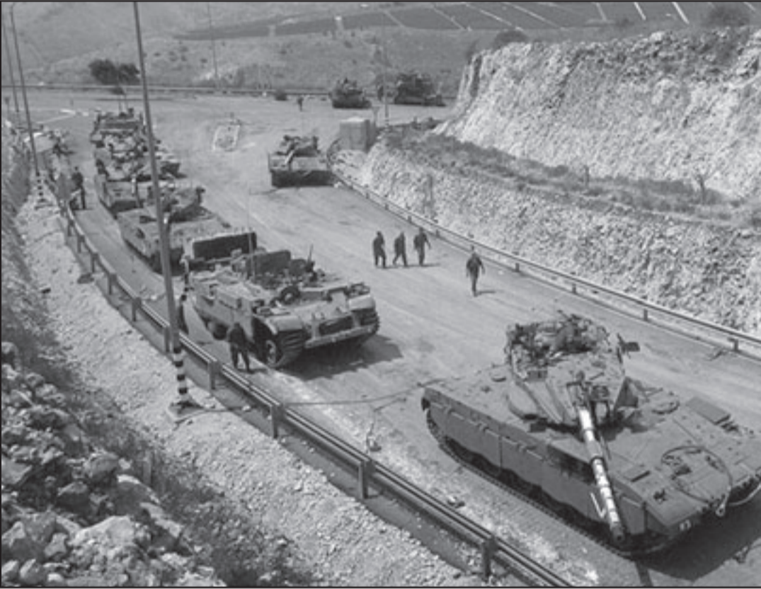
الصمت على انتقاد حرب غزة يهدد بدمع على الشرعية على الحروب القادمة

الاصراع القليلة التي تعاونت فيها مع ثقافة التحقيق الخارجي، لجنة كهان نكفت اسرائيل من المسؤولية المباشرة عن مذنبجة