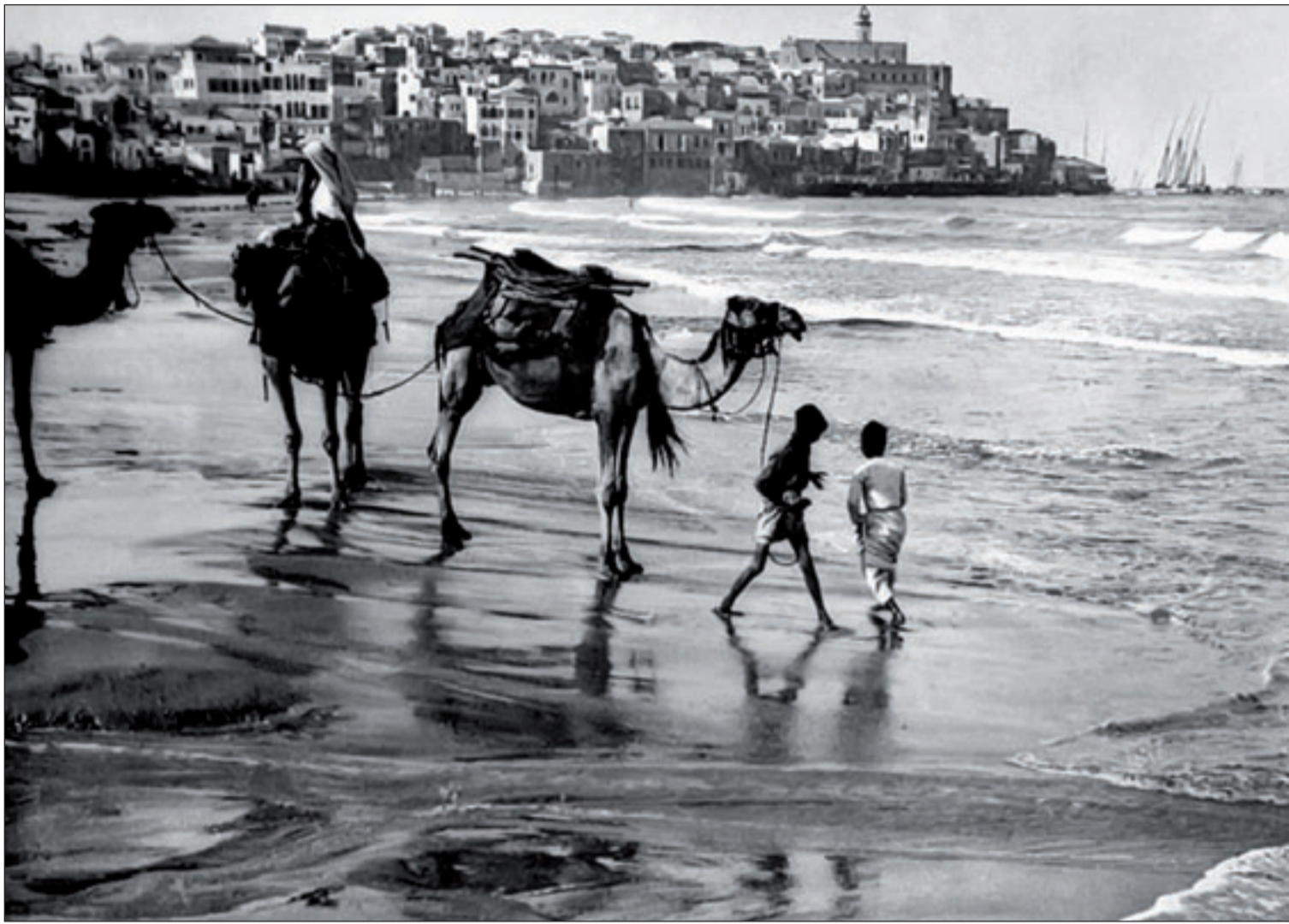
لقطتان من المعرض

وتدور الأحداث في رام الله حول راقصة الفنون الشعبية العتلة التي يسجن زوجها فجأة فتعود إلى الرقص متحديّة نظرة الجتمع للراقصات وأثناء الرقص تبدأ علاقة حب بينها وبين فلسطيني عائد للوطن يعلمها الرقص قبل أن يتم تعديدهم من زوجها مع وجود دعوى قضائية لصادرة عن العائلة المزروعة بالزيتون.