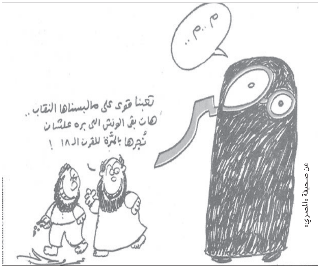
ع. م. م. في صحيفة «المصري»