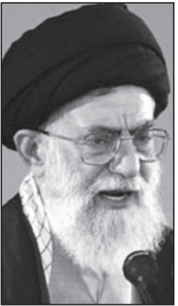
مجموعة خامنئي تحدّث التغام مع الغرب

في رسالة بعث بها احمدي نجاد الى الرئيس بوش. استعداد الولايات المتحدة لتجسيد هذه التطلعات قليل يكون في ولايته لاذات اكثر حذرا بكثير واكثر انصاتا لان انتقاد اول مرة ازمة ثقة عميقة بين النخبة المسيطرة وبين الزعيم الروحي، علي خامنئي.