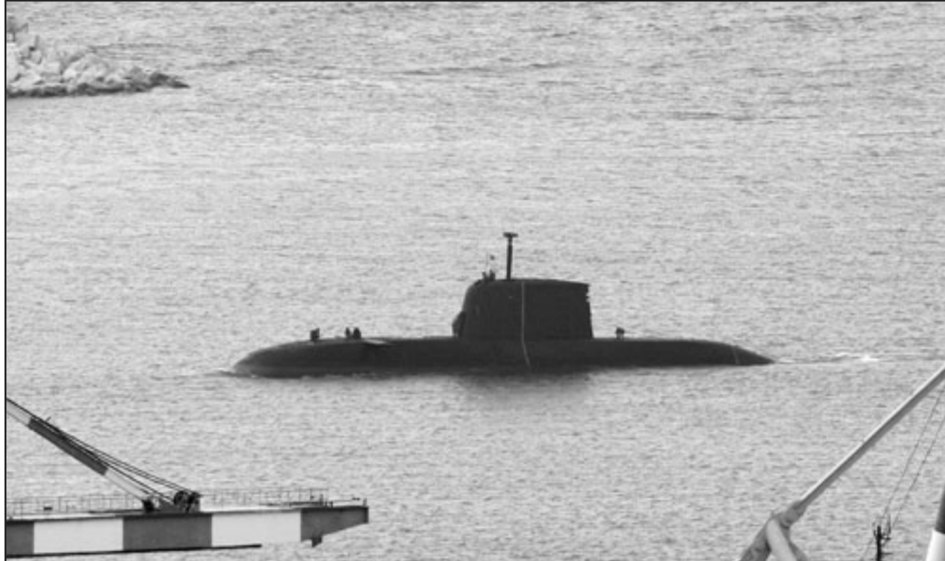
غواصة اسرائيلية قبالة شواطئ حيفا ضمن تدريبات استعدادها لأي حرب جديدة في المنطقة

وقالت الصحيفة ايضا ان الاتفاق يعتبر ضربة لاسرائيل، وكتب المحلل لل شؤون الاسرائيلية اليكس فيشمان، المعروف بصلاته الوثيقة مع المستوى الامني والجهزة المخابرة في الاسرائيلية، ان الاتفاق يشير بصحائب، ووصف فيشمان جام غنصيه على رئيس الوكالة الدولية للطاقة النووية محمد البرادعي، حيث كتب ان هذا الرجل الذي قالت عنه وكالات استخبارات غربية منذ مدة بأنه يتعاون مع ايران، سيبعثنا بخسنا وبقفح حياتنا، ويصف فيشمان اتفاق البرادعي بأنه خطا، ويقول ان هناك من يحذرون منذ سنوات بأنه يبلغ الايرانيين بنوايا المجتمع الدولي بشأن مشروع ايران النووي، ويضيف في اتهاماته: الايرانيون تلقوا تحذيرات بشكل مسبق وعرفوا ما يرد الاثرنت ان منهم، كان لديهم مصدر عن الوكالة الدولية للطاقة النووية، في اشارة واضحة الى الدكتور المصري البرادعي. ويرى فيشمان ان البرادعي سيسير جدا بتحقيق حلم وطه مصر وبإي العالم العربي والاسلامي، وذلك بحصي ما يعرف بالمشروع النووي الاسرائيلي.