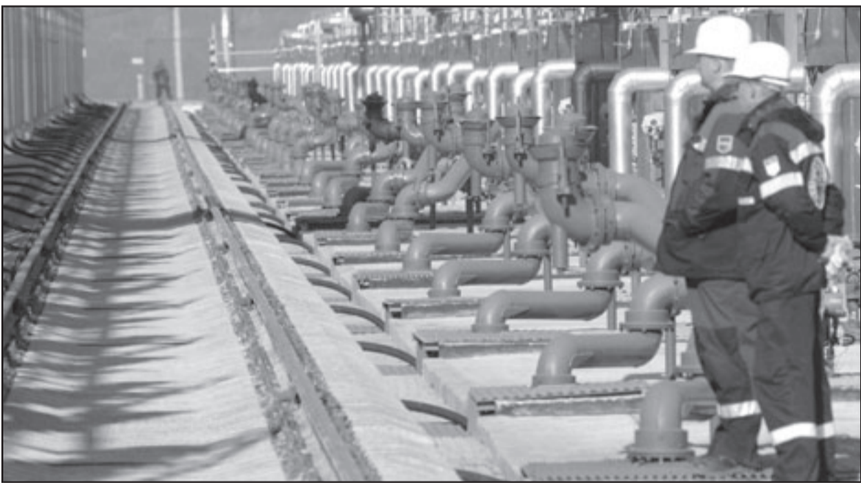
عمال روسيون ينتظرون تفريغ شحنة نفط قرب كوزمينو غرب روسيا

وسيجسن في شكل كبير الوضع في الاسواق العالية للناقة». من جانبه، قال اردوغان «بعد قليل سنلتقي في عداة عمل (رئيس كازاخستان نور سلطان) نزار باييف».