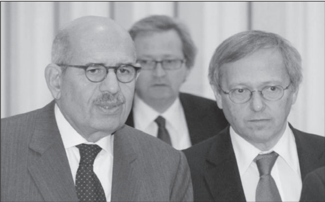
محمد البرادعي رئيس الوكالة الدولية للطاقة الذرية خلال اجتماعات الوكالة في فيينا

وقال دبلوماسيون غربيون إن الاتفاق يلزم طهران بإرسال 1.2 طن من مخزونها المعطن من اليورانيوم منخفض التخصيب والذي تصل كميته إلى 1.5 طن إلى روسيا وفرنسا بحلول نهاية العام الحالي. وستحول المادة إلى وقود تستخدمه منشأة طبية نووية في طهران.