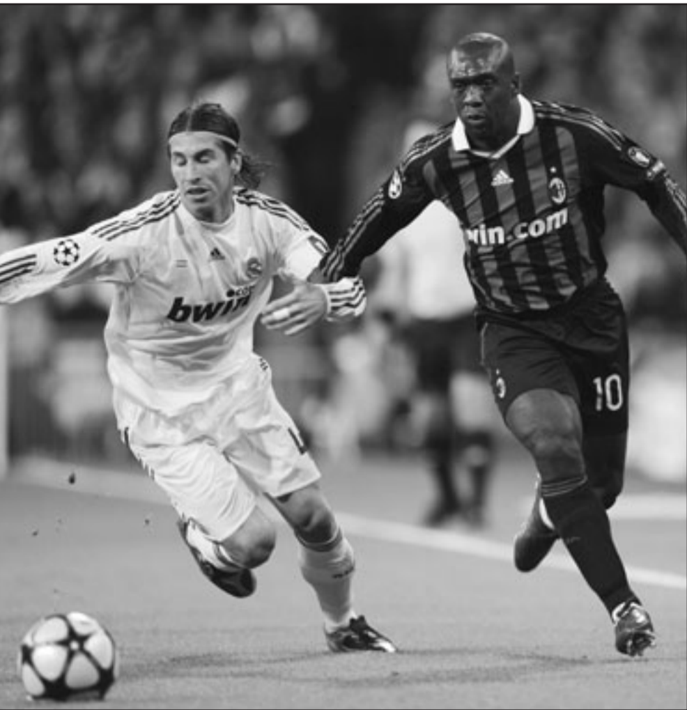
مدافع ريال مدريد سيرجو راموس (يسار) في متغاسلة على الكرة مع لاعب ميلان كليرينز ساواروف

زأمبروتا أعاق كريم بنزيمة داخل منطقة الجزاء، وفي ظل سيطرة ريال مدريد على مجريات اللعب تصدى ديدا بشكل رائع لفرصة خطيرة قبل نهاية الشوط الأول، إثر تسديدة قوية نفذها مارسيلو قبل أن يتصدى لمحاولة خطيرة لكاهل. وفي الوقت الذي بدأ فيه أن ريال مدريد يهدف في طريقها للاتهاء عن طموحات ميلان، نجح بيرلو في إدراك التعادل للفريق الإيطالي في الدقيقة 62 إثر تسديدة قوية من مسافة 30 مترا.