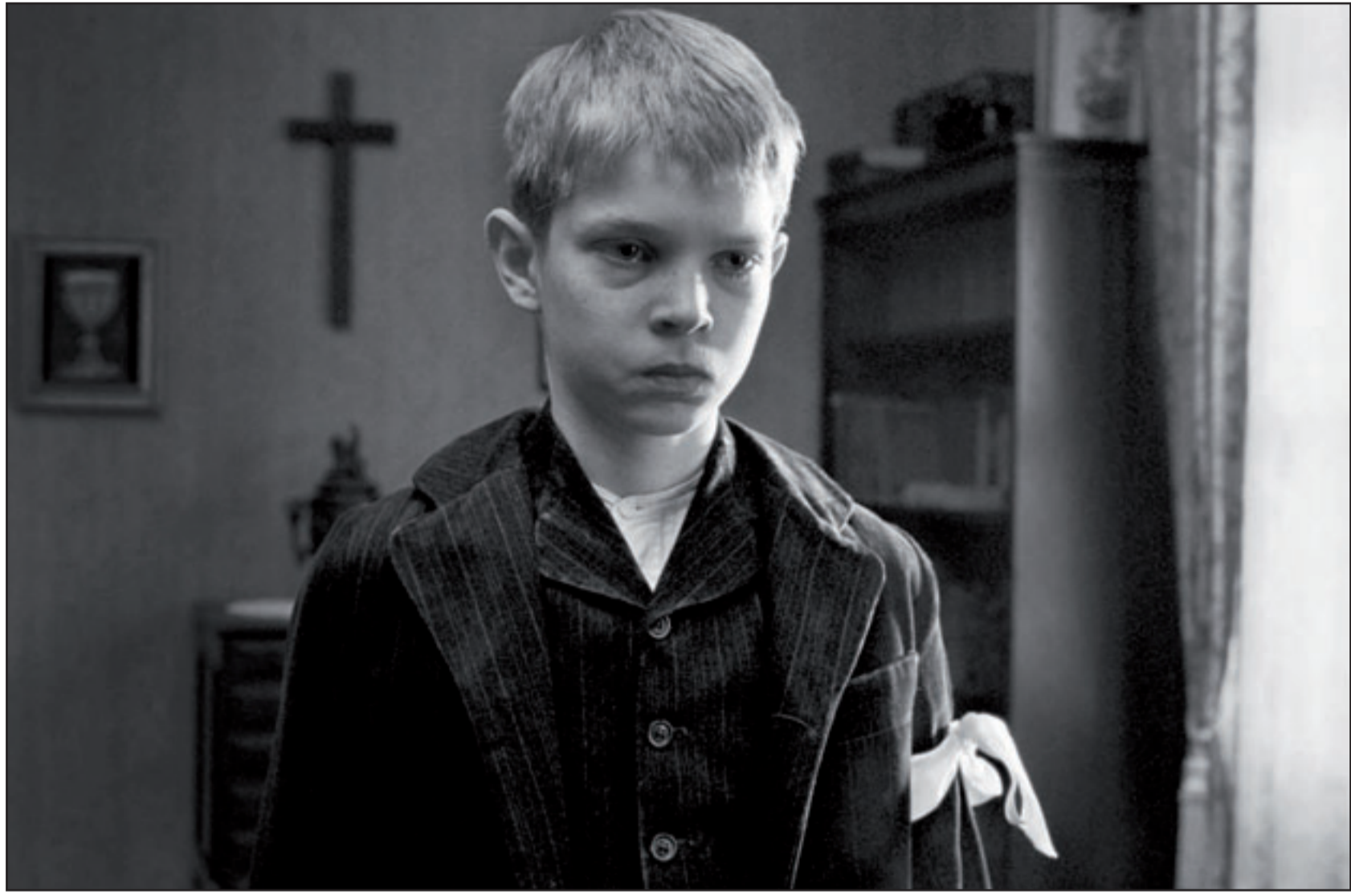
لقطة من فيلم «الشريط الأبيض»

في الجولة الخامسة لمهرجان «كان» الدولي 2009 فاز الفيلم الألماني «الشريط الأبيض» Band Michael Haneke للمخرج ميشائيل هانكه الذهبية. ويعد أن رشح مؤخرًا للاوسكار 2010، اشدت زحاحم دور العرض لا سيما في ألمانيا والنمسا للحصول عليه. في برلين كالدن الأخرى، أقبل الزوار بكثافة على صالات السينما لمشاهدته وكتب النقاد كتابات عن الجائزة ومستقبلها كالتالي. كان من المتوقع انتقال السعفة الذهبية إلى فيينا في النمسا لأن المخرج نمساوي الأصل، إلا أن اختيار النمساوي كريستوف فالس Christoph Waltz المقيم منذ سنوات طويلة في برلين للقب أفضل ممثل في الفيلم وحيازته على جائزة أحسن ممثل، مما يعني أن السعفة الذهبية ربما ستذهب إلى ألمانيا.. «الشريط الأبيض» دراما 144 دقيقة، أصر المخرج ميشائيل هانكه الذهاب بعيداً للبحث عن الأسباب الجذرية للإرهاب والنف على أرض الواقع. وتقع أحداث الفيلم في قرية في شمال ألمانيا قبل الحرب العالمية الأولى وبصور البنية الاستبدادية وأثارها الشريرة في القرية عشية الحرب. توليفة التصوير «أسود - أبيض» ساعدت على إعطائه أهمية فنية وتاريخية وجمالية متميزة، شبيهة بأعمال انغمار برغمان «الفراولة البرية»، «الخمخ السام»، «شخص..» إلى جانب الآخرين، لعب في بطولة الفيلم الممثل الألماني أولريش توكور Ulrich Tukur سوزانا لوتار Susanne Lothar وبيورث كلاوزنر Burghart Klausner وجوزيف بيريشلر Bierbichler Josef. وهو أول فيلم ألماني يحصل على السعفة الذهبية بعد 25 عاماً من آخر فيلم ألماني حاز عليها في عام 1984 باريس- تكساس، للمخرج فيم فيندرس Wim Wenders. وتمنح السعفة الذهبية سنويًا في مهرجان «كان» السينمائي لأفضل فيلم مشارك في فئة الأفلام الروائية المتنافسة خلال «المنافسة» وتعتبر أهم جائزة في المهرجان.