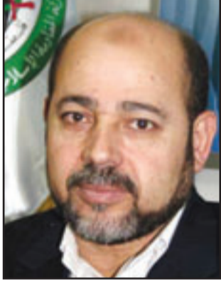
موسى ابو مرزوق

لرفضها القبول بالورقة المصرية ومطالبتها بإدخال تعديلات عليها في حين وقعت عليها حركة فتح، في الخامس من الشهر الجاري. (تفاصيل ص 5)