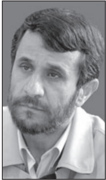
نجاد لن يكون بعد اليوم الرئيس المنبوذ

من هنا السبيل سيكون مفتوحا لسلسلة اخرى من الاتفاقات واقامة الحوار بين ايران والولايات المتحدة على قاعدة واسعة اكثر بكثير من مسألة النووي بل وازالة جزئية للعقوبات. لا يدور الحديث فقط عن تنسيق مواقف في مواضيع مثل العراق وافغانستان، بل عن تعاون في حل نزاعات اخرى في الشرق الاوسط مثل تشكيل حكومة في لبنان ومصالحة فلسطينية داخلية، بشكل كفيّل بان يجسد تطلع ايران لأن تكون قوة عظمى سياسية في المنطقة وليس مجرد تهديد. هذه التطلعات السياسية فصلت بتوسع