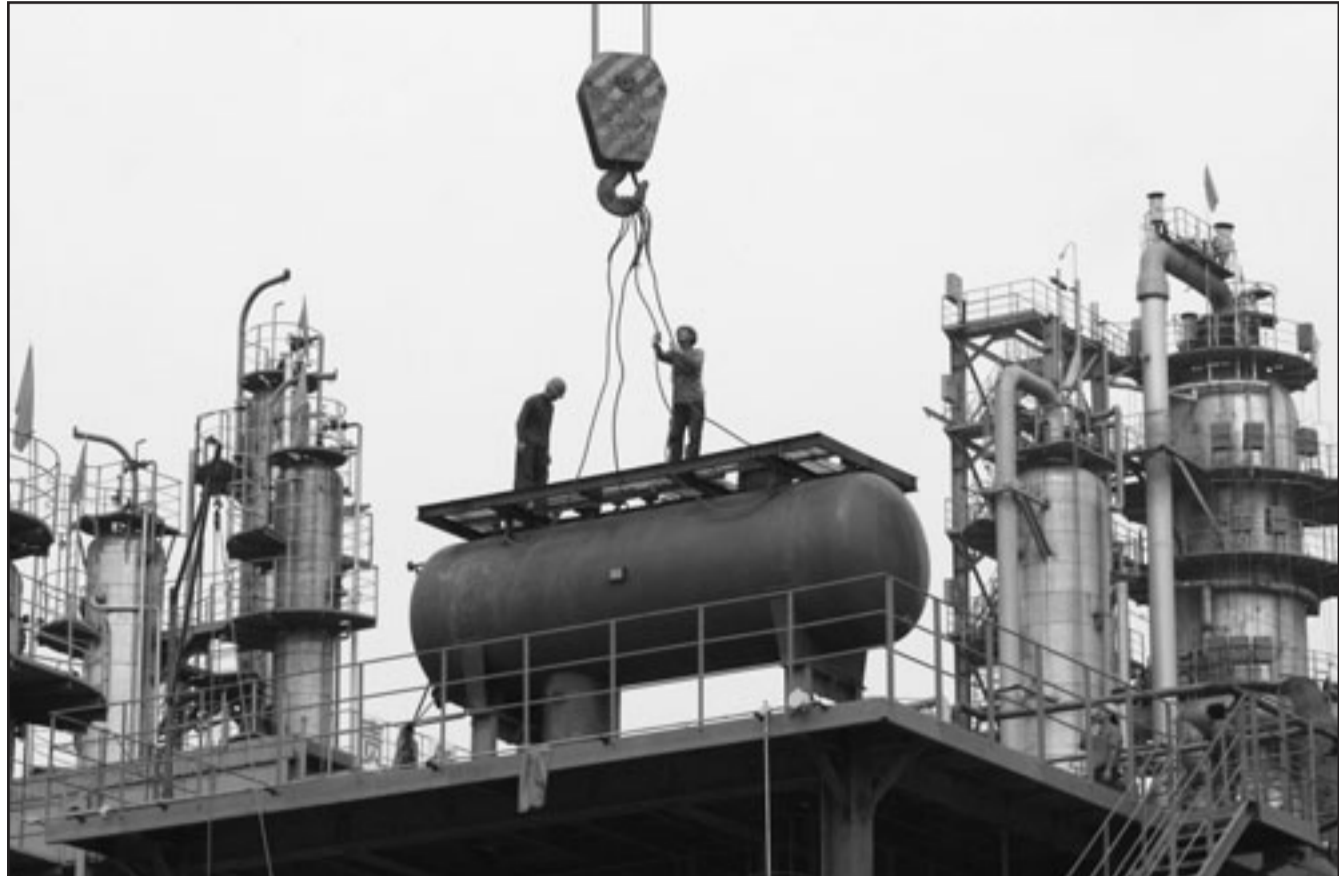
عمال في معمل لتكرير النفط في الصين

القاهرة - رويترز: قال رشيد محمد رشيد وزير التجارة المصري في بيان امس الخميس ان مصر ستفرض حدا أقصى على صادرات الأرز عند 100 ألف طن شهريا على ان تقدم العروض في مظاريف مغلقة بحد أقصى يبلغ 34 ألف طن. وأضاف الوزير أنه سيجري خفض الرسوم الجمركية الفروضة على صادرات الأرز إلى 1000 جنيه مصري (183 دولارا) من 2000 جنيه وأن التعديلات ستسري من الأول من كانون الأول/ديسمبر. وكانت الرسوم الجمركية 1000 جنيه قبل ان يجري مضاعفتها في تموز/يوليو. وفي الاسبوع الماضي قالت مصر انها ستضع قواعد جديدة للتصدير بنظام العروض لا تنص على ضرورة ان يقوم