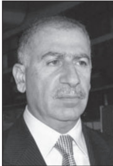
أسامة عبد العزيز النجيفي