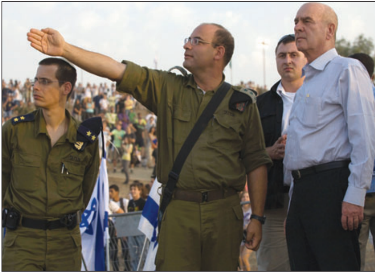
ماتان فيلنای (يمين) يستمع لشرح من ضابط اسرائيلي حول التطورات على الحدود مع لبنان استعدادا لاي حرب مع ايران

واعلمت اسرائيل أمس الخميس انها اجرت محادثات مع ايران حول نزع الاسلحة النووية للمرة الأولى منذ العام 1979. وذكرت صحيفة «هارتس» امس ان مندوبي إسرائيل وإيران وعدد من الدول العربية والأوروبية والولايات المتحدة اجتمعوا في القاهرة مؤخرًا للبحث في احتمالات تحويل منطقة الشرق الأوسط إلى منطقة منزوعة من السلاح النووي. وقالت الصحيفة ان المندوبة الإسرائيلية، وهي مديرة الشؤون السياسية ومراقبة الأسلحة في لجنة الطاقة النووية الإسرائيلية ميراف تسفاري أوديز، والمندوب الإيراني لدى الوكالة الدولية للطاقة النووية في فيينا على اصغر سلطانية، تبادلوا الاسته، واستعرضا مواقف بلديهما، وأضافت الصحيفة ان المندوب الإيراني طرح على المندوبة الإسرائيلية سؤالاً مباشراً قائلا «هل تملكون اسلحة نووية ام لا؟» لكن المندوبة الإسرائيلية بادرت باتسامة ولم تجب على سؤاله، وهو ما ثقته طهران التي وصفت هذه المعلومات بانها «كاذبة». ونقل السلطان «العالم» الإيراني عن المتحدث باسم منظمة الطاقة الذرية الإيرانية علي شيرزادبان وصفه لما نشرته صحيفة «هارتس» الإسرائيلية بهذا الشأن بأنه «عار عن الصحة وكذب مضح»، معتبراً انه يدخل في إطار الحرب النفسية التي تمارسها سلطات الاحتلال للتقليل من شأن نجاح أي خيار. (تفاصيل ص 6)