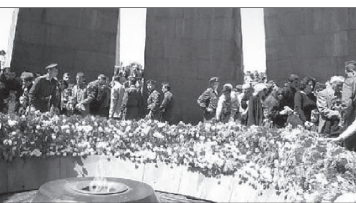
العلاقات الدبلوماسية ستطوي ملف مذابح الأرمن

الترك في الحقيقة انه كان لهذا التهديد تأثير فيهم، لكن يبدو انه لو قرر سركسيان الازيور تركيا، لوهت اصعب الاتهام اليهم، ولا حتى من جديد دعاوى على عدم وجود نيات جدية في ايار (مايو) . أكد اوپاما انه غير مستعد في تركيا التي تحاول ان تؤكد في السنين الاخيرة رغبتها في مصالحة جاراتها، في اطار سياسة، عدم المشكلات، التي يبادر اليها وزير