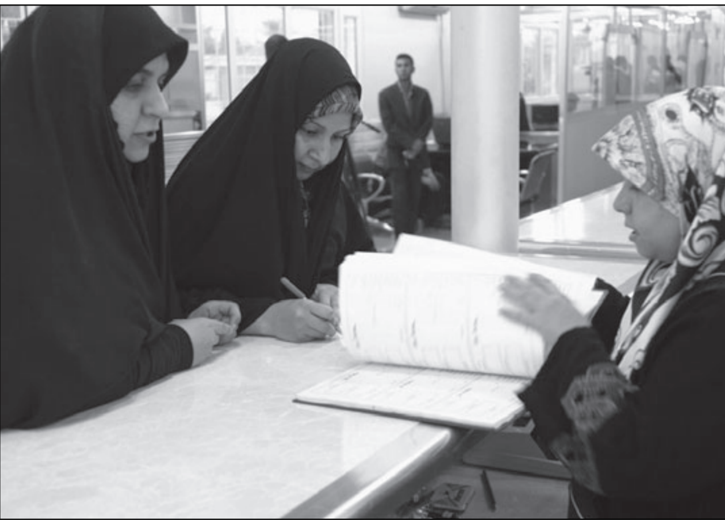
سيدات عراقيات في مصرف مخصص للنساء فقط

تزامن هذه التصريحات مع الزيارة التي يقوم بها رئيس الوزراء نوري المالكي إلى الولايات المتحدة ربما يؤشر على وجود طلب من الحكومة بعدم تسريع الانسحاب، إلا أن كان الحديث عن احتمالات حدوث تصعيد في أعمال العنف، كما صرح بذلك أوبرينو، فالخروقات الأمنية موجودة في جميع الأحوال»، وفق قولها.