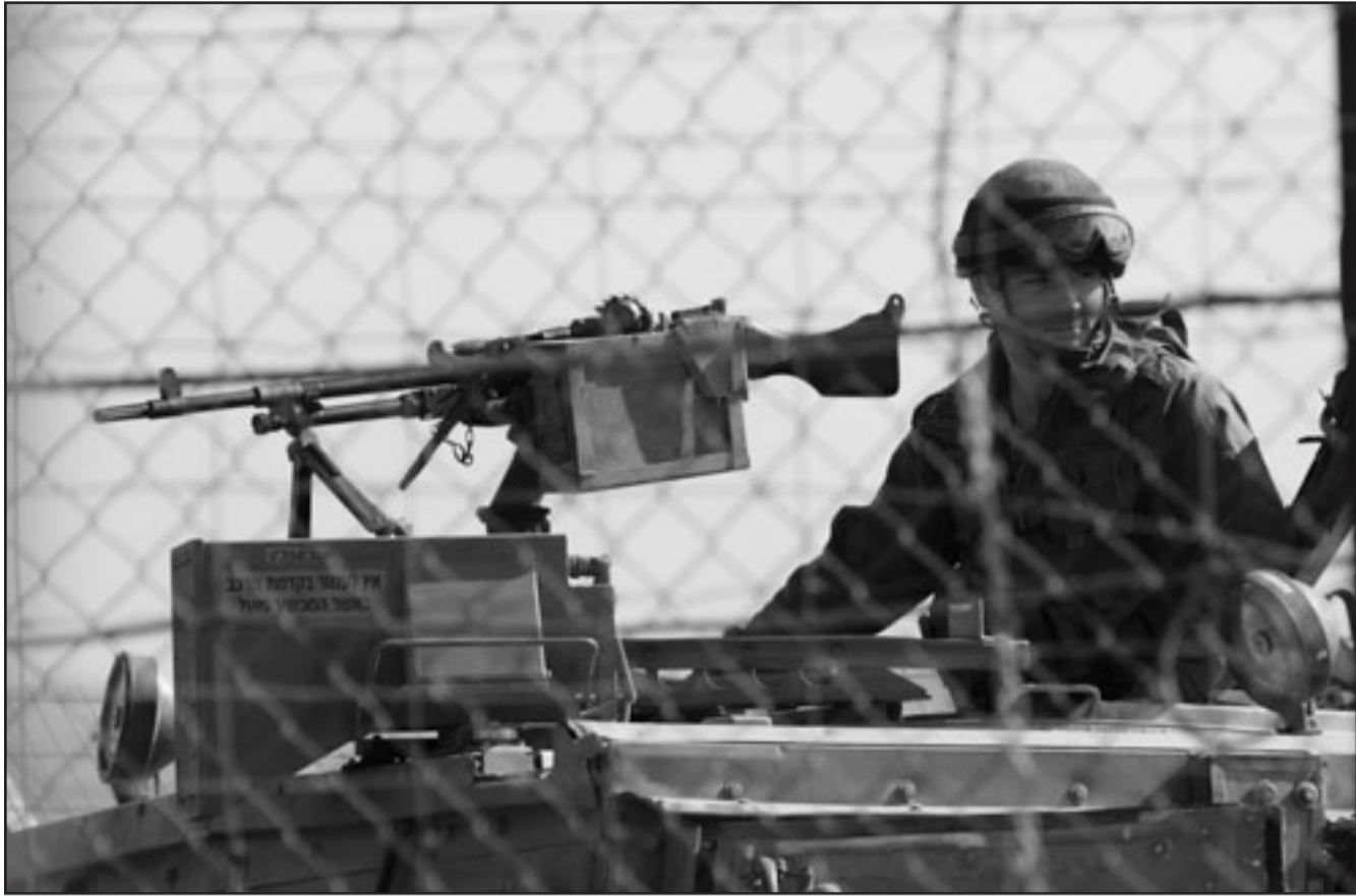
جندي اسرائيلي يراقب الحدود اللبنانية قرب قرية كفار كلا في الجنوب

ولكن مع هذا، اضافت المصادر عينا قاطلة أنّ سورية تواصل تزويد حزب الله بالاسلحة المتطورة، وأن الجيش الاسرائيلي قلق جدا من هذا الامر، على حد تعبير المصادر. وزادت المصادر ان اكثر ما يقلق الاسرائيليين هو احباط العدوان الاسرائيلي الوجيه على قطاع غزة. الةجهزة الامنية في الدولة العبرية هو حصول حزب الله على صواريخ عسكيري خفيفة قاطلة ان المؤسسة الامنية الاسرائيلية تؤيد العودة الى طولة المفاوضات مع سورية، وأن وزير الامن، يهود باراك، وقائد هيئة الاركان العامة في الجيش الاسرائيلي، الجنرال غايي اشكنازي، يدعان هذا الوضع وتقول المصادر الامنية الاسرائيلية ان تجديد المفاوضات الاسرائيلية الاسرائيلية سويدي على تسريع انسلاخ دمشق عما تسميه اسرائيل بدول محور الشر بقيادة الجمهورية الاسلامية الإيرانية.