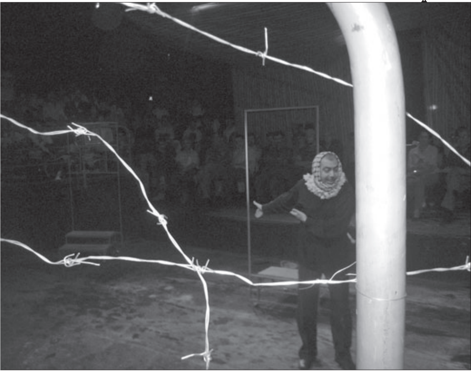
مشهد من المسرحية الاردنية

ويحاول مهرجان لندن السينمائي منافسة المهرجانات الدولية الكبيرة مثل كان وتورونتو والبندقية على الرغم من أن أغلبية الافلام التي يعرضها شاركت في مهرجانات سابقة.