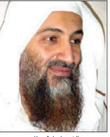
الشيخ اسامة بن لادن

■ لاهور (باكستان) - د ب ا ف ب: قالت وزيرة الخارجية الامريكية هيلاري كليبتون الخميس انه «من الصعب تصديق» انه لا يوجد في حكومة باكستان احد يعرف اين يختبئ زعماء القاعدة». وقالت كليبتون لمحوري احدي كبرى الصحف الباكستانية في العاصمة الثقافية لاهور «القاعدة وجدت في باكستان ملاذاً آمناً منذ 2002». واضافت وهي تؤكد كلامها «اجد ان من الصعب تصديق انه لم يكن احد في حكومتكم يعرف اين هم ولم يكن قادرا على الامساك بهم لو انهم ارادوا ذلك حقا»، وقالت «ربما هذه هي المشكلة، ربما يصعب الوصول اليهم، لا اعرف... ولكن ما اعرفه انهم في باكستان». الى ذلك قال مسؤولون في باكستان ان مواطننا المانيا مدرج اسمه في قائمة وكالة المخابرات الامريكية الخاصة بالاطلوبين بشدة لقبائمه بتوفير الدعم اللوجيستي والتمويل لتفذي هجمات الحادي عشر من ايلول (سبتمبر) ربما يكون مختبئا في باكستان. ويقول مسؤولون امنيون باكستانيون انهم عشروا على جواز سفر سعيد باهاجي، وهو عضو فيما يسمى بخلية هامبورغ خلال