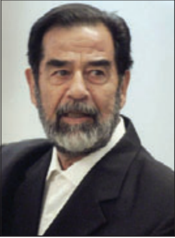
الرئيس العراقي الراحل صدام حسين

من القضاء ان يقول قراره العادل، لكنني وجدت ان وزير العدل وان القضاء العراقي كان محرجا امامي فقررت اعدامه.. ويضيف «لكن ام عدي ارسلت معيوثا من دون علمي الى (العاهل الاردني) الملك الحسين بن طلال رحمه الله الذي على الفور حط بطائرته (...) وفوجئت به يطلب مني العفو عن عدي، واقسم الملك حسين الا يزور العراق ان لم استجب لطلبه، فاضطرت وفقا للتقاليد العربية للعفو عن عدي شرط ان يعفو عنه اهل الضحية». وروى كيف اقال اخاه غير الشقيق وطبان ابراهيم الحسن عندما كان وزيراً للداخلية بعدما سمع بأنه اطلق النار على اشارة مرورية حمراء في احد شوارع بغداد لان سائقه توقف احتراماً لها، وقال «قلت له: «انا أسف ل مكان للمجانين والمتهورين في قيادتنا»» (تفاصيل ص 4)