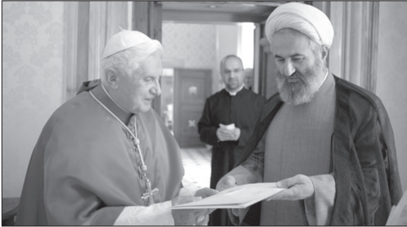
سفير إيران لدى الفاتيكان علي أكبر ناصري يقدم أوراق اعتماده إلى بابا الفاتيكان بنديكس السادس عشر

الوكالة الدولية للطاقة الذرية احتمالين لتسليم اليورانيوم المخصب، وذلك في إطار تعديلات ستطلب ادخالها على مشروع الاتفاق حول تخصيب وقودها النووي في الخارج. وافادت الصحيفة استنادا إلى «مصدر مطلع» أن طهران ستقترح في التعديل الأول لتسليم اليورانيوم المخصب بنسبة 3.5 % تدريجيا» تحصل في المقابل على وقود مخصب بنسبة 20 % الضرورية لمفاعل أبحاث طهران. وفي التعديل الثاني المحتمل ستقترح طهران أن تتبادل «في الوقت نفسه» كمية محددة من اليورانيوم المنخفض التخصيب مقابل الوقود النووي الضروري لمفاعل طهران. وفي هذه الفرضية سيتم تحديد كمية اليورانيوم المخصب بنسبة 3.5 % التي سيتم تسليمها «استنادا إلى الحسابات التقنية للوكالة الدولية للطاقة الذرية»، لإنتاج كمية الوقود اللازمة، بحسب الصحيفة. وخلال الأيام الأخيرة، أكد عدد من المسؤولين والصحف في إيران أن مفاعل طهران في حاجة فقط إلى ثلاثين كلغ من اليورانيوم المنخفض التخصيب (دون 5 %)، رغم معارضة مجلس الأمن الدولي، لتخصيبه بنسبة 19.75 %، في روسيا ينتج منه فرنسا «قصباتا نووية» لمفاعل طهران للابحاث الذي يجعل تحت مراقبة الوكالة الدولية للطاقة الذرية. الآن عدد من المسؤولين الإيرانيين رفض فكرة إرسال هذا الكمية الكبير من اليورانيوم المخصب إلى الخارج لتخصيبه هناك. وحسب صحيفة «جوان» الإيرانية المحافظة في عدها الصادر الخميس، فإن طهران انستقرت على