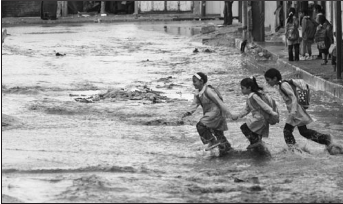
اطفاله غزة يلهون بمياه الامطار التي غطت شوارع المدينة

شكك وزير العدل في الحكومة المقالة محمد فرج الغول التي تديرها حركة حماس امس في نوابيا الرئيس الفلسطيني محمود عباس على خلفية اصدار مرسوم خاص بفتح الانتخابات في كانون الثاني (يناير) المقبل، في وقت قالت فتح ان المرسوم يعد «ضرورة قانونية» للحفاظ على دستورية السلطة الفلسطينية. ورأى ان المرسوم يعقد الانتخابات بحمل «مواقف متناقضة وخداعا»، كون ان الرئيس عباس «يتعمد مع سبق الإصرار والترصد انتهاك القانون»، واتهم الغول الرئيس عباس بانه ينتهك القانون، وقال انه «مغتصب للسلطة الرئاسية والتفيذية والتشريعية» وقال «اغتصاب عباس للسلطة يتضح من خلال انتحاله شخصية رئيس السلطة والتמיד لنفسه أكثر من سنة، ومخالفة للمادة (36) من القانون الاساسي التي تؤكد ان مدة ولاية رئيس السلطة الفلسطينية اربع سنوات ولا تسمح بتمديد الولاية مطلقا».