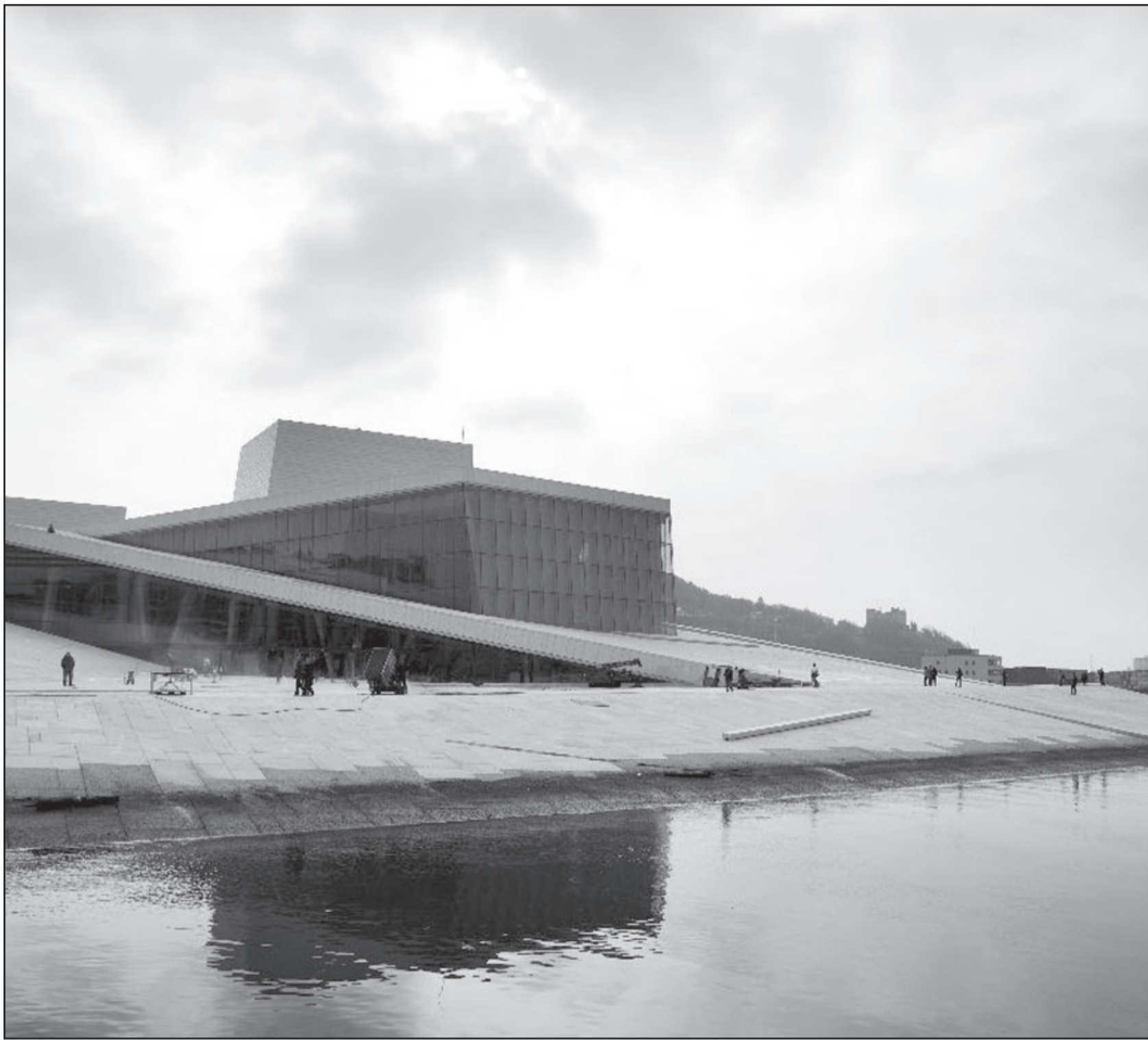
جانب من مكتبة الإسكندرية

ويلاحظ هذا الرصد من خلال عرض الوزارات في فترتي رئاسة جمال عبدالناصر والسادات، التغيير المستمر في الوزارات، ولا تشمل أهميته وخطورته في عدد من الوزارات التي تشكلت فكان للكثير منها ما يبره من الأحداث السياسية التي سادت تلك الفترة، وإنما تتمثل أهميته في كثرة عدد من تعاقب على كل وزارة، ففرضت كثرة تعاقب الوزراء على الوزارات التي تمس مصالح الجماهير مسا مباشراً وهذا فضلا عن ضم وزارات وفصل وزارات واستحداث وزارات جديدة والغاء وزارات، فعلى سبيل المثال كانت وزارة الاقتصاد وحدها في وزارتي 18 تشرين الأول (أكتوبر) 61، و29 ايلول (سبتمبر) 62، ثم ضمت التجارة الخارجية إلى الاقتصاد ابتداء من وزارة 25 آذار (مارس) 1964، واستمر ذلك إلى نهاية عهد عبدالناصر، ثم ضمت المالية إلى الاقتصاد والتجارة الخارجية في وزارة 27 آذار (مارس) 1973، ثم اختلفت وزارة الاقتصاد في وزارة 25 نيسان (أبريل) 1974،