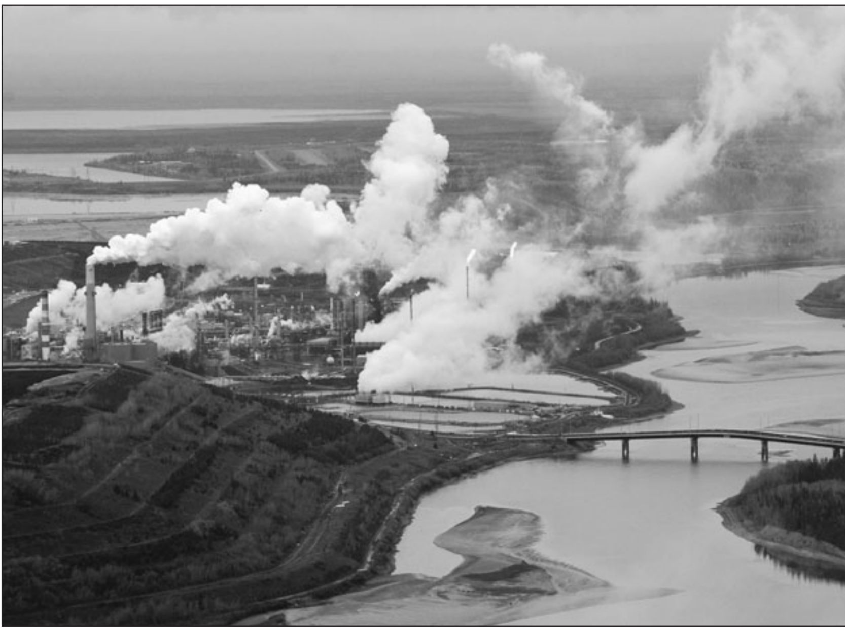
صورة جوية لمنشأة سانكور لاستخراج النفط من الرمال الزيتية على شواطئ نهر اثاباسكا في كندا

في مصر والذي يبلغ 6.08 مليون وحدة قياسية. ولصغر ثلاثة موائن رئيسية أخرى فضلا عن ميناء شرق بورسعيد. والمحلة الثانية للحاويات بالميناء قيد الانشاء.