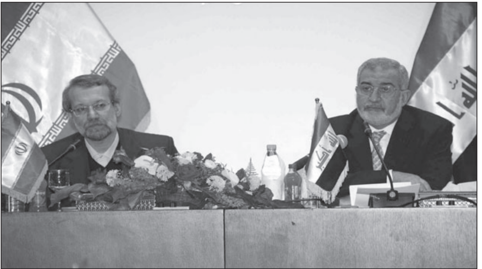
رئيس مجلس النواب العراقي اياد السامرائي ورئيس البرلمان الايراني علي لاريجاني في مؤتمر صحفي ببغداد امس