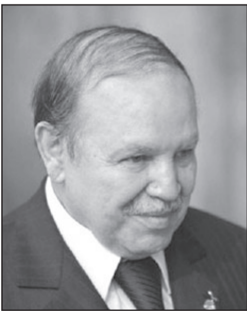
الرئيس الجزائري عبد العزيز بوتفليقة