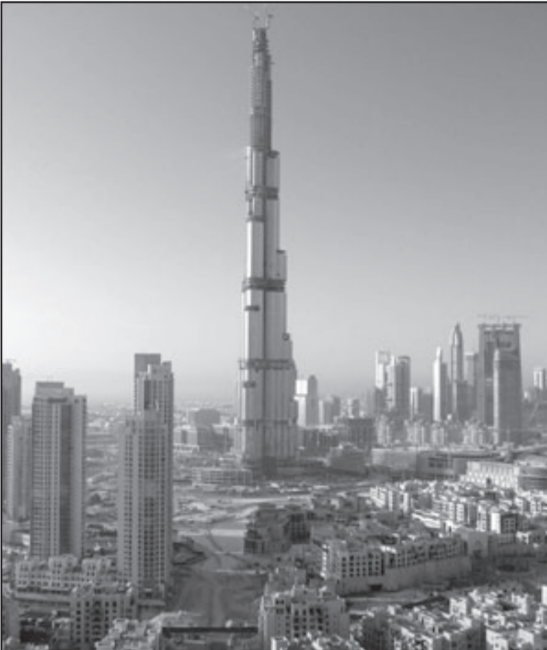
برج دبي وسط مجموعة من العمارات العالية التي يقزمها بارتفاعها الهائل