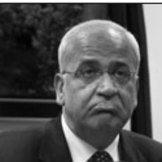
صاحب عريقات يتحدث في مؤتمر صحفي في رام الله امس

القدس غير شرعي». وطالب الادارة الامريكى بان تعلن إسرائيل كطرف معطل، إذا لم تلتمزم بخارطة الطريق، مبيّنا ان المفاوضات لا تبدأ هذه السنة، بل هي وصلت إلى موقع متقدم جداً في كانون الأول (ديسمبر) في العام 2008. بين السيد الرئيس ورئيس الحكومة الإسرائيلي السابق إيهود أولمرت، لذلك نحن نطالب باستئناف المفاوضات من حيث توقفت في ديسمبر».