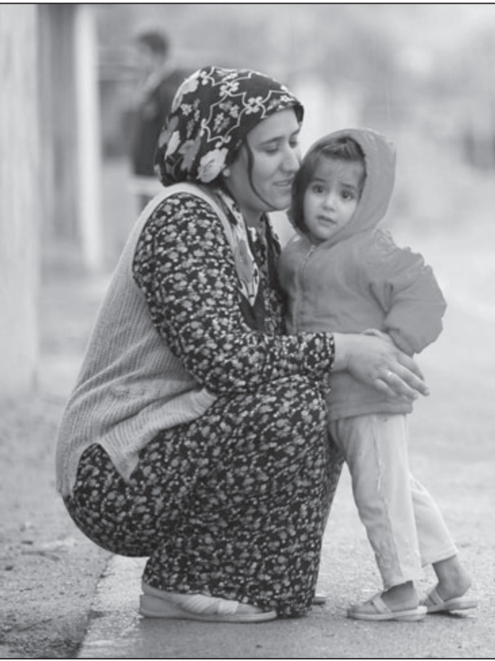
سيدة كردية عراقية مع طفلتها في اربيل بشمال العراق امس

وقال المصدر أن انفجار سيارة مفخخة متوقفة على جانب الشارع العام وسط قضاء الحمودية، جنوب بغداد، أدى «إلى إصابة 4 أشخاص بجروح خطيرة». وذكر مصدر امني أن الانفجار وقع قرب نقطة تفتيش تابعة للجيش العراقي في حي الضباط بمنطقة الاعظمية شمال العاصمة العراقية أسفر عن إصابة خمسة من عناصر الجيش بجروح «بليغة».