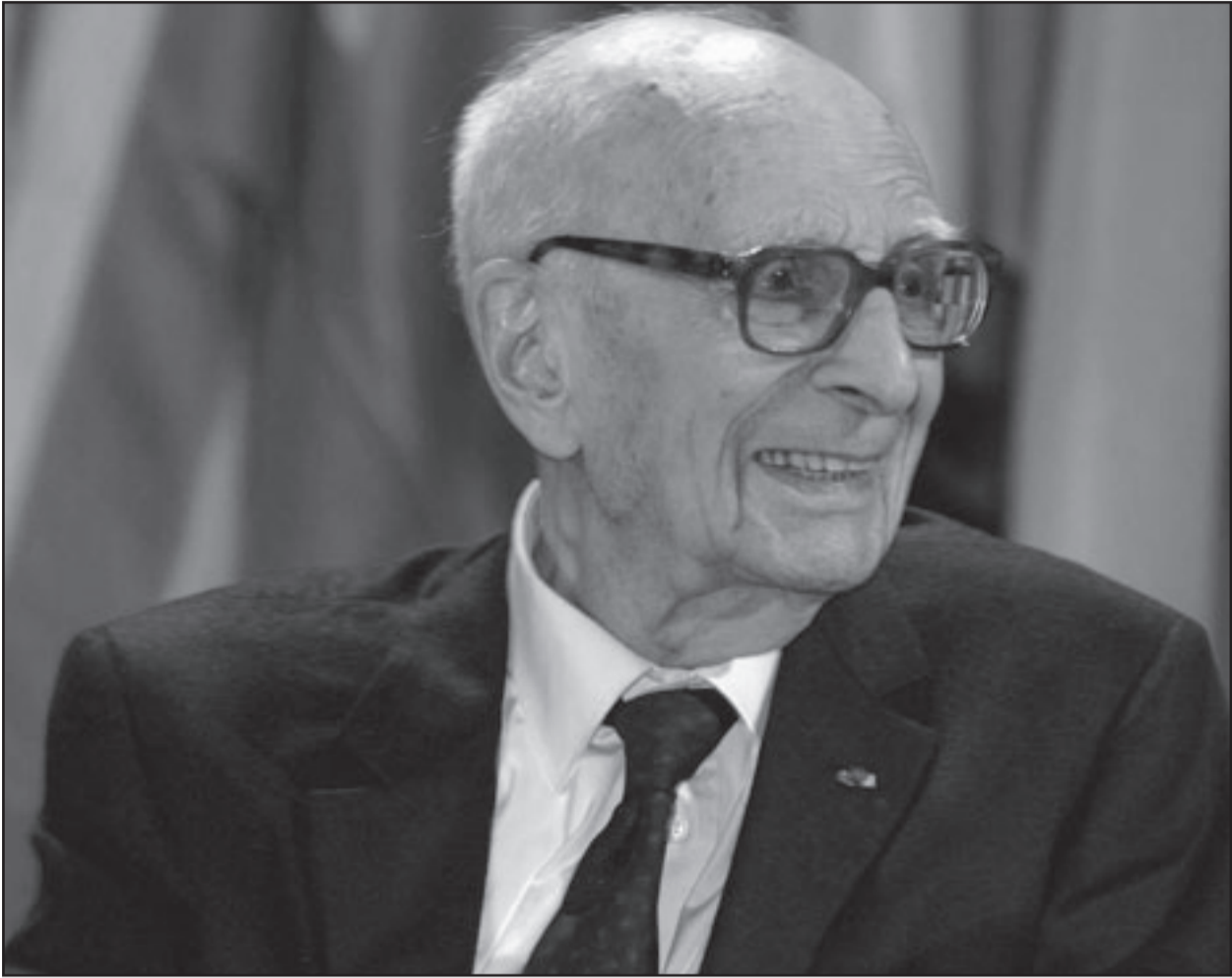
كلود ليفي ستراوس

1 عن المئة عام وعام، يرحل المفكر الفرنسي كلود ليفي - ستروُس [1908-2009م] عن عالمنا. وقد ذاع صيت الرجل في المنتصف الثاني من القرن العشرين باعتباره رائد البنيوية وعالم الأنثروبولوجيا الذي قادته مغامرات فكره إلى استكشاف الآليات الخفية للثقافة عبر سبل متنوعة ومتضاربة من العمل المهني، وهو ما اتاح له فهم قطاع مهم من تلك الآلة الرمزية المتعاطمة التي تتغلغل على مجموع خطط الحياة البشرية، من العائلة إلى المجتمعات الدينية، ومن الأعمال الفنية إلى آداب المائدة. ولقد مر، بعد ذلك، حين من الدهر لم يُسمع شيء عنه، وظل في صمت مطبق، حتى اعتقد الكثيرون أنه غادرننا، إلى أن أفاقوا على أصداه الاحتفال الكبير الذي خصّته به فرنسا مرور مئة عام على ميلاده. وكان ليفي - ستروُس، بسبب تدمره مما يحدث حواليه، يقول: «أنا نعيش في عالم لا ينتمي إليه منذ زمن. إن العالم الذي عرفته وأحبته كان يتضمن مليارا ونصف المليار نسمة، وفي عالم اليوم يتألف من ستة مليارات نسمة. لم يعد هذا العالم عالمي.»