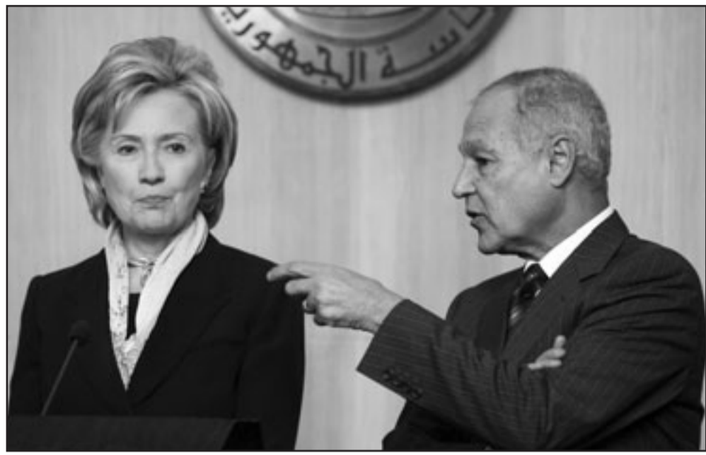
وزير الخارجية المصري خلال مؤتمره الصحفي مع نظيره الامريكى في القاهرة

الاسرائيلي وعدم وجود نتائج ملموسة للتحرك الامريكى» و انتقد الامين العام للجامعة العربية تصريحات كلينتون عن إمكانية تسوية مشكلة المستوطنات من خلال المفاوضات على حدود الدولة الفلسطينية، وتشاعل «اذا كانت (الادارة الامريكى) لم تستطع وقف الاستيطان او تجديده لفترة مؤقتة وهذا امر بسيط فهل يمكن تصور التوصل الى الاتفاق على اقامة دولة فلسطينية في حدود 1967 بما فيها القدس بهذا السهولة».