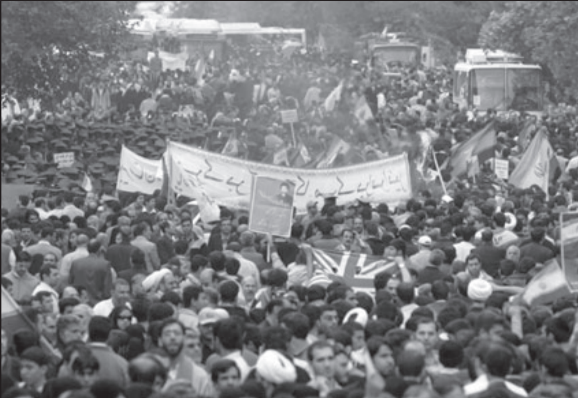
جانب من التظاهرة الحاشدة التي شهدتها طهران في ذكرى الاستيلاء على السفارة الامريكية