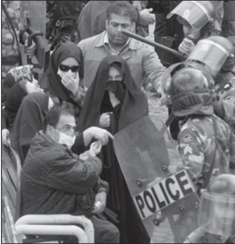
رجال امن ايرانيون يستجوبون انصارا للمعارضة