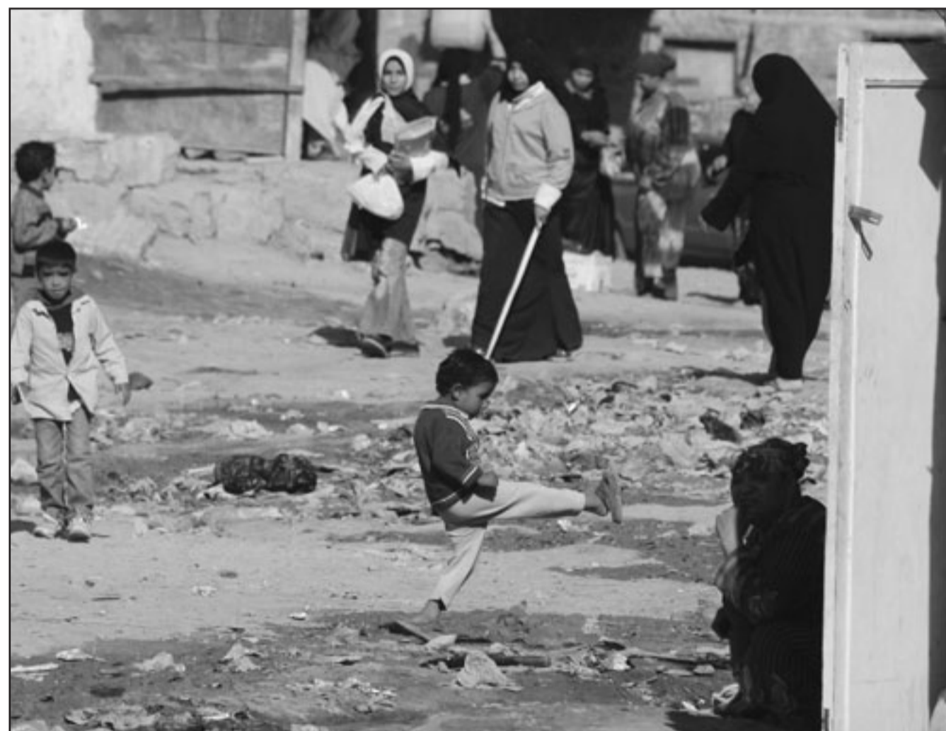
أحد شوارع القاهرة الفقيرة التي تعاني من مشكلة القمامة