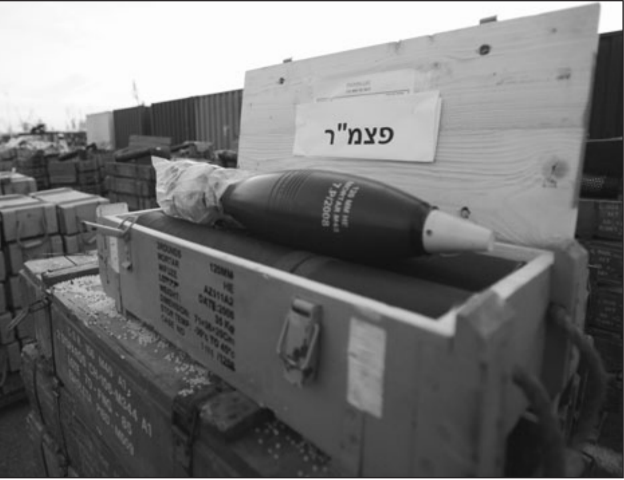
جانب من الاسلحة التي صادرتها اسراييل من سفينة تجارية قرب سواحل قبرص