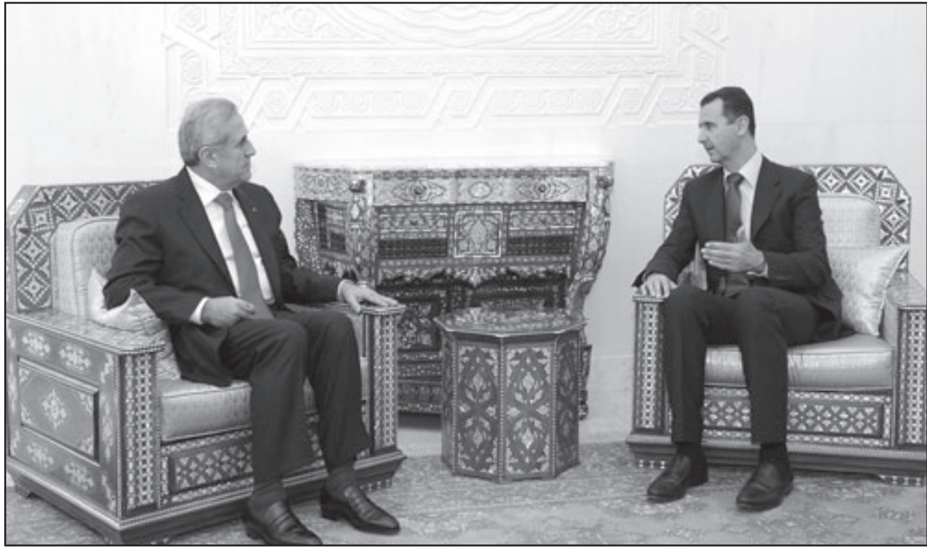
الرئيس السوري خلال استقباله نظيره اللبناني

في باريس الاربعة ان رئيس الوزراء ابلغ ساركوزي باستعداده للاجتماع مع الرئيس السوري بشار الاسد مما يثير احتمالا تجدد مفاوضات السلام المتوقفة