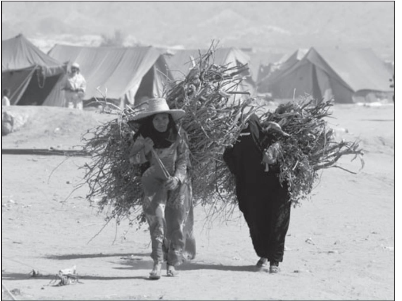
سيداتان يمينتان في معسكر للنازحين في صدرة امس

جدير بالذكر أن التوتر بين الشعبين عرف طريقه أيضاً في العلاقات الزوجية حيث تقدم مواطن جزائري للسفير عبد العزيز سيف النصر، سفير مصر في الجزائر، بشكرى يوم الاثنين الماضي يتضرر فيها من قيام زوجته المصرية بتترك منزل الزوجية الكائن بالعاصمة الجزائر عقب وقوع مشاجرة بينهما، حول من سيفوز في المباراة القادمة بين المنتخب الجزائري لكرة القدم ونظيره المصري يوم 14 تشرين الثاني/ نوفمبر الحالي بالقاهرة، في إطار التصفيات النهائية