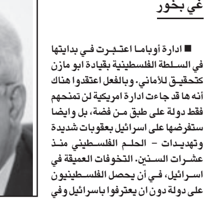
لم يتبق لأبو مازن غير الاستقالة

الذي طرحته في بداية المسيرة، وبقي الفلسطينيون مطمئن جدا هذا التنازل وذلك لانهم يعتبرون ان كمن يتبعون المفاوضات وليس إسرائيل، فهي مستعدة لان تشرع في المحادثات دون شروط، ولكنهم يطالبون بتجميد الاستيطان. وهم يعتبرون نوحا من العفة. الخطير من ذلك، هو ان الفلسطينيين يخطون أيضا ان تكون الولايات المتحدة تنازلت عن نيتها الاصلية لقامة دولة فلسطينية على كل مناطق 1967. فقد فهم الرئيس اوباما بان هذا المطلب ليس منطقيا مع الظروف القائمة على الارض في شرقي القدس وفي الكتل الاستيطانية الكبرى. هنا وصل الفلسطينيون الى الياس، من لا يتوقع لا يحيب أمه، أما هم فقد علقوا توقعات هائلة على إدارة