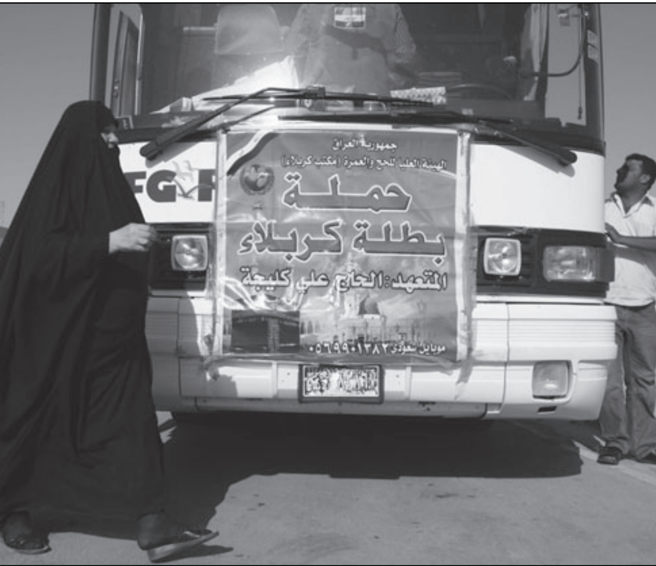
سيدة عراقية امام حاخلة للحجاج في كربلاء امس (ا ف ب)

بغداد - «القدس العربي» من ضياء السامرائي: