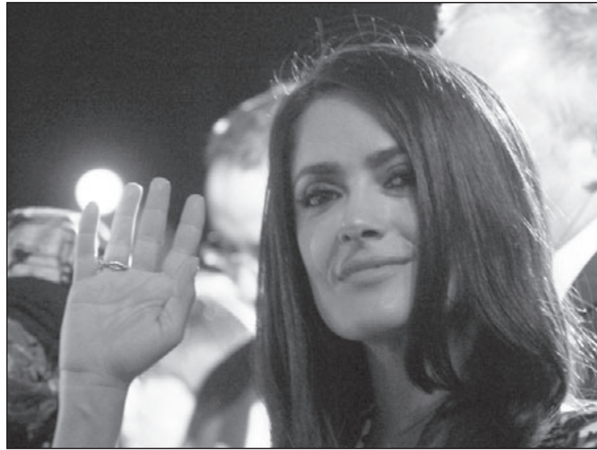
سلمى حايك في القاهرة