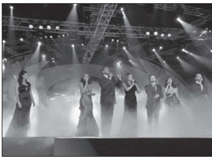
من حفل افتتاح مهرجان الإعلام العربي

كما كرم المهرجان المخرج السعودي عبد الله الحسين وحسن كمال مدير الإذاعة البحريني السابق والمخرج السوري مطهر الحكيم والرائع الشاعر الفلسطيني محمود درويش والكاتب السوداني الطيب صالح. وتتوافق 18 دولة عربية بـ682 عملاً بينها 208 أعمالاً إذاعية و474 عملاً تلفزيونياً على جوائز المهرجان الذي يستمر حتى يوم 15 من الشهر الجاري ويبلغ مجموع جوائز 5.2 مليون جنيه