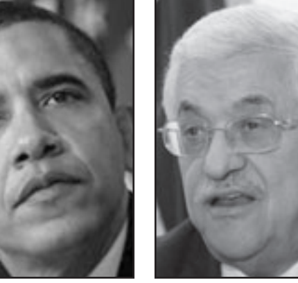
أوباما شرع انه أخطأ بحق إسرائيل