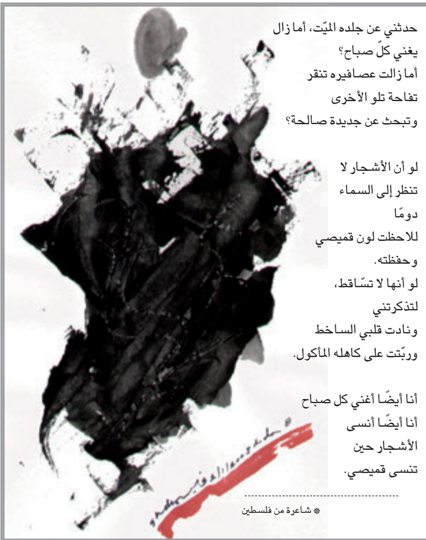
شاعرة من فلسطين

* باحث مقيم في ألمانيا andaloss29@yahoo.fr