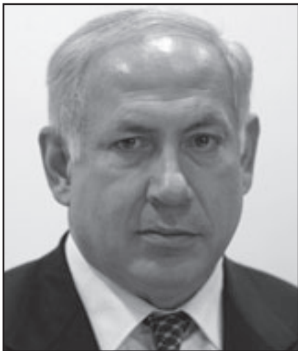
زيارة نتنياهو البيت الأبيض كانت مشرفة

تفاوض شامل في المستويات العليا. ليست احتمالات نجاح التوجه الجديد ضمانة، ولو بسبب ما يحدث في الشارع الفلسطيني عامة وفي الأزقة السياسية خاصة، لكن استعرضت في المحادثة الموضوعات التي يسير فيها عن التعاون بين الولايات المتحدة وإسرائيل في القضية الفلسطينية. لم تسو جميع الخلافات ولا زينت جميع العقبات بالزيارة، لكن جمع الأزمات المهمة حل محله جو جديد من التعاون. أمريكا ليست لا تستطيع فصل نفسها عن النزاع في الشرق الأوسط، كما اقترح نوحاس فيديمان في شبه هول، بل لا يستطيع النزاع أن يهمل نفسه عن أمريكا. في هذا الواقع اسهم اللقاء عن توثيق الصلة والتفاهم بين إسرائيل وحليفها.