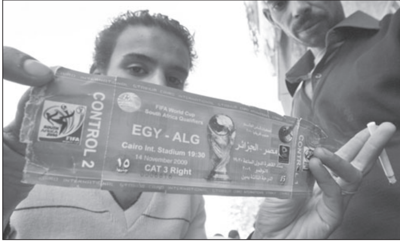
مشجع مصري يبرز تذكرة التي اشتراها لحضور المباراة بين منتخب مصر والجزائر

صباح امس الخميس حوالي 265 مشجعا جزائريا وصلوا لحضور المباراة على متن طائرتين مصرية وجزائرية. وقال المسؤولون ان اصوات المشجعين الجزائريين انطلقت بالشعارات المؤيدة لفريقهم القومي بوقبيلت بشعارات مضادة من قبل مسافرين مصريين وكذلك بعض موظفي المطار. واضاف المسؤولون ان رجال الامن فرقوا الطرفين لمنع اية احتكاكات بينهما. وكانت سلطات الأمن في القاهرة قد أعلنت حالة الطوارئ استعدادا للمباراة بعد اشتداد درجة الاحتقان لدى جمهوري البلدين بشأن المباراة التي هي آخر جولات المجموعة الثالثة المؤهلة لنهائيات كأس العالم بجنوب أفريقيا 2010. ويدخل منتخب الجزائر اللقاء متصدرا قمة المجموعة الثالثة برصيد 13 نقطة، فيما يحتل المنتخب المصري المركز الثاني برصيد 10 نقاط، ويحتاج