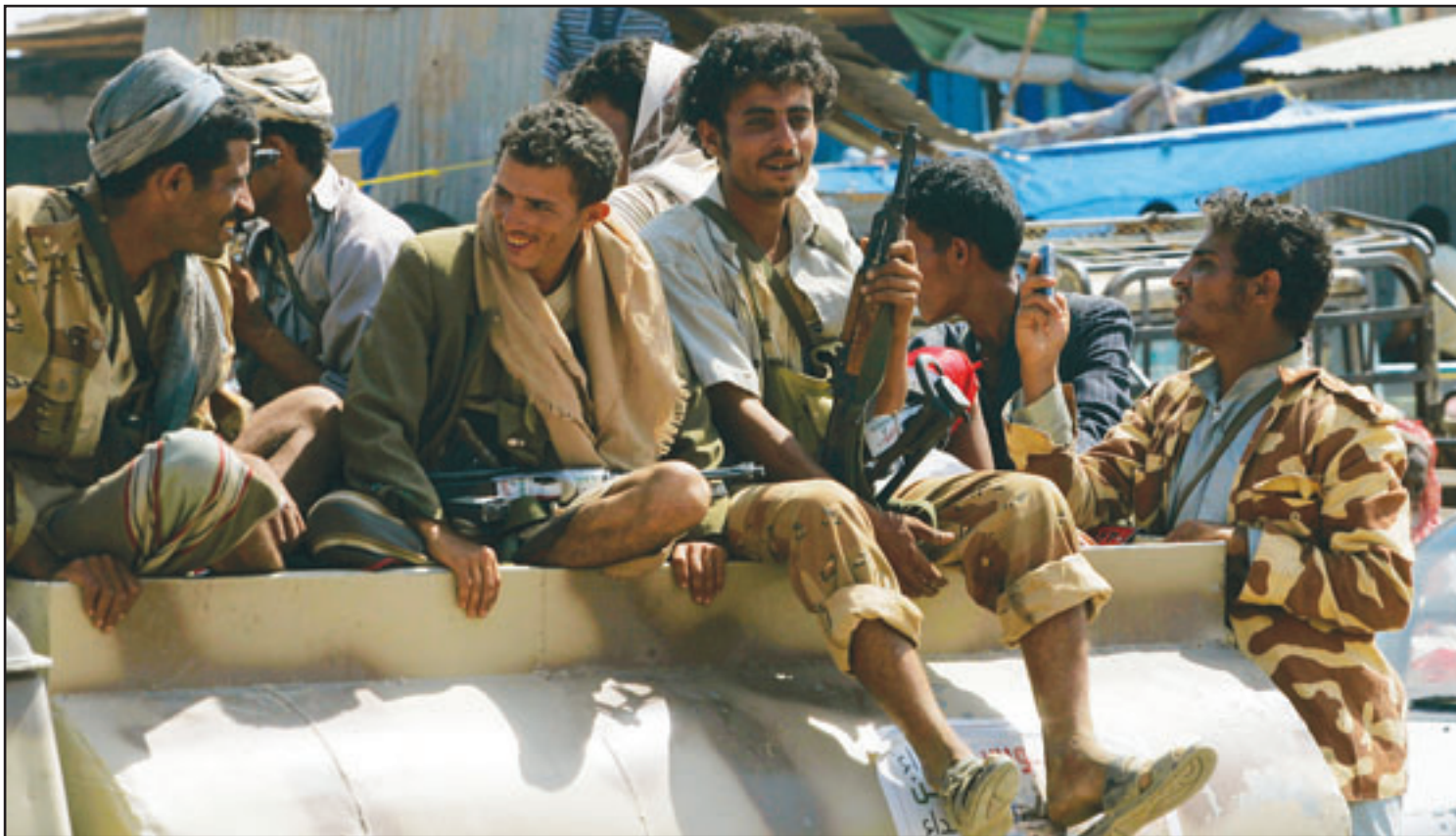
جنود يمنيون في صعدة أمس

في هذه الحرب ضد عناصر التمرد والارهاب الحوثية رف نسبة النازحين اليمنيين إلى مخيم المزرقي للنازحين وإلى وكان مساعد وزير الدفاع السعودي خالد بن سلطان أعلن وأرجع أسباب ذلك إلى أن «الكثير من اليمنيين كانوا يعيشون داخل الخط الحدودي المشترك، بحكم صلة القرابي والصاهرة مع نظرائهم في الجانب السعودي»، موضحاً أن «لواطين اليمنيين الذين كانوا يعيشون على الخط الحدودي اضطروا إلى ترك قراهم ومناطقهم تحت تأثير القصف السعودي الشديد على الشريط الحدودي إلى مناطق النزوح الآمنة في محافظة حجة وفي مقدمتها مخيم المزرقي الذي فاق في عدد النازحين طاقة السلطات اليمنية وإمكانيات المنظمات الدولية العاملة فيه».