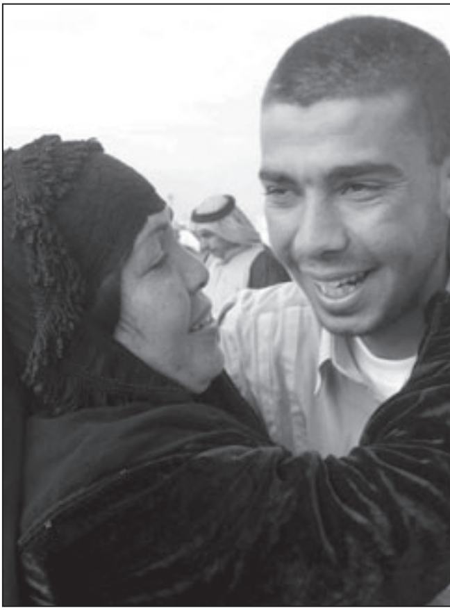
سيدة عراقية تعانق ابنتها بعد الافراج عنه في بغداد امس (رويترز)

لذا امام البرلمان العراقي ايام قلائل لمناقشة مطلب طارق الهاشمي نائب الرئيس العراقي وهو من العرب السنة بمنع العراقيين المقيمين بالخارج صوتا اكثر وضوحا داخل البرلمان.