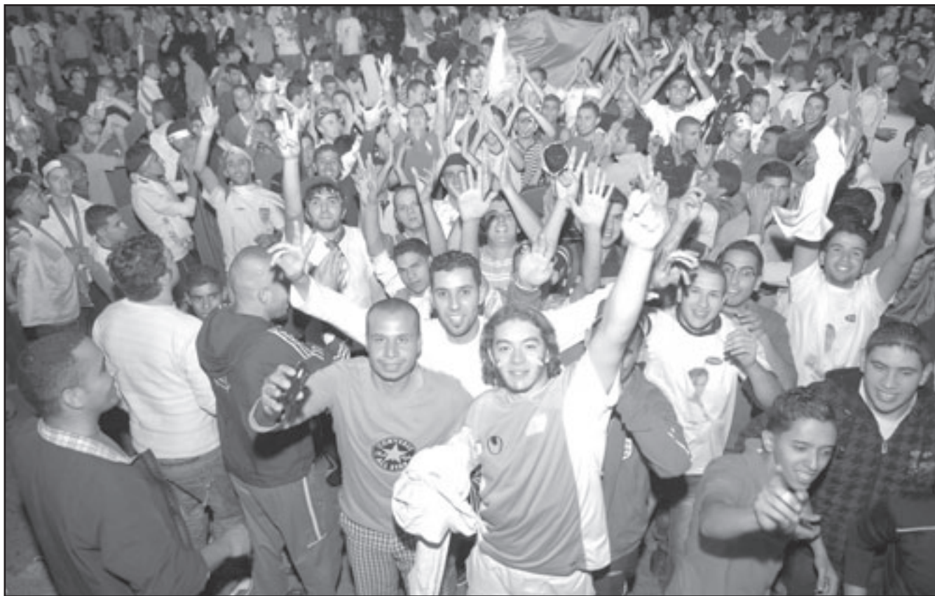
جزائريون في حالة اشتاء وهم ينتظرون وصول فريقهم القومي إلى مطار العاصمة عصر أمس عاذا من السودان (القدس العربي)

الخطيرة التي حدثت في القاهرة من التعدي التعمد على حافلة الفريق الوطني والاضايقات التي تعرض لها إزاء ما قام به المواطنون الجزائريون من اعتداءات على أنصار الفريق الوطني وما رافق ذلك من الضغوط النفسية والحملة الإعلامية الشرسة من مختلف وسائل الإعلام المصرية. وذكر البيان بتصريحات المسؤولين الجزائريين بأن «من مسؤولياتهم حماية الرعايا الأجانب وممتلكاتهم بما فيها ما يتعلق بالرعايا الأثقاء من جمهورية مصر العربية ويدركون تماما أن تواجدهم في الجزائر يعود إلى عراقلة الحكمة بين البلدين».