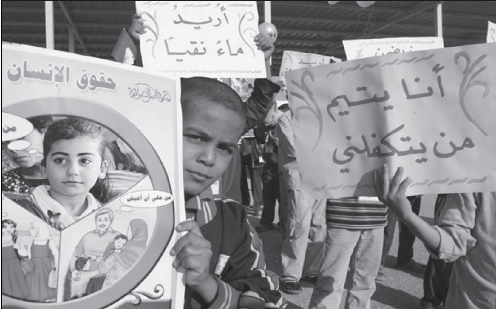
اطفال عراقيون ضمن تجمع رعته اليونسيف في يوم الاطفال العالمي امس

دورا اكبر في اختيار رئيس الوزراء. ولا يستبعد معلقون ان دعوة الهاشمي مرتبطة بمنافسة سياسية لتعزيز موقفه السياسي خاصة بعد تركه الحزب الاسلامي. وعلى الرغم من مواقف السياسيين العراقيين الا ان محللين في صحف بريطانية لم يستبعدوا ان يفتح قراره الباب امام جولة جديدة من النقاش والجدل حول القانون، الذي ظل يدور في اروقة مجلس النواب العراقي لفترة طويلة قبل اقراره.