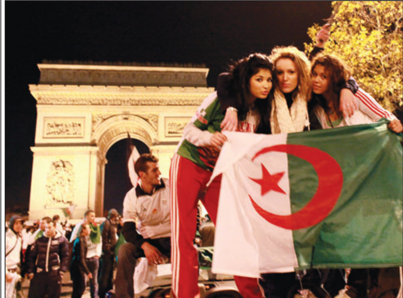
جزائريون في فرنسا يحتفلون بفوز فريق بلادهم في مباراة التأهل للمونديا