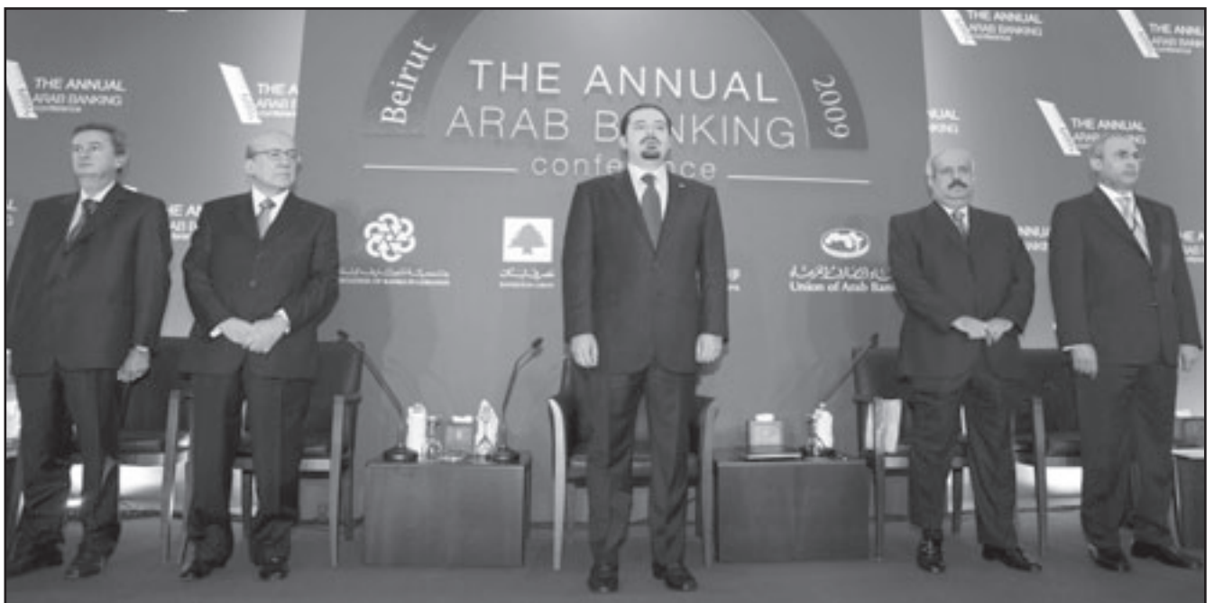
الحريري خلال الاجتماع السنوي للبنوك العربية

الصارف اللبنانية مناعة هائلة وقدرة على التكيف مع الأحداث مهما كانت صعبة واستطاعت مؤخرا تحطيم تدايعات الأزمة المالية العالمية التي مزقت النظام المالي العالمي. بل أكثر من ذلك أصبح لبنان ملاذاً للرسائل الوافدة،