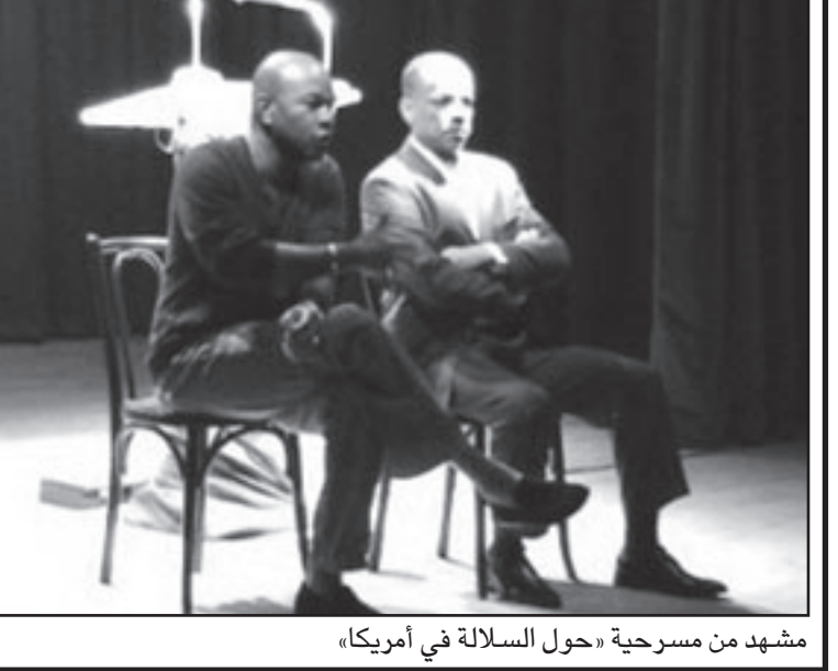
مشهد من مسرحية «حول السلالة في أمريكا»

وسواصل المهرجان للدورة الثالثة على التوالي حجب المسابقات والجوائز للاعمال المسرحية المعروضة. وقبول سحبها في الدوريتين الماضيتين باحتجاجات واسعة من قبل العديد من المسرحيين الذين رأوا في ذلك انحرافاً عن المسار التاريخي للمهرجان الذي يوفر فرصاً للتنافس بين أفضل الاعمال المسرحية في العالم العربي والافريقي.