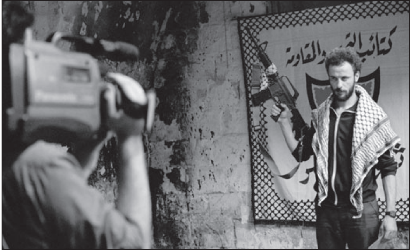
لقطة من فيلم «الجنة الآن» لهاني أبو أسعد

الأوسكار عن أفضل فيلم غير أمريكي، وحصوله على جائزة «غولدن غلوب» في فئة أفضل فيلم أجنبي، وهو أول فيلم عربي يفوز بهذه الجائزة الرفيعة، كما حصل على جائزة الجمهور في مهرجان برلين السينمائي، وجائزة العجل الذهبي في هولندا، وجائزة مهرجان دوربان للسينما العالمية في جنوب أفريقيا، وجائزة «الملك الأزرق» في مهرجان الفيلم الأوروبي، وجائزة منظمة العفو الدولية (أمستري إنترناشيونال)، وجائزة العفو باور الخاصة، وجائزة قراء صحيفة «مورغن بوست».