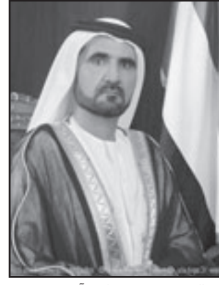
الشيخ محمد بن راشد آل مكتوم

■ لندن - «القدس العربي»: أكد الشيخ محمد بن راشد آل مكتوم نائب رئيس دولة الامارات ورئيس مجلس الوزراء حاكم دبي امام وقود اعلامية وصحافية من نحو 46 بلدا عبريا واجنبيا جاءوا إلى الامارات بدعوة من المجلس الوطني للعلوم بمناسبة الذكرى الثامنة والثلاثين لعيد الوطني. وفي وحدة الامارات سياسيا واقتصاديا واجتماعيا وتعمويا، مقدما الاعداءات والاصوات التي تصدر من هنا وهناك حول الازم الاقتصادية التي تركزتها الازمة الاقتصادية والمالية العالمية على اقتصاد ومشاريع دبي دون ابوظبي موصيا «انه ليس عندما ما لله ولما يقصر يقصر وافضا هذه المقولة ومعتبرا ان كل شيء لله ومن عنده سبحانه وتعالى وكل ما في دبي وابوظبي هو لدولة الامارات العربية المتحدة وشعبها». وعرب و ثقته التامة بنهوض اقتصاد الامارات من جديد والذي بدأ يتعافى تاركا الازمة المالية العالمية خلفه دون الالفتات التي الوراها الاقتصاد العالمي برونية جديدة متعائلة، مشورا في هذا السياق إلى مشروع الطاقة النووية السلمية الذي اعتمده حقا شرعا لدولة الامارات للاستخدامات المدنية