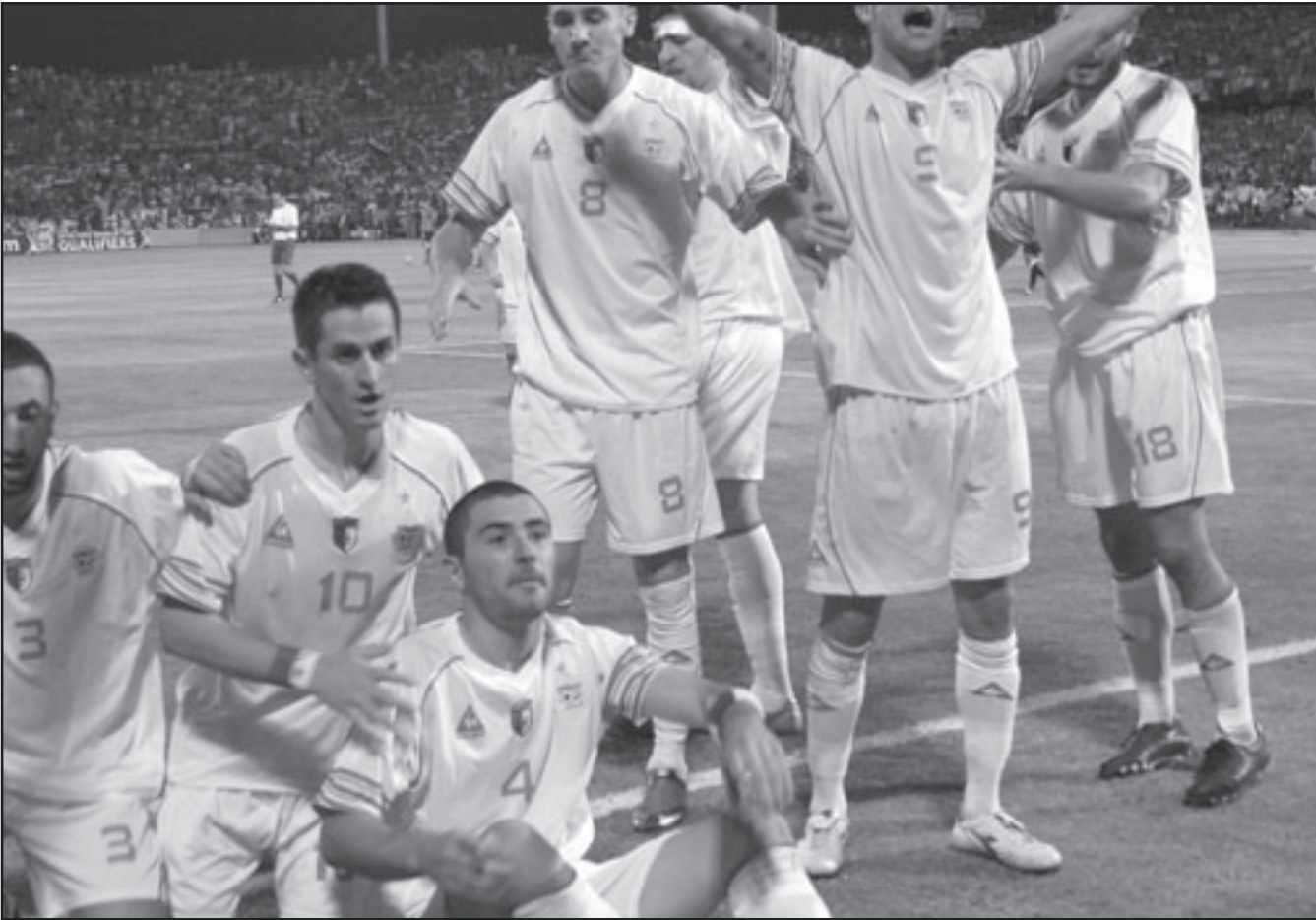
نجوم منتخب الجزائر يحتفلون بالفوز والعبور الى كأس العالم

شامل عن الأحداث التي وقعت قبل وأثناء المباراة الفاصلة في السودان وكذلك المباراة الأولى بالقاهرة لتقديم القدم «الفيقا» على الجرائم التي ارتكبتها الجزائريون ضد الفريق والمجاهير المصرية. ويذكر أن الجماهير المصرية واللاعبون قد تعرضوا لهجمات من قبل الجماهير الجزائرية في السودان وتم الاعتداء على عدد من الحافلات الخاصة بهم وهناك العديد من الأدلة والشواهد على ذلك.