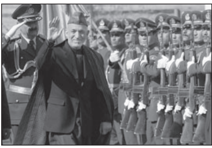
الرئيس الافغاني حامد كرزاي يستعرض حرس الشرف

■ كابول- وكالات: قال الرئيس الافغاني حامد كرزاي في خطاب تنصيبه امس الخميس ان قوات بلاده يجب ان تكون مستعدة لتولي مسؤوليات الامن في البلاد في غضون خمس سنوات وتعيد بمكافحة الكسب غير المشروع الذي أساء إلى سمعته. وادي كرزي اليمين الدستورية في وقت يتحدث فيه واشنطن إرسال عشرات الاف من القوات الاضافية لخوض حرب تتراجع شعبيتها. وكانت وزيرة الخارجية الأمريكية هيلاري كلينتون من بين المسؤولين الاجانب الذين حضروا المراسم. ووصف كرزاي (51 عاما) أيضا إلى اجتماع مجلس القبايل (لويجا جيركا) الذي يعطيه الدستور الأفغاني اولوية على كل مؤسسات الحكومة بما فيها الرئاسة نفسها. ويأتي أداء كرزاي اليمين الدستورية في ظل تصاعد تمرد حركة طالبان وشكوك حول شرعية الرئيس الافغاني بعد انتخابات شابها تزوير وشكاوى من انتشار الفساد وسوء الادارة في الحكومة الافغانية. وقال كرزاي الذي سيتولى الرئاسة لفترة ثانية مدتها خمس سنوات «نحن عازمون على ان تصبح القوات الافغانية في غضون