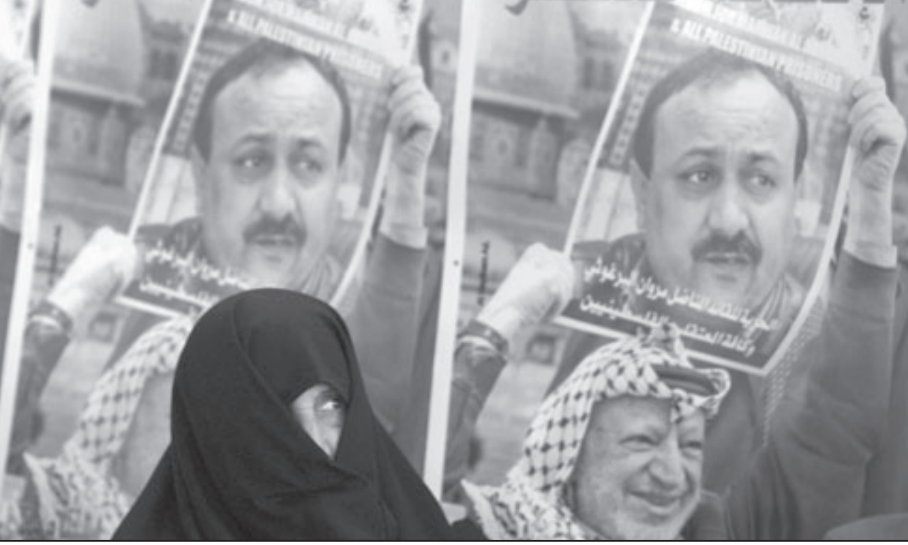
فلسطينيون يرفعون صور الرئيس الراحل ياسر عرفات والاسير مروان البرغوثي خلال تظاهرة في غزة

بدون وقف كامل لبناء المستوطنات الاسرائيلية التي يقول الفلسطينيون انها تقوض فرصهم في اقامة دولة تتوافق لها مقومات البقاء. وقال البرغوثي «عدوت دوما الى المزاوجة الخلاقة بين المفاوضات والمقاومة والعمل السياسي والدبلوماسي والجماعي... وحثرنا من الانهزام للمفاوضات فقط وقد اكتشف البعض ذلك متأخرا». وطالب البرغوثي «بإسناد البرنامج الفلسطيني الذي طرحه ابو مازن (عباس) لمواجهة غزة وعاصمتها القدس الشرقية، الى الأمم المتحدة وبالتف كامل والتقدم نحو تجسيد الدولة كامر واقعي».