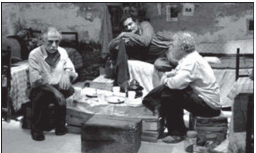
لقطة من فيلم «الليل الطويل»

ويجذب الفيلم الخوض المباشر في اشكالية السجن السياسي لكنه يعرض لما يتصل بها عبر حديث علاقات السجناء المطلق سراحهم، التي تنتظر بترقب عودتهم الى حياة شهدت انقلابات جوهرية. وعبر حاتم علي عن امله ان ينال فيلمه الموافقة