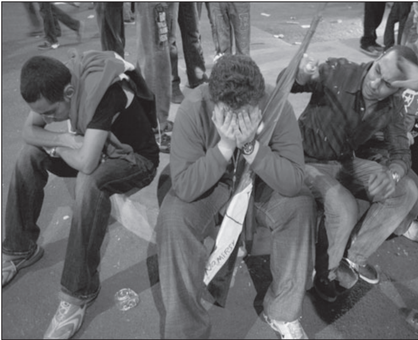
مصريون في احد شوارع القاهرة بعد فشل منتخبهم في التأهل الى المونديال