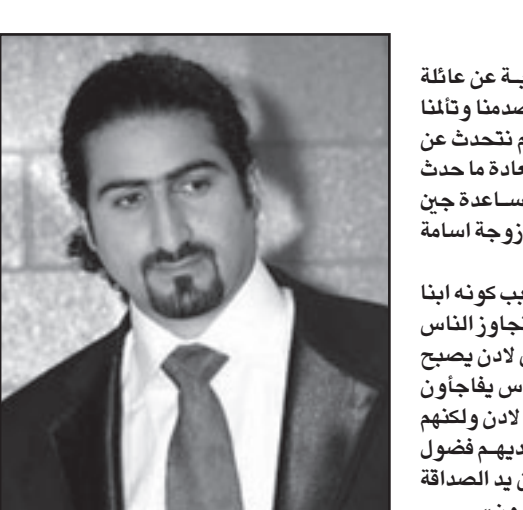
عمر بن لادن