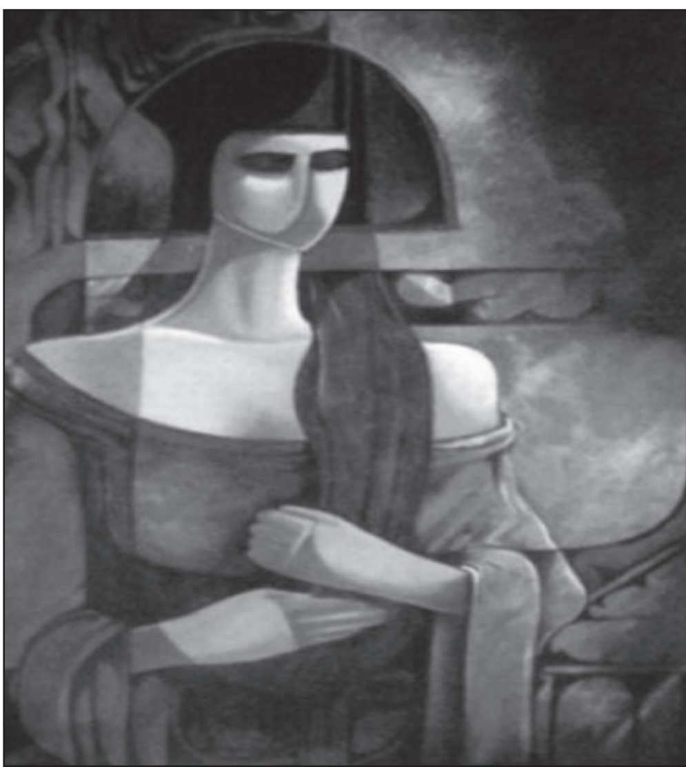
لوحة للفنان مجدي الكفراوي

الاضرابات العمالية في السبعينات من القرن الماضي، أي في أوج الديكتاتورية.