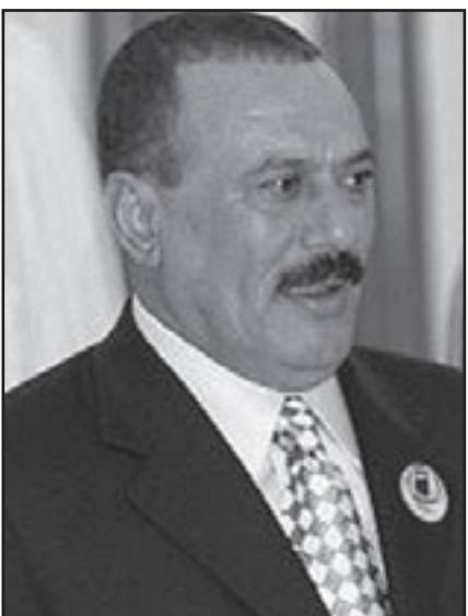
الرئيس علي صالح

الاحتقانات، بسبب المشكلات، بسبب التمييز، بسبب التهميش، بسبب انعدام التنمية، وانعدام المساواة بين الناس». وأكد أنه بسبب هذه المشكلات والاحتقانات المتراكمة «أصبحت هذه المنطقة الحدودية بؤرة صنف وتهريب وقطع طرق وتهريب مخدرات ومن ثم هذه البيئة هي بيئة جريمة عابرة للحدود، وأي بيئة للجريمة لا شك أن العنف هو أحد نتائجه».