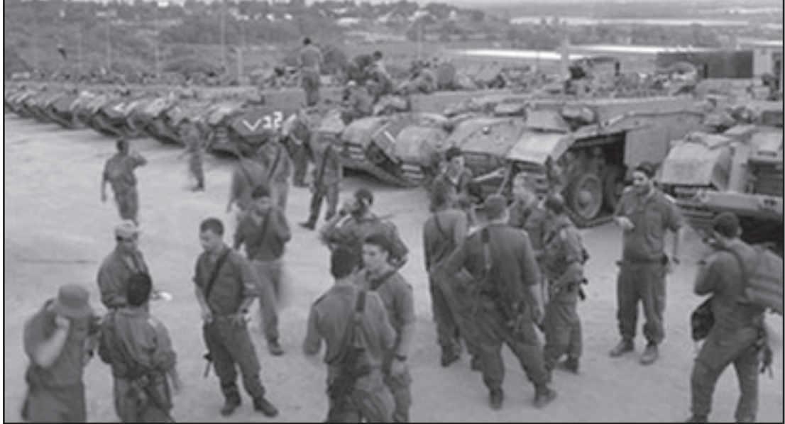
الجيش الإسرائيلي تبني استراتيجية «حرب بلا مخاطرة»

المحليين لم يكن ذا وزن في «الرصاص المصبوب». ان ادراك قادة القوات في افغانستان والعراق ان سياسة منع المخاطرة تعرض القدرة على تحقيق المهمة العسكرية للخطر، لانها تزيد تايد المواطنين للقوات التي يريد الغرب القضاء عليها، ما تزال غير ذات وزن في التفكير العسكري الاسرائيلي. كل ذلك برغم حقيقة ان الاسرائيليين سيظلون يعيشون الى جانب الفلسطينيين. اما جنود قوات التحالف فسينسحبون آخر الامر من افغانستان ويعودون الى بلادهم بعيدا عن هناك.