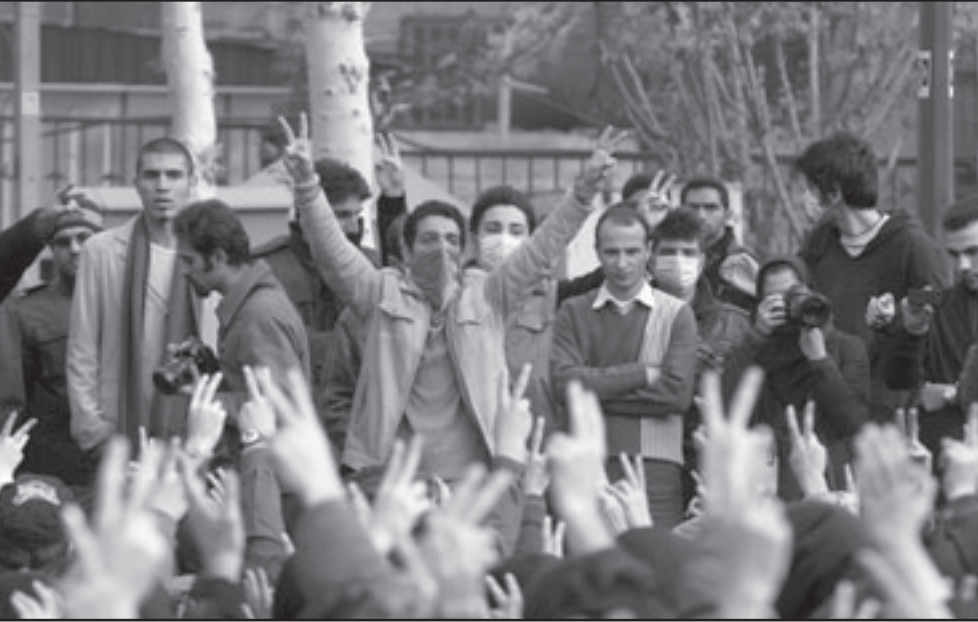
انصار الاصلاحي مير حسين موسوي يتظاهرون في طهران امس

طهران - وكالات: استخدمت الشرطة الإيرانية المنتشرة بكثافة صباح امس الاثنين الغاز المسيل للدموع لتفريق متظاهرين في وسط طهران وغمقوا مناسبة احياء «يوم الطلاب» لاطلاق شعارات مناهضة للرئيس محمود احمدي نجاد، على ما افاد شهود. وقال احد الشهود لوكالة «فرانس برس» ان «الشرطة استخدمت الغاز المسيل للدموع ضد مجموعات من المتظاهرين كانوا يرفعون شعارات ضد الرئيس محمود احمدي نجاد»، دون تحديد عدد المتظاهرين. واضاف المصدر ذاته ان هذه الحوادث جرت في جادة انقلاب المحاذية لجامعة طهران. وتعدز على وكالة «فرانس برس» التأكيد من حصول هذه الحوادث بسبب منع الصحافة الاجنبية من تغطية تظاهرات المعارضة. واعلنت السلطات «عدم صلاحية» البطاقات الصحافية الممنوحة للصحافيين الاجانب لمدة 48 ساعة. وحسب وكالة «فرانس برس» فقد شارك نحو الالف طالب في تجمع رسمي داخل الجامعة واطلقوا شعارا مؤيدا للمرشد الأعلى للجمهورية علي خامنئي، وتم تنظيم جنازة رمزية احياء لذكرى مقتل ثلاثة طلاب يابدي شرطة الشاه في 7 كانون الاول (ديسمبر) 1953 اثناء تظاهرات معادية للولايات المتحدة. واضافت الوكالة ان نحو 50 من انصار مير حسين موسوي حاولوا التوشيل على التجمع واطلقوا «مقاتلات» مؤيدة لمير حسين موسوي. وترغم موسوي المرشح الخاسر في الانتخابات الرئاسية في 12 حزيران (يونيو)، المعارضة منذ اعلان نتائج تلك