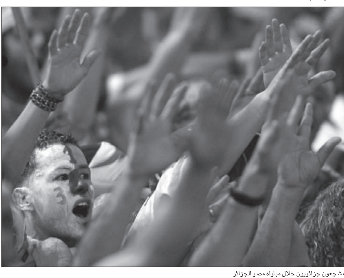
مشجعون جزائريون خلال مباراة مصر الجزائر

تلك كانت جريدة «الدستور» الشعبية أكثر وضوحا في موقفها لا سيما في مقال لرئيس تحريرها إبراهيم عيسى الذي أدان ما فعله رموز الحزب الوطني في السودان وهو ما دفع للبع الأكبر للرئيس إلى اتهامه بالكتب في حديثه للفضائية المصرية.