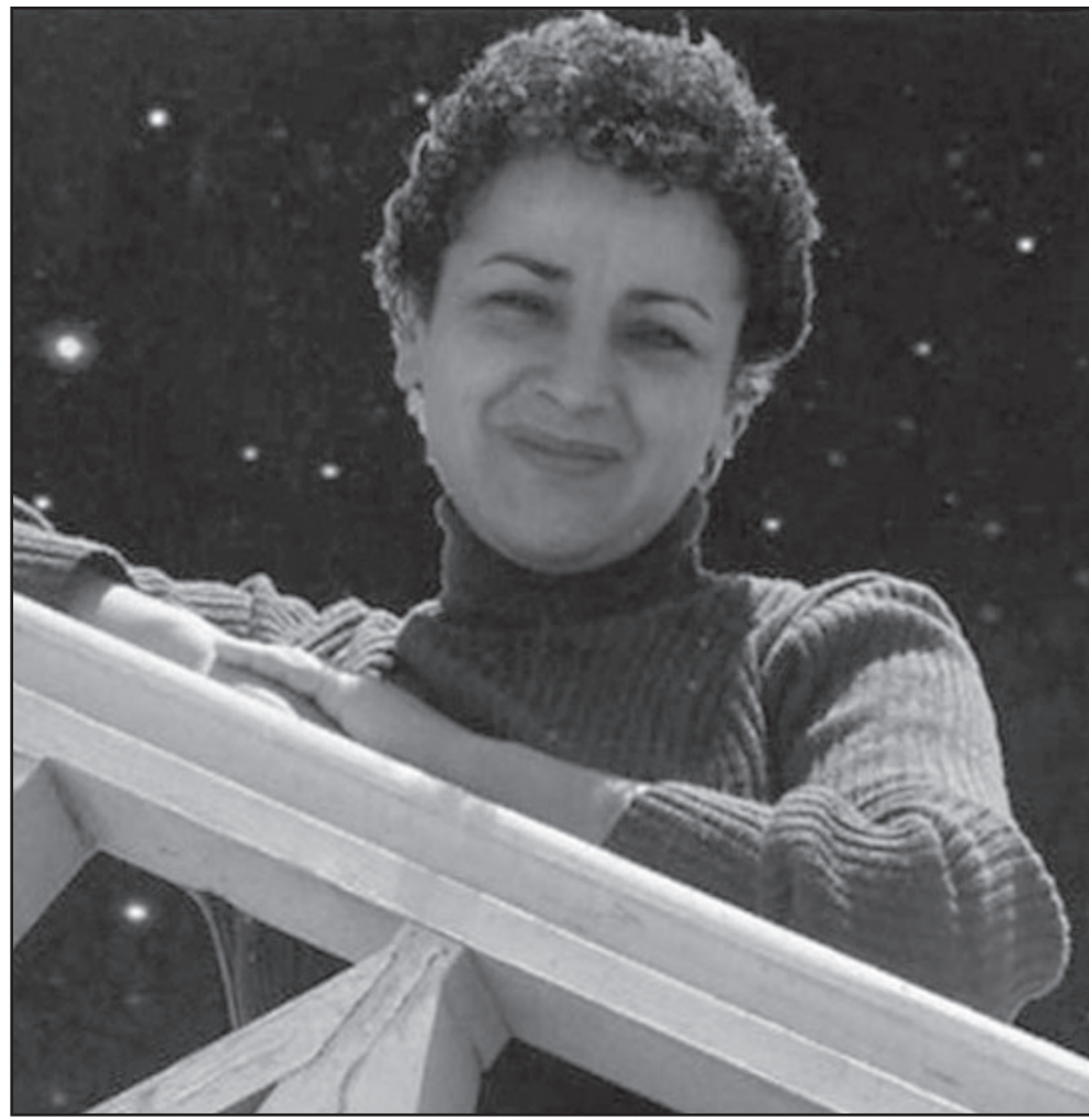
أمينة بوخبزة (القدس العربي)