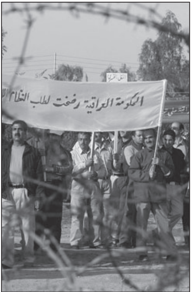
مظاهرات مجاهدي خلق في بغداد امس

وقال السامرائي «ان الجهد الامني العراقي ما زال دون المستوى المطلوب وان التضارب في اجابات الوزراء كان مؤشرا من مؤشرات الخلل وانعدام التنسيق بين الوزارات المعنية، الامر الذي انعكس سلبا على الوضع الامني في البلاد». ووصف النائب حميد رشيد معلة اجابات الوزراء والقادة الامنيين الذين انهى البرلمان استضافتهم الاثنين بالتفاوتة، في حين وصفها النائب رضوان الكليدار بغير الشافية.