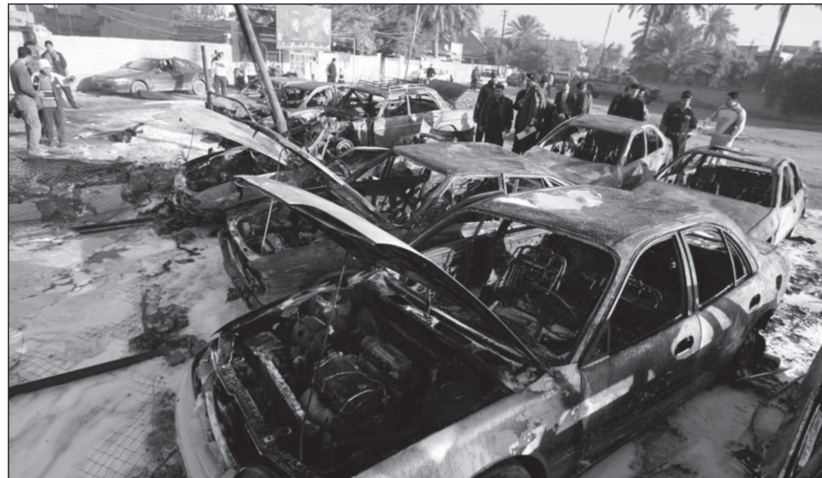
موقع الانفجار في بغداد امس