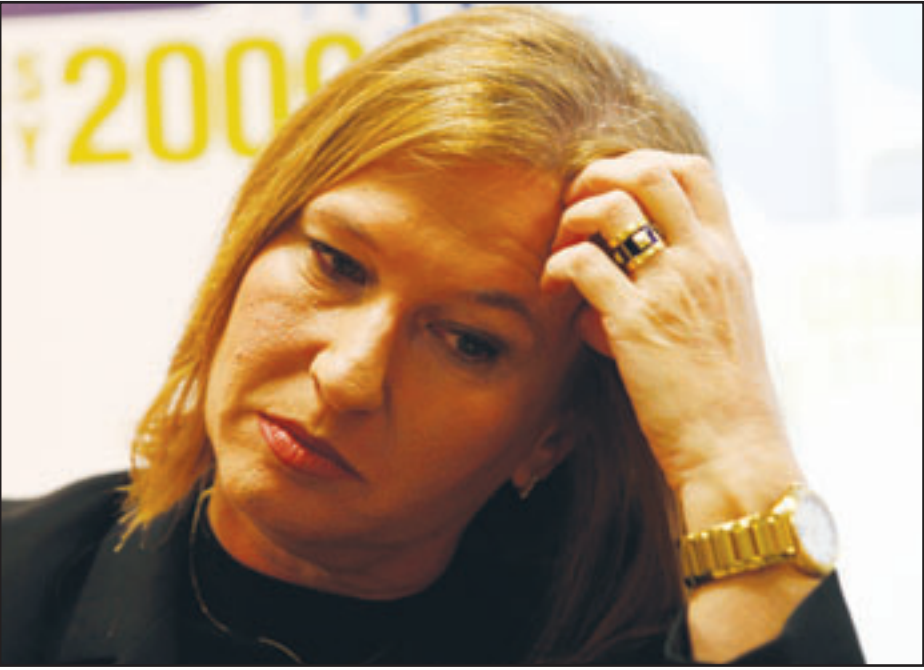
زعامة المعارضة الاسرائيلية تسيبي ليفني خلال مؤتمر في معهد الامن القومي بتل ابيب امس

وتسود حالة من الاحتياط والغضب في اوساط مناصري القضية الفلسطينية بعد تسرب ابناء عن احتمال ان تكون