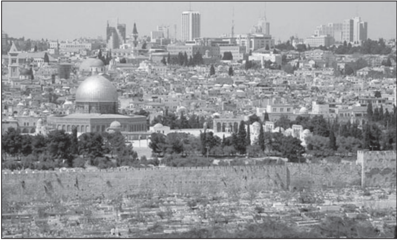
الاتحاد الأوروبي لم يعترف بضم القدس الشرقية

لا يخفي الاتحاد الاوروبي تأييده لأسى مازن ويدعو الفلسطينين الى تأييده. سيبارك الاتحاد الاووبي اقامة انتخابات داخلية، عندما تمكن الظروف