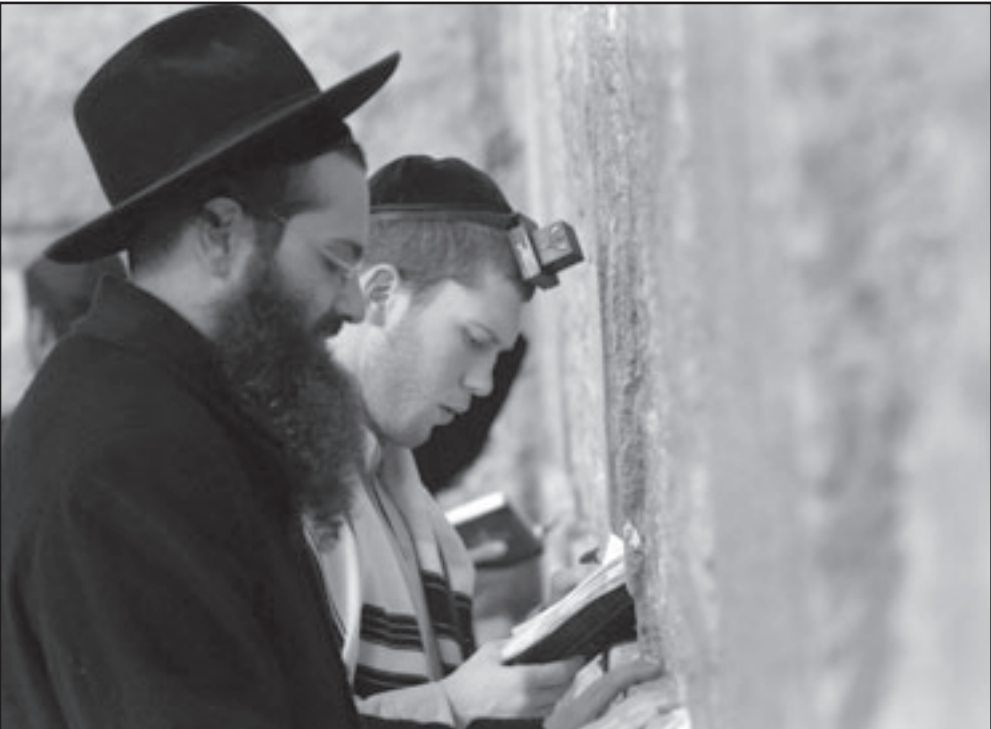
إسرائييل تواجه خطر عدو داخلي

الرسمي ويدرك انه ينمو بيننا سرطان فتأكد؟ متى نندرك جميعا انه يجب وقف هؤلاء الزعران الذين يشبهون الجهاديين والتأزيميين الجدد وهم صغار؟ لنجد الله ألا يكون ذلك متأخرا.