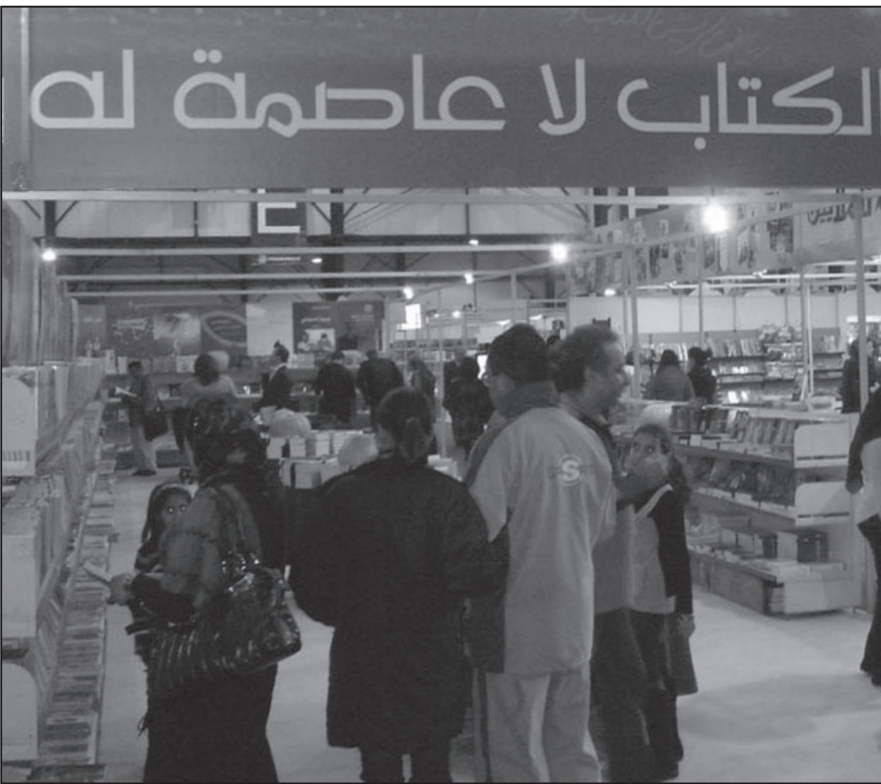
من أنشطة المعرض «القدس العربي»