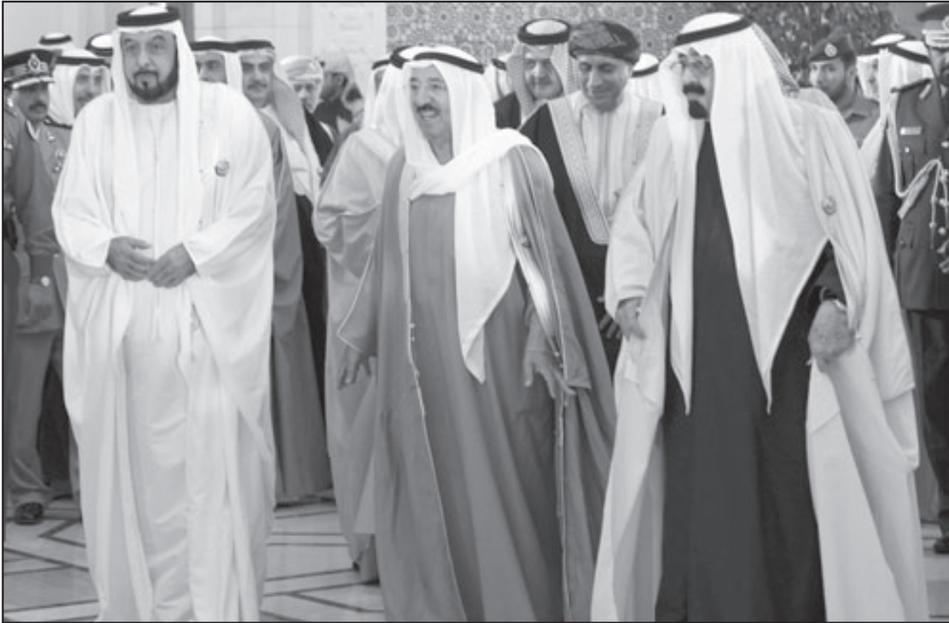
العامل السعودي الملك عبد الله بن عبد العزيز وأمير الكويت الشيخ صباح الاحمد الصباح ورئيس دولة الامارات الشيخ خليفة بن زايد آل نهيان

امام رقابة المجتمع المدني على العمل الحكومي، وجاء في البيان الصادر عن «مؤتمر المجتمع المدني الخليجي للوازي للقمة الخليجية»، والذي رفع الى قادة دول مجلس التعاون الخليجي «ان مشاركة الشعوب الخليجية في اتخاذ القرار في ما يتعلق بنواحي الحياة كافة، وان رسم هذه الشعوب مستقبلها اصحبا من المتطلبات الملحة للتواكب مع مستجدات العصر الحديث والمستقبل».