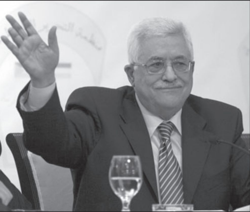
الرئيس الفلسطيني محمود عباس خلال لقائه كلمته امام اللجنة المركزية للمنظمة امس