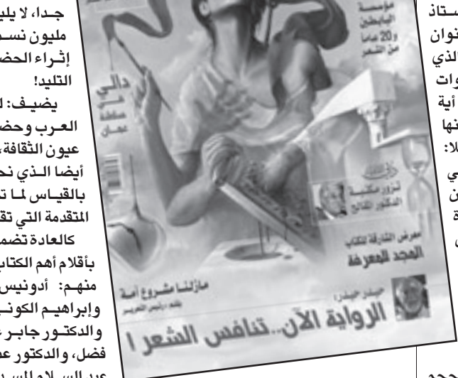
الرواية الآن. تنافس النشرا