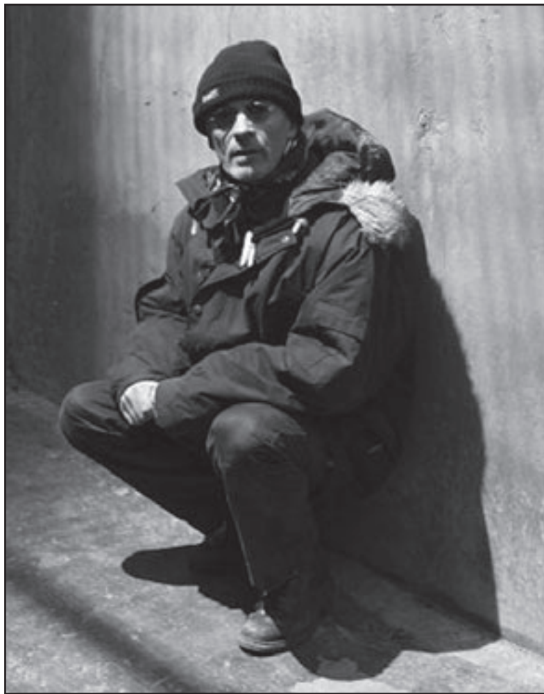
لقطة من فيلم «دني»

دبي - أ ف ب - افتتح فيلم «قرطاجنة» الروائي مساء الاثنين تظاهرة «السينما الفرنسية في دائرة الضوء» التي يقدمها مهرجان دبي السينمائي ضمن دورته السادسة التي اختتمت الأربعاء بإعلان جوائز المهر الخالص بالافلام العربية وجوائز مهر الأحياء الأسبوعية - الأفريقية.