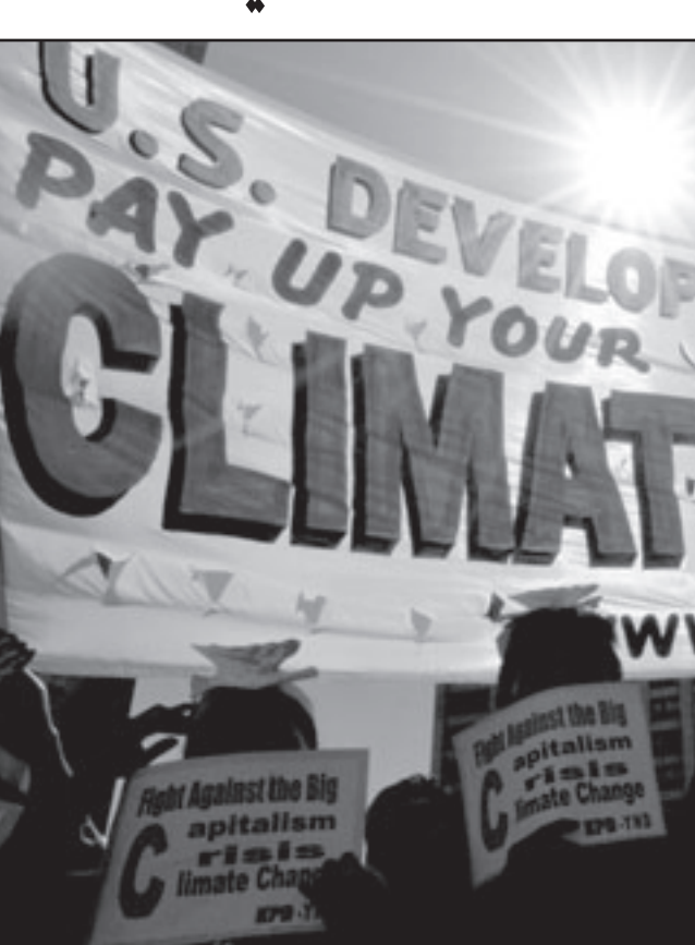
فلبينيون يتظاهرون امام بنك التطوير الآسيوي للمطالبة بمنع تمويل المشاريع التكنولوجية غير النظيفة