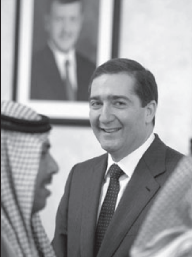
رئيس الوزراء الأردني يستقبل المهنيين

وقبل ذلك شنت صحيفة «كل الأردن» الإلكترونية المقربة من التيار اليساري هجوماً مباشراً على وكالة «رويترز» تحت عنوان الانضمام لعداء الحقوق المنقوصة. ولم يصدر عن «رويترز» رسمياً حتى الآن أي تعليقات رسمية في حين ان الخالدي كان قد نشر تقريراً يعتبره مراسل «رويترز» عادياً وروتينيا تحدث فيه عن ضعف تمثيل الأردنيين من أصل فلسطيني ورموز