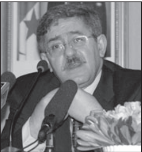
الوزير الأول الجزائري أحمد أويحيى

مباشرة، مشيراً في تصريح صحفي سابق إلى أن «التاريخ سيسهدهم عن سيخرج من هذه الأزمة مرفوع الرأس ومن سيخرج منها مطأطأه». وقال أن «الجزائري ينتمي إلى شعب عظيم (...) وهذا ليس مجرد شعارة، مشيراً إلى أن ثورة المليون ونصف المليون شهيد ليست اكتشافاً طارئاً، وأن «ما قامت به الجزائر من «تضامن مع الأشقاء ليس افتعلاً لا أثناء أزمة... وشده على أن «الشتايم أو الغوغاء لا تنقص من قيمة الجزائر وقيمة شعبها»، موضحاً أن عدم الرد على التحامل المصري ليس نابعا من ضعف أو من حسابات أخرى». وفي المقابل استقبلت تصريحات بعض الوزراء بتحفظ شديد، خاصة وأنها وصفت بأنها «معاملة أكثر من اللازم»، كما أن بعض الصحف الجزائرية انتقدت شكيب خليل وزير الطاقة بعد سفره إلى القاهرة وإعلانه عن تأسيس شركة مختلطة جزائرية-مصرية.