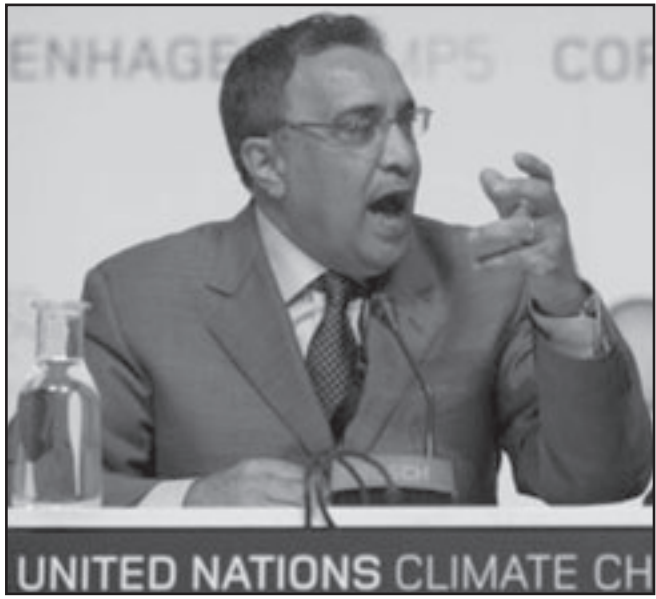
وزير البيئة الجزائري الشريف رحمانى