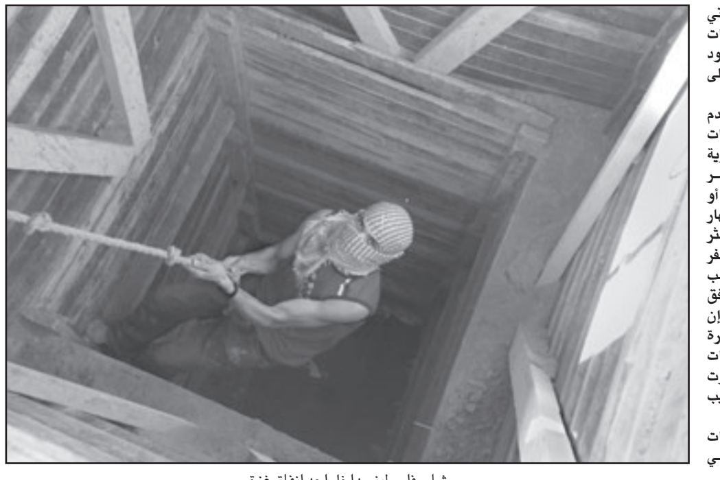
شاب فلسطيني داخل احد انفاق غزة