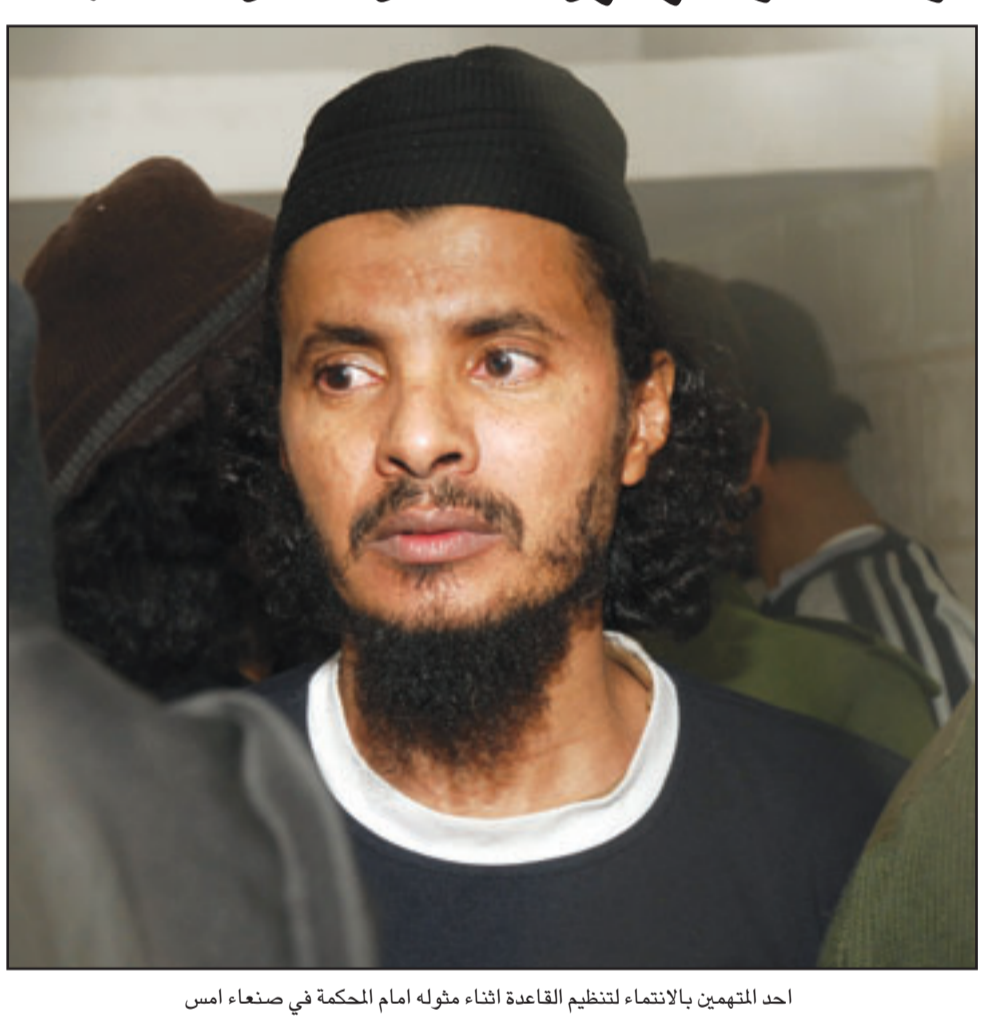
أحد المتهمين بالانتماء لتنظيم القاعدة أثناء مؤهله أمام المحكمة في صنعاء امس

صنعاء - يو بي اي: أعلنت وزارة الدفاع اليمنية مساء امس الثلاثاء عن سيطرة الجيش على جبهات قتال مع المتمردين الحوثيين ومهاجمة مواقع لهم في منطقة الملاحيط بمحافظة صنعاء الشمالية. من جهته قال الحوثيون في بيان ان الجيش السعودي حاول اليوم (امس) بعد 13 غارة جوية الزحف على (مديرية شدا من محور الجابري) لكنه تم رده، وتم إحراق خمس آليات عسكرية، وقال المتمردين ان إحراق الآليات العسكرية جاء بعد ان رفض الجنود السعوديون الذين كانوا بداخلها الاستسلام بعد مفاوضات أكثر من مرة ورفضهم الاستسلام قدم تفجير الآليات بمن فيها. وأكد الناطق الرسمي للحكومة اليمنية حسن اللوزي في مؤتمر الاسبوع عن زعيم المتمردين عبد الملك الحوثي جرح في العمليات واخفى ويات مصيره مجهولاً، وبخاصة ان التابعة الامنية التي تتم لقيادات التمرد تؤكد انه لا صوت له