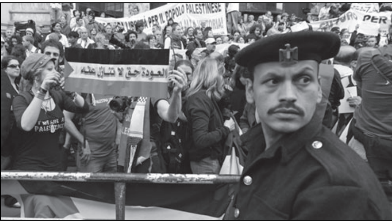
مظاهرون أمام السفارة الفرنسية بالقاهرة أمس

وترددت أنباء عن اعتقال عدد من النشطاء الأجانب، فيما يبدو تشويقاً بين السفارات الغربية والنظام المصري رفض مسؤولو السفارات الأمريكية والفرنسية والبريطانية والكندية والأسترالية توجيه اللوم للنظام المصري كما رفضت السفارة الأمريكية على وجه الخصوص قيام النشطاء بالتحاهر أمامها وطالبت قوات الأمن بالتعاون معهم بالصورة التي تكفل أمن البلاد.