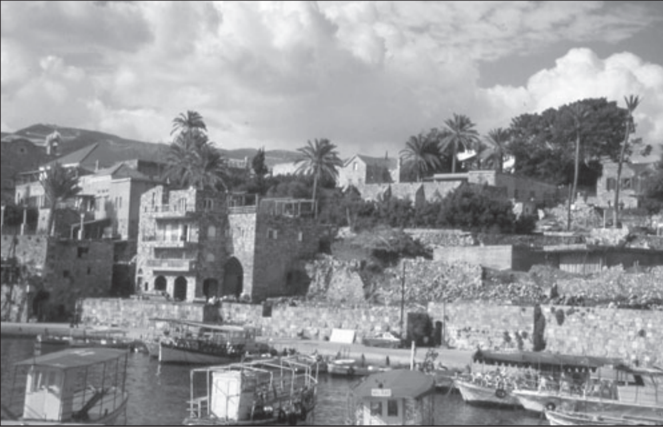
منظر عام لمنطقة جونية ببيروت

ولفت إلى أن المشاكل كبيرة، وأن العجز في موازنة الدولة مرتفع بالنسبة للناجح المحلي، وخدمة الدين العام لا تزال تسجل ارتفاعات سنوية عالية. وقال إن العوامل البنوية ما تزال تعترض انطلاق الاقتصاد الحقيقي، لكن في المقابل سجل مستوى الأسعار اتجاهاً واضحاً نحو الانخفاض يرجح ألا يزيد عن 3 بالمئة هذا العام. وكل ما يامله اللبنانيون أن يستمر الاستقرار السياسي والأمني لكي يستعيدوا بعضاً من الازدهار المالي والاقتصادي.