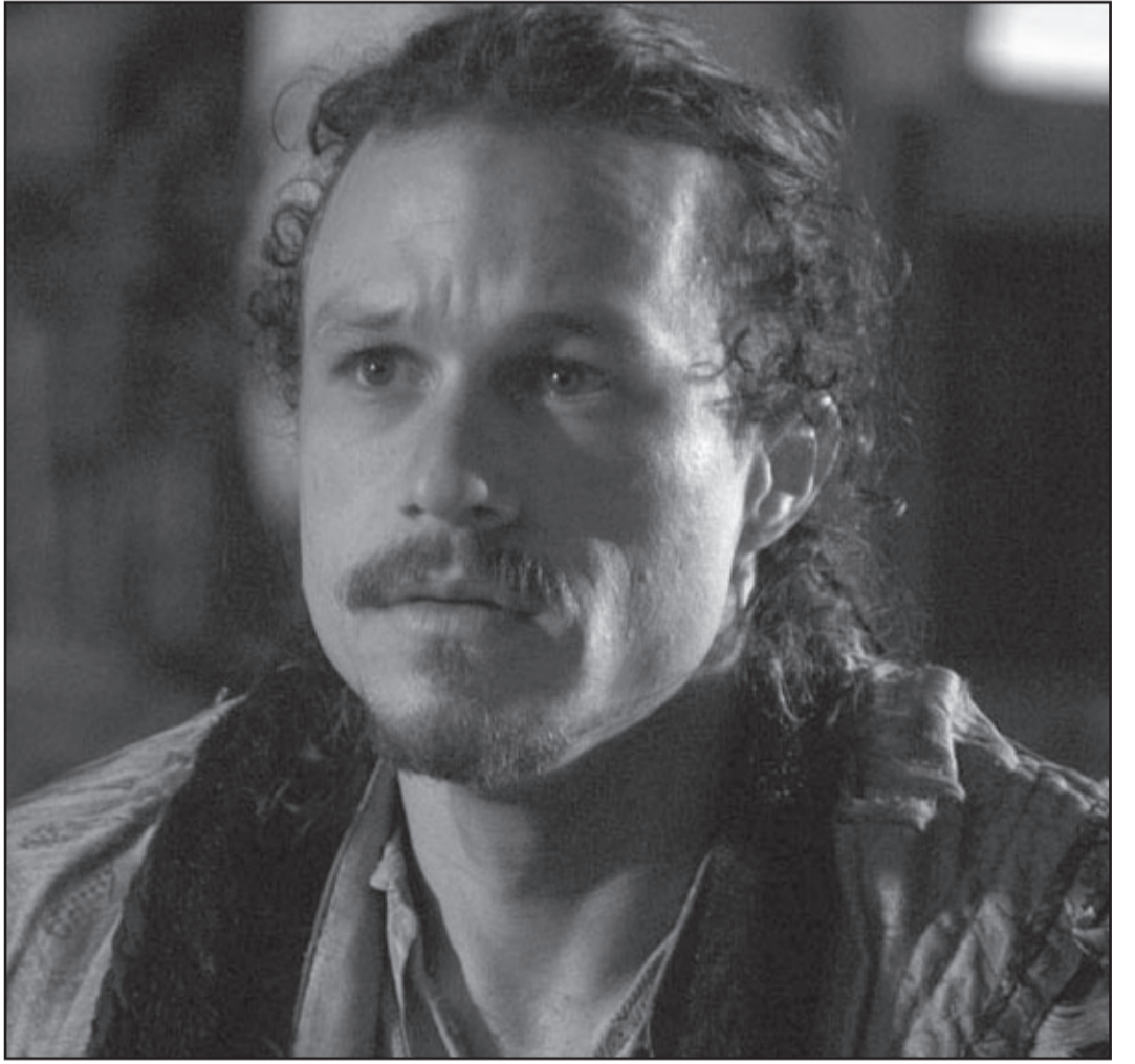
هيث ليدجر في لقطة من فيلم «إماجينا ريوم الدكتور برنسس»