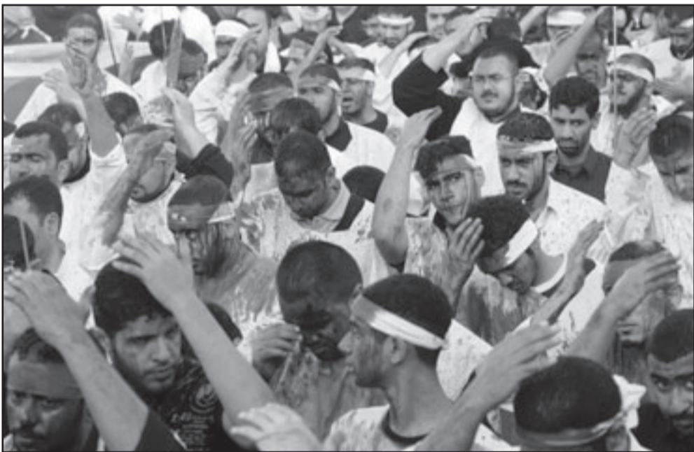
شيعية سعوديون خلال مراسم عاشوراء في بلدة القطيف شرق السعودية

وكان تحقيق عسكري من قبل مدنيين في دولة اطاحت فيها القوات المسلحة بإرهاب حرسات منذ عام 1960 امرا لم يكن متصورا ان يحدث قبل بضعة سنوات. وقالت وسائل إعلام إنها المرة الاولى التي تجرؤ فيها الشرطة على القيام بعمل كهذا.