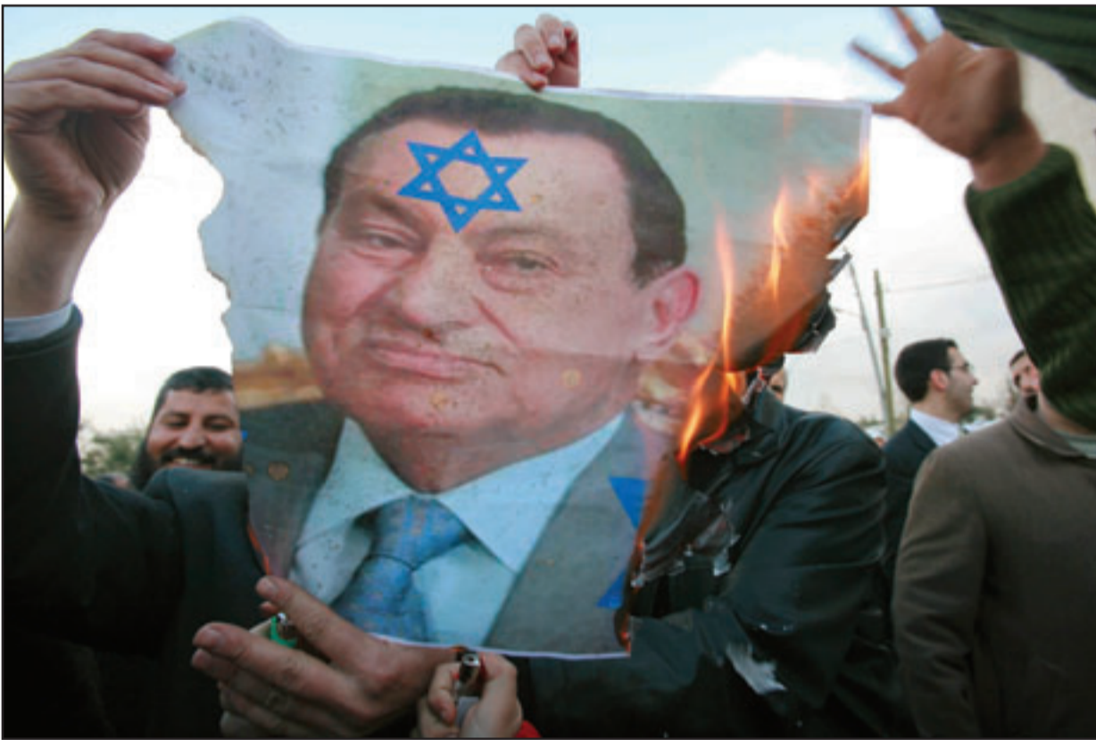
مظاهرات اردنيون يحرقون صور الرئيس المصري حسني مبارك امام السفارة المصرية في عمان اس