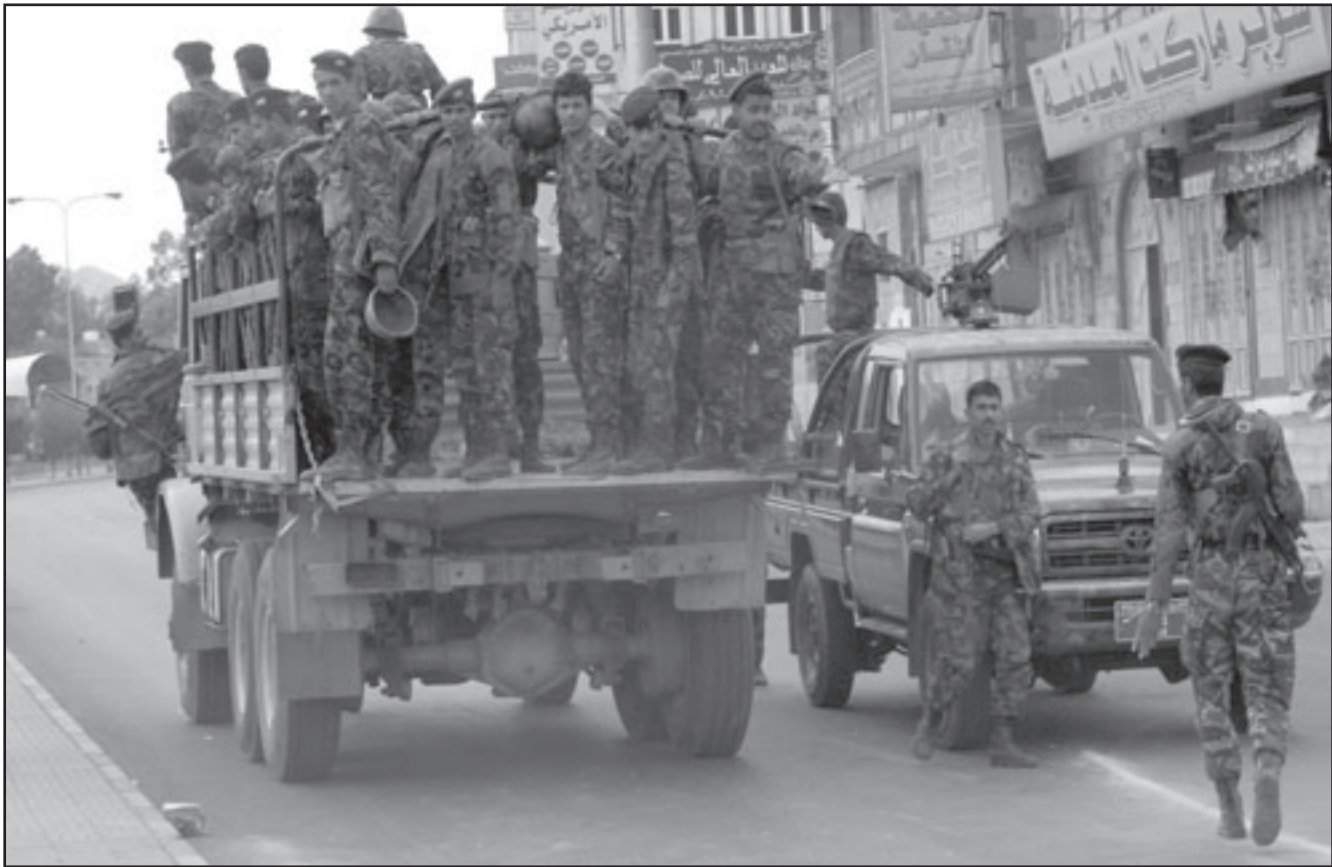
قوات أمن يمنية أثناء دورية بالقرب من السفارة الأمريكية في صنعاء

لمحاربة القاعدة، إلا أنها كلما كثفت هجماتها كلما كشفت نفسها أمام أعدائها مما يجعلها في نفس الطريق الذي تسير عليه باكوستان وأفغانستان. وبالنسبة لشايخ القبائل المتضررين للحكومة ومتعاطفون للانتقام، أما القاعدة فهي بحسب محلل بمعهد شؤون الخليج بواشنطن أكثر راحة من القبض على معظم المقاتلين المتورطين بالهجوم بعد عام 2001، إلا أنها عادت ناحية الكفاءات لفصلها بتنفيذ عمليات كبيرة، ولكنها ستتعلم من دروسها وتخطط للمستقبل، وأخيراً وأبرزت أمريكا تحديداً عن قلق عملا يحدث في اليمن، فإنها استأققت متأخرة.