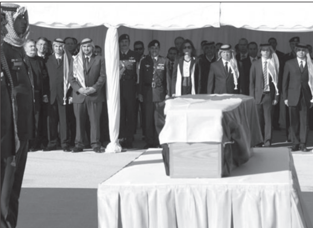
العامل الاردني الملك عبد الله الثاني وزوجته الملكة رانيا واعضاء من الاسرة الحاكمة بالاردن امام جثمان الشريف علي بن زيد احد اقرباء الملك الذي سقط في افغانستان

الدكتور أمين الظواهري، وهو ما وافق عليه همام. وكانت العملية الانتحارية التي استهدفت عملاء المخابرات المركزية في ولاية خوست شرقي أفغانستان المجاورة لمناطق القبائل الباكستانية قتلت سبعة مع عملاء المخابرات المركزية الامريكية بينهم قائد القاعدة وجرح ستة آخرون. ويقول القائد الطالباني الذي قدم نفسه باسم يعقوب لـ«القدس العربي» مشددا على أن جهاز المخابرات الذي يعرف تماما من هو يعقوب، إن همام جاءنا وتعاملنا معه كاخ منتم إلى حركة طالبان وهو أول عربي ينضم إلى حركة طالبان الباكستانية، وبالفعل عقدنا لقاءات كثيرة معه، وكنا نعد المخابرات الأردنية بمعلومات مضملة عن الحركة لندوة ولجهاز تقناوي يمررون تلك المعلومات إلى المخابرات المركزية الامريكية واستمرت اللعبة طوال عام كامل، حتى قرر عملاء المخابرات المركزية الامريكية قبل أيام نقل همام إلى خوست للحديث معه عن تفاصيل بعض المخابرات الأردنية في الأردن لنشاطه خطفه إلى داخل خوست. وتقول المصادر الطالبانية الباكستانية لـ«القدس العربي» إن همام «تم تزنيده بجزءا ناسف ممتلئ بالمخدرات ونظرا للثقة التي بناها مع المخابرات الأردنية التي لديها مقر كامل في خوست وكذلك مع المخابرات