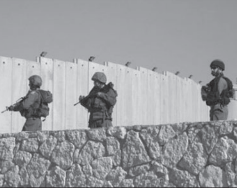
الفصل بين الجموعات البشرية على أساس أمني ليس عنصرياً

به مكتب التحقيقات الفيدرالية الف.إف. بي.أي. وقد اوضحت النتيجة في 11 ايلول (سبتمبر) 2001. هولدر، الذي أمر بمباركة اوباما بتحقيق جنائي ضد رجال السال، أي.ايه الذين زعم انهم سسوا بالمشبهوهين بالارهاب باحد 11 ايلول (سبتمبر)، شجع الاجواء التي منع عبدالمطلب من الدخول الى قائمة مرفوضي الرحلة الجوية والدخول الى الولايات المتحدة.