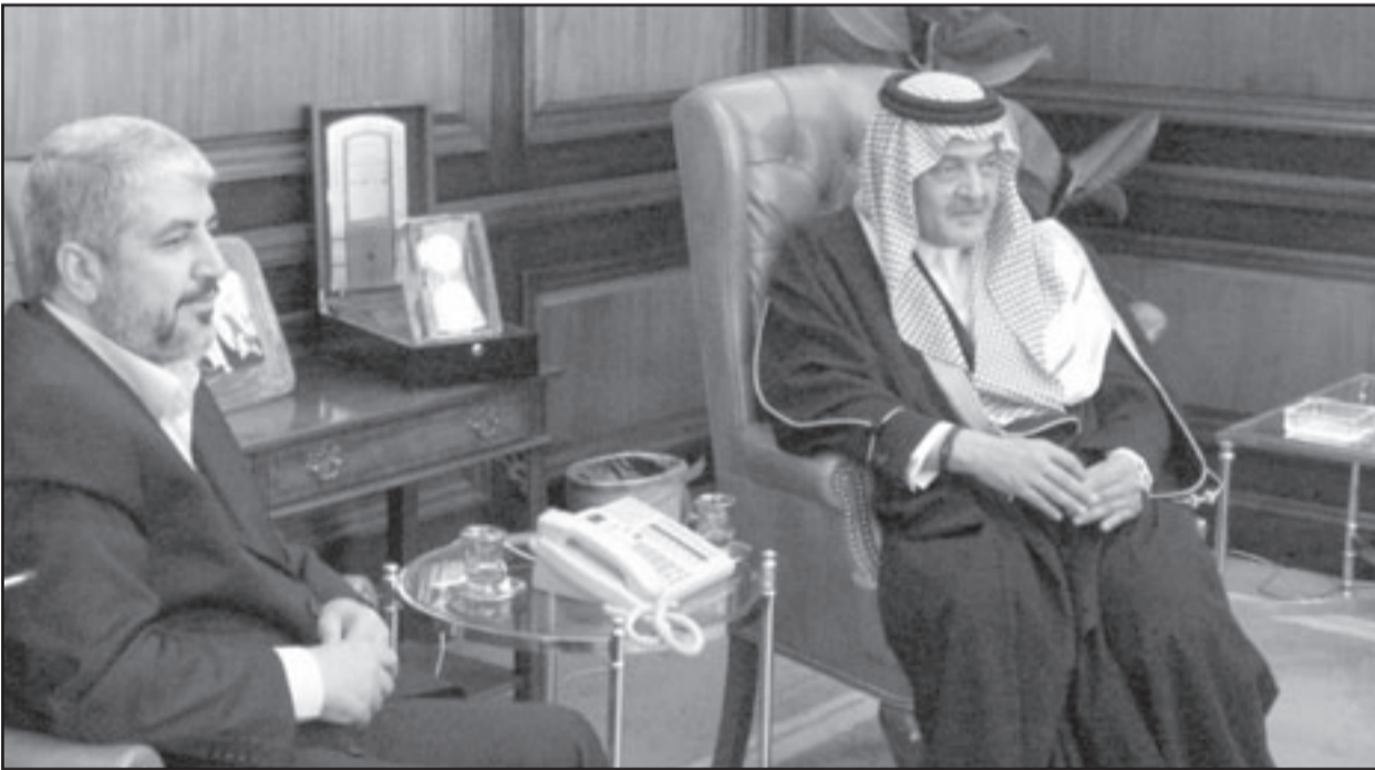
وزير الخارجية السعودي الامير سعود الفيصل لدى اجتماعه مع رئيس المكتب السياسي لحركة حماس خالد مشعل في الرياض