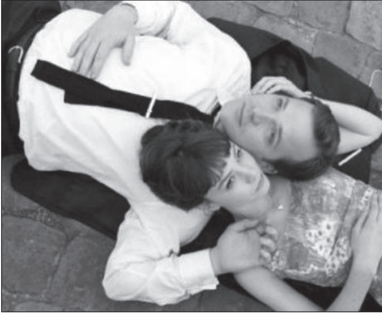
لقطة من فيلم «تعليم»

بحوث لونا قد أتت ثمارها، فهي وطاقها وممثلها قد أنتجوا فيلما بريطانيا أصيلا وممتعا حقا. «إنه لشيء عظيم أن تكون في فيلم لا تخجل منه» بيتر سارسغارد يختم الحديث.