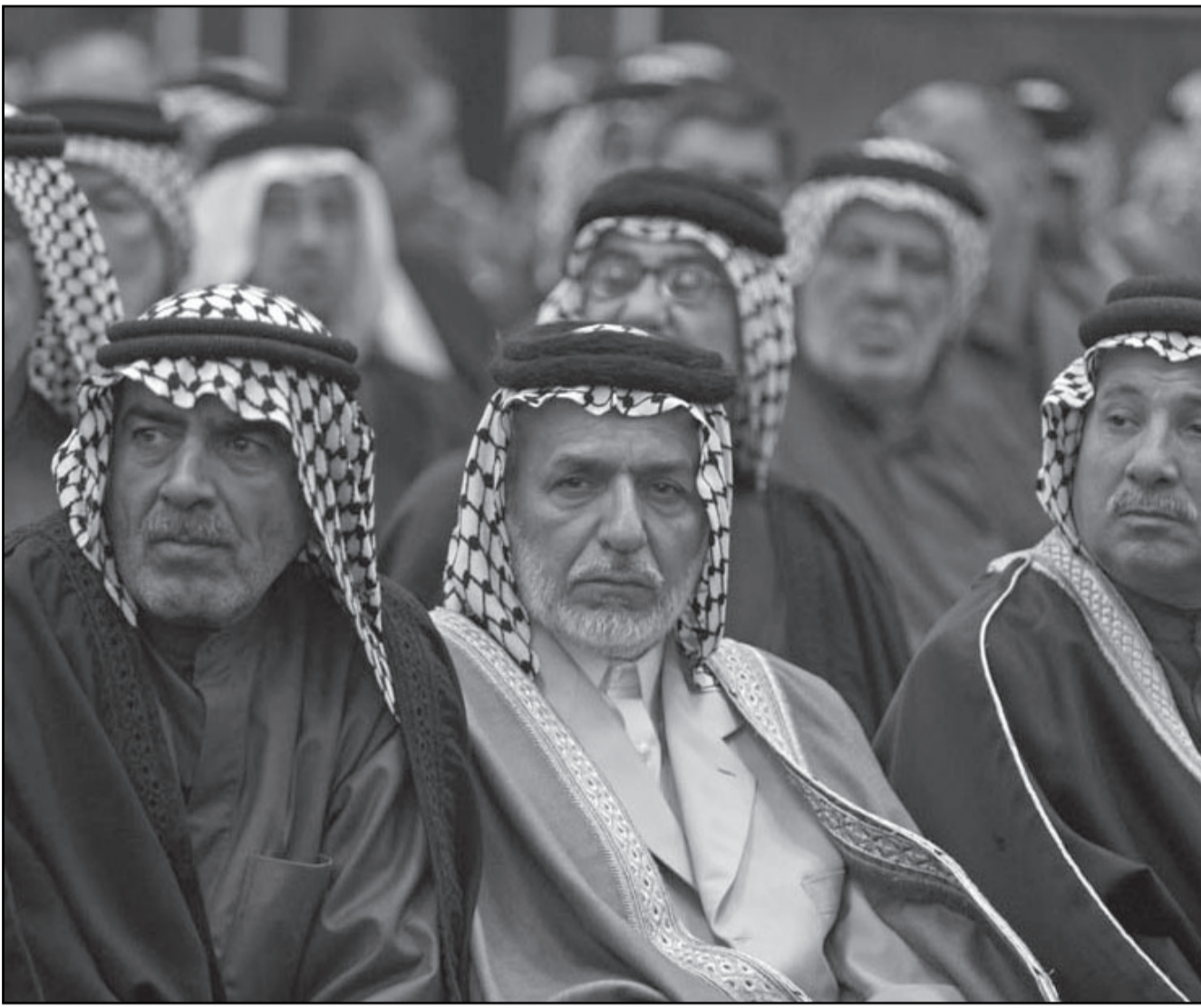
زعماء عشائر لدى استماعهم لكلمة رئيس الوزراء نوري المالكي في بغداد أمس