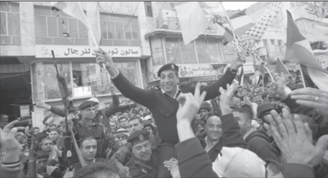
فلسطينيون يحيون ذكرى انطلاق حركة فتح في الخليل