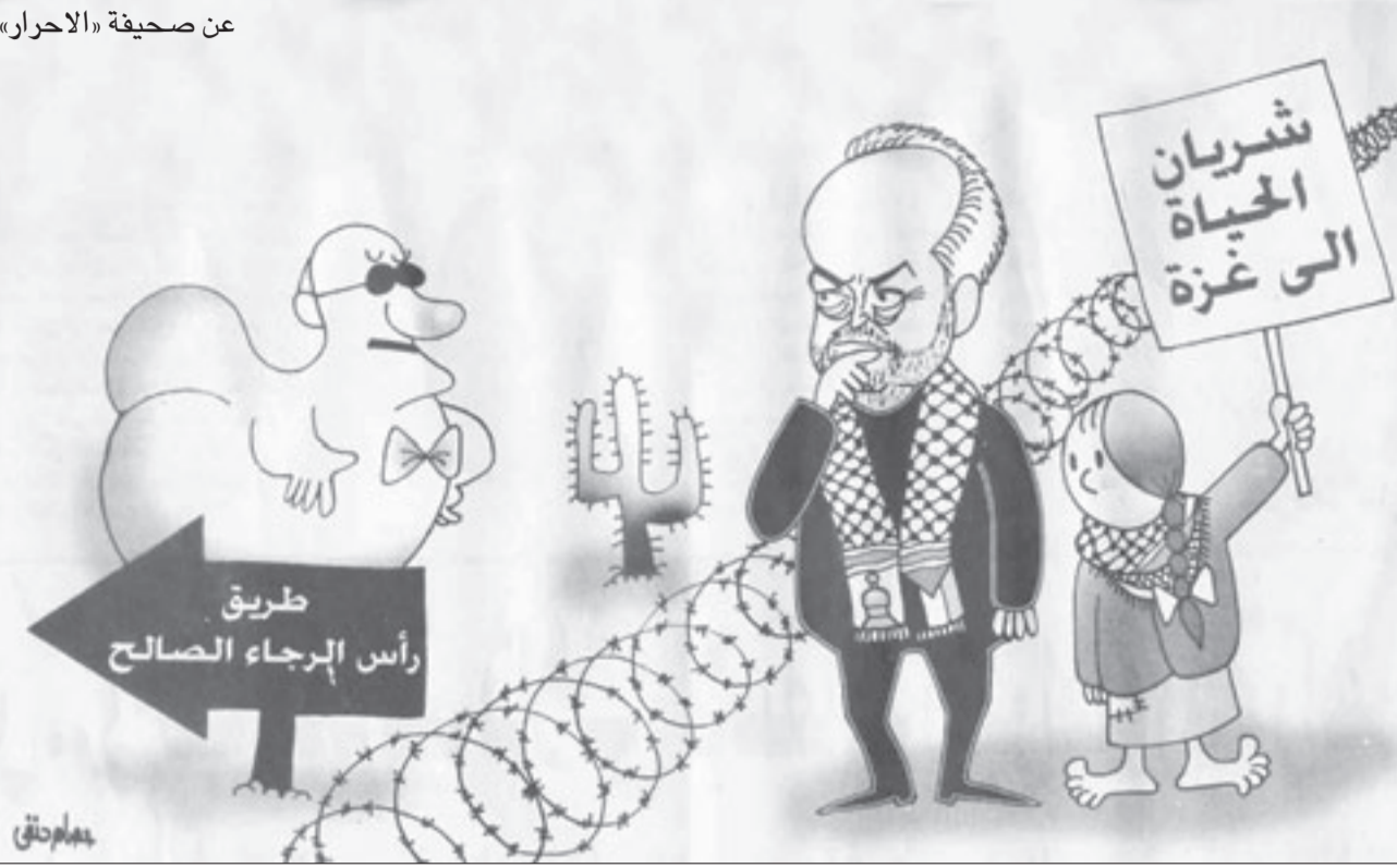
عنا صيفيا «الأحرار» له المرضة مولوده الفكر، فقال لها: -مامد طالع ولد ح اسميه نور الدين، لكنها نصحتها قائلة: -سميه سب الدين يمكن يطلع حاجة كبيرة.