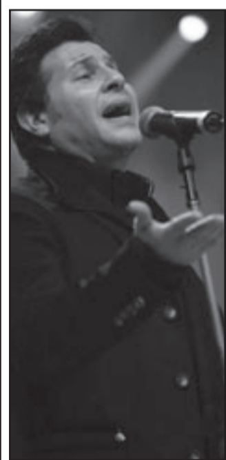
هاني شاكر (القدس العربي)

تواصلت أمسيات ليالي شاعر المليون التي تنظمها هيئة أبوظبي للثقافة والتراث على خشبة مسرح الظفرة في المجمع الثقافي، إذ أحيا الأسبعية الثالثة الفنان القطري سعد الفهد والفنان هاني شاكر بحضور حشد من الصحافيين ومحبي الطرب الأصلي.