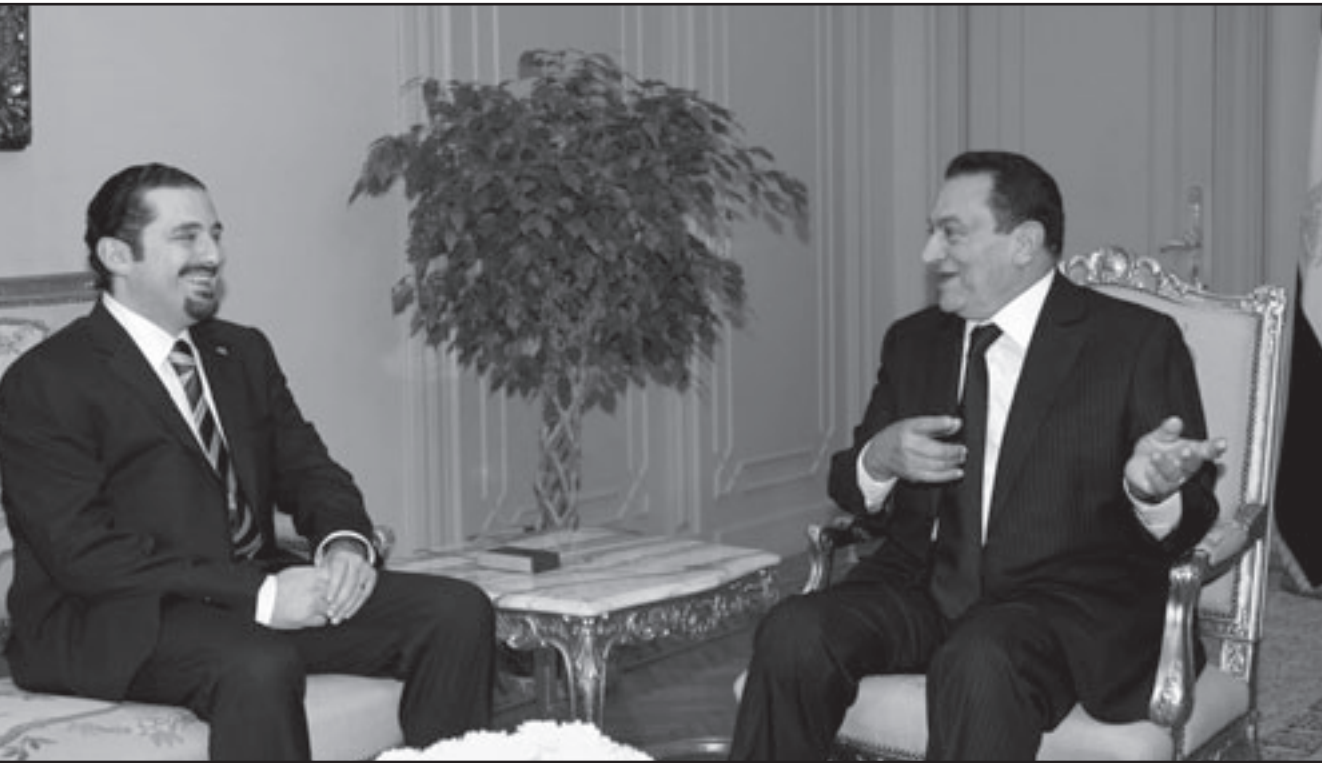
الرئيس المصري حسني مبارك لدى اجتماعه مع رئيس الوزراء اللبناني سعد الحريري في القاهرة

محدثاتها تركزت على «تعزيز التعاون الاقتصادي وتفعيل اللجنة العليا المشتركة المصرية اللبنانية»، مشيراً الى انها ستعقد في ايار (مايو) او حزيران (يونيو) المقبلين.