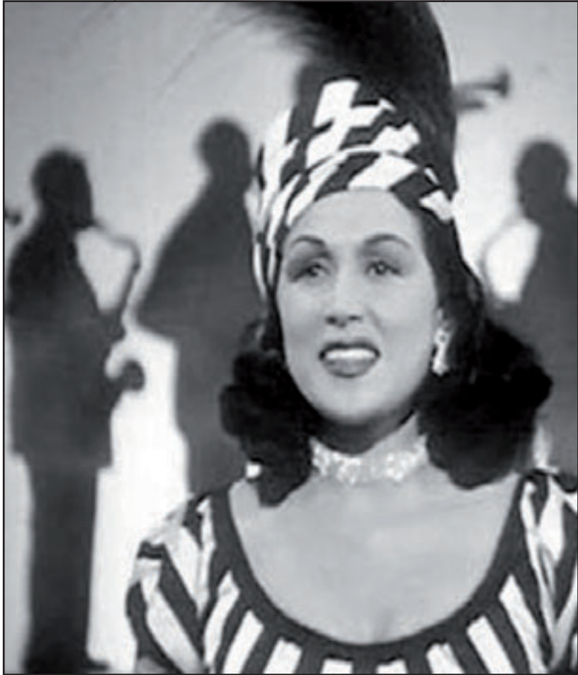
ليلي مراد في فيلم «يحييا الحب»

هذا قليل من كثير قدمته السينما المصرية والذي كان متعة لكل جماهير مصر وكان الفيلم يعرض، لأول مرة، في دور السينما الضخمة أو الفخمة ثم ينتقل بعد ذلك الى دور السينما الشعبية وكانت الأفلام تجد إقبالا عظيما من جماهير مصر، ثم بدأ الإرسال التلفزيوني بفضل الكتيروى قضاء السهرة في المنزل مع المسلسل أو الفيلم الذي كان التلفزيونيون يعرضه ثم جاء بعد ذلك الفيديو، وكان لابد أن تغلق دور السينما أبوابها الواحدة تلو الأخرى، وفي موضوع قائم نستعرض مع القارئ الكثير من دور السينما التي اغلقت أبوابها.