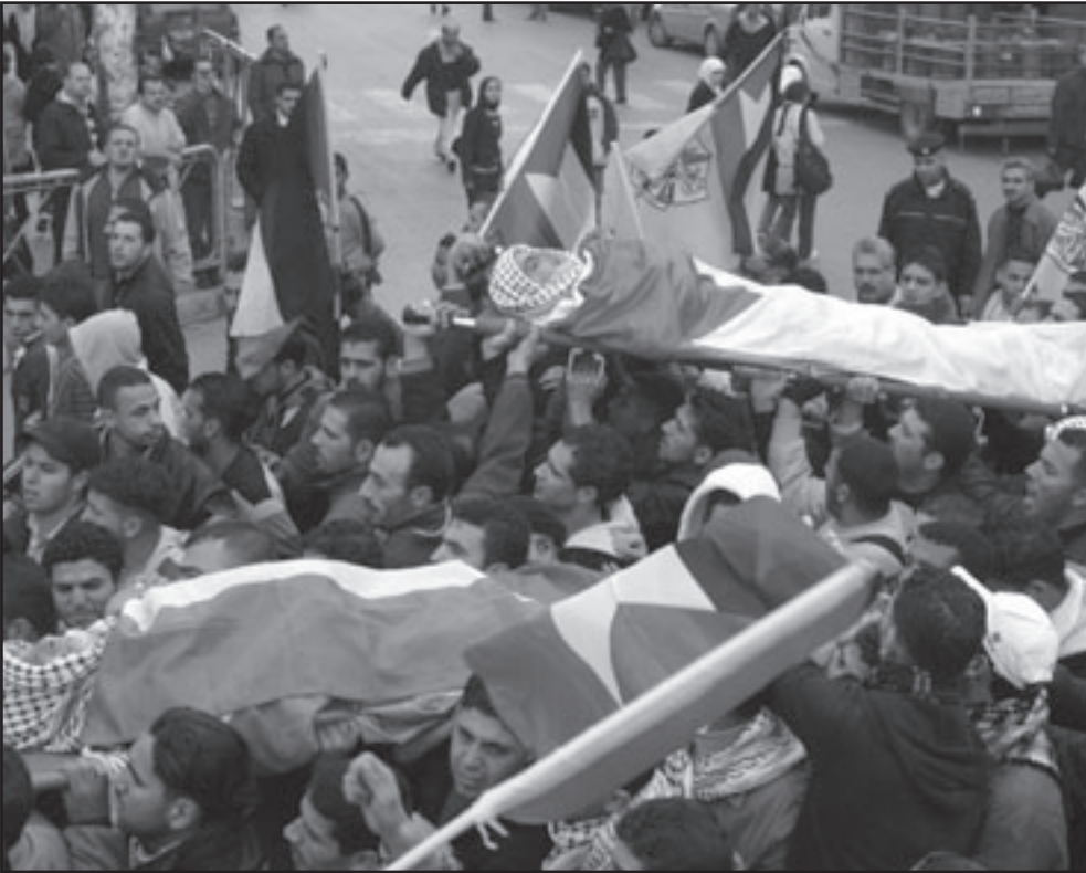
الف خطاب ضد الالاسامية لن ينسي الناس ما فوجده بغزة

نصيب محافل اليمين المتطرف مثلما في اوربا، بل من نصيب المؤسسة السلطوية بأسرها. لدينا رئيس يتحدث عن الشر ارياء، ويقدم جدارا كي يمنع لاجسي الحرب من أن يدقوا بوابات اسرائيل. رئيس وزراء يتحدث عن الشر ويشارك في جريمة الضمار على غزة، الذي يرفض منذ أكثر من ثلاث سنوات، يخلف مليوناً ونصف مليون من السكان في ظروف بائسة، رئيس