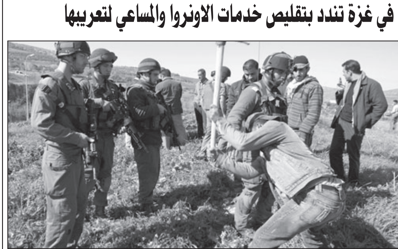
فلسطيني يعمل في ارضه في قرية بويرين قرب نابلس

وذكر ان «معظم الزعماء العرب» تفهم موقف حماس خاصة في موضوع المصالحة، وانهم ابرعوا عن دعمهم للجهود السياسية لحماس ان الحركة «تلقت دعوة رسمية من روسيا لزيارتها في شباط (فبراير) القادم»، مشيرا الى ذات الاطار الى ان وفدا من الحركة سيوزر الاردن