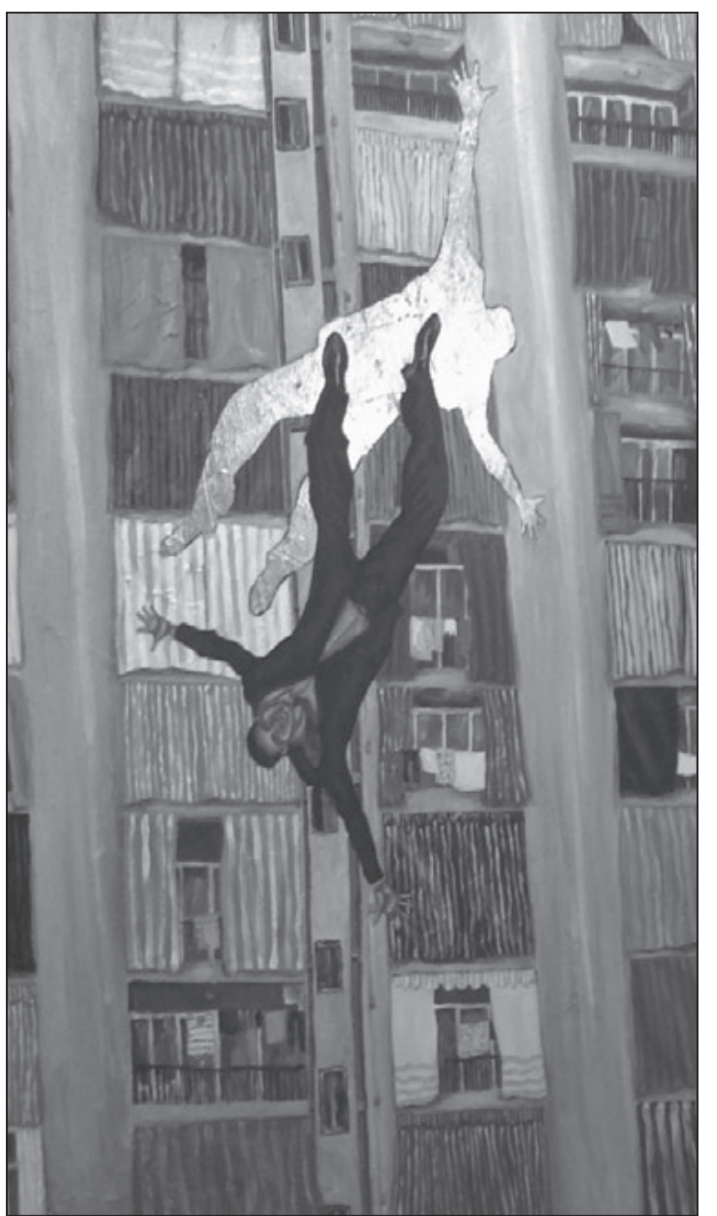
من أعمال ريم الجندي «القدس العربي»