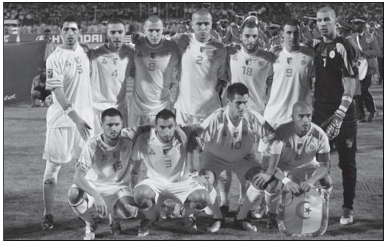
تشكيلة المنتخب الجزائري