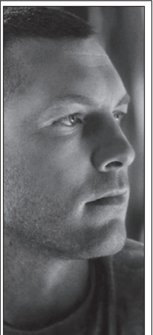
سام وورثيغتون في لقطة من «أفاتار»