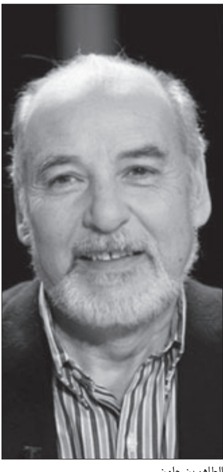
الطاهر بن جلون

وتشارك ثلاث دول أجنبية هي النمرك وبولندا وقازاخستان في المعرض لأول مرة.