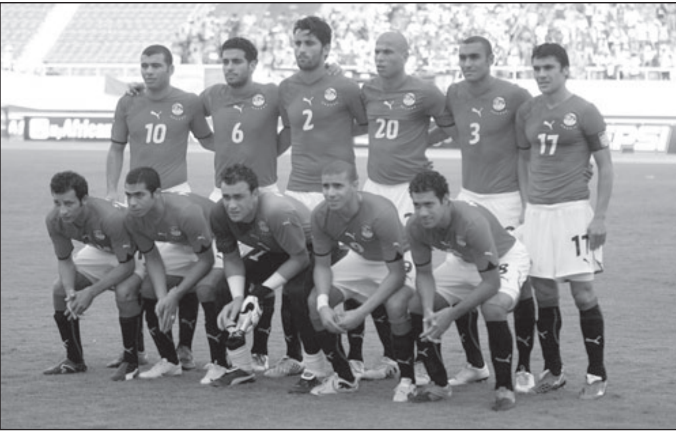
تشكيلة المنتخب المصري