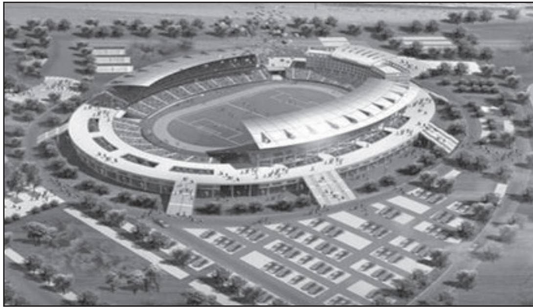
ستاد اومبكا الوطني الذي اقيمت عليه المباراة

ويوقع وصول نحو 200 مشجع مصري بحسب تقديرات الصحف المصرية و900 مشجع جزائري بحسب شركة الطيران الوطنية لحضور وهو امر خلف ارتياحا كبيرا لدى السلطات الامنية في بنيغلا وان كانت الاخيرة اكدت استعدادها التام لفرض الامن وفنّادي حدوث اي اعمال قبل وقتها وعقب المباراة. والمباراة هي الثالثة بين المنتخبين في ظرف شهرين والرابعة في الموسم الحالي بعد لقاءهما الثلاثة في التصفيات المؤهلة الى نهائيات كأس الامم الافريقية وكأس العالم والتي شهدت احداث شغب بين جماهير البلدين كانت تؤدي الى القطيعة الدبلوماسية بينهما خصوصا بعد المواجهتين الاخيرتين في القاهرة والسودان والتي حسمت فيها الجزائر بطاقة التأهل الى مونديال جنوب افريقيا 2010. وعلى غرار مواجهة ام درمان والتي حضرها 35 الف مشجع من المنتخبين، سارعت جماهير البلدين الى التعبير عن رغبتهم في ضرورة السفر الى انغولا والوقوف الى جانب منتخب بلادها على أمل بلوغه المباراة النهائية للعرس القاري.