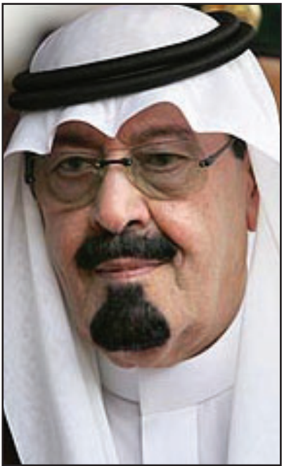
العاقل السعودي الملك عبد الله