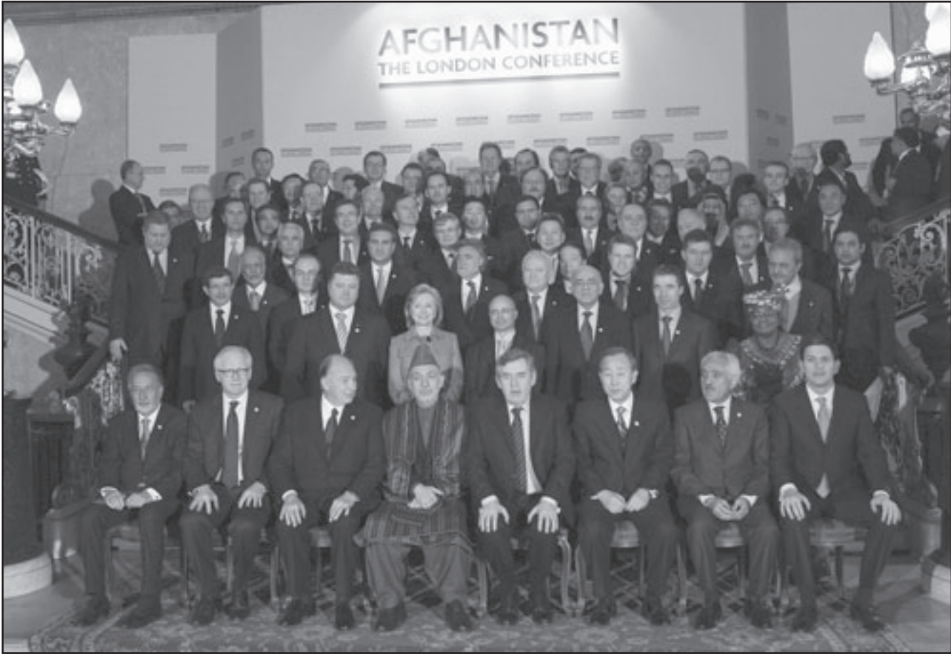
صورة تذكارية للمشاركين في مؤتمر لندن حول أفغانستان