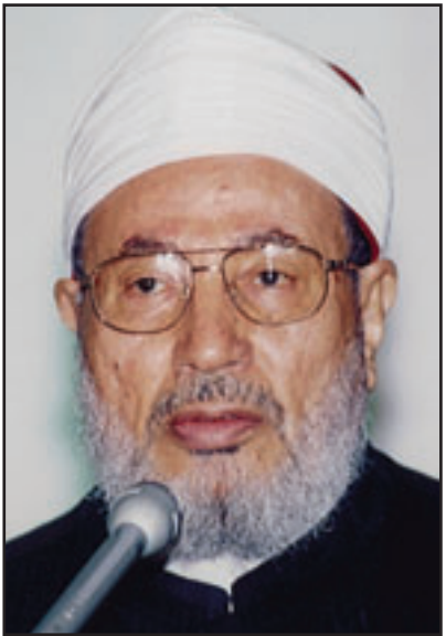
الشيخ يوسف القرضاوي