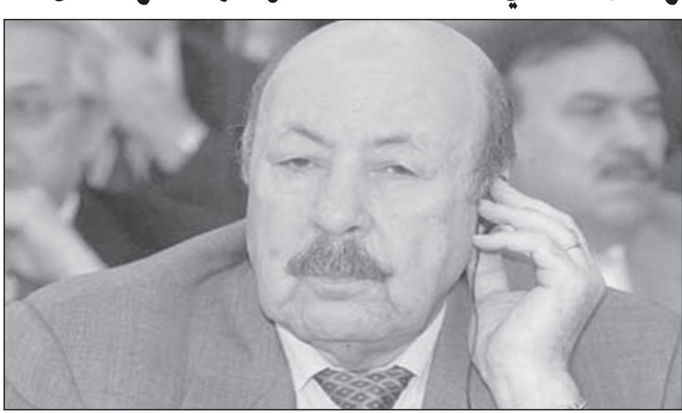
اللواء العربي بلخير الذي توفي أمس بالجزائر العاصمة

أن تولى منصب الأمين العام لرئاسة الجمهورية في عهد الرئيس الشاذلي بن جديد، وكان أيضا مدير ديوان الرئيس بن جديد. وكان بلخير هو من أعلن نتائج الانتخابات البرلمانية للمغاة عام 1991 التي حصلت فيها جبهة الإنقاذ الإسلامي (المحظورة) بوصفه وزيرا للداخلية آنذاك. وعاد بلخير إلى واجهة الأحداث في نهاية تسعينات القرن الماضي، لما