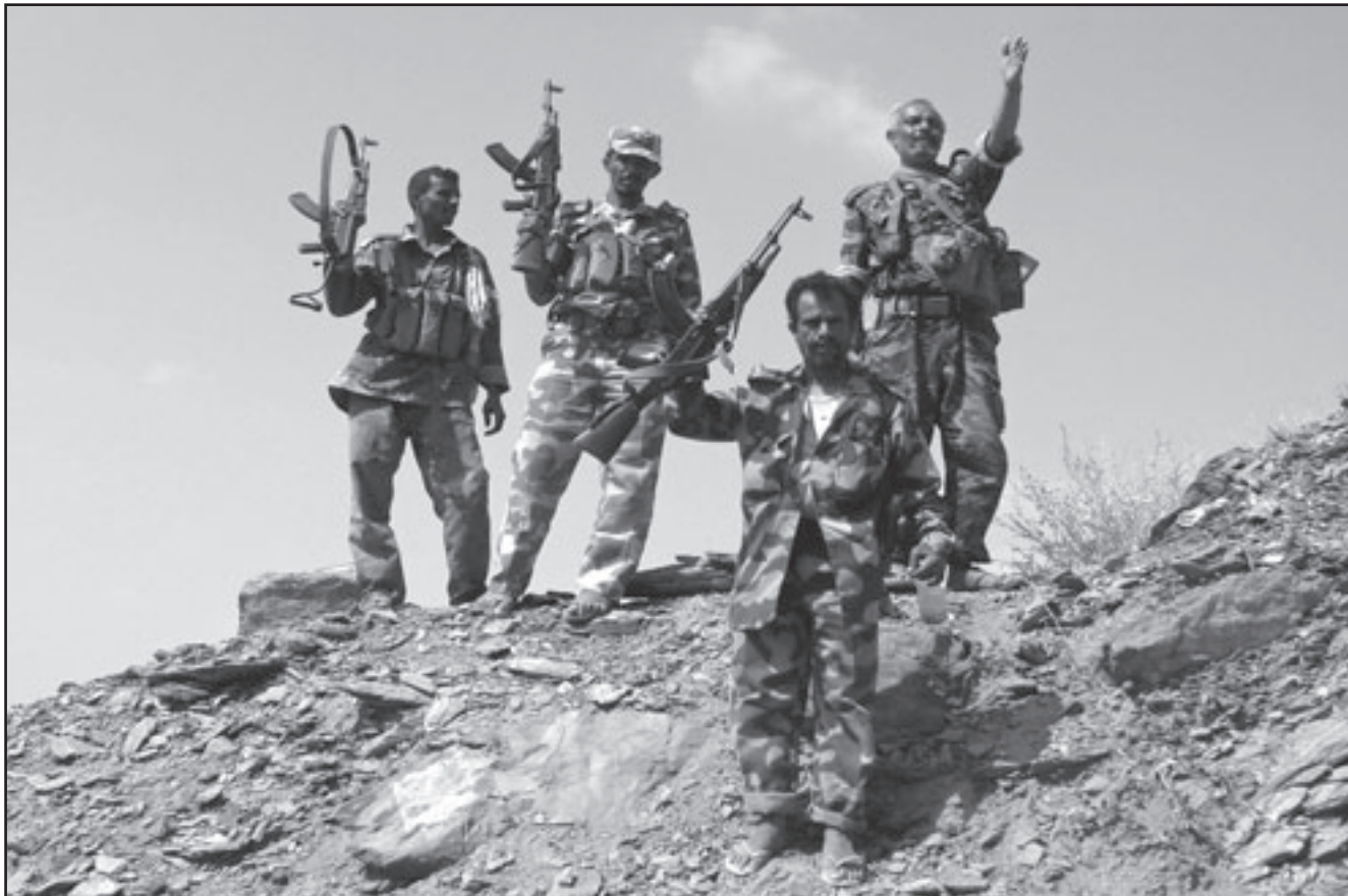
جنود يمنيون يلوحون بأسلحتهم على جبهة القتال في صعدة