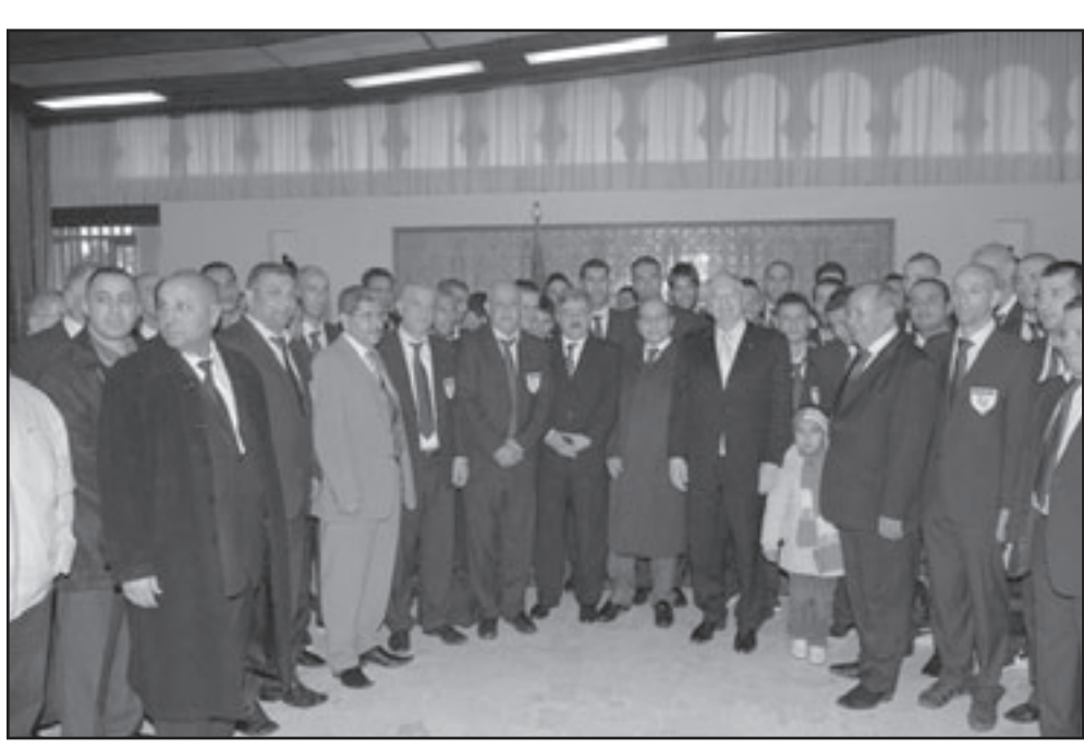
اعضاء الوفد الجزائري بقاعة استقبال مطار الجزائر الدولي

معتب، والغريب حسب حليش أن الحكم لم يشهر البطاقة الصفراء إلا بعد أكثر من دقيقة ونصف على وقوع اللقطة. وغادر الحضر المطار على وقع تصفيقات وترجم أي جولة للاعبين في أنوبيس مكشوف متلما كان الحال عليه بعد تاهل المنتخب إلى المونديال في المباراة الفاصلة التي لعبها الحضر ضد الفراعنة في أم درمان، وقد