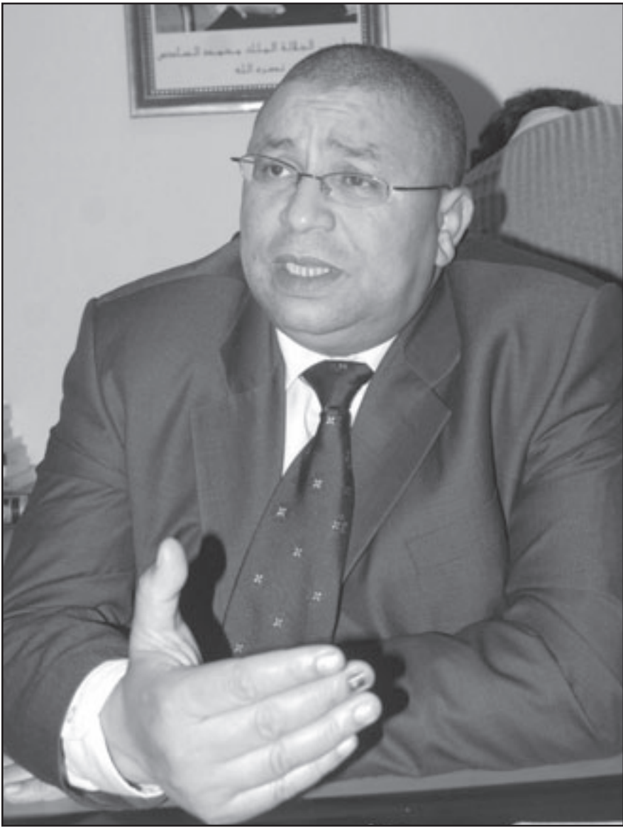
محمد مهاد (القدس العربي)

جهة يمكن أن تقول إنها تتوفر على جواب حاسم وقاطع ومقنع لهذا الموضوع. إحداث لغة معيارية هي مهمة موكولة إلى المعهد الملكي للثقافة الأمازيغية، وهناك لجان تشغلت على ذلك حالياً. وقد وضع المعهد مجموعة من المعاجم لتوحيد تلك اللهجات، مع أن في كل لهجة متغيرات عديدة. أضيف إلى ذلك، أن الصحافيين العاملين بالشركة الوطنية للإذاعة والتلفزيون قاموا منذ سنتين بجهود كبيرة في نشرات الأخبارية الإخبارية الموثوقة باللغة الأمازيغية، من خلال تحب وابتكارات ومفردات باللغة الأمازيغية. ولعل المعهد استفاد من هذه العملية. وبدورها، استلهمنا هذا التراكم الإيجابي والهام، فالفريق الصحافي الذي يعمل حالياً في قناة «تمازيغت»، استفاد من تدريبات بالشركة الوطنية للإذاعة والتلفزيون.