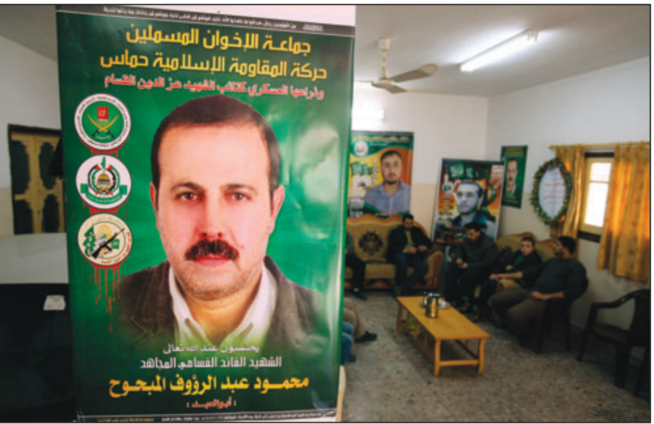
عائلة الشهيد محمود المبحوح تتلقى التعازي بوفاته

ملاحقة الجناة، والتقى خلفان أمس الأحد، حسين عبد الخالق القنصل العام لفلسطين بدبي، وتم خلال اللقاء «الوقوف على سير التحقيقات في مقتل المبحوح» من جهتها قالت صحيفة «صاندي تايمز» إنه تم اغتيال المبحوح في دبي من خلال فريق قام بإعطائه ابرة تحتوي على سم يؤدي الى نوبة قلبية وان الفريق قد يصور كل الوثائق الموجودة في حقيبته وتركوها على حالها، فيما قاموا بوضع إشارة «لا تزج» على الباب بعد انتهائهم من المهمة. وكان طاقم فندق البستان في دبي قد اكتشفوا جثة المبحوح بعد فترة الغداء في العشرين من كانون الثاني (يناير) الماضي، ولم يتم الاستشاهة بكونه حدث الوفاة اغتيالاً حيث شخص الطبيب الذي استدعي للمكان الوفاة بانها ناجمة عن نوبة قلبية، ولم يتم تحديد سبب الوفاة الا بعد تسعة ايام حيث ارسلت عينات دم للمعالم الفرنسية بباريس ووجد ان الدم يحتوي على مادة سامة. وقامت حركة حماس بعدها باعلان عن وقاته والقت المسؤولي على الاستخبارات الاسرائيلية «الموساد»، وقال مراسل الصحيفة البريطانية عوزي منحايمي الذي يستند في معلوماته على مصادر أمنية اسرائيلية ان المبحوح كان في زيارة لدبي مستخدماً جواز سفر مزيف وعند وصوله تبعه شخصان وصفا