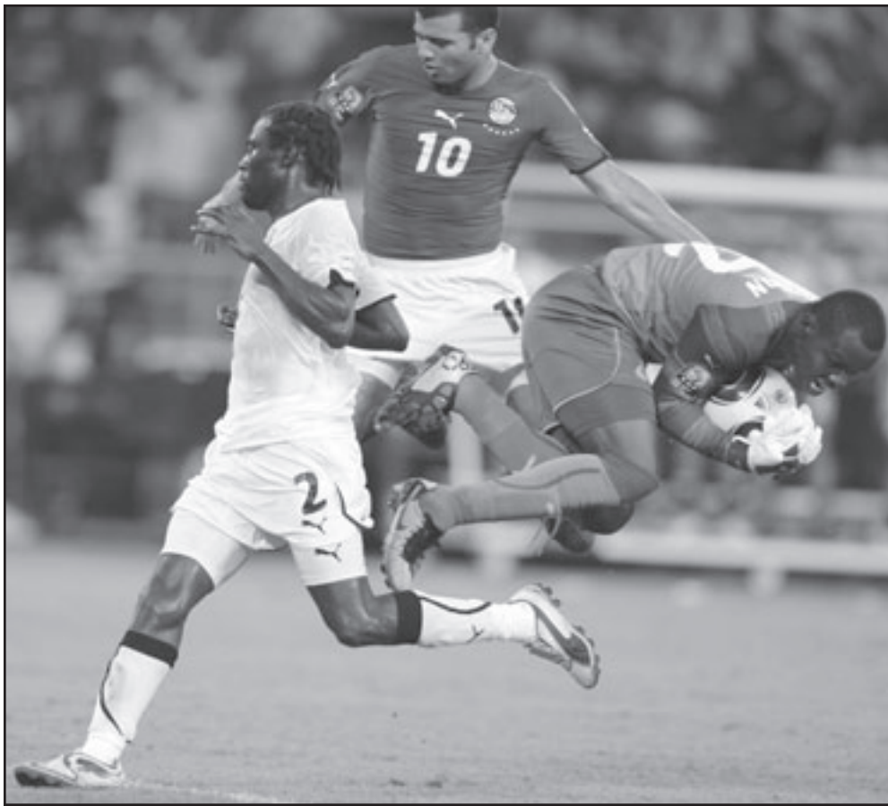
لقطة من مباراة الامس بين مصر وغانا

افريقي مشجع. وقاد الديل محمد ناجي (جدو) منتخب مصر للفوز بكأس الأمم الإفريقية للمرة الثالثة على التوالي والسابعة في تاريخه بعد أن سجل هدفا قبل خمس دقائق من نهاية المباراة النهائية ضد غانا منح به الفريق الفوز 1-0 صفر. وسدد جدو الكرة بباطن القدم في شباك الحارس ريتشارد كينجستون بعد تبادل رائع مع محمد زيدان مسجلا خامسة أهدافه في البطولة ليتوج هدافا لكأس الأمم الإفريقية. وجاءت المباراة حماسية ومشتعلة من جانب الفريقين، لكنها لم تشهد عددا كبيرا من الفرص التهديدية،