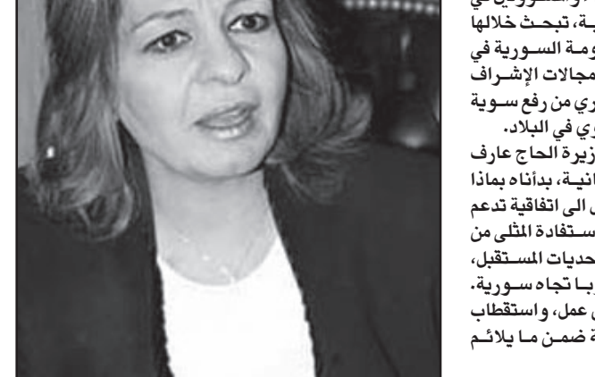
الدكتورة ديبالا الحاج عارف

تقوم وزيرة الشؤون الاجتماعية والعمل السورية الدكتورة ديبالا الحاج عارف هذه الأيام بزيارة للندن، حيث تعقد عدة لقاءات مع العديد من الوزراء والمسؤولين في الحكومة والمؤسسات والهيئات البريطانية، تبحث خلالها في آليات التعاون في مجال عمل عمل الحكومة السورية في منح الاعتمادية لمنظمات المجتمع الأهلي ومجالات الإشراف والمتابعة لها لتمكين المجتمع الأهلي السوري من رفع سوية عمله للوصول الى معايير مثلى للعمل التنموي في البلاد.