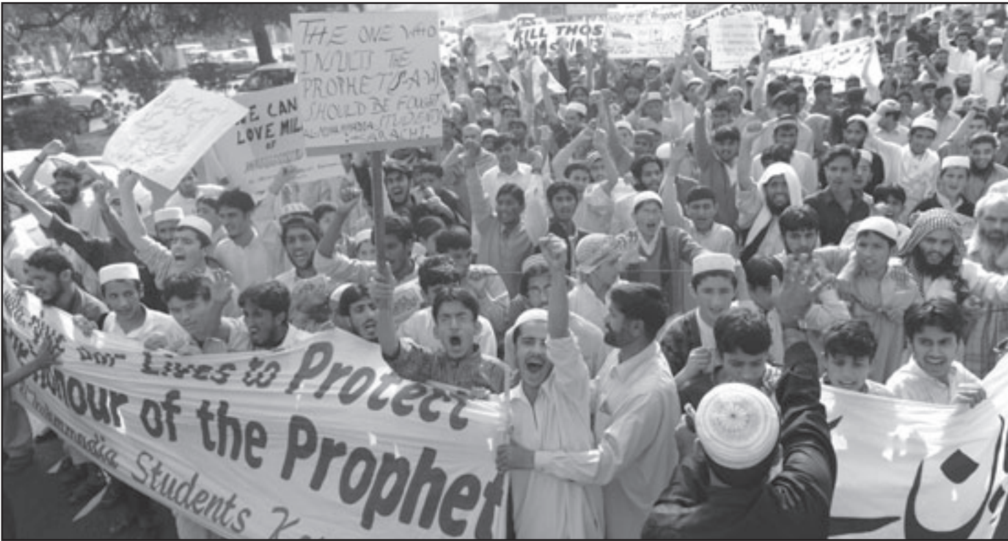
طلاب باكستانيون ينظاهرون ضد امريكا في كراتشي