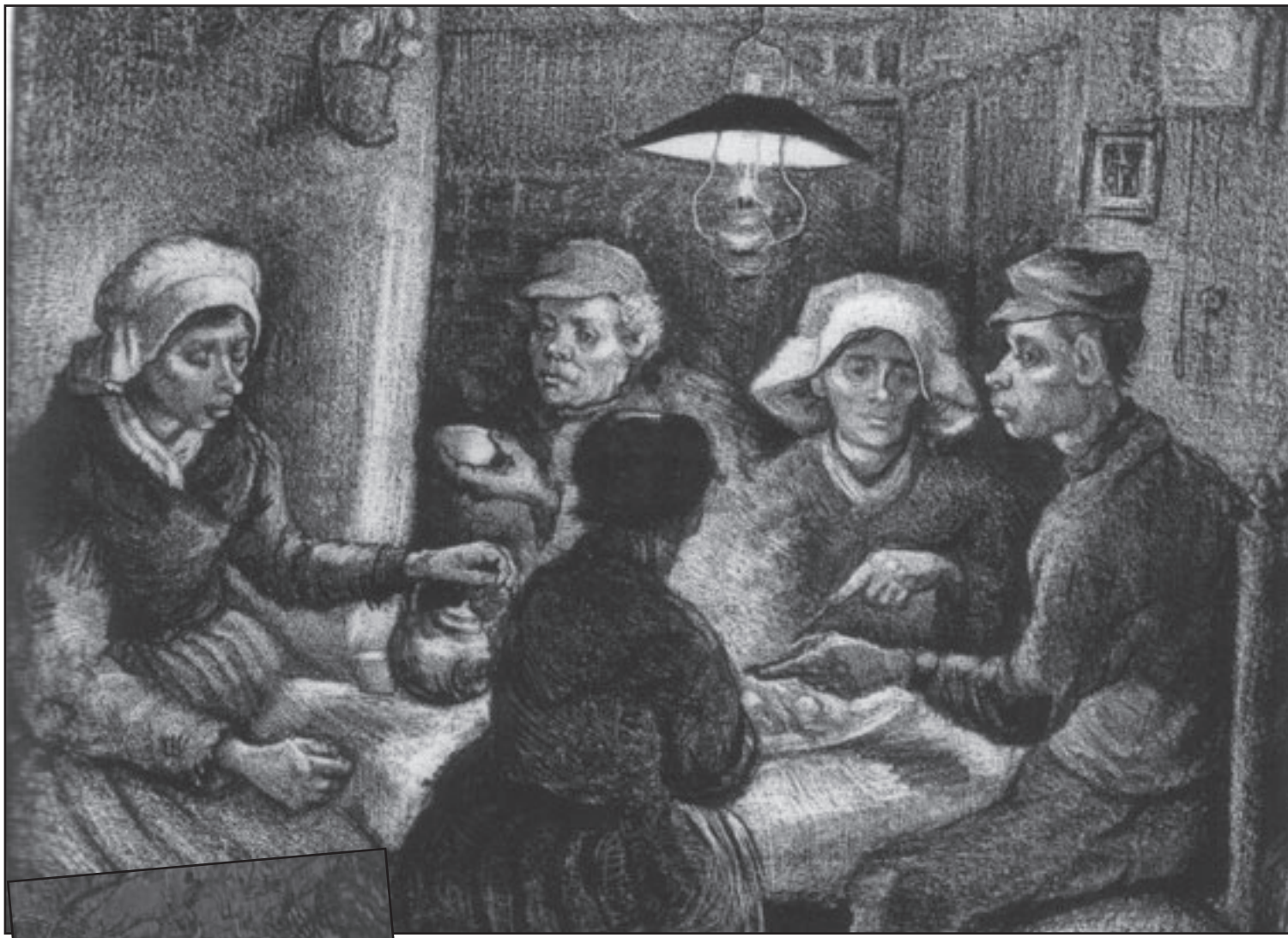
لوحة «الكي البطاطا»

ولا تخلو الرسائل من محاولات لتشال النقاش حول قضايا