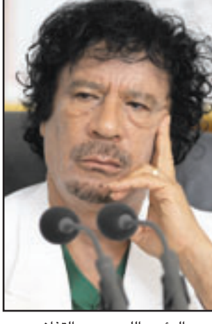
الرئيس اللبناني معمر القذافي

بيروت - «القدس العربي» من سعد الياست: رغم مرور 32 عاماً على اختفاء الخلف بين القيادات الشيعية في لبنان والنظام اللبناني، وقبل فترة على موعد انعقاد القمة العربية في ليبيا استبق نائب رئيس المجلس الإسلامي الشيعي الأعلى الشيخ عبد الأمير قبلان الخطوة وأعلن في موقف له رفض مشاركة لبنان في هذه القمة ما يعني مقاطعة حتمية لوزير الخارجية اللبناني علي الشامي المحسوب على حركة «أمل» بزعامة الرئيس نبيه بري وإحراجاً في مكان ما لرئيس الجمهورية العماد ميشال سليمان الذي سيدرس موضوع مشاركته، علماً أنه سبق له أن تجاوز بعض المواقف الداخلية في لبنان المعارضة على انعقاد قمة لبعض الرؤساء العرب في قطر أثناء العدوان على غزة، وسافر الى النوبة للمشاركة في القمة التي ضمت الرئيس السوري بشار الأسد، وأعلن من هناك تمسكه بمبادرة السلام العربية التي أعلنت من بيروت، وقالت