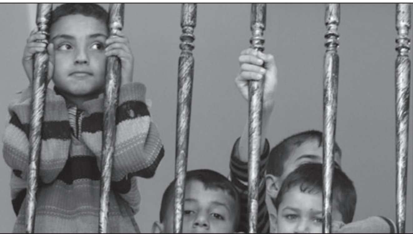
اطفال في غزة يراقبون الصلاة في احد جوامع القطاع