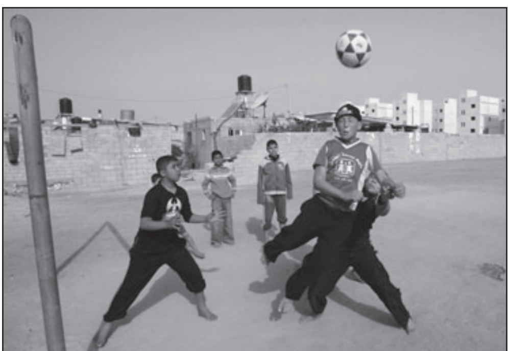
صبي فلسطينيون يلعبون بملعب ترابي