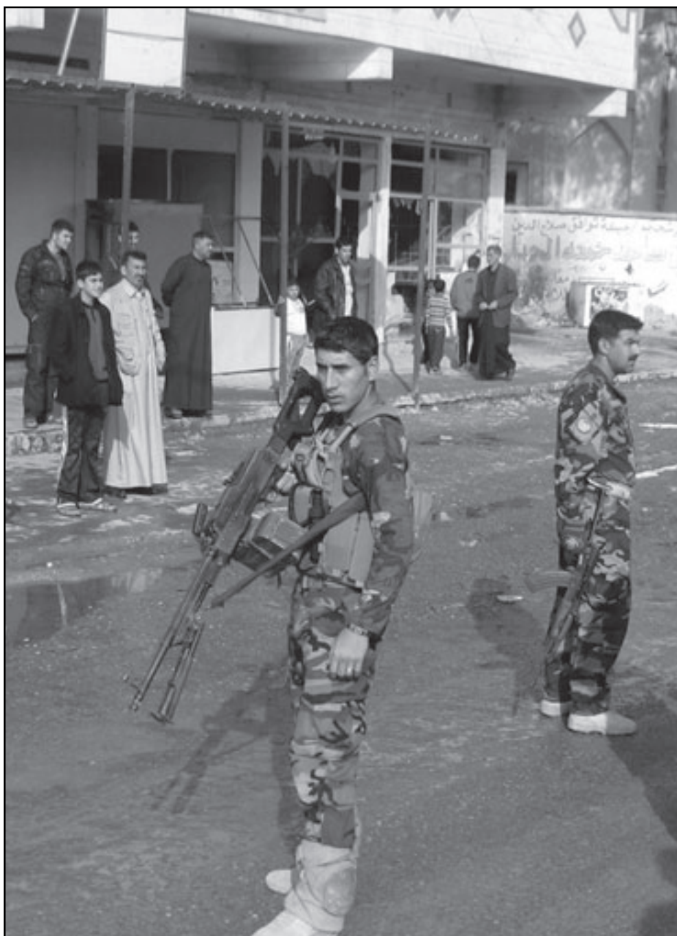
جندي عراقي في موقع انفجار سامراء امس

محمود عثمان من التحالف الكردستاني رأى ان قرار إسقاط النظام السابق كان صائبا، غير انه أشار إلى ان هذا