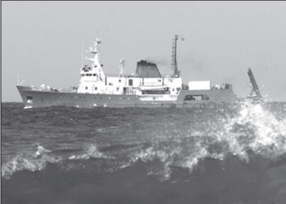
قوات امريكية تشارك في البحث عن بقايا الطائرة الايوبية في المياه اللبنانية

في المقابل، أكد رئيس الهيئة التنفيذية في «القوات اللبنانية» سمير جعجع قبل الاجتماع «إن 14 آذار مستمر وسيبقى قائداً وهذا اليوم سيجيبه آمال كل المرشحين على عدم وجود هذه القوى»، وقال «رجعت أيام