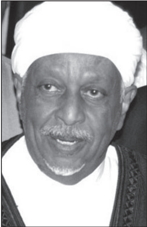
محمد عثمان الميرغني