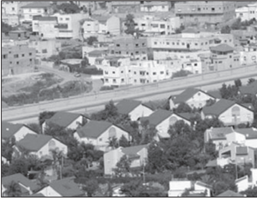
كندا تقع في الفخ حين أعلن نتنياهو تعجيد البناء في المستوطنات

مثل تركيا، السعودية، ايران بل وحتى سورية فانها تدير بنفسها سياساتها وتقرر جدول اعمال لولايات المتحدة، وليس العكس، تركيا قررت توسيع نفوذها وعلاقتها مع الدول العربية ووسط آسيا، والآن هو غير قادر على جلب الضماعة، الشرق الاوسط، ايران تصير قوه عملى بغض نفسها، الشريعة اعادت الى نفسها السيطر في لبنان، عادت الى الحضن العربي وتسيطر سيطرة ذات مغزى على استمرار السياسة بين اسرائيل والعرب.