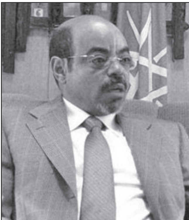
رئيس وزراء إثيوبيا ملس زيناوي