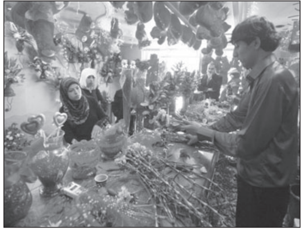
فلسطينيات يشترين الزهور للاحتفال بعيد الحب في القدس المحتلة

القرار القضائي ان الزمت بركات بهدمها»، ولا يبد من الذي ان بلدية الاحتلال وجهت اخطارات ببدء نحو 88 منزلا يتكون منها حي السبسان ببلدة سلوان بحجة البناء دون ترخيص، ويهدف تشييد واطمة حديقة تلمودية لترتبط بالهيكل اليهودي، خاصة ان الجماعات الاستيطانية وسلطات الاحتلال تعتبر منطقة سلوان واحياءها «مدينة داوود»، ويتم العمل بشكل متسارع على تهيؤها قعد النجاح في وضع اليد على استيطانية متفرقة.