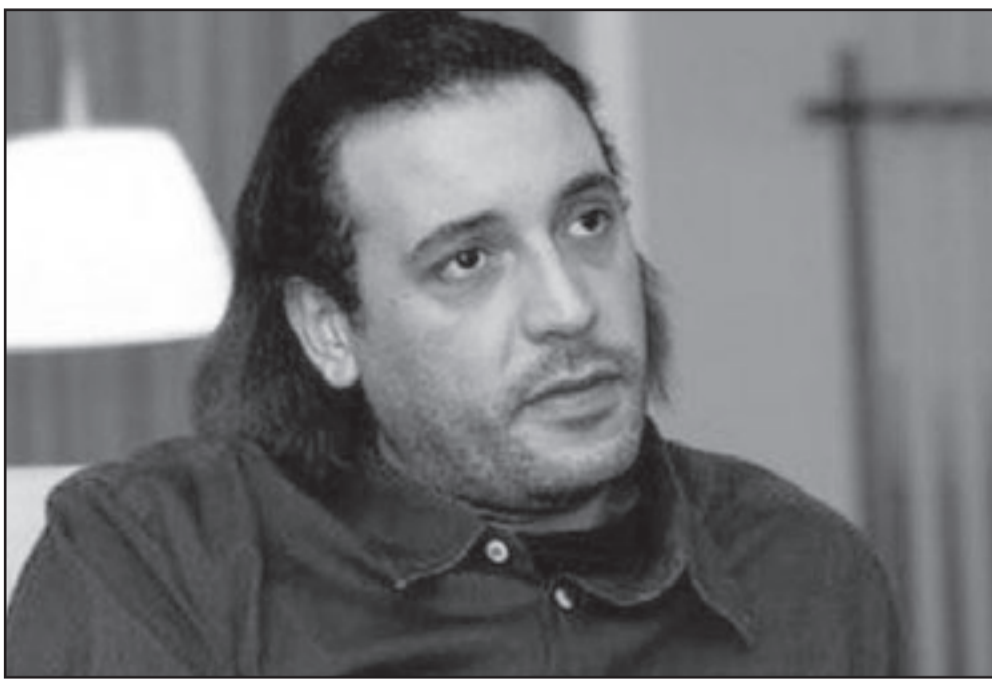
هنيعل القذافي الذي تسبب إيقافه بسويسرا في أزمة لم تنته بعد

ليتمكن من مغادرة البلاد، وحكمت محكمة الاستئناف على المواطن السويسري الثاني ماكس غولدي الخميس بالسجن أربعة أشهر مع النفاذ بتهمة «الإقامة غير الشرعية» و«ممارسة نشاطات اقتصادية بشكل غير قانوني». ونمت تيرثة أحدهما ويدعى رشيد حمداني الأسبوع الماضي من التهمة الموجهة إليه لكنه ما زال ينتظر أن تعيد إليه السلطات جواز سفره الصادر