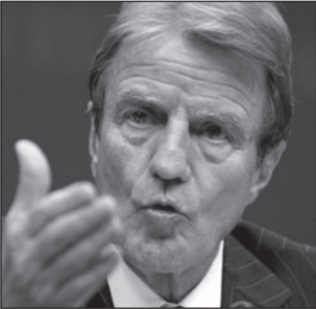
وزير الخارجية الفرنسي برنارد كوشنير

باماكو - اف ب: قام وزير الخارجية الفرنسي برنار كوشنير السبت بزيارة مفاجئة جديدة الى باماكو لبحث مصير الرهينة الفرنسي بيار كامات الذي خطفه تنظيم القاعدة في نهاية تشرين الثاني/نوفمبر في شمال مالي، كما أفادت مصادر حكومية وملاحية. وقالت المصادر أن كوشنير وصل ظهره وغادر قرابة الساعة 17:00 (بالتوقيت المحلي وتغ) بدون الإدلاء بأي تصريح للصحافيين. وكان كوشنير قام في الاول من شباط/فبراير بزيارة اولى لباماكو استمرت بضع ساعات والتقى خلالها الرئيس امانو توماني توري.