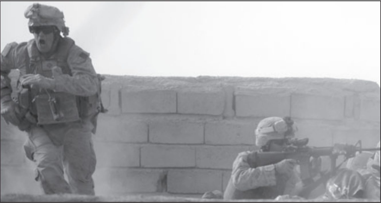
جنديان امريكيان من قوات حلف الناتو خلال اشتباكات مع حركة طالبان في اقليم هلمند

قتلوا في اطار العملية الجارية. وأضاف الجنرال البريطاني «جرت مواجهات متفرقة (...) لكن طالبان لم يتمكنوا من تنظيم مقاومة متماسكة». مشيرا الى «مقتل عدد قليل من المتطرفين». ويصف مسؤولون عسكريون العملية بانها اكبر هجوم تشنه القوات الدولية منذ بداية الحرب في نهاية 2001، بعد طرد طالبان من السلطة. لكن المتطرفين سخروا من العملية التي «احتبط بضجيج اعلامي كبير» ضد مرجه «المنطقة الصغيرة جدا». وقال الناطق باسم حركة طالبان يوسف احمدي السبت «قتلنا ستة جنود اجانب في اولي الاشتباكات».