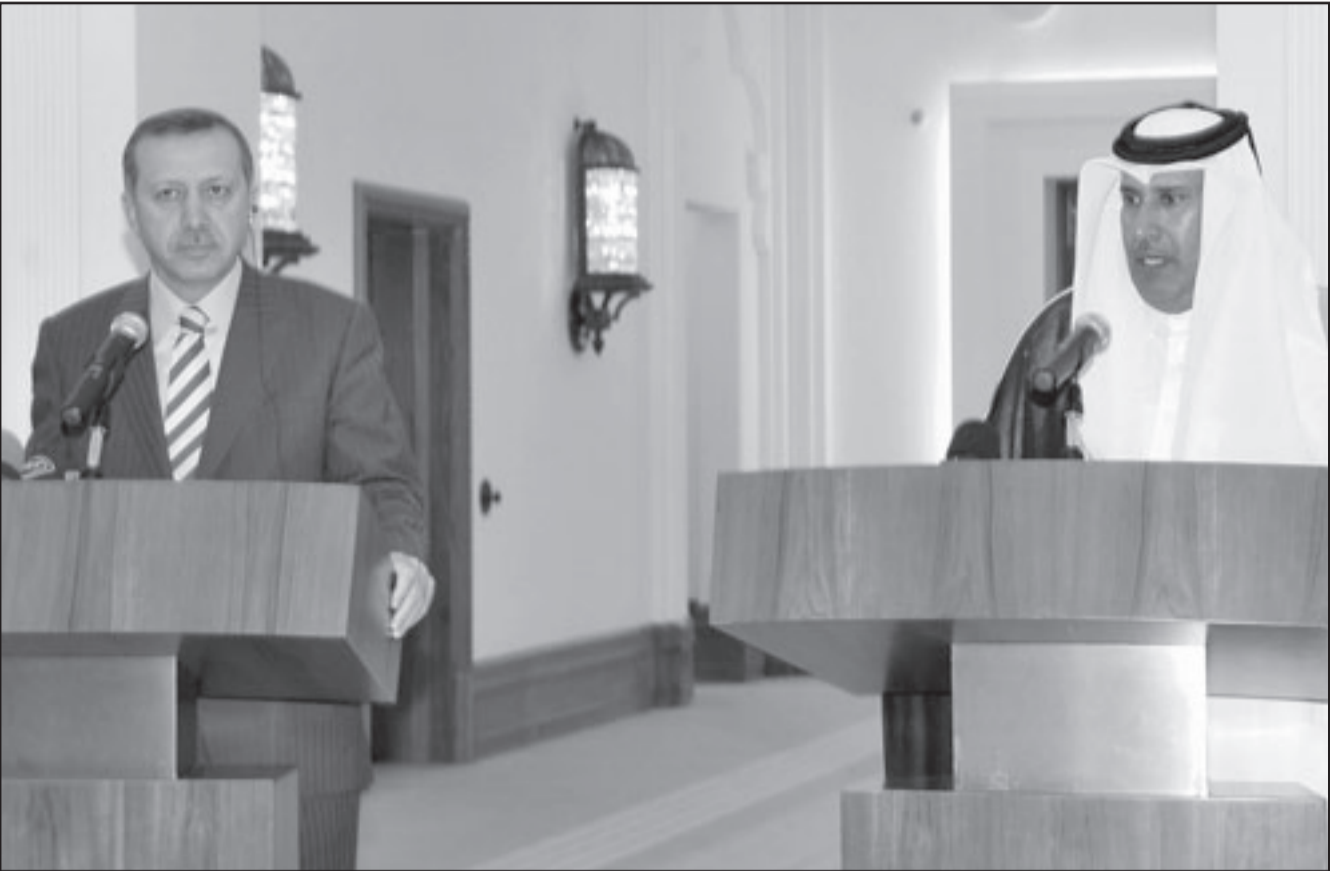
رئيس الوزراء القطري الشيخ حمد بن جاسم آل ثاني خلال مؤتمر صحفي مع نظيره التركي رجب طيب اردوغان في الدوحة امس

دعم شن هجمات ضد المنشآت النووية الإيرانية، كما أن جونز صرح قبل أسابيع قليلة أن من شأن فرض عقوبات مشددة على إيران أن يدفع الأخيرة إلى مهاجمة إسرائيل. رغم ذلك ذكرت صحيفة «يديوت أحرنوات» أمس أن «مولن سيبحث مع قادة جهاز الأمن في إسرائيل في الخيار العسكري ضد إيران» لكنها أشارت إلى تصريحات سابقة أطلقها مولن وغيره من خلالها عن معارضته لهجوم ضد إيران وتحسبه من رد الفعل الإيراني على ذلك.