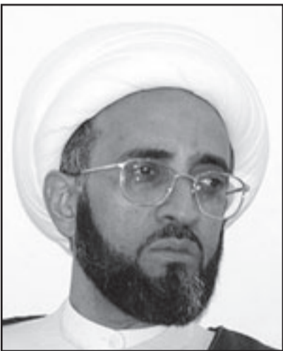
الشيخ حسن الصفار

في ظلام الليل فهي بذلك ستكون عديمة الجوى». ومضيا بان هناك سعيا لكي تحظى بدعم علمائي واسع في اوساط الطائفتين. وأضاف نحن نتحدث عن ميثاق شرف يتعلق بالعلاقات الاهلية بين السنة والشيعة مع اننا نجزم ونعلم بان المسألة بحاجة الى معالجة رسمية. مستدركا بان توقيع ميثاق تعايش بين العلماء من الطائفتين لن يحل المشكلة «نريد ان نهيئ ونضع الاجواء المناسبة التي تدفع لحفظ حقوق جميع المواطنين ومعالجة الطائفية». وتابع الصفار امام حشد من الصلبيين بان خلفنا تراثا فيه الكفاية من المرات والامم والاساءات المتبادلة وهذا لا يمكن ان ينتهي بين عشية وضحاها. وردا على اتهامات بشأن انقصار الشخصيات الشيعية على اصدار بيانات الاستنكار قال الصفار «المسألة ليست اصدار بيانات وانما في بذل جهود في التحرك والتواصل لتغيير القناعات السلبية وابداع جسور من الثقة وهذا ما قام به المحضون الواعون من ابناء الوطن». وأضاف «انا كان البعض يتلفظهم اهمة هذه الجهود وتتملكه بعض الهواجس تجاهها فعليه ان يقترب منها ويتعرف على حقيقتها وان يتبصّر من قفله وواجه الفرع السني بعيدا عن ندفة مشاعر الناس والشارة والواجب السياسي والشعبي تجاه مسألة الوحدة والتقارب واصلاح ذات البين». وأشار في هذا السياق بتنظيم مركز الأبحاث في العقيد مؤتمرا فقهيا يهدف في جامع الكوثر في مدينة ضوى في اليومين الماضيين بمشاركة شخصيات دينية سنية