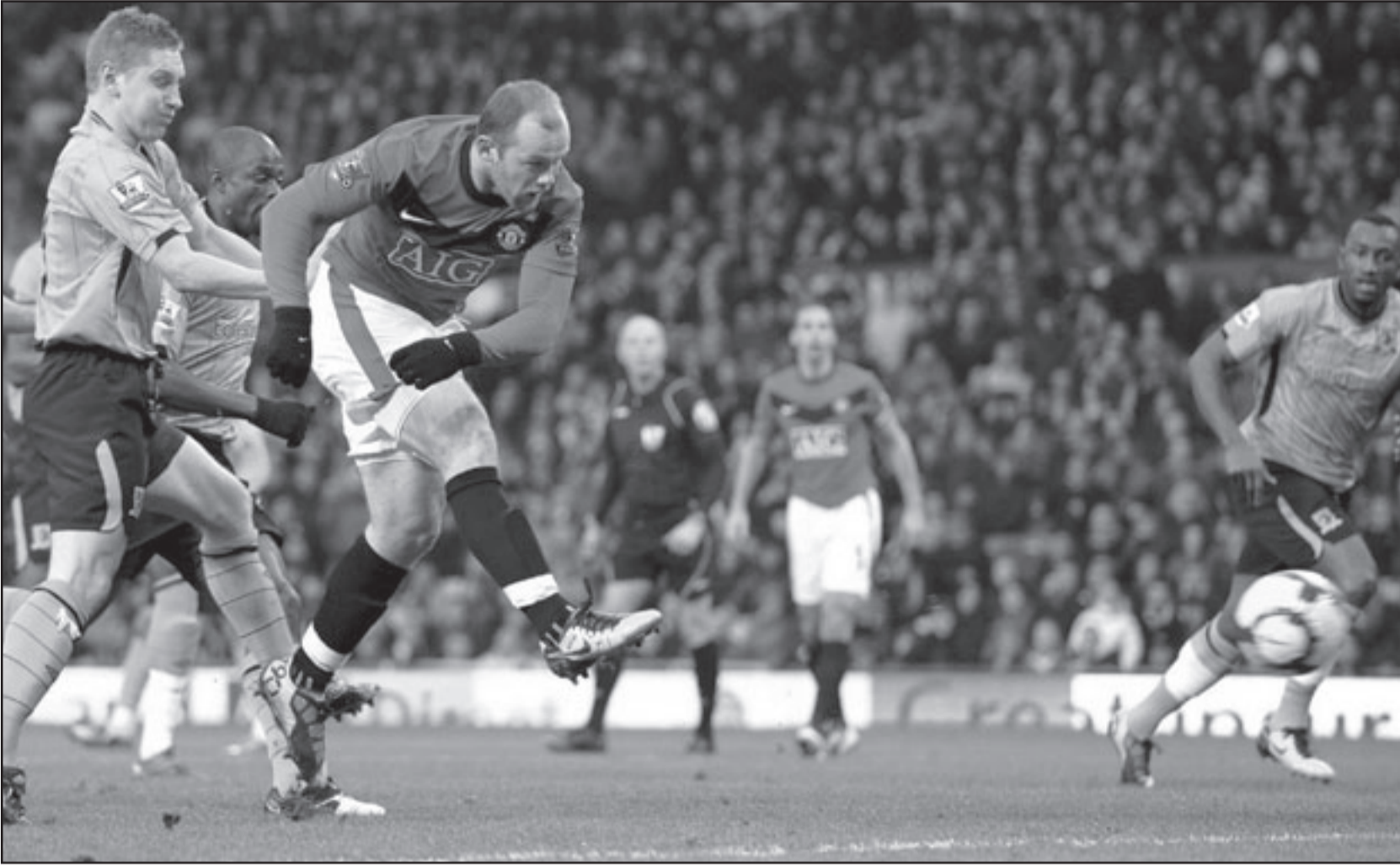
واين روني نجم مانشستر يونايتد (الثالث من اليمين) يسدد هدفا افتتاحيا في المباراة مع هال سيتي

ويملك ارسال الاسلحة اللازمة للعودة بنتيجة ايجابية من بورتو في مقدمتهم خط الهجوم المكون من الروسي اندري ارشافين والدنماركي العملاق نيكلاس بندتنر والتشيكوي توماس روزيتسكي وثيو والكوت وصانع الاعباب الاسباني فرانسيسك فابريغاس.