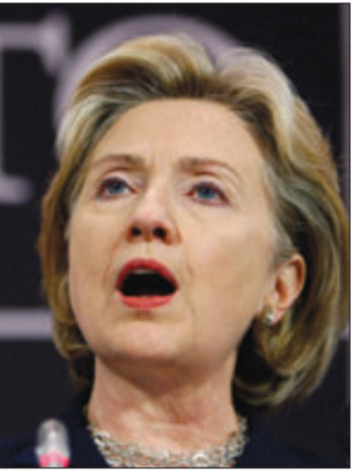
وزيرة الخارجية الأمريكية هيلاري كلينتون