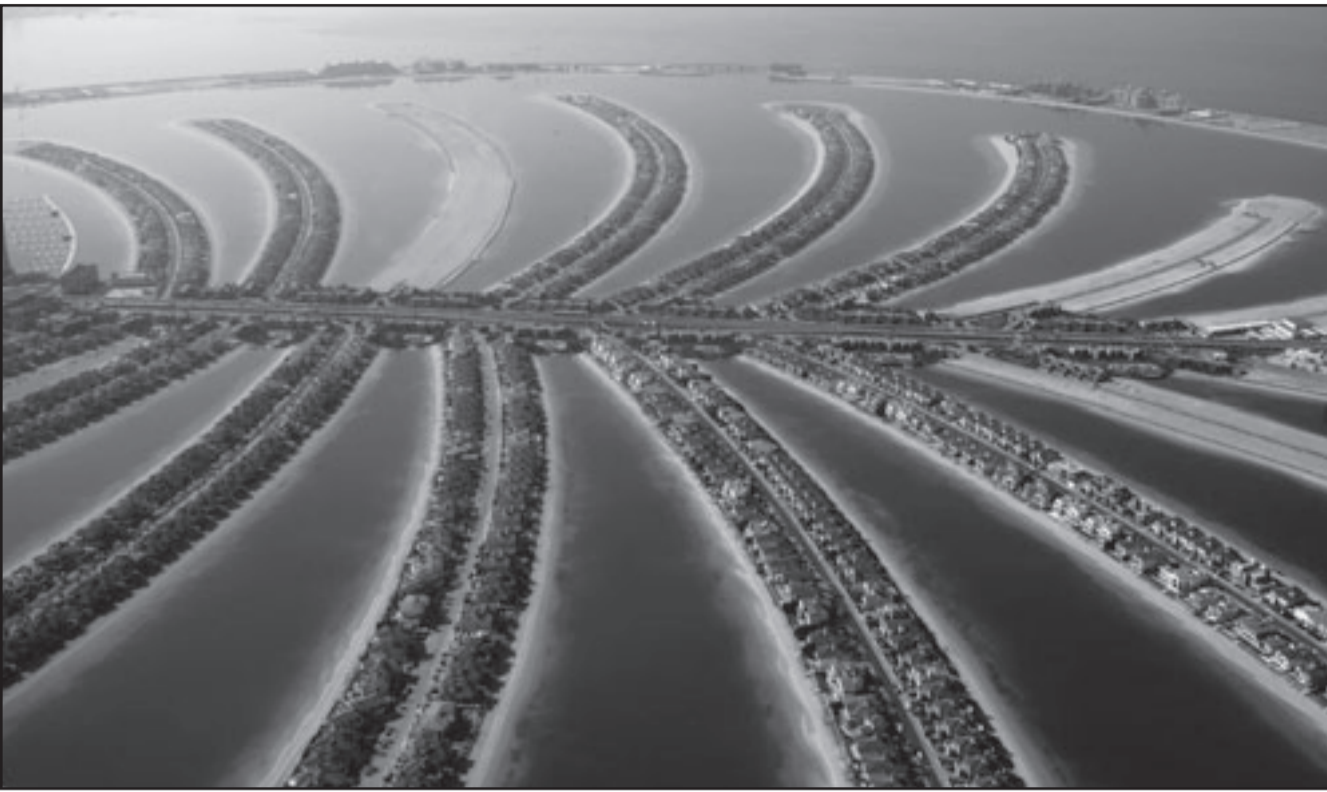
صورة جوية لمشروع النخلة الملوك لشركة دبي العالمية

■ دبي - اف ب: نصحت وكالة موديز لتصنيف الائتماني امس الاثنين مجموعة دبي العالمية ببيع المزيد من أصولها للقيام بعملية إعادة جدولة ودية لديونها المتعثرة والبالغة 22 مليار دولار. وقال فيليب لوتر نائب رئيس موديز في الشرق الاوسط في تقرير «نعتقد ان بيع المزيد من الأصول هو شرط لاي عملية إعادة جدولة ودية لديون مع المصارف». وأضاف في تقرير شركة «استثمار» التي تعتبر الذراع الاستثمارية لمجموعة دبي العالمية باع او اخر 2009 بعض موجوداتها العقارية في الخارج بما فيها ملكيات عقارية في لندن وفندق ديليو في نيويورك بسعر بخس. وبحسب موديز فان «استثمار» تحضر لبيع شركة الشحن البحري التابعة لها «انشكيب لخدمات الشحن». وأضاف تقرير موديز ان «دبي انك»، وهو المصطلح الذي