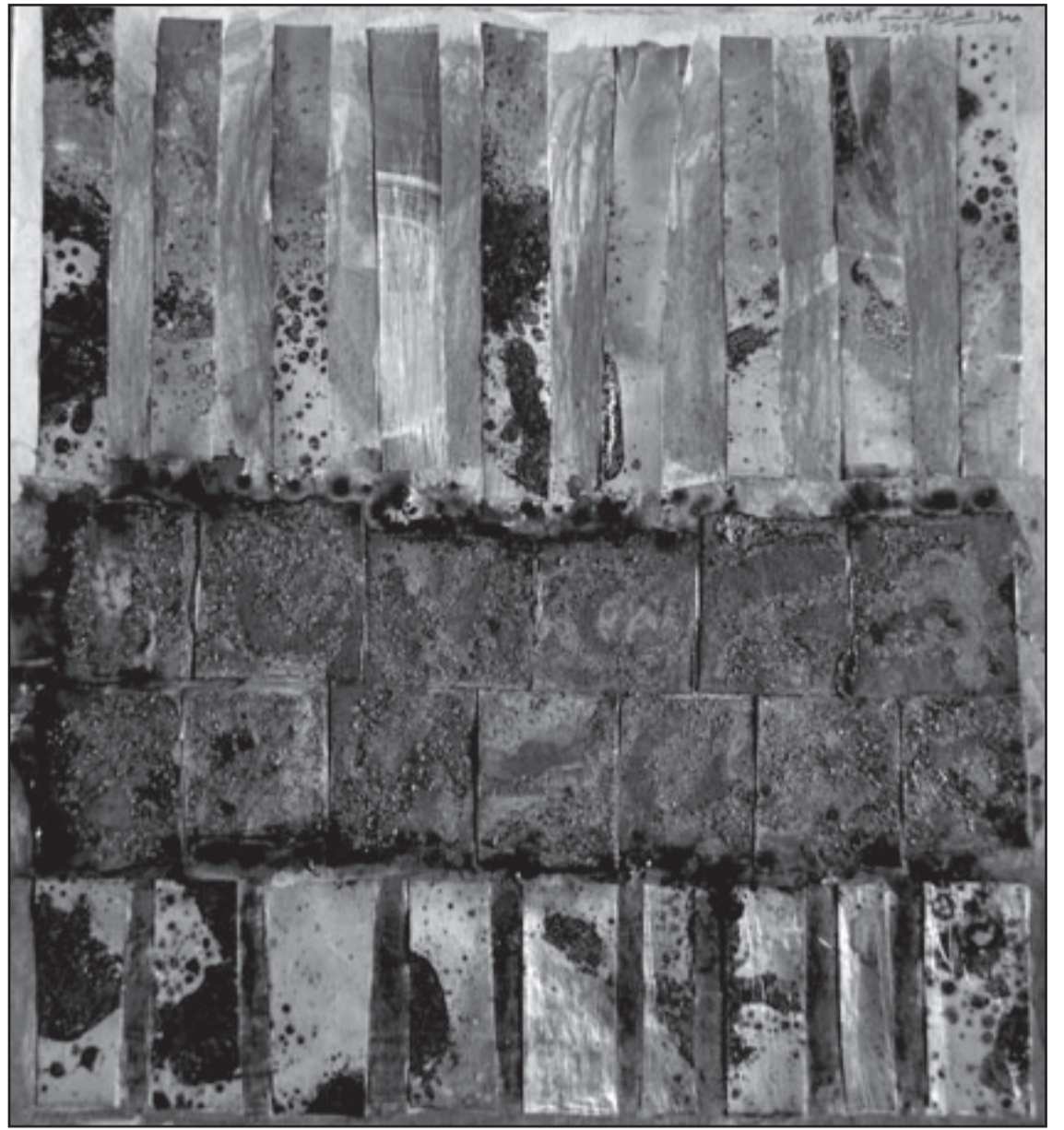
أعمال مشاركة في المعرض