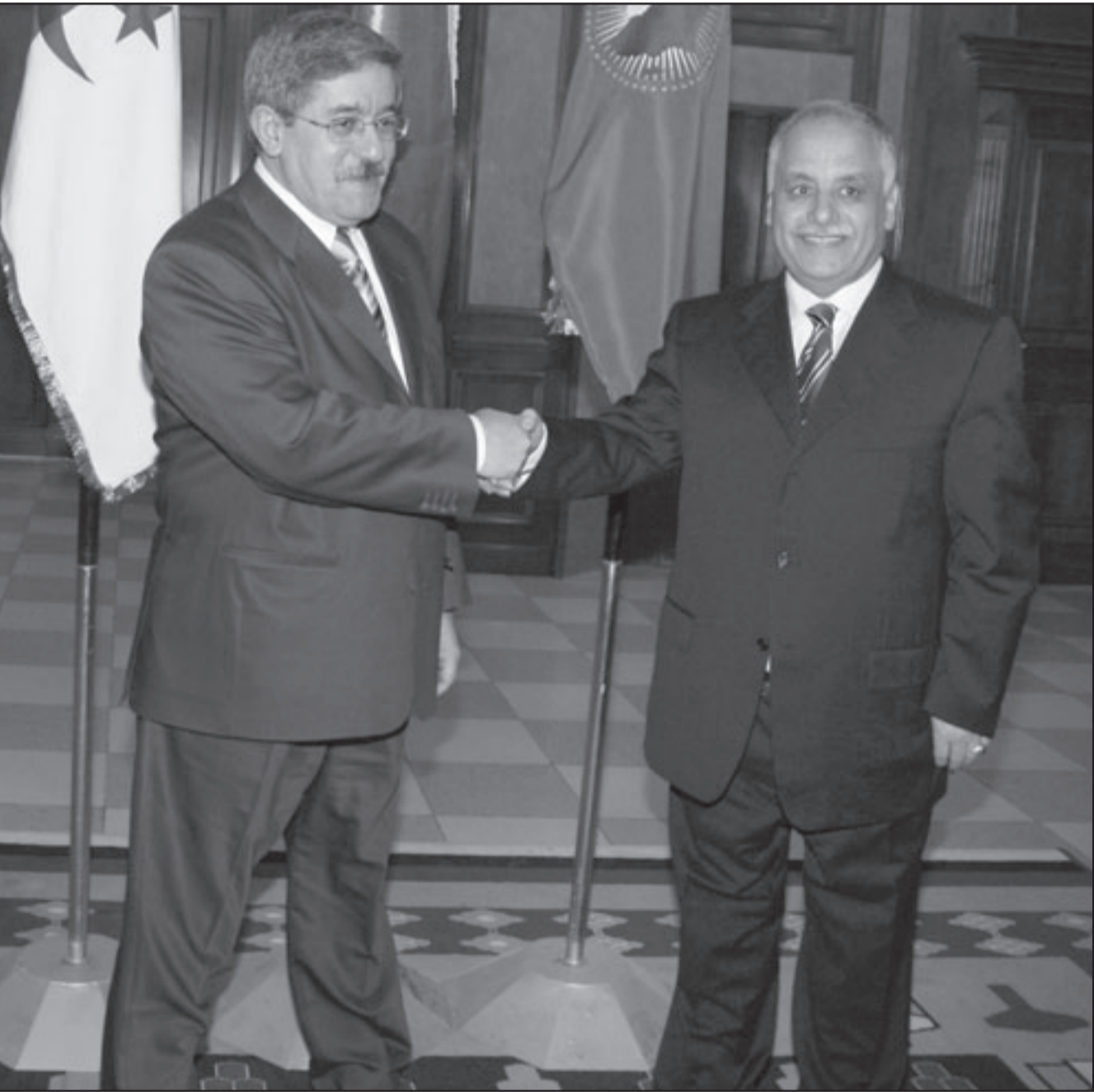
رئيسا الحكومتين الليبية البغدادي المحمودي (يمين) وأحمد أويحيى في طرابلس أمس

■ طرابلس - يو بي أي: اتفقت ليبيا والجزائر امس الاثنين على العمل سويا من أجل دعم تعاونهما الثنائي لتحقيق شراكة استراتيجية في عدد المجالات من بينها الطاقة والأمن الغذائي.