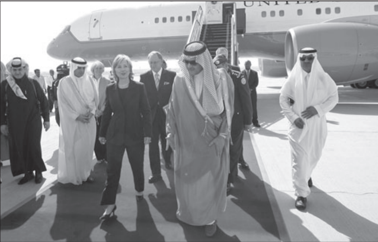
وزيرة الخارجية الامريكية هيلاري كلينتون لدى وصولها الى السعودية وفي استقبالها وزير الخارجية السعودي الامير سعود الفيصل