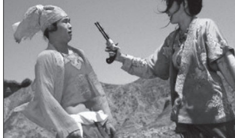
لقطة من فيلم «امرأة ومسند ومتجر مكرونة»

وفي مؤتمره الصحافي، أعرب تشانغ عن امتنانه لمهرجان برلين السينمائي لعرض الفيلم في اليوم الأول لما يعتبره الصينيون عام النصر واختياره ليكون في