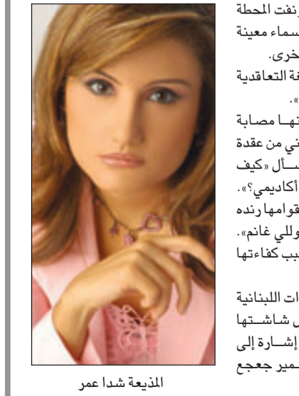
المدية شدا عمر

شدا عمر كان حديث عن أن الاستقالة جاءت بعد خلاف بين الضاهر والمتني في علاقة بسياسة القناة، وبعد «تمن» من الضاهر، تزامناً مع سير الدعوى المقامة من القوات اللبنانية على «المؤسسة اللبنانية للإرسال»، ورئيس مجلس إدارتها وأصحاب الحقوق والسماح فيها بتهمة «الاحتيال وساءة الأمانة وتهريب الأموال».