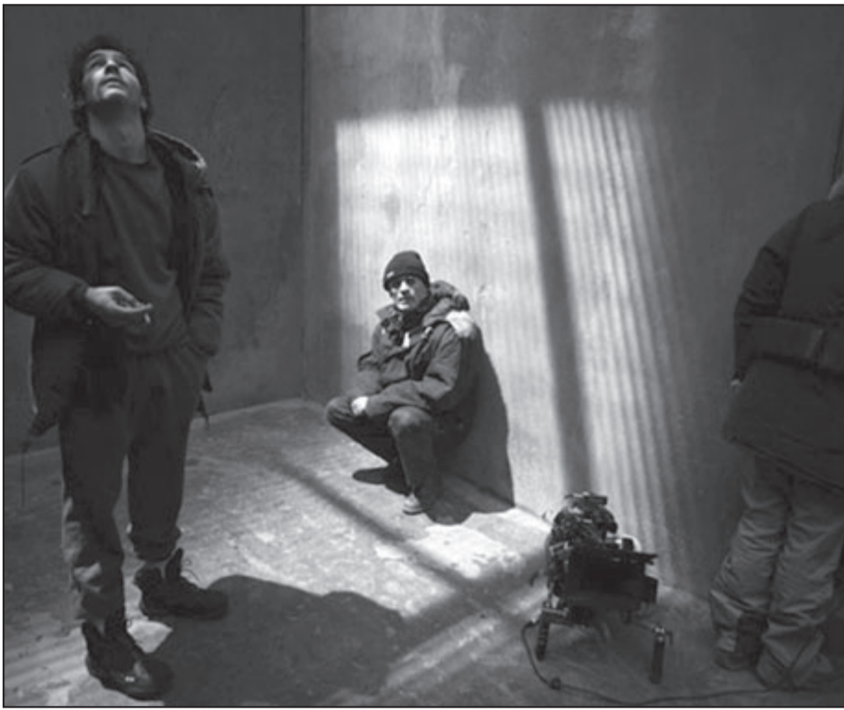
لقطة من فيلم «نبي»

مالك هو العمود الفقري لهذا الفيلم، ورحلته المؤلمة من صبي جصول أمي، إلى زعيم تأثير انه يرعبنا بعينيه المتاججتين عندما يغضب، وهو يثبثنا في مقاعدنا عندما يهاجم