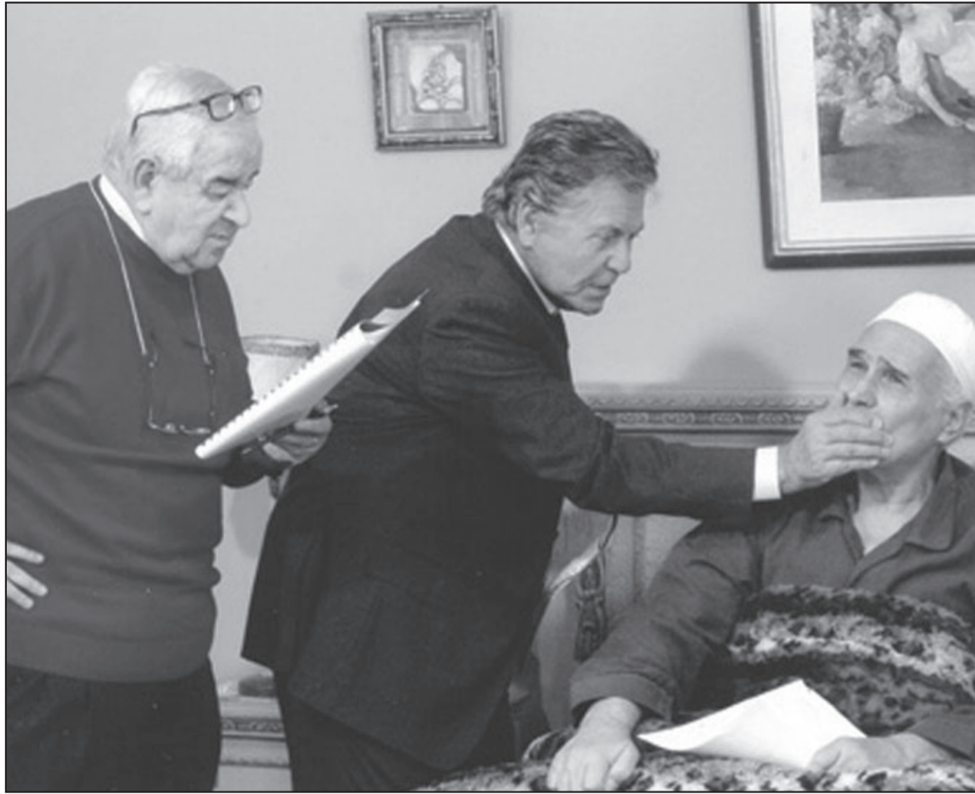
حسين فهمي أثناء تصوير «بابا نور»

■ لماذا تأخرت في تقديم أفكار سياسية مباشرة في