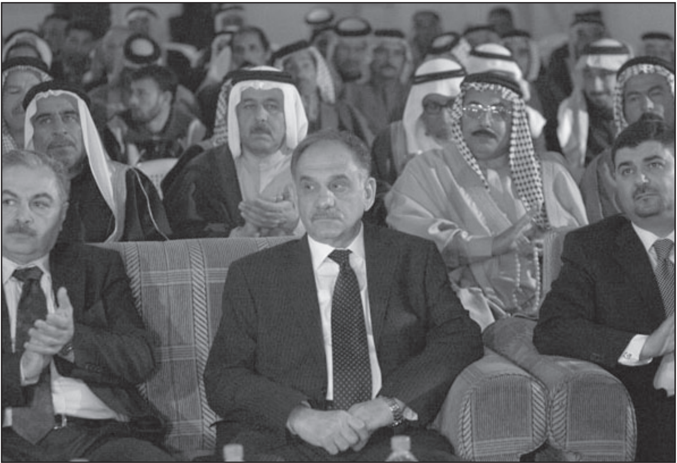
السياسي العراقي صالح المطلك اثناء احتفالية انتخابية أمس

السنوات الماضية، ودعا الى ان لا يلتفت رئيس الوزراء الى الاصوات المتشددة والتي تذهب الى اقضاء الشركاء في العملية السياسية على خلفيات الخلاف السياسي او المذهبي، خاصة في العراق الذي يفتقر الى الديمقراطية وان فيه من ساهم في كتابة الدستور وقراره، مؤكداً على ان الوقت لا يزال متسعاً لاتخاذ قرار يفتح الأفق أمام الجميع للمشاركة في عراق ديمقراطي تعددي ينعم فيه الجميع بالسلام. وأكد الفلوجي على ان المالكي لو اتخذ مثل هذا القرار فسيفقد ثقة الشعب وضماً لتغليب المصلحة