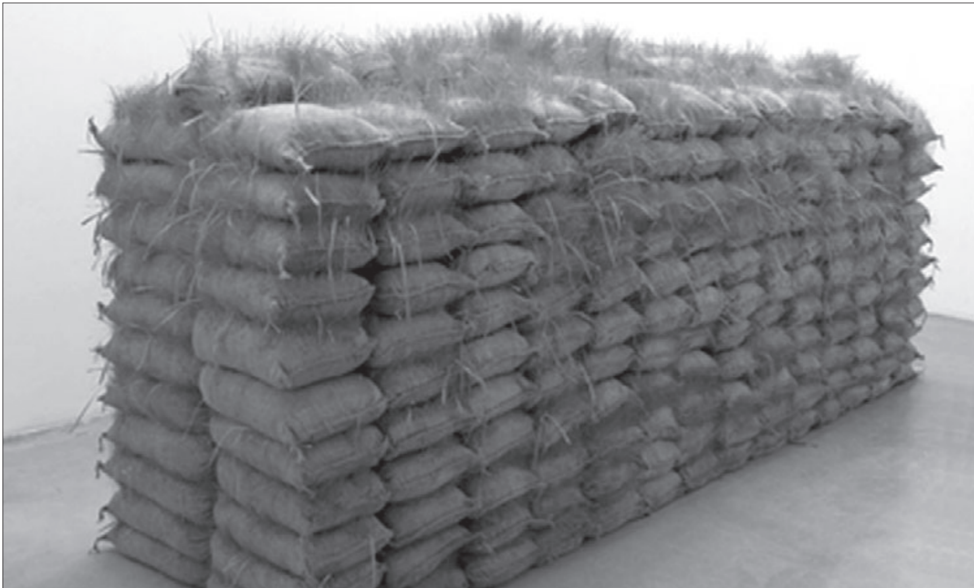
عمل لمتى حاطوم (القدس العربي)