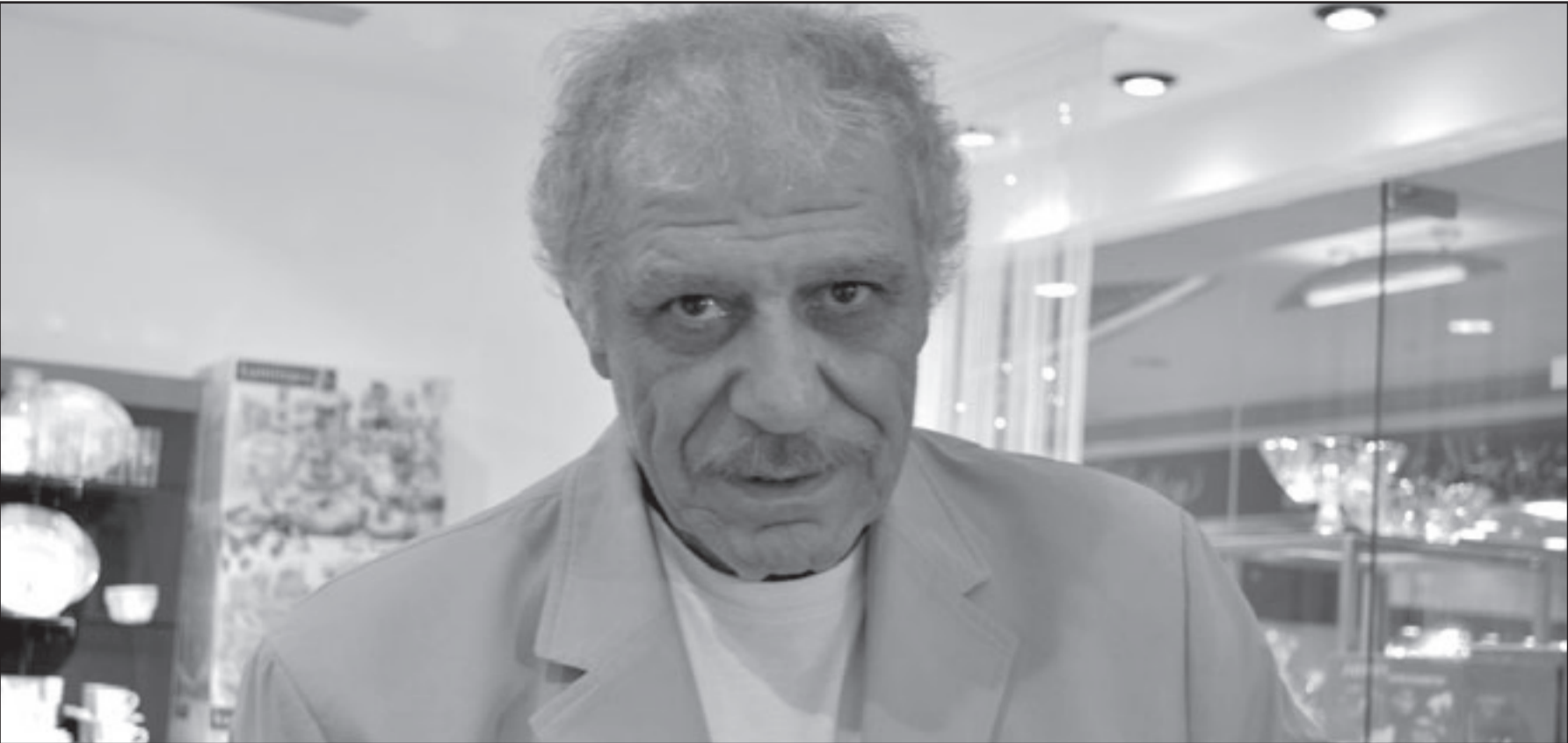
خالد تاجا (القدس العربي)