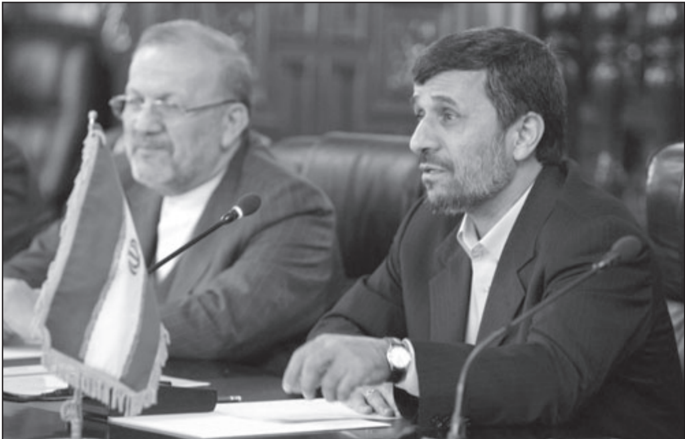
الرئيس الإيراني أحمدى نجاد ووزير خارجيته بوشهر متكي خلال مؤتمر صحفي

العلاقات، بدون أن تزيد أي تفاصيل. وقال الناطق باسم الخارجية الصينية كين غانغ للصحافيين «نأمل أن تكون الأجواء جيدة على الدوام بين العلاقات بين الولايات المتحدة لكن الأمر مرتبط بالاعتقاد بجهودنا لإزالة العقبات».