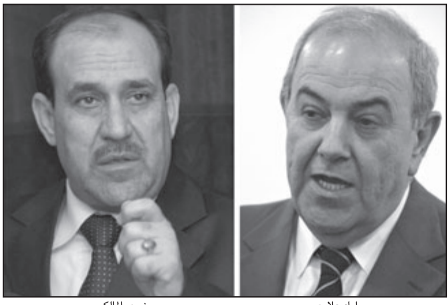
نوري المالكي (يسار) و اياد علاوي (يمين)

ذريعة «العلاقة مع البعث».. وعلاوة على كل هذه لا يزال العراق بلداً خطيراً على الرغم من التحسن النسبي للامن، فمن الخطورة بمكان ان يسافر اي شخص باستثناء موظفي الامم المتحدة بحرية في انحاء العراق. وختمت ان اذاحة المالكي عن الحكم تعني رحيل جنرالات في الجيش متهمين بتحويل المؤسسة العسكرية إلى ميليشيا خاصة، مشيرة إلى ان منظمة الشفافية الدولية وضعت العراق في المركز الثالث في قائمة الدول الأكثر فساداً في العالم في تقريرها عام 2007-2008 وهذه العوامل مجموعة قد تتخفي بالعراق إلى دولة ديكتاتورية وهذا ان يكون ارتها يتفخر في الجيش الامريكي الراحل من العراق لانه جاء لبحر العراقيين من ديكتاتورية صدام، كما ان هذا الوضع لا يبرر بقاء الاحتلال، وماذا يعني هذا؟ قد يؤدي إلى دخول العراق مرحلة جديدة من العنف، ويرى جوست هيلترمان من مجموعة الازمات الدولية ان نتائج الانتخابات العراقية تثير حساساً وساخراً ولكن هذه النتيجة متوقعة عندما يتم تنظيم الانتخابات في «بلد غير مستقر».