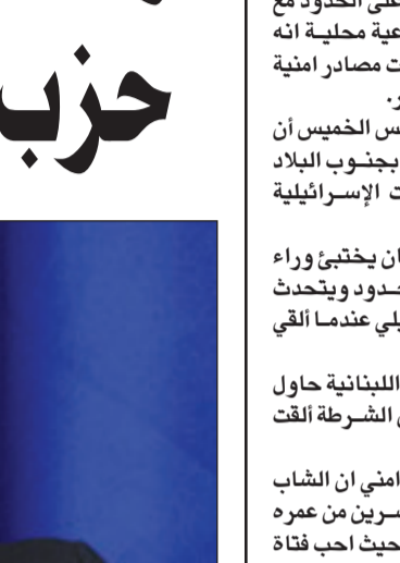
دمشق - د ب أ: بدأ فريدريك هوف مساعد المبعوث الأمريكي الخاص للسلام في الشرق الاوسط جورج ميتشل، محادثات امس الخميس مع المسؤولين السوريين بوزارة الخارجية في دمشق.

وقالت مصادر مواكبة لزيارة هوف إلى سورية، لوكالة الأنباء الألمانية، ان المحادثات تجري في إطار ما يمكن وصفه «بخارطة الطريق بين واشنطن ودمشق»، كما كان اسمها وزير الخارجية السوري وليد المعلم عند بداية انطلاقتها قبل أكثر من عام.