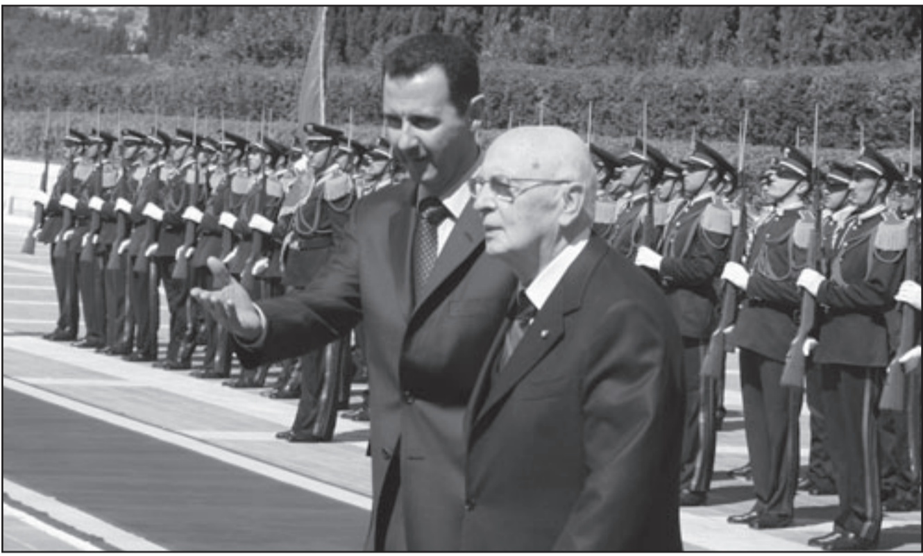
الرئيس السوري يستعرض حرس الشرف مع نظيره الإيطالي في دمشق

القدس الشرقية وهذا موقف الأيوبي مع موقف الإدارة السورية، مشيراً إلى تناغم هذا الموقف مع موقف الإدارة السورية، وأضاف «نحن على قناعة أن الحل الوحيد الممكن لتحقيق السلام هو الحل القائم على الدولتين والعرب، مؤكداً أن حق الشعب الفلسطيني في تقرير المصير وتقرير دولته المستقلة القابلة للحياة هو حق إسرائيل في الاعتراف بوجودها»، وأشار إلى ضرورة تحقيق المصالحة الفلسطينية ووحدة الشعب الفلسطيني بسلام، وقال إن عملية السلام يجب أن تشمل إعادة الأراضي المحتلة ومن بينها الجولان، وحول اتفاق الشراكة السورية - الأروبية قال نايوليتانو ونحن نقوم بكل