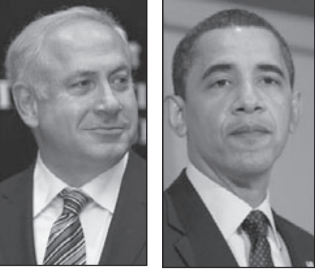
الناصرة - «القدس العربي» من زهير اندراوس:

على الرغم من إعلان الرئيس الأمريكي باراك أوباما، عن أنه لا توجد أزمة بين تل أبيب وواشنطن، إنما الحديث يدور عن خلاف، قالت وسائل الإعلام الإسرائيلية الخميس أن الإدارة الأمريكية ما زالت مصورة على الحصول على رد رسمي من الحكومة الإسرائيلية حول البناء في القدس الشرقية المحتلة.