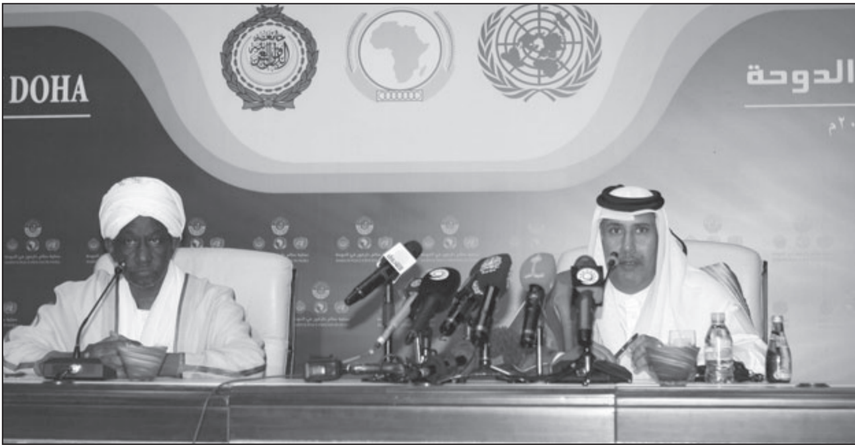
نائب الرئيس السوداني علي عثمان طه ورئيس وزراء قطر حمد بن جاسم بن جبر آل ثاني عقب توقيع الاتفاق في الدوحة أمس

■ الخرطوم - رويترز: وقع السودان امس الخميس اتفاقاً لوقف إطلاق النار مع فصائل متمرد ثان في دارفور في إطار سعي الحكومة لإنهاء الصراع في الاقليم الواقع في غرب البلاد قبل الانتخابات المقررة الشهر المقبل. ووقع مسؤولون حكوميون الاتفاق مع حركة التمرد القوية في الدوحة التي تضم فصائل عدة صغيرة في العاصمة القطرية الدوحة بعد أسابيع من توقيع الخرطوم اتفاقية مماثلة مع حركة العدل والمساواة المتصدة القوية في دارفور. ورفضت جماعات متمردة في دارفور ومن بينها حركة العدل والمساواة اتفاق امس قائلة ان حركة التحرير والعدالة ليس لها اي قوة عسكرية على الارض وما زالت ترفض التعامل مع الخرطوم بعد مرور سبع سنوات على بداية الصراع. وانقسم متمردو دارفور وأكثرهم من غير العرب بعد السنوات الأولى من القتال الذي اندلع في 2003. وعرقل تقاسمهم وغياب الثقة العميق بين الأطراف المتحاربة الجهود المتكررة لجمع المتمردين حول طاولة مفاوضات مع الحكومة. وقال علي عثمان محمد طه نائب الرئيس السوداني للصحافيين في الدوحة حيث جرت مفاوضات السلام لشهور ان الاتفاق خطوة مهمة. ودعا طه كل الفصائل والحركات ومن بينها حركة العدل والمساواة للانضمام إلى مفاوضات جادة وأمنية بأسرع ما يمكن. وتعتبر المفاوضات بين حركة العدل والمساواة والخرطوم والتي كان من المفترض أن تلي اتفاق وقف إطلاق النار الموقع بينهما الشهر الماضي وتمهد الطريق لأول اتفاق سلام نهائي بحلول آذار/مارس. وهددت حركة العدل والمساواة في وقت سابق بمغادرة