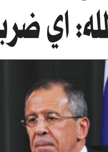
دمشق - د ب أ: بدأ فريدريك هوف مساعد المبعوث الأمريكي الخاص للسلام في الشرق الاوسط جورج ميتشل، محادثات امس الخميس مع المسؤولين السوريين بوزارة الخارجية في دمشق.

وقالت مصادر مواكبة لزيارة هوف إلى سورية، لوكالة الأنباء الألمانية، ان المحادثات تجري في إطار ما يمكن وصفه «بخارطة الطريق بين واشنطن ودمشق»، كما كان اسمها وزير الخارجية السوري وليد المعلم عند بداية انطلاقتها قبل أكثر من عام.