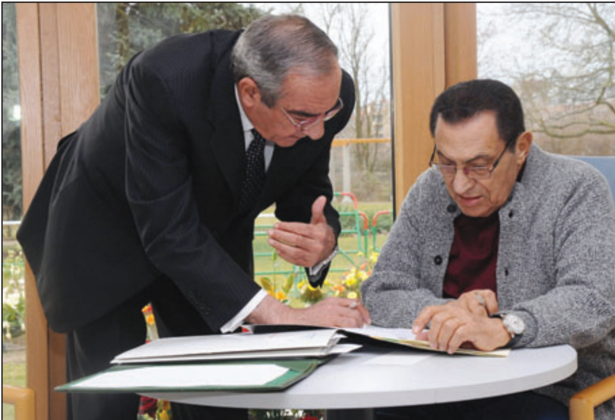
الرئيس مبارك يوقع قرارات جمهورية في مستشفى هايدلبرغ والى جانبه امين رئاسة الجمهورية زكريا عزمي