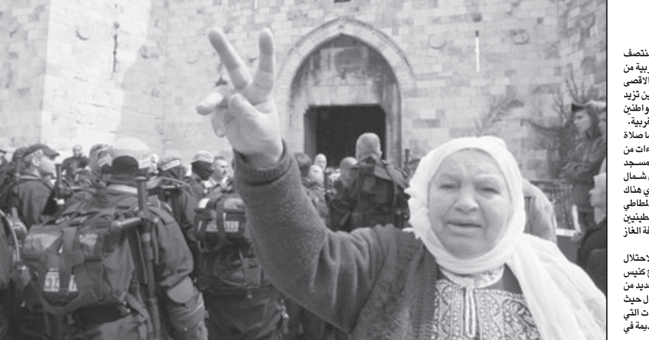
رام الله - «القدس العربي»