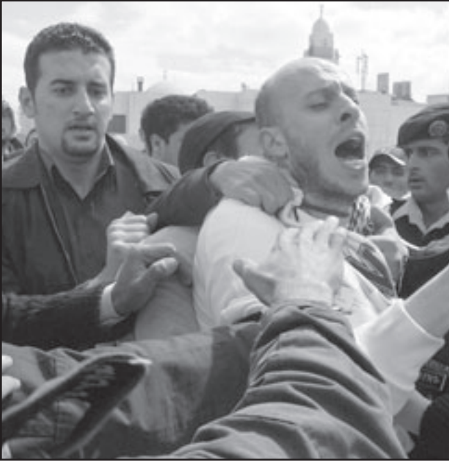
رجال امن اردنيون يحاولون السيطرة على متظاهرين وسط العاصمة عمان