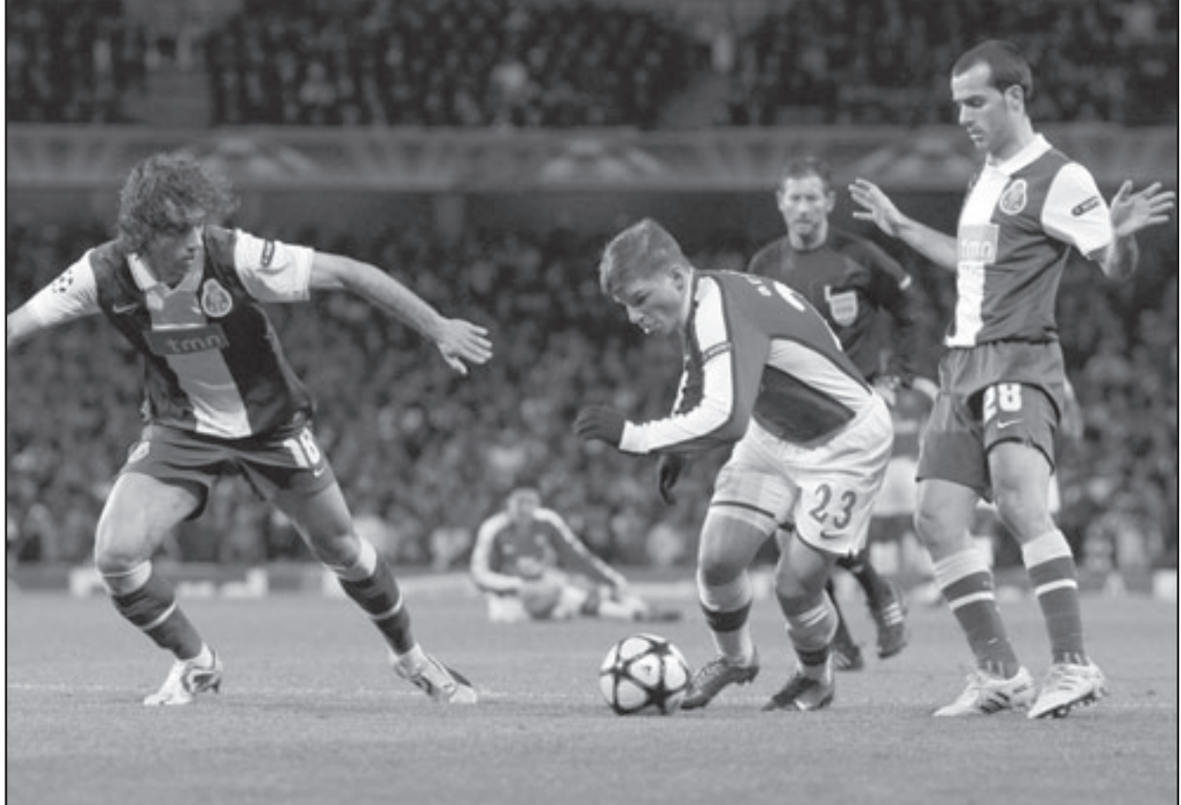
اندية أرفشان نجم أرسنال (وسط) في منافسة على الكرة مع لاعبي بورتو

وسبق للمباراة هذه المرة على ملعب نادي دوسلدورف،