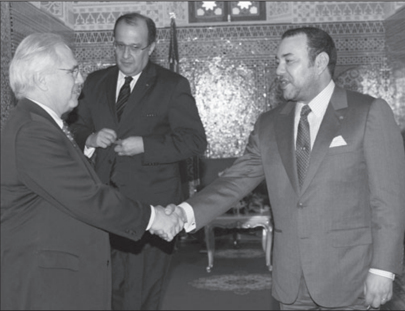
الملك محمد السادس مستقبلا روس في حضور وزير الخارجية الطيب الغاوي الغهري

تلك المعسكرات واوضاع اللاجئين الصحراويين، دون ان تعترضهم السلطات المغربية او تعرقل حركتهم.