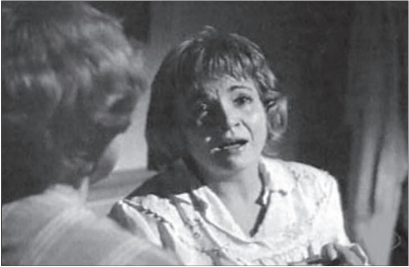
شادية في «المرأة المجهولة»

أضافت: بالتأكيد الكتاب لا يميلون إلى هذه النوعية لأنها تحتاج قدر أكبر من الجهد والسعي وراء وقائع