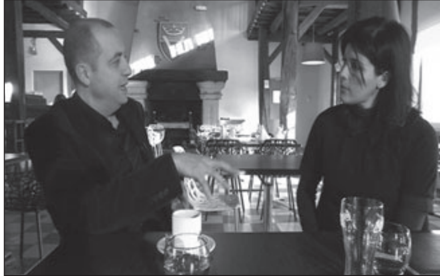
سعاد ماسي مع مقدم البرنامج سمير فرح

لدرجة انها قررت ان تهاجر بلدها الجزائر، تقول ذلك وتلفت النظر إلى ان الامر كان خطيراً خلقت قصة عائلتها تتمشي للقبائل البربر، لذلك عندما تلقت دعوة الجمعية الجزائرية من فرنسا للتحادث عن بلدها الجزائر، وجدتها فرصة للمغادرة وتم كانت دهشتها كبيرة عندما وقفت وحدها لتعزف على العيتار في باريس ويصمم أذنيها الصفيق الحاد ورد الفعل الإيجابي الكبير على أغانيها، التي أشعرتها إلى جانب الفخر بجدورها الجزائرية، أن أهل الجزائر لم يظهم النسيان بل مازالوا في عمق العالم الأكبر يعيشون بأمل بعيداً عن قوقعة الحرب وهوها العيشية.