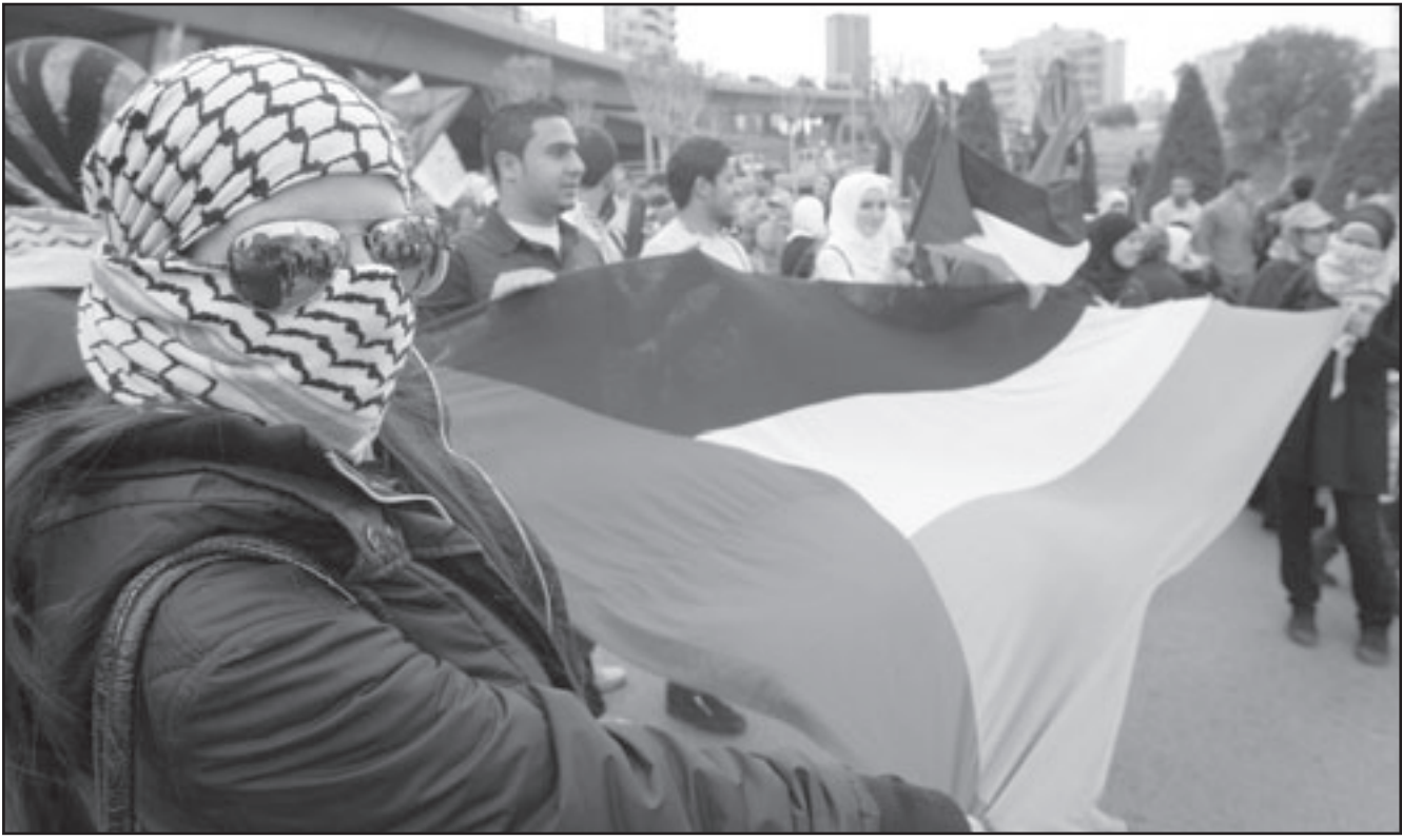
فلسطينيون يتظاهرون في بيروت ضد سياسة اسرائيل بشأن المقدسات الاسلامية

وجاء في خطبة نائب رئيس المجلس الاسلامي الشيعي الاعلى الشيخ عبد الامير قبيلان «التوسع الاسرائيلي وطرود الشعب الفلسطيني من ارضه هما من اعصاب المشاكل والاضطراب فما يجري في الضفة والقبع لا تحمد نتائجها والصبر عليه قابل لغضبنا ان نتعاطى مع الشعب الفلسطيني باخوة، فنرفع الصوت مستنكرين ولعنن على الجامعة العربية بان تقوم بعمل منتج، وعليها ان تلاحق قضية فلسطين وتكون جليسا مفتوحة لتابعة ومراقبة ما يجري في الاراضي المحتلة التي تتعرض لهجمة صهيونية»، واعتبر انه «يجوز ايدا التغاضي عن فلسطين، ان التغاضي عنها كالتغاضي عن الامة ومكانتها، والمطالبه توجهه اولا الى جميع الكلمة وتوحيد صفوف المنظمات الفلسطينية وتوفير دعم عربي واسلامي لتفكيك هذه الغزاة السريطانية وهذا الشر الخلق الذي تعيشه الامة». وتاب: «بقول لامة، المال لا يبقى والازامة تتغير ولكن الارض باقية والشعب الحرمة مستمرة في ظلها ضد العدوان، والامن لا يتحقق ما دام الشر في فلسطين، والاعتماد على مجلس الامن هو الاعتماد على السراب، لذلك نطالب النجدة لحماية الارض والمقدسات وتحصرة الشعب الظالم». فالاستمرار بالاعتصام على هذا النهج تضيق لوقت والهمال للشعب اللقوة التي تاتي النزل والمسلمون وشده على ان «انطلاق التظاهرات وحملات الاستنكار ضد الكيان الصهيوني امر جيد، ولكن علينا ان نتعاطى مع الامور بجديته ويتحرك فاعل وهمة عالية وتحد للصلاب،