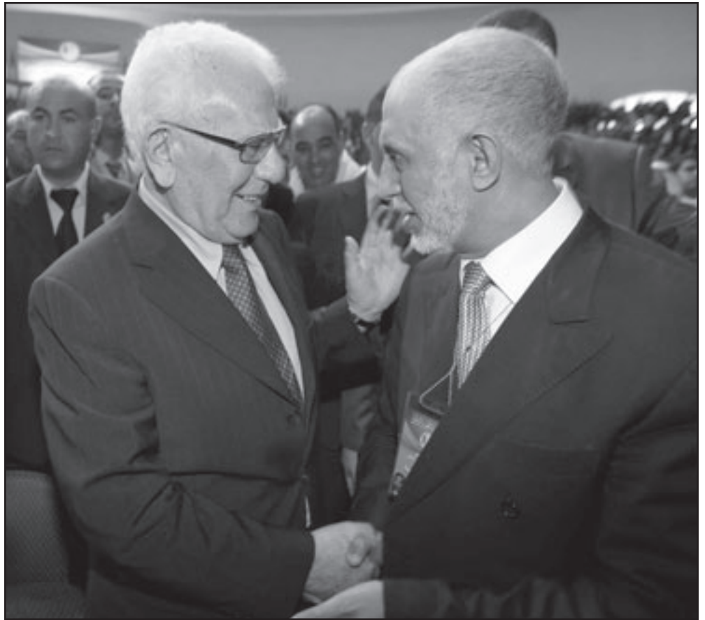
الرئيس الأسبق الشاذلي بن جديد (يسار) برفقة أمين عام جبهة التحرير عبد العزيز بلخادم في مؤتمر الحزب الجمعة

أعضاء اللجنة يتراوح بين 250 و300 عضو. ورغم اقتراح بتوزيع مقاعد اللجنة المركزية بمئج 30 بالمئة للشباب و30 بالمئة للنساء، و40 بالمئة من عامة المنسبين، إلا أن الأعضاء يجب أن يحصلوا على موافقة الأمين العام، ومن المستبعد أن يمر الاقتراح بسلام. كما أن تقليص عدد المناصب المتوفرة مقارنة بالمؤتمر السابق، إذ كان عدد أعضاء الهيئة التنفيذية 165 عضوا وأعضاء المجلس الوطني 200، أي تم استحداثه 600 عضو، بينما سيستيب إلغاء المجلس الوطني في انتخابات 2007 البرلمانية والمحلية. ويبدو محسوما منذ البداية لصالح عبد العزيز بلخادم، على اعتبار أنه لا توجد أي شخصية عبرت عن نيتها في الترشح لهذا المنصب، إلا أن عضوية اللجنة المركزية بدأت تسيل لعاب الكثيرين منذ اليوم الأول للمؤتمر، علما بأن عدد