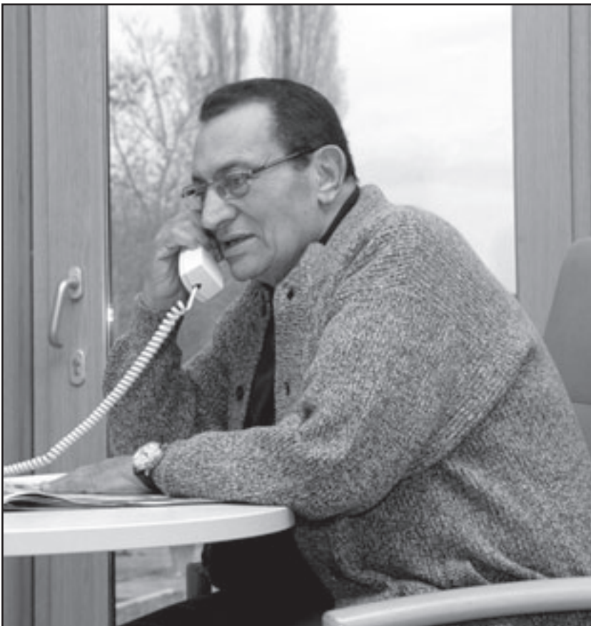
صور مبارك التي أذاعها التلفزيون المصري الجمعة

وطالب رجل الدين اليمن عبد المجيد الزنداني، أحد أهم المطالبين للإدارة الأمريكية التي تتهمه بتمويل الإرهاب، أن يعلن زعماء