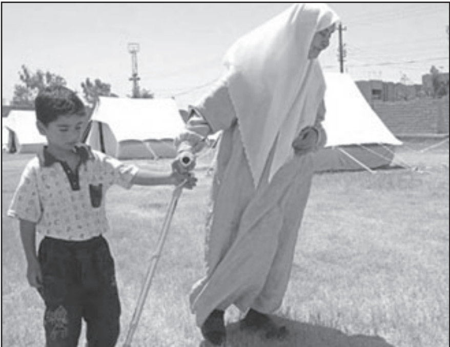
لا يمكن ارغام الفلسطينين على نسيان نكبتهم

■ الكنيست حقرت أمس الأول الديمقراطية الاسرائيلية حين اقرت بالقراءة الاولى، باغلبية 15 ضد 8 مشروع «قانون النكبة»، اذا ما اقر القانون بالقراءة الثانية والثالثة، فانه سيسمح بالحرمان من التحويل العام ويفرض غرامات على هيئات تستحق الدعم الحكومى، اذا ما احيى يوم الاستقلال كيوم حداد، او اقامت احداث ذكرى للمكارة الفلسطينية في 1948. المشروع الذى اقر في ختام الدورة الشتوية كان «مخففا» بالمقاييس الى مشروع القانون الاصلى، الذى يبارد اليه اليكس ميلر من «اسرائيل بيتنا»، وقد صيغ المشروع بحيث ان الغرامة التي ستفرض على مؤسسات يهودية وديمقراطية، يدعى الكفاح المسلح او الارهاب ضد الدولة، يحرض على العنصرية او يمس بشرف علم الدولة وزمراها، وهو ليس موجها لمعاقبة الافراد وتهديدهم بالسجن، مثل مشروع «قانون النكبة»، صيغته الاولى.