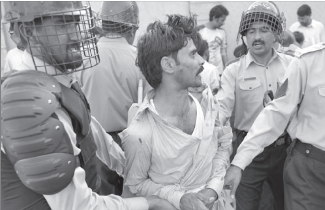
رجال امن باكستانيون يعتقلون رجلا خلال احتجاجات على رفع اجور المواصلات

وتحدثت التقارير الاولى عن لقاء ايدي بقيادة من طالبان بعد المؤتمر الدولي حول افغانستان في لندن في كانون الثاني (يناير) الماضي، وردا على سؤال حول مستوى التمثيل في المحادثات قال ايدي لـ«بي بي سي»، «التقينا شخصيات بارزة في قيادة طالبان كما التقينا اشخاصا مؤجلين من (شورى كويتا) اجراء مثل تلك المحادثات.» و«شورى كويتا» هو اسم مجلس قيادة طالبان، ويحمل اسم مدينة كويتا الباكستانية التي يعتقد انها مركز كبار اعضاء الحركة. وردا على سؤال حول ما اذا كان زعيم الحركة الملا عمر على علم بتلك المحادثات قال ايدي «لا يمكنني تصور ان يجري مثل هذا الاتصال بدون معرفته بل ووافقته.» واستقال ايدي من مهامه موقدا للامم المتحدة الى افغانستان في وقت سابق هذا الشهر بعد عامين على تعيينه. وشهدت فترة مهمته تصاعدا في اعمال العنف واتهامات بدور للامم المتحدة في انتخابات شابقتها عمليات تزوير.