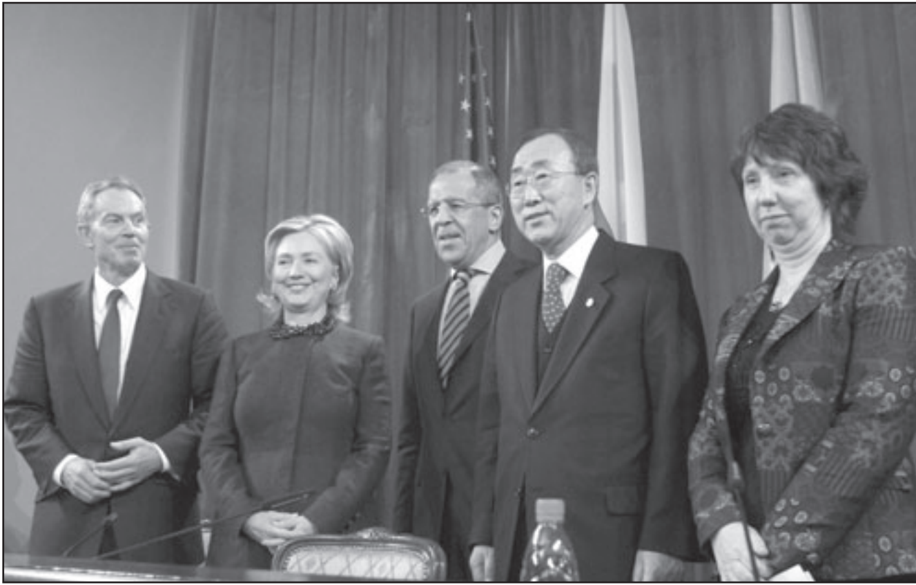
اللجنة الرباعية للشرق الاوسط خلال افتتاح اجتماعها الجمعي في موسكو