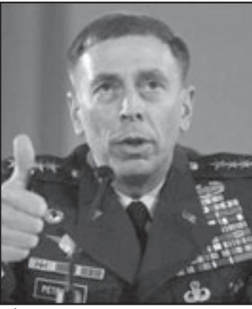
باتريوس: ميتشل جود جزا وآتى متأخراً

قال السؤل الملح هو ماذا ضغطت واشنطن على نتينهاو بكامل القوة وفي ضمن ذلك التهديد للمح به الى ان تترؤن من جديد موضوعات تتعلق بالمساعدة الامنية، السؤل ماذا الان خاصة، «نشرت الازمة للسبيين، يقول اهورن ميلر، باحث في معهد السياسة الدولية «درو ويلسون»، الذي عمل مدة 15 سنة مستشارا للرؤساء ووزراء خارجية وعد أكثر من مرة «للدن»، وراء السياسة الامريكىة في الشرق الاوسط، «السبب الاول شخصى، يوجد هنا تصادم بين شخصيتين متناقضتين: اوباما ونتينهاو، والسبب الثاني خيبة أمل ادارة اوباما العميقة من أنه قد مر 14 شهرا منذ بدء ولايته ولم يتحرك شيء في الموضوع الاسرائيلي - الفلسطينى، لا شك في ان اعلان البناء زمن زيارة بايدن اسمهم في العاصفة لكننى ان كان هناك رد زائد من الطرفين، اضر هذا المشهد بأعمق شيء يجب ان يكون في العلاقات