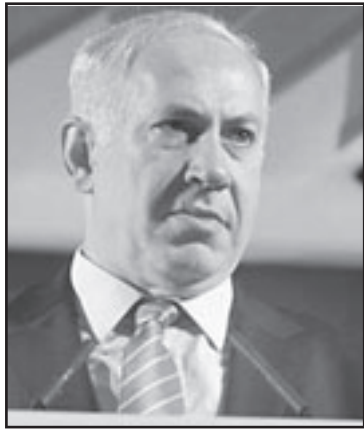
نتينهاو تراجع عن تعهداته لامريكا