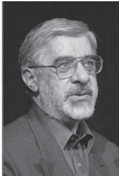
مير حسين موسوي

■ طهران - د ب ا: دعا زعيم إيراني معارض الى مواصلة الاحتجاجات ضد حكومة الرئيس الإيراني محمود احمدي نجاد في العام الفارسي الجديد، وذلك حسبا ذكرت مواقع الكترونية تابعة للمعارضة. وقال مير حسين موسوي، زعيم الحركة الخضراء المعارضة في بيان بمناسبة حلول العام الفارسي الجديد الذي يبدأ مساء اليوم السبت حسب التقويم الشمسي «العام الجديد هو عام المثابرة والمقاومة.» واضاف رئيس الوزراء السابق في رسالة نشرت في موقعه الالكتروني «لا يتعين علينا ان نتخلى عن الطلبات المشروعة للشعب لان ذلك سوف يكون بمثابة خيانة.» ويشكل موسوي بالإضافة الى رئيس البرلمان السابق مهدي كرويبي والرئيسين السابقين محمد خاتمي واكبر هاشمي رافسنجاني القيادة الرباعية للمعارضة. واتهم الاربعة الحكومة بالتلاعب في الانتخابات الرئاسية التي جرت في شهر حزيران (يونيو) الماضي ورفضوا الاعتراف باعادة انتخاب احمدي نجاد. وتعتبر الحركة الخضراء على نطاق واسع جماعة المعارضة الرئيسية في البلاد ويعتبر انصارها المحركين الرئيسيين للاحتجاجات في الشوارع ضد الرئيس الإيراني والتي بدأت بعد الانتخابات. وقال موسوي «الانتخابات الرئاسية كان يمكن ان تتحول الى مهرجان للاصلاحات وبداية عهد جديد من الحرية والعدل.» واعرب عن اسفه لان الغضب ازاء التلاعب في الانتخابات ادى بدلا من ذلك الى احتجاجات في الشوارع قتل خلالها العشرات من المتظاهرين واعتقال عدة الاف. ومازال هناك اكثر من 100 شخص في السجون ويقضي البعض منهم احكاما على خلفية اتهامات بالدعاية ضد المؤسسة الاسلامية.