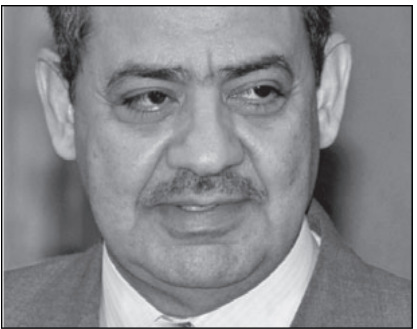
الدكتور احمد الطيب

ومن مؤلفاته «مباحث العلة والمعلول من كتاب المواقف - عرض ودراسة ويحت عن أصول نظرية العلم عند الأشعري» ويحت عن مفهوم الحركة بين الفلسفة الإسلامية والفلسفة الماركسية.