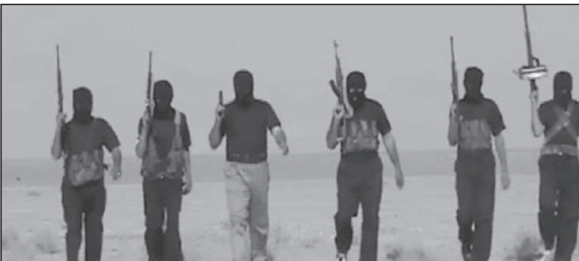
حل النزاع الاسرائيلى الفلسطينى سيخفف منابع الارهاب

هاثقيا لـ«هارتس» ان الازمة الحالية والمخاطر التي تحدى بالمنطقة تذكره بايام الشرخ بين بوش الاب وشمير، «اذا وصلت المفاوضات بين اسرائيل والفلسطينيين في مأزق، فان المنطقة ستسقط في عدم استقرار و عنف، وعلى فان ادارة اوباما ملزمة بان تدفع الطرفين الى تنفيذ التزاماتها وجليهما مجددا الى مفارقات مباشرة، وحسن ساعة مبكرا اكثر»، قال، «اوباما لا يحق له ان يسحب يده من النزاع فى اسرائيل، هذا الاسبوع قتال في مقابلة