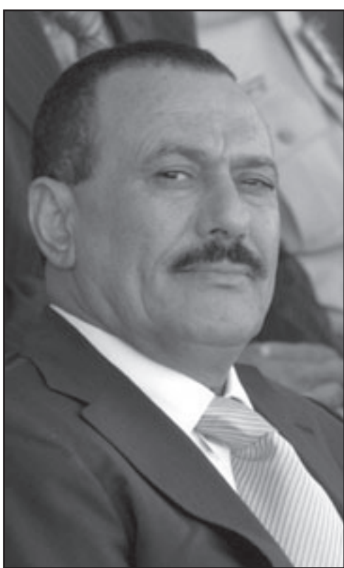
علي عبد الله صالح

وقال «إننا لم نلتق موعداً محدداً للافراج عن معتقلينا ولكن السلطة وعدتنا بسرعة الإفراج عنهم ونحن حالياً في انتظار وفائها بوعودها»، معرباً عن تفاؤله بهذه الخطوة