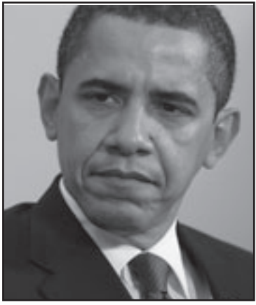
اوباما تأخر في وضع خطته للسلام على الطاولة

وهو الثقة، ووفق ذلك يوجد في البيت الابيض شعور بان اسرائيل تنظر الى الولايات المتحدة على انها مفهومة من لقاء ذاتها، صعد الطرفان شجرة عالية، وتوقع أن ينزلا عنها في الايام القريبىة، لكننى لن أفتأ اذا تسلسل بعد زمن قصر الشجرة نفسها». ان عدم وجود قناة الامتداد شوكوا منذ استشاط غضبا، وزعم اولئك الذين شكوا منذ البدء بكل كلمة من نتينهاو، من بين مساعديه بين الرجسين علاقات تقارب تمكن من تسوية الاختلافات بهوء، من وراء ستار كما حدث في الماضي بين رؤساء امريكويين ورؤساء حكومة اسرائيليين، ليس نتينهاو واحداً من الزعماء الذين يستطيعون محاكاة الغرفة البيضوية هاتقيا في كل ساعة لمشاورة الرئيس وتوضيح أمور معه تتجاوز محضر الجلسات.