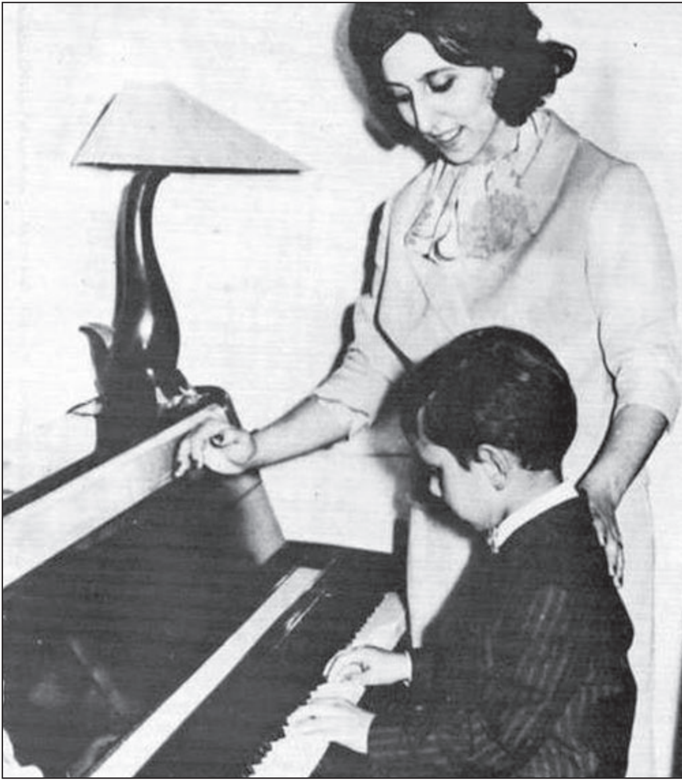
الأم الحاضرة الغائبة في تذكارات فيروز (القدس العربي)

الشكوى من الرقابة العاطفية! وبخلاف هذه القصائد التي كتبت بالصحة والتي صورت ولع فيروز بالتغني بالأم في مراحل مختلفة من مسيرتها مع الأخوين رحباني ومن دونها، بدت صورة الأم في بعض الأغنيات والاستكشافات المكتوبة بالعامية مختلفة تماماً... فالأم هنا سلطة رقابية على حالة العشق الخفية التي تتسلل إلى قلب الفتاة فتبدل حالها، كما تقول الأغنية الرحبانية: دخيلك يا أمي مدي شو بني اتركيني بهمي زهقانة الدني بذكر من سنة وأكثر من سنة شفته تحت اللوزة بالفني وما يعرف عطاني يمكن سوسة ومن يومها يا أمي مدي شو بني وفي استكشاف عيد العزاية الذي قدم في فيلم (بيع الخواتم) عام 1965 تتكرر رقابة الأم على حالة اللهو العاطفي البريء الذي يمثله عيد العزاية منذ