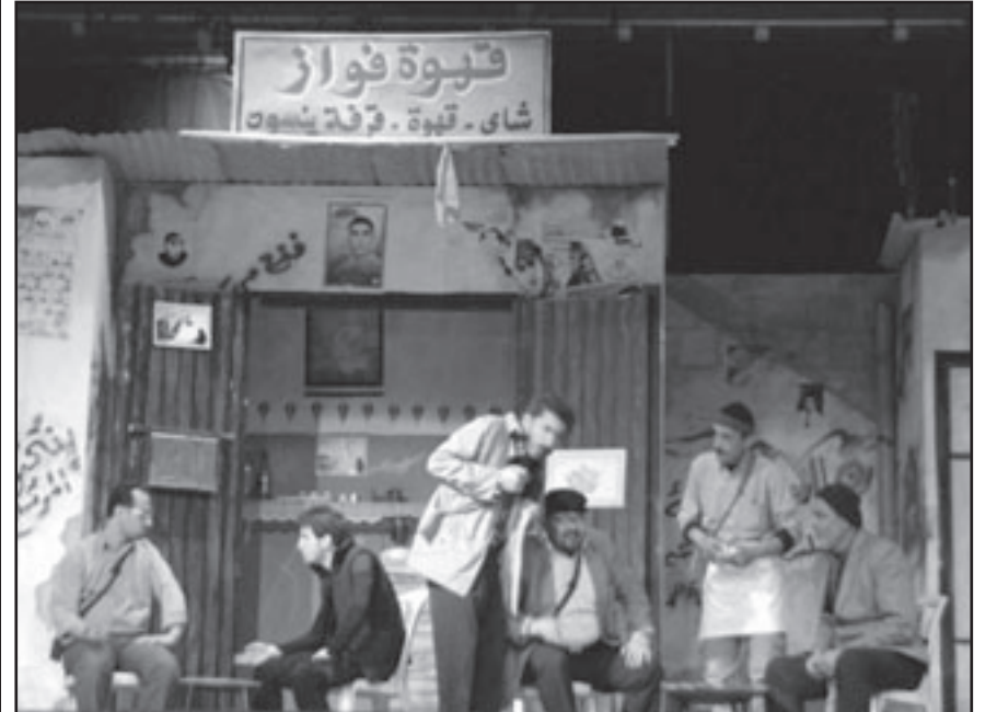
مشهد من مسرحية «الحبل السري»

فالحبل الأخضر لحماس التي تدعمها إيران الإسلامية والأصفر لفتح التي تتلقى دعما غريبا والأحمر لليساريين كالجبهة الشعبية لتحرير فلسطين والأسود لحركة الجهاد الإسلامي وحلفائها.