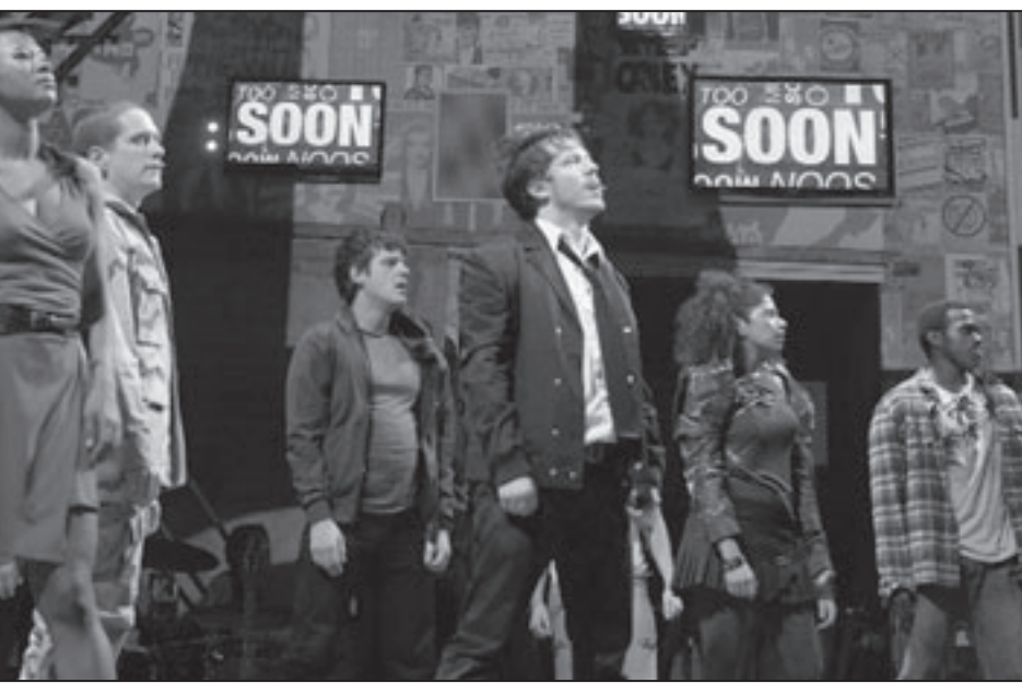
مشهد من مسرحية «غبي أميركي»

■ لوس انجلس - يوبي أي: يخطط الشريكان في شركة «بلايتون للإنتاج»، الممثل توم هانكس والمنتج غاري غوتزمان لتحويل مسرحية «غبي أميركي» الموسيقية إلى فيلم سينمائي قبل بدء عرضها حتى. وذكر موقع «ديلاين» الأمريكي ان هانكس وغوتزمان يخططان لتحويل المسرحية الموسيقية التي يبدأ عرضها في 20 نيسان/ أبريل المقبل إلى فيلم يتضمن أيضا أغاني فرقة «غرين دي».