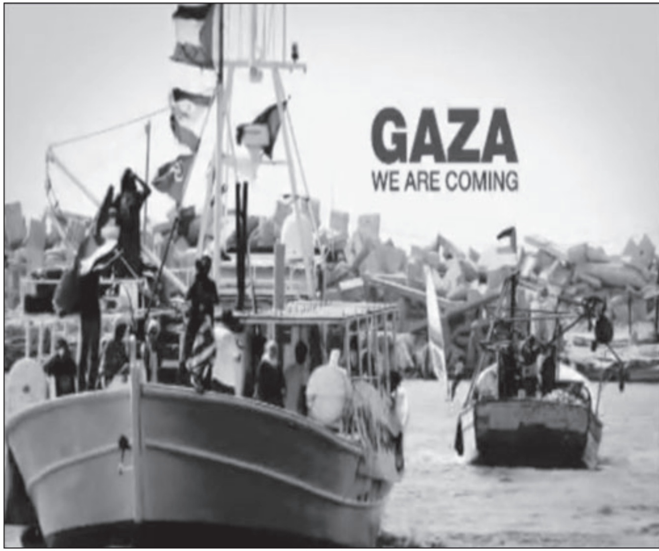
«غزة إنا قادمون»

واعتبر زيرغانوس أن السنوات الأخيرة تشهد تضامناً شعبياً عملياً - خاصة في صفوف الشباب - مع الشعب الفلسطيني ومع جميع الشعوب التي تشهد مقاومة الاحتلال، وهو ما يرجعه إلى العنف والوحشية الإسرائيلية ضد الفلسطينيين وهو ما يخلق شعوراً بالحيف والظلم لدى الشعوب الأوروبية والغربية، كما أن مقاومة الفلسطينيين المستمرة منذ عقود طويلة تشكل منارة ومثلاً لكل الأوروبيين الذين يعيشون ظروفًا مختلفة لا تمت إلى المقاومة بصلة.