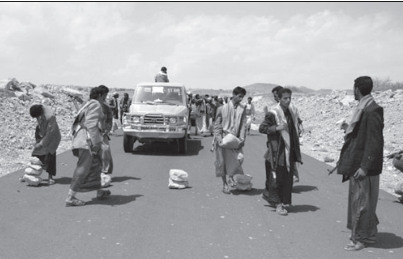
يمنيون يفتحون الطرق في صعدة

من الانفجارات المشابهة لذات السبب في الأسواق والمناطق القريبة من مخيم النازحين. وقال «إن الرعب أصاب سكان مخيم المزرقي للنازحين أمس إثر وقوع هذه الحادثة، فيما تصاعدت المخاوف من استمرار مسلسل الانفجارات لمخلفات الحرب في صعدة جراء اختفاء الكثير من العيوات الناسفة والمتفجرات والألغام الأرضية في قطع الحديد الخردة التي يتم بيعها في الأسواق القريبة من المناطق التي شهدت موجات عنيفة بين القوات الحكومية والحوثيين». وأكد أن تجار الخردة من الحديد الذي خلفته الحرب في صعدة وقعا ضحية للعديد من المواد المتفجرة التي أخفيت داخل بعض قطع الحديد، والتي كان ضحيتها أحد تجار الخردة الذي لقي مصرعه في حادث أمس أثناء محاولته بيع قطع من الحديد الخردة في سوق المزرقي. وكثفت أكثر مصادر قطع الحديد الخردة وهذه المواد المتفجرة منطقة الملاحيط التي تبعد نحو 15 كيلومترا فقط من مخيم المزرقي للنازحين، والتي شهدت أكثر المواجهات عنفا في دورة الحرب السادسة بين القوات الحكومية والمرتدين الحوثيين والتي استمرت 6 أشهر منذ 12 آب (أغسطس) وحتى 12 شباط (فبراير) المنصرم، مشيرا إلى أن سكان مخيم المزرقي للنازحين أصبحوا يشعرون بالقلق البالغ من كسل قطعة حديدية غريبة الشكل ومن كل قطعة حديدية يشعرون بها من السوق الجاور، نتيجة وقوع العسديين من الانفجارات جراء ذلك وسقوط الكثير من الضحايا بين قتيل وجريح.