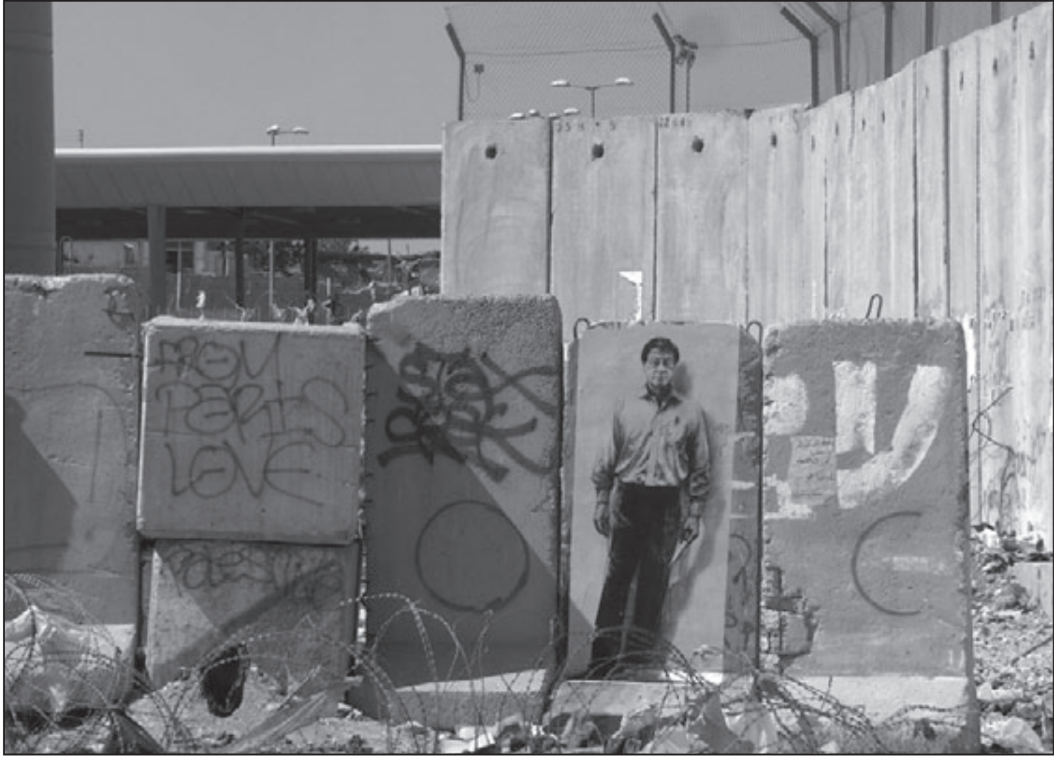
درويش على الجدار