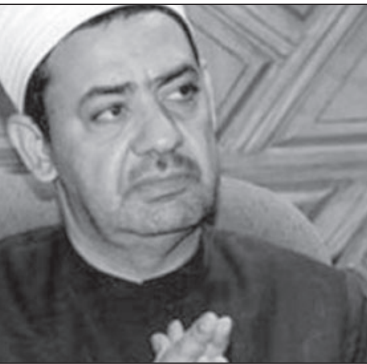
شيخ الأزهر الجديد أحمد الطيب

قال: رغم أنني أتبنى المذهب المالكي فسوف أفسح المجال لكل المذاهب لأن هو الطبيعي الأزهر منتعيا لحزب سياسي وما المانع الشرعي في ذلك؟، وأكد أن الحكومة لم تتدخل في أي إرشادات دينية أو إفتاءات أفتى بها أثناء توليه لدار الإفتاء، واستدرك قائلا: لم يشغلني كوني عضوا في الحزب الوطني عن منصبه حينذاك كفتي للديار المصرية.