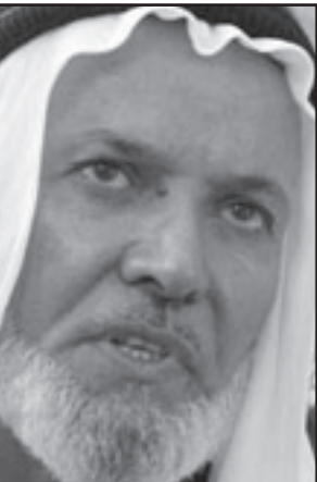
الشيخ حارث الضاري

محمود: قد يعمق الصراع بين الاكرد والعرب على مدينة كركوك المنتجة للنفط بعد التحدي الانتخابي القوي الذي مثلته كتلة العراقية القومية العربية التي يتزعمها رئيس الوزراء الأسبق ابياد علاوي بالنسبة للكتلة الكردية الحاكمة في منطقة كردستان. وأظهرت النتائج الأولية للانتخابات البرلمانية التي جرت يوم السابع من آذار (مارس) الجاري ان دعماً قوياً من جانب السنة العرب والتركمان دفع قائمة العراقية العلمانية للتقدم قليلا على التحالف الكرديستاني القوي. وطالب الاكرد بكركوك باعتبارها أرض أجدادهم ويريدون ضمها إلى منطقتهم شبه المستقلة في شمال العراق. ورفض العرب والتركمان في كركوك هذه الفكرة وكذلك الحكومة في بغداد، والاقتراع في كركوك حيث تقدمت قائمة علاوي بنحو ثلاثة آلاف صوت قد يضيف مطالبات الاكرد ويثير توترات جديدة في الوقت الذي يسعى فيه العراق للخروج من سنوات من