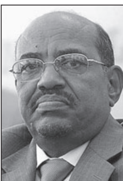
الرئيس عمر البشير

وأضافت الصحيفة نقلاً عن مصادر أن القادة الغربيين طلبوا من سلفاكير تأجيل خطوة الانفصال لعدة سنوات لنقص القدرات الأمنية التي تمكن الحكومة الوليدة من السيطرة على الوضع الأمني لعدم وجود بنيات تحتية وخشية تحميها الى صومال جديد وبالتالي تصبح ممرا آمنا للمجموعات الإرهابية كالقاعدة. على صعيد متصل قالت مفوضية الانتخابات إنها تلقت (8192) طلب مراقبة حتى الأسس، اعتمد منها (130) طلباً للاتحاد الأوروبي، وطالبان من مركز كارتر احدهما أكثر من (30) مرافبا، وتكشف عن رفض طلبين للمراقبة المحلية، فيما أكدت زيادة تمثيل اللغتين العربية والفرنسية في اللجنة الإعلامية لبعث (14) مقراً بعد مرشحي رئاسة الجمهورية، وإضافة اثنين آخرين من أحزاب حكومة الوحدة الوطنية. وقال عبد الله أحمد عبد الله نائب رئيس المفوضية للصحافيين عقب اجتماع المفوضية الاستثنائي أمس، إن المفوضية استجابت لرغبة الأحزاب والأجهزة الإعلامية في زيادة التمثيل، وأشار إلى أن الاجتماع أوصى بزيادة الوقت المتاح للمرشحين في الانتخابات لـ (10) أيام استند إلى ذلك أكد عبد الله، أن تقرير مركز كارتر الداعي لتأجيل الانتخابات لـ (10) أيام استند على معلومات خاطئة، وقال ان مندوب المركز في الخرطوم لم يلقَ أي معلومات من المفوضية،