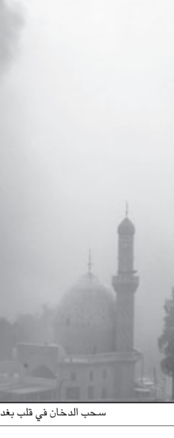
سحب الدخان في قلب بغداد بسبب الانفجارات أمس

وأتت ان المعتقلين أكدوا ان هذا الشخص، الذي لم يذكر اسمه، قام