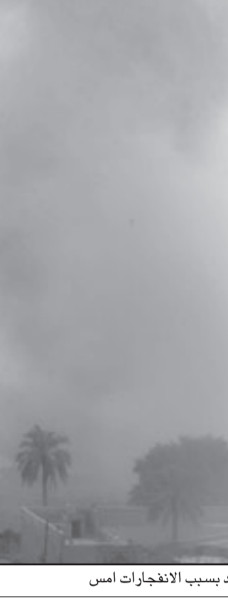
سحب الدخان في قلب بغداد بسبب الانفجارات أمس

وأتت ان المعتقلين أكدوا ان هذا الشخص، الذي لم يذكر اسمه، قام