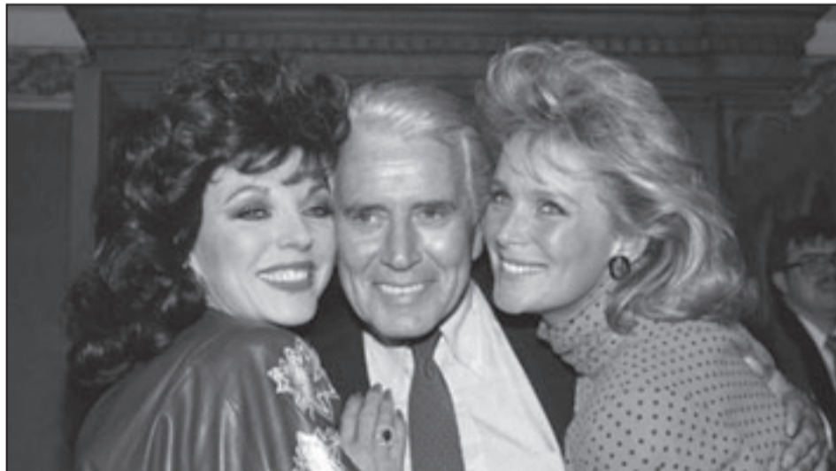
جون فورسيث يتوسط بطلتي مسلسل «داينستي»

■ لوس أنجلس - (يو بي أي): توفي نجم مسلسل «داينستي» الأمريكي جون فورسيث عن عمر 92 عاماً بعد صراع مع مرض السرطان.