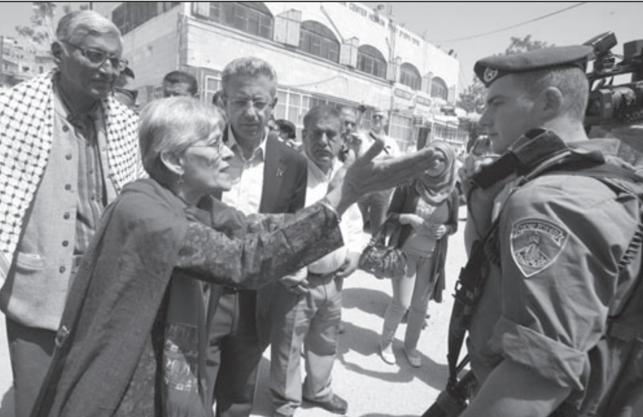
راجوهام غاندي (يسار) حفيد المهاتما غاندي ينظر إلى زوجته أوشا وهي تصرخ بجندي اسراييلي لدى زيارتهما المسجد الإبراهيمي في الخليل

وقال إن ملاحظات حركته تعد «وطنية وليست حزبية»، ويشار إلى أن الجهود المصرية لإنعام المصالحة جمدت في أعقاب رفض حماس التوقيع على ورقة المصالحة،