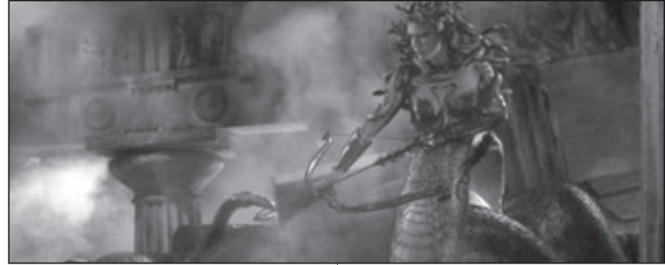
لقطة من فيلم «كلاش أوف ذا تايانز»

■ لوس أنجلس - (يو بي أي): بلغت إيرادات فيلم «كلاش أوف ذا تايانز» في اليوم الأول لعرضه في صالات السينما الأمريكية 4.2 مليون دولار ليصل بذلك في الدرجة الثانية بعد الفيلم الرومانسي «الأغنية الأخيرة» الذي حقق عائدات متقاربة.