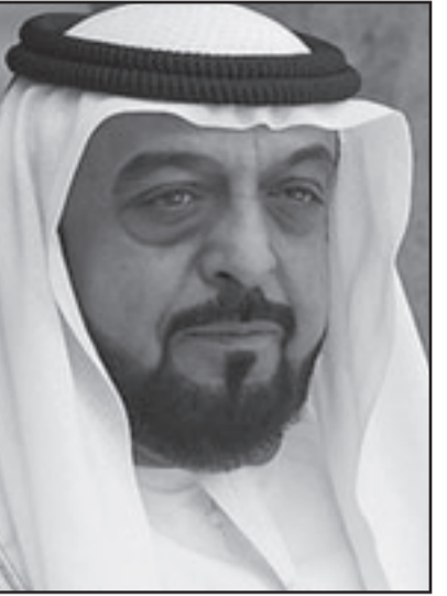
الشيخ خليفة بن زايد آل نهيان

وأثير التحقيق بسبب البريد الإلكتروني أرسل في 14 كانون الثاني (يناير) للوكالة الدولية للطاقة الذرية، وقالت الصحيفة إن البريد الإلكتروني زعم أن شركة