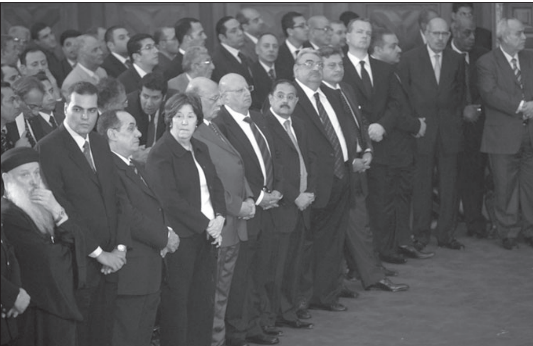
د. محمد البرادعي في الصف الاول اثناء عيد القيامة السبت