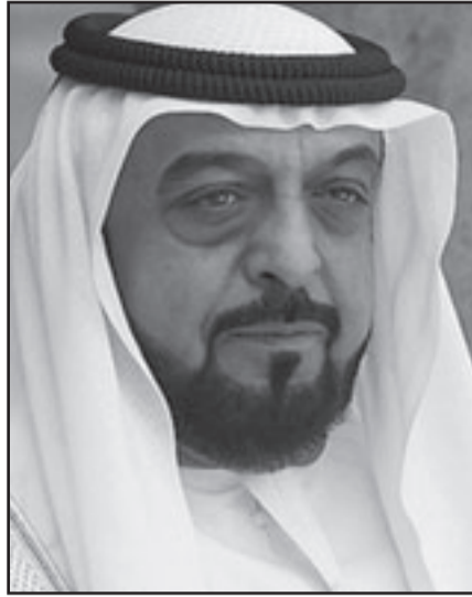
الشيخ خليفة بن زايد آل نهيان

ولاستثمارات، وعندما تولى ادارة المؤسسة لم يكن خطى الثامنة والعشرين من العمر، وهي المؤسسة التي تقول الصحيفة انها الاكبر في العالم حيث لم تكشف عن حجم الاموال التي تديرها وتقدر بما بين 400 - 800 مليار دولار امريكي.