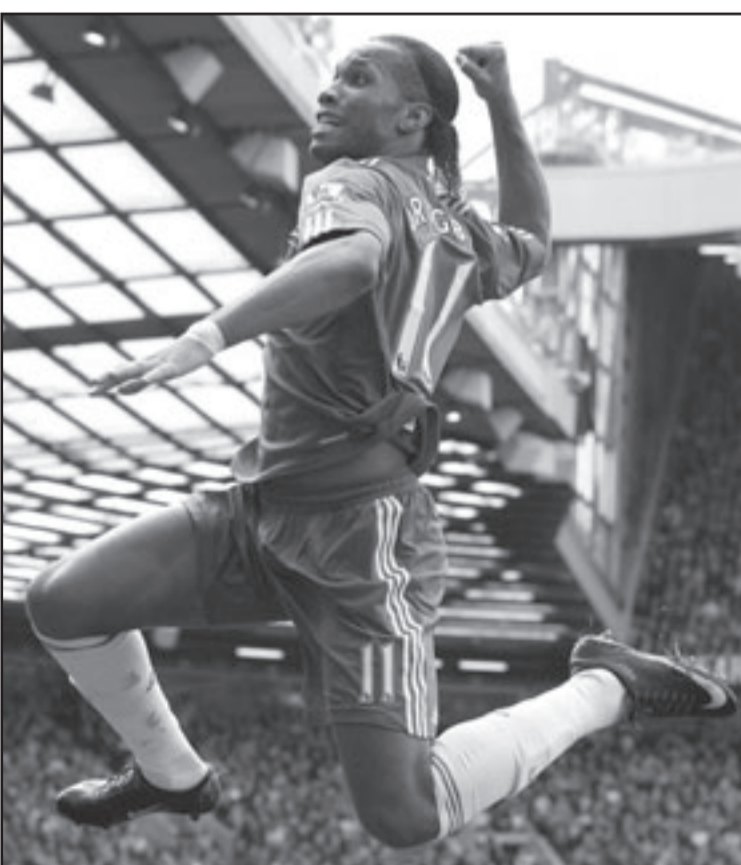
ديديه دروجبا نجم تشيلسي يحيي الجمهور بعد ان سدد هدفا

اوروبيا يوم الثلاثاء الماضي وأسفرت سيطرة تشيلسي في البداية عن هدف. وشق مالودا طريقه متجاوزا ثلاثة من مدافعي يونايتد وأرسل كرة عرضية أرضية حولها كول يونايتد أكثر نشاطا في الشوط الثاني مع وجود البلغاري ييميتار برياتوف في قيادة خط الهجوم واقترابه من التسجيل بضرية رأس بعد مرور ساعة من زمن اللقاء. وفي الوقت الذي اقترب فيه يونايتد من ادراك التعادل ضاع تشيلسي تقدمه بهدف مثير للجدل عن طريق دروجبا الذي نزل ارض الملعب قبل عشر دقائق بدلا من الفرنسي نيكولا انيكا. وسدد دروجبا بقوة في شباك الهولندي ادوين فان دير سار حارس يونايتد رغم أنه كان من الواضح تماما وجوده في موقف تسلل عندما تلقى الكرة من موطنه وزميله سالومون كالو. وبعد دقيقتين اصطدمت كرة عرضية من