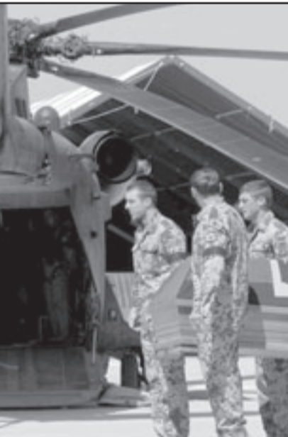
نقل جثمان الجنود الالمان الثلاثة الذين قتلوا في قندز شمال افغانستان

يعد هذا الهجوم هو الأسوأ الذي يتعرض له جنود المان في افغانستان ليرتفع عدد القتلى بين صفوفهم إلى 39 جنديا.