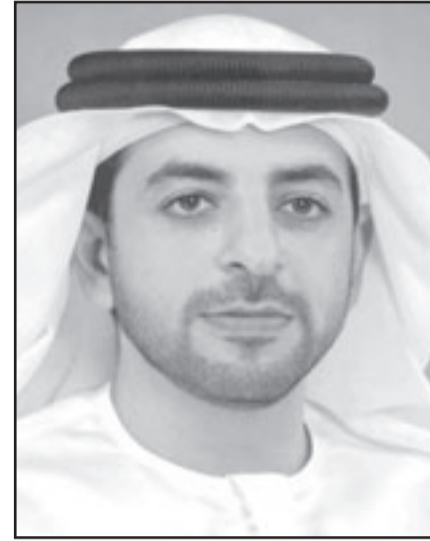
الشيخ احمد بن زايد آل نهيان

وترى الصحيفة ان الحياة اليومية التي تعيشها العائلة من ناحية ادارة مجالس الشركات الكبيرة والتأثير على الجغرافيا السياسية وفوق هذا زيادة ثروة العائلة بشكل يجعلها أغنى عائلة في العالم، ومن هنا شبهها التقرير بال كينيدي ولكن على الخليج العربي.