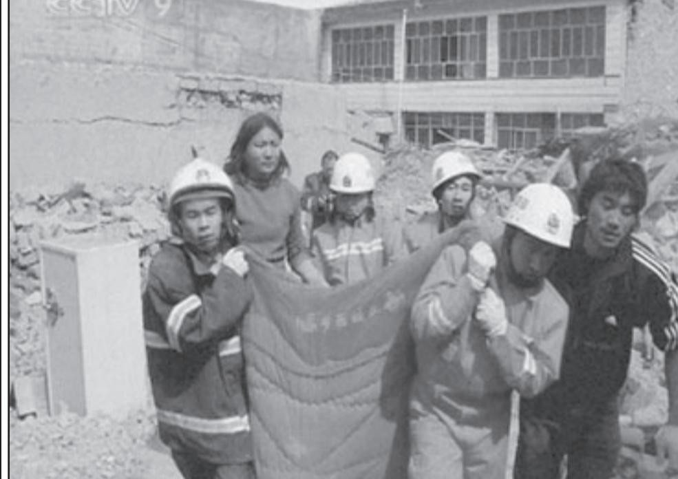
رجال انقاذ صينيون يقومون بانتشال ضحايا الزلزال المدمر