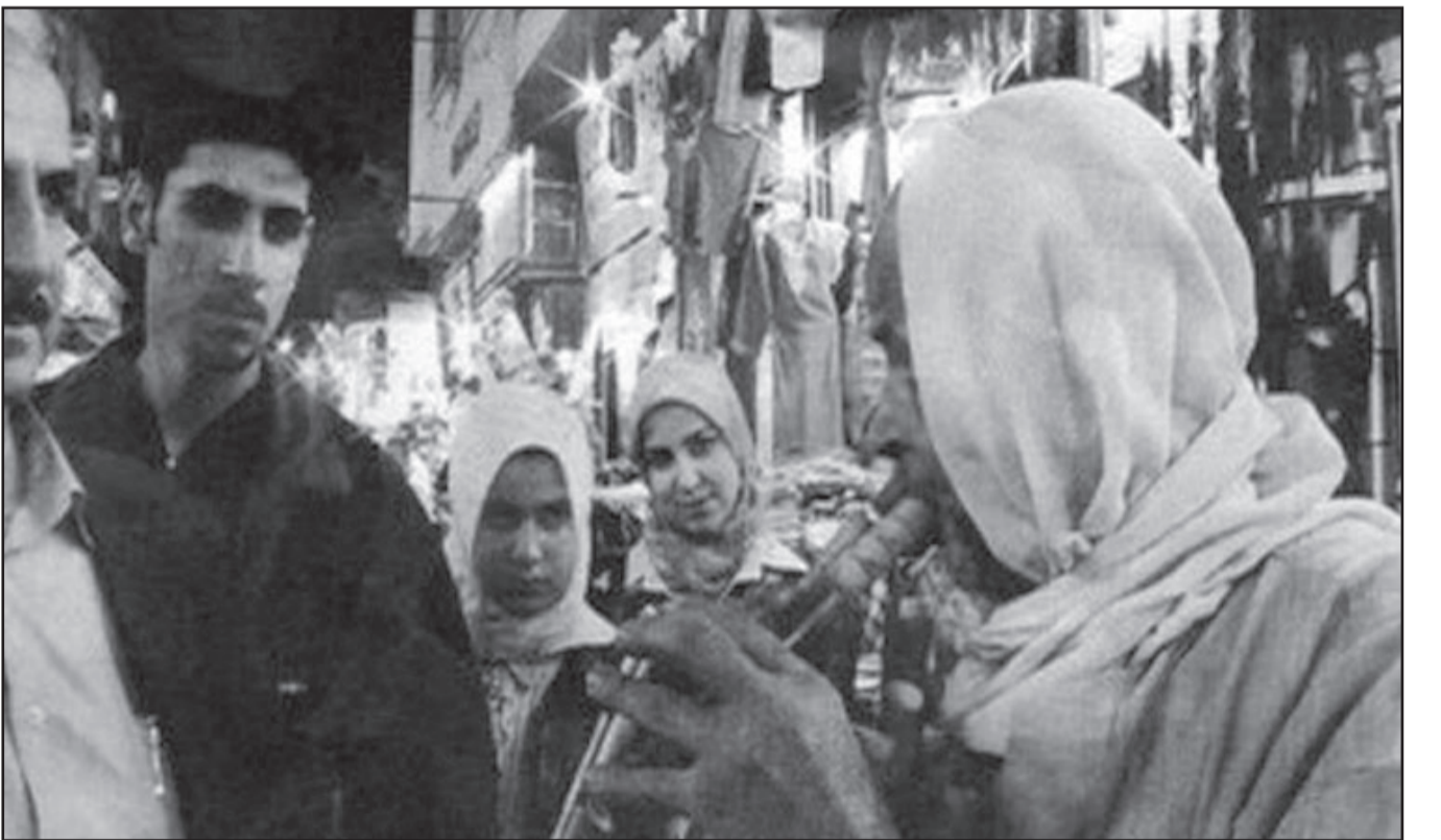
لقطة من «البحث عن رفاعة الطهطاوي»

القاهرة - د ب أ: انتهى الناقد والمخرج السينمائي المصري صلاح هاشم من إعداد سيناريو الجزء الثاني لفيلمه الوثائقي «ثلاثية رفاعة» الذي يعمل فيه على التوثيق لتاريخ وذاكرة المفكر المصري رفاعة رافع الطهطاوي «1801-1873» كرائد نهضة مصر الحديثة.