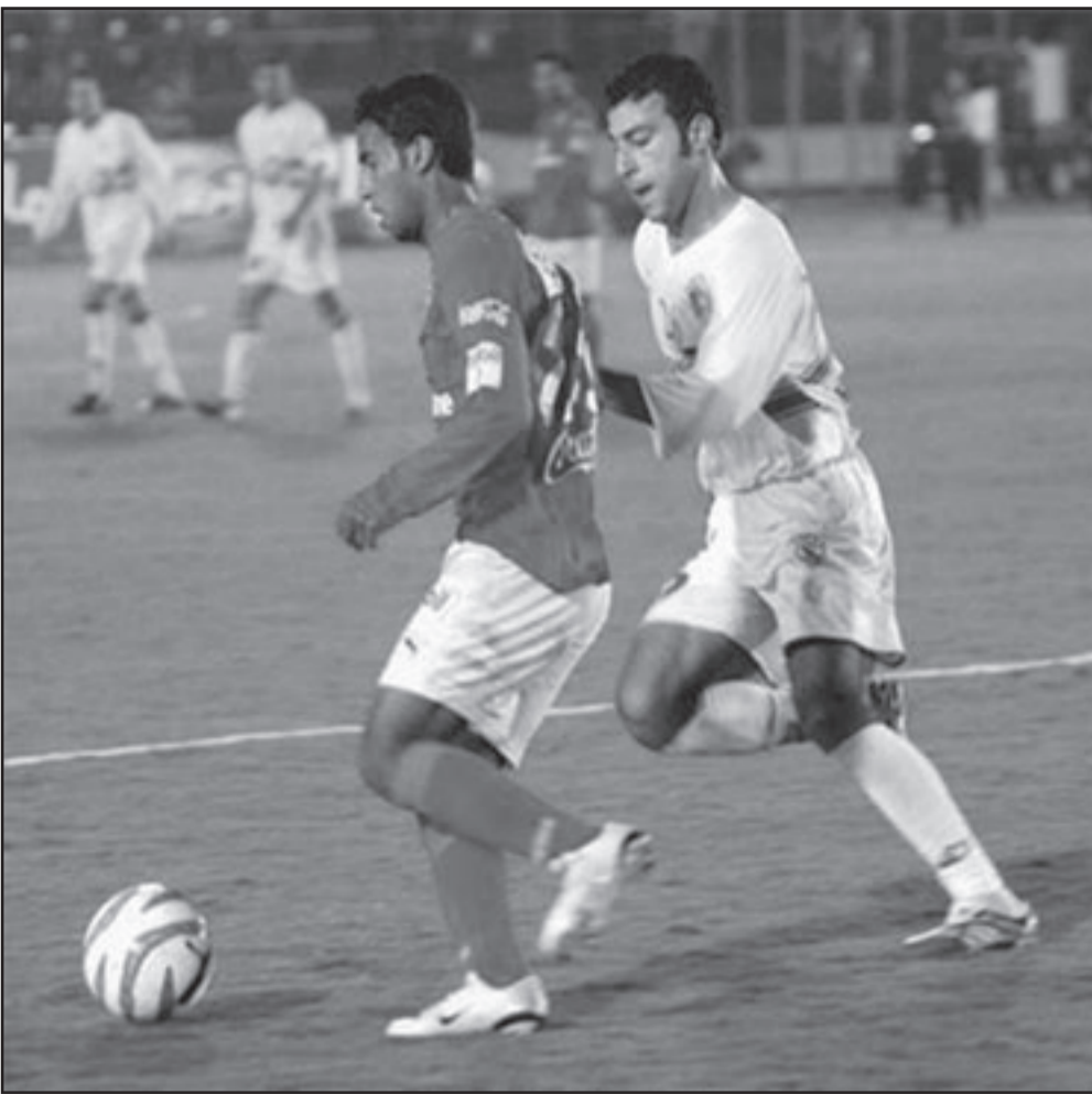
الأهلي والزمالك.. صراع على القعة

واضاف «الجديدي سيعاونه مساعداً من تونس وتم استقدامه بناء على طلب الجودة الذي يستجمل تكاليف استقدامه». ويسعى الجودة للهروب من الهبوط للدرجة الثانية وتمكن الفريق من الابتعاد عن هذه المنطقة بغارق أربع نقاط مستفيداً من صوته الأخيرة ونجاحه في جمع عشر نقاط من آخر أربع مباريات.