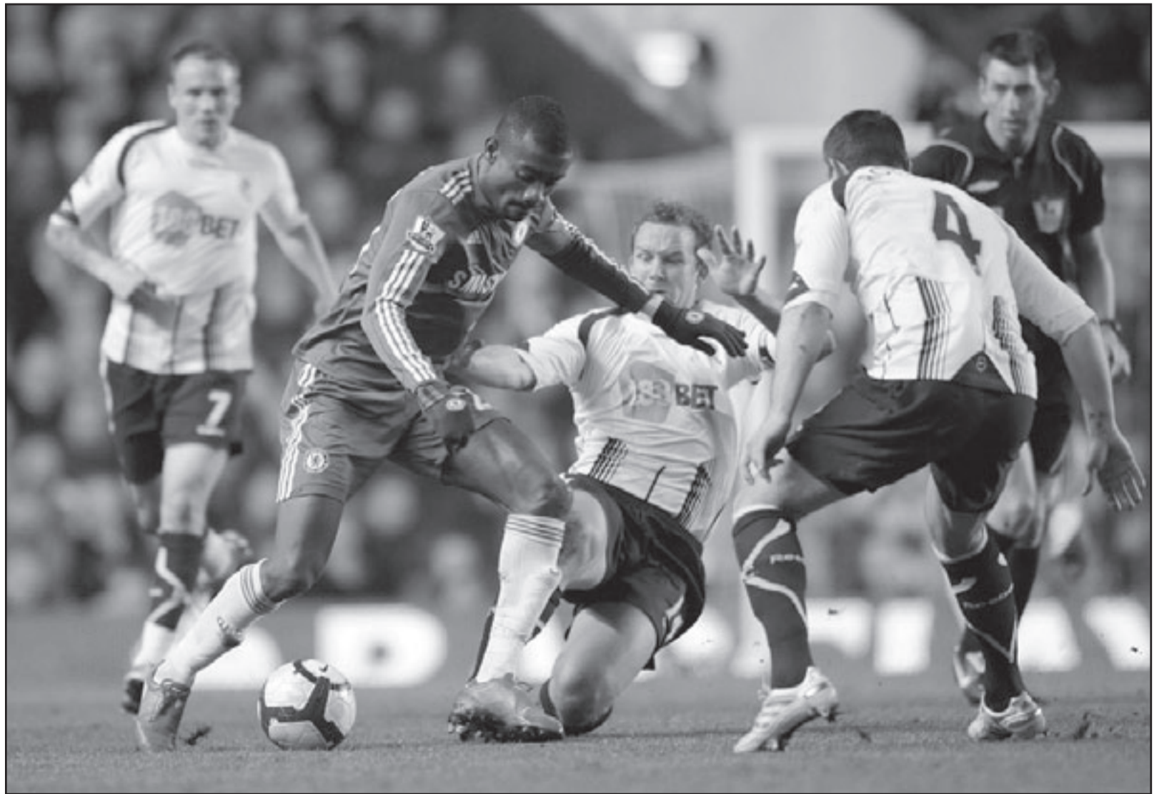
سالون كالو نجم تشيلسي (الثاني من اليسار) في منافسة على الكرة مع لاعبي بولتون

ومع تبقي اربع جولات على نهاية الموسم يملك تشيلسي الذي يقوده المدرب الايطالي